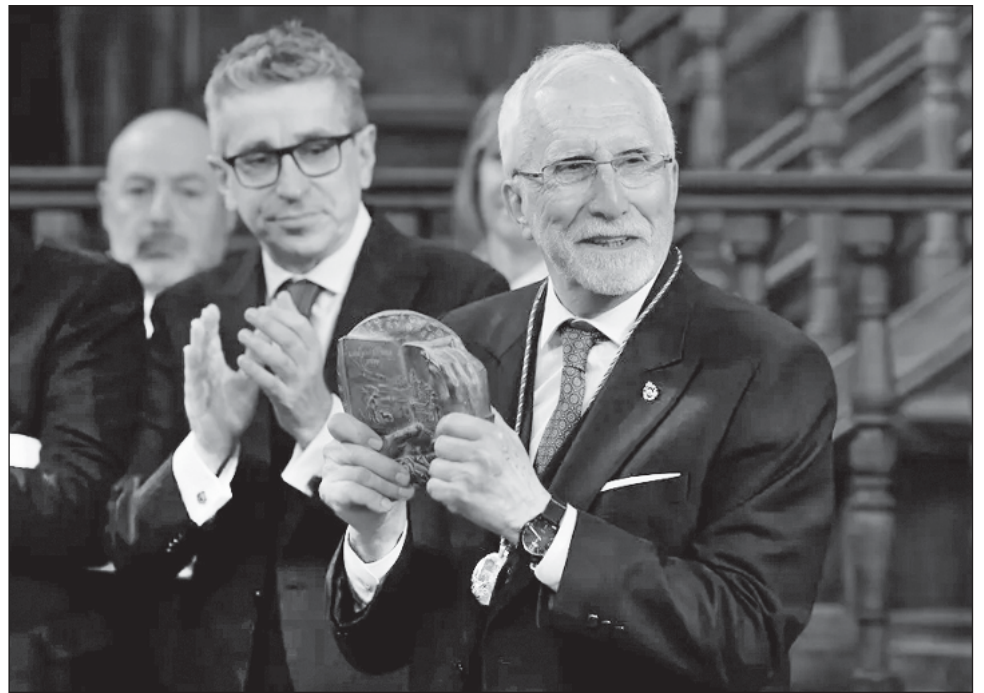
▲ El novelista y cuentista Luis Mateo Díez recibió en el paraninfo de la Universidad de Alcalá de Henares, el Premio Cervantes, consagrándose como un clásico vivo de la literatura en español.

Como es habitual en los discursos de recepción del Premio Cervantes, el galardonado hizo alusión a Don Quijote de La Mancha: El libro que escuché con mayor deleite y aprovechamiento