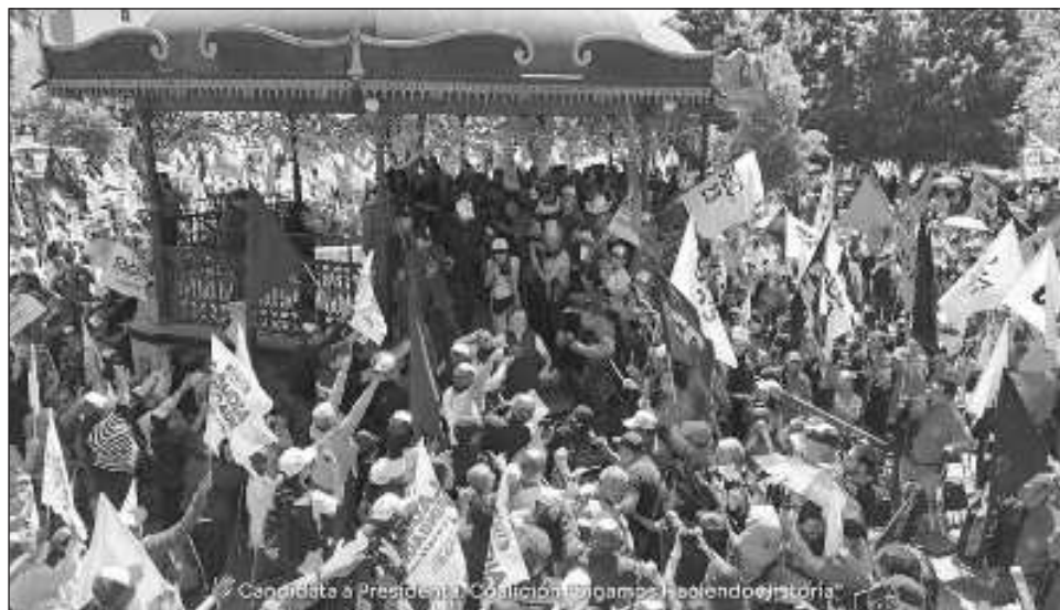
▲ “Hablamos mucho del tema del agua, de cómo atendieron el tema de la seguridad en la laguna y en general, hablamos del país, de cuál es nuestro proyecto”, dijo la candidata presidencial sobre una reunión con empresarios de La Laguna antes de su mitin en Torreón.

En conferencia de prensa, también pidió que se revise la participación de Manuel López San Martín como uno de los moderadores del primer debate entre los candidatos presidenciales, después de que denostó a Hugo López Gatell, tras ser nombrado por el presidente Andrés Manuel