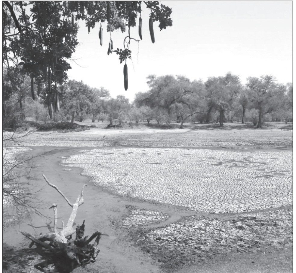
▲ La declaración del presidente Chakwera estimulará un programa de respuesta humanitaria “de gran alcance” que incluye 600 mil toneladas métricas de maíz para los hogares afectados.

El Niño es un cambio en las dinámicas atmosféricas ocasionado por el aumento en la temperatura del océano Pacífico. Mientras que la sequía sacude países como Malawi, Zambia o Zimbabue, este fenómeno meteorológico provocó en los últimos meses lluvias torrenciales en el este de África que dejaron centenares de muertos en Kenia, Tanzania, Somalia y Etiopía.