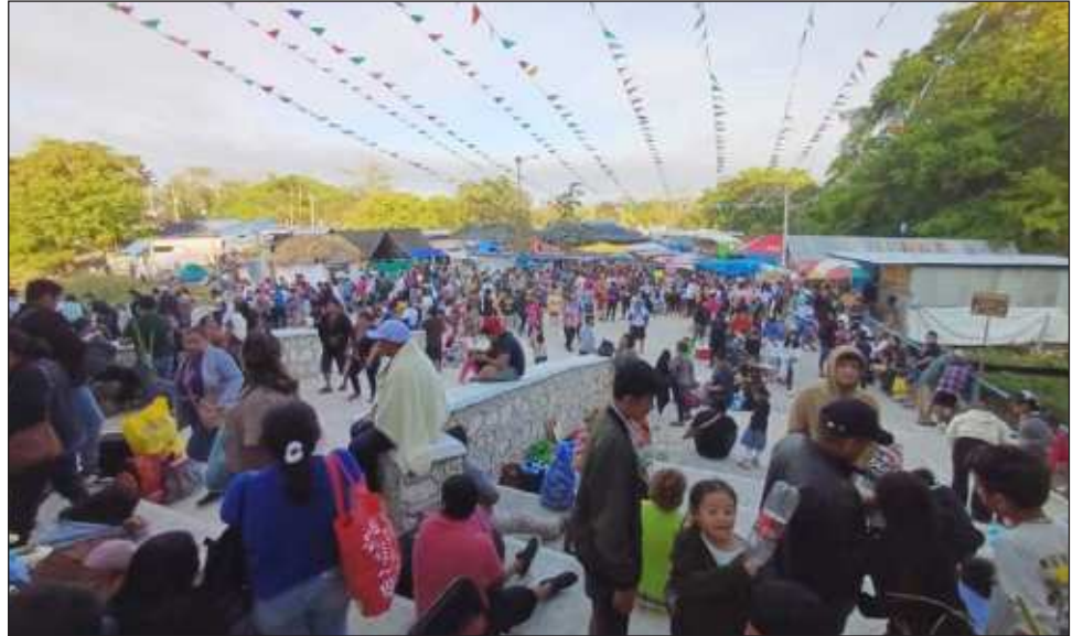
▲ Desde el viernes 27 de marzo inició el peregrinar de devotos al Santuario de la Virgen de Chuiná, mismo que se prolongará hasta el jueves Santo.

Los visitantes buscan áreas comunitarias para estacionar sus unidades, "colgar" sus hamacas de los árboles cercanos o instalar sus casas de campaña, para posteriormente acudir al Santuario de la Virgen de Chuiná, encender sus veladoras, aceites o entregar sus promesas.