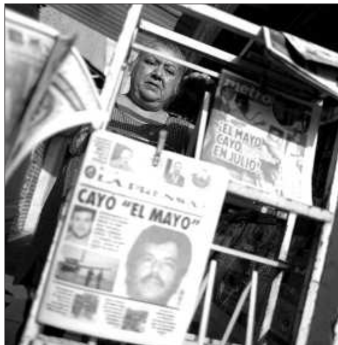
▲ La oposición al gobierno mexicano intenta lucrar con la carta, esparciendo el dicho de que la presidenta Claudia Sheinbaum buscará proteger al Mayo .

En realidad, El Mayo , en tanto ciudadano mexicano, tiene todo el derecho a solicitar la intervención del cuerpo diplomático nacional, tanto para ser asistido en su defensa como para que se revise el proceso de su aprehensión. Lo que está en juego es que la omisión o inacción de la representación mexicana establecería el precedente para que cualquier connacional pudiera ser detenido por autoridades de otro país extraterritorialmente, y esto sin necesidad de que participen agencias gubernamentales, pues bastaría con lanzar