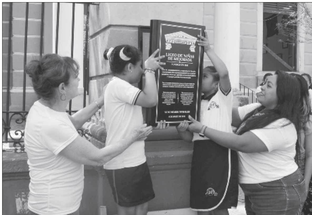
▲ “Liceo de niñas de Mejorada (en la calle 57 entre 50 y 48, Centro). Rescate de la historia de un centro educativo clave en la formación de las niñas del estado de Yucatán”.

A TRAVÉS DE la colocación de placas, recuperamos algunas historias de mujeres cuya presencia ha sido silenciada, asegu-