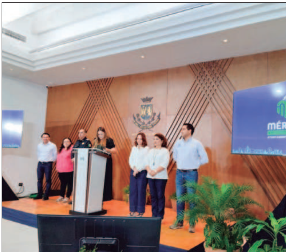
▲ Durante su conferencia de prensa semanal, la alcaldesa Cecilia Patrón anunció que el ayuntamiento realizará este jueves una Feria de Inclusión Laboral.

Asimismo, dentro de las actividades del Carnaval 2025, este miércoles 26 de febrero se hará la Quema del Mal Humor con la presencia de los artistas Yahir y María José, a las 20 horas en los bajos del Palacio Municipal de Mérida.