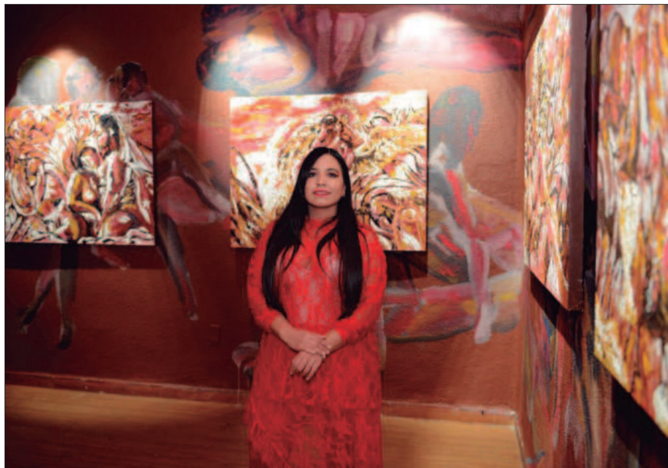
▲ La exposición analiza los arquetipos de buena mujer que son retomados en los escudos de cada entidad.

Anayeli Contreras, encargada de la curaduría,