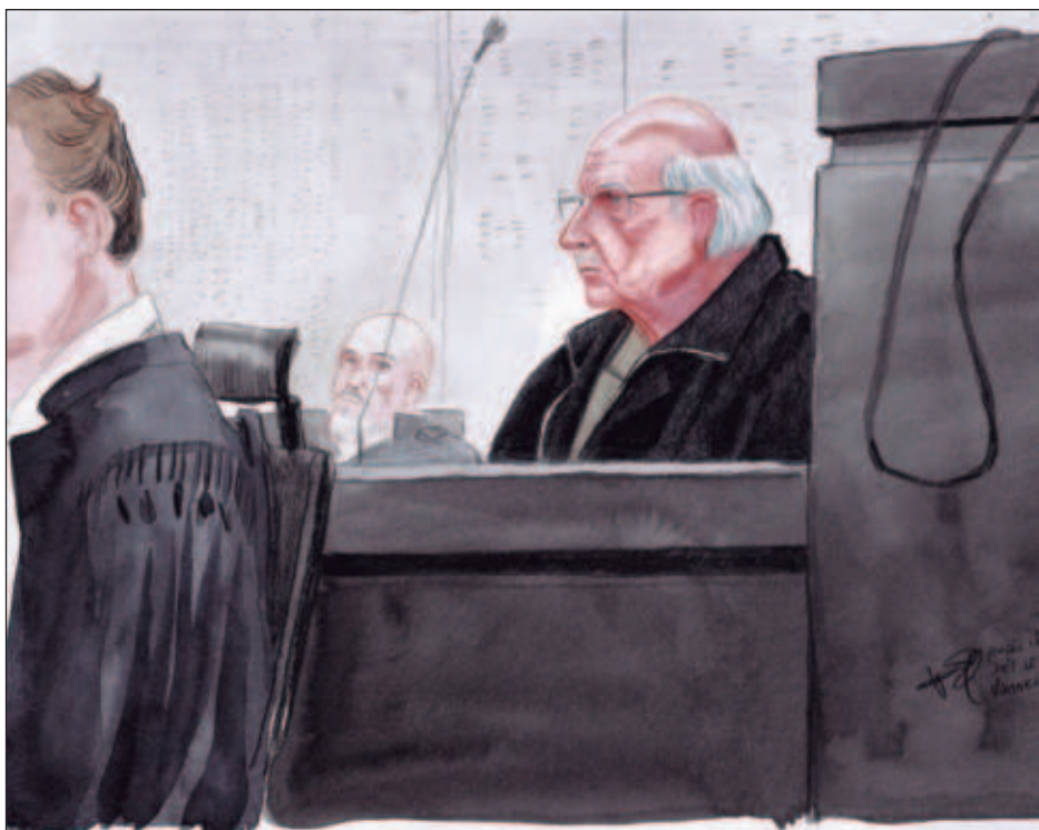
▲ Joël Le Scouarnec, de 74 años, se enfrenta 111 acusaciones de violación y 189 de agresión sexual entre 1989 y 2014, agravadas por el hecho de que abusó de su posición de médico y de que 256 de los 299 víctimas eran menores de 15 años.

La violencia ejercida por los armados ha registrado cambios. El año pasado no primaron los actos más notorios como las masacres sino otros dirigidos al control social como los confinamientos.