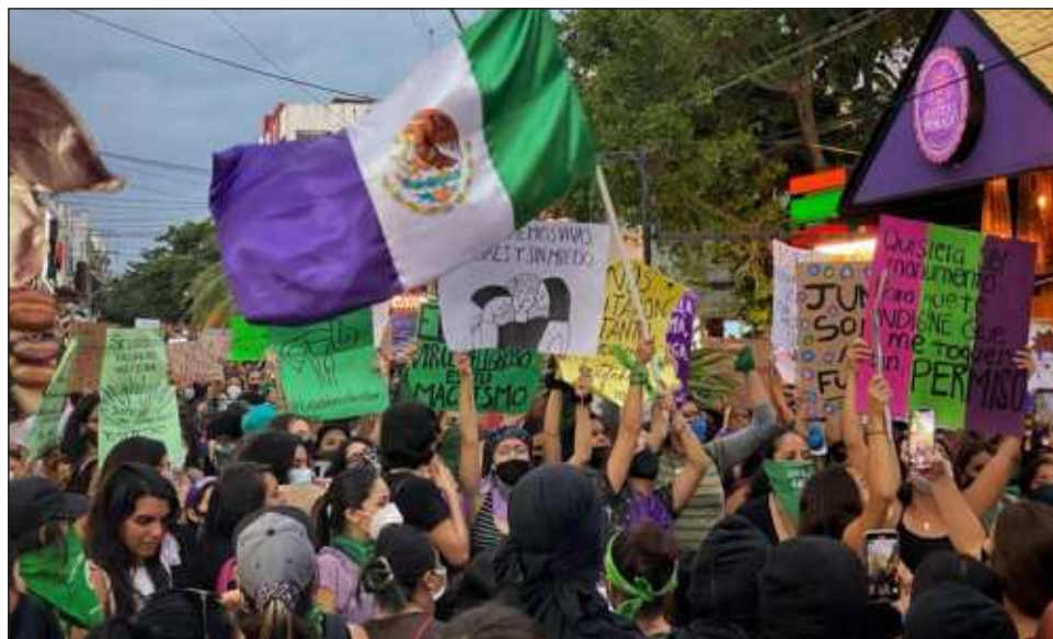
▲ “Como todos los años vamos a salir a las calles, a tomarlas, a seguir demandando las exigencias pendientes: educación, salud, igualdad, seguridad”: Marea Verde.

De manera anticipada, el 22 de febrero las integrantes de Siempre Unidas de Playa del Carmen realizaron la tercera edición del Festival de la Revolución Feminista, en el que hubo actividades, talleres y se presentaron artistas, standuperas y rapeas feministas.