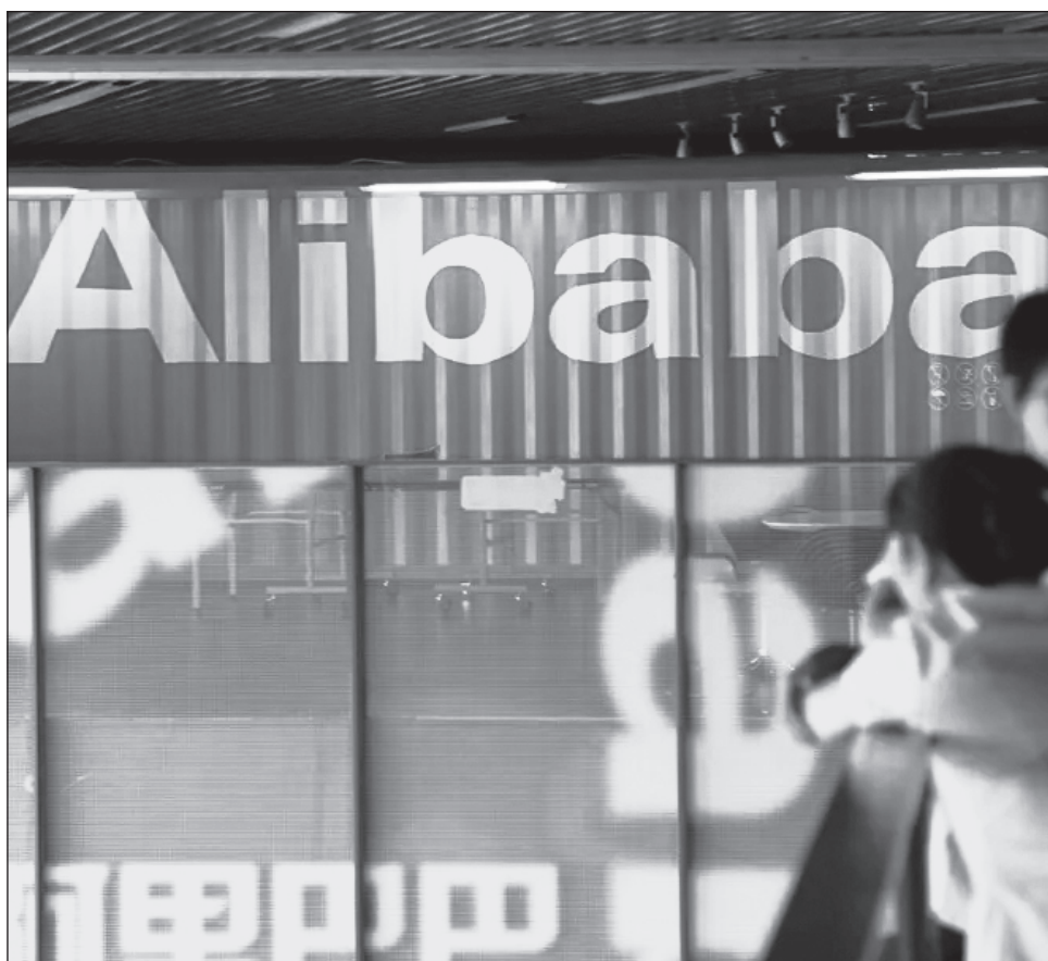
▲ Desde 2020 y durante varios años, el sector tecnológico chino estuvo en el punto de mira de las autoridades, que pretendían regular una industria hasta entonces muy poco reglamentada.

Sin embargo, estos gigantes tecnológicos se han ido recuperando poco a poco, especialmente en los últimos meses, en un momento en que China intenta reactivar el consumo interno, estancado desde la pandemia, en un contexto de crisis inmobiliaria y elevado desempleo juvenil.