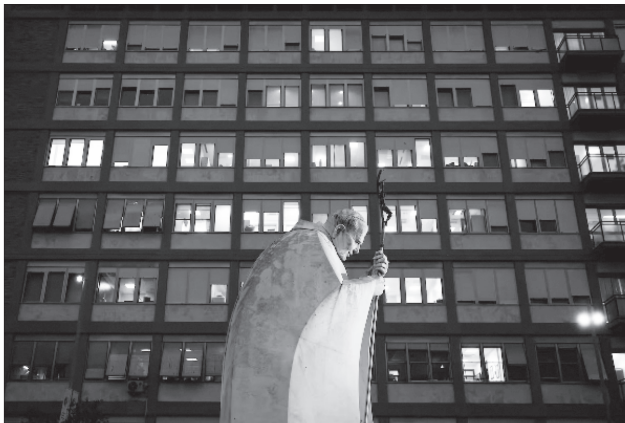
▲ El equipo médico afirmó estos últimos días que Jorge Bergoglio no se encuentra “fuera de peligro”.

También las redes sociales están inundadas de personas afirmando que rezan por Francisco. Algunos acompañan sus mensajes de una famosa foto del obispo de Roma, sólo en la plaza de San Pedro, durante la pandemia de Covid-19.