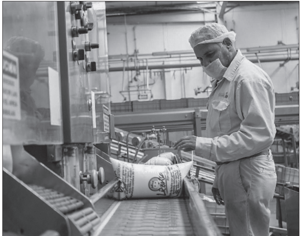
▲ La edificación de la planta lechera de Liconsa en Campeche tendrá una inversión total del orden de los 120 millones de pesos, el recurso partirá del Presupuesto Fiscal 2025.

Este centro de producción, tiene como objetivo principal asegurar la “seguridad alimentaria” del país, pues proyecta pasar de 45 millones de litros de leche producidos al año, a 100 millones de litros, lo que también sería en beneficio de los campechanos.