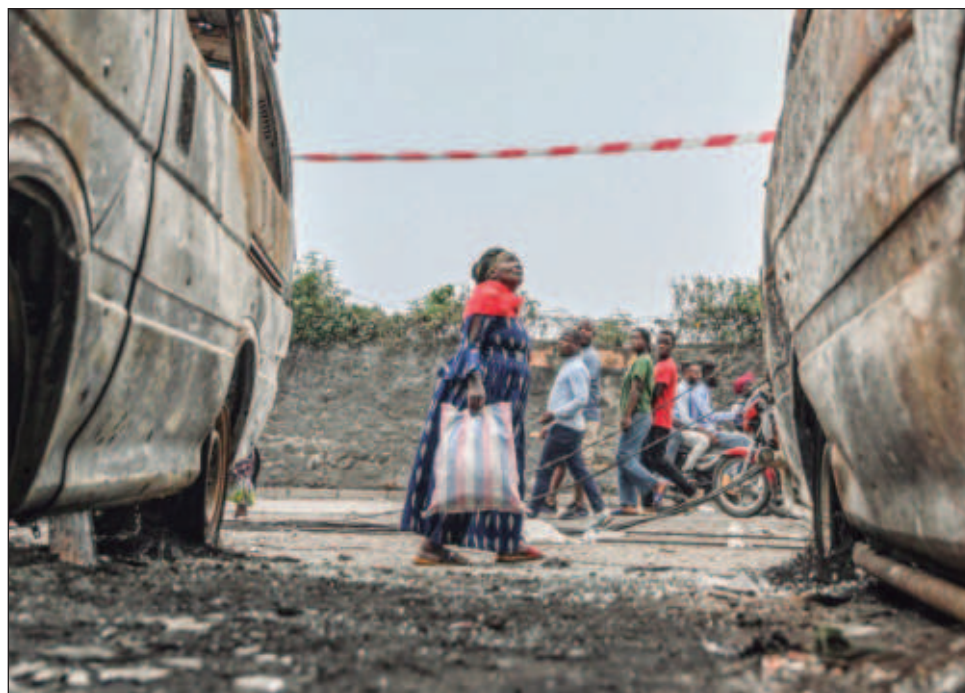
▲ Los autócratas aplastan a la oposición porque temen lo que haría un pueblo verdaderamente empoderado (...) y el patriarcado mantiene a las niñas sin escolarizar y a las mujeres alejadas de los derechos básicos, acusó el jefe de la ONU, Antonio Guterres.

El secretario general de la ONU, Antonio Guterres, aseguró por su parte que “uno a uno, los