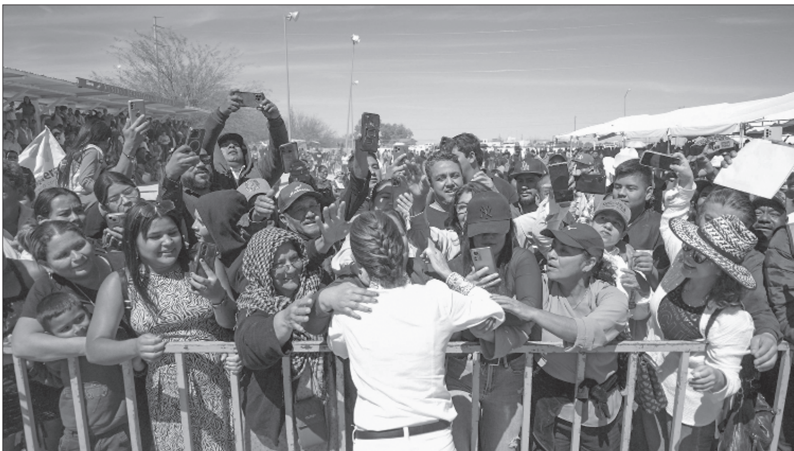
▲ La carta de El Mayo trata de poner a la administración Sheinbaum en el dilema de atender requerimientos de un ciudadano procesado irregularmente en EU.