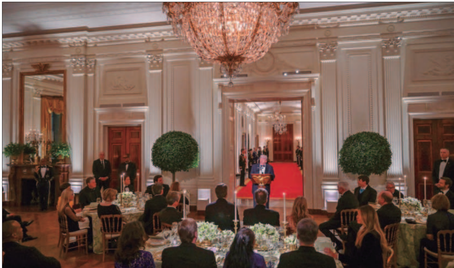
▲ "Trump hace elogios a Sheinbaum y en otros momentos señala que México no está haciendo lo suficiente para atender los problemas de migración".