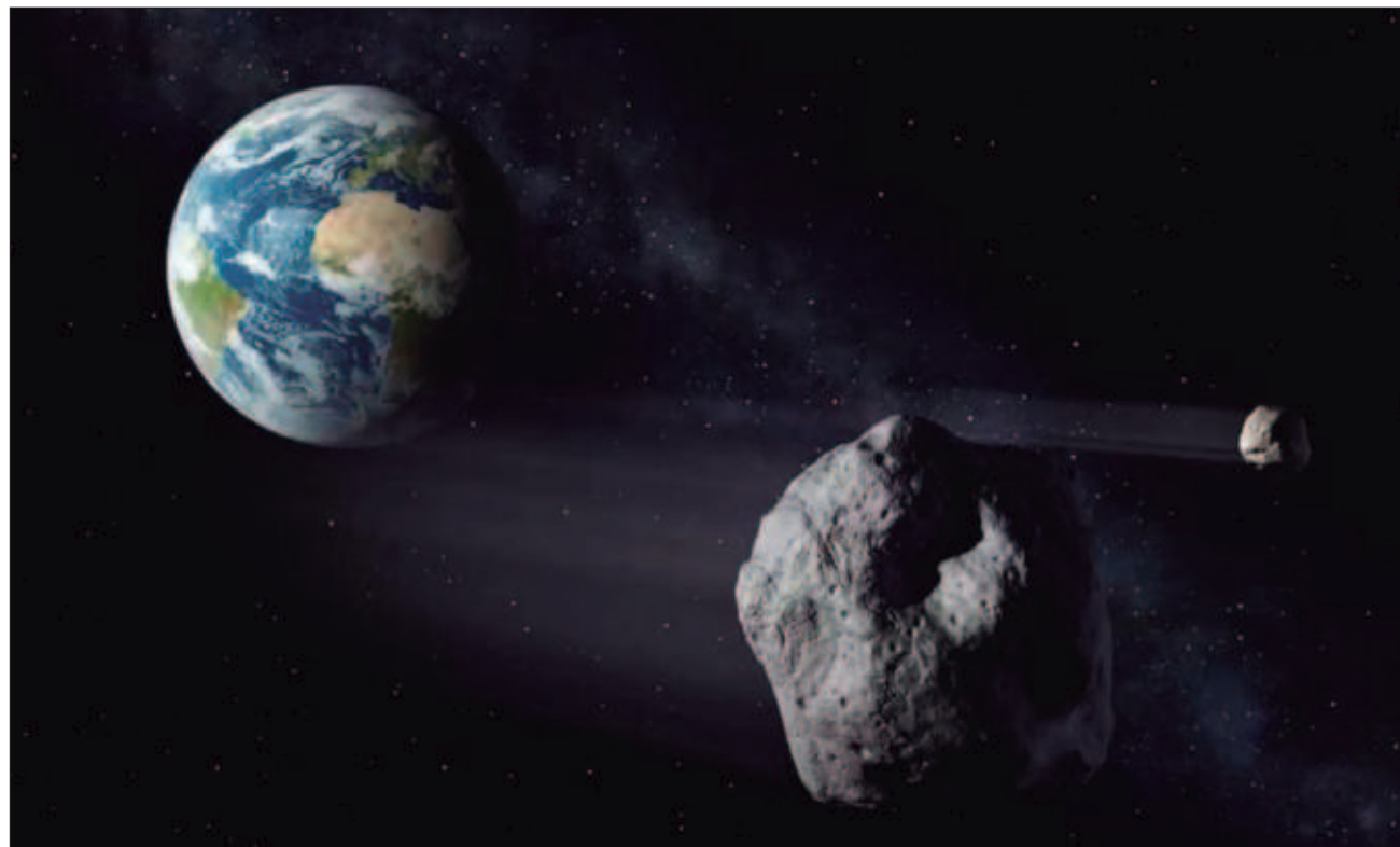
▲ La agencia estadounidense confirmó que el cuerpo especial pasará “con seguridad” al lado de la Tierra en 2032 y aumentó la probabilidad de impacto directo a la Luna a 1,7%, aunque señaló que este sigue siendo un valor “muy pequeño”.

“Las últimas observaciones han reducido aun más la incertidumbre de su futura trayectoria, y el rango de posibles localizaciones en las que podría estar el asteroide el 22 de diciembre de 2032 se ha