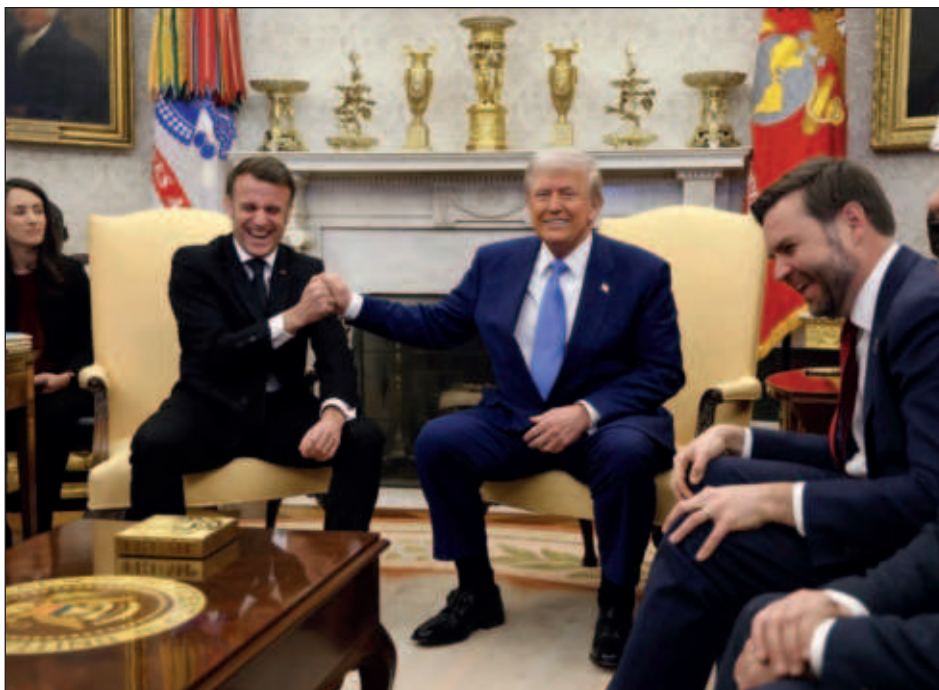
▲ Emmanuel Macron y Donald Trump intercambiaron algunas bromas y cumplidos, en un tono bastante distendido; también se dieron fuertes apretones de manos.

El republicano, que cuenta sobre todo con su diálogo con el presidente ruso, Vladimir Putin, para detener los combates,