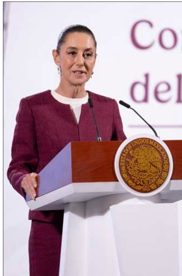
▲ La jefa del Ejecutivo aseguró que no le preocupa lo que el narcotraficante pueda decir en el proceso judicial en EU: “no caemos en chantajes ni amenazas”.

Sostuvo que ante las supuestas presiones, “ni caemos en chantajes ni en amenazas, cumplimos con nuestra responsabilidad, con la Constitución y con las leyes”.