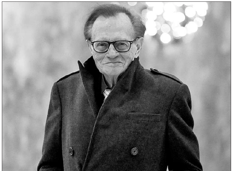
▲ King presumía que nunca se preparaba demasiado para una entrevista. Su estilo de evitar la confrontación relajaba a sus invitados y lo hacía cercano con su audiencia.

Mientras, los errores ocasionales lo hacían parecer fuera de la realidad o algo