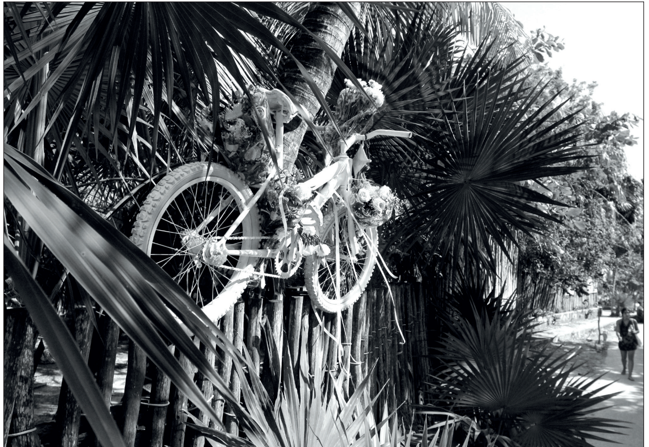
▲ El accidente ocurrido en la colonia Los Reyes, al oriente de Mérida, es el primero del año en el que un conductor de bicicleta pierde la vida.

El domingo 17 de enero, más de 100 ciclistas rodaron del Parque Ecológico de Poniente hasta Ciudad Caucel para exigir justicia por la muerte de Jacinto (occurrida hace un mes) y todos los ciclistas caídos en accidentes de tránsito, y reclamar espacios seguros para todos.