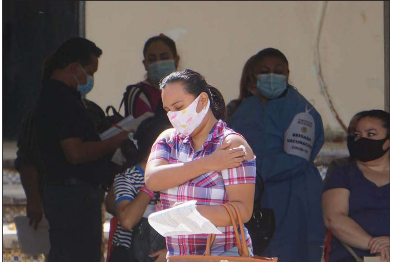
▲ Algunos docentes esperaban reacciones a la vacuna anti COVID, pero éstas no han pasado de alguna irritación como con cualquier otro inmunizante.

Las primeras horas de la jornada transcurrieron en calma, sin altercados ni manifestaciones de padres de familia, quienes son los más alterados por la decisión de vacunar a los maestros y que Campeche regrese a clases presenciales después de este paso.