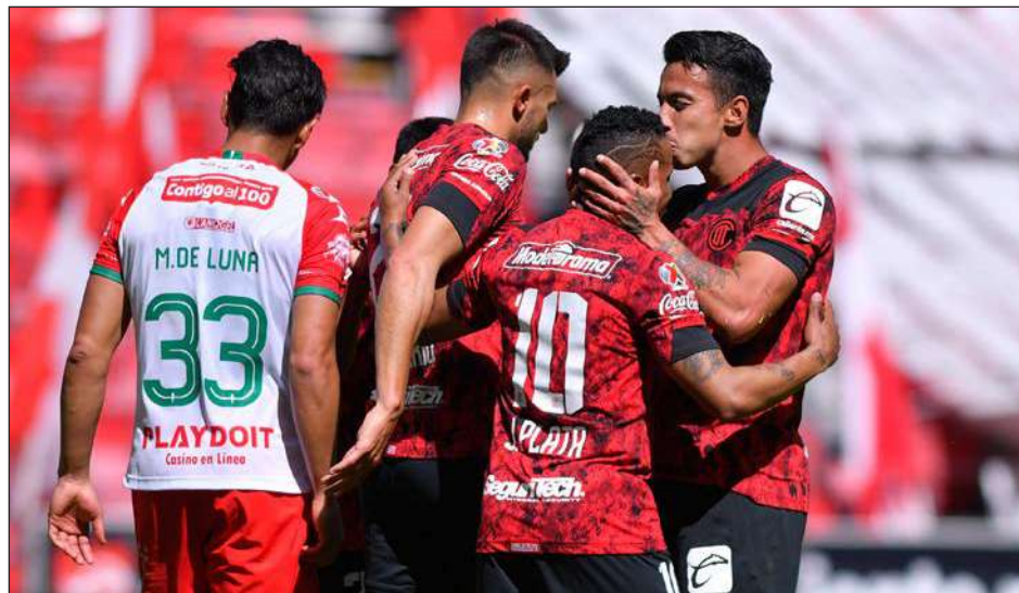
▲ Los Diablos van invictos en el comienzo del torneo Clausura de la Liga Mx.

Estrada convirtió un penal a los 24 minutos y Plata agregó un tanto a los 90 para la segunda victoria de los Diablos Rojos en tres fechas. Toluca se mantiene invicto y con siete puntos se colocó primero de manera momentánea con la misma cosecha que el Santos, pero una mejor diferencia de goles. Santos empató 0-0 con Mazatlán, mientras que los Tigres derrotaron 2-0 al Atlas y Tijuana superó 1-0 a Puebla. Las Chivas continúan sin ganar y sufrieron su primer tro-