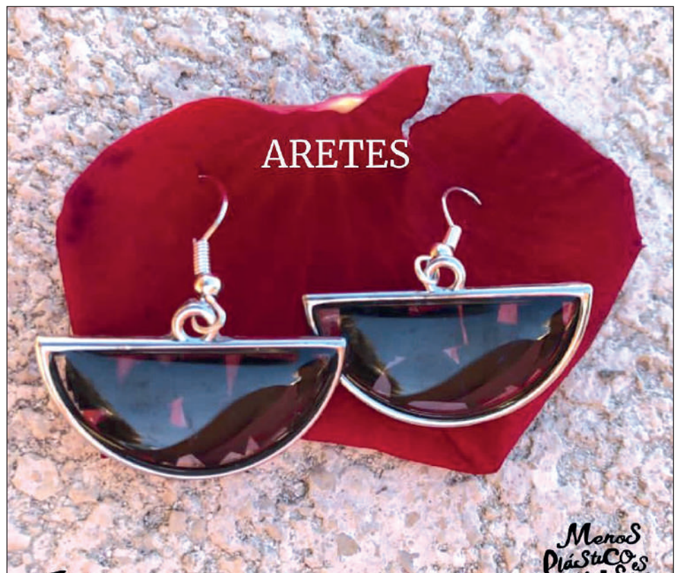
▲ La colección Joyas del Mar está inspirada en las tortugas marinas.