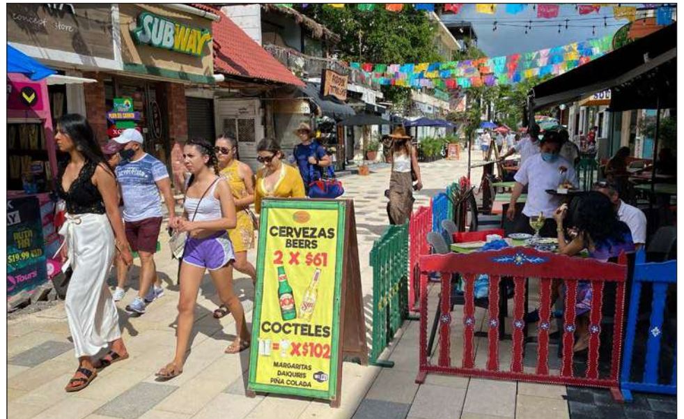
▲ Muchos turistas caminan por la Quinta Avenida de Playa del Carmen sin cubrebocas.

“A muchos de ellos se les ve caminando por la Quinta Avenida de Playa del Carmen sin cubrebocas y no hay autoridad que los conmine a usarlos. Es de vital importancia que haya presencia de autoridades que vigilen que tanto turistas como locales sigan rigurosamente las medidas y protocolos sanitarios. La pandemia aún está entre nosotros y no podemos darnos el lujo de bajar la guardia”, destacó.