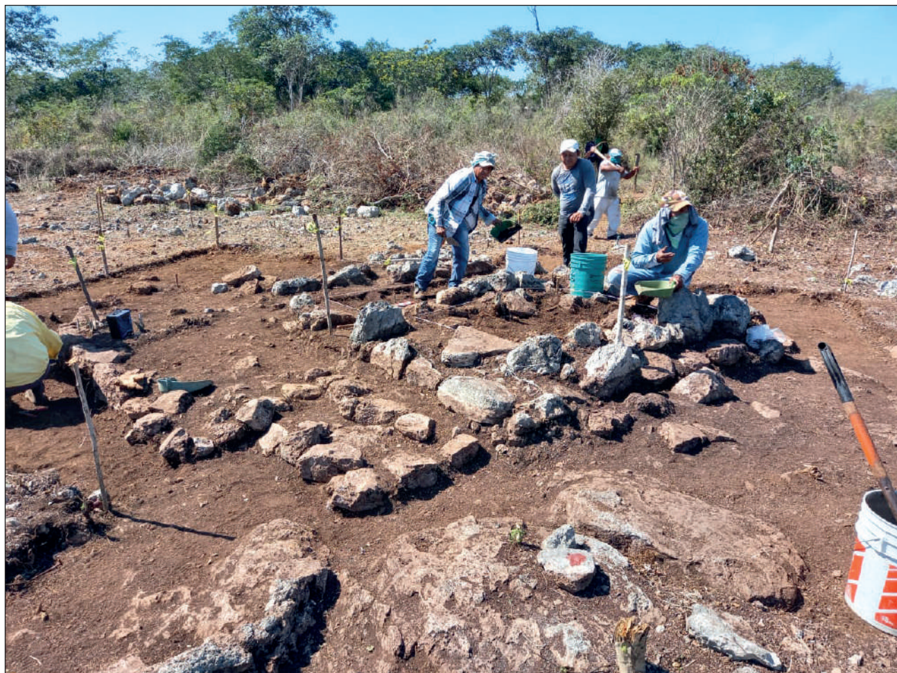
▲ En algunos fraccionamientos se ha destinado una reserva importante de montículos mayas, pero se requieren más espacios similares y que los vecinos los cuiden.