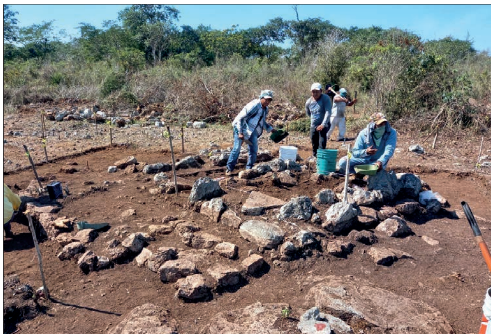
▲ Maanal 16 ja'abo'ob káajak u beeta'al u xaak'alil yéetel u meyajil Parmee' tí'al u kaláanta'al yéetel u xak'alta'al úuchben ba'alo'ob.

Le beetike', tu ya'alaj yéetel Parmee' táan u