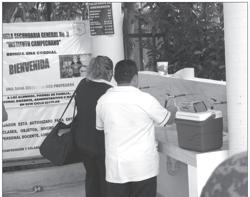
▲ Afiliados a la Canaco confían que mientras haya más personas inmunes podrá haber una recuperación de las actividades económicas y productivas.