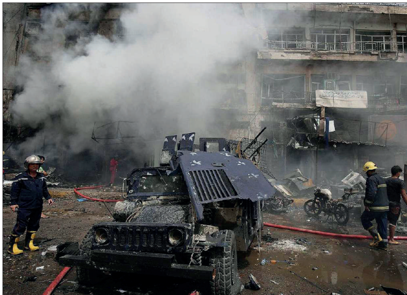
▲ La red del Estado Islámico para ataques urbanos en Bagdad parecía degradada, pero el pasado jueves demostró que encontró una brecha que explotar.

Irak declaró su victoria sobre el grupo EI a finales de 2017, reabrió calles y suprimió kilómetros de vallado en Bagdad. Se envió a las tropas más experimentadas en busca de las células durmientes de los yihadistas, en desiertos y montañas, y las ciudades quedaron en manos de unidades