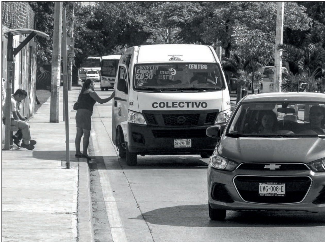
▲ La estrategia responde a las exigencias de las colectivas quintanarroenses por una Ley de Movilidad con perspectiva de género.

El Consejo General del INE aprobó la validez de las credenciales con vigencia 2019 y 2020 para ser utilizadas exclusivamente para votar el día de la jornada electoral del próximo 6 de junio.