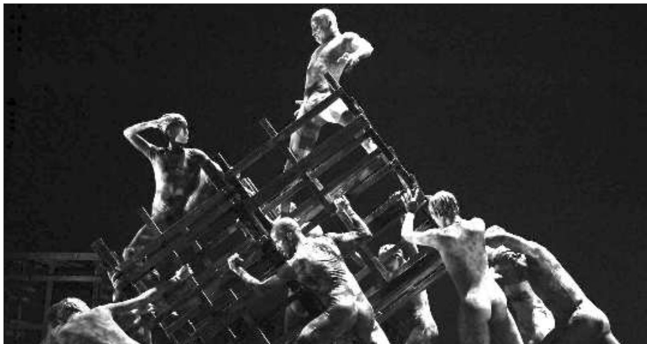
▲ Perro sin plumas, primera ópera con temática brasileña inspirada en el poema homónimo de João Cabral de Melo Neto, será interpretada por la Compañía Deborah Colker en el Festival Cervantino el 25 y 26 de octubre.

"Frida es un ícono, es un símbolo, por eso quiero referirme más a la persona, a los detalles. Para mí es muy importante la figura de Frida porque estuvo como aprisionada en su propio cuerpo, entonces quiero hablar de su cuerpo aprisionado cuando vive el problema de su pierna y luego el accidente que tiene y ese dolor constante con el que vivió. Quiero hablar de eso", agregó la directora de la Compañía de Danza Deborah Colker.