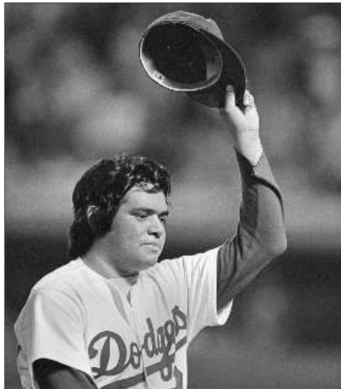
▲ Valenzuela es, hasta la fecha, el mejor lanzador mexicano en el béisbol de Estados Unidos. Su carrera, libre de escándalos y de episodios de abusos de sustancias que fueron muy frecuentes en esos años.

Bastaron unas pocas temporadas para que Fernando Valenzuela se incrustara en un imaginario colectivo de todo el continente americano, atrayendo a millones de aficionados mexicanos y latinoamericanos a formar parte de la afición de los Dodgers de Los