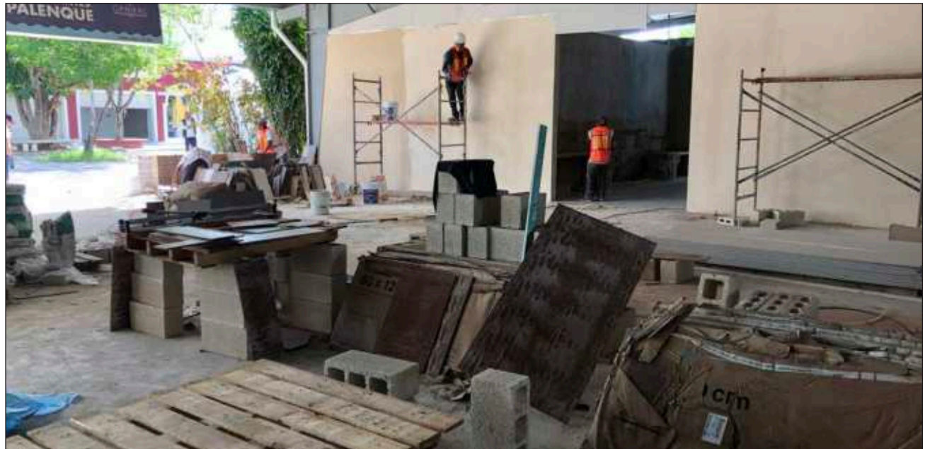
▲ La principal novedad en las remodelaciones de la Feria de Xmatkuil serán los accesos digitales: con 18 nuevos torniquetes, se pretende que la entrada a la feria sea más rápida y eficiente: Servicios Estatales.