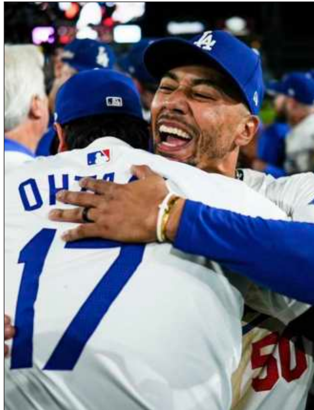
▲ Mookie Betts y Shohei Ohtani, después de que Los Ángeles aseguró el banderín frente a los Mets.

Será el primer Clásico de Otoño en la historia con cinco peloteros ganadores del premio al Jugador Más Valioso. Dos de ellos, Aaron