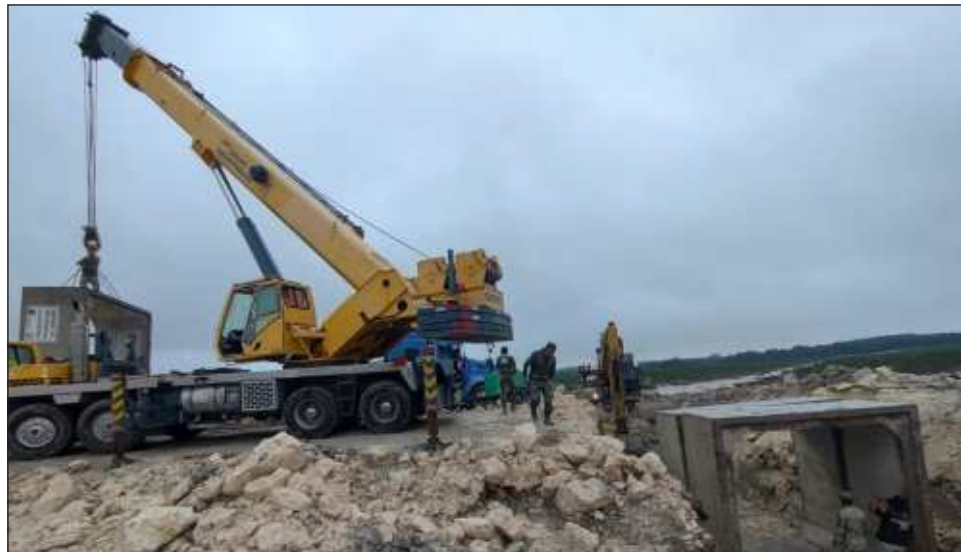
▲ Autoridades avanzan en los trabajos en la carretera 186, que quedó incomunicada, colocando cajas de concreto, haciendo relleno y compactado material.

Denunciaron que el martes 22 de octubre fue personal