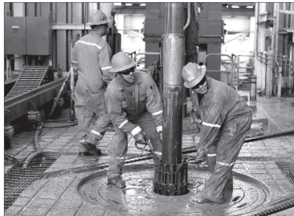
▲ Se calcula que la petrolera tiene deuda con al menos 42 empresas locales.

Recordó que de acuerdo con datos obtenidos en el portal de Pemex, la deuda de la petrolera nacional con sus proveedores es de más de 360 mil millones de pesos, lo cual ha sido so-