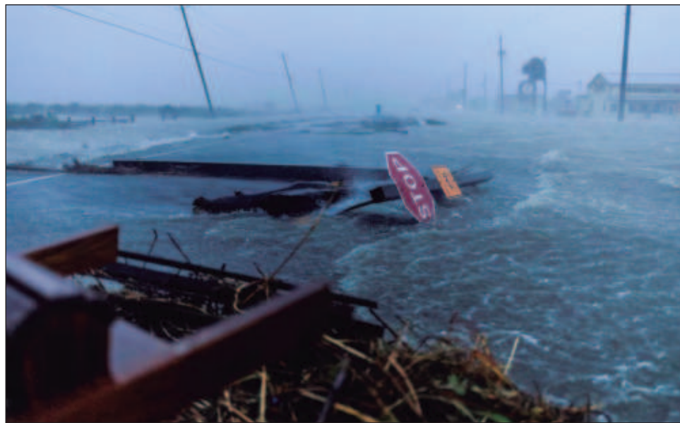
▲ Los científicos del clima estudian El Niño porque puede alterar la corriente en chorro, secando el noroeste de EU mientras empapa el suroeste con lluvias inusuales.

Estos cambios de temperatura eran más intensos en el pasado, y la oscilación se produjo incluso cuando los continentes estaban en lugares diferentes de los que están ahora, según el estudio, que se publica en la revista PNAS.