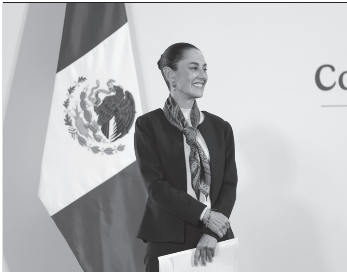
▲ “Habrá que reconocer que Claudia es una mujer de temple, ni se ha quejado ni ha arrojado culpas. Creo que nunca lo haría porque también es leal y firme. Está resistiendo con serenidad, inteligencia y mucha paciencia”.

“ SOY MADRE, ABUELA , científica y mujer de fe, y a partir de hoy, por voluntad del pueblo de México, la presidenta constitucional de los Estados Unidos Mexicanos. Gobernaré para todos y para todas, y tengan la certeza de que pondré mi conocimiento, mi fuerza, mi historia y mi vida misma al servicio del