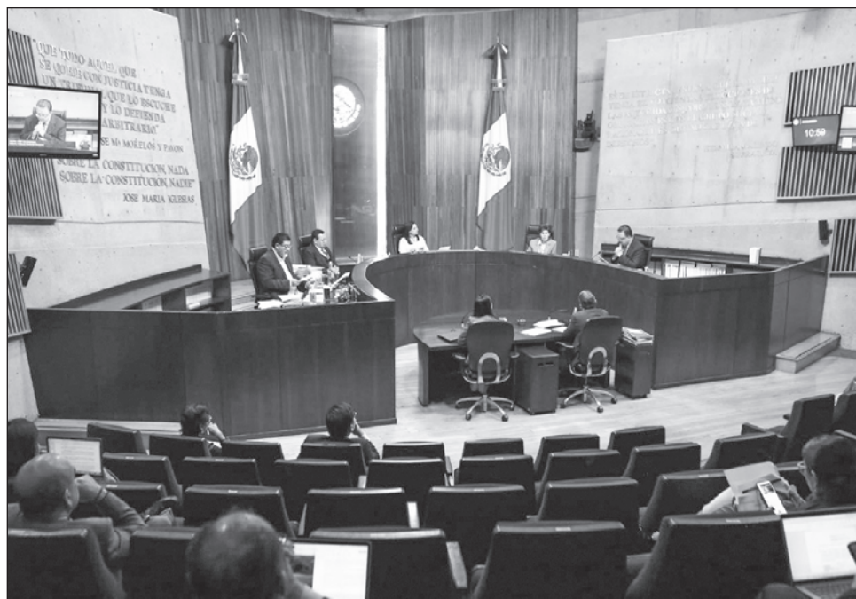
▲ El proyecto fue aprobado con tres votos a favor y dos en contra.

Lo mismo señaló la magistrada presidenta Mónica