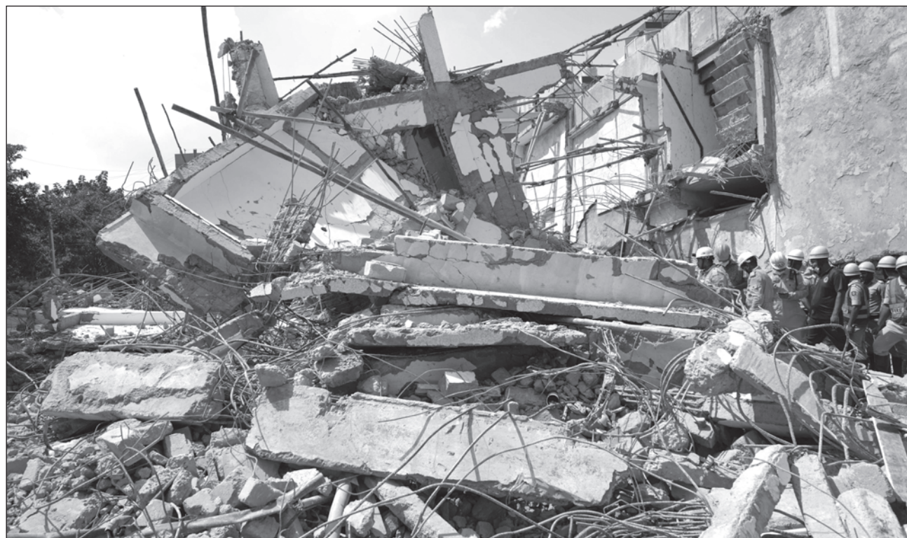
▲ Al menos cinco trabajadores murieron y otros tres quedaron atrapados en el sur de India por el derrumbe de un edificio en construcción de siete plantas durante las lluvias del

monzón, según dijo la policía el miércoles. Los equipos de bomberos y emergencias habían rescatado por el momento a 13 personas, según indicó la policía.