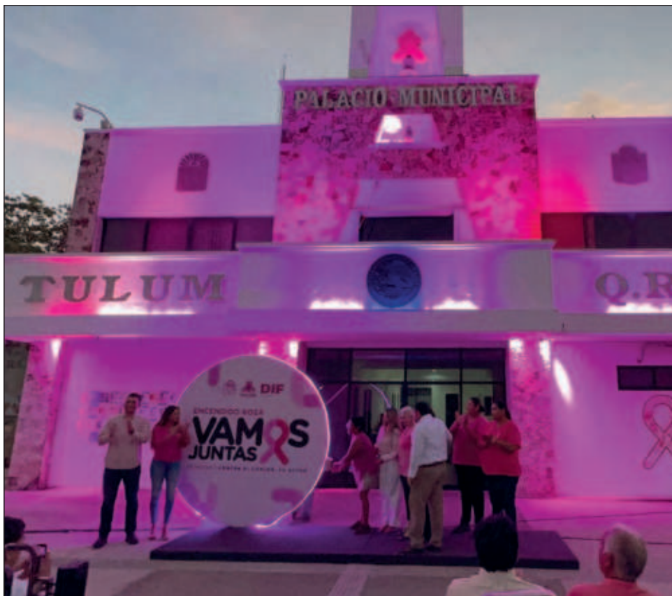
▲ Autoridades intensifican los esfuerzos en la detección temprana.

Expuso que aunque octubre es el mes de la concienciación sobre el cáncer de mama, las iniciativas de prevención deben llevarse a cabo de manera continua a lo largo del año.