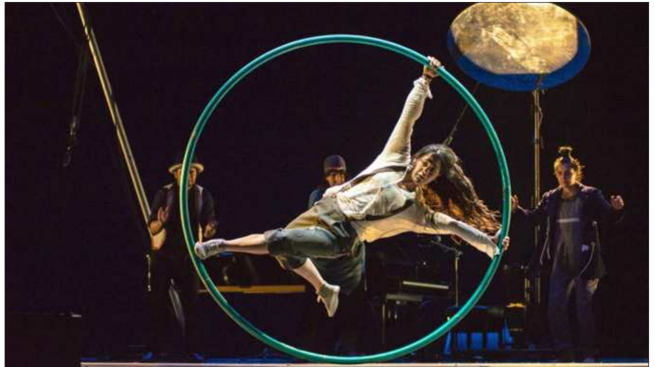
▲ Luna Eva es un espectáculo de circo contemporáneo que aborda los ciclos de vida desde el territorio de los sueños, integrando actos de suspensión capilar, equilibrio mano a mano, acrodanza, cintas aéreas y rueda Cyr.

Bajo la dirección de Andrea Peláez González, Luna Eva integra actos de suspensión capilar, equilibrio mano a mano, acrodanza, malabarismo excéntrico, mástil, cintas aéreas y rueda Cyr. El espectáculo se desarrolla en un espacio diseñado como una instalación por el artista visual Alain Kerriou,