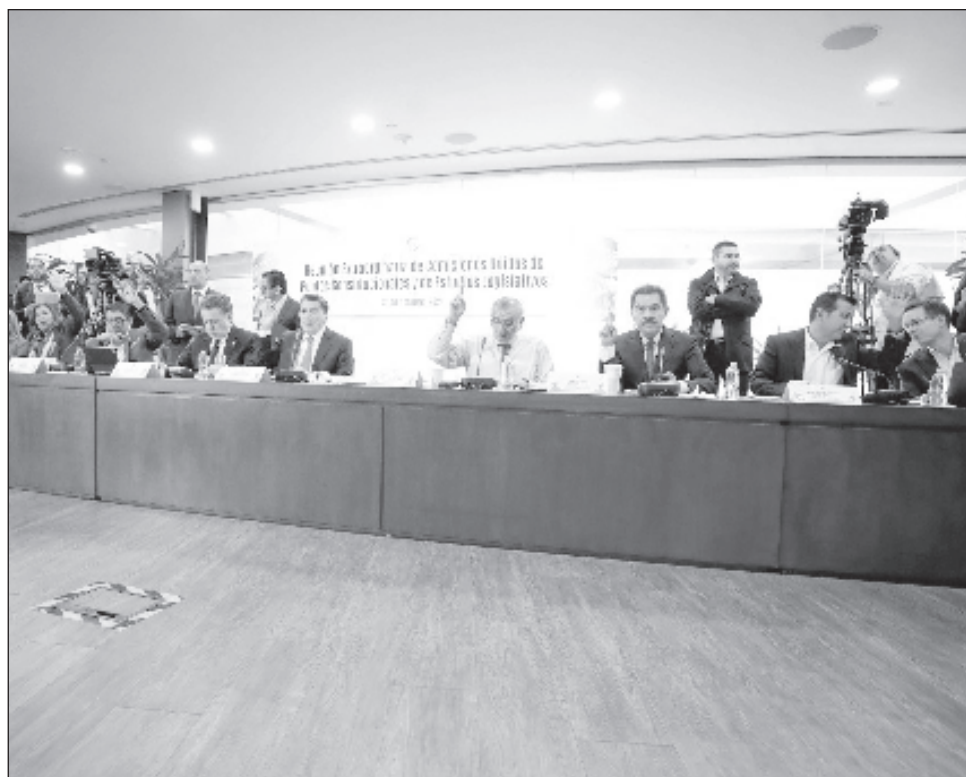
▲ Después de más de cinco horas de discusión se aprobó esa reforma, con 24 votos a favor de Morena y sus aliados y 10 en contra de la oposición.

Ante los reiterados señalamientos de panistas y priistas en el sentido de que dejarán desprotegidos a los ciudadanos ante reformas que, por ejemplo, revivan en la Carta Magna la pena de muerte o la esclavitud, el senador Morenista Javier Corral sostuvo que la iniciativa fue "sustancialmente modificada, con lo que se eliminan las preocupaciones, así como las falacias".