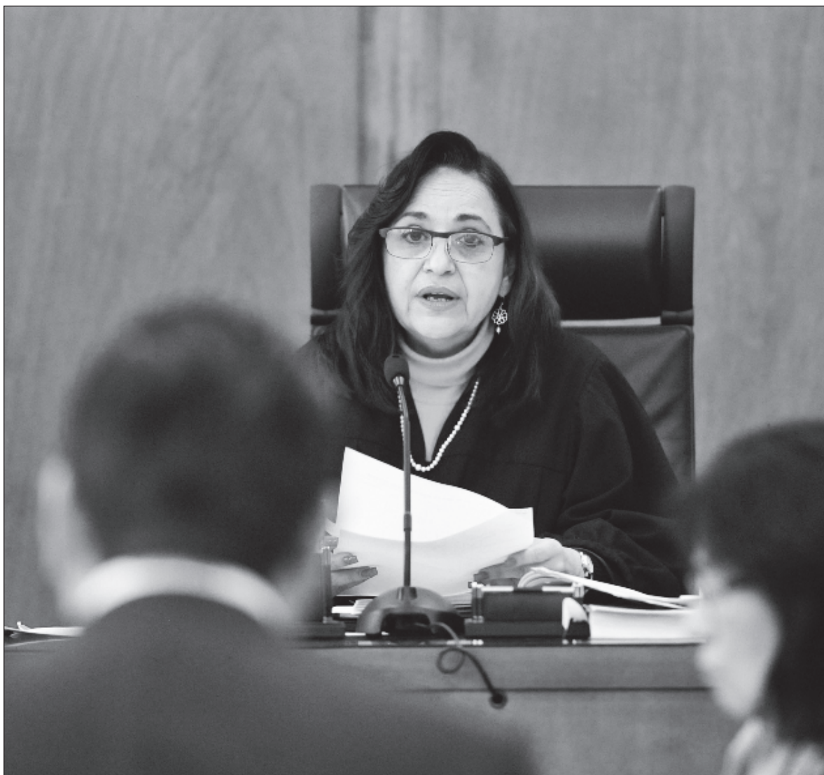
▲ "Ahora su nuevo riesgo se decidirá en el Tribunal Electoral del Poder Judicial de la Federación, donde la facción dominante, integrada por tres de cinco magistrados, está por resolver si es procedente la elección de juzgadores".