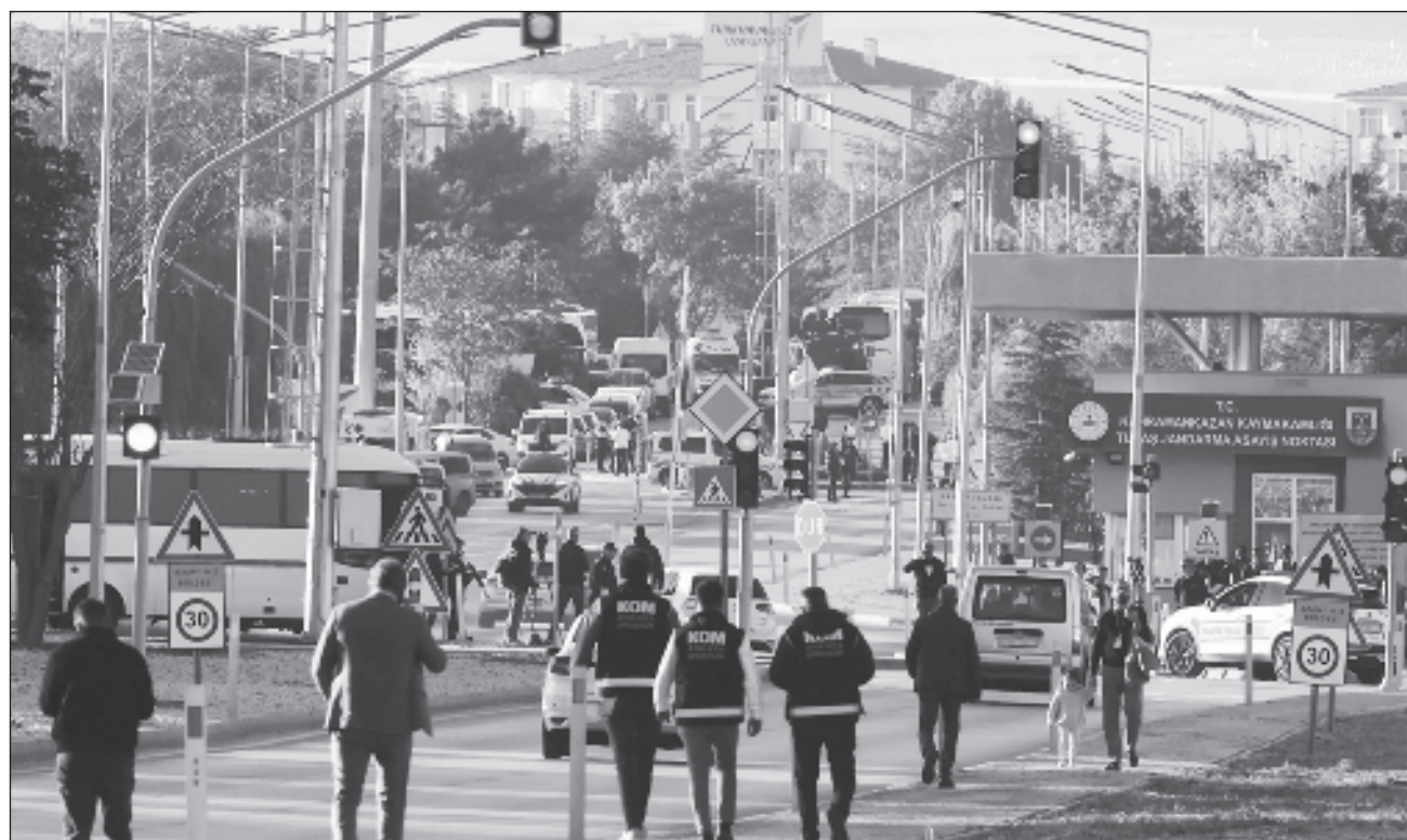
▲ Un gran número de policías, además de bomberos y ambulancias, acudieron a las instalaciones de TUSAS y, de acuerdo con la emisora NTV, hasta el día de ayer continuaban los tiroteos en el interior de la fábrica.

“El ataque a las instalaciones de TUSAS tuvo lugar a las 15:26 horas (local). Dos terroristas fueron neutralizados, un hombre y una mujer. Desafortunadamente, tenemos cuatro muertos y 14 heridos, tres de ellos de forma grave”, dijo el ministro