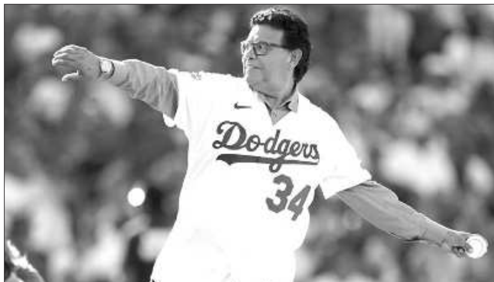
▲ Fernando Valenzuela lanza la primera bola durante el Juego de Estrellas de MLB el 19 de julio de 2022 en Los Ángeles. Residentes de la ciudad, particularmente latinos, lamentan la muerte del "Toro".