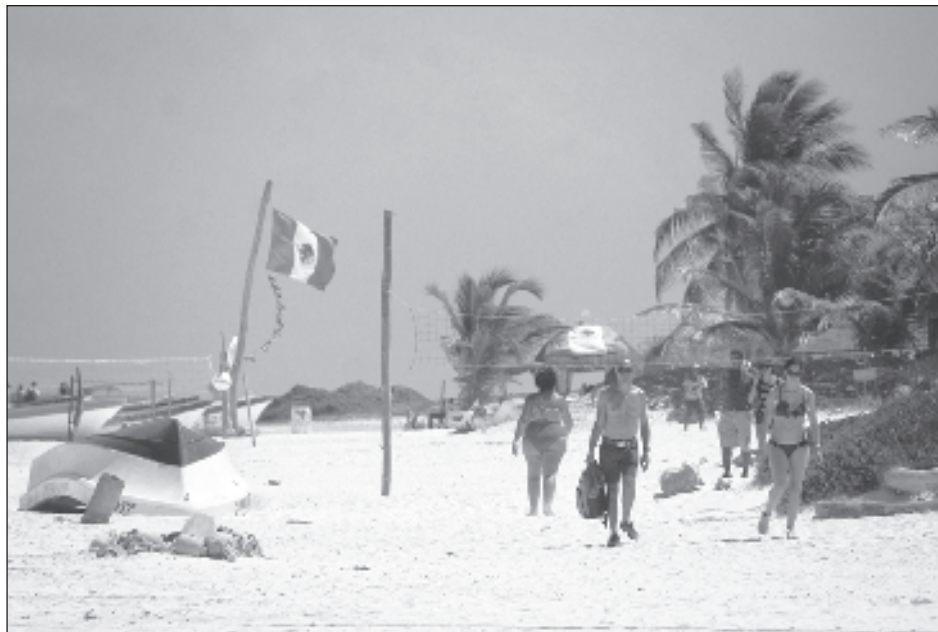
▲ Las tendencias indican que 2025 será el año de las experiencias de viajes inmersivas y compartidas, en las que Tulum ocupa el segundo puesto.

"Skyscanner ha publicado un reciente informe de tendencias de viaje a 2025 donde en España el destino