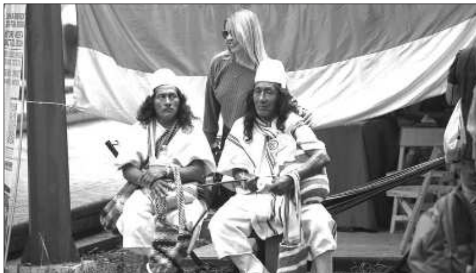
▲ La Fundación Pares alerta que "las estadísticas sobre los niveles de esclarecimiento de violencia homicida contra liderazgos sociales en general muestran un panorama crítico en esta materia".

La cumbre de Naciones Unidas de Biodiversidad