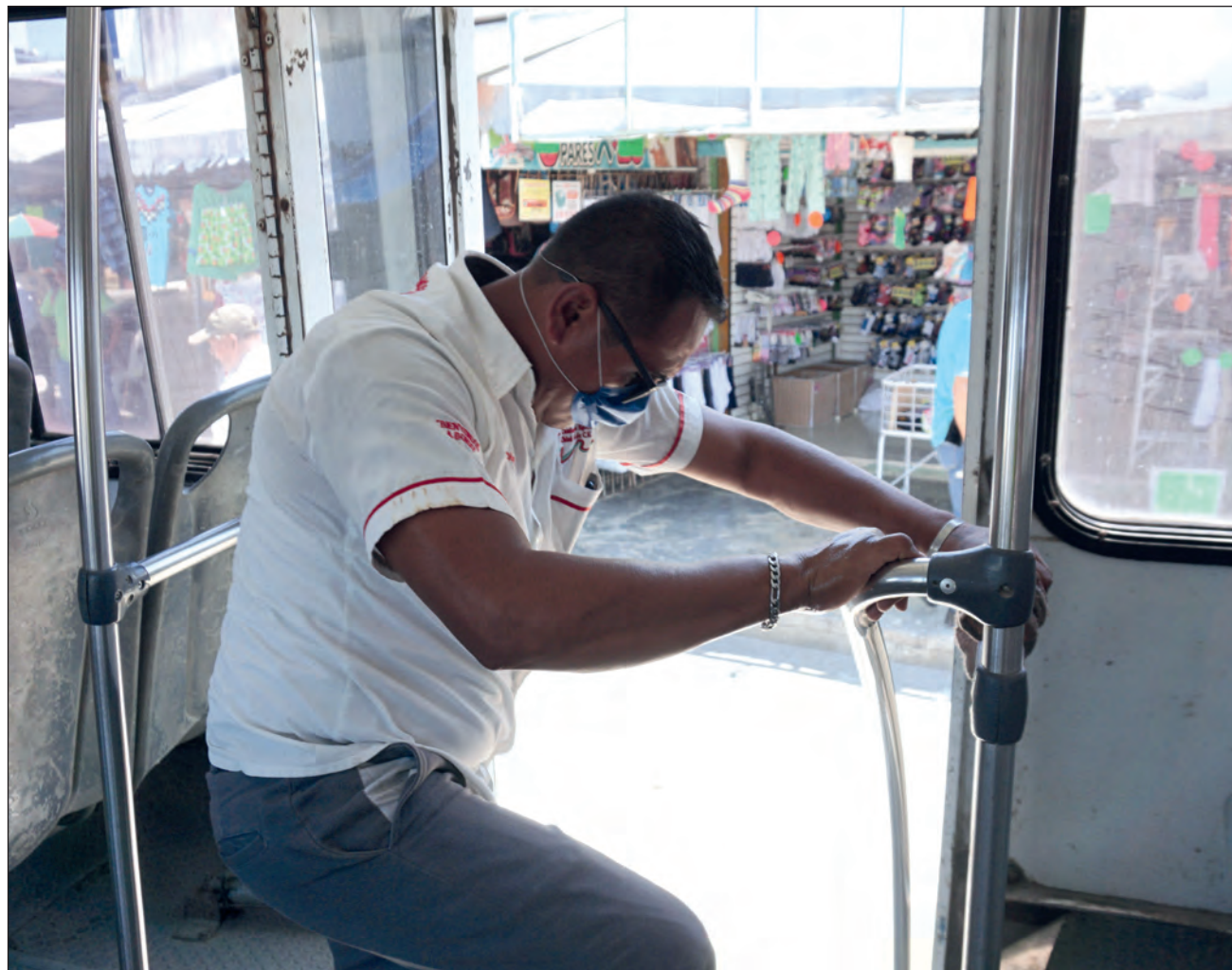
▲ Activistas consideran que el horario de transporte público debe extenderse pues se trata de un servicio esencial.

El transporte público continuará trabajando en horario limitado de 5 a 22 horas