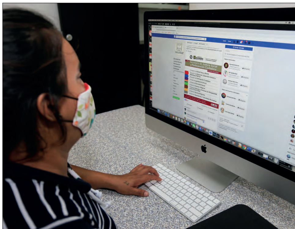
▲ El trabajo entre docentes y padres de familia durante el receso escolar debió generar alternativas de contacto, para subsanar problemas de comunicación.

El entrevistado dijo que, de cara al inicio de clases a distancia, se espera que haya mucha au-