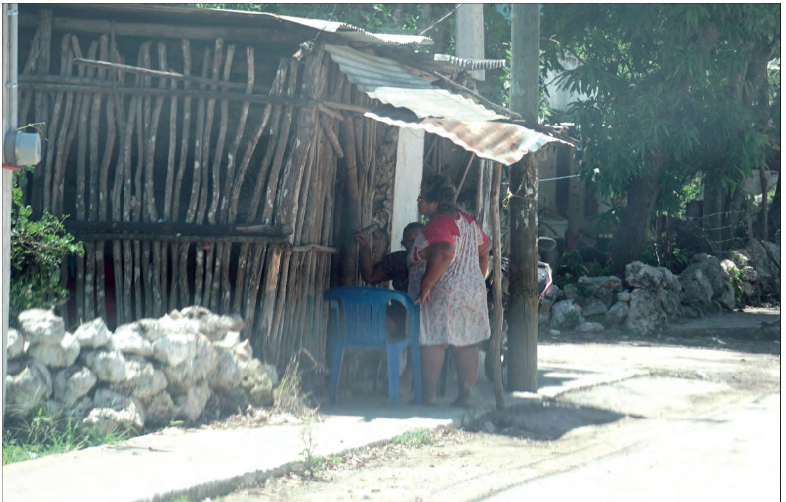
▲ Aunque el COVID-19 puede contagiar a cualquier persona, el mayor número de la población no goza de las condiciones materiales de vida, ni de los servicios de salud y derechos laborales como para poder en verdad asegurarse la suficiente “sana distancia”.