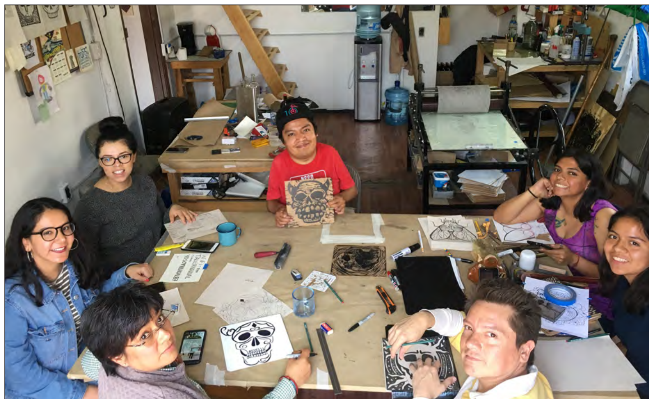
▲ El Taller de Gráfica Nahual es un centro de trabajo para más de 20 talleristas y artistas que comparten sus conocimientos, exponen y venden su obra en la galería.

“Fuimos los primeros que cerramos el 18 de marzo para cumplir los protocolos de seguridad, decidimos no arriesgar la vida de nadie, y seremos los últimos que reabriremos puertas cuando todo sea seguro. Mientras tanto, la comunidad del taller Nahual ha dejado de ob-