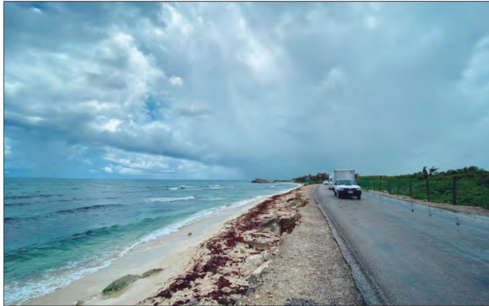
▲ El gobierno estatal levantó la alerta en toda la entidad por el paso de la tormenta tropical “Marco”, que pasó sin dejar afectaciones.

En los municipios de Benito Juárez e Isla Mujeres se realizaron acciones preventivas para evitar inundaciones, como el desazolve de pozos y limpieza de rejillas, captadores y bóvedas. En Tulum se registró un deceso relacionado con el mal clima: una turista falleció la tarde del sábado al caerle un rayo mientras estaba en la playa. Policías ministeriales levantaron el cuerpo y resguardaron la zona.