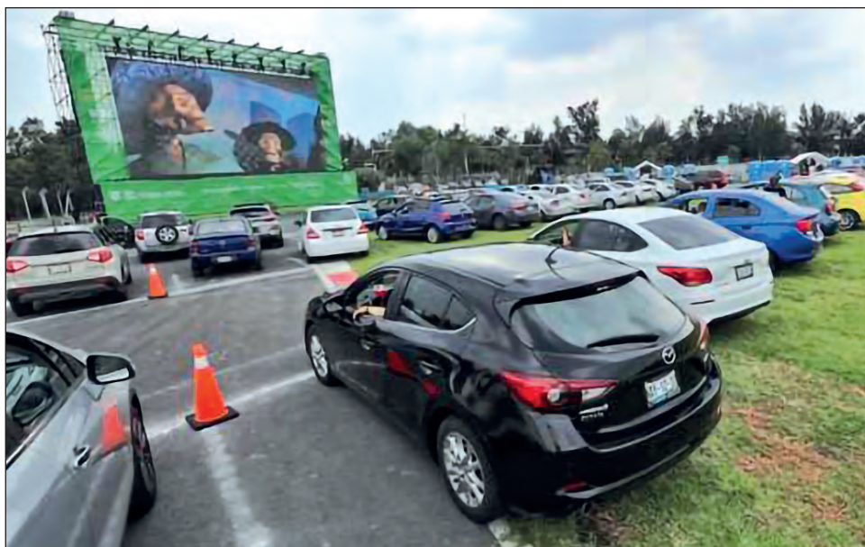
▲ Los autocinemas se han convertido en una alternativa de diversión en la nueva normalidad.

Agregó que buscan conseguir clientes internacionales e incluso crearon una nueva unidad de negocios llamada Neerme, la cual