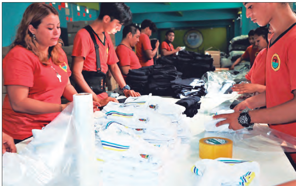
▲ Las 27 empresas del ramo textil del sur del estado ni siquiera están consideradas como esenciales; la gente considera que la ropa no es prioridad.

"Estamos muy bajos, las escuelas empiezan a distancia y aunque sí ha habido