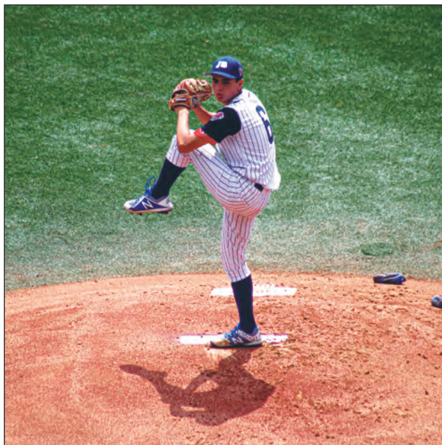
▲ La Liga de Prospectos de México se desarrolla en el Estadio Charros de Jalisco.

Es un alivio para la organización que luego de que no