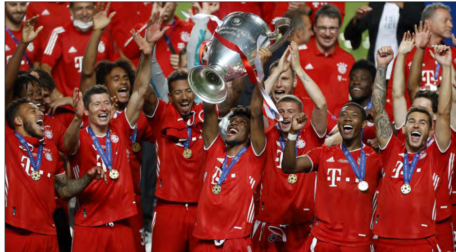
▲ Kingsley Coman, centro, del Bayern Múnich, alza el trofeo después de conquistar la Liga de Campeones al vencer en la final al Paris Saint-Germain.

Fue el 43er. gol del Bayern en una perfecta campaña en la "Champions"