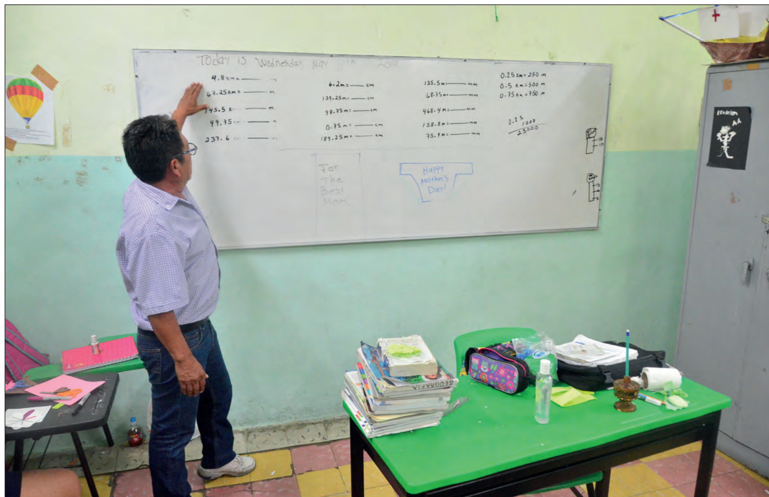
▲ Quiero invitarlos a retomar la vocación como la mejor posibilidad de darle sentido a nuestra vida. Con ella, transformamos la realidad.