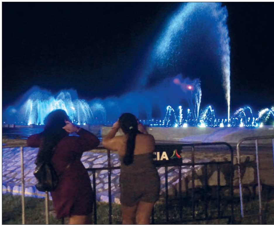
▲ El espectáculo de las fuentes tiene permitido, por ahora, el 30 por ciento de aforo.

Con un estricto protocolo de higiene y medidas sanitarias, las fuentes marinas Poesía del Mar , ubicadas en el malecón de esta capital, volvieron a funcionar este pasado viernes, al 30 por ciento de su capacidad, permitiendo un máximo de 100 asistentes por espectáculo. Por ahora, los días de función serán lunes, miércoles, jueves y viernes a las 20 horas, mientras que los sábados y domingos habrá dos funciones.