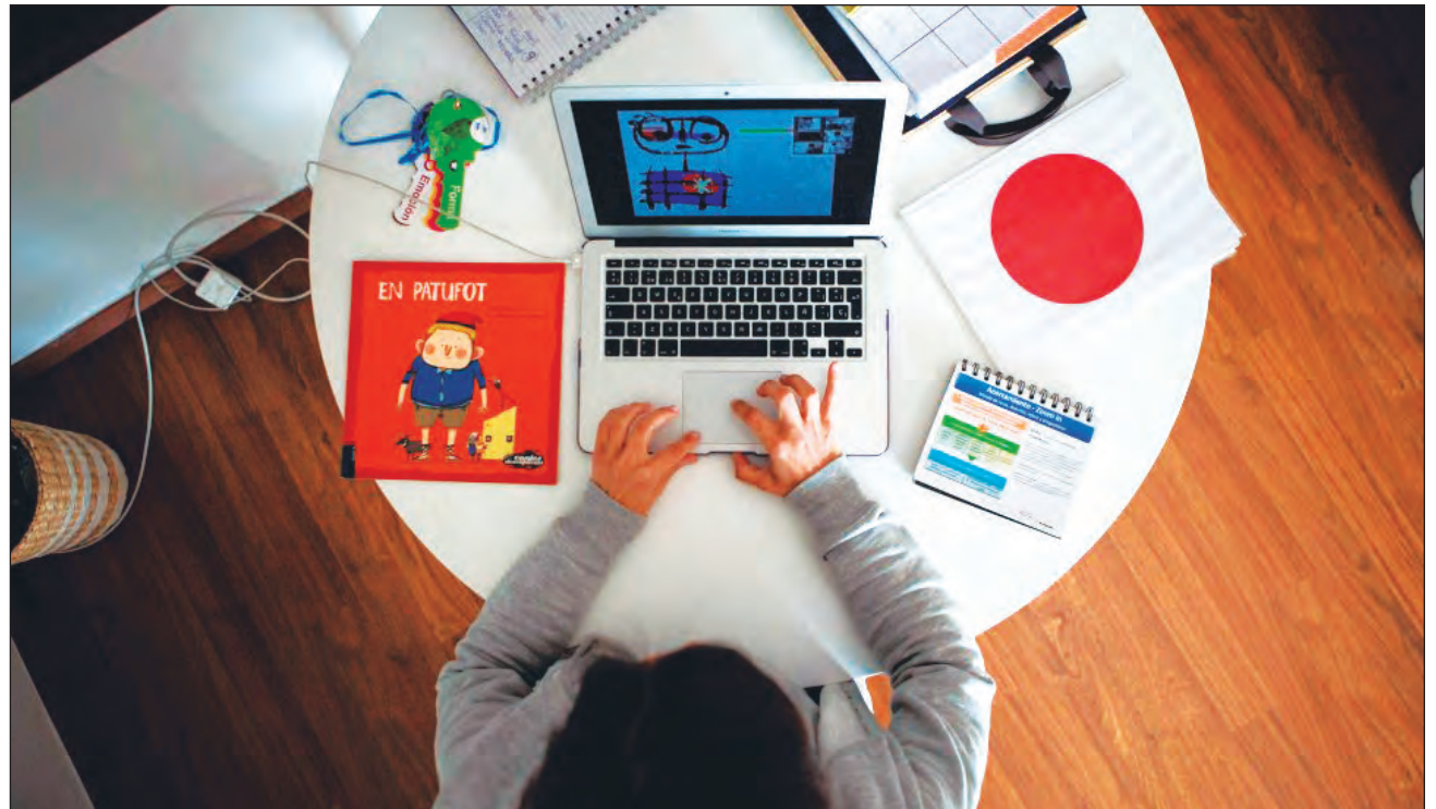
▲ El papel de los docentes será reforzar las clases por medio de cualquier herramienta de Google, WhatsApp, Facebook, entre otras aplicaciones.

Detalló que a partir de ahí y dependiendo de las características del grupo, así como su ritmo y estilo de aprendizaje, “los docentes podremos reforzar las clases que se van a dar con ciertas actividades, por medio de cualquier herramienta de Google, WhatsApp, Facebook, etcétera, para tener contacto con los niños y poder evaluarlos, pero la planeación estará basada en Aprende