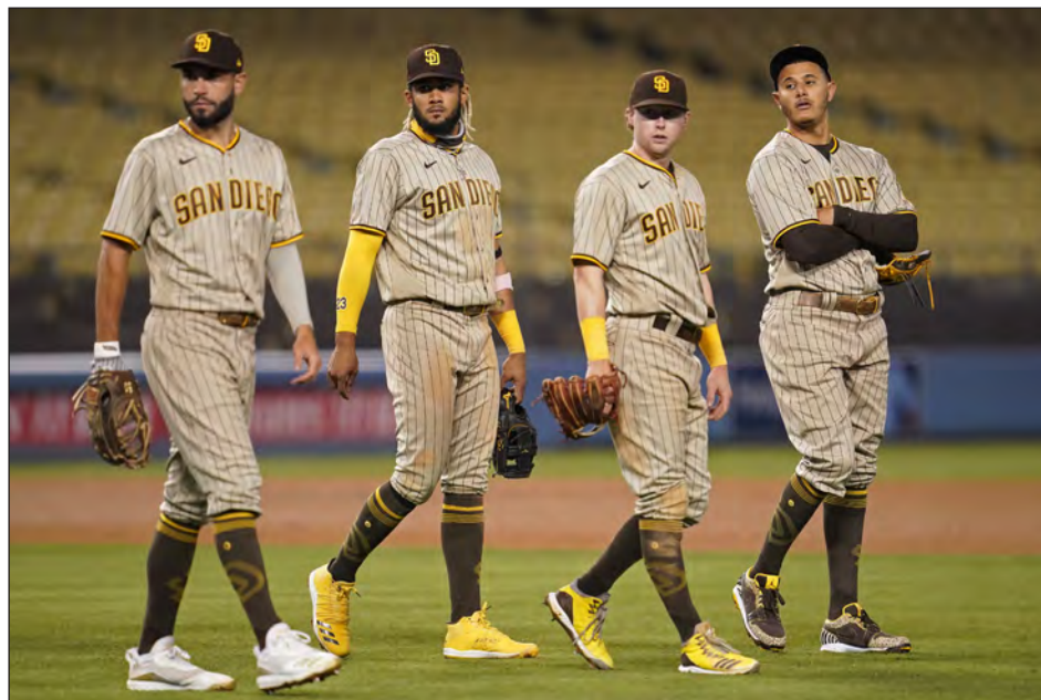
▲ Los Padres hacen vibrar al beisbol con su bateo de largo metraje y "grand slams".

Los Medias Blancas, con su "armada cubana", no se quedan atrás. Son un show explosivo. Dispararon 27 bambinazos en siete días y el antillano José Abreu se