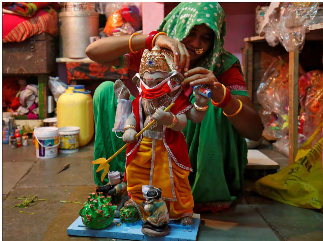
▲ La fiesta del dios elefante es una de las celebraciones religiosas más importantes de la India y cada año congrega a miles de fieles en las playas del país.

Las autoridades de Nueva Delhi decidieron directamente que ninguna efigie de Ganesh sea mostrada en público, mientras que Bombay, muy afectada por la epi-