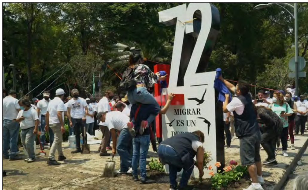
▲ Frente a la embajada de EU en la capital mexicana, familiares de las víctimas y activistas sociales levantaron un antimonumento para rendir homenaje a los victimados en San Fernando y a migrantes muertos en otros episodios violentos.

Diez años se cumplen de la masacre que, aun en un escenario de desahogada violencia cotidiana, se significó por el brutal saldo de víctimas que dejó en el municipio de San Fernando, Tamaulipas: 72 migrantes (58 hombres y 14 mujeres) asesinados a balazos, cuando se dirigían a la frontera con Estados Unidos, a unos 150 kilómetros de distancia, con el propósito de cumplir el quimérico sueño americano. Posteriormente se comprobaría que el número de personas ejecutadas en el lugar y sus intermediaciones era mucho mayor, pero la atrocidad y magnitud del homicidio colectivo llevado a cabo entre el 22 y el 23 de agosto de 2010 por el grupo delictivo de Los Zetas convirtió la matanza en un trágico símbolo de injusticia e impunidad.