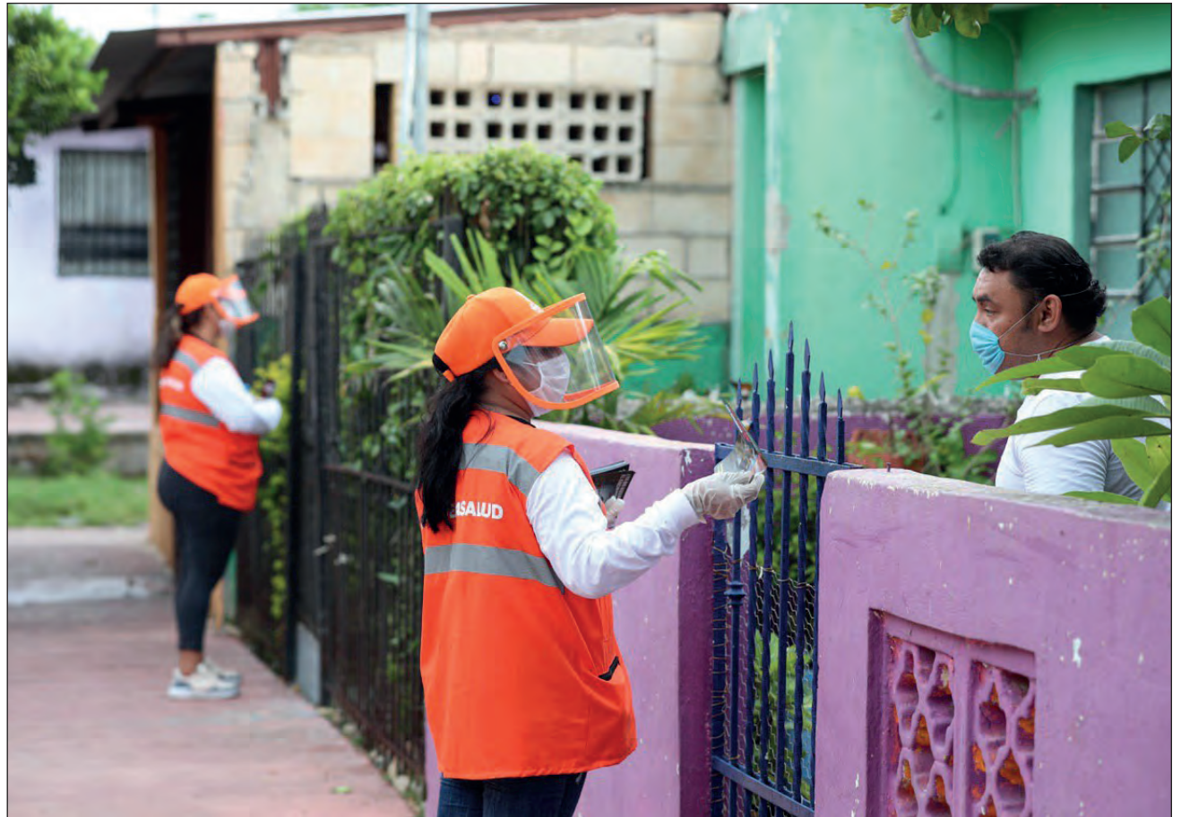
▲ Las brigadas de "Amigos de la Salud Casa por Casa" ya visitaron 41 colonias de Mérida y 75 municipios del interior de Yucatán, proporcionando información de las medidas de higiene a seguir para evitar contagios.

El gobernador Mauricio Vila Dosal impulsó el Programa Estatal de Reforzamiento a la Protección de la Salud, que vino a sumarse al combate de la pandemia a través del esquema "Amigos de la salud Casa por Casa", la instalación de módulos itinerantes para la toma de muestras y la detección oportuna de coronavirus, así como la implementación de un sistema de rastreo oportuno vía mensajes SMS y llamadas telefónicas para la detección de posibles infectados.