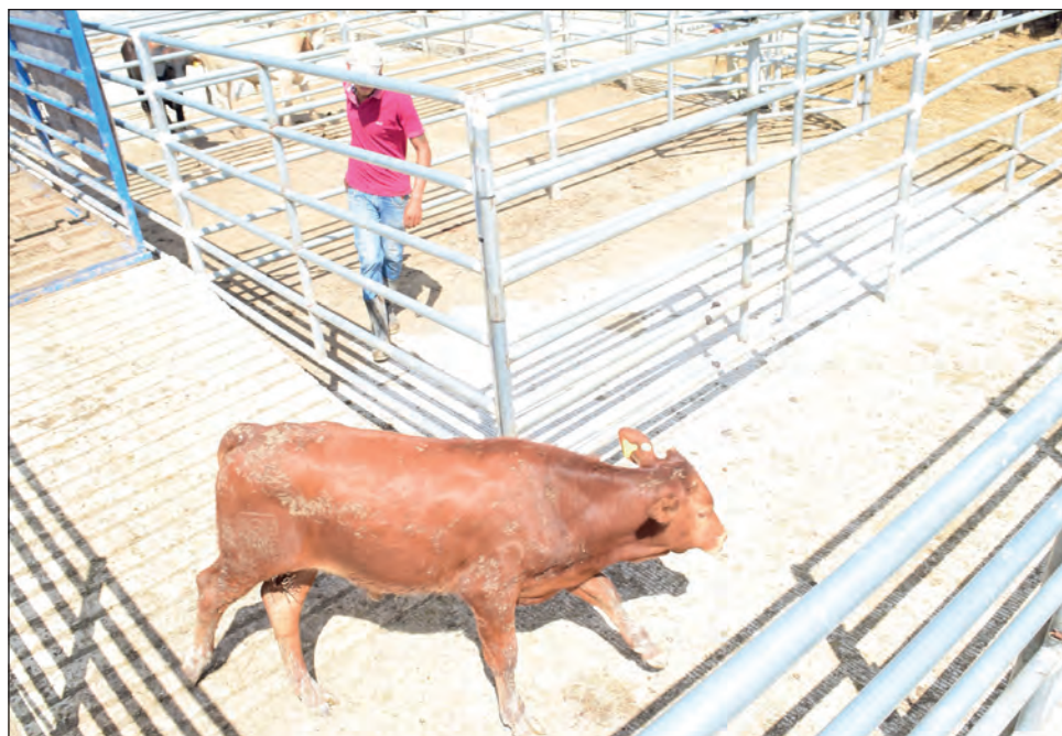
▲ Ante la caída de la demanda, algunos productores aprovechan las redes sociales para vender o intercambiar ganado.

Puntualizó que no había demanda porque la gente no estaba consumiendo. “Ahora que se están abriendo ciertos estados las zonas turísticas y