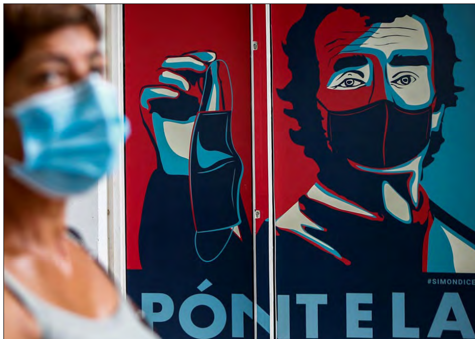
▲ Durante el fin de semana, más de la mitad de las muertes por COVID-19 en el planeta se registraron en cuatro países: Estados Unidos, Brasil, México e India.

Incluso Corea del Sur, que fue considerado un ejemplo en la lucha contra la pande-