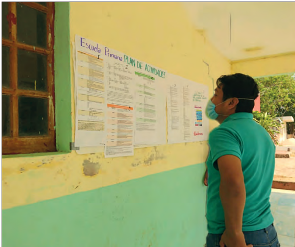
▲ Con cuadernillos, cartas personales a los alumnos y apoyándose en las mamás que tienen teléfono celular, los maestros lidian con la falta de recursos de las comunidades escolares.

El maestro Gilberto reconoció el esfuerzo de todos