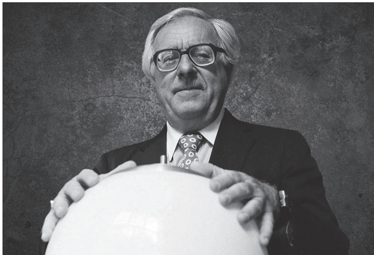
▲ Aunque Bradbury escribió hace varias décadas, vaticinó los viajes a Marte, las televisiones planas, la gente caminando con audífonos todo el tiempo en una enajenación absoluta.

En este caso, la frase de la novela Fahrenheit 451 "se presta mucho para lo que estamos viviendo al decir: 'cuando lleguemos a la ciudad'. Todos queremos salir de este encierro en el que nos tiene el enemigo invisible. Todos queremos gozar de la ciudad que hemos merecido, que hemos cons-