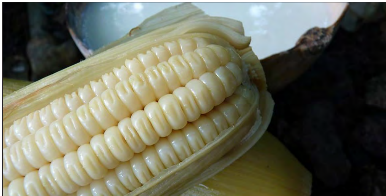
▲ El maíz nunca debe dejarse caer en el suelo ni tampoco pasarle por encima.

El cuento de Dzul Estrella relata que en medio de un