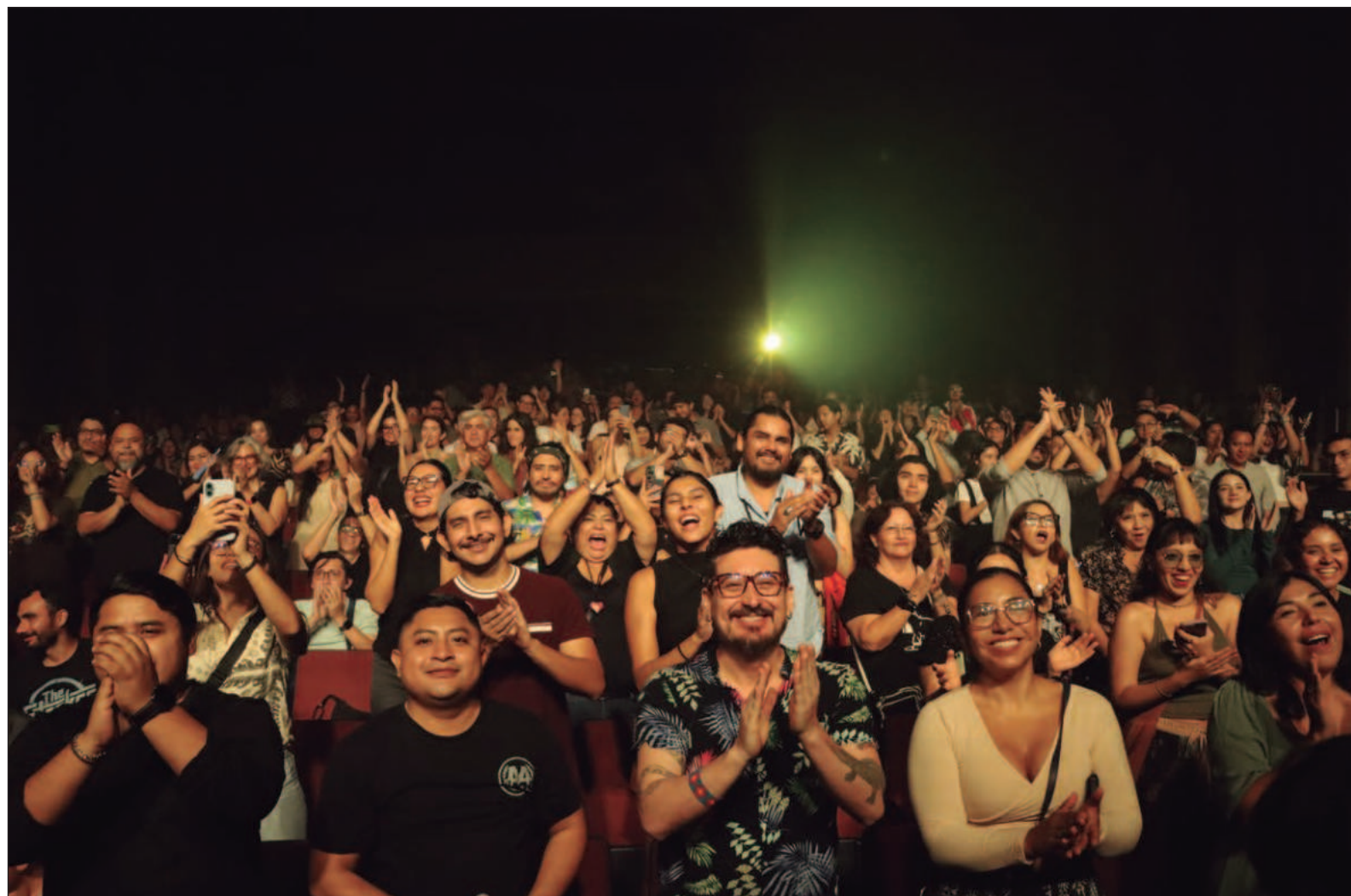
▲ “Es notable la sensibilización al interior de la Sedeculta (...) Hemos visto con asombro cómo el actual gobierno ha roto la inercia e invierte convencido de su capacidad transformadora y ajustándose al presupuesto existente se construyen puentes culturales con la sociedad de los nuevos tiempos”.