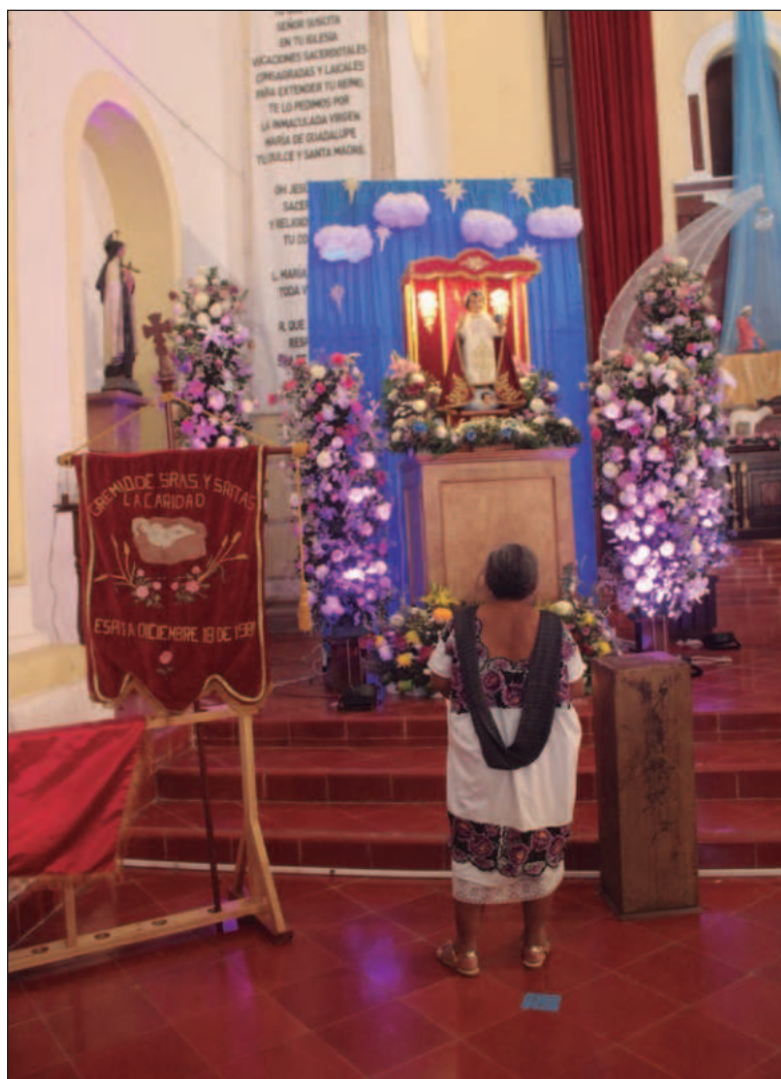
▲ “La escultura festejada es una representación del Niño Jesús de Praga, advocación célebre en Europa que posteriormente obtuvo el título local de Niño Dios de Espita que se considera un símbolo de la infancia y la inocencia”.

La escultura festejada es una representación del Niño Jesús de Praga, advocación célebre en Europa que posteriormente obtuvo el título local de Niño Dios de Espita que se considera un símbolo de la infancia y la inocencia. La imagen tiene una rica historia que se remonta muy probablemente a finales del siglo XVIII, cuando fue traída a la iglesia de San José de Espita. Es hasta el siglo XIX que las clases acomodadas adoptaron al Niño como objeto de gran devoción por su fama de milagroso. Desde entonces se venera como símbolo de protección en momentos de necesidad. Durante la Guerra Social Maya de 1847, las celebraciones fueron puestas en pausa, pero fueron retomadas