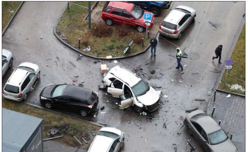
▲ Desde el inicio de la ofensiva rusa contra Ucrania en febrero de 2022, Kiev ha sido acusado reiteradamente de ser responsable de ataques contra personalidades y mandos militares.

El negociador ucraniano Rustem Umerov y el emisa-