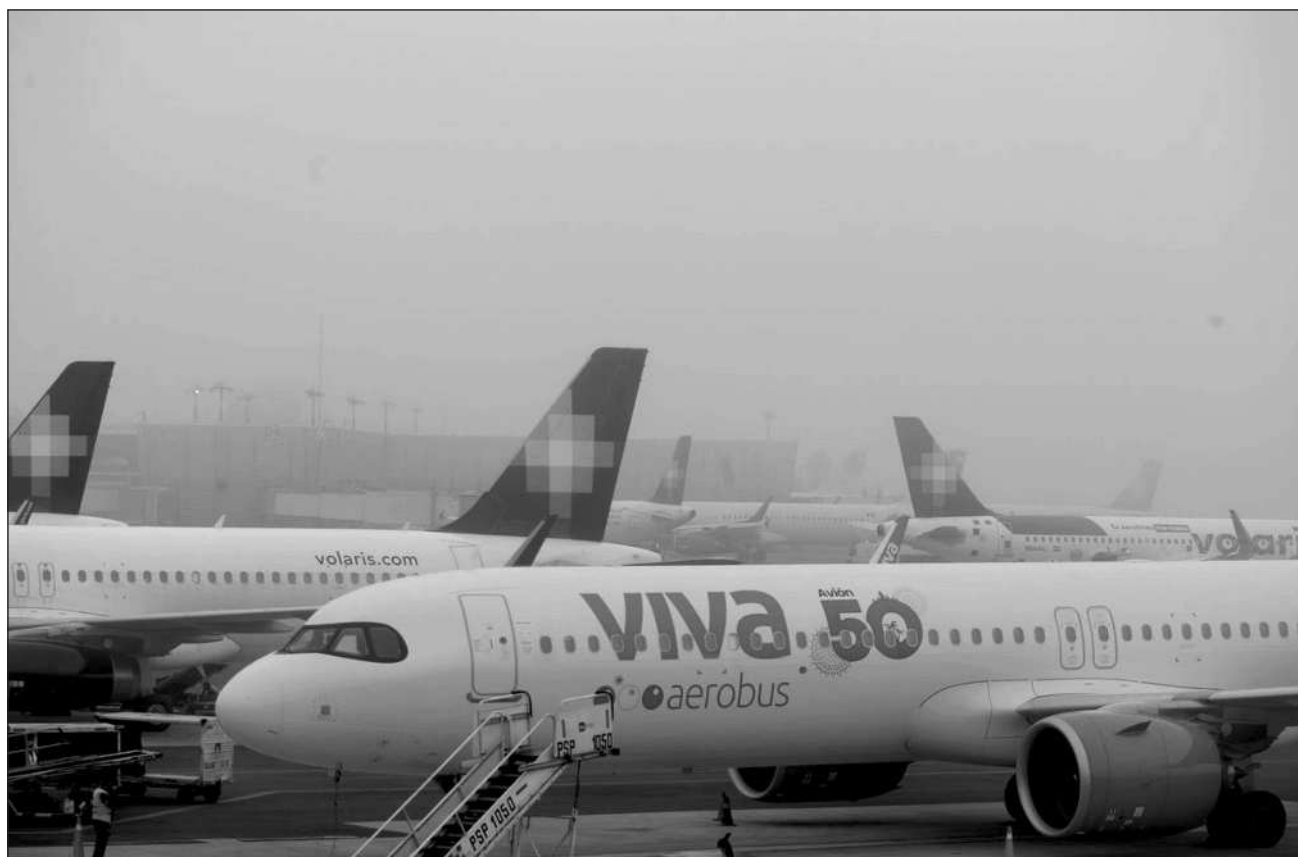
▲ Sheinbaum señaló que tendrá que darse análisis en la Comisión Nacional Antimonopolios, a fin de verificar que la alianza esté en el marco de la ley. “Lo que quieren es no solamente agruparse, aunque mantienen las dos marcas, sino invertir, comprar más aviones”.

“Es una inversión importante para ampliar la capacidad de las aerolíneas mexicanas en nuestro mercado y