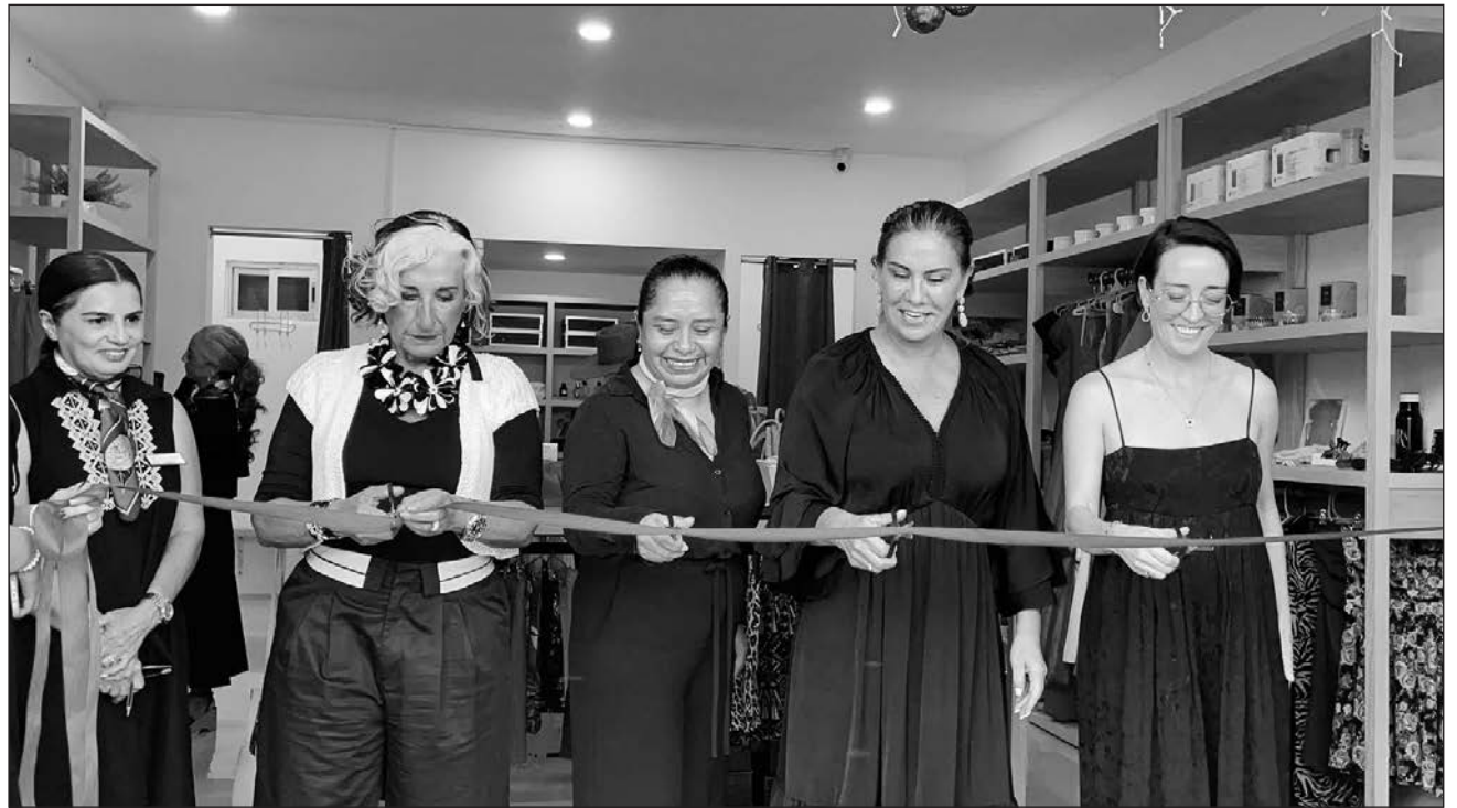
▲ La tienda de Playa , ubicada en el centro de la ciudad, estará abierta de 10 a 18 horas de lunes a viernes.

La tienda de Playa del Carmen está ubicada en la avenida 20 entre calles 12 Bis y 14 Bis, en el centro de la ciudad. Estará abierta de 10 a 18 horas de lunes a viernes. Allí podrán encontrar ropa de segunda mano y nueva, accesorios, regalos,