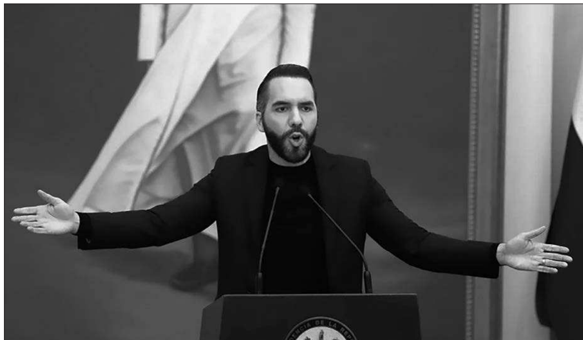
▲ “El discurso autoritario, elitista y desdeñoso con los sectores marginados ya no es privativo de Nayib Bukele en El Salvador, quien gobierna bajo un régimen de excepción, prorrogado al menos 34 veces, por el cual más de 100 mil personas han sido detenidas muchas sin cargos claros ni acceso a defensa legal, torturas, muertes bajo custodia y desapariciones forzadas”.

Es la derecha xenofóbica y autoritaria de los Le Pen, Vox y Georgia Meloni con su grupo Hermanos de Italia que ahora invade América Latina. Hoy triunfan la derecha arcaica y la ultraderecha neofascista de un país a otro, en un