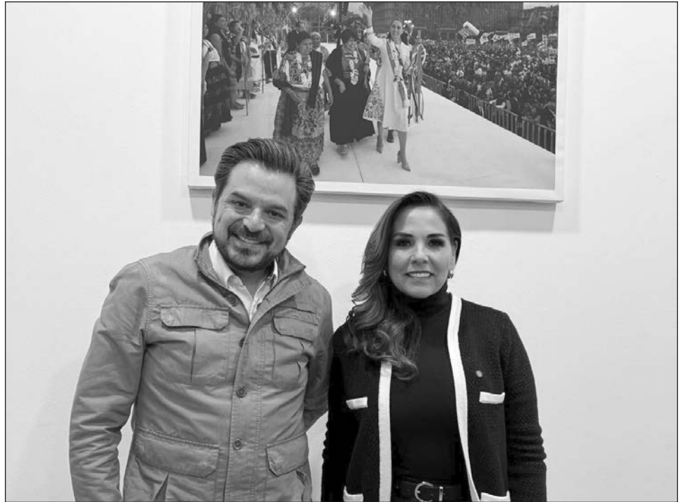
▲ La mandataria estatal se reunió con el director general del IMSS, Zoé Robledo, quien señaló que el Centro de Diagnóstico y Tratamiento Ambulatorio forma parte de un plan integral de expansión de los servicios de salud en la entidad.

El titular del IMSS señaló que este proyecto forma parte de un plan integral de expansión de los servicios de salud en Quintana Roo, que contempla