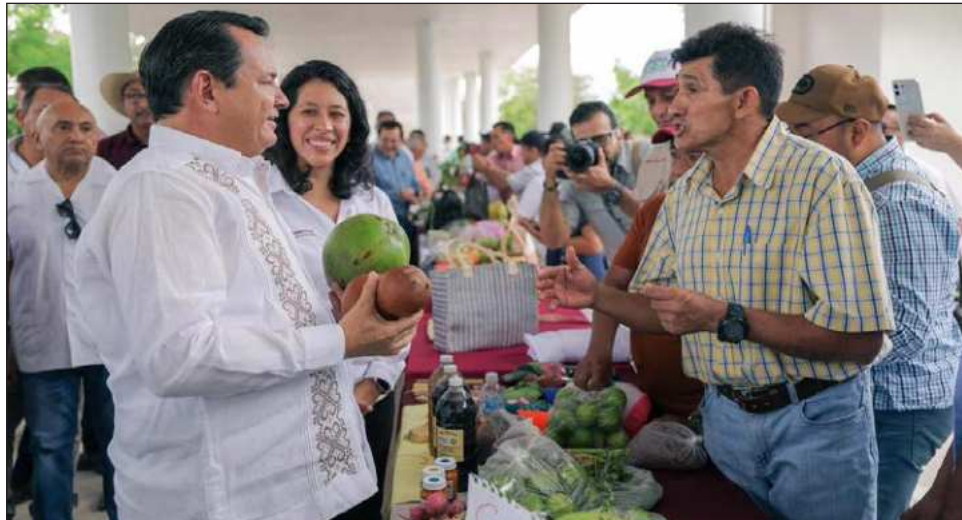
▲ Durante la inauguración, el gobernador Joaquín Díaz Mena destacó que esta iniciativa de traer a los productores a la capital del estado es una forma de impulsar el consumo de productos frescos y de recordar la importancia que tienen los campesinos para el Renacimiento Maya.

Durante su discurso, el mandatario destacó que esta iniciativa forma parte de las estrategias Sembrando Vida y Huertos de Traspatio, y señaló que su administración ha incrementado los recursos destinados al campo yucateco para impulsar nuevas cosechas, instalar sistemas de riego con paneles solares y asegurar que el trabajo de las y los productores se traduzca en una retribución justa que llegue directamente a sus familias.