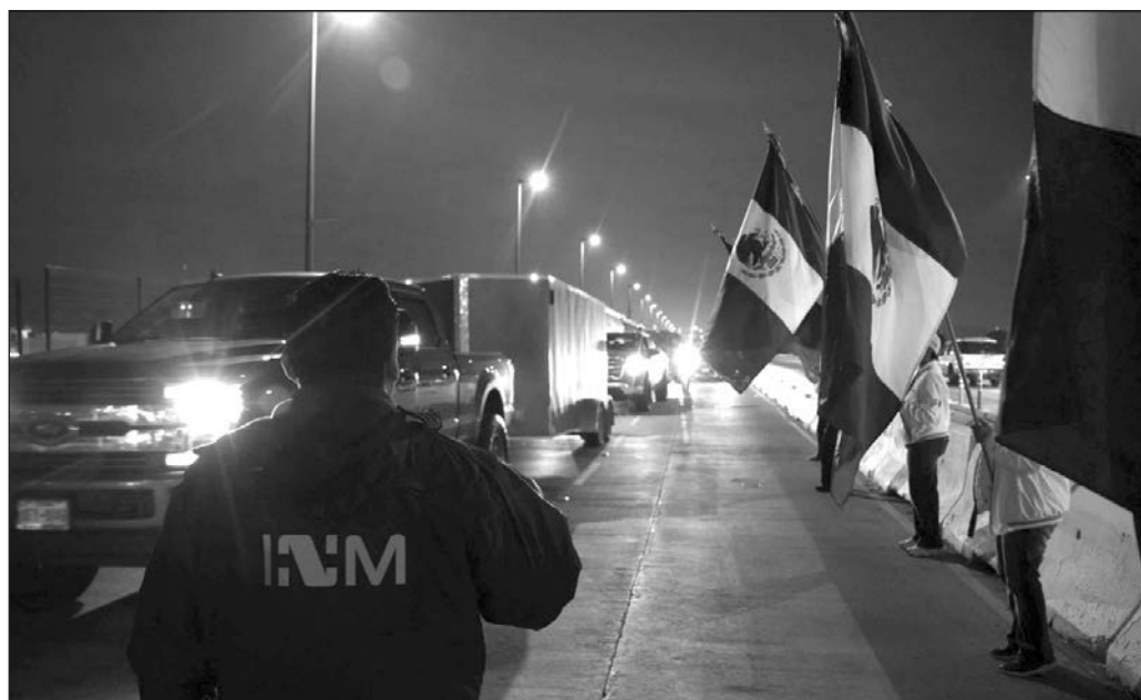
▲ Cabe entonces preguntar hacia quién es la lealtad de los agentes del Instituto Nacional de Migración, cuando actos como el que fue exhibido son contrarios a las órdenes de la Presidenta.

Reprobar institucionalmente los abusos contra migrantes extranjeros o connacionales que regresan es una obligación de las autoridades, y se ha procedido correctamente al interponer la denuncia puntual ante la Fiscalía General de la República (FGR). Sin embargo, en la declaración del titular del INM hay algo más por destacar: en el combate a los abusos y la corrupción está comprometida la investidura presidencial. Es una de las principales banderas de la Cuarta Transformación y por eso mismo debe buscarse la no repetición de los hechos. Esto quiere decir que la averiguación debe llegar a los funcionarios que han tolerado, permitido, favorecido o promovido la extorsión a los héroes y heroínas que regresan a México.