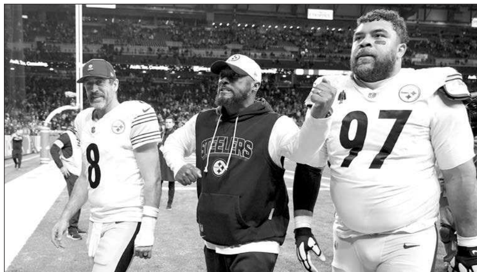
▲ Mike Tomlin, entrenador de los Acereros de Pittsburgh, con el quarterback Aaron Rodgers (izquierda) y Cameron Heyward, tras un triunfo frente a los Leones en Detroit el domingo.

Los equipos de la NFL de hoy no tienen ese lujo. Y aunque los Acereros han tenido su propia cuota de ju-