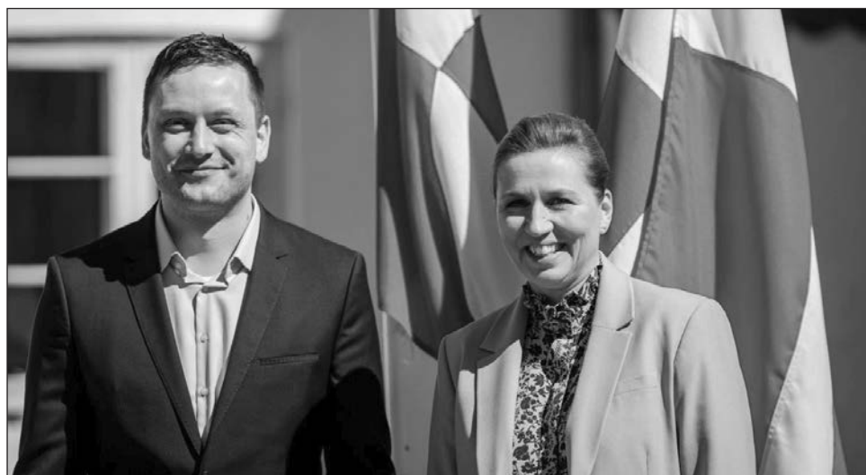
▲ El primer ministro de Groenlandia, Jens-Frederik Nielsen, y la primera ministra danesa, Mette Frederiksen, emitieron una declaración conjunta en la que recordaron que “las fronteras nacionales y la soberanía de los Estados se basan en el derecho internacional”.

El ministro de Relaciones Exteriores danés, Lars Løkke Rasmussen, se mostró el lunes “profundamente indignado” por el nombramiento. Dinamarca es parte de la Unión Europea y de