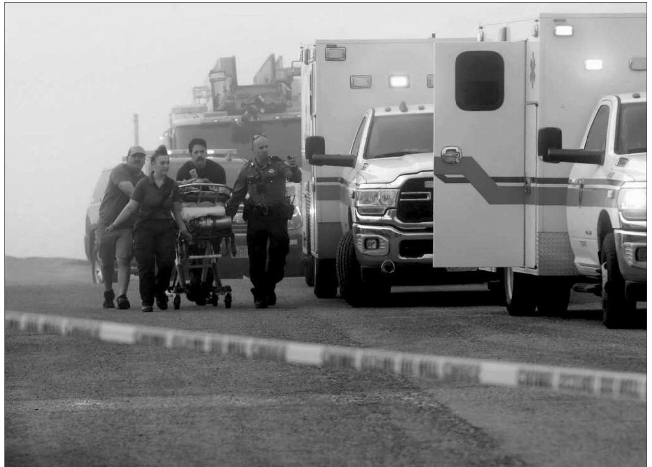
▲ Se informó que los protocolos de búsqueda y rescate fueron activados de inmediato, en coordinación con la Guardia Costera de los EU.

Se informó que los protocolos de búsqueda y rescate fueron activados de inmediato, en coordinación con la Guardia Costera de los Estados Unidos. La Marina también adelantó que