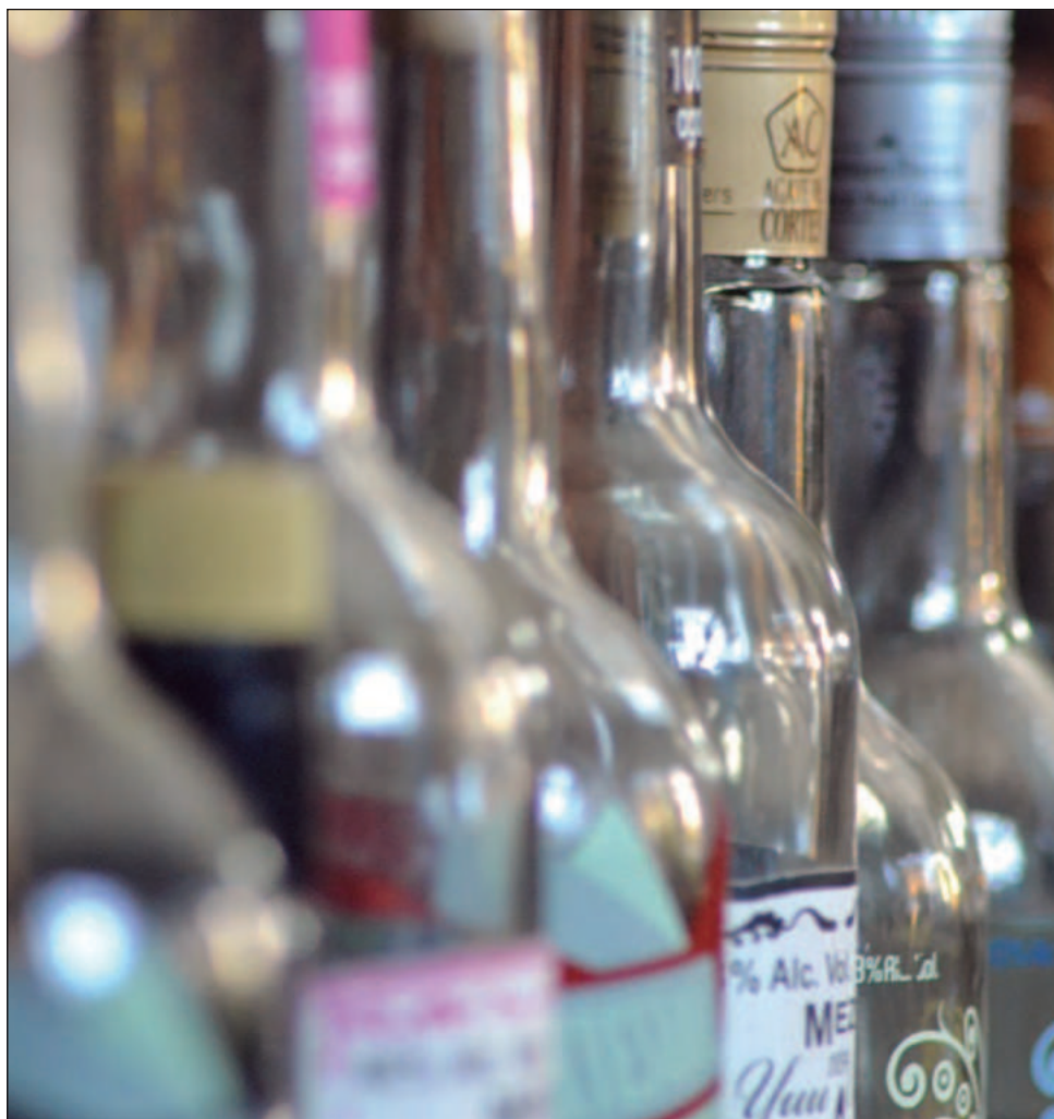
▲ Las etiquetas presentan la serie y folio por medio de un código QR, el cual permite conocer los detalles de producción, procedencia y sus fabricantes de manera inmediata.

Los marbetes tienen el objetivo de certificar el origen y legalidad del producto