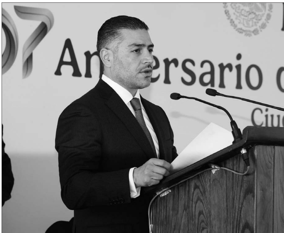
▲ “La publicación inglesa asegura que García Harfuch ‘es una de las pocas figuras públicas mexicanas con competencia técnica e influencia. Su presencia serena e imagen pública le otorgan una credibilidad excepcional’”.

X: @julioastillero Facebook: Julio Astillero juliohdz@jornada.com.mx