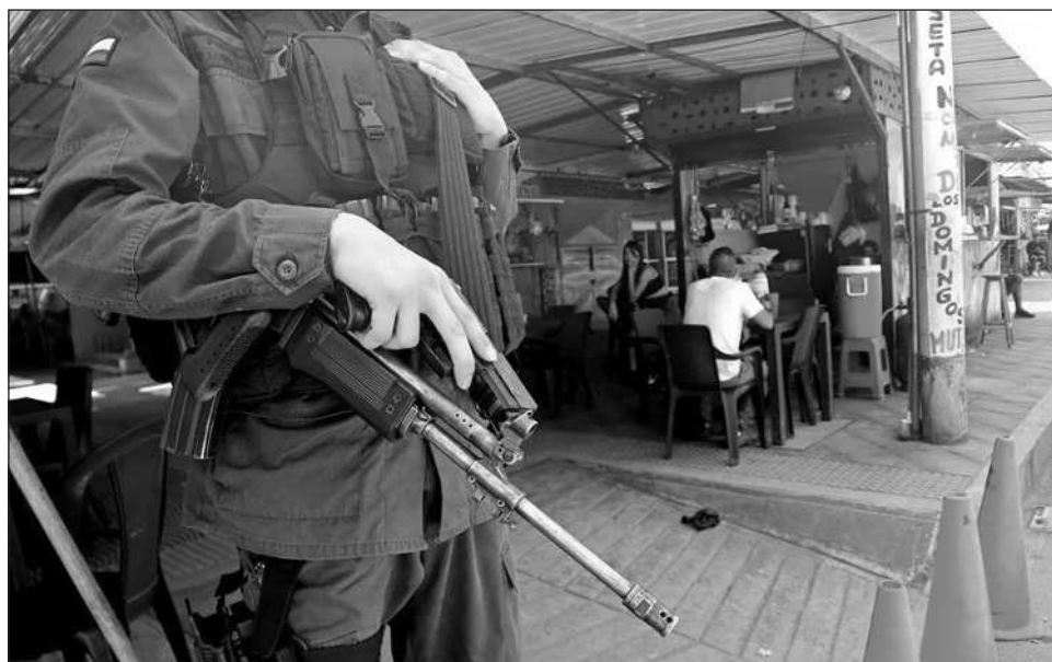
▲ Las detenciones de militares y policías son comunes en Colombia en zonas controladas por grupos armados y participan pobladores manipulados por las organizaciones ilegales.

Autoridades sostienen que en estas retenciones participan pobladores, en su mayoría campesinos, que actúan manipulados u obligados por las organizaciones ilegales que operan en la zona.