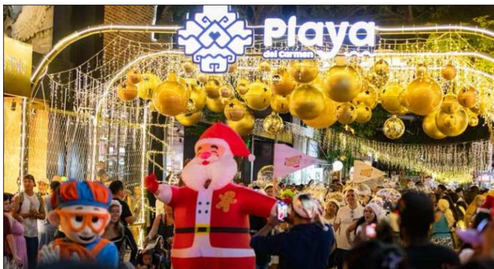
▲ Niñeces y adultos convivieron con personajes navideños, disfrutaron de diversos espectáculos y aprovecharon atractivos como la pista de hielo más grande del estado.