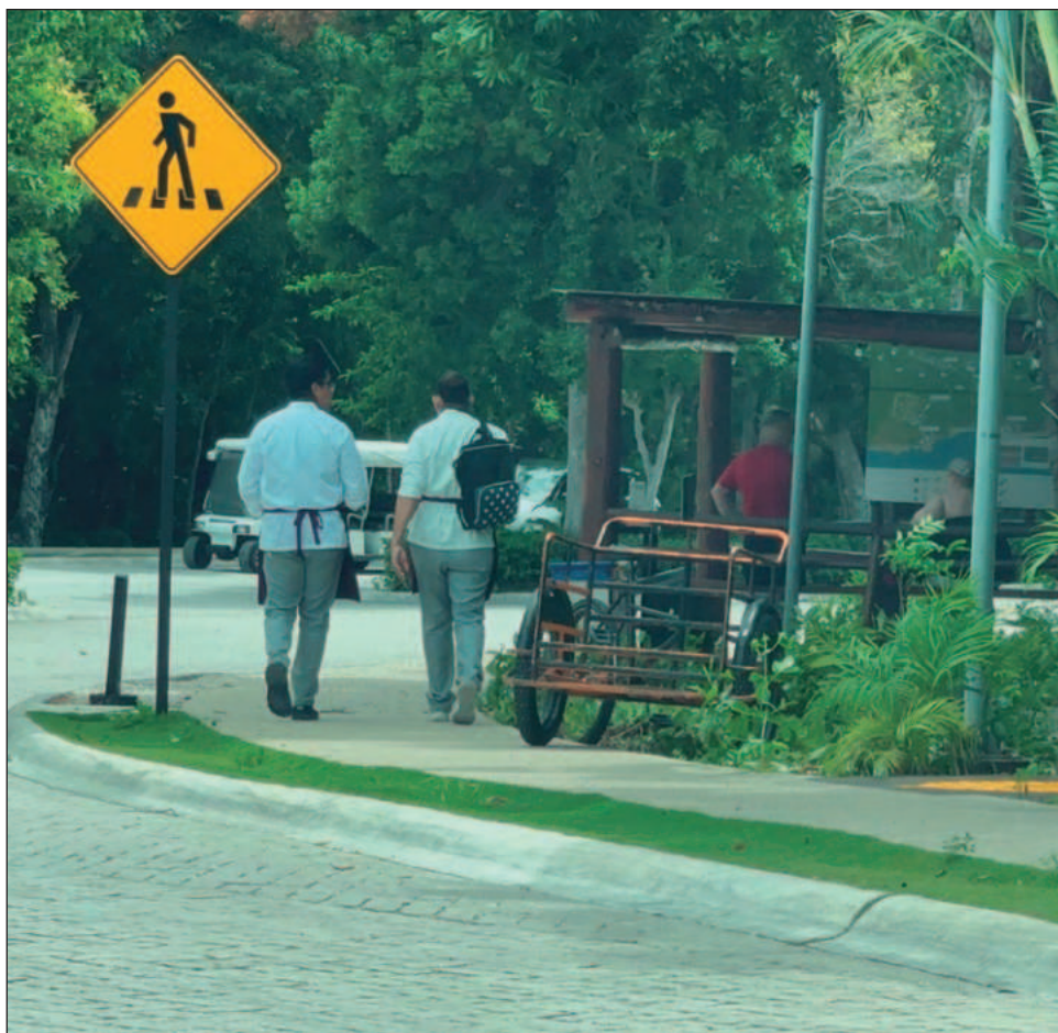
▲ Algunos centros de hospedaje operaban con un déficit de entre 15 y 20 por ciento en su plantilla; actualmente algunos continúan trabajando con 5 por ciento menos.

Refirió que esta recuperación en la cobertura de plazas laborales se debe a muchas cuestiones, pero en especial a las campañas de reclutamiento que se hicieron en las comunidades de la zona maya.