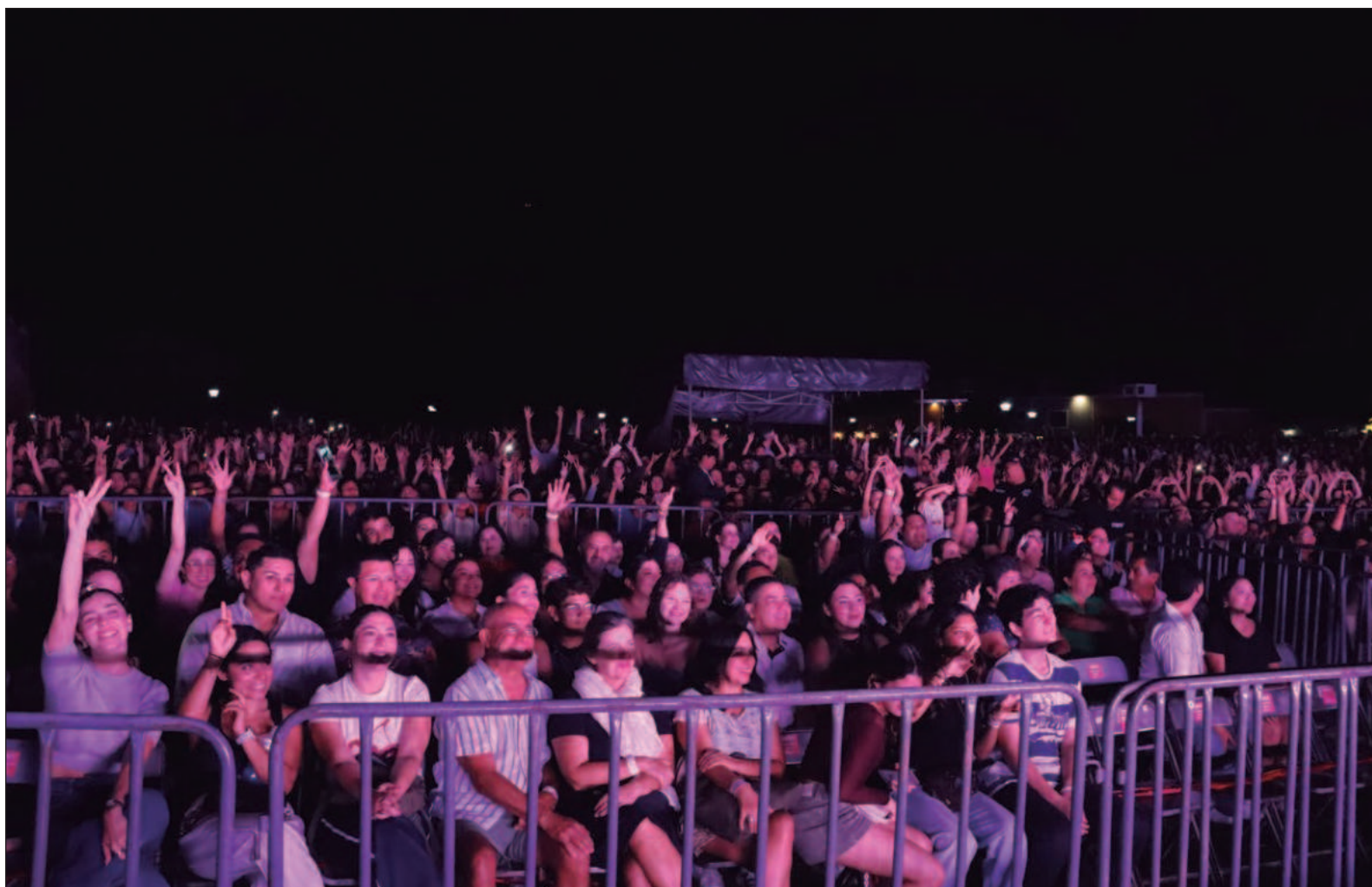
▲ “Sedeculta abrió sus puertas a expresiones contemporáneas, artistas visuales, a la música independiente local, olvidados por administraciones anteriores; son artistas, promotoras, managers, productores, técnicos, quienes desde hace tiempo lucharon por tener un espacio en la escena nacional”.

algunos medios de Yucatán nadan sincronizadamente contra lo que ocurre en el ámbito local y nacional, analizando y emitiendo juicios desde el hígado y no con los datos duros.