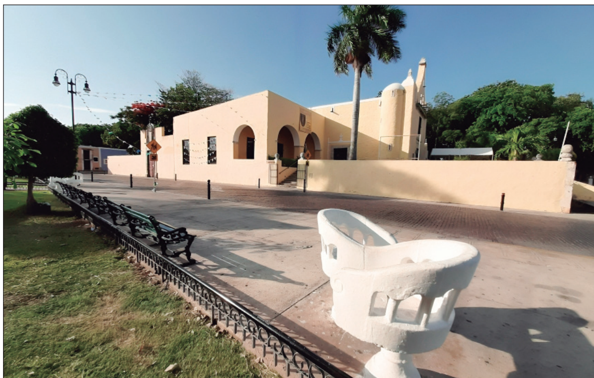
▲ “La conservación y protección de este patrimonio dependen tanto de la participación de sus habitantes como del trabajo que, desde hace 35 años, realiza de manera constante la Junta Interna de Monumentos Históricos del Centro INAH Yucatán”. En la fotografía, Ermita de Santa Isabel.

EN MÉRIDA, EL área de protección histórica toma forma con la Zona de Monumentos Históricos establecida desde 1982 con una extensión de 659 manzanas donde coexisten componentes urbanos y arquitectónicos resultantes de los conceptos culturales que los motivaron, así como materiales y sistemas constructivos vigentes en cada etapa. Sin embargo, las edificaciones históricas y los conjuntos urbanos que estas conforman deben integrarse a las actividades contemporáneas. Para ello, en Mérida es fundamental el trabajo que desde 1990 realiza en el INAH la Junta Interna de Monumentos Históricos, un cuerpo colegiado integrado por arquitectos peritos que revisan, valoran y dictaminan los proyectos propuestos para la Zona de Monumentos Históricos,