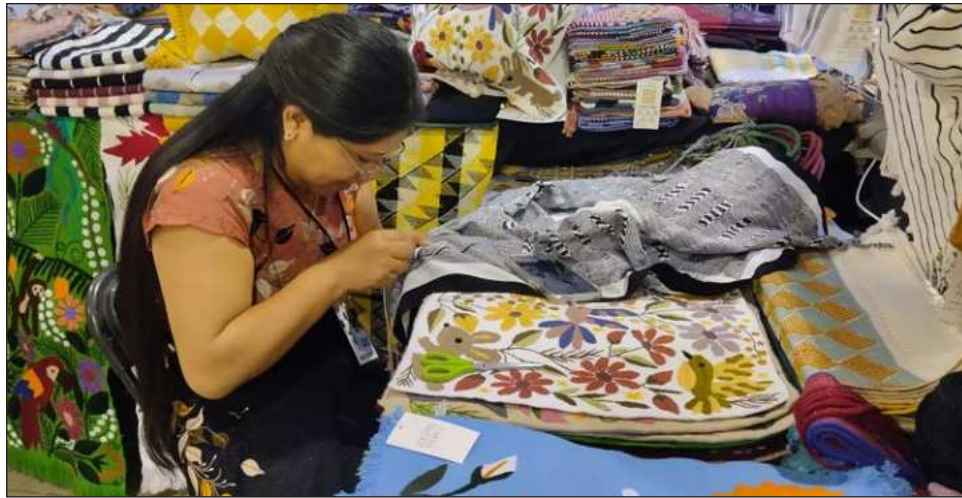
▲ De acuerdo con el Instituto Mexicano para la Competitividad, en el país hay 29 millones de mujeres que están fuera de la economía remunerada y su participación económica es un motor para el crecimiento y la competitividad de México.

El organismo publicó la cuarta edición de dicho reporte, herramienta que mide la capacidad de las 32 entidades federativas para atraer y retener el talento de las mujeres a través de 16 indicadores agrupados en tres pilares: entrada, permanencia y autonomía económica.