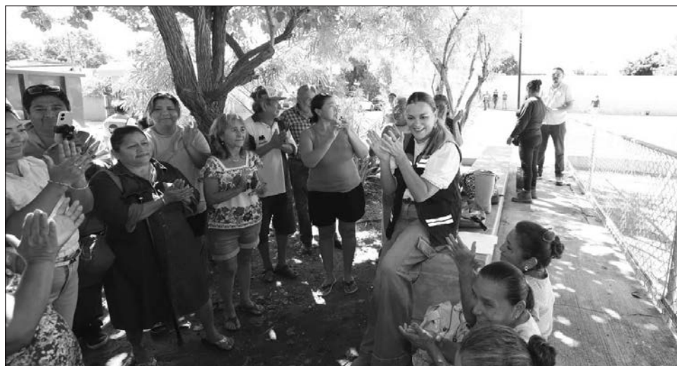
▲ “Desde luego que el ayuntamiento tiene la política pública que marca la línea de acción, pero las y los ciudadanos tenemos que contribuir a que Mérida chula esté limpia”, resaltó la presidenta municipal durante la presentación.

Durante su reunión semanal con representantes de los medios de comunicación, la alcaldesa destacó que, a través de la estrategia Mérida Limpia ¡Es tuya, cuidala! , se fortaleció la gestión de residuos sólidos en la ciudad y sus comisarias, con 12 Mega Operativos de Limpieza realizados en distintos puntos del norte, sur, oriente y poniente, además de