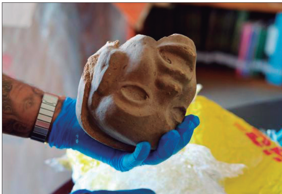
▲ Uno de los ejes más visibles fue la recuperación de piezas arqueológicas. En este mes, la SRE formalizó la entrega al INAH de 52 objetos devueltos voluntariamente por particulares en Estados Unidos, un lote que se sumó a más de 2 mil bienes recuperados.

La repatriación se gestionó mediante la embajada de México en Estados Unidos y de los consulados en Nueva York, Sacramento y San Francisco.