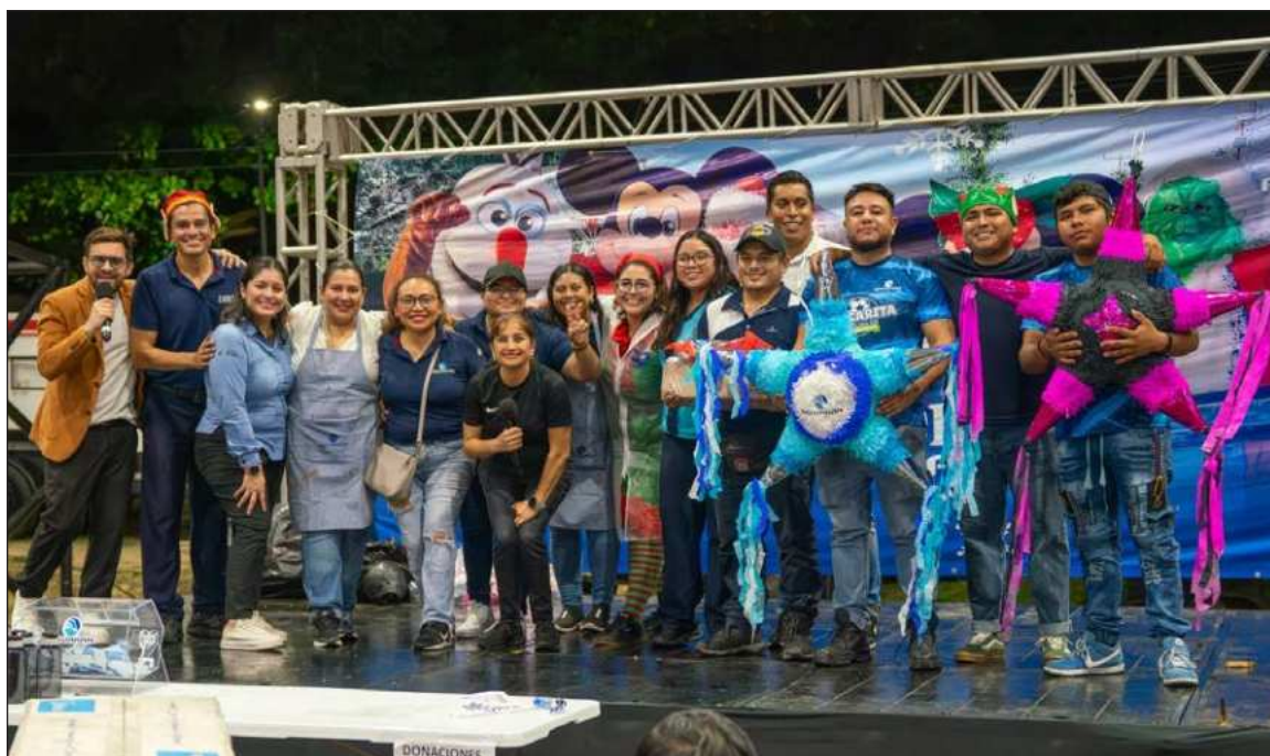
▲ Las familias disfrutaron de un show musical navideño con animación, participaron en talleres creativos como escritura de cartas a Santa Claus, pintura de alcancías, elaboración de manualidades, así como de juegos infables.

La jornada culminó con la Gran Rifa Navideña, con la que los asistentes tuvieron la oportunidad de ganar premios como un aire acondicionado, un scooter, piñatas y juguetes, llevando a casa aún más alegría.