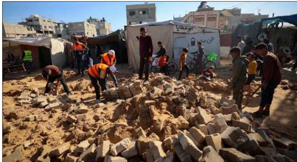
▲ Hamás ha denunciado que "el continuado derrumbe de edificios bombardeados durante la guerra (...) caídos sobre sus habitantes, reflejan el aumento de los riesgos de la situación humanitaria.

Así, ha destacado que desde el inicio de la ofensiva israelí, lanzada en respuesta a los ataques del 7 de octubre de 2023, se han registrado 70 mil 937 muertos --entre