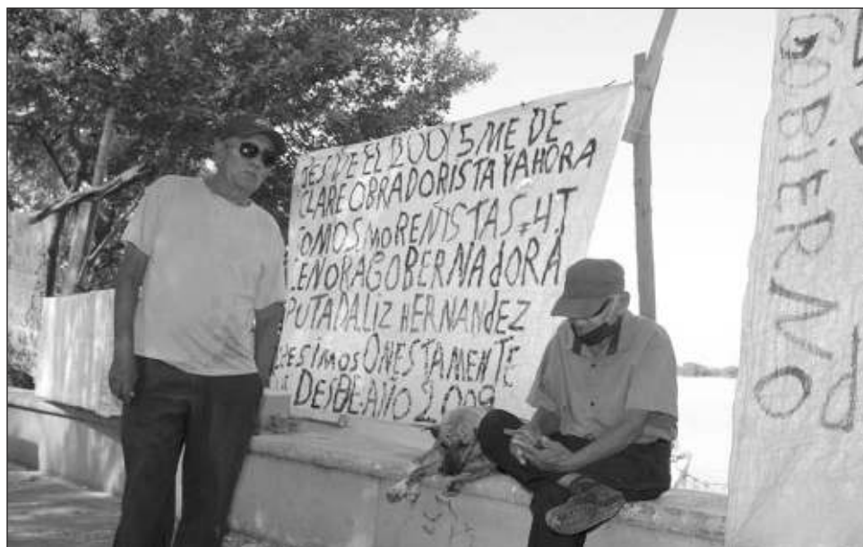
▲ Lech Kay es una de las cooperativas pesqueras más longevas en Campeche. Sus socios se dicen decepcionados del gobierno de la Cuarta Transformación, tanto local como federal.

Una de las cooperativas más longevas en el gremio pesquero de la ciudad volvió a manifestarse decepcionada del gobierno de la Cuarta Transformación, pues asegura votaron en su momento por Andrés Manuel López Obrador, y Layda Sansores San Román para presidente y gobernadora, respectivamente, pero estos no han respon-