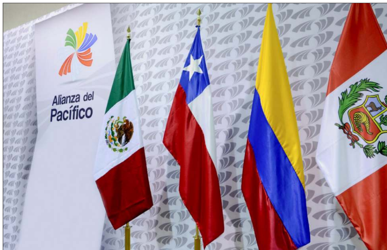
▲ La Alianza del Pacífico es una iniciativa de integración regional conformada por Chile, Colombia, México y Perú. En esta ocasión, el Congreso de Perú no permitió la asistencia del presidente Pedro Castillo a México.

La Alianza del Pacífico es una iniciativa de integración regional conformada por Chile, Colombia, México y Perú. El presidente de Perú, Pedro Castillo, agradeció este martes el apoyo de su homó-