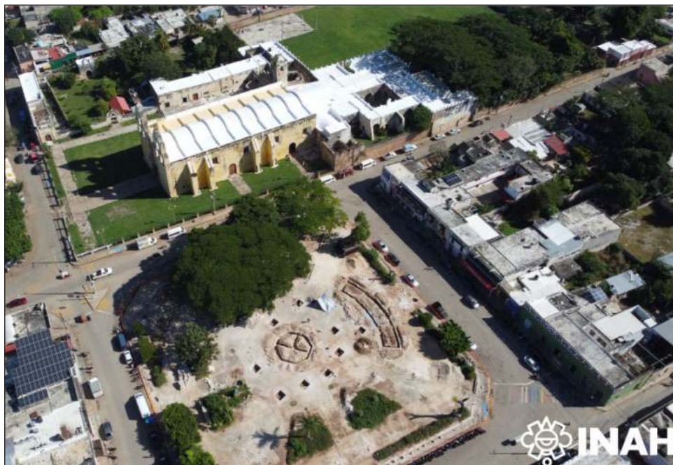
▲ Entre los hallazgos destacan materiales cerámicos, muestras óseas y diversos materiales que ayudan a entrelazar la historia de la ocupación del centro histórico de Oxkutzcab.

Los elementos recuperados serán analizados para entender su dimensión dentro de la cultura de Oxkutzcab.