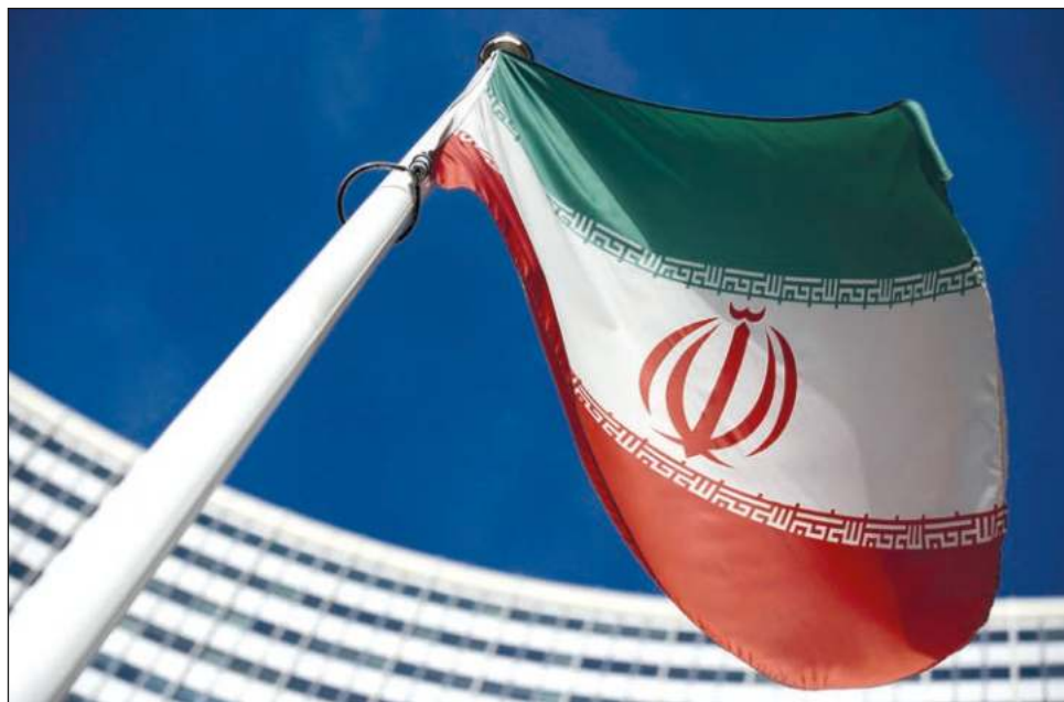
▲ El nivel manejado está muy por encima de la cota de 3.67 por ciento fijada por el acuerdo de 2015 para evitar que Irán se hiciera con un arma atómica. La fabricación de una bomba nuclear requiere un nivel de enriquecimiento de uranio del 90 por ciento.

"Nosotros advertimos que las presiones políti-