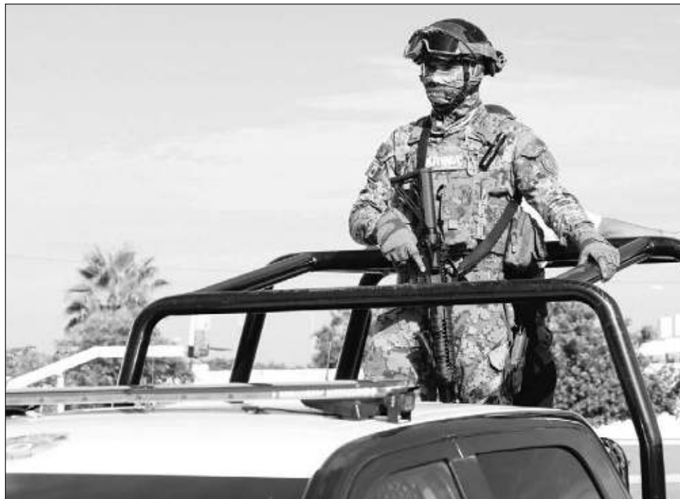
▲ Los 50 elementos navales participarán en coordinación con los tres órdenes de gobierno en operativos de prevención y disuasión de hechos delictivos.