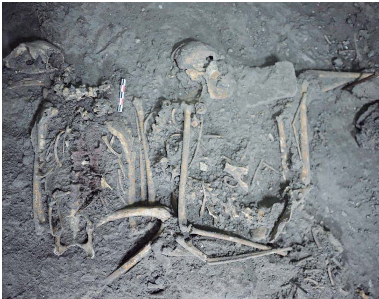
▲ Los restos óseos del mono araña se encontraron junto a un águila real y varias serpientes de cascabel, rodeados de artefactos únicos, como piezas de concha/caracol y objetos de obsidiana.

El descubrimiento fue realizado por Nawa Sugiyama, arqueóloga antropológica de la Universidad de California Riverside, y un equipo de arqueólogos y antropólogos, quienes desde 2015 han estado excavando en el Complejo Plaza de Columnas en Teotihuacán, México. También se descubrieron restos de otros animales, así como miles de fragmentos de murales de estilo maya y más de 14 mil tiestos de cerámica de una gran fiesta. Estas piezas tienen más de mil 700 años.