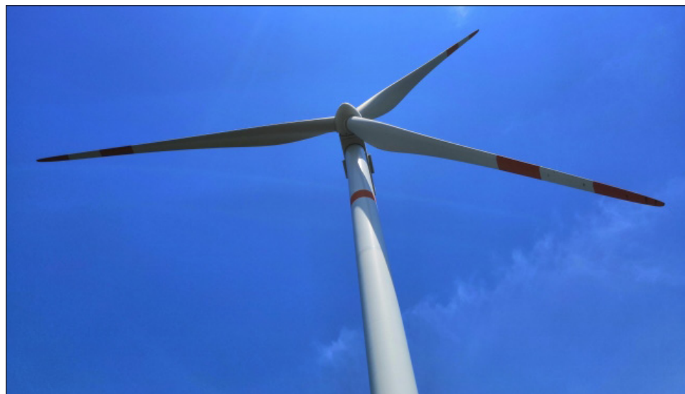
▲ La CRE dio un nuevo revés a la Iberdrola, pues negó la modificación de los permisos otorgados a Dos Arbolitos y Parques Ecológicos de México, dos centrales eólicas de autoabasto en Oaxaca.

La primera de ellas, Eólica Dos Arbolitos, opera con el permiso E/1159/AUT/2014 y se ubica en La