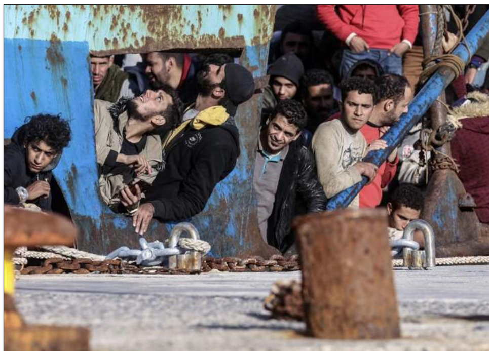
▲ Aunque hasta ahora no se dispone de información oficial sobre la nacionalidad de los rescatados, medios locales señalan que proceden de Siria y Egipto.

El barco, que emitió una señal de socorro el lunes por la noche, fue remolcado por un pesquero hasta el puerto de Paleochora, en el suroeste de Creta.