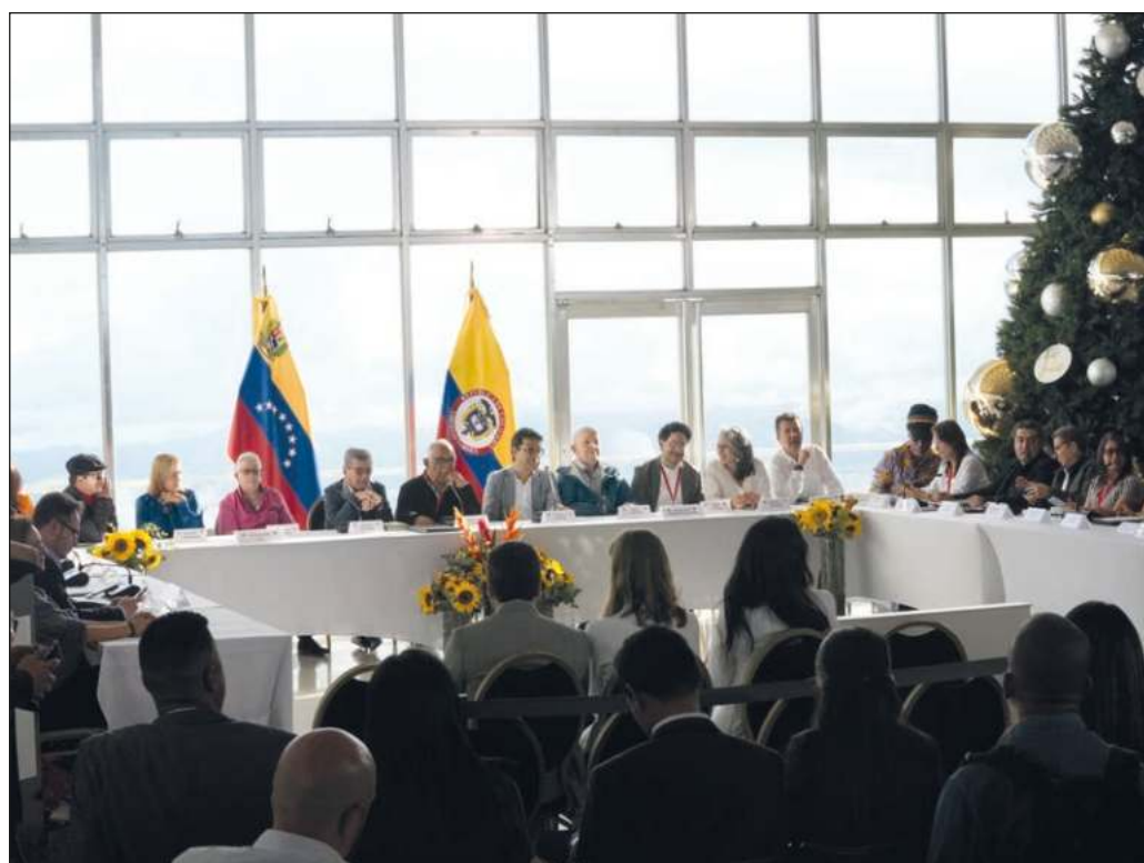
▲ La reactivación de las negociaciones entre el gobierno y la única organización reconocida como una insurgencia propiamente política resulta fundamental para avanzar en la pacificación del país.

Tres décadas después, el reinicio de las pláticas con el ELN es un hecho esperanzador. Cabe esperar que el proceso desemboque en la consecución de una paz que Colombia merece y necesita con urgencia.