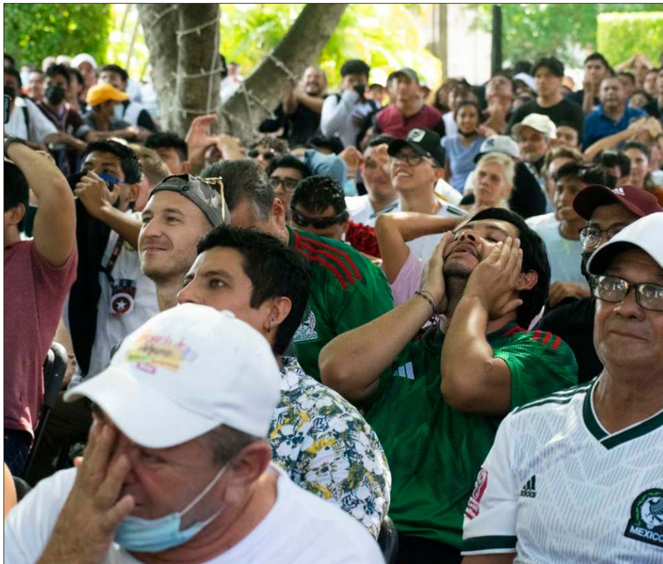
▲ El partido terminó en un empate a cero goles, pero produjo algunas emociones entre el público.

El próximo partido de la selección mexicana será contra Argentina y también se proyectará en ese sitio, el sábado a las 13 horas.