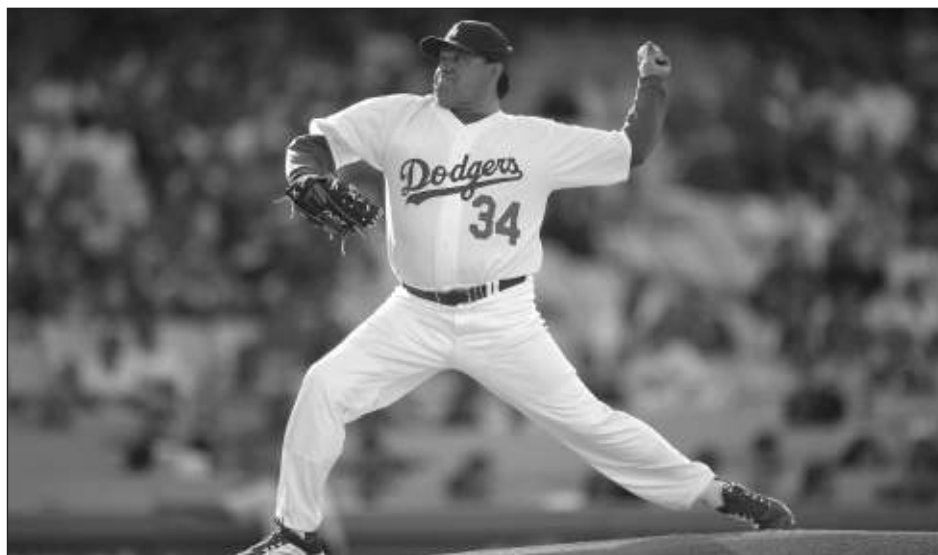
▲ Fernando Valenzuela lanza en un juego de veteranos disputado el 8 de junio de 2013 en Los Ángeles.

Valenzuela había dejado su trabajo como comentarista en la transmisión en español de los Dodgers en septiembre sin dar explicaciones. Se dio a conocer que fue hospitalizado a principios de este mes. Su trabajo lo mantenía como una presencia regular en el Dodger Stadium. Antes de los partidos, solía cenar en el