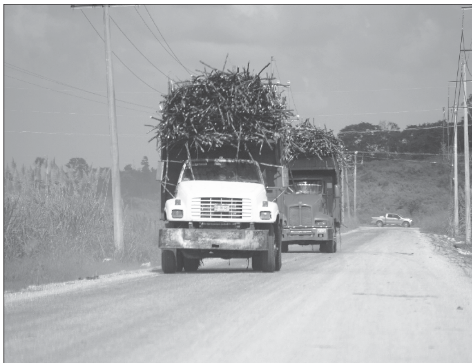
▲ Empresarios se suman al llamado de la gobernadora para atender las vías.

Por su parte, el Consejo Coordinador Empresarial del Carmen y los organismos que lo integran, manifestaron su apoyo a la mandataria estatal, en su posicionamiento ante la presidenta de México, Claudia Sheinbaum Pardo, en "el justo reclamo que por justicia merece el estado de Campeche, solicitando la