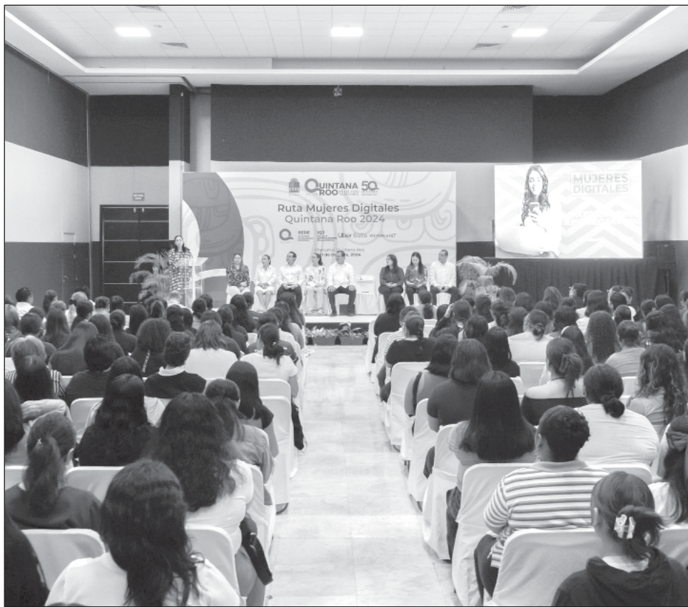
▲ El curso busca empoderar a socias repartidoras, conductoras y restauranteras de Uber, lo que les permita crecer sus emprendimientos.

Prueba de ello es que 91 por ciento de los comercios que se han integrado a la aplicación de Uber Eats han visto un incremento en sus ingresos. Incluso 64 por ciento de estos negocios define a la aplicación como algo crucial para el éxito de su negocio actualmente.