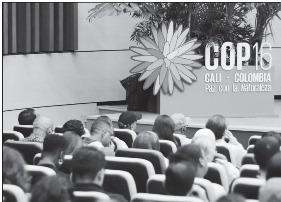
▲ La COP16 es el órgano rector del Convenio sobre la Diversidad Biológica, adoptado en 1992, el cual en este 2024 tiene como sede Cali, bajo el lema "paz con la naturaleza".

Expresó el agradecimiento a la ONU México por invitarlos para dar a