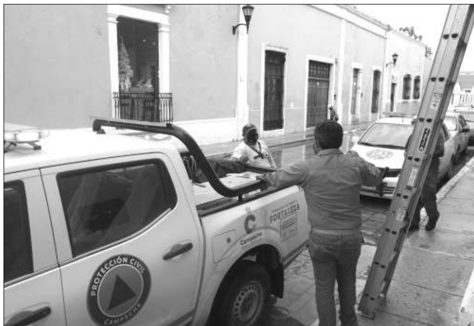
▲ Los tres involucrados son acusados de simular el pago a una empresa "facturera" por más de 600 mil pesos para la remoción y reconstrucción de tres módulos de bomberos en la ciudad capital, sin que haya evidencia administrativa y física de estos trabajos.

El mencionado, junto con Edgar N., Mario N. y un sujeto más también identificado como Ricardo N. respectivamente, son acusados de simular el pago a una empresa "facturera" por más de