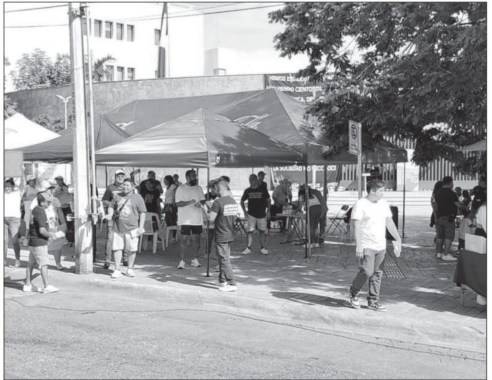
▲ Pese a que decidieron no realizar más bloqueos viales, la base trabajadora del Poder Judicial seguirá en paro en Cancún, así como en todo el país, al menos hasta el miércoles 23 de octubre, pero seguirán atendiendo los casos prioritarios.

Chi Flores adelantó que buscan organizar una feria jurídica; prevén tener al menos dos módulos con titulares y algunos compañeros que expliquen tanto a niños como jóvenes, adultos y adultos mayores, todo lo que necesiten conocer de las leyes. El llamado, dijo, es a que los sigan apoyando y sobre todo que tengan la certeza de que están tratando de pelear por un México libre.