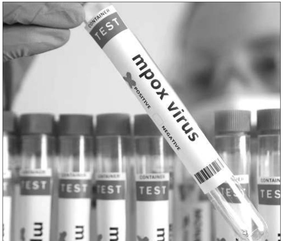
▲ El mpox, anteriormente conocido como viruela del mono, se propaga de los animales a los humanos, pero también se transmite entre personas, causando fiebre, dolores musculares y lesiones en la piel.

A principios de octubre se lanzó una campaña de vacunación en RDC, el país de África Central más afectado por el virus en el mundo.