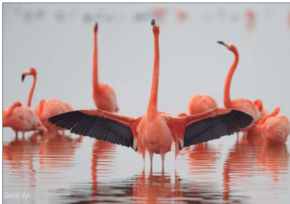
▲ El documental Flamingos, la vida después del meteorito , dirigido por Lorenzo Hagerman, es un vistazo al camino que recorre un flamenco, también llamado flamenco en la península de Yucatán, para encontrar a la pareja adecuada y formar una familia.

El documental es un vistazo al camino que recorre un flamenco, también llamado flamenco en la península de Yucatán, para encontrar a la pareja adecuada y formar una familia. Cactus Docs, La Vaca Independiente y Cornell Lab of Ornithology trabajaron en conjunto en la producción de esta historia.