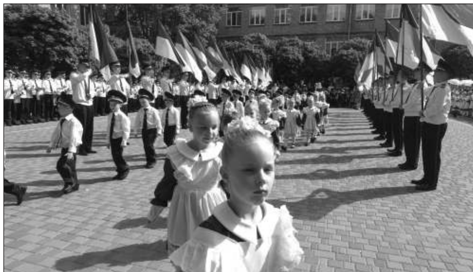
▲ El índice de natalidad que se tiene registrado en la nación ucraniana es uno de los más bajos del mundo y “muy por debajo” del umbral para renovar la población, que es de 2.1 hijos”.

Ya antes del conflicto, Ucrania tenía una de las tasas de natalidad más bajas de Europa y, como en