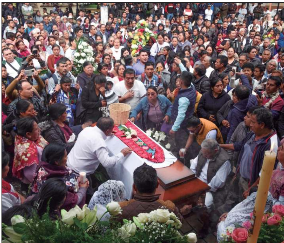
▲ La Fiscalía General de la República será la instancia que estará informando avances del tema al haber atraído la investigación del caso del padre Marcelo.

Por su parte, el gobernador de Chiapas, Rutilio Escandón, confirmó esta información en su cuenta de X: “Mi reconocimiento a las autoridades de Procuración de Justicia, quienes me han informado que ha sido detenido el autor material de la muerte del padre Marcelo”, publicó Escandón.