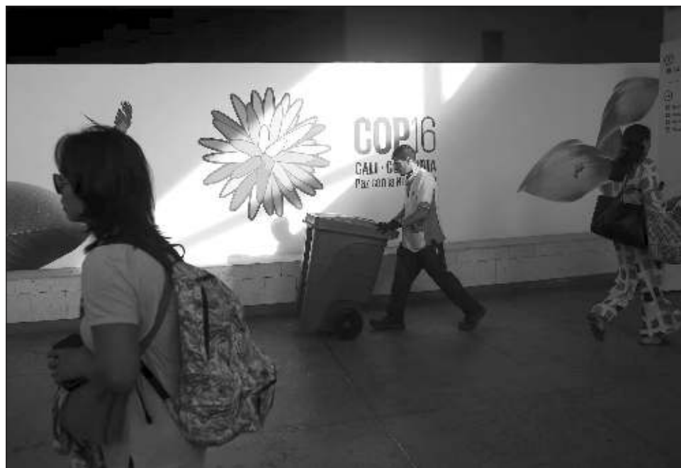
▲ Los rebeldes conocidos como Estado Mayor Central (EMC) amenazaron a los asistentes a la mayor cumbre de Naciones Unidas sobre biodiversidad, que se realiza en la ciudad de Cali.

“La carga explosiva fue detonada a unos 100 metros antes de que el camión llegara. (...) afortunadamente