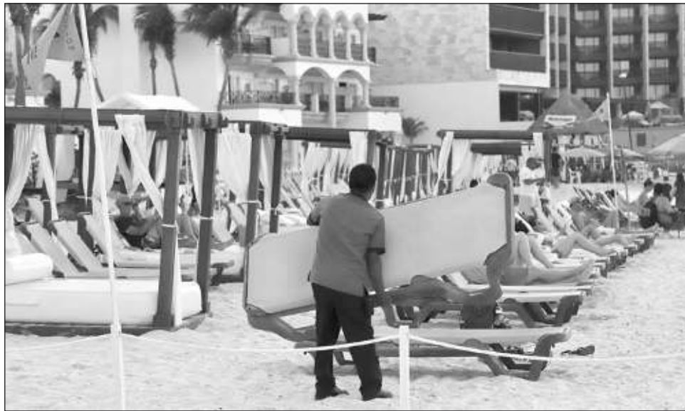
▲ En la reunión, el instituto presentó al CCE del Caribe el nuevo programa Buzón IMSS, donde el empresario puede tener contacto personalizado con el instituto para tener toda la información relacionada con su empresa y afiliados.

"Las guarderías son un servicio interesante para muchas empresas, para grupos de empresas, no es nada más para una, pueden ser a lo mejor dos o tres o puede ser una aso-