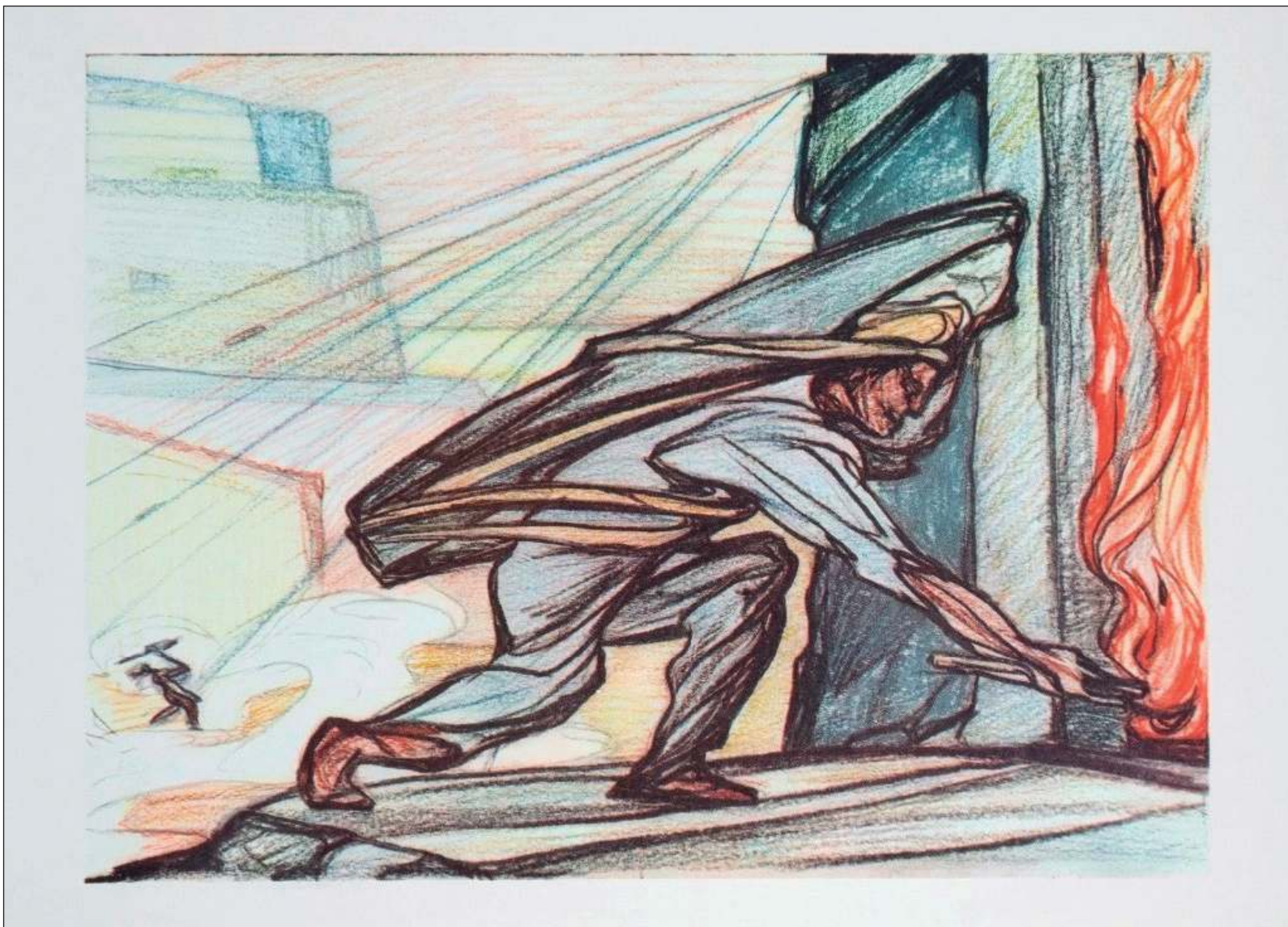
▲ “Nuestro héroe era El Pípila, que con su piedra en la espalda desfundó la puerta de la Alhóndiga de Granaditas, un héroe descubierto en la primaria, al que considero que nunca se ha hecho el caso que tanto merece y que entronicé desde mi infancia entre los grandes héroes, los más anónimos y los más conmovedores”.

1896 se han comenzado los festejos la noche del día 15 con una ceremonia impactante y única en mi memoria, que recuerda el famoso Grito de Independencia y, sobre todo, admira al Hombre Araña, un joven muy pobre y heroico que subía hasta el campanario. Varias veces, mi hermana y yo nos con-