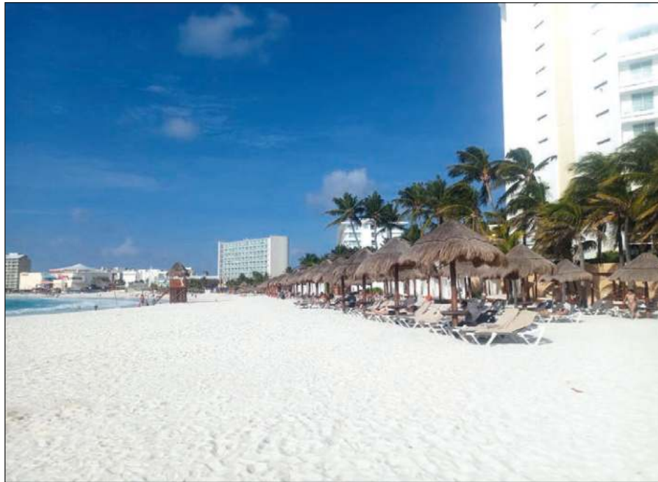
▲ El verano tampoco fue favorable para la Asociación de Complejos Vacacionales y Turísticos: muchos de los viajeros decidieron visitar Europa en vez de Quintana Roo.

Por ello, la expectativa se centra ahora en incrementar las acciones de promoción para mantener el ritmo de cre-