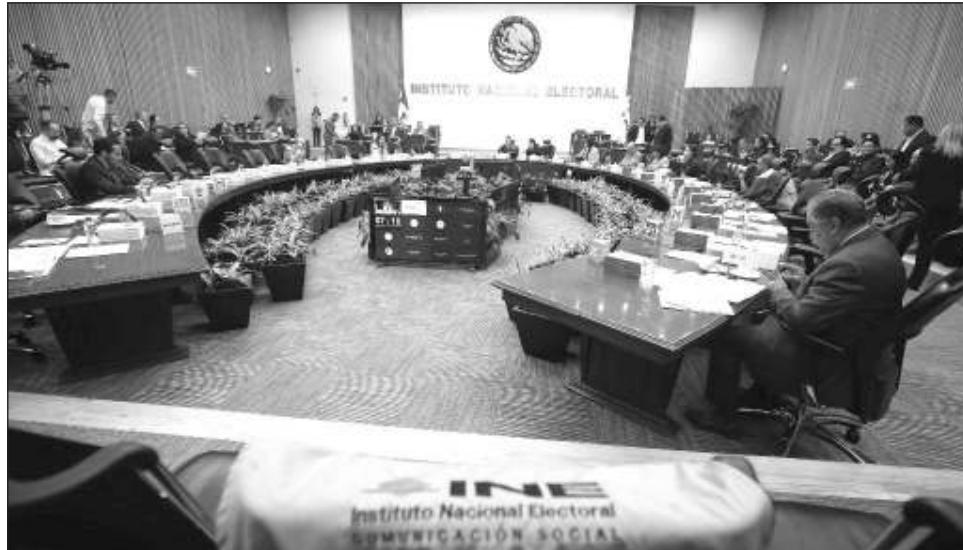
▲ La reforma judicial, publicada el 15 de septiembre pasado, prevé que la etapa de preparación de la elección extraordinaria de 2025 se iniciará con la primera sesión que el Consejo General.

La reforma judicial, publicada el 15 de septiembre