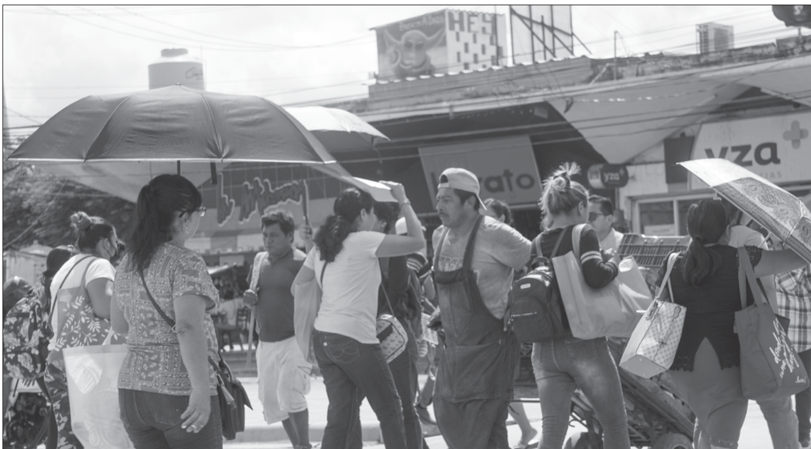
▲ "De acuerdo a la ONU, en 2023 se tuvo por objetivo poner de relieve el vínculo crucial entre la lucha contra la corrupción y la paz, la seguridad y el desarrollo; su núcleo fue la noción de que la lucha contra este delito es un derecho y una responsabilidad de todos".

SÍGANOS EN: http://orga.enesmerida.unam.mx/ Facebook @ORGACovid19 Instagram @orgacovid19 X @ORGA_COVID19