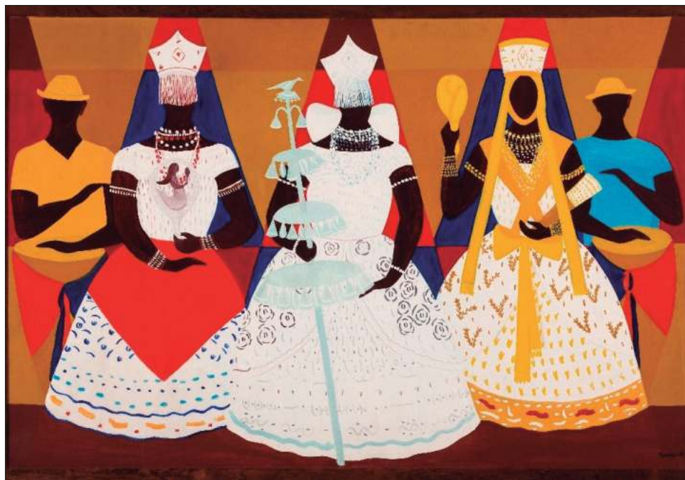
▲ La exposición Brasil! Brasil! The Birth of Modernism , que estará abierta hasta el 5 de enero de 2025, y su catálogo, abordan también cuestiones contemporáneas, como la centralidad de las mujeres artistas en el Modernismo brasileño y los aspectos raciales.

El primer grupo incluye a los clásicos del Modernismo, artistas de origen burgués, como Tarsila do Amaral, Candido Portinari, Vicente do Rego Monteiro, Geraldo de Barros, todos