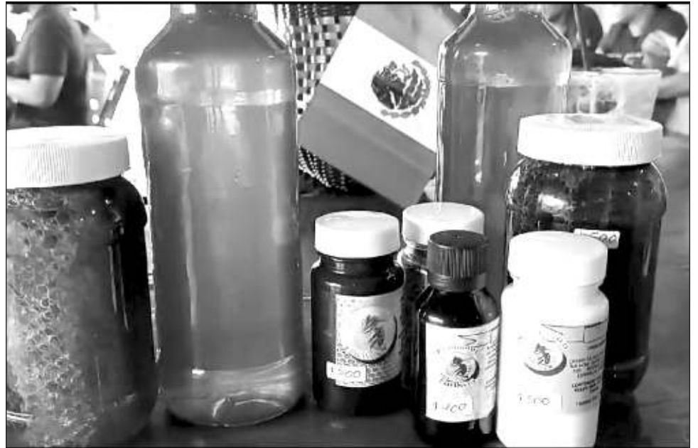
▲ Los apicultores de la región están buscando estrategias para aumentar su visibilidad en el mercado y atraer a más consumidores en un destino como Tulum.

El apicultor enfatizó que, a pesar de las dificultades, su compromiso con la calidad de sus productos se mantiene firme, puesto que continúa ofreciendo una variada gama de productos naturales, que incluyen miel