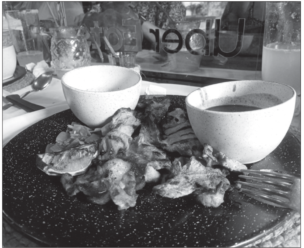
▲ De los restaurantes que guardan el sabor típico de la región y que pueden ser consumidos por nacionales y turistas, destaca El Museo de la Gastronomía Yucateca.

Parte del área museística del restaurante corresponde a la recreación de las casas mayas yucatecas con sus ingredientes típicos, la calabaza, el pepino local, el tomate, el cilantro, la pimienta, algunos de los elementos de las milpas en zonas rurales que aún se cultivan con frecuencia.