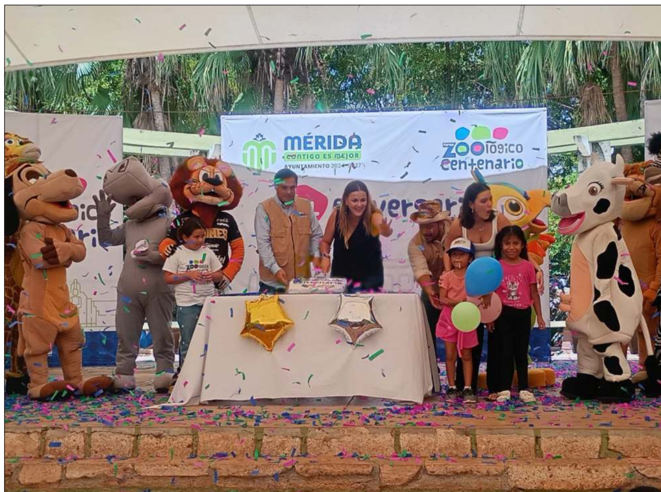
▲ La alcaldesa Cecilia Patrón Laviada celebró el aniversario número 114 del Parque Zoológico del Centenario junto al personal responsable del cuidado de dicho recinto, y felicitó a los trabajadores del lugar.

La presidenta municipal aseguró que hay muchas áreas de oportunidad y mejora. Como la del trenecito,