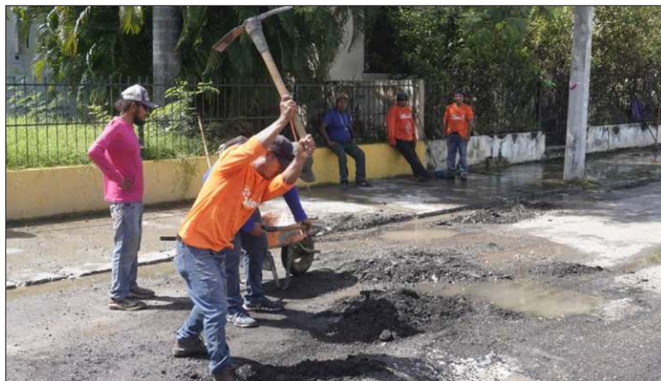
▲ La concesión de servicios públicos y bacheo en la ciudad, que fue admitida este viernes en sesión extraordinaria, estará vigente desde el 1 de octubre de 2024 al 30 de septiembre de 2027.

Afirmó también que al no haber mucha información al respecto, decidió investigar a la empresa, pero lo único que encontró fue