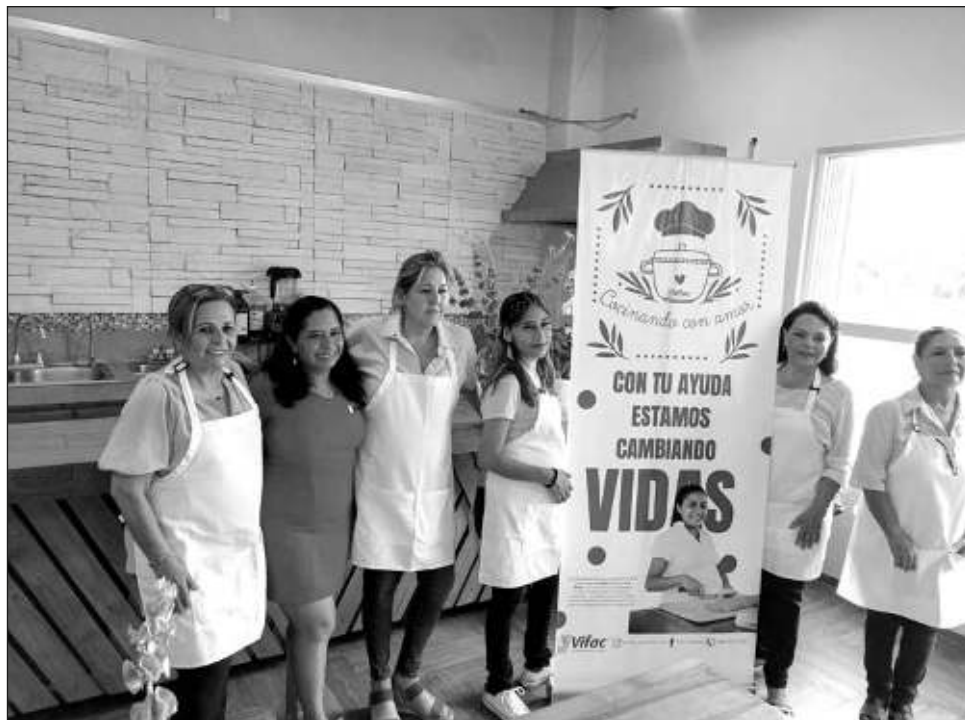
▲ Las beneficiarias aprenden a cocinar comida rápida, rica y balanceada que ponen a la venta al público en general y hacen su propio negocio.