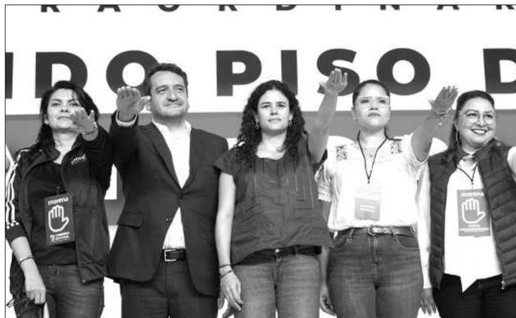
▲ Sería negativo tanto para la Cuarta Transformación como para el primer gobierno encabezado por una mujer, que los mayores conflictos políticos se originen en el partido que representa ese ideal.

De ahí que una de las prioridades de Claudia Sheinbaum será contar con operadores dentro de Morena. Sería sumamente negativo tanto para la Cuarta Transformación como para el primer gobierno encabezado por una mujer, que los mayores conflictos políticos se originen en el partido que representa ese ideal y volvamos a los ciclos de crisis que marcaron los años 90 del siglo pasado para el entonces partido oficial. La diferencia es que ahora se perdería una oportunidad histórica de transformación del país.