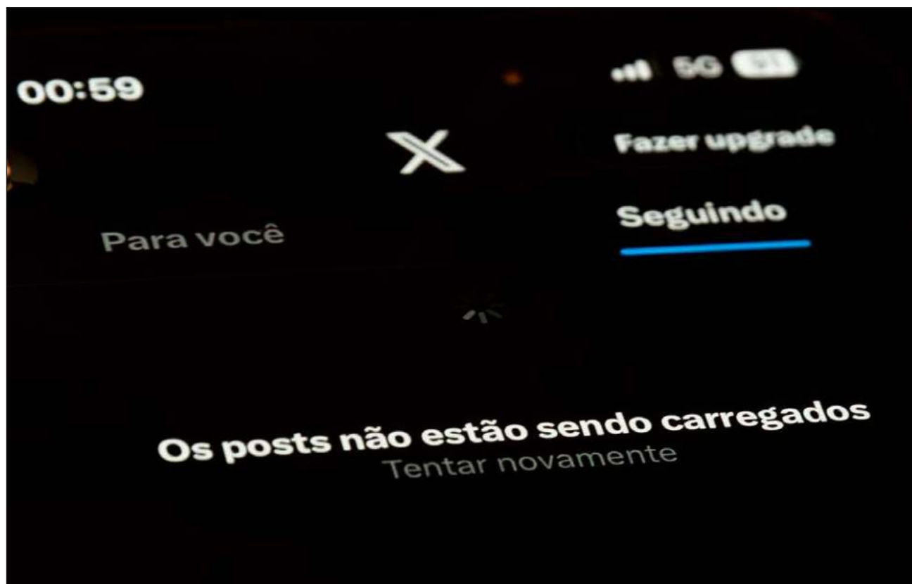
▲ La red social X deberá pagar una multa de 913 mil dólares a Brasil por violar la suspensión en el país.

La decisión del sábado también establece que X deberá pagar una multa de al menos 5 millones de reales