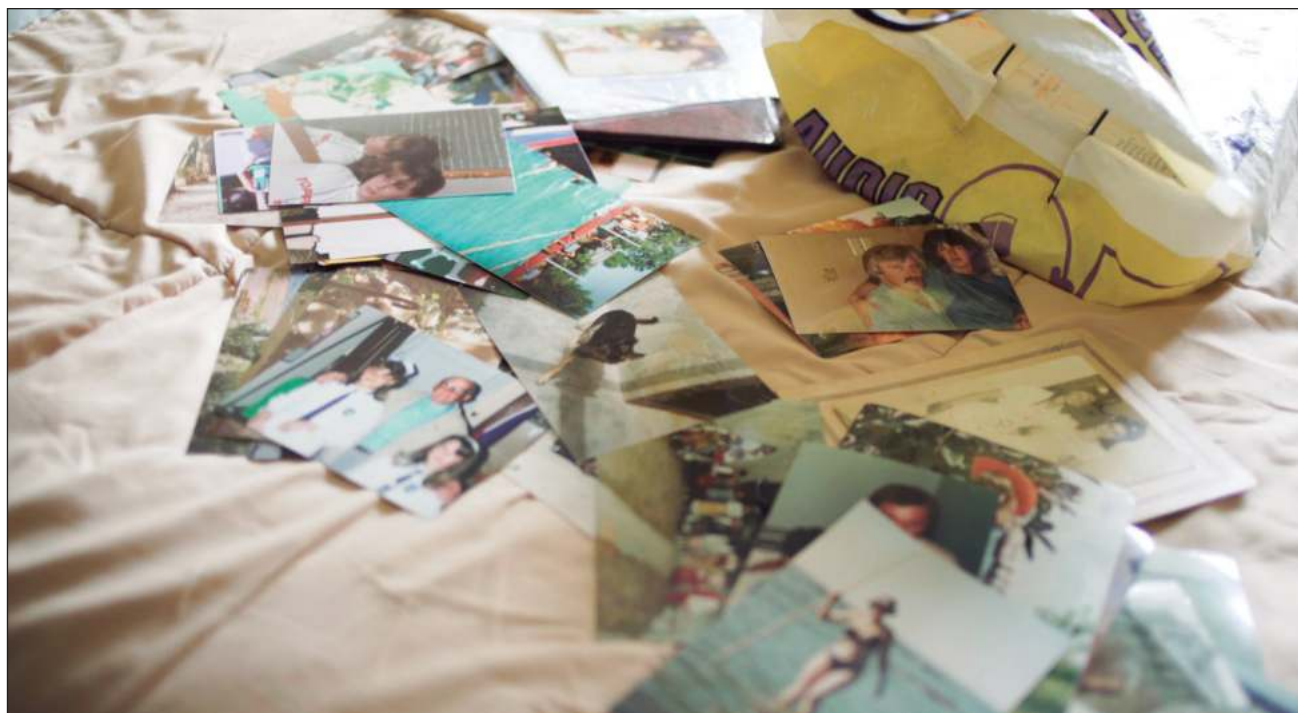
▲ Mientras que la cinta Los bordes del abismo explora la dolorosa realidad de quienes han perdido a un ser querido por suicidio, Los Invisibles es un documental que aborda el cuidado de la salud mental en jóvenes. Foto Fotograma

Para la realización de este trabajo, Murmurante exploró la temática en dos regiones de Latinoamérica que comparten, paradójicamente, la condición de presumir altos niveles de bien-