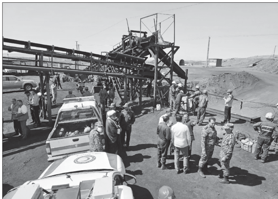
▲ De acuerdo con IRNA, la mina de Tabas cubre un área de más de 30 mil kilómetros cuadrados y contiene enormes reservas de carbón de coque y carbón térmico.

El guía supremo, el ayatolá Ali Jamenei, expresó sus condolencias a las familias de las víctimas tras este “triste incidente”, y pidió a las autoridades “hacer todo lo posible para