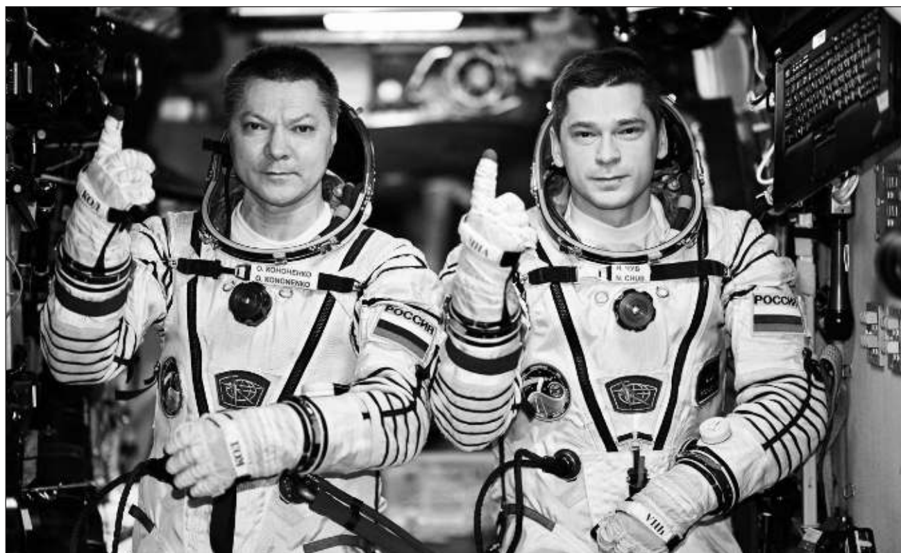
▲ Kononenko y Chub batieron el récord anterior de mayor estadía continua en el espacio en el marco de un programa de la EEI.

Se espera que Kononenko y Chub, quienes partieron a la EEI el 15 de septiembre de 2023, regresen a la Tierra a bordo de la nave espacial Soyuz MS-25 el 23 de septiembre de 2024.