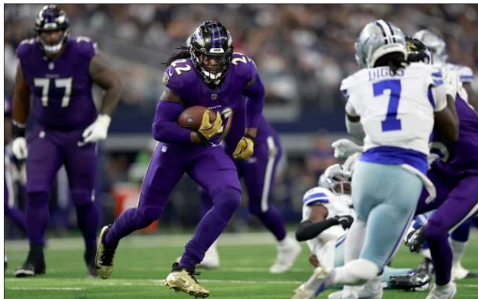
▲ La defensiva de Dallas batalló de nuevo, ante los Cuervos, que lograron su primer triunfo.

Los "Cowboys" (1-2) permitieron 120 puntos en sus últimos tres juegos como locales, incluida la derrota por 48-32 en la ronda de comodines ante