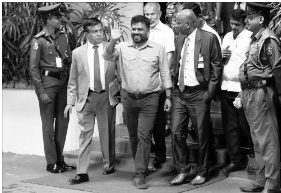
▲ Anura Kumara Dissanayake, cuya campaña a favor de la clase obrera y en contra de la élite política lo hizo popular entre los jóvenes, le ganó al líder opositor Sajith Premadasa.

Las elecciones realizadas el sábado fueron cruciales,