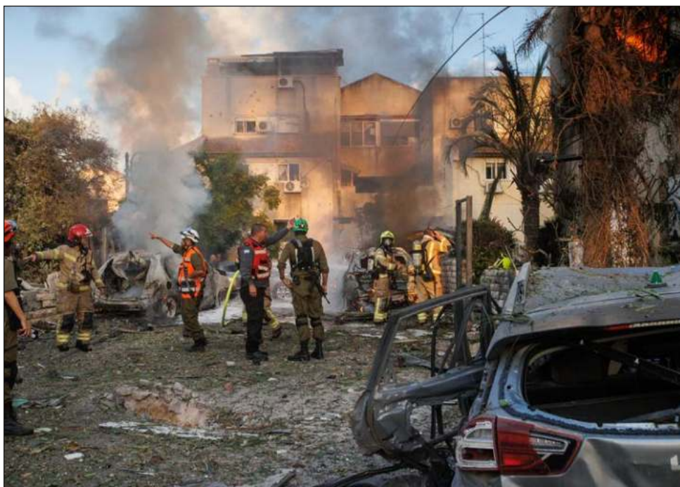
▲ Un cohete cayó cerca de un edificio residencial en Kiryat Bialik, una población cerca de Haifa, donde hirió al menos a tres personas y prendió fuego a edificios y autos.

Al Jazeera niega las acusaciones y asegura que Israel ataca sistemáticamente a sus empleados en la Franja de Gaza, donde cuatro de ellos murieron desde el inicio de la guerra.