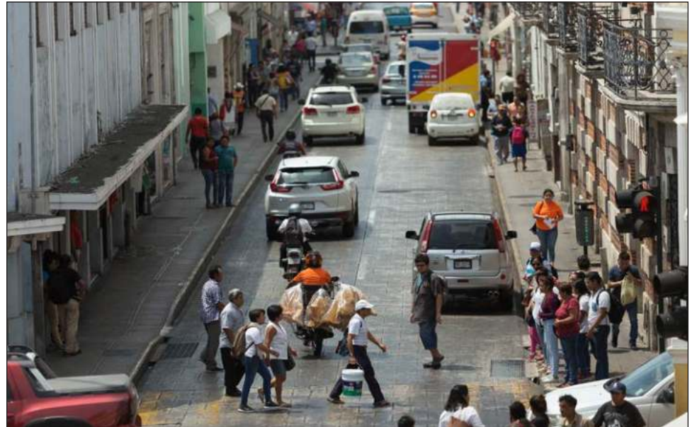
▲ Mejoramiento de alumbrado, mantenimiento de parques y canchas deportivas, mayor patrullaje y vigilancia policiaca, entre las medidas puestas en marcha.

La Envipe registró que en 2023 hubo 31.3 millones de