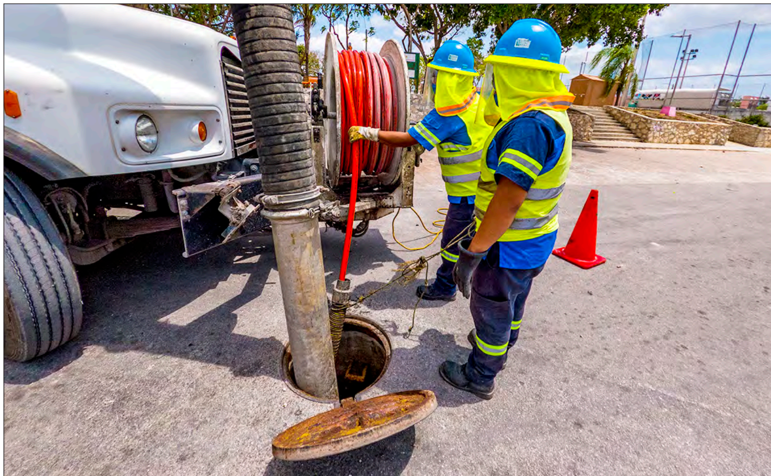
▲ Para que los hogares puedan hacer uso del agua, se requiere de un largo proceso: el vital líquido debe ser extraído, desinfectado, almacenado, distribuido al consumidor, recolectado, saneado y posteriormente reinyectado al manto freático.

Históricamente Aguakan ha desarrollado diversos programas para apoyar a sus clientes mediante convenios, apoyos sociales a personas en situación vulnerable y actualmente durante la pandemia ha brindado flexibilidad en los pagos mensuales a sus clientes.