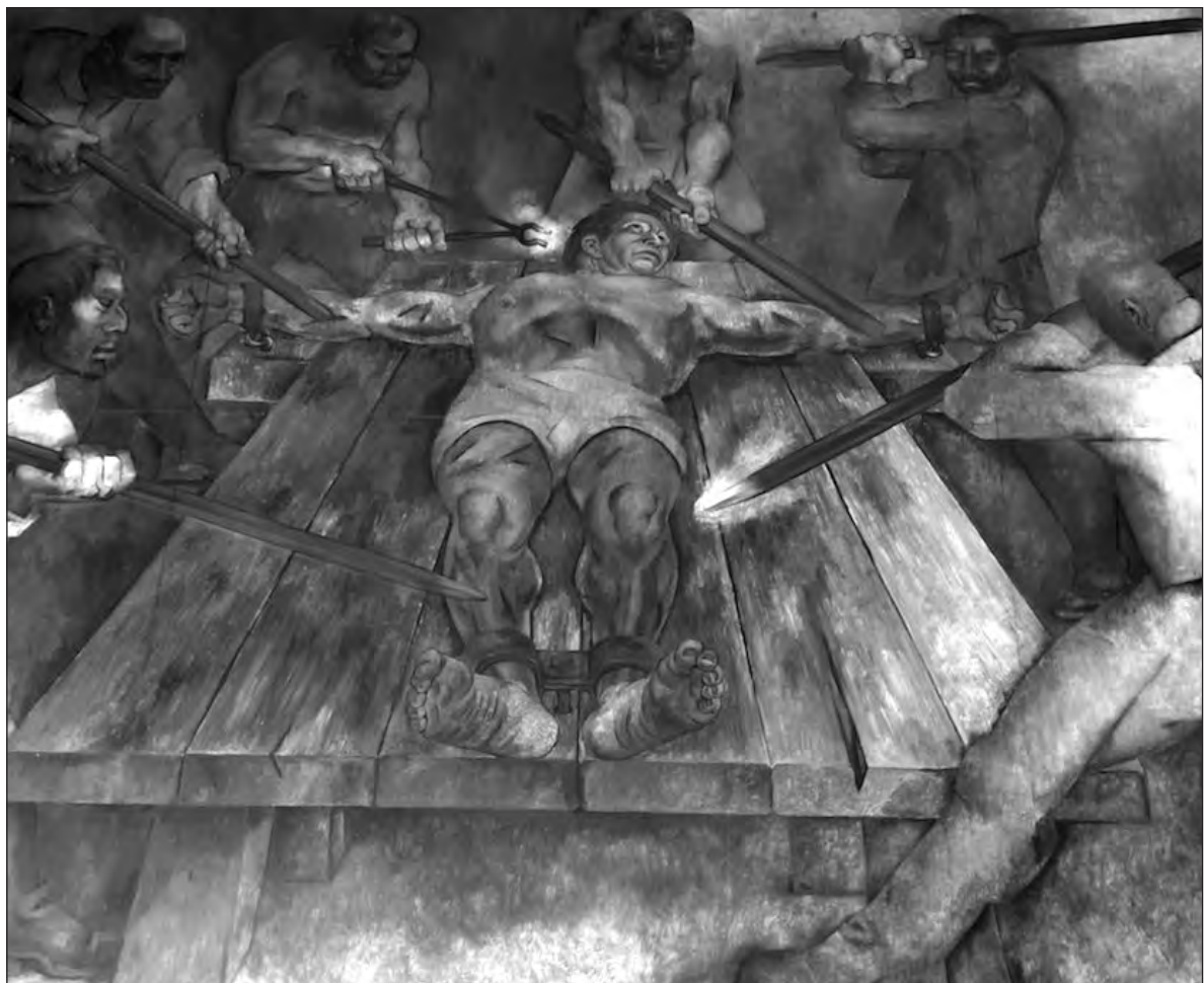
▲ El abuelo preguntó: ¿A qué no sabes que encontré en la raíz de caoba? –y levantando la mano, empuñando una gubia, con el mango, golpeó con fuerza el trozo de madera y exclamó– ¡Es Canek, aquí adentro, está la cabeza de Canek!

El Abuelo se quedó mirando el enigmático nudo, y me dijo: