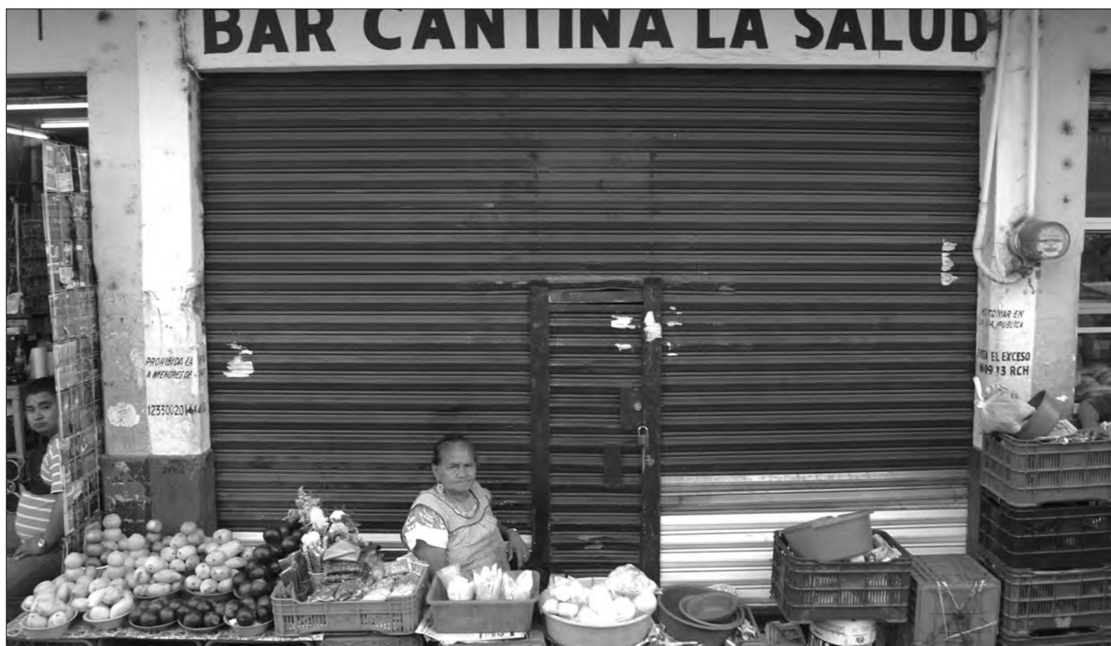
▲ En general, las cantinas de Mérida son lugares hospitalarios, portadores de más de un recuerdo entrañable. Y algunos de ellos ostentan nombres de buena ley, que refulgen y deslumbran en bien de sus concurrentes.