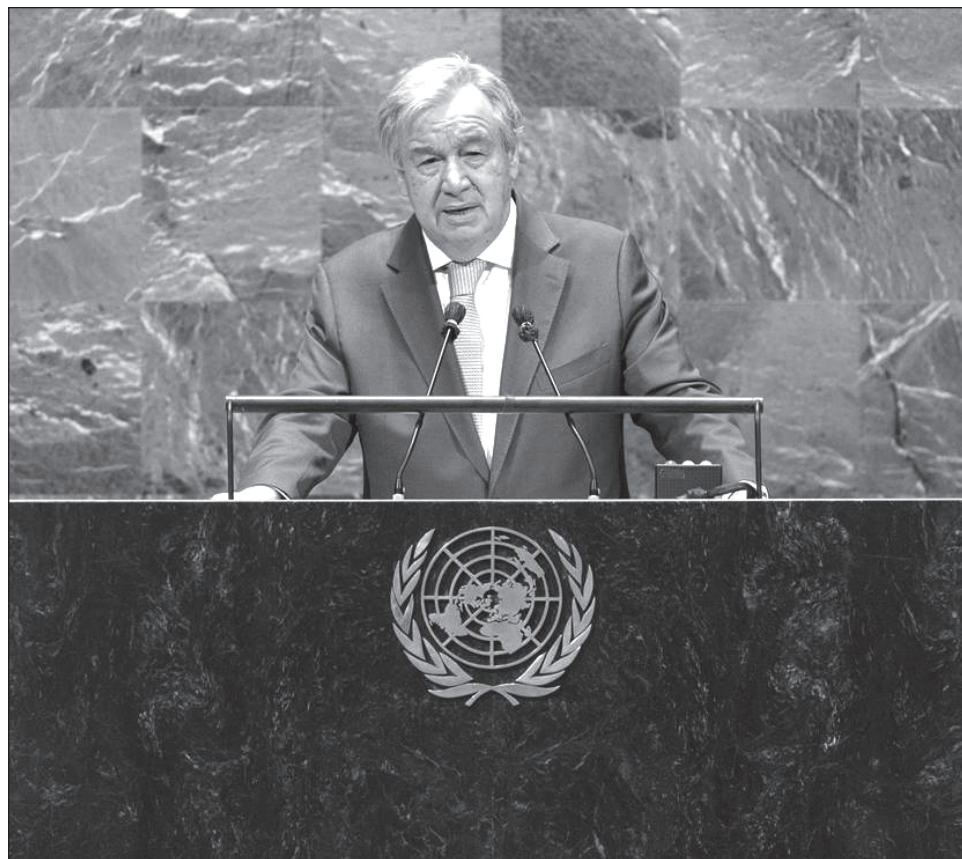
▲ El secretario general de Naciones Unidas, Antonio Guterres, advirtió el martes en la primera reunión virtual de líderes mundiales que el planeta enfrenta una crisis de importancia “histórica”.

El jefe de la ONU pronunció su discurso en el vasto Salón de la Asamblea General, donde sólo se permitió la entrada a un diplomático con mascarilla de cada una de las 193 naciones miembros de la ONU, esparcidos en la cámara.