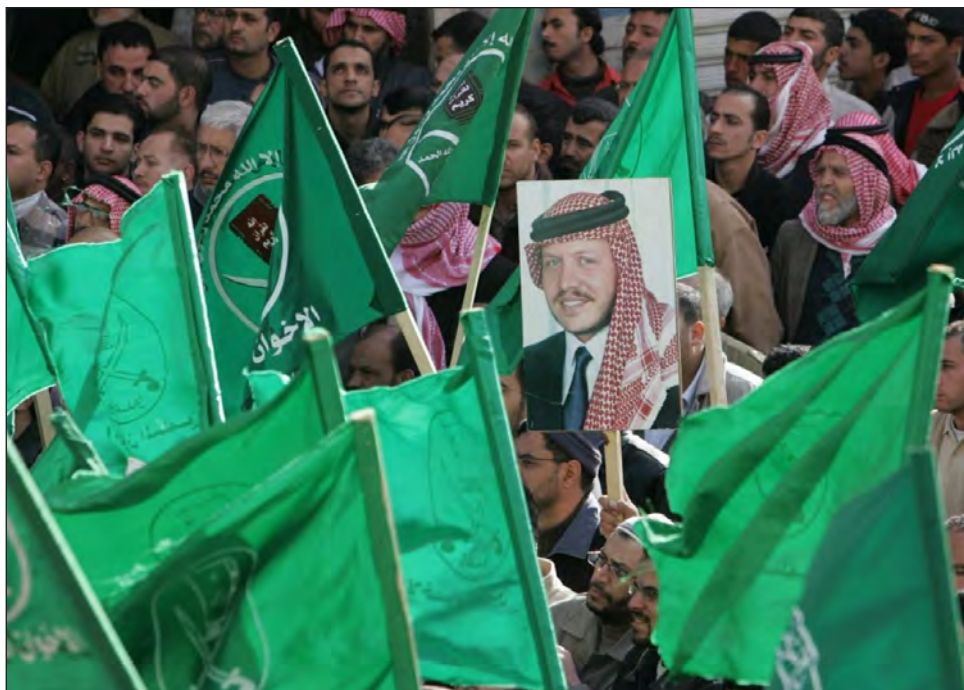
▲ En julio pasado, el Tribunal de Casación de Jordania, la más alta instancia judicial del país, ordenó la disolución de los Hermanos Musulmanes.

En julio pasado, el Tribunal de Casación de Jordania, la más alta instancia judicial del país,