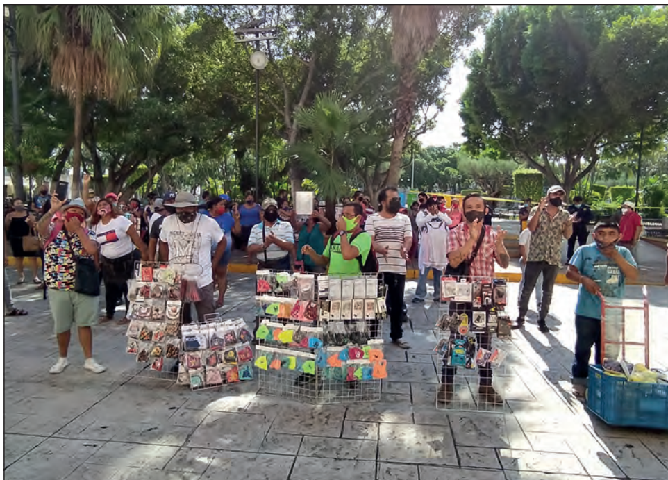
▲ Frente al palacio municipal, los comerciantes acusaron a los inspectores municipales de no permitirles instalar sus puestos y correrlos de las aceras.