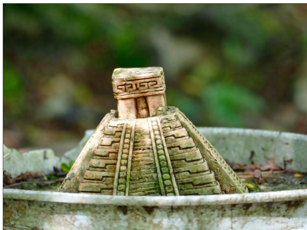
▲ Chichén Itzá tendrá un aforo máximo de 3 mil visitantes diarios, pero existen casi 2 mil vendedores y cargadores trabajando en la zona. Será marcación casi personal, uno a uno.

En Chichén pandemias van y vienen, comerciantes ambulantes sitian, protestan y apenas sobreviven, los órdenes de gobierno y los operadores turísticos no se involucran a fondo y las soluciones son siempre cortas. Como si fuera Stalingrado en la Segunda Guerra Mundial, en Chichén Itzá sólo el INAH no se rinde en la batalla, una que después de la tregua forzada amenaza volver con mayor crudeza en medio de la crisis económica.