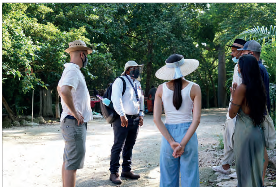
Los visitantes ya pueden volver a admirar El Castillo, siempre y cuando cumplan con las estrictas medidas de higiene y distanciamiento social.