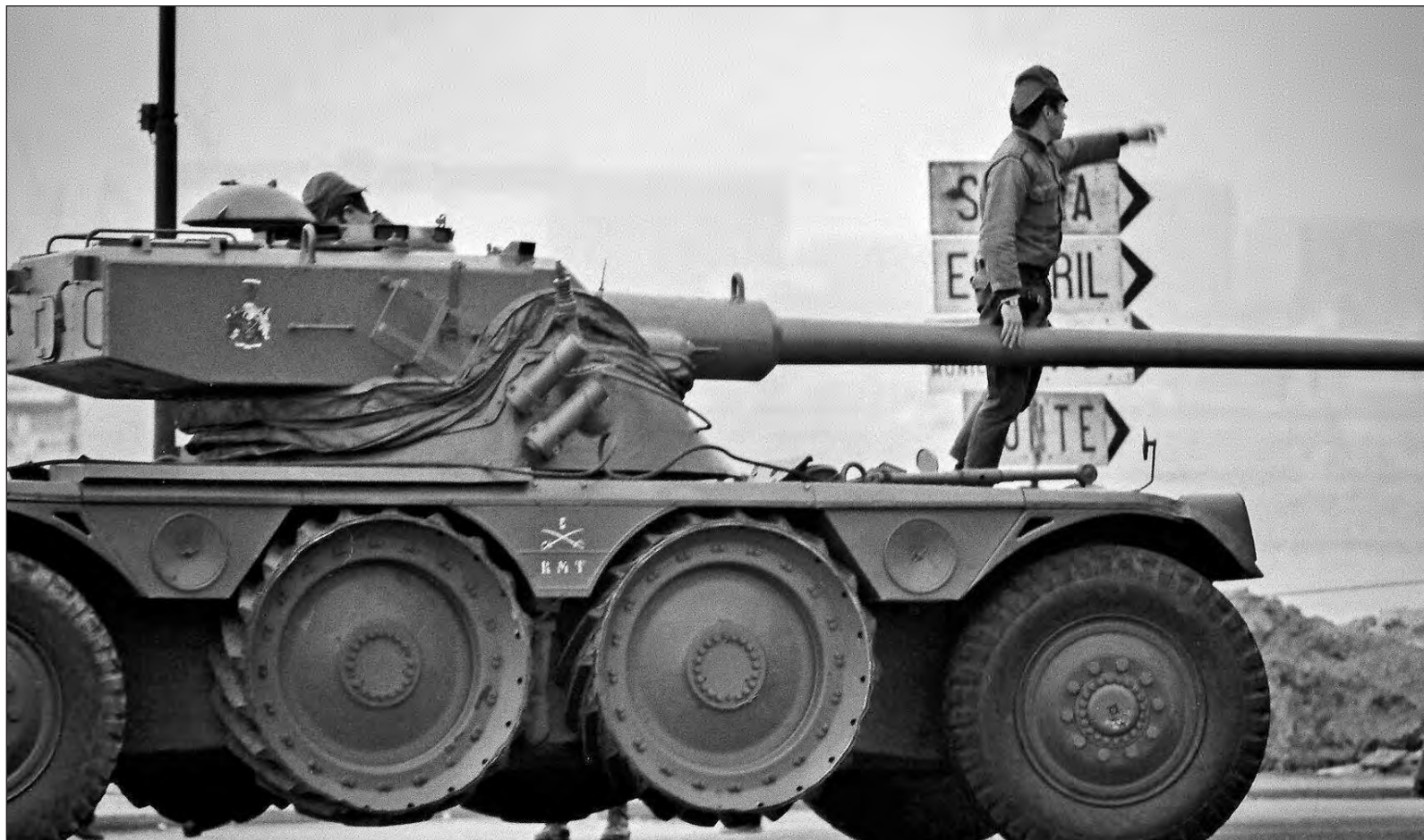
▲ La de los claveles fue una revolución sin violencia que logró derribar la dictadura de Oliveira Salazar.