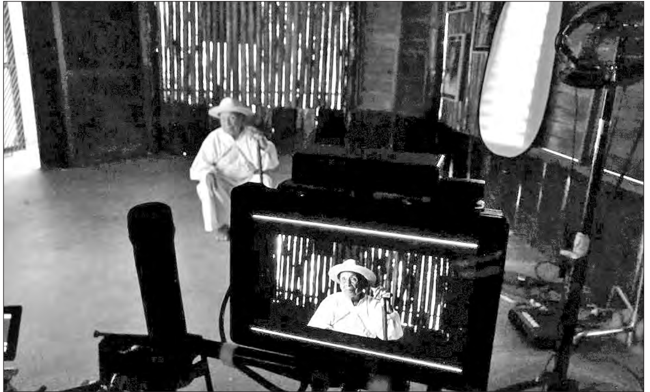
▲ La comisión tendrá un inventario de lo que el estado cuenta para aportar a la industria.

En agosto del año pasado, el Instituto para el Desarrollo y Financiamiento del Estado de Quintana Roo (Idefin) informó que mediante la plataforma de atracción de inversiones PRO-Quintana Roo buscaba posicionar a la entidad como un destino fil-