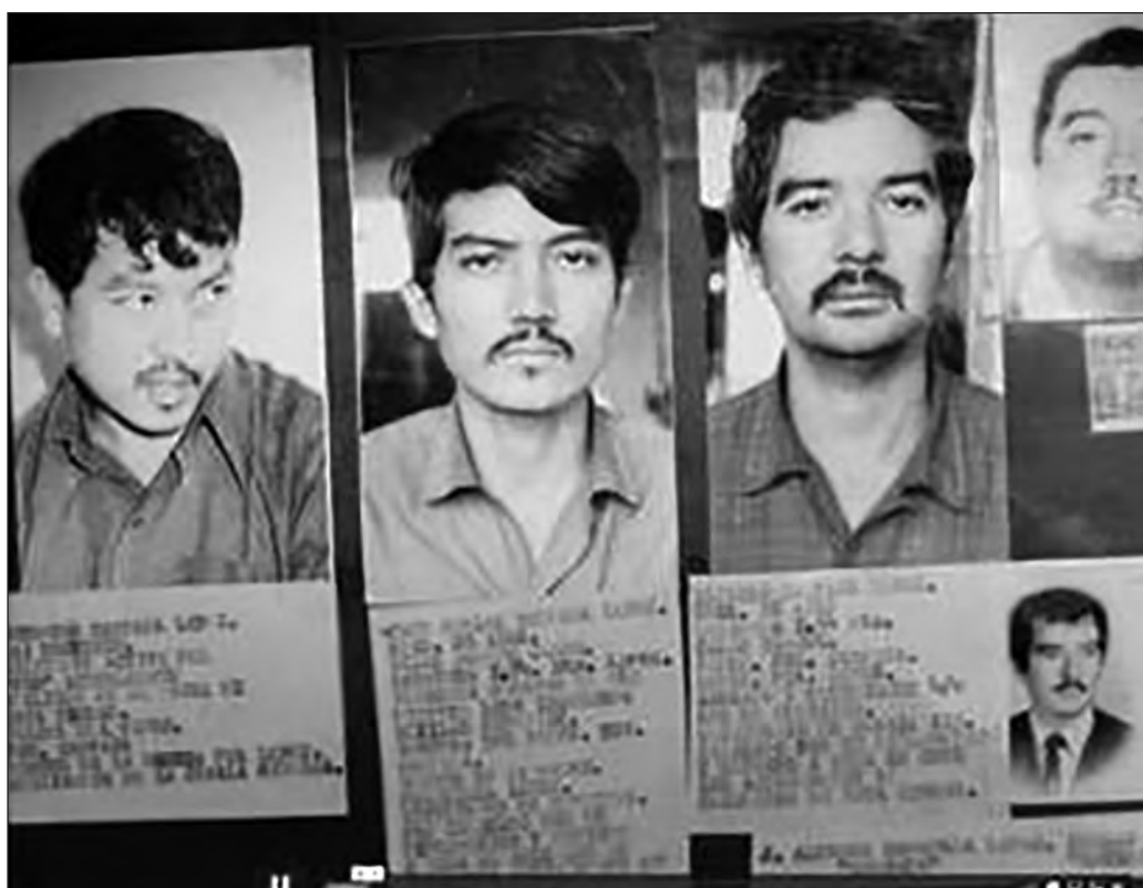
▲ Fotogramas de El guardián de la memoria , de Marcela Arteaga, historia de familias que escapan de la violencia en Chihuahua, y de Oblatos, el vuelo que surcó la noche , de Acelo Ruiz, referente a la liga 23 de Septiembre.