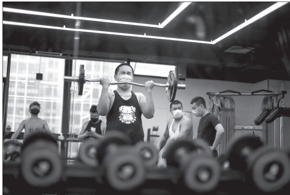
▲ Luego de seis meses de suspensión ante la pandemia, gimnasios en la CDMX se disponen a retomar mañana sus actividades con estrictas medidas sanitarias para evitar contagios.

Oxfam analizó cinco acuerdos contratados entre gobiernos y compañías farmacéuticas -AstraZeneca, Gamaleya/Sputnik,