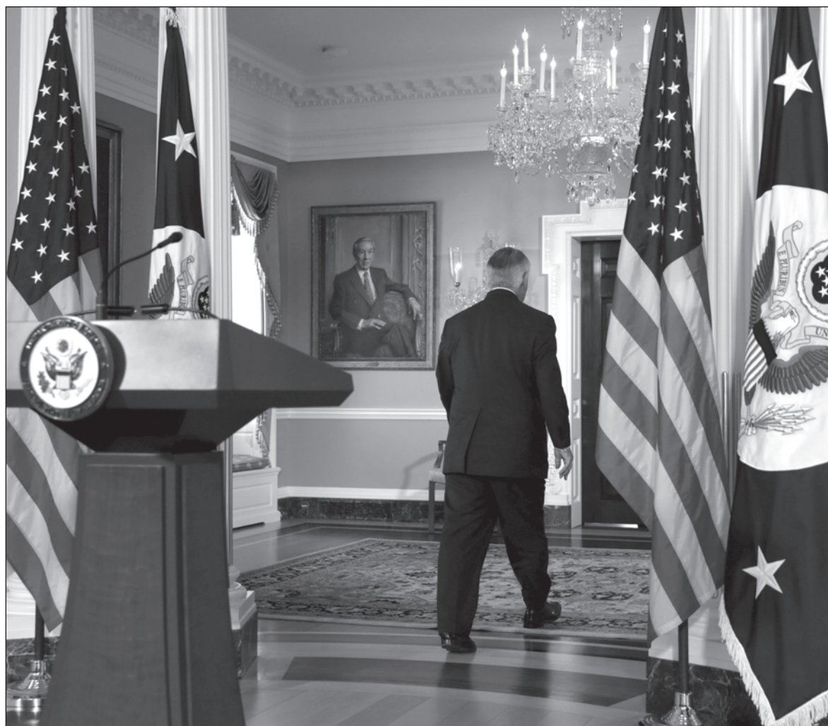
▲ The current U.S. administration has made many crucial mistakes that are affecting global security and governance.

IN ADDITION, THE administration's concerted attacks on the European Union and NATO have degraded a once unbeatable alliance between the United States, Canada, and Europe – an alliance that triumphed in the Cold War and brought economic prosperity and unity of purpose to a Europe historically at odds with itself.