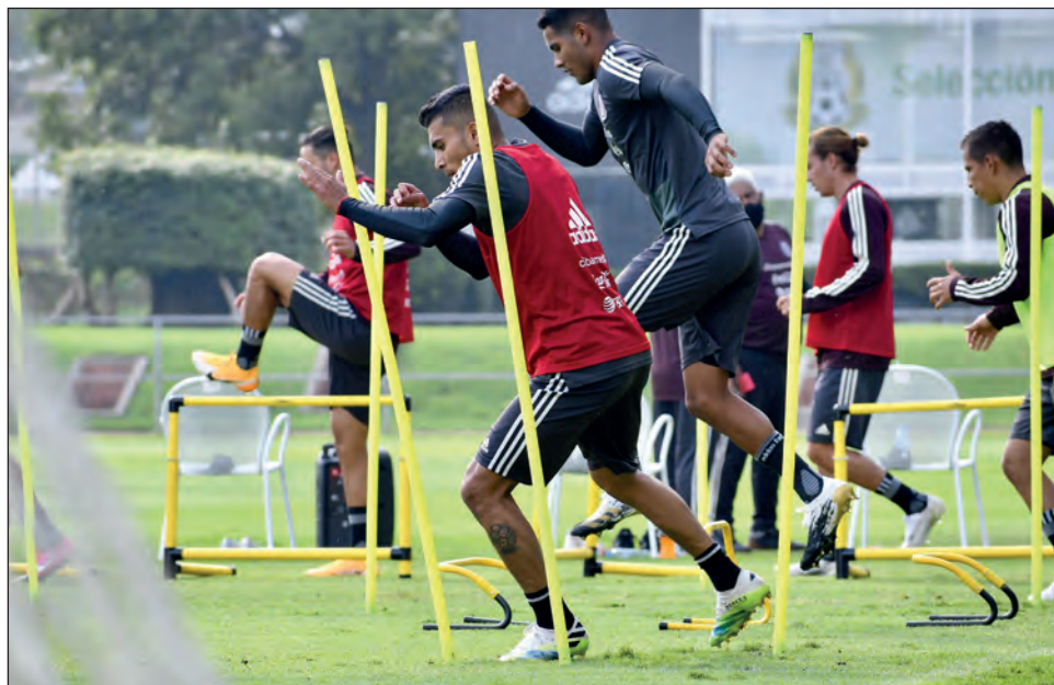
▲ El Tricolor, que ya no se enfrentará a Costa Rica el próximo día 30, tuvo otra sesión de entrenamiento ayer.