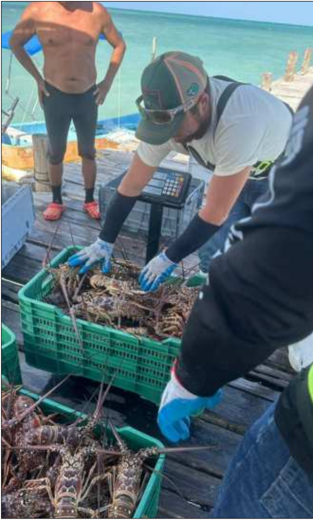
▲ Los hombres del mar pertenecientes a la cooperativa Vigía Chico mantienen la esperanza de una mejora económica en las próximas semanas y meses.