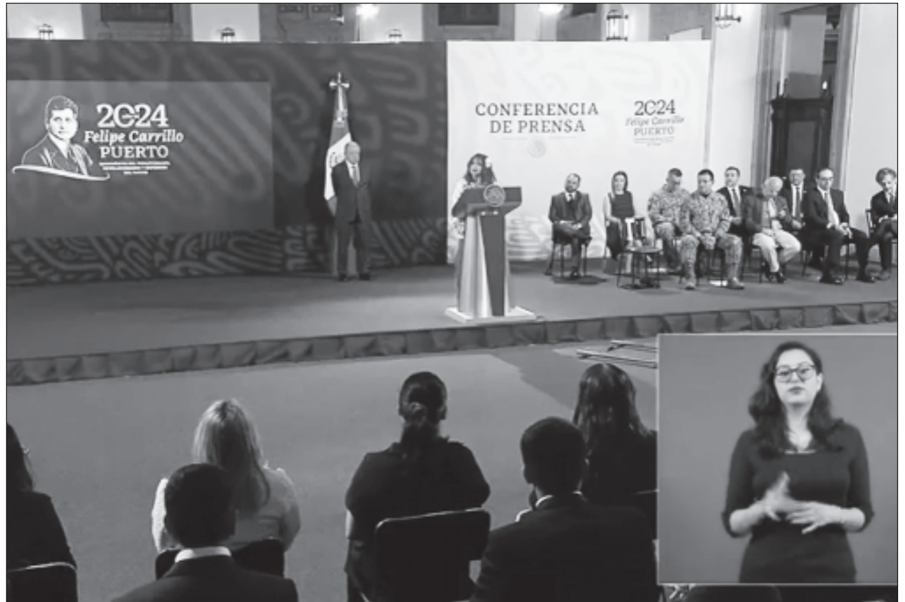
▲ En Palacio Nacional, la gobernadora Layda Sansores San Román subrayó que en Campeche se hablará de un antes y un después del Tren Maya, obra visionaria implementada por el presidente López Obrador.

“No dudamos que Claudia, nuestra próxima presidenta, tiene la misma convicción de que Campeche