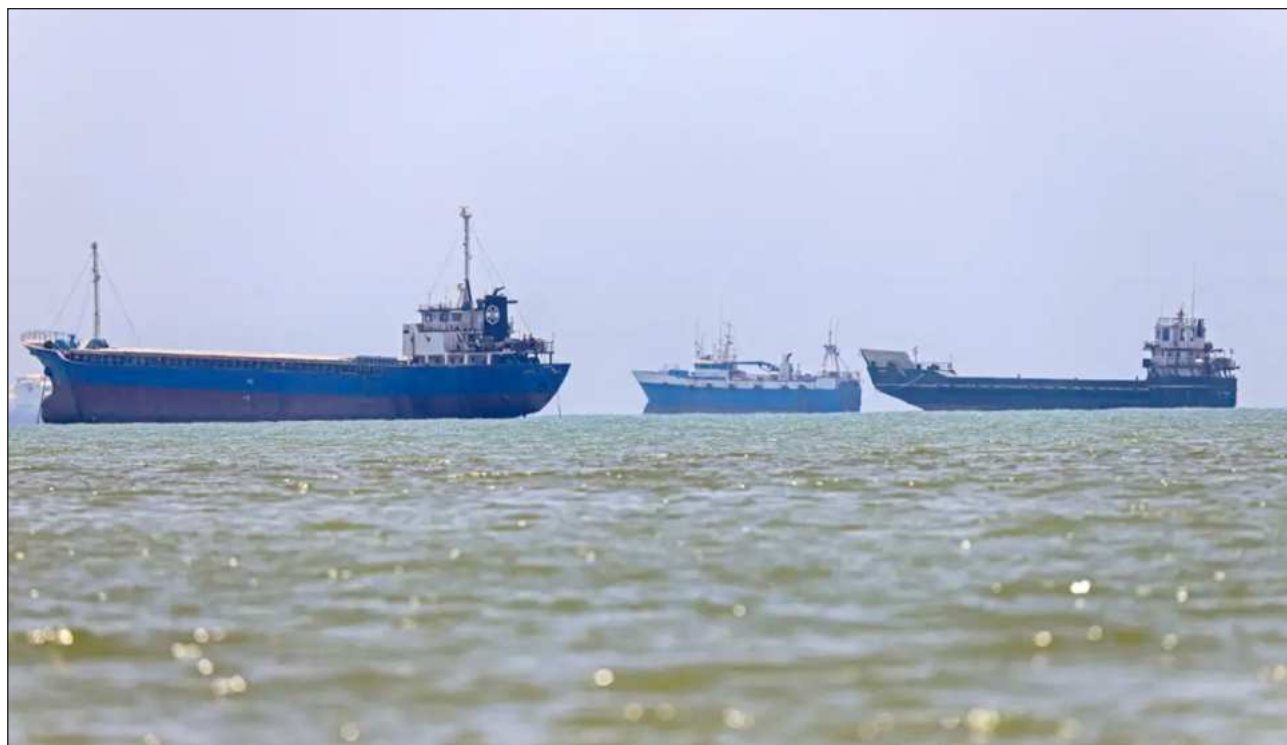
▲ “Si Irán no cumple con su acuerdo o no se comporta como debe, haré lo que tenga que hacer”, subrayó el magnate. Foto

La noticia salió a la luz el lunes, cuando el vicepresidente estadounidense JD Vance afirmó que sus largas conversaciones con altos funcionarios iraníes en Suiza sentaron una base sólida para un acuerdo final exitoso. Los negociadores buscan poner fin de forma definitiva a la guerra que Estados Unidos e Israel iniciaron a finales de febrero.