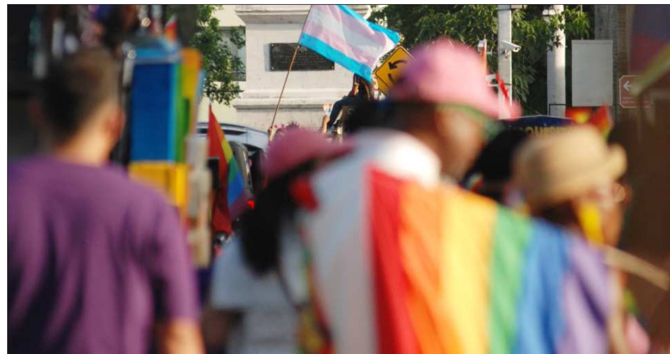
▲ "Las juventudes trans suelen ser objeto de debate público, pero pocas veces son escuchadas directamente. Queremos poner en el centro sus voces y reconocerlas como sujetas de derechos", sostuvo el colectivo Familias que Acompañan.

"Las juventudes trans suelen ser objeto de debate público, pero pocas veces son escuchadas directamente. Queremos poner en el centro sus voces y reconocerlas como sujetas de derechos y agentes de transformación