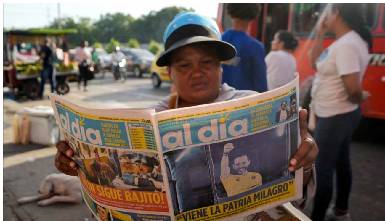
▲ Las propuestas disruptivas del presidente electo incluyen recortar drásticamente el Estado, bombardear guerrilleros y otros narcos con apoyo de Donald Trump, o revisar la permanencia de Colombia en organismos de cooperación como Naciones Unidas.

Con un discurso de mano dura y en contra de la política tradicional, el empresario de 47 años fue elegido el domingo para su primer cargo de elección popular, y a partir de agosto presidirá el país con el último conflicto armado activo en el hemisferio occidental. Sus propuestas disruptivas incluyen recortar drásticamente el Estado, bombardear guerrilleros y otros