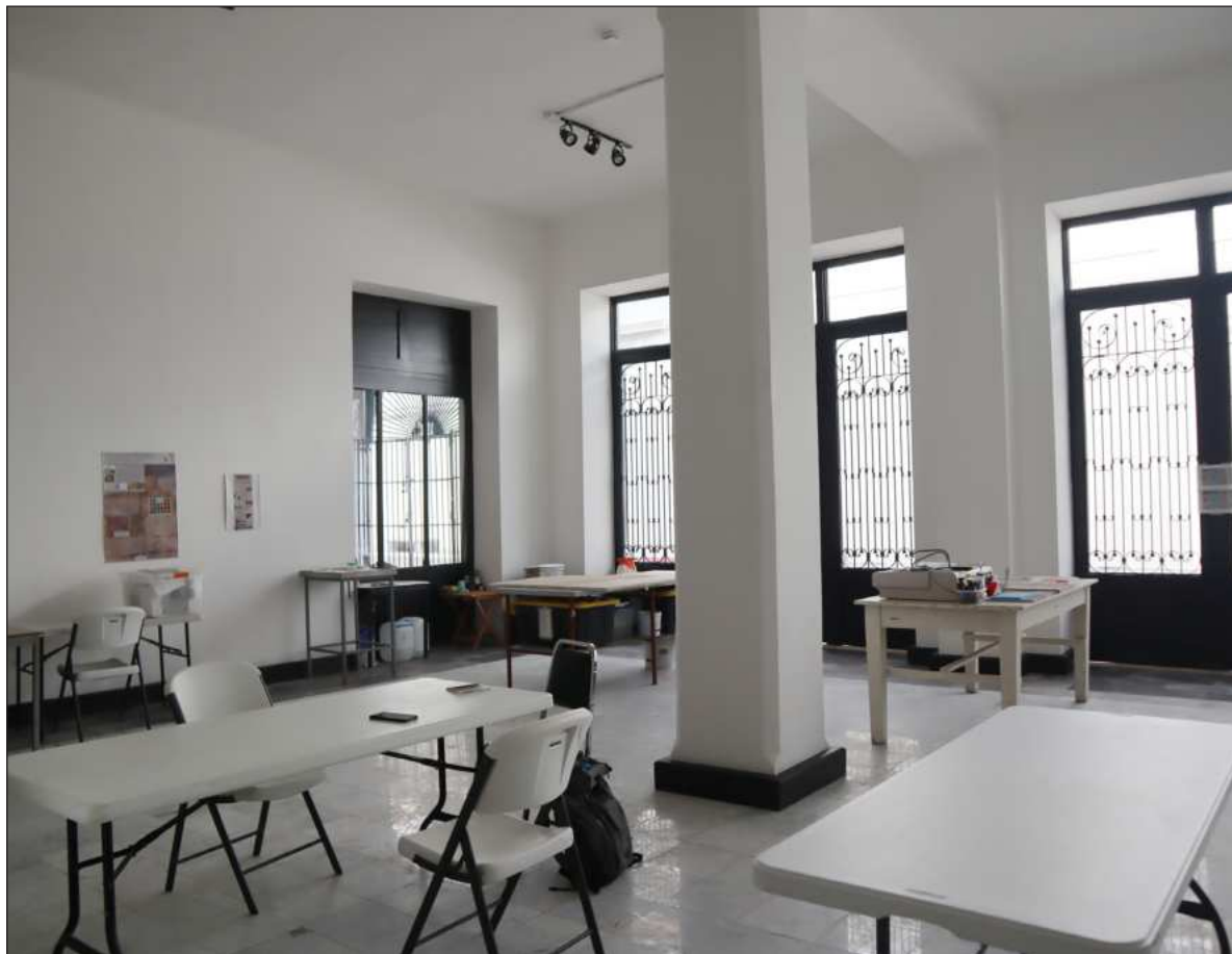
▲ Laboratorio de Investigación para la Conservación del Patrimonio Cultural del Sureste de México.

EN MÉRIDA, EL Laboratorio de Investigación para la Conservación del Patrimonio Cultural del Sureste de México del Centro INAH Yucatán, ubicado en el edificio del