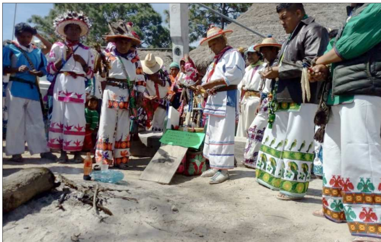
▲ En la fotografía, varios integrantes del pueblo wixárika de San Sebastián Teponahuatlán, entre los municipios de Mezquitic y Bolaños, Jalisco, durante una asamblea comunitaria realizada en 2020.

La decisión se tomó por consenso comunitario en asamblea general