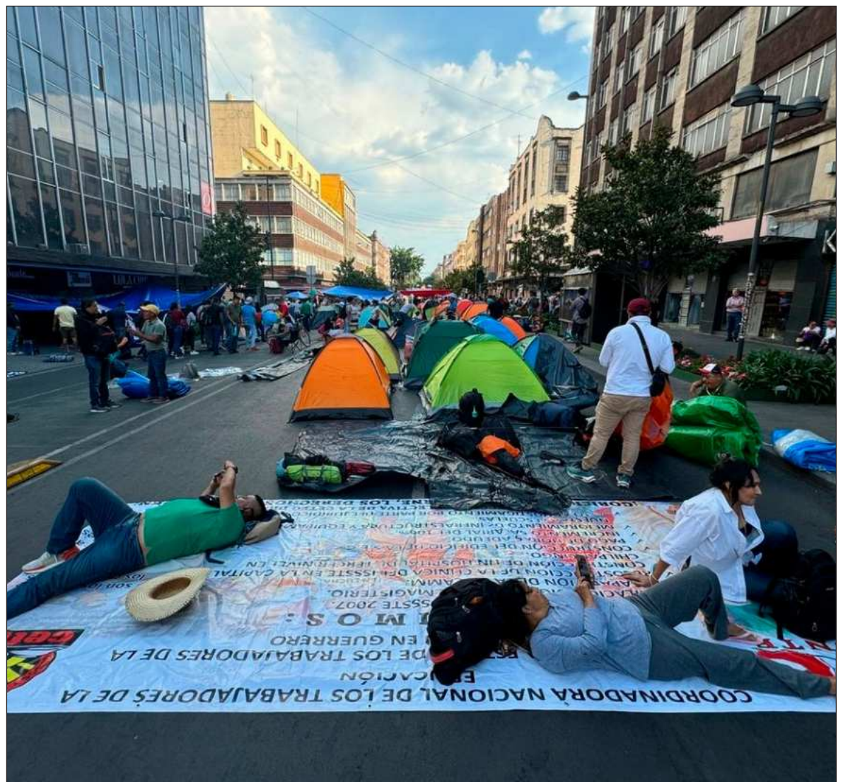
▲ "Desde hace unas semanas hemos visto el movimiento de la CNTE reclamando la erogación de la nueva forma de jubilación para regresar a la antigua. La respuesta del gobierno ha sido que no hay recursos suficientes".