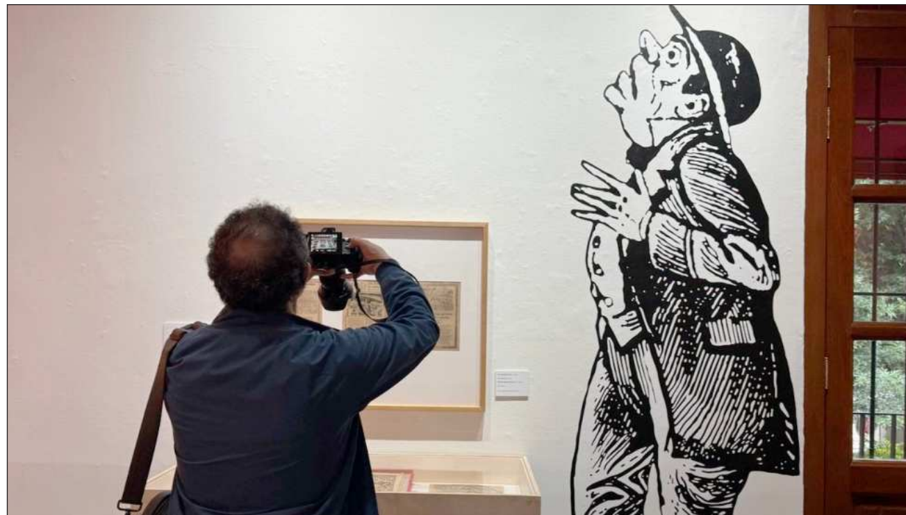
▲ Muestra incluye obras de tres colecciones: del Museo Posada, el museo José Guadalupe Posada y la del Munae.

La exhibición, curada por Mercurio López Casillas, David García y Caroline Montecat, incluye obra de tres colecciones: la del Museo Posada, de Coyoacán; el museo José Guadalupe Posada, de Aguascalientes, y la del Mu-