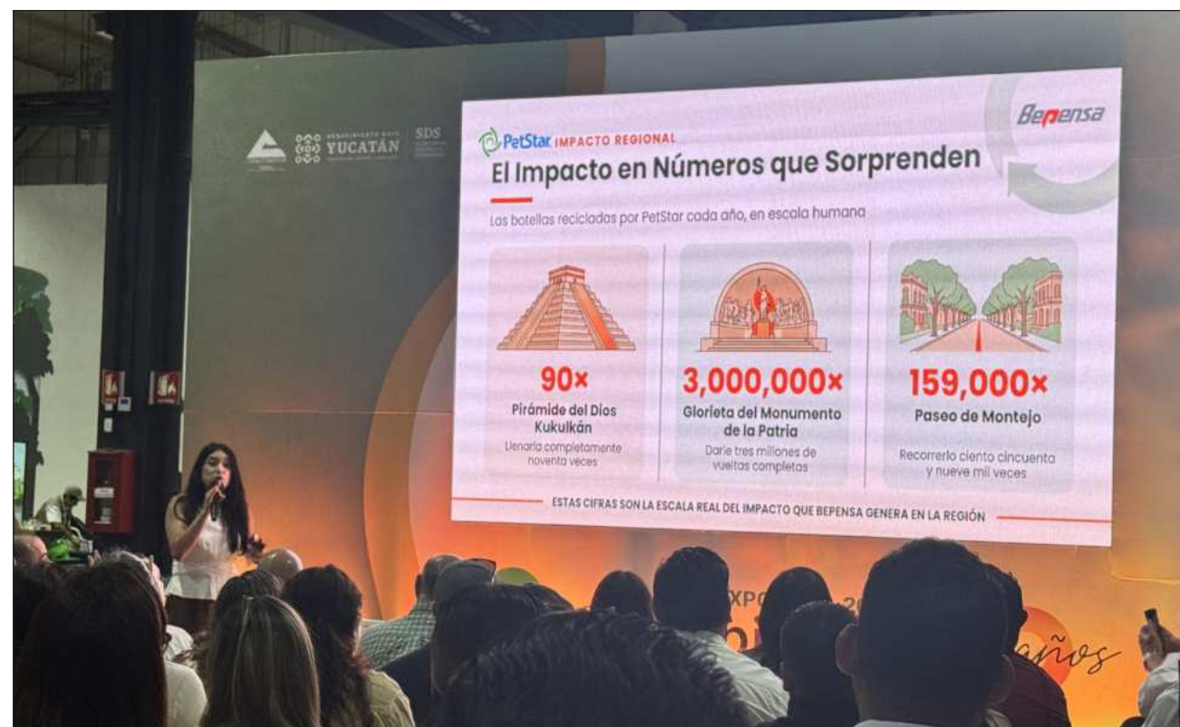
▲ Bepensa refrenda su compromiso de seguir impulsando iniciativas que conecten a empresas, comunidades, ciudadanía y aliados para convertir los retos ambientales en oportunidades de colaboración.

Asimismo, a través de Nergic, empresa de la división Motriz de Grupo Bepensa especializada en energías renovables y soluciones sustentables, se presentaron alternativas de energía solar para la industria, el comer-