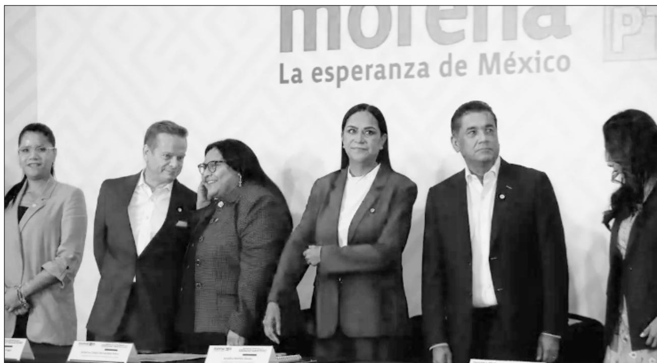
▲ La distancia entre la capital y Aguascalientes, Baja California, Baja California sur y Campeche no ha sido obstáculo para que por momentos los registros de aspirantes se convirtieran en mítines políticos.

Al World Trade Center de la Ciudad de México acudieron ayer, según el cronograma, los aspirantes de Aguascalientes, Baja California, Baja California Sur y Campeche. “Se ha diseñado un proceso muy organizado,