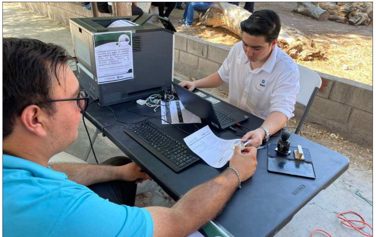
▲ La atención se brinda desde este lunes 22 a jueves 25 en un horario de 9 a 17 horas; mientras que el viernes 26 de junio el horario será de 9 a 15 horas. Los interesados podrán inscribirse al RFC, generar o renovar firma electrónica, CSF y orientación fiscal.

La atención se brindará de lunes 22 a jueves 25 en un horario de 9 a 17 horas; mientras que el viernes 26 de junio el horario será de 9 a 15 horas. Las personas interesadas podrán solicitar los siguientes trámites: inscripción al RFC,