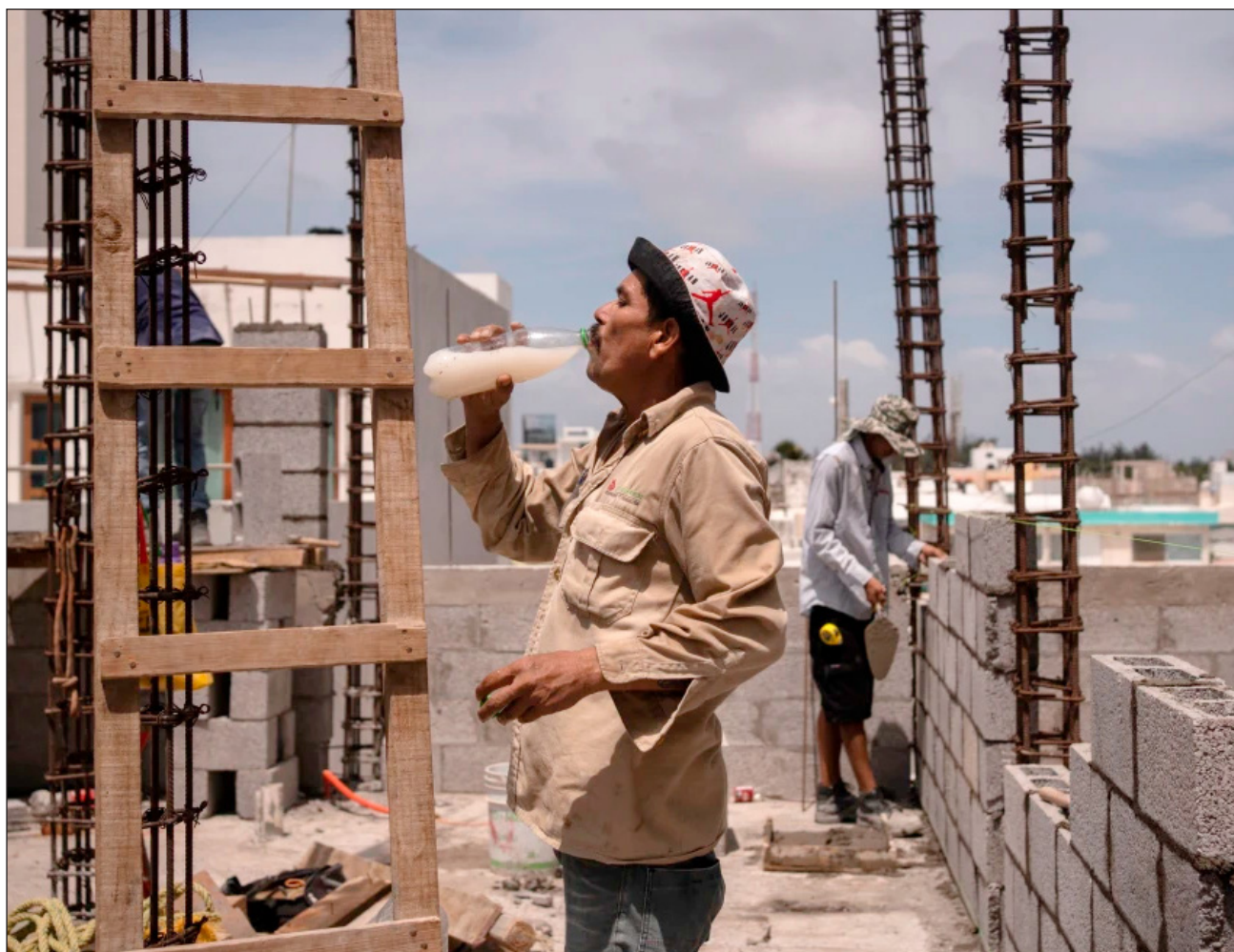
▲ Entre los lugares que podrían registrar alrededor de 50 días más al año de al menos estrés térmico fuerte en comparación con la década de 1970 figuran partes del África austral, África oriental, así como partes de México y Centroamérica.

La autora principal del estudio, Rebecca Emerton, también científica sénior del Centro Europeo de Pronósticos Meteorológicos, manifestó que fue llamativo “ver que el estrés térmico no sólo se intensifica en esos lugares que ya consideramos calurosos sino ver lo que llamamos una huella en expansión del estrés térmico, que se extiende a regiones donde históricamente ha sido raro”.