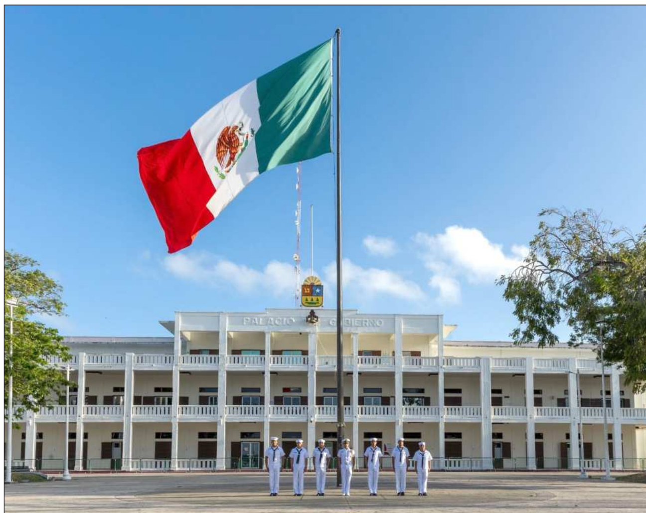
▲ Por segunda noche consecutiva, elementos de la Dirección de Cobranza y Fiscalización del ayuntamiento de Playa del Carmen, Guardia Nacional, Marina, Defensa Nacional, Policía Estatal y Turística, Gepse, Unidad K-9, Protección Civil y Tránsito Municipal, inspeccionaron ocho establecimientos.

Actualmente, 15 jóvenes ya se encuentran activos en siete dependencias estratégicas, y se espera que en breve se incorporen quince más para fortalecer estas brigadas de fiscalización social. “Vamos a incorporar a 15 más porque vamos a estar trabajando sobre todo en estar cuidando todo este proceso”, acotó.