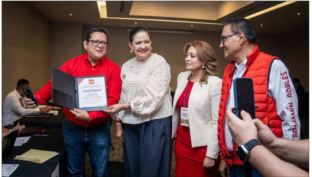
▲ El sobrino de la gobernadora se registró como contendiente en CDMX, siendo un enviado del PT.