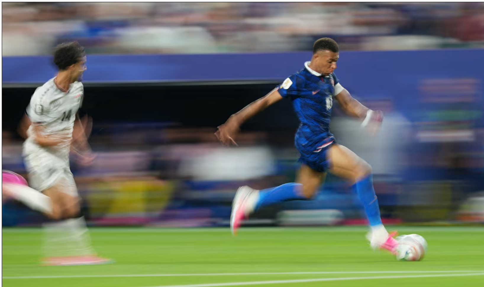
▲ El delantero de 18 años llegó barriéndose a segundo palo para empujar el balón al fondo de las redes tras un centro raso para abrir el marcador.