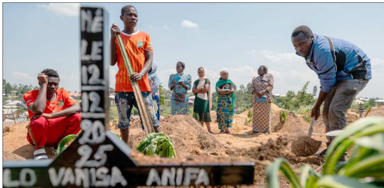
▲ La tasa de letalidad se sitúa en 25.3 por ciento, según el último informe publicado a última hora del domingo por el Ministerio de Comunicación y Medios sobre la epidemia, con datos recopilados hasta el 20 de junio.

“Se ha superado la barrera de los mil casos confirmados. A pesar de este avance, los equipos de respuesta continúan activamente las investigaciones, la vigilancia epidemiológica y las acciones