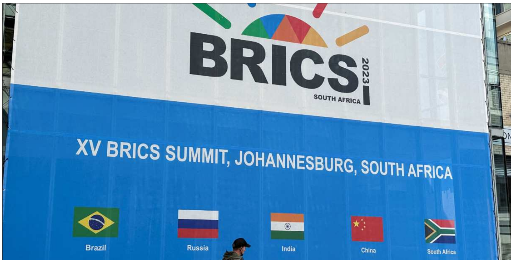
▲ Entre los tres países se han deshecho de 187 mil 407 mdd en deuda del gobierno estadounidense, cuyo total asciende a 39 billones de dólares.