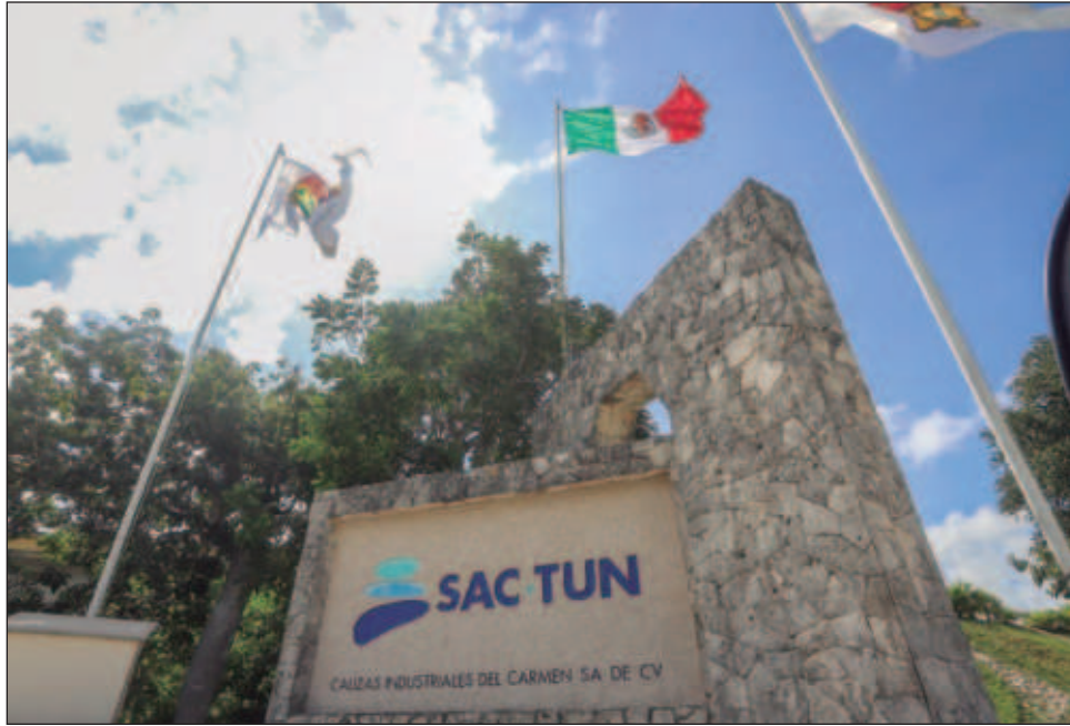
▲ “No queremos traer inversión a cualquier precio”, respondió el presidente López Obrador a las declaraciones del secretario de Estado de EU, Antony Blinken, quien dijo que el trato dado a Sac-Tun “no es una buena forma de atraer inversiones”.

En su conferencia matutina de este miércoles 22 de mayo, cuestionado sobre el juicio que la empresa Vulcan Materials Company mantiene contra el gobierno mexicano y las recientes declaraciones del secretario de Estado de Estados Unidos, Antony Blinken, quien en una visita al Poder Legislativo de su país dijo que el trato dado a Sac-Tun “no es una buena forma de atraer inversiones”, el Presidente aclaró que no se trata de una expropiación.