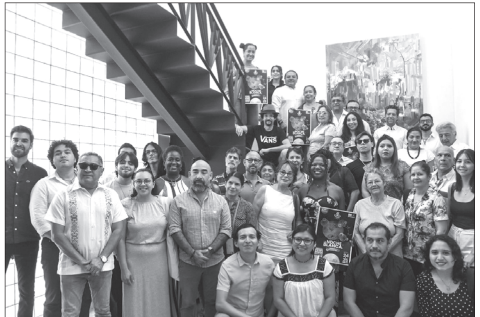
▲ Un total de 32 galerías de Mérida mostrarán la riqueza que ofrece el arte, a las que suman actividades de movilidad y charlas de aprendizaje.

En la Víspera de La Noche Blanca , participarán 32