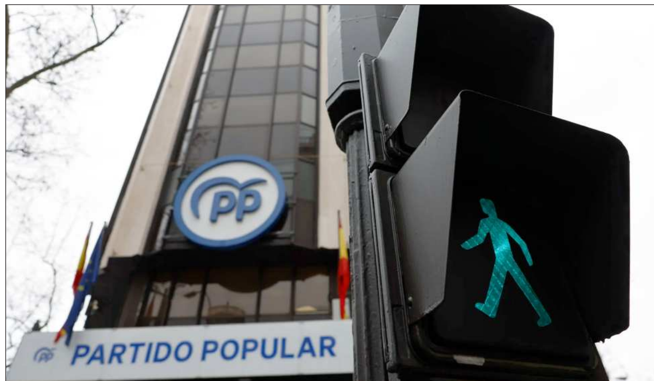
▲ Vox y PP se unieron en 2023, pero en 2024 Vox se retiró por reparto de inmigrantes menores de edad irregulares.

El Ejecutivo rechaza sobre todo que el pacto extremeño prevea la "prioridad nacional" para las prestaciones sociales, es decir, que se priorice a los locales sobre los que vienen de afuera, lo