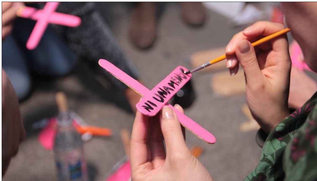
▲ La minuta promovida por la presidenta Claudia Sheinbaum considera reformar el artículo 73 de la Constitución para establecer un tipo penal, sanciones y criterios homogéneos en todo el país para combatir este delito.

Zhazil Méndez (PAN) señaló que nombrar y tipificar el femicidio no es igual que atender o proteger a la mu-