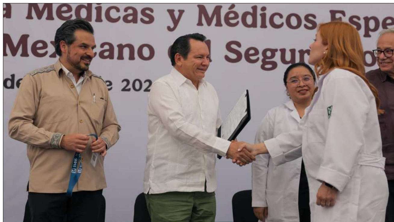
▲ En el CIC y ante la presencia del director general del IMSS, Zoé Robledo, el mandatario estatal afirmó que la incorporación ampliará la cobertura en especialidades como medicina interna, cirugía, ginecología y pediatría.

Joaquín Díaz Mena destacó que “este 2026 es el año de la salud en Yucatán”