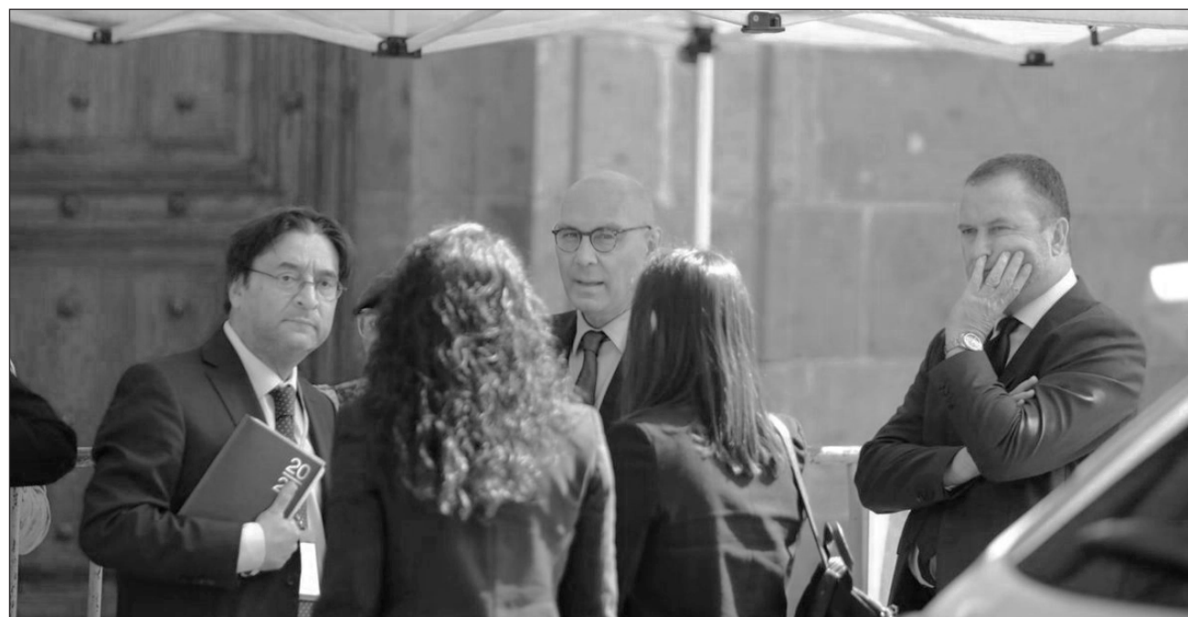
▲ Volker Türk subrayó que durante sus días de trabajo en México, la impunidad fue un problema mencionado reiteradamente en el diálogo con las víctimas y colectivos de familiares de personas desaparecidas y de otras violencias.

Al realizar un balance de las reuniones que tuvo con víctimas, señaló que las