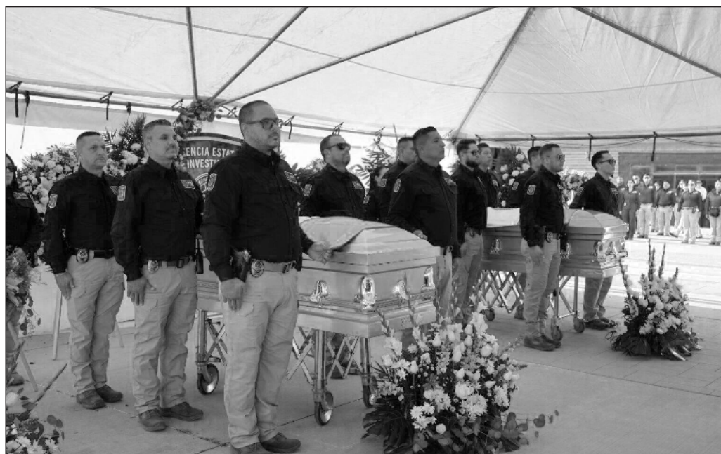
▲ Es necesario recordar que la convivencia entre agentes extranjeros y miembros de un gobierno o un organismo estatal a espaldas de la Federación transgrede la Ley de Seguridad Nacional.

Más allá de los detalles truculentos, lo central es que no se trata de un episodio aislado, sino que ocurre en el contexto de permanentes amenazas contra México por parte de Donald Trump y su equipo. Por ello, es obligado investigar si lo que dicen el rotativo estadounidense y otros medios es cierto, establecer las responsabilidades penales del fiscal Jáuregui y la gobernadora Campos, y reevaluar por completo la cooperación con Washington en materia de seguridad.