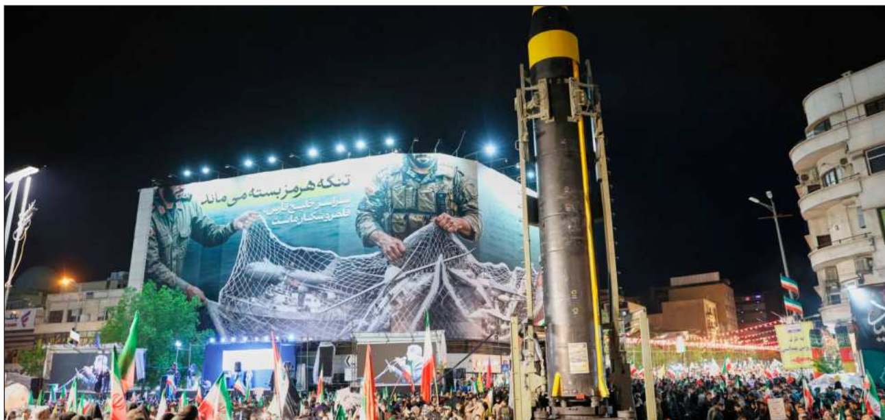
▲ En los hechos, el enfrentamiento entre EU e Irán ha estrangulado casi todas las exportaciones a través del estrecho.

Las fuerzas iraníes no violaron la tregua ya que las embarcaciones no eran de EU