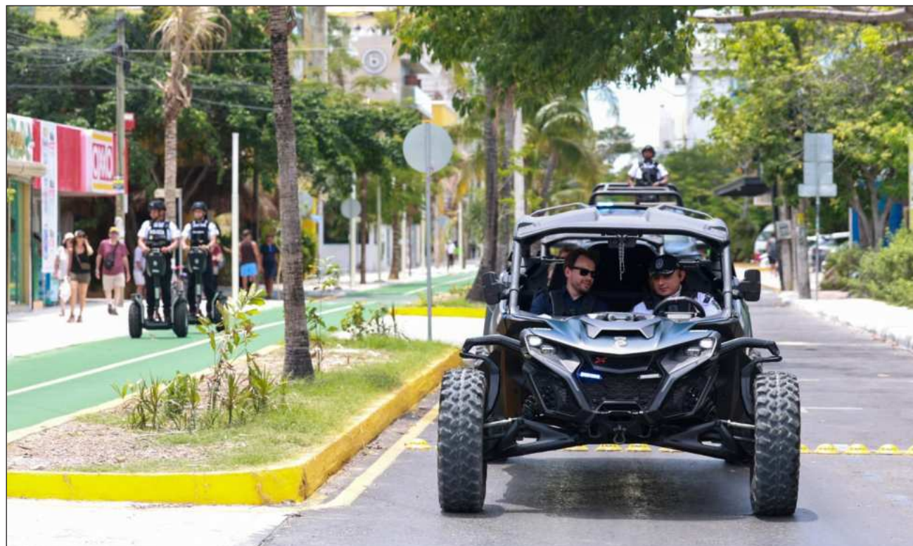
▲ La edil destacó que la disminución obedece al trabajo con el estado y la Federación.

“El compromiso es uno solo: la tranquilidad de cada familia”