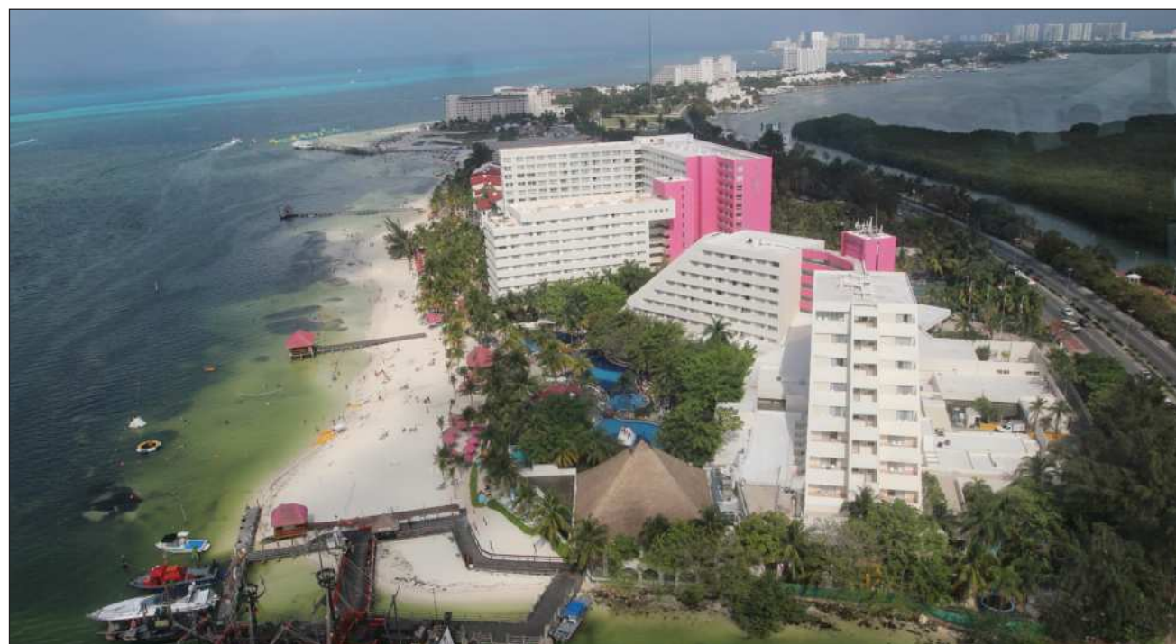
▲ Los hoteles galardonados generaron ahorros económicos por 3.5 millones de pesos.

Indicó que la industria turística en México, y específicamente en destinos de relevancia internacional como Cancún, enfrenta un desafío crítico ante el estrés hídrico que afecta a más del 70 por ciento del territorio nacional y en este escenario, la décima