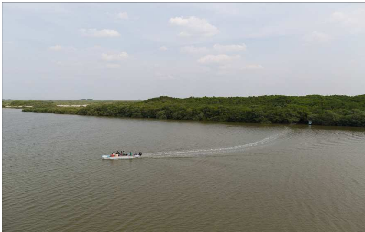
▲ “Cuando lo conocí, se llegaba en un alijo, palanqueando, y era un sitio apacible y umbrío. El Corchito se convirtió durante algún tiempo en un lugar bastante sucio, donde acudían grupos de personas diversas con el propósito común de montar fiestas ruidosas y etílicas al aire fresco”.

Tuve también la oportunidad de visitar de nuevo Dzibilchaltún. Las últimas veces que fui ahí antes de esta larga pausa, el sitio pugnaba por hacer visible su condición de área