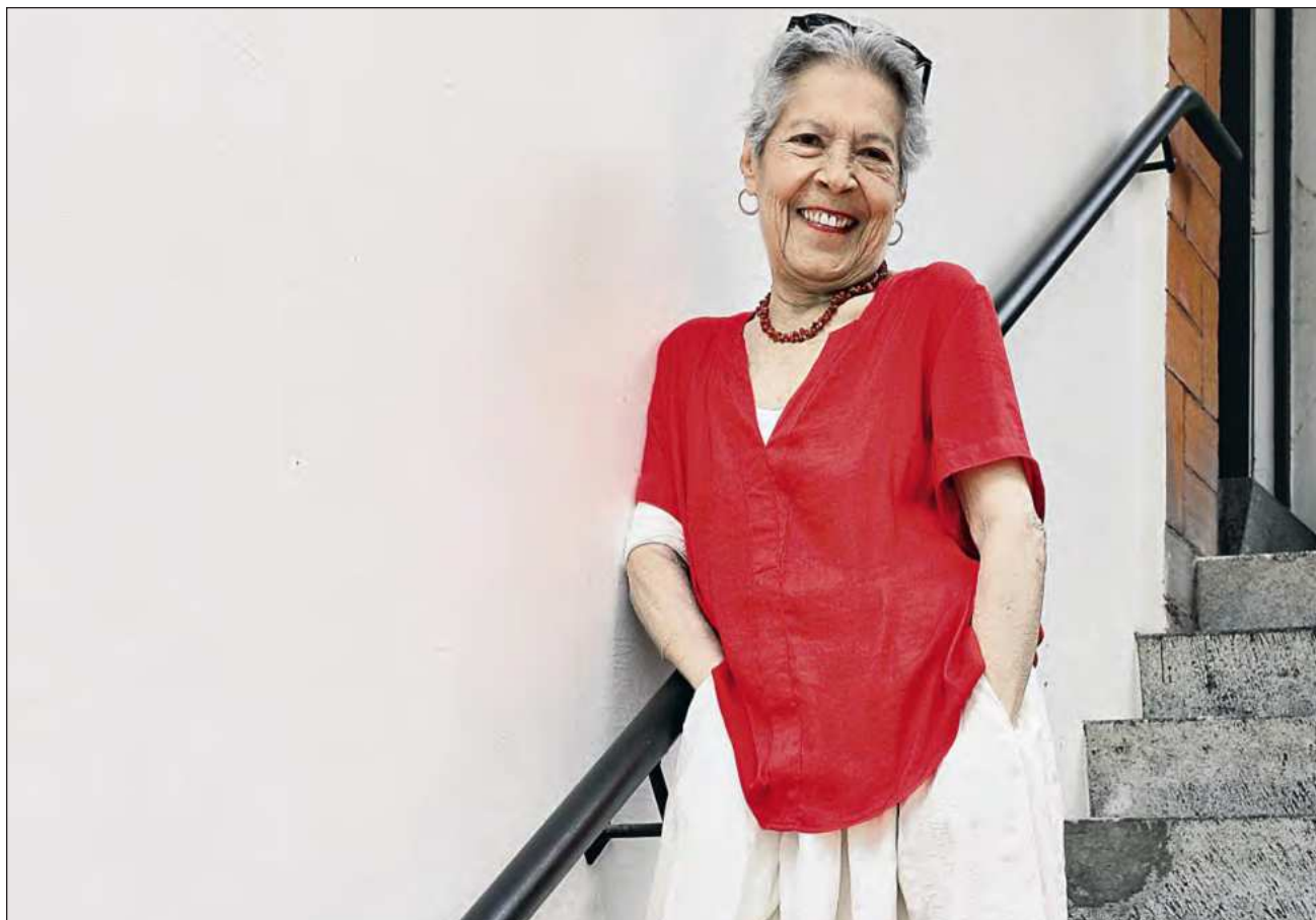
▲ Socióloga de formación, al cumplir 40 años González dijo: “quiero otro lenguaje para expresarme. Me metí a estudiar profesionalmente foto y me encantó. A esta fusión de mi mirada social, política, comprometida, se agrega este nuevo lenguaje de las imágenes”.

Escuchar el “clic, clic me produce mucha emoción. Ese es mi momento mágico de la fotografía. Llama en los ojos refleja mi deseo, mi imaginación y mi pasión”.