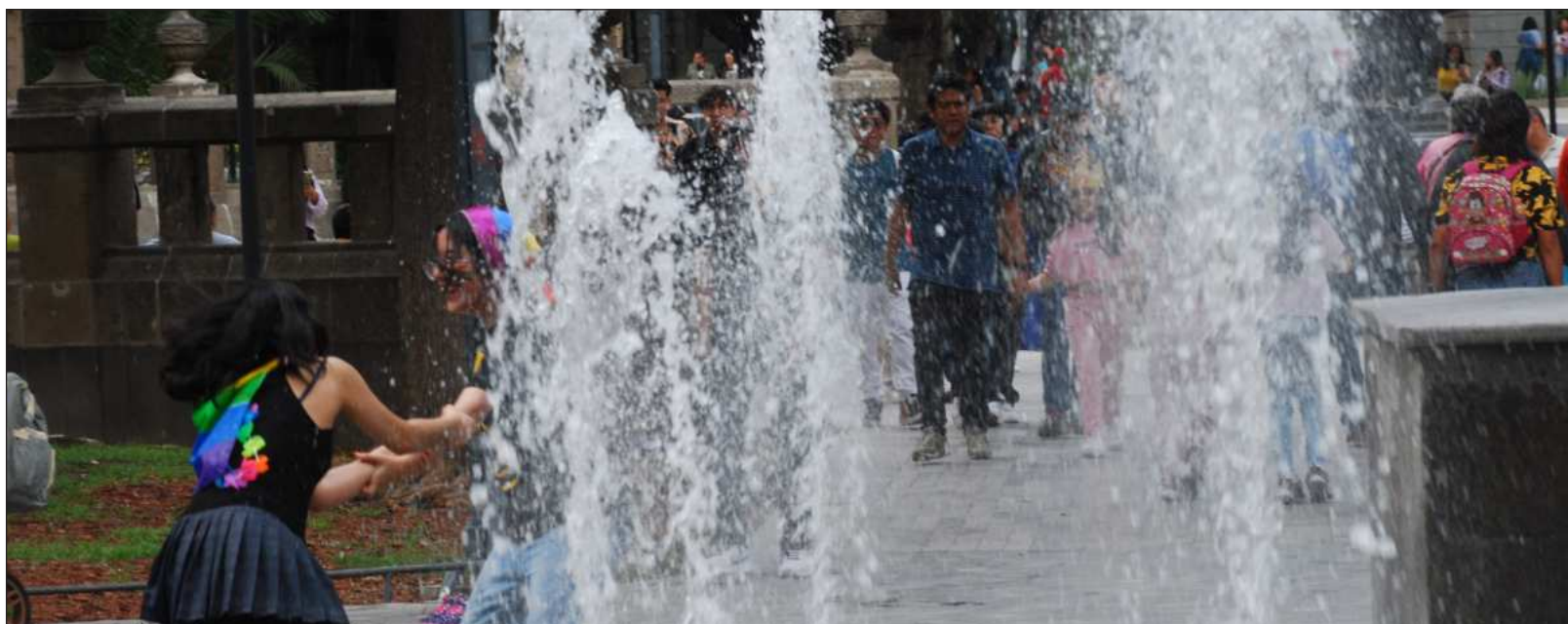
▲ “El mundo habla, la naturaleza nos enseña con la lluvia, el viento, el calor y el frío, se comunica con nosotros y apela a que le hablemos, a que reaccionemos ante sus demandas de amor y necesidad”.