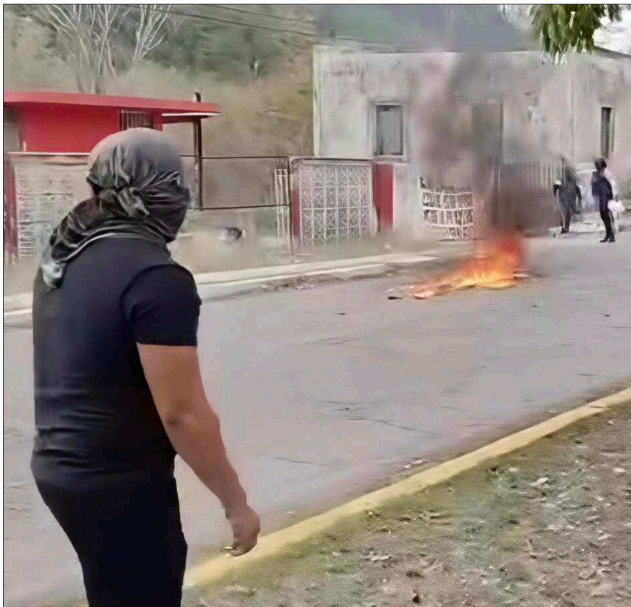
▲ Estudiantes exigieron a las autoridades realizar una reunión en el plantel para que observen sus necesidades.

Dijeron confiar en las autoridades, a quienes pidieron no descartar de tajo esta solicitud y petición, pues recalcaron que Bécál es un lugar ideal para el desarrollo.