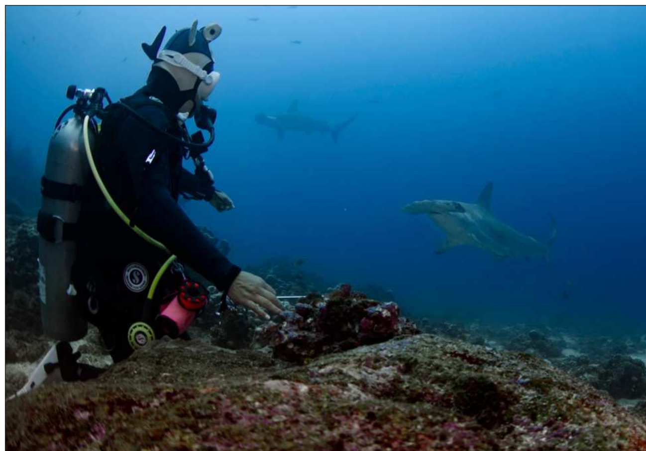
▲ La temperatura global de la atmósfera y del agua marina crecen con los conflictos actuales en Oriente Medio y Ucrania.

Cada fracción de grado de calentamiento puede suponer la aparición de fenómenos climáticos más