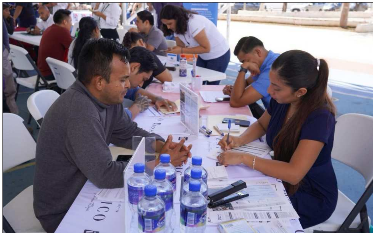
▲ El evento reunió a 11 empresas en el domo de la alcaldía de Puerto Aventuras.

El evento reunió a 11 empresas que ofertaron más de 300 vacantes dirigidas a la población local, reafirmando el compromiso de las autoridades de impulsar el desa-