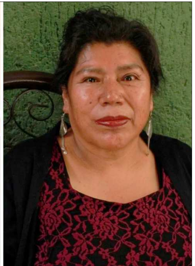
▲ Fotogramas del documental Estrella de Tlalpujahua, en mazahua yo cuidé , del realizador Alfredo Guzmán Cayetano (abajo izquierda), el cual fue un proyecto seleccionado de la octava convocatoria de estímulos del Instituto Mexicano de Cinematografía.