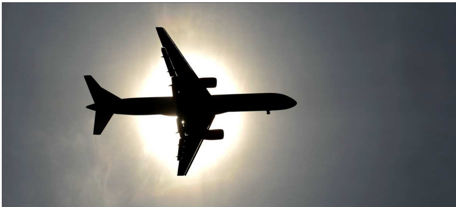
▲ "No hace falta talar selvas para que desaparezcan; solo basta ser anfitrión del Mundial de fútbol y recibir vuelos comerciales".