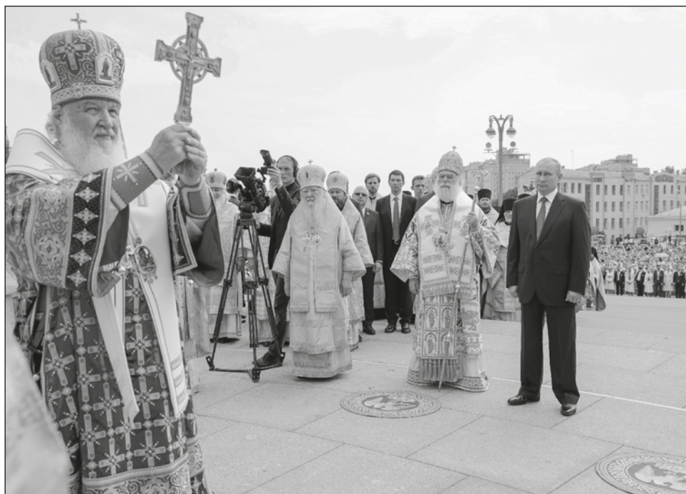
▲ Kirill sostuvo que la guerra no era culpa de las autoridades rusas y que la raíz del conflicto son amenazas provenientes del exterior, tanto políticas como religiosas.

Destacó que el patriarca ecuménico de Constantinopla en el 2019 reconoció formalmente la independencia de la Iglesia Ortodoxa de Ucrania, un país que el patriarcado de Moscú considera bajo su jurisdicción. El patriarca ecuménico, con sede en Turquía, es considerado “primero entre iguales”