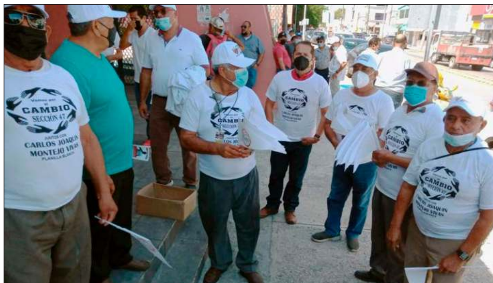
▲ Los simpatizantes de la planilla blanca iniciaron proselitismo en las Terminales Aérea y Marítima de Pemex.