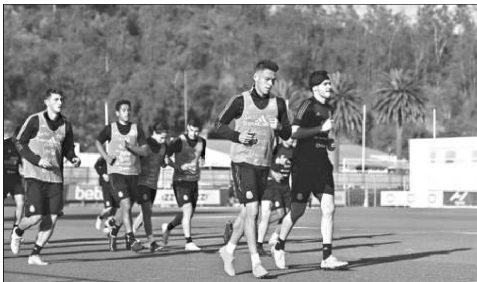
▲ El Tricolor recibe mañana a Estados Unidos, que se impuso en los últimos enfrentamientos entre los acérrimos rivales.