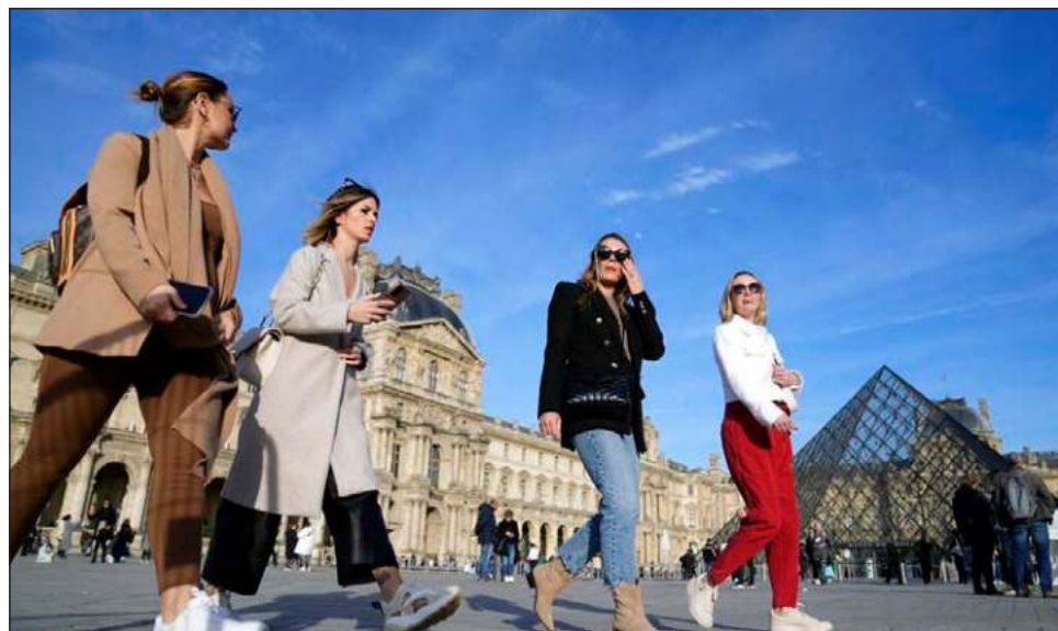
▲ La quinta ola observada en el Viejo Continente aún no ha terminado.

“Los países en los que observamos un aumento particular son el Reino Unido, Irlanda, Grecia, Chipre, Francia, Italia y Alemania”, dijo Kluge. “Estos países han