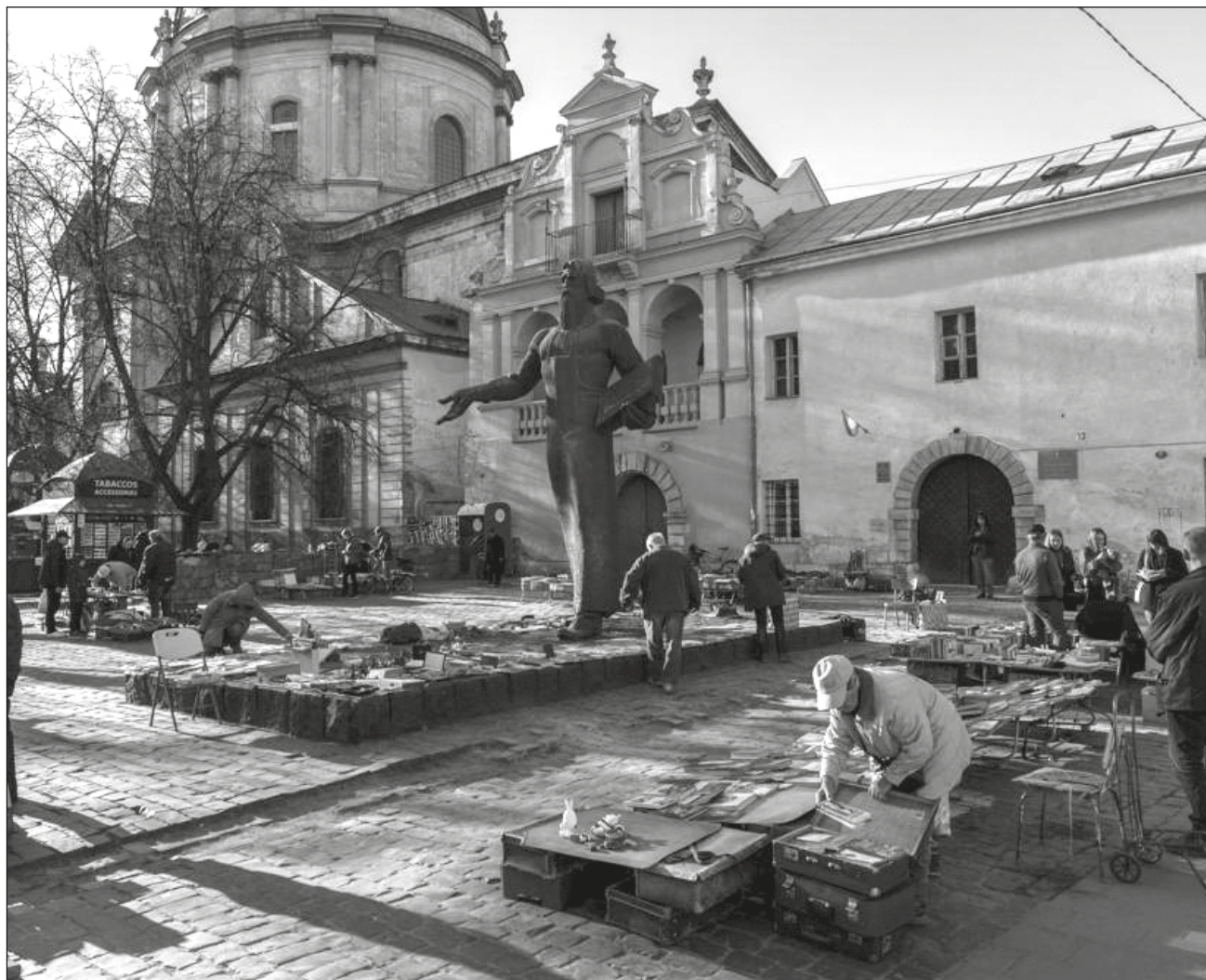
▲ El presidente ucraniano afirmó que las negociaciones con Rusia son difíciles y a veces "escandalosas".

Zelenski emitió un video divulgado por la presidencia ucraniana en el que se fijó sobre todo en la situación de Mariúpol, en el sureste del país, donde dijo que "a día de hoy, hay unas cien mil personas en la ciudad en condiciones inhumanas, en un bloqueo completo sin comida, sin agua, sin medicinas, bajo constante bombardeo".