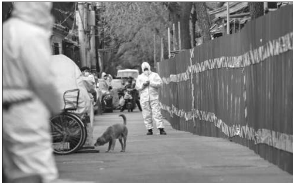
▲ China se ha apresurado en las últimas semanas a erradicar los focos infecciosos con confinamientos focalizados y pruebas masivas.

Las autoridades de salud reportaron el martes 4 mil 770 nuevos casos en todo el