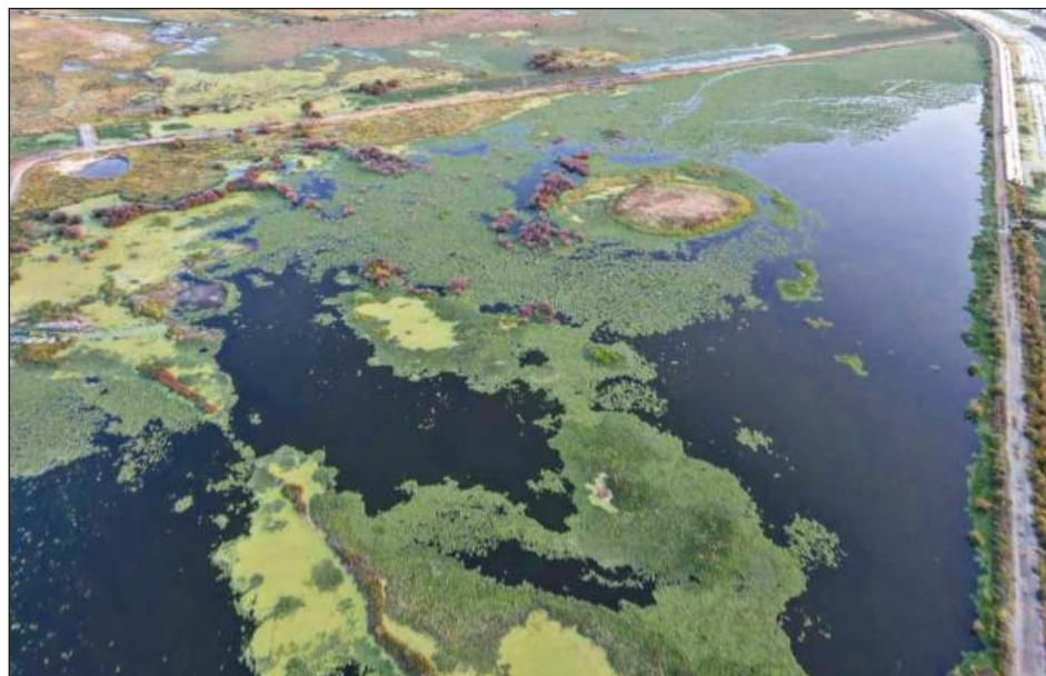
▲ El FPDT consideró que con la declaratoria de Área Natural Protegida del ex lago de Texcoco se le pone fin a un modelo de desecación y una forma de despojo que se había sistematizado en la región.

Esta Área de Protección de Recursos Naturales ubicada en el Estado de México abarca los municipios Atenco, Texcoco, Nezahualcóyotl, Chimalhuacán y Ecatepec, así como once núcleos agrarios.