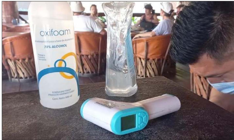
▲ El uso de mascarillas y gel antibacterial es requisito para dar servicio a los clientes.

“Nosotros no vamos a bajar la guardia, todos los empleados de acá vamos a seguir utilizando el cubrebocas para fortalecer las medidas de seguridad para nuestro personal y nuestros clientes”, sostuvo.