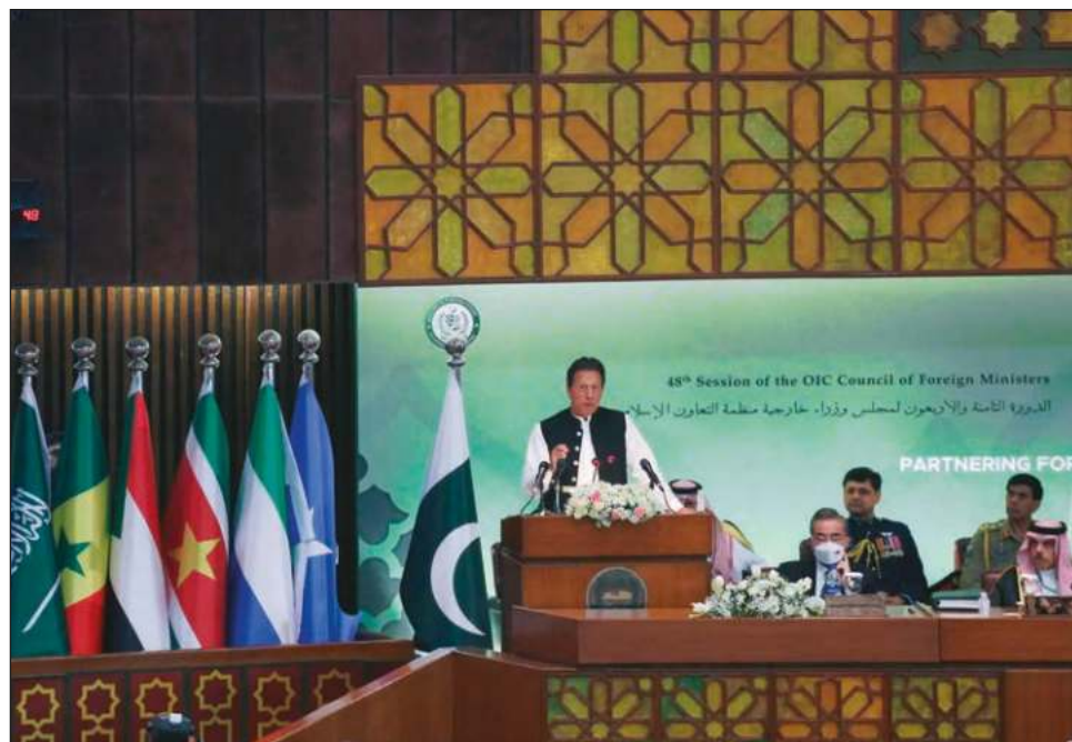
▲ Imran Khan intervino durante el consejo de Ministros de la OCI, que se celebra en Islamabad para plantear la postura ante el conflicto bélico.

En este sentido, el primer ministro paquistaní señaló que si la guerra entre Ucrania y Rusia se prolonga “tendrá grandes consecuencias para el resto del mundo”, y advirtió que si no se realizan