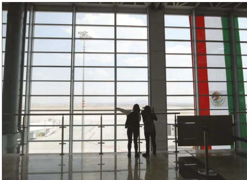
▲ Si fuesen honestos, quienes criticaron al AIFA hubiesen dicho "reconozco que me equivoqué", manifestó el Presidente en su conferencia de este martes.

"Eso es lo que estamos haciendo, y por eso no afecta el que haya debate y confrontación política. Yo les diría que es necesario,