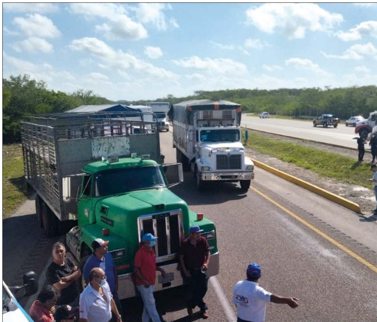
▲ La movilización formó parte de las manifestaciones simultáneas a nivel nacional, a la cual convocó la Amotac.

Pero no solamente hicieron exigencias dirigidas a las autoridades federales, sino también a la de Yucatán, pues apuntan que los cobros de impuestos y derechos en lo local también son excesivos y afectan su trabajo, en especial para operadores de carga.