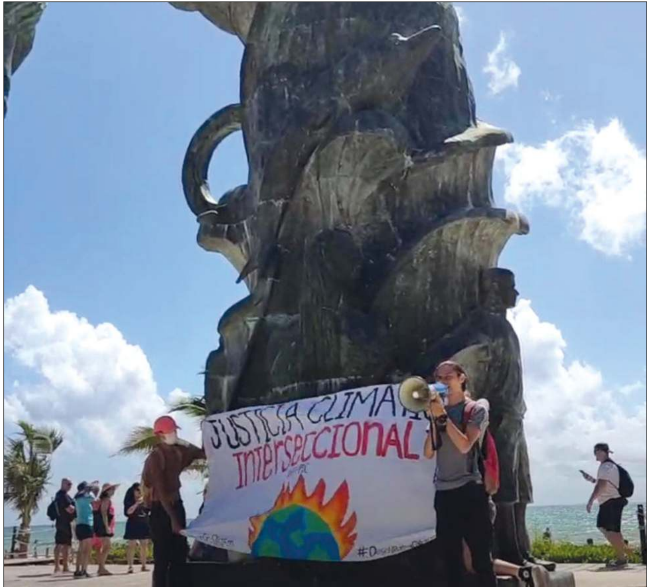
▲ El portal maya de Playa del Carmen fue escenario de una manifestación este martes.