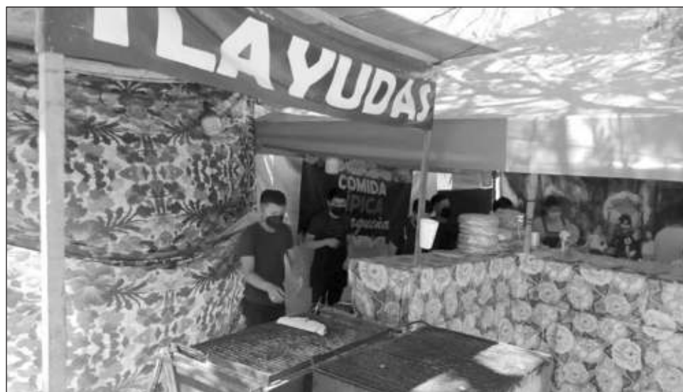
▲ Desde las 9 de la mañana hasta pasadas las 22 horas se podrá visitar la Feria; todos los días habrá presentaciones de actividades artísticas y culturales desde las 18 horas.

La oferta para esta ocasión no varía: tlayudas, tamales, chapulines, mezcales, helados, quesos y panes de fiesta. También habrá artesanías oaxaqueñas, ropa típica del estado; y desde luego, una