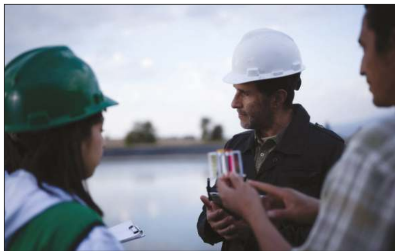
▲ De 2004 a 2019, Industria Mexicana de Coca-Cola aumentó la eficiencia del uso de agua en 30%.

En la península de Yucatán, Bepensa como parte de la Industria Mexicana de Coca-Cola, impulsa a