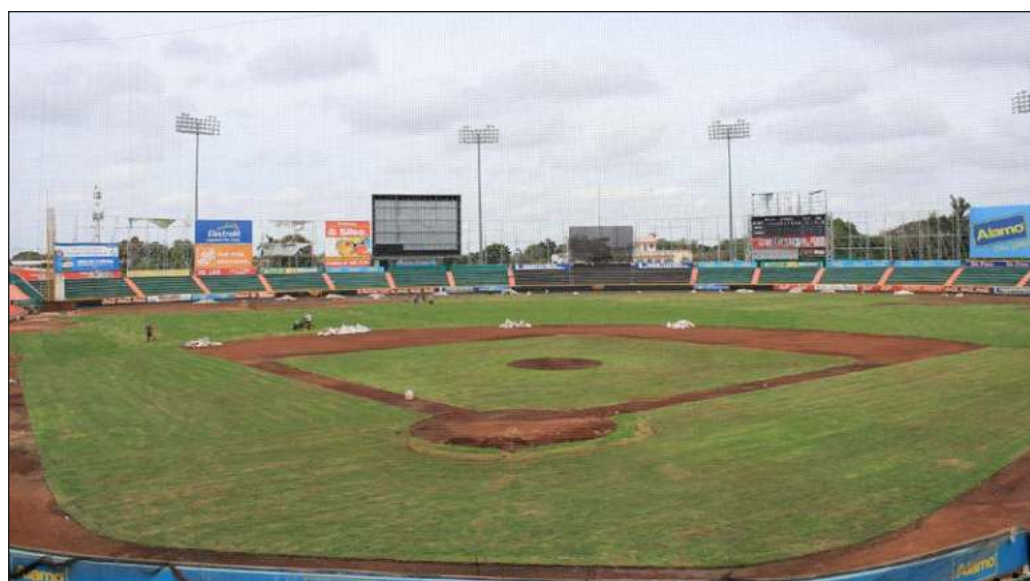
▲ El Kukulcán es un templo para una feligresía que ha sido testigo de varios cambios en el ambiente de la celebración, pero el fondo se mantiene.