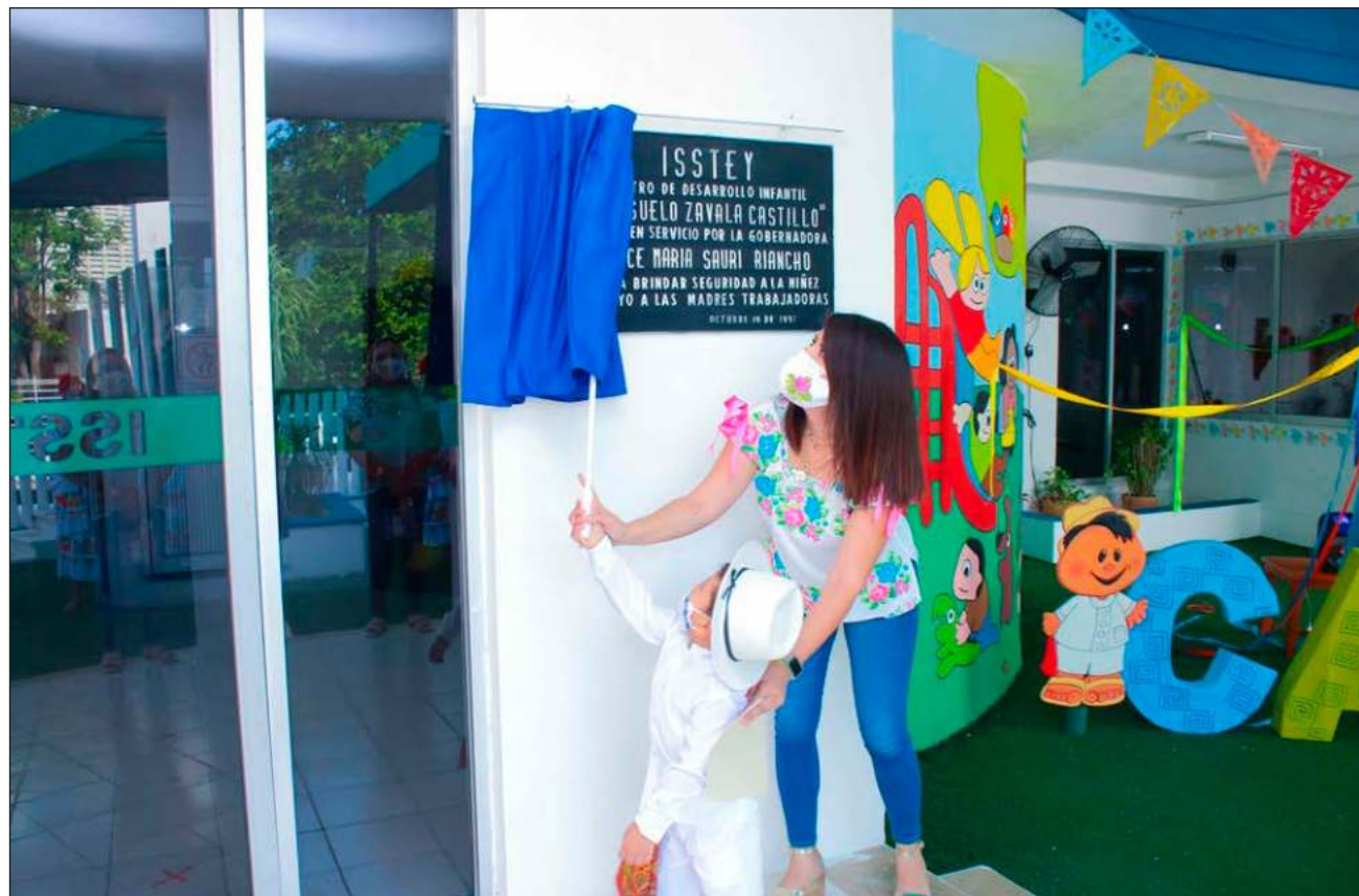
▲ Actualmente, la proyección de suficiencia del ISSTEY apenas llega a 2026, asumiendo que se apliquen al déficit de la institución todos los recursos financieros y se moneticen todos sus activos.

Bajo las condiciones actuales y con base en los estudios que se han hecho hasta el momento, se proyecta una suficiencia del ISSTEY hasta 2026, asumiendo que se apliquen al déficit todos