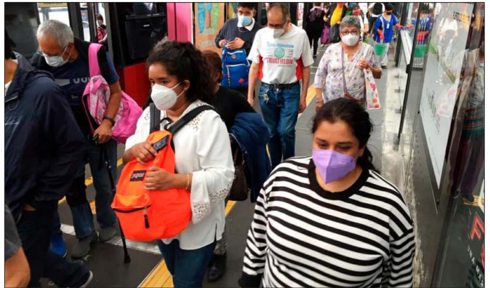
▲ A diferencia de los hombres, las mujeres suelen tomar trayectos más cortos o “encadenados”, al desplazarse de un punto A a un punto B con paradas durante el camino.

Para cambiar esto, recomendó integrar la perspectiva de género en todas las etapas de implementación de las políticas públicas de movilidad, aplicar estrategias de género transversales en las instituciones del sector de transporte, mejorar la infraestructura básica con espacios iluminados y segu-