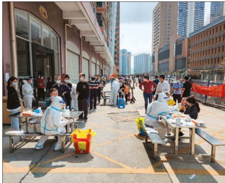
▲ Chinese government has announced the complete lockdown of Shenzhen, a major manufacturing center of 17 million people, for two weeks due to an outbreak of a new strain of Covid.

THIS ASPECT OF globalization will continue to be in the national interest of most countries although there is always the danger that actual or emerging leaders will continue to question science with "other information" which, although false, attracts the interest and support of vested interests. We can look no further to climate change for example.