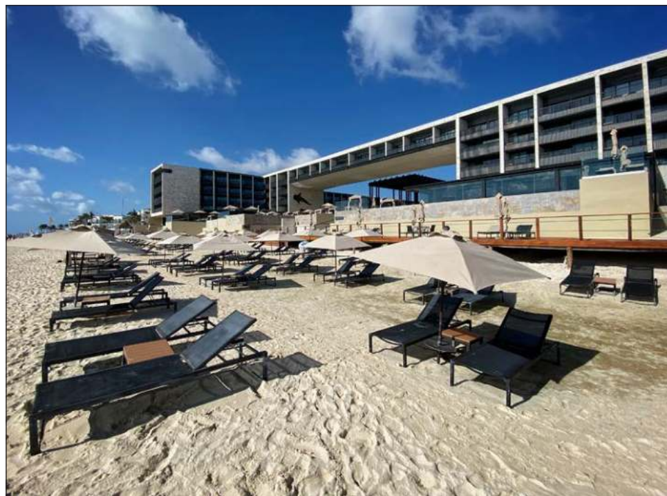
▲ Un centro de hospedaje de 500 habitaciones genera una huella de carbono de 8 mil toneladas al año.

“Aunque podrían parecer muchos años adelante, lo que los obliga es a que los hoteles piensen en estas estrategias”, dijo Ferreyra al acotar que en una cifra estimada, a partir de mediciones en varios hoteles, un centro de hospedaje de 500