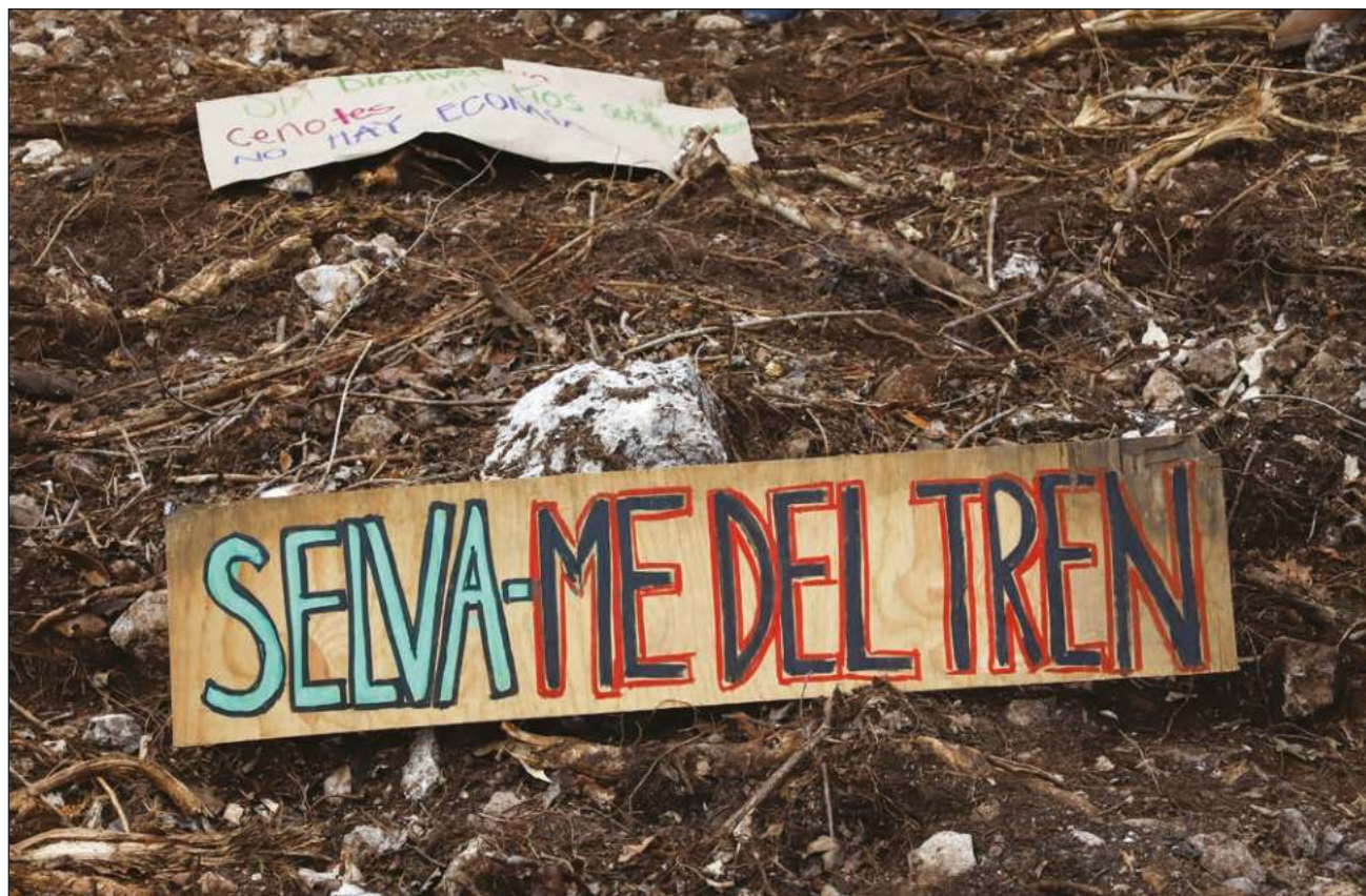
▲ Los convocantes a la campaña instaron a las autoridades federales a recorrer las cuevas, conocerlas y escuchar a los expertos en desarrollo sostenible.

Se hizo un recuento de los diversos cambios de ruta: el primero, cuando se anunció que pasaría por terrenos ya impactados (las torres de alta tensión de la CFE), luego por la carretera federal, igualmente un tramo ya impactado aunque con algunos derrumbes, “pero hace un mes de pronto cambiaron la ruta y por una razón que nadie comprende decidieron