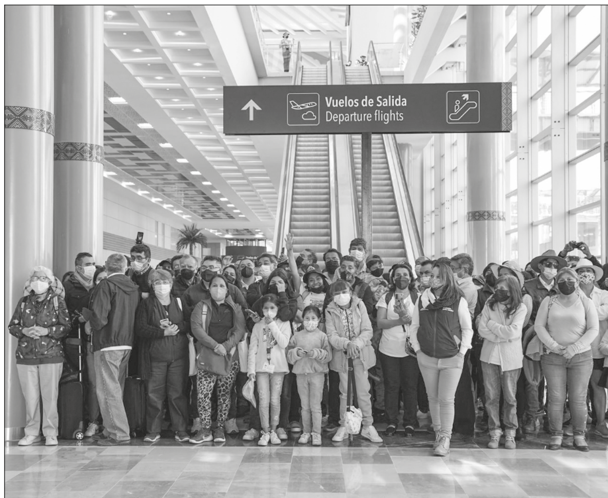
▲ El espíritu festivo que se disparó este lunes en el segmento solidario con la 4T tuvo como antecedente la decisión presidencial de cancelar el aeropuerto de Texcoco, una especie de quinazo a empresarios.

SOBRELLEVÓ LAS PRESIONES el Presidente recién estrenado, enviando señales disímolas a los empresarios sumamente desconcertados e irritados (ahí