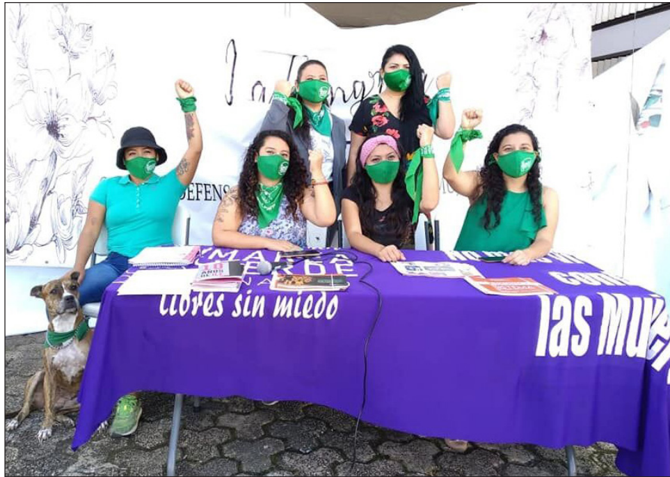
▲ Las integrantes de la RFQ responsabilizaron al Estado de impedir que escale la violencia.

Llamaron a las autoridades a tomar acciones en contra de quienes difundieron mensajes de odio y que criminalizan a las defensoras de derechos humanos; durante el fin de semana, grupos autodenominados “pro vida” repartieron panfletos en las