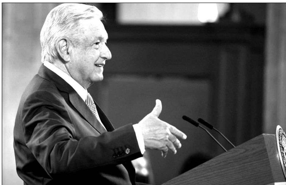
▲ En el extranjero ya no se habla de los escándalos de corrupción, subrayó López Obrador en su conferencia matutina, este lunes.

En una de sus respuestas también refirió el estado de