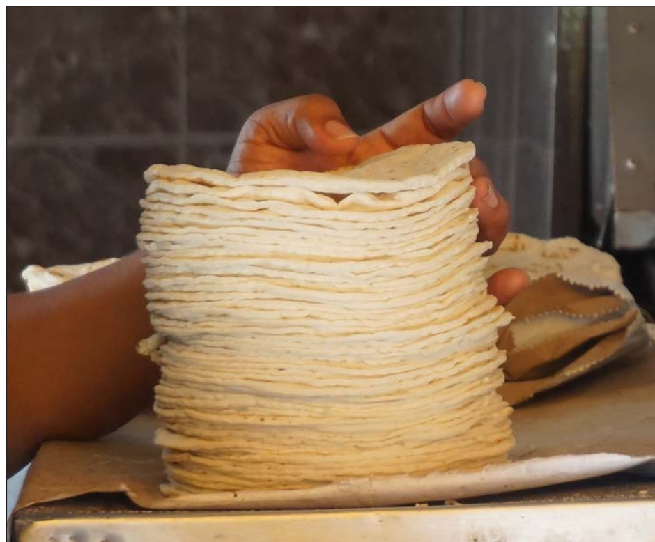
▲ El incremento de un peso por kilo de tortillas será absorbido por los consumidores finales, quienes tienen a este alimento dentro de la canasta básica.

Recordaron que tienen un permiso provisional acordado con el Ayuntamiento de Campeche para que cada molino y tortillería albergue a siete repartidores o mototortilleros, pero mencionaron que buscarán una reunión con la comuna para ampliar el registro de repartidores antes que comiencen con las re-