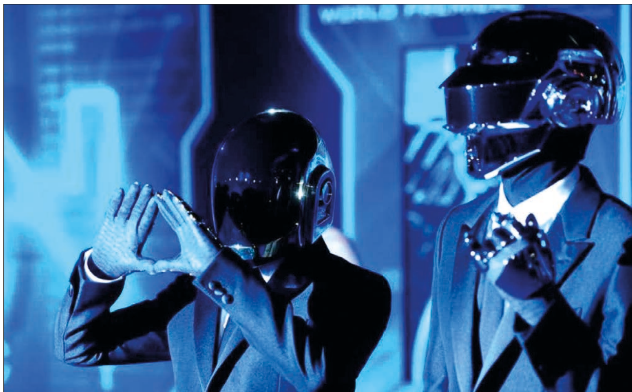
▲ El dueto francés deja una discografía de cuatro álbumes de estudio, tres extended play y otro material en directo y recopilatorio.

En 2001, el dúo francés lanzó Discovery , un álbum todavía más popular con canciones como One more time y Harder, better, faster, stronger .