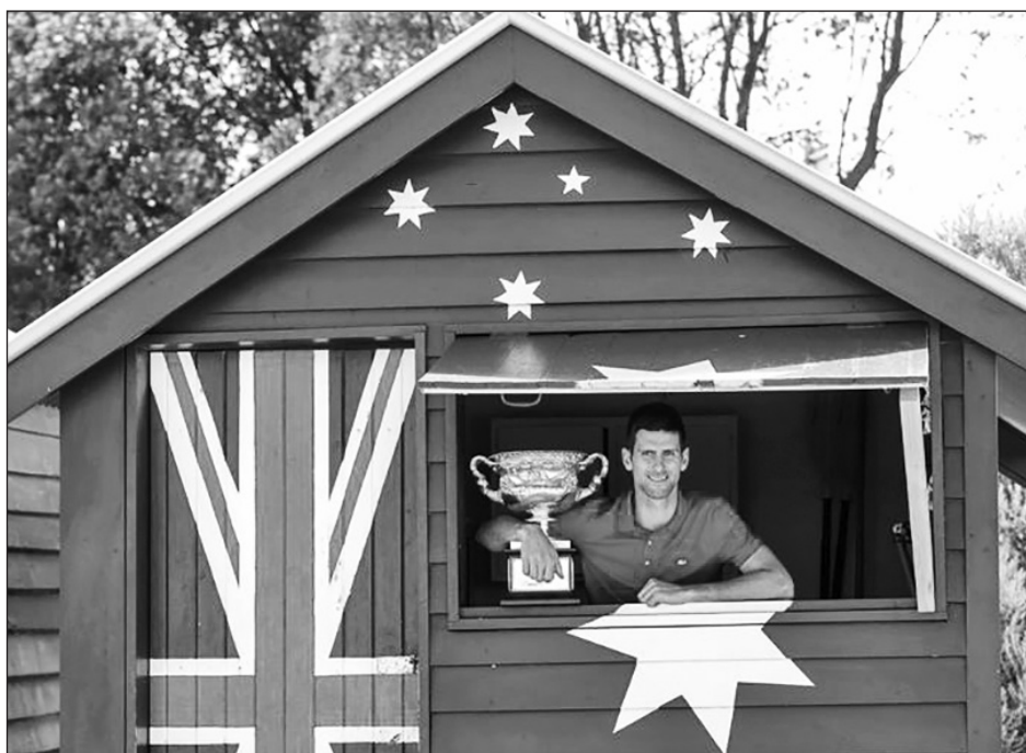
▲ Novak Djokovic, flamante monarca del Abierto de Australia.

Es algo que no se aparta de lo que el propio Federer