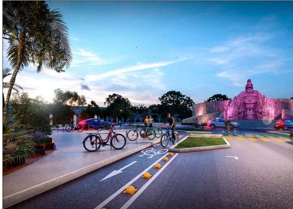
▲ Empresarios consideran que deben haber más espacios para estacionamiento de automóviles.

No obstante, el también dirigente del Consejo Empresarial Turístico de Yucatán (Cetur), aclaró que no están en contra de este proyecto en Paseo Montejo, sino que quieren que se haga sin