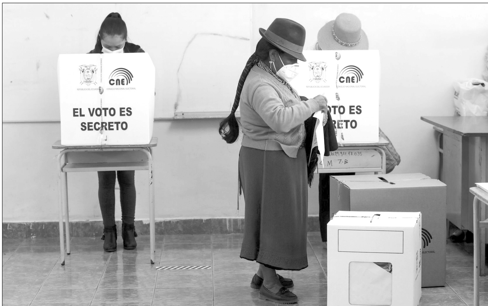
▲ En esta ocasión, las elecciones para la presidencia se vieron trastocadas por la pandemia.