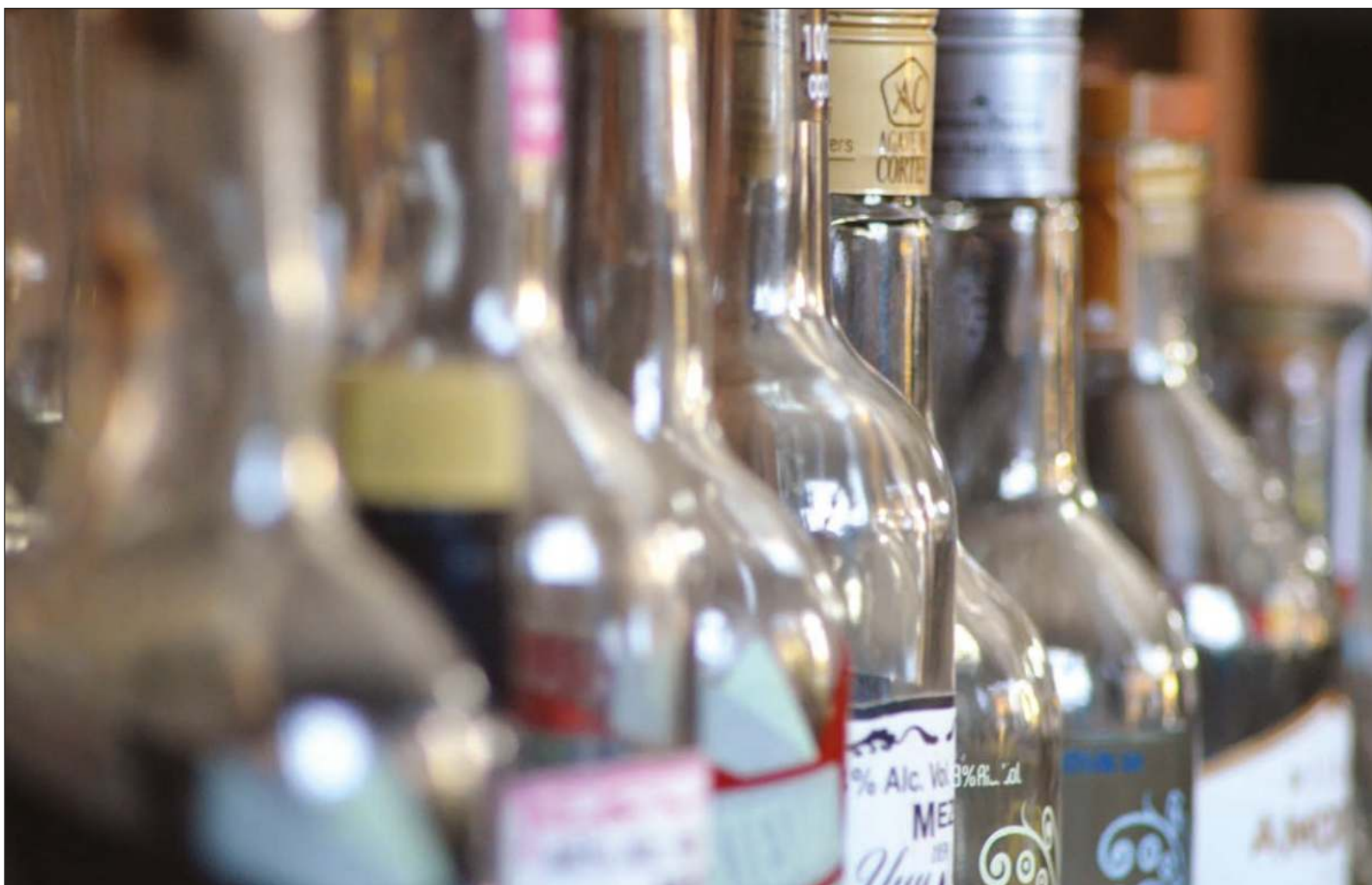
▲ El Diccionario de la Lengua Española nos dice del término campechano: "Natural de Campeche" y "Perteneiente o relativo a esta ciudad", aunque también se refiere a las mezclas de bebidas alcohólicas y como sinónimo de una persona agradable y divertida.