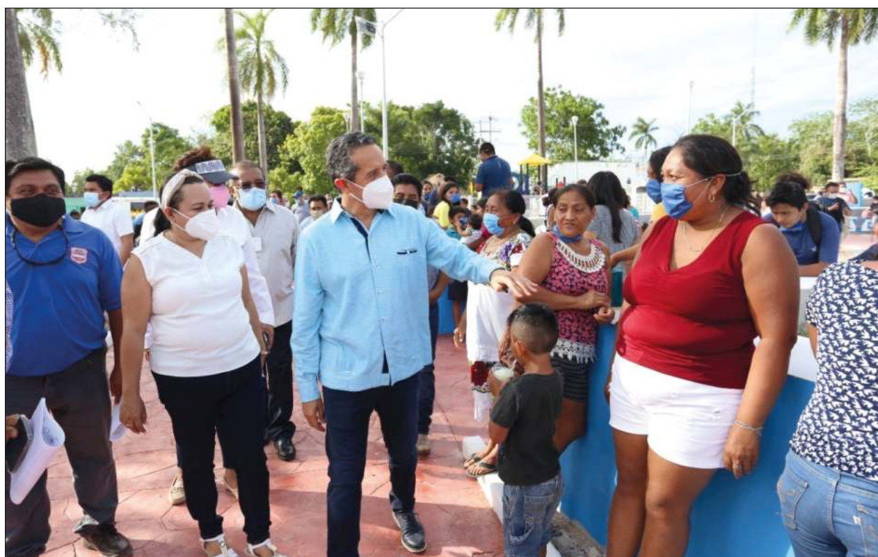
▲ Este gobierno logró que el delito de feminicidio se persiguiera por primera vez en la entidad con penas más severas.

“Es nuestra forma de trabajo, así le gusta trabajar a nuestro presidente, después de esta obra lo que sigue es la segunda etapa para concluir lo que es el drenaje y vamos a cumplir también los trabajos que quedaron pendientes, como conectar el agua potable, vamos a complementarlo para que pueda tener servicio, después de eso vamos a promover las pavimentaciones de esta colonia”, sostuvo.