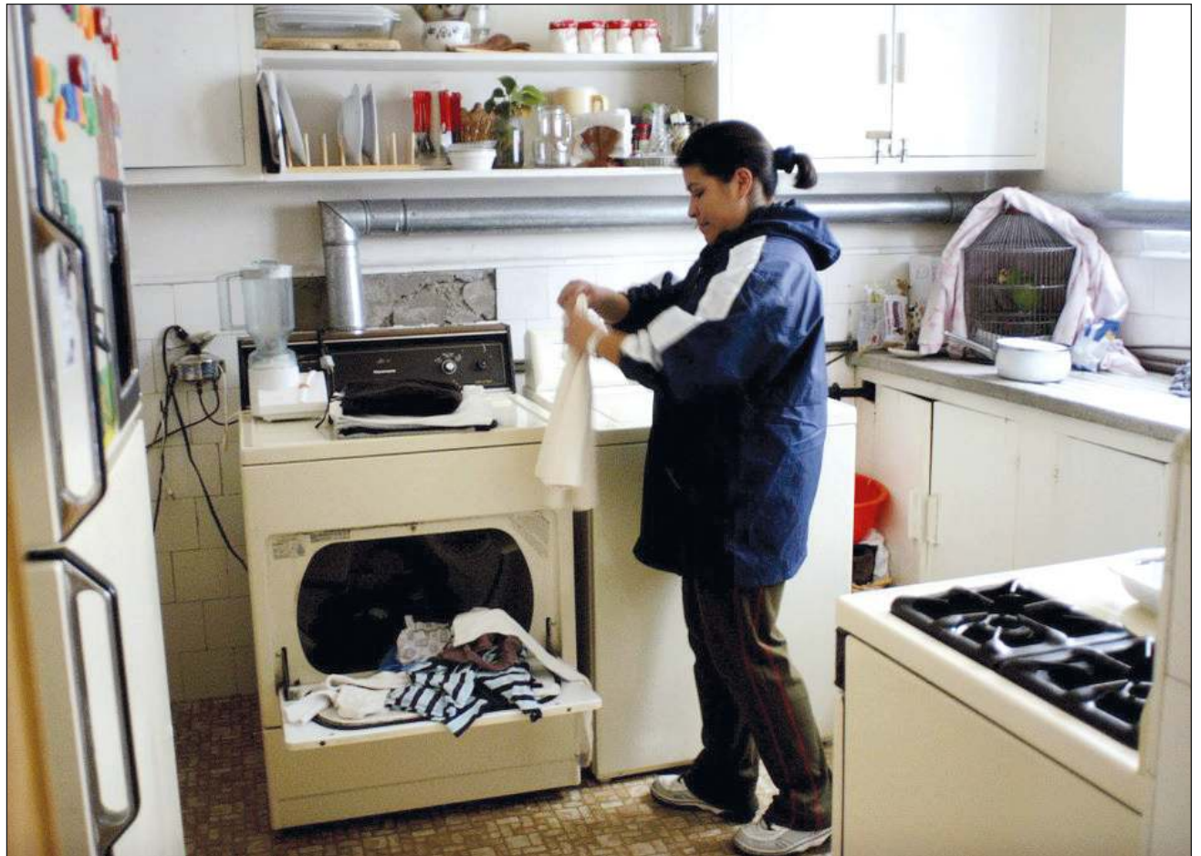
▲ Las trabajadoras del hogar, según el padrón de Jade Propuestas Sociales y Alternativas al Desarrollo , no cuentan con acceso a la información ni programas destinados a ellas.

Desde su visión, un primer paso es informar tanto a las trabajadoras como a los empleadores sobre sus derechos para hacerlos cumplir,