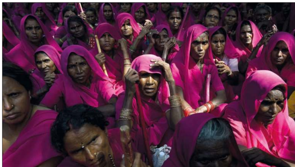
▲ El ejército del Sari Rosa, que hoy cuenta con más de 400 mil mujeres, es una fuerza contra la violencia en la India.