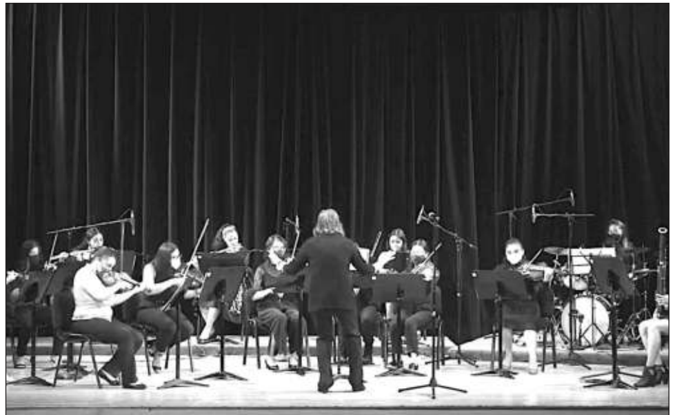
▲ La Orquesta de Mujeres Sofía Cancino es la primera en su tipo integrada por campechanas, y la primera también en toda la península de Yucatán.