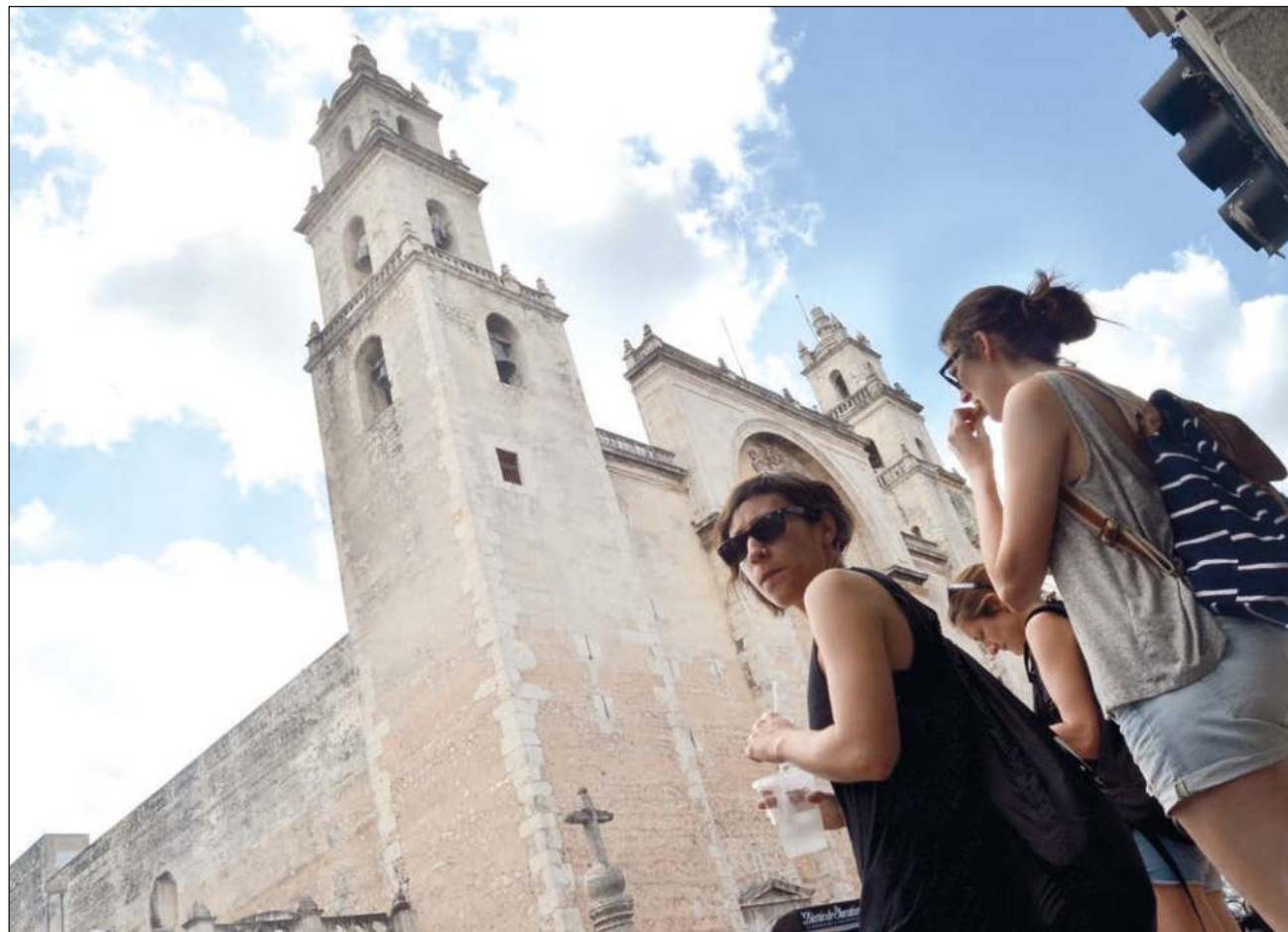
Uno de los cambios que realizó la plataforma de hospedaje Airbnb durante la pandemia, fue implementar la opción de fechas flexibles sobre cuánto tiempo le gustaría quedarse al viajero.