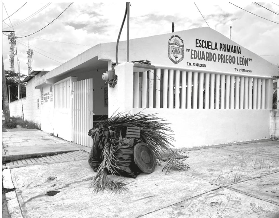
▲ Desde mitad de año a la fecha se han contabilizado 488 escuelas vandalizadas.

"Nos hacen falta un centenar más para fin de año,