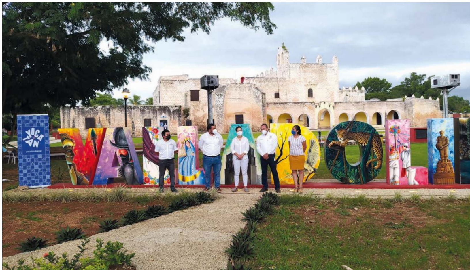
La zona oriente de Yucatán, como Valladolid, tiene una potencia turística que atrajo inversiones como las de Grupo Xcaret.

Anunció que Valladolid albergará un hospital dirigido a la demanda de extranjeros en la zona y plazas comerciales con firmas de marca internacional. 90 por ciento de los clientes son extranjeros.