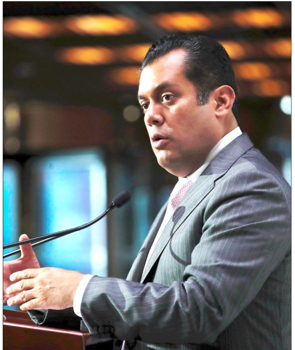
▲ El legislador de Morena explicó que se hará un llamado a los dueños de las compañías eléctricas para que participen en el debate.

También convocó a la participación de especialistas, empresarios, académicos y asociaciones civiles en su análisis.