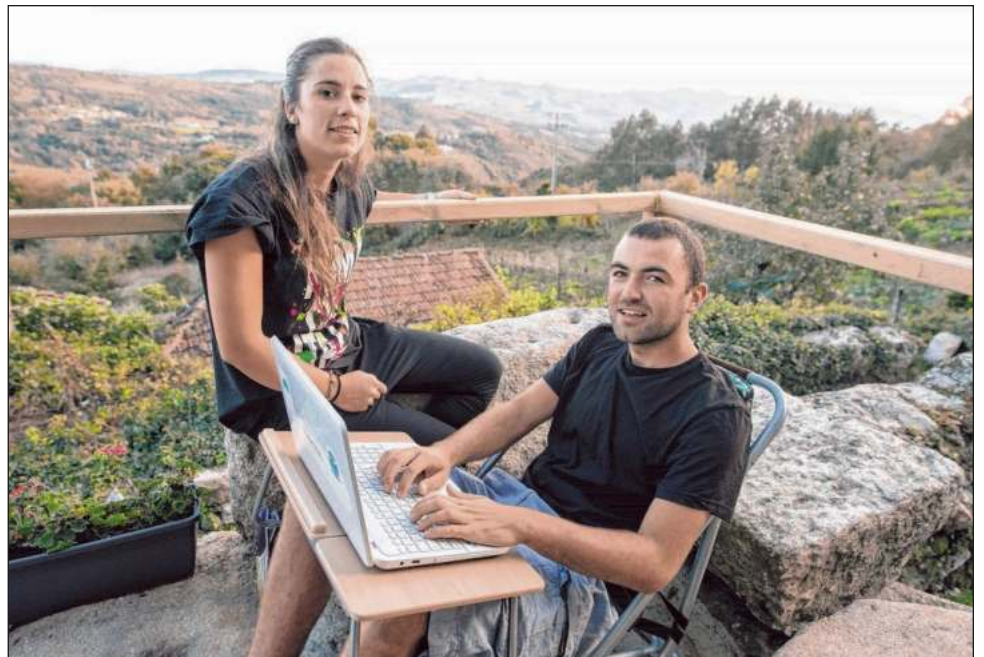
▲ U mola'ayil Airbnbe' tu beetaj k'áatchi' tu'ux chíikpaje', u 43 por siiento mexikoilo'obe' ku meyaj tu yotoch yéetel tu kúuchilil; u 87 por siientoil tu ya'alaje' u k'áat ka ts'a'abak u páajtalil u meyajo'ob uláak' tu'ux; 60 por siientoile' u k'áat ka yanak k'iinilo'ob ti'al u bin xiimbalo'ob. Úuchik u máan pak'be'en k'oja'anile' ya'abach ba'al jelpaj ti' bix suuka'an u yúuchul ka'achij.

Jiménez tu ya'alaje', ti' jump'éeel xaak'al beeta'abe', ila'ab ti' lajuntúul máake', bolontúul láayli' sajak u jóok'ol xiimbal tu yóok'lal pak'be'en k'oja'an.