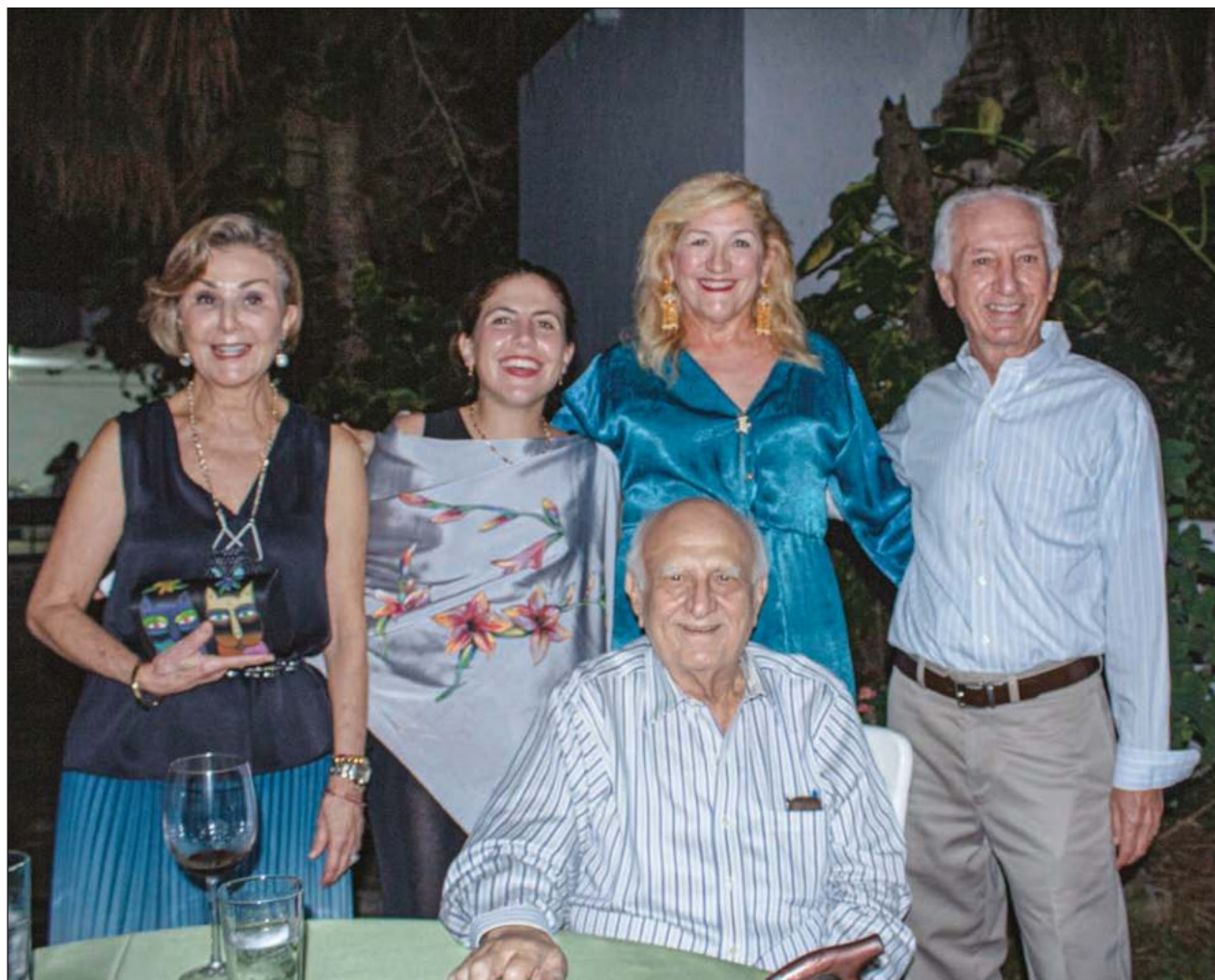
▲ Hace un cuarto de siglo que Calocho comenzó a capacitar a jóvenes para que pudieran pintar las obras, hoy en día siete continúan trabajando con él.

Desde allí, hace un cuarto de siglo, comenzó a capacitar a jóvenes para que pudieran pintar las obras, hoy en día siete continúan trabajando con él.