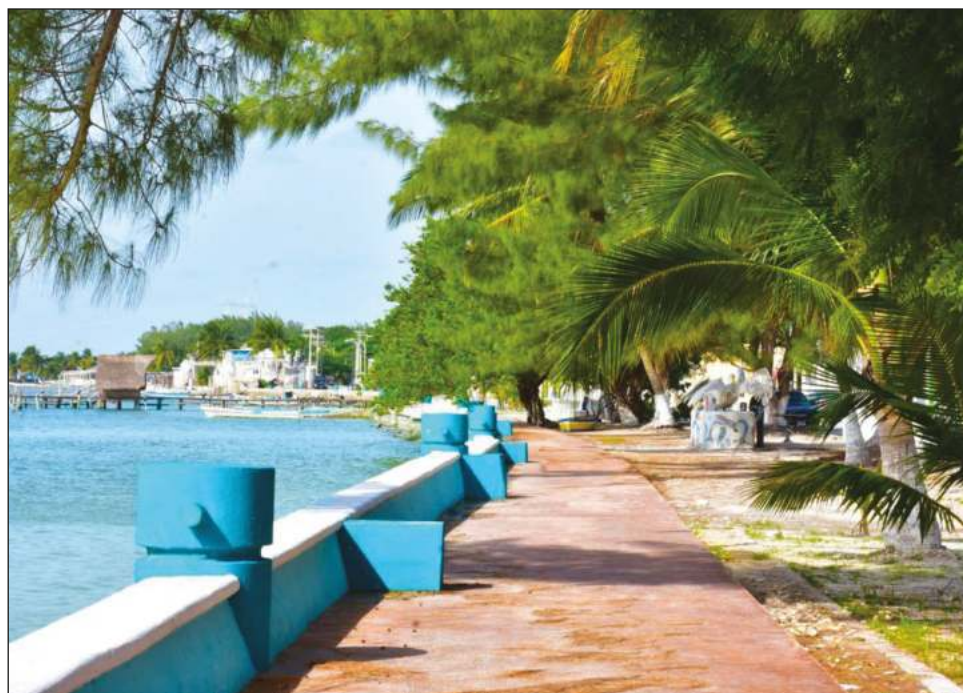
▲ A través de plataformas digitales promueven la riqueza natural de Isla Aguada y ofrecen actividades como avistamiento de aves y otros animales.

“Es grato ver que pese a la situación que se vive por la pandemia de Covid 19, la participación de visitantes