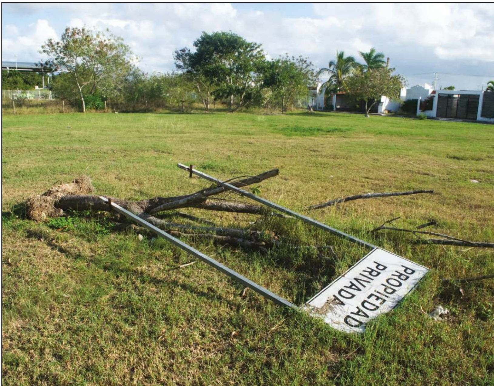
El comportamiento humano es un fenómeno que se reproduce en el mismo espacio a través del tiempo ▲

Después de una hora de caminata, me acerco a la Plaza Acrópolis, casi en la entrada del fraccionamiento, donde hace tres meses se inauguró una ventanilla municipal para trámites de Catastro, Finanzas y Desarrollo Urbano.