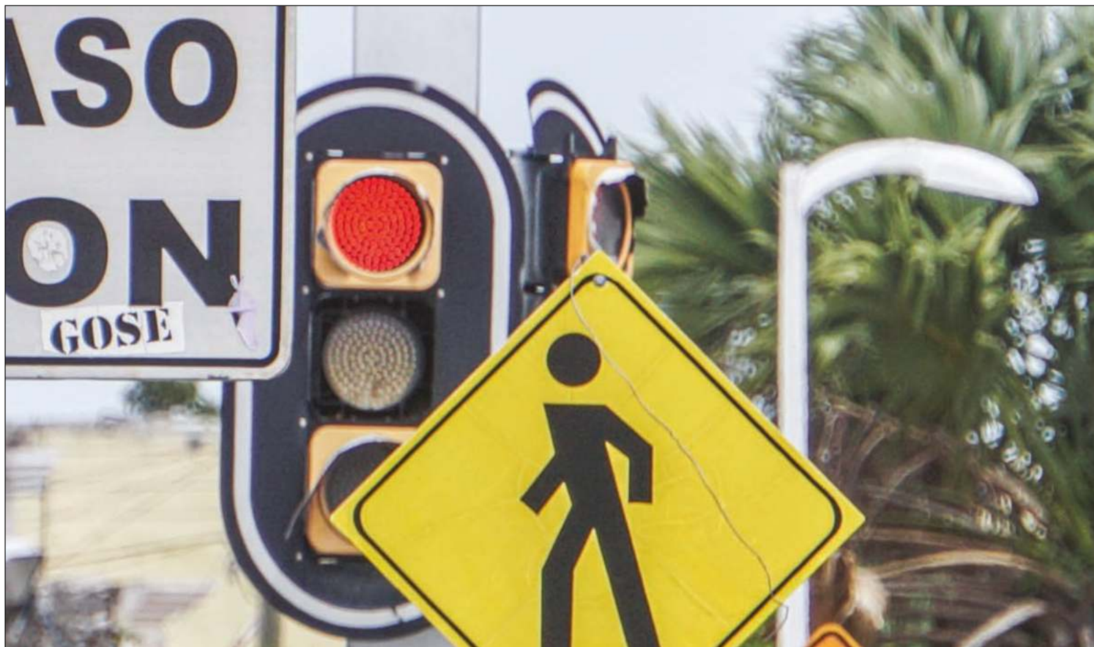
▲ Las sucesivas adecuaciones del semáforo epidemiológico han respondido más a criterios políticos y económicos.