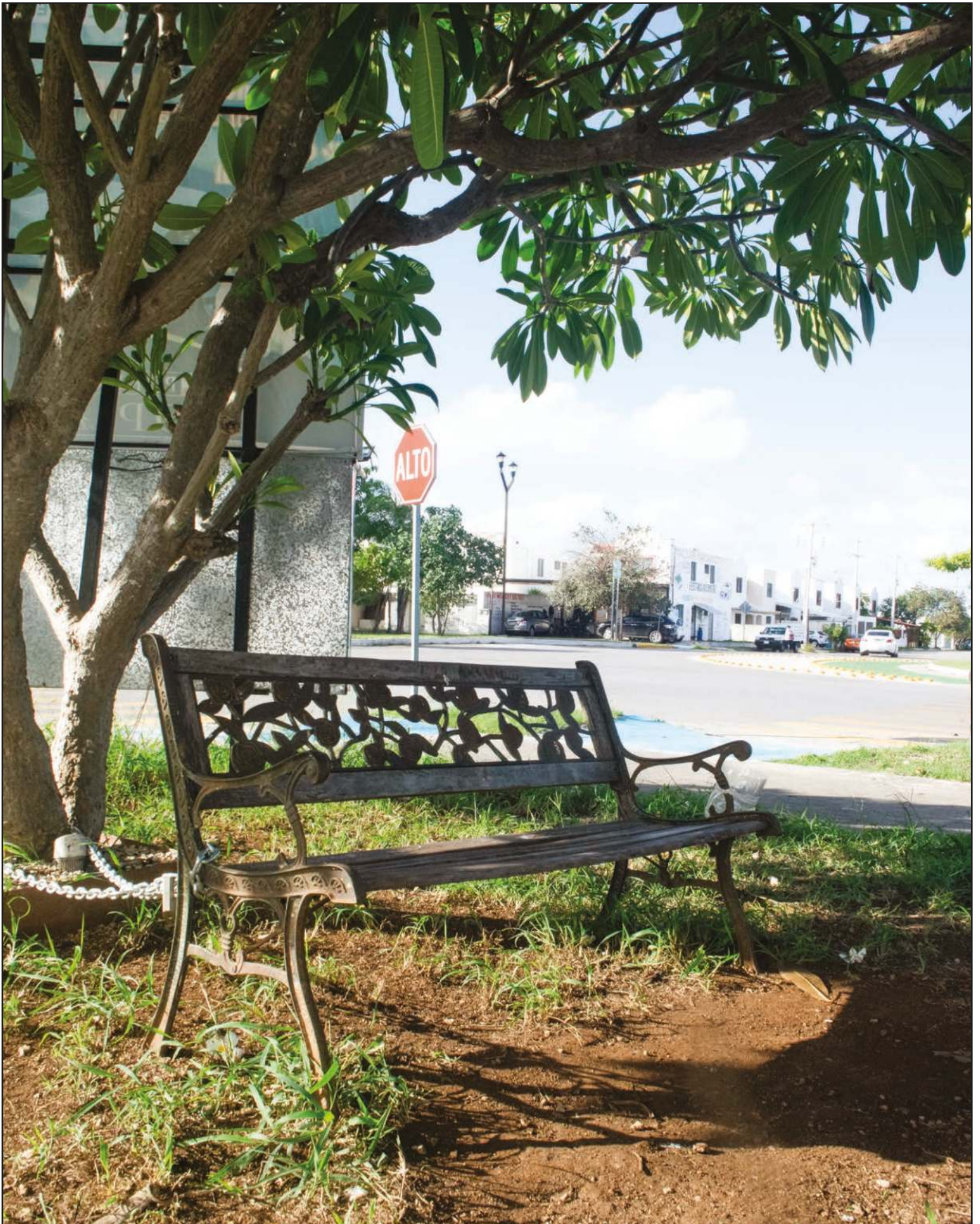
Las Américas, como otros tantos fraccionamientos, es la intersección del Diagrama de Venn donde el trabajo y la vivienda se mezclan.▲