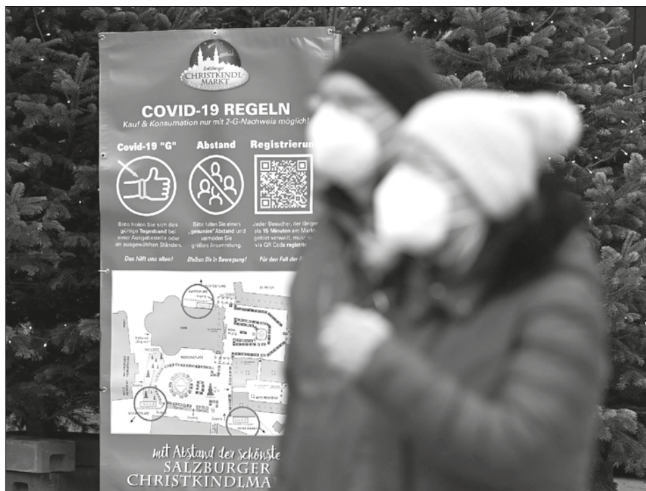
▲ Austria introducirá un mandato de vacunación a partir del 1 de febrero.

En una entrevista publicada el domingo en el periódico Kurier , Schallenberg calificó de "lamentable" que el gobierno haya