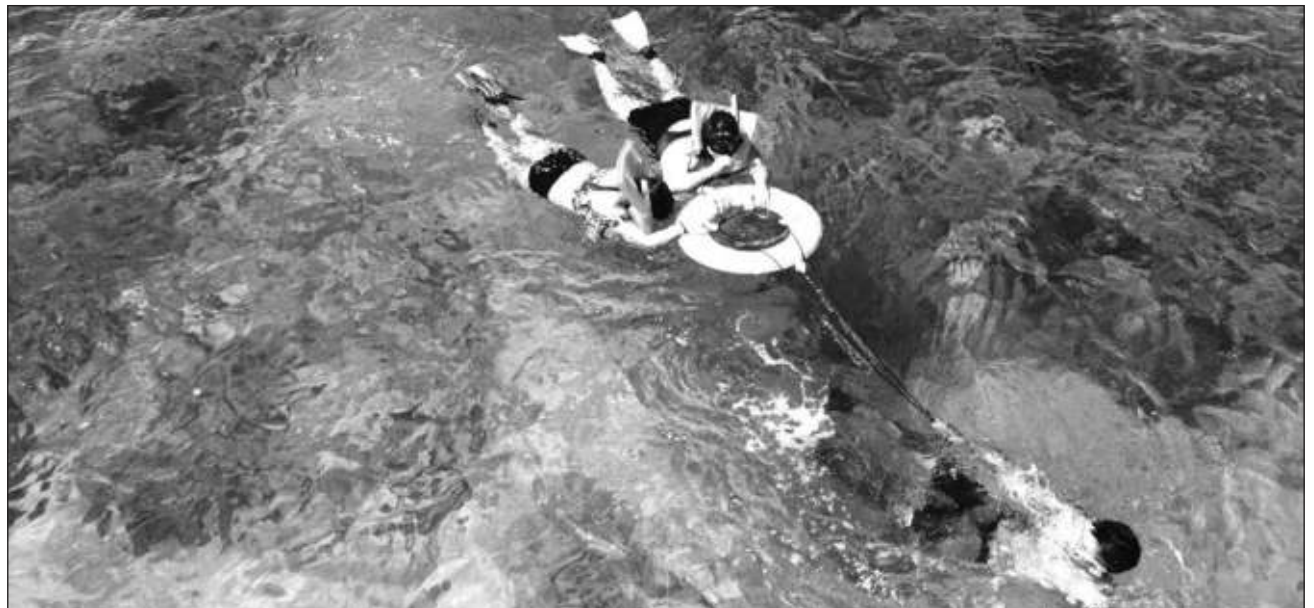
▲ Los destinos han tenido que adaptarse a las nuevas necesidades; ahora lo que buscan los visitantes son espacios abiertos y el contacto con la naturaleza.

viene con una aceleración, al menos del destino Riviera Maya que ha sido único en demostrar al mundo que sí se puede; se pudo ver cuando todo se cerró, los mismos hoteleros mandaron a todos a sus pueblos, y eso fue muy importante.