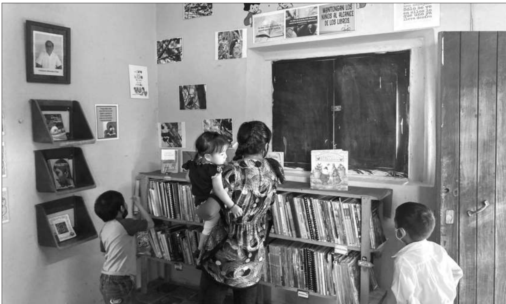
▲ La iniciativa de la biblioteca corrió a cargo del Centro Cultural y de Derechos Humanos Casa Colibrí y la Reserva Ecológica Amazili.