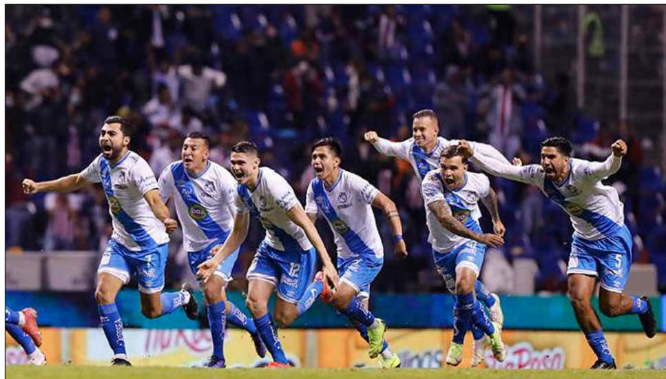
▲ Puebla eliminó a las Chivas para meterse de nuevo a la liguilla. Monterrey es otro invitado a la fiesta grande, luego de golear anoche 4-1 a Cruz Azul.

guilla consecutiva para Puebla, que el torneo pasado sorprendió al meterse hasta las semifinales.