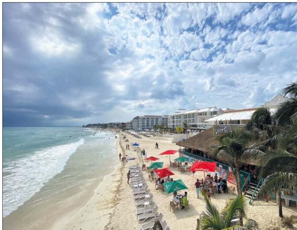
Actualmente, varios hoteles están mejorando el servicio de conexión wifi para ofrecer a sus clientes, así como espacios cómodos de trabajo.

“Para México, los viajes familiares han sido clave para la recuperación del turismo” finalizó