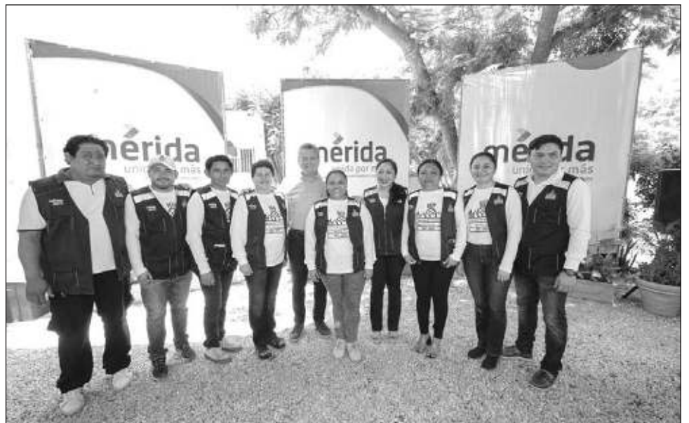
▲ El nuevo espacio se une al complejo de esta central, con una inversión de 600 mil pesos en beneficio de 28 trabajadoras, 28 trabajadores y más de 60 locatarios.

También, en el marco del 42 aniversario de la Central