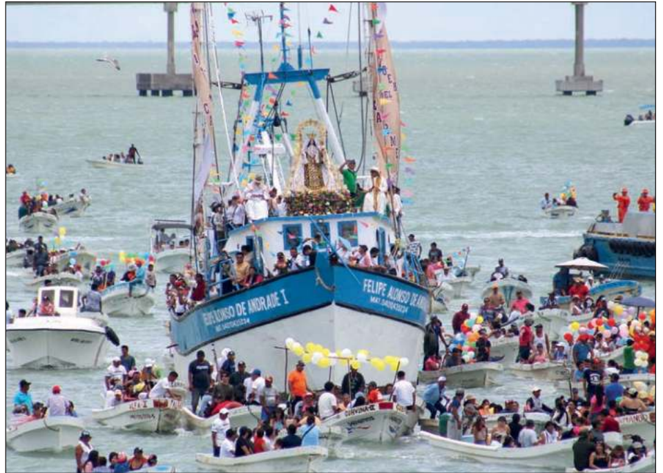
▲ La imagen de la Virgen del Carmen fue cargada en hombros por los fieles y llevada en procesi3n hasta el Malec3n de la ciudad, donde se llev3 a cabo la ceremonia eucar3stica.

Pese a la amenaza de lluvia, familias completas, llegadas de estados cercanos como Yucat3n, Quintana Roo, Tabasco, Veracruz, Tamaulipas, Puebla, Chiapas y Puebla, entre otros, se desplegaron a lo largo del recorrido de la imagen que parti3 del Santuario Mariano Diocesano de la Virgen del