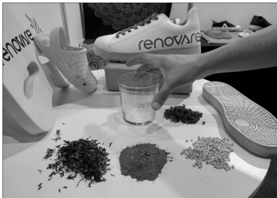
▲ Las empresas presentaron productos como suelas de zapatos hasta materiales de construcción y biocombustible, todos hechos a partir del sargazo.

El laboratorio está ubicado en España, pero no fabrican,