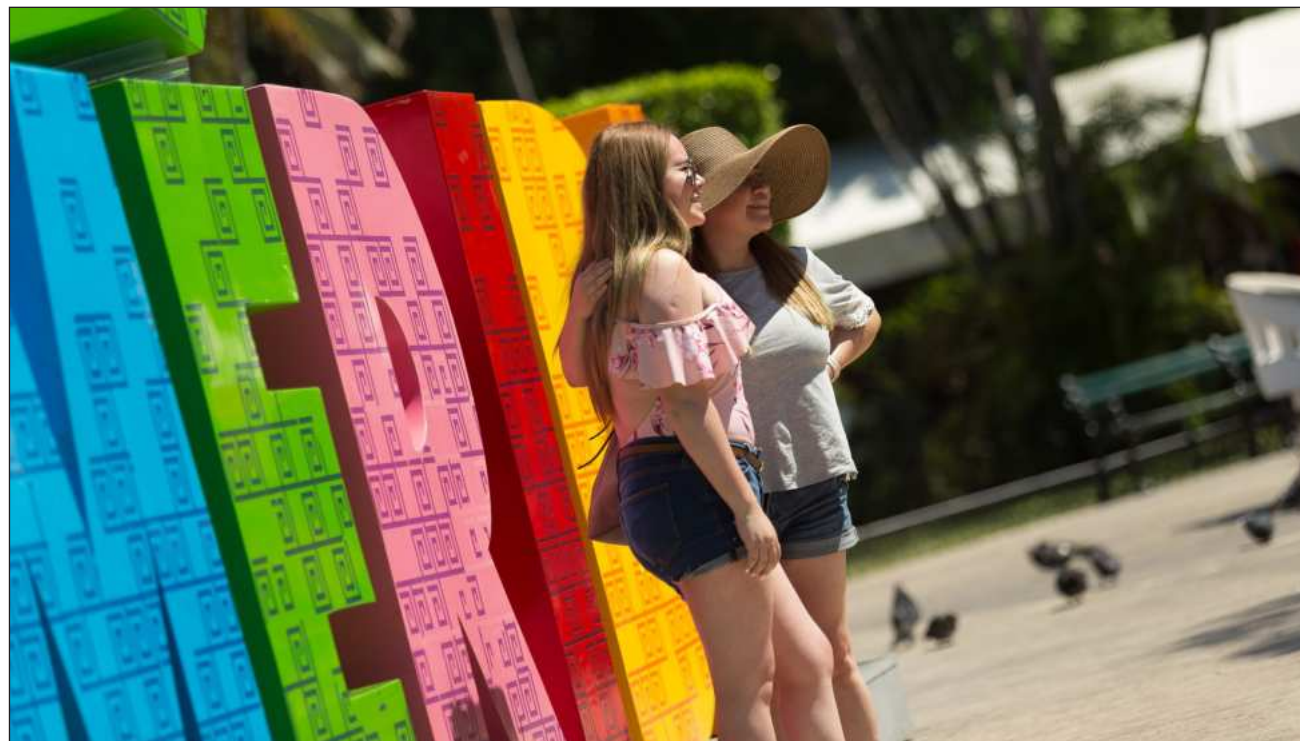
▲ Los hoteleros esperan una ocupación de 70% durante el Mundial 2026, del 11 de junio al 19 de julio.