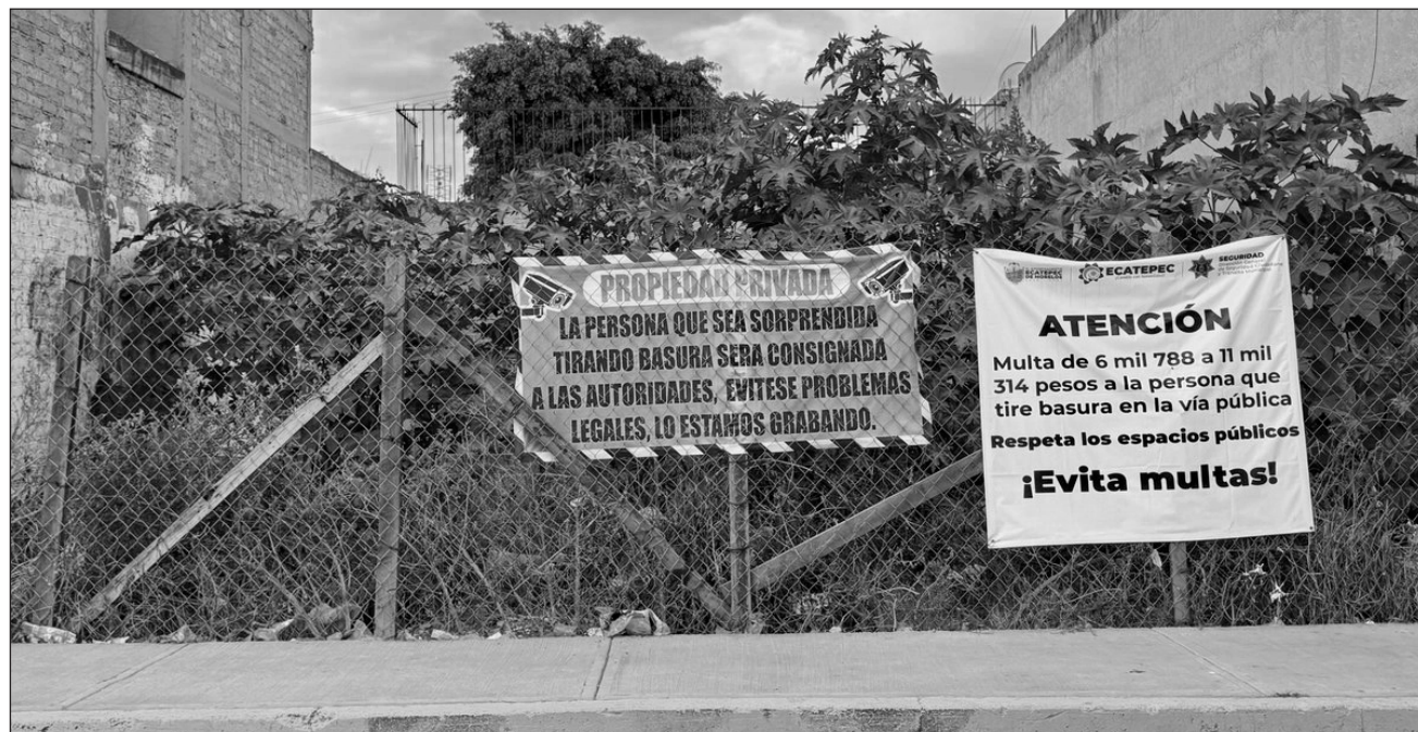
▲ En 2018 este municipio fue escenario de uno de los casos más emblemáticos y denigrantes de feminicidios en el país.

“Todavía estamos en la definición de cuánto se va invertir pero es un hecho que haremos un Centro de Atención para concluirlo este año; creemos que más o menos se van invertir 5 millones. Se va