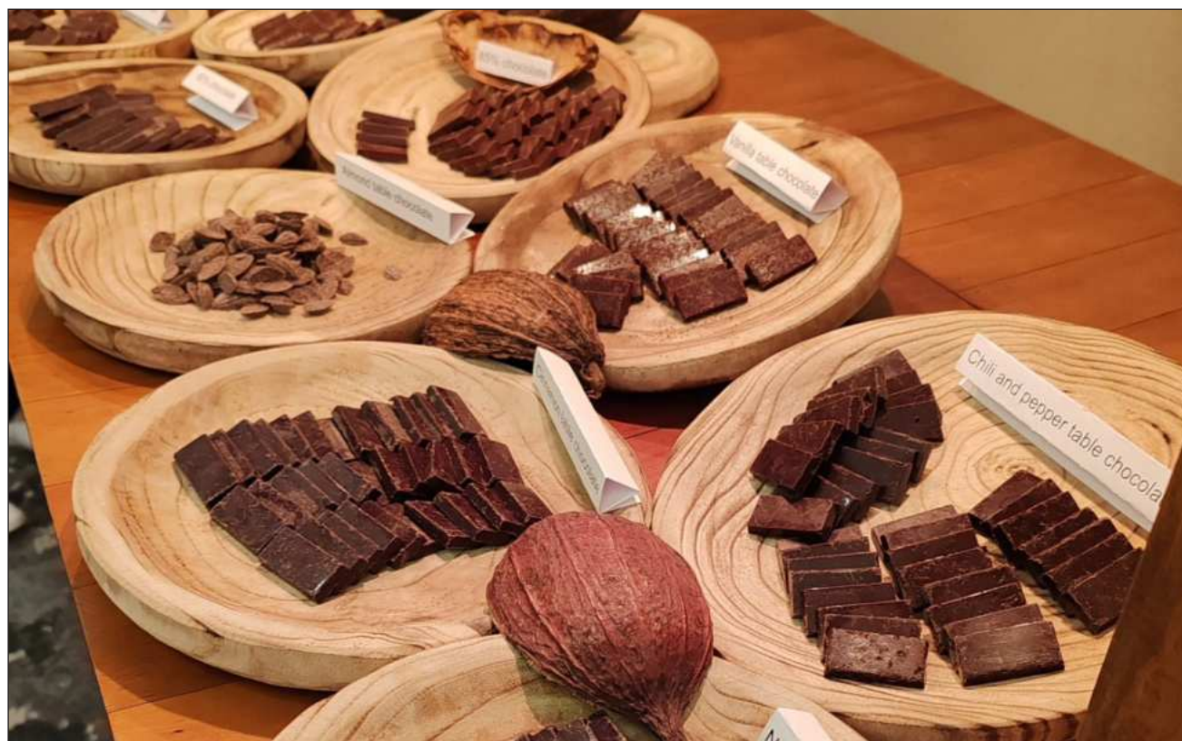
▲ El proyecto no se limita únicamente a la exhibición de productos finales, sino que invita a los visitantes a sumergirse en la historia milenaria y en los procesos artesanales que transforman una semilla en un chocolate premiado.

El proyecto, dijo, no se limita únicamente a la exhibición de productos finales, sino que invita a los visitantes a sumergirse en la historia milenaria y en los procesos artesanales que transforman