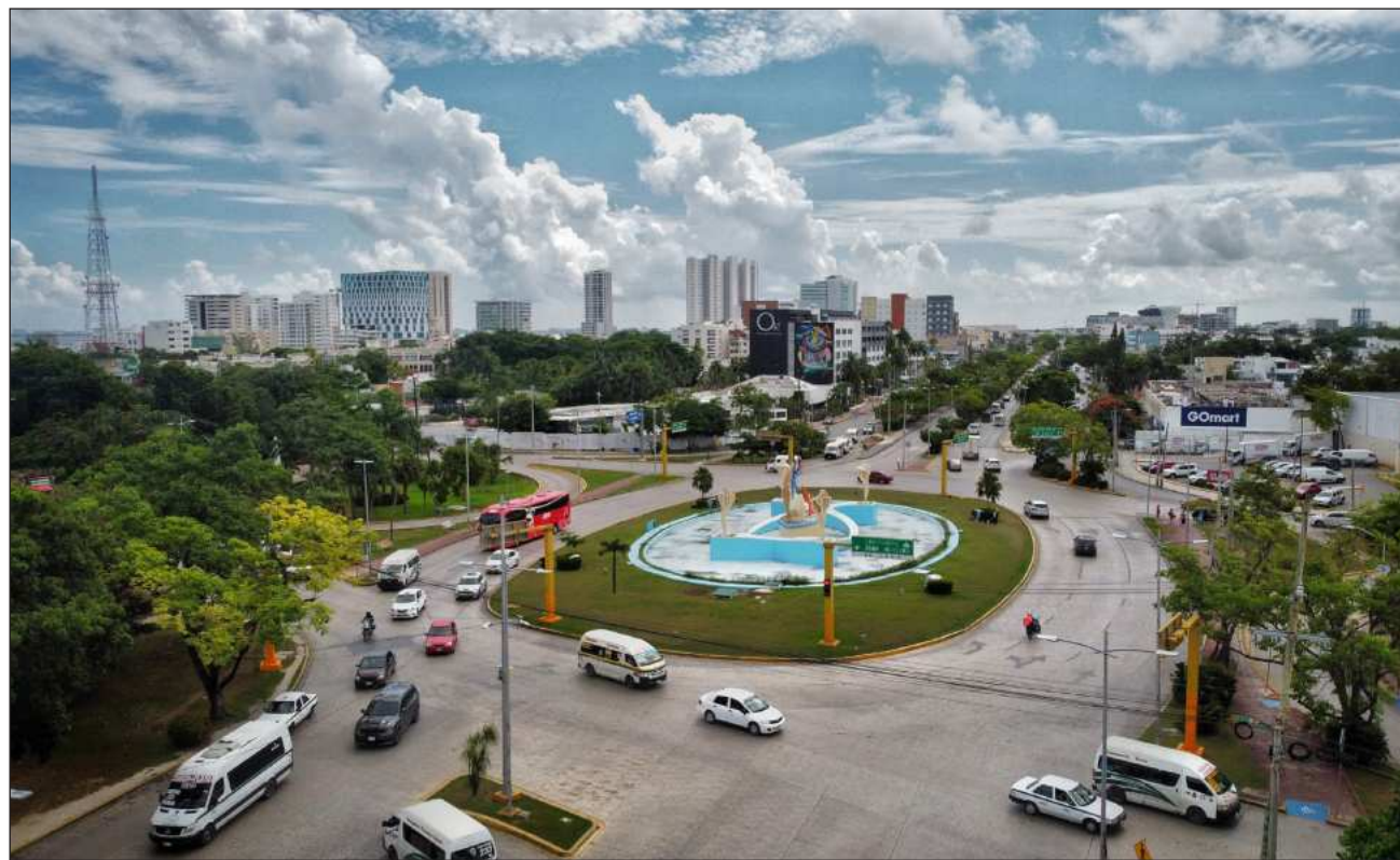
▲ La campaña busca que cada habitante identifique el valor particular que aporta a la comunidad.

La campaña, apuntó, propone acciones tangibles que cualquier ciudadano puede adoptar en su vida cotidiana; a través de la plataforma mkt-cancun.org se invita a las personas, asociaciones y empresas a sumarse con compromisos específicos que reflejen su orgullo y