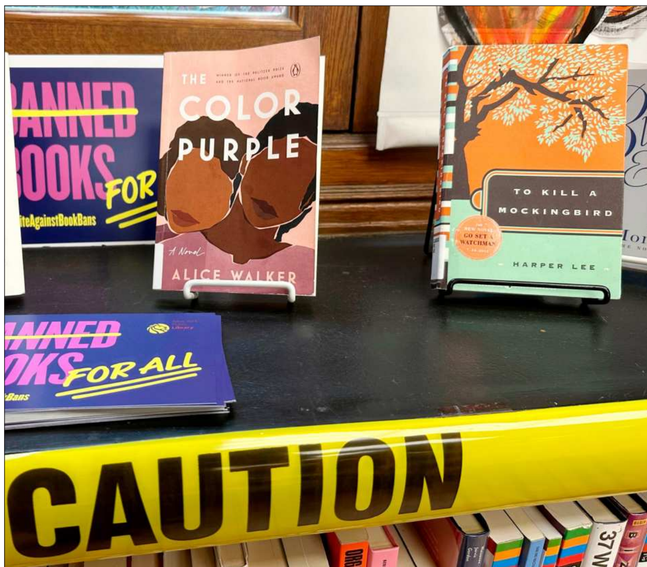
▲ Los intentos de censura se mantienen en niveles récord, según la Asociación Estadunidense de Bibliotecas, la cual publicó este lunes su lista anual de los libros más impugnados en las bibliotecas del país, como parte del informe State of America's Libraries Report .

Los boletos ya se encuentran a la venta a través del número de WhatsApp 9902287462 y cuestan 280 pesos la entrada general, pero hay descuentos para quienes presenten su credencial de estudiantes y para quienes tengan credencial del Inapam.