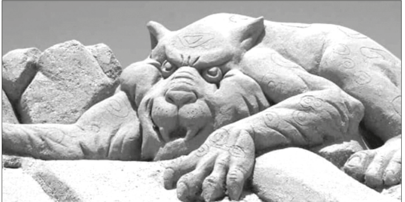
▲ Las esculturas de arena de Enarenarte se realizarán en Isla Aguada y Sabancuy.

La Fiesta del Mar 2023 se realizará en el municipio del Carmen y comprende las Villas de Sabancuy y el Pueblo Mágico de Isla Aguada, del 31 de marzo al 9 de abril.