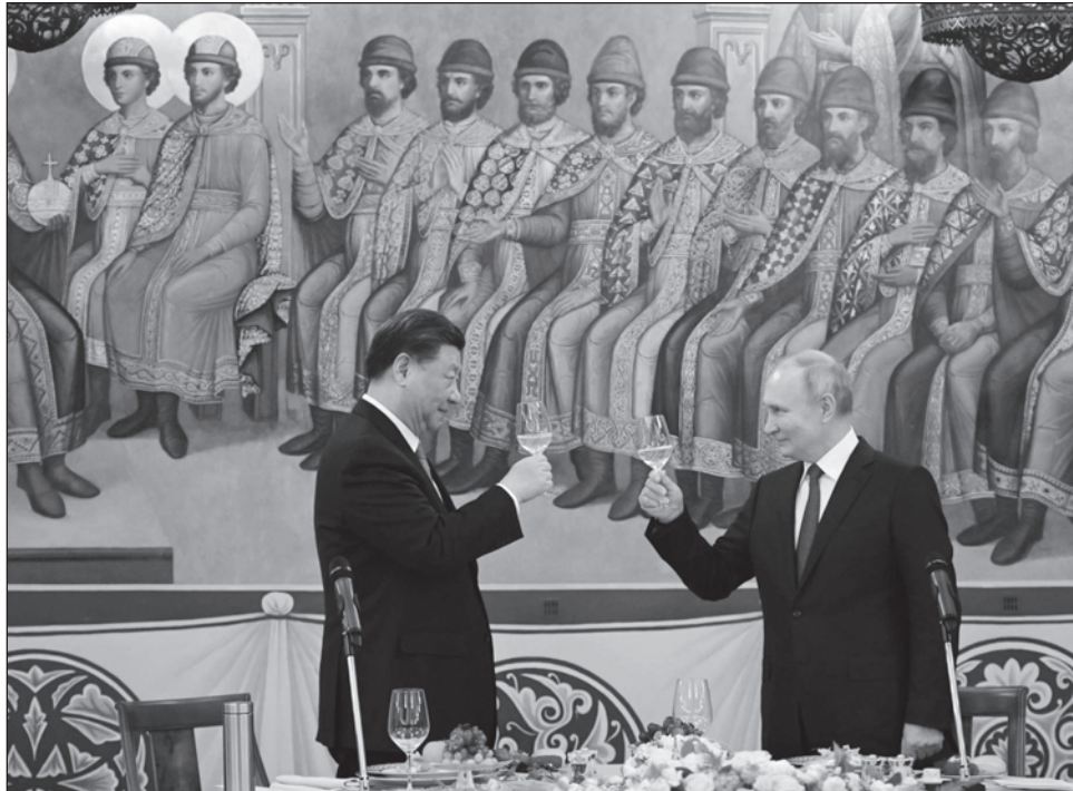
▲ Xi Jinping y Vladimir Putin, presidentes de China y Rusia, respectivamente, sostuvieron una reunión a puerta cerrada para dialogar sobre la situación internacional.

Al dar la bienvenida a Xi, Putin destacó que Rusia y China “tienen muchos objetivos y tareas conjuntas”, mientras el presidente chino subrayó que “la relación bilateral tiene una lógica histórica” cual corresponde a “los vecinos más grandes y socios estratégicos” que son.