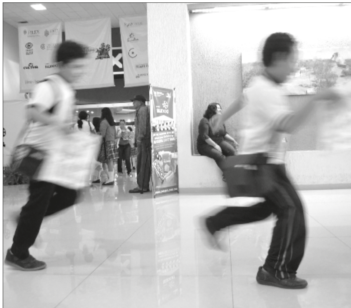
▲ “La jauría seguirá ahí, creando pequeños fuegos con el pedernal del insulto, con la paja de la burla y la exclusión, para convertirlos después en incendios de violencia”.

La directora de la escuela minimiza el hecho: así son los niños , taja, y da por concluido el asunto. No sólo