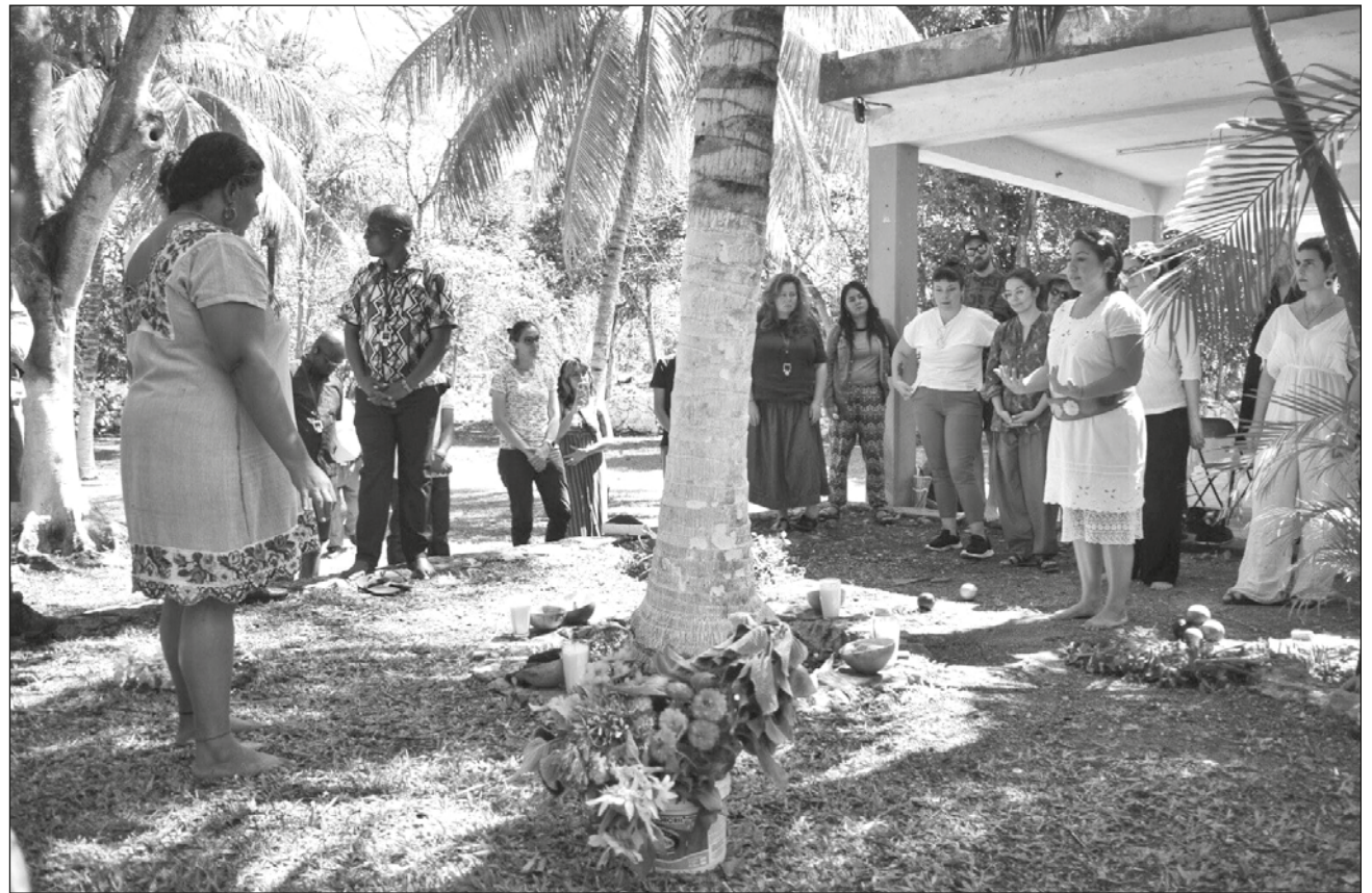
▲ U k'a'ananil le meyaj', ti' yaan tumen ku kaxtik u ts'aatántik u k'ajla'ayil kaajo'ob, ba'ale' tu k'ab kaaj.

Ka'aj yáax t'aanaj Alika Santiago' tu tsikbaltaje' le k'iino', u k'iinil k'a'anan káajbal, ts'o'okole' leti'e' kéen káajak u yáalkab u túumbe k'iinilo'ob kuxtal.