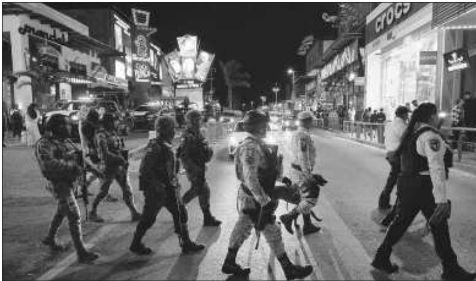
▲ El Círculo Rojo es un operativo de seguridad que se llevará a cabo todos los días a partir de las 22 horas en los diferentes destinos del Caribe Mexicano.

Destacó que a partir de las 22 horas se inicia todos los días el operativo Círculo Rojo.