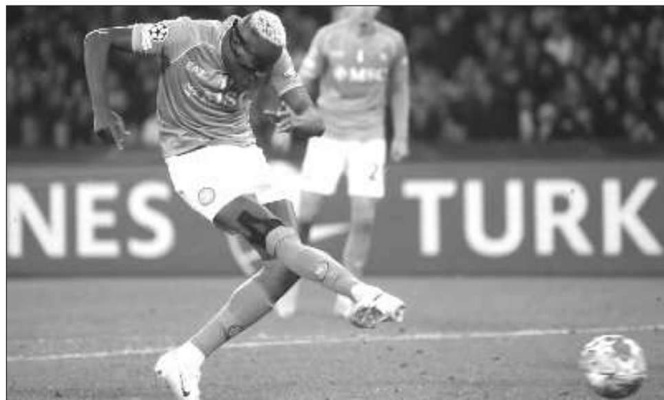
▲ Víctor Osimhen anota el gol con el que el Napoli rescató un empate ayer ante el Barcelona.

"Jugando así tenemos muchos números para pasar. Hemos hecho muy buen partido, aunque nos desajustamos con el gol", dijo el técnico azulgrana Xavi Hernández. "Hemos estado muy bien y el equipo ha hecho méritos para ganar. Me voy satisfecho, pero con la sensación amarga de que, viendo el