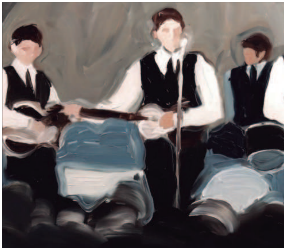
▲ La productora Pippa Harris aseguró que su objetivo "que sea una experiencia cinematográfica única, emocionante y épica: cuatro películas, abordadas desde cuatro visiones diferentes que cuentan una sola historia sobre la banda más célebre de todos los tiempos".

"Me siento honrado de contar la historia de la mejor banda de rock de todos los tiempos, y emocionado de desafiar la noción de lo que constituye un viaje al cine", señaló Mendes en un comunicado.