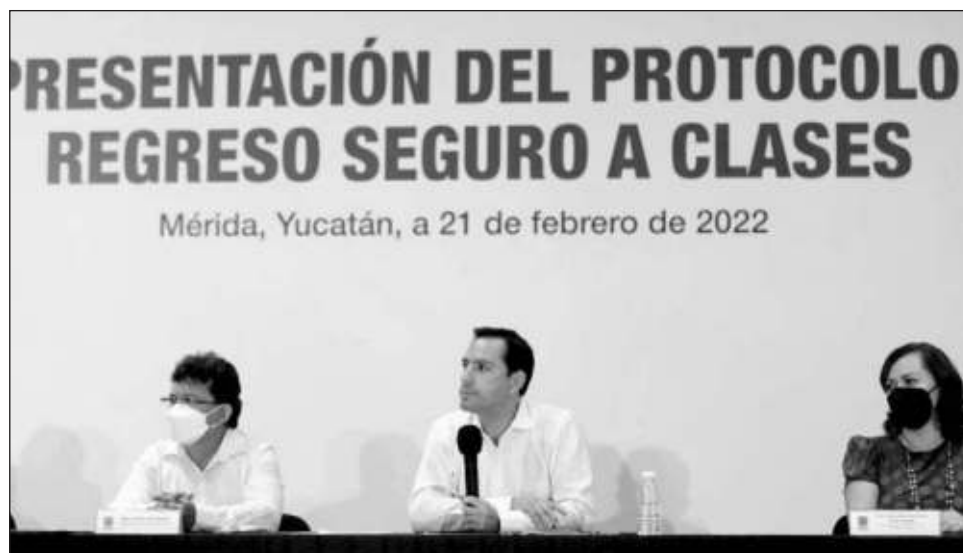
▲ A causa de la pandemia, 21.8 por ciento de la población de Yucatán se encuentra en rezago educativo, y seis de cada 10 personas entre 16 y 20 años no asisten a la escuela.