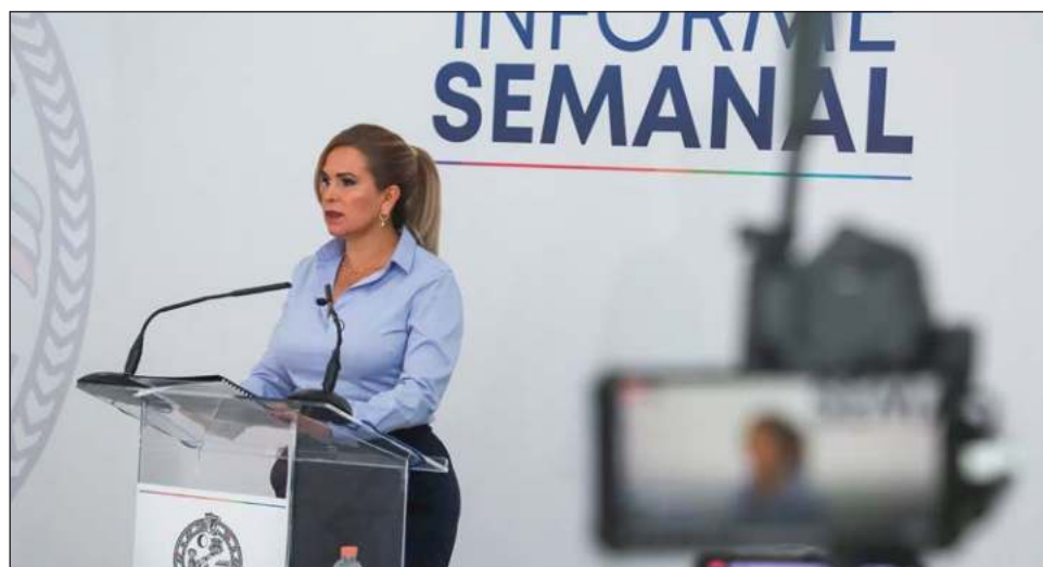
▲ A nivel interno el ayuntamiento tiene dos procedimientos en fase final, uno es sobre el panteón municipal, que ya fue turnado a la sala Chetumal para determinar la sanción.

La mayoría corresponde a servicios que nunca fueron