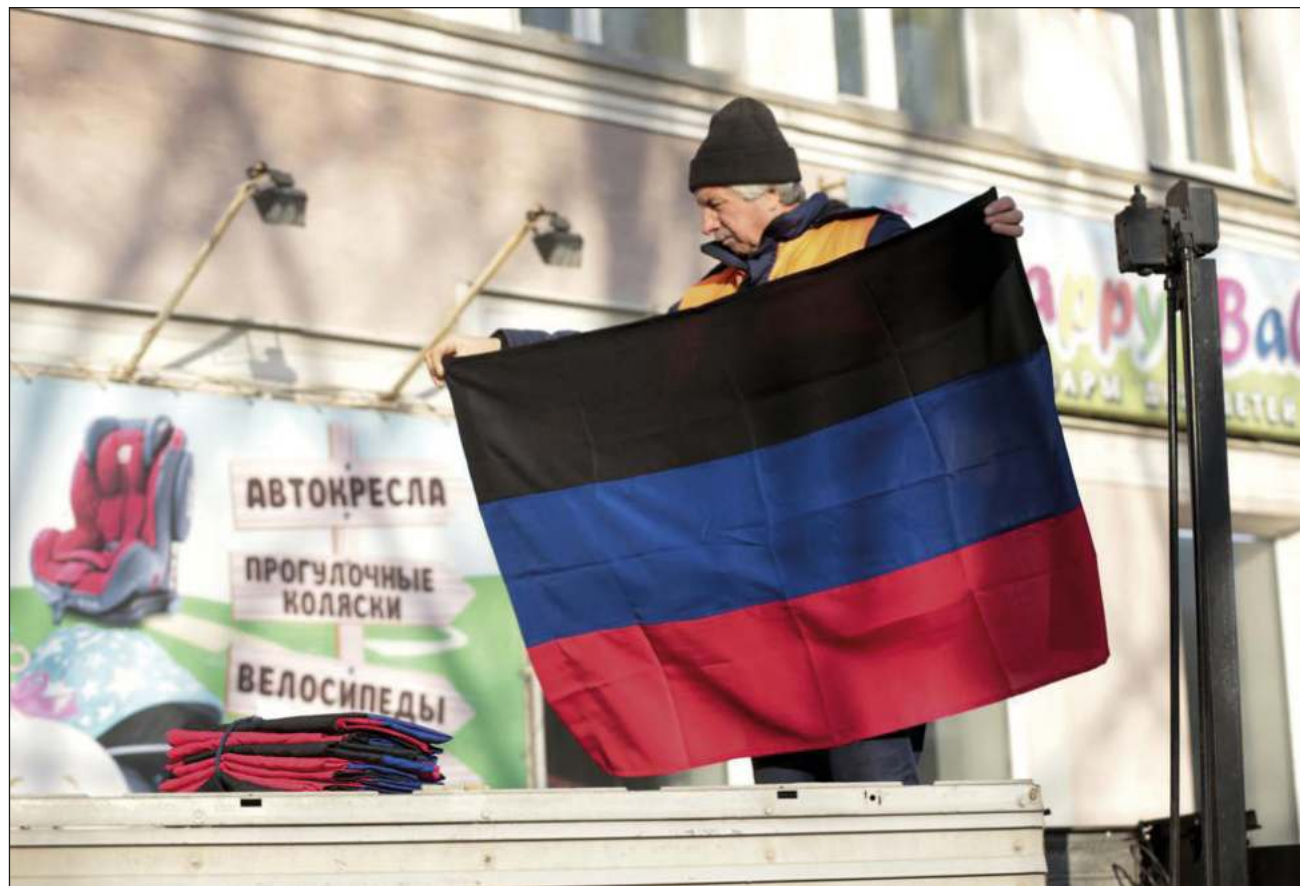
▲ El presidente ruso, Vladimir Putin, reconoció la independencia de la República Popular de Donetsk y la República Popular de Lugansk, con cuyos líderes firmó sendos tratados de amistad y asistencia mutua este lunes.

Putin tomó esta decisión después de recibir este lu-