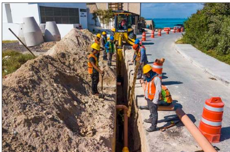
▲ En atención al servicio de alcantarillado se destinarán más de 170 millones de pesos en obras como la construcción del emisor Cárcamo Paraíso.

En el 2022 uno de los principales objetivos es trabajar en el reforzamiento de la infraestructura en las plantas de tratamiento, pues ante el acelerado proceso de urbanización y el incremento del flujo de las aguas residuales, se requiere preparar dichas instalaciones a fin de mantener la adecuada recepción y saneamiento de aguas; por lo que solo en este rubro se invertirán más de 370 millones de pesos, destacando la modernización, ampliación y urbanización de la Planta de Tratamiento Norponiente y la construcción de la primera etapa de la Planta de Tratamiento Polígono Paraíso, en el municipio de Benito Juárez.