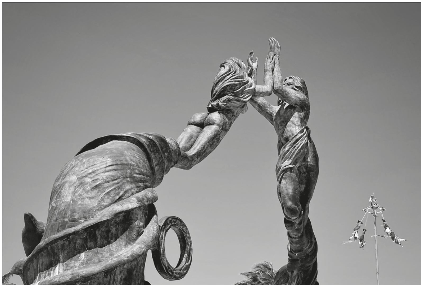
▲ Los voladores de la Papanltá política, dispuestos al salto desde la veleta, no saben vivir de otra cosa; nunca lo han hecho.