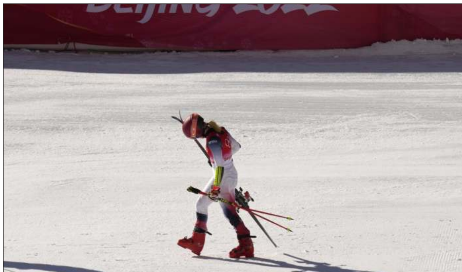
▲ Se esperaba que Mikaela Shiffrin fuera una de las estrellas de los Juegos Olímpicos, pero la esquiadora se fue de Beijing con las manos vacías.

Tras la experiencia de Beijing, el COI tiene 29 meses para oprimir el botón de re-