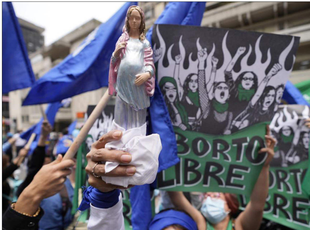
▲ La despenalización fue aceptada en sesión extraordinaria por cinco votos a favor y cuatro en contra.

Hasta la fecha el aborto sólo estaba permitido en Colombia por tres causas: cuando está en riesgo la salud o la vida de la madre, cuando es fruto de violación o incesto, o si hay malformación del feto, mientras que en el resto de casos está penado hasta con cuatro años y medio de cárcel.