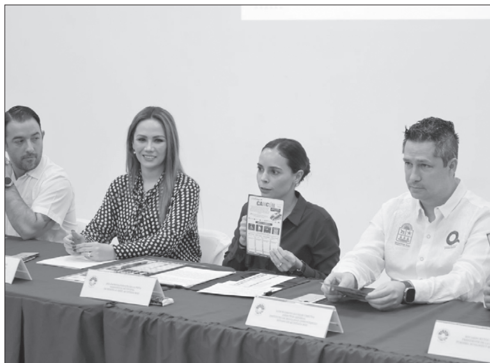
▲ El tarjetón turístico permitirá disminuir las quejas recibidas por parte de los visitantes que se encuentren en Cancún, y se espera que otros municipios lo implementen.

Exhortó a los arrendadores a brindar su apoyo para que este programa cumpla su propósito, que hagan de conocimiento a todos los turistas que cuen-