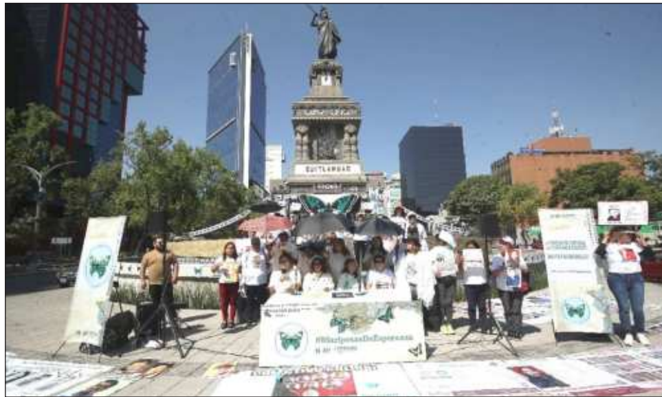
▲ El CNC denunció la falta de transparencia en el proceso para elaborar el censo, "violando principios establecidos" en la Ley General en Materia de Desaparición.

En la conferencia matutina, la titular de la dependencia, Luisa María Alcalde, expuso que la investigación también arrojó a 17 mil