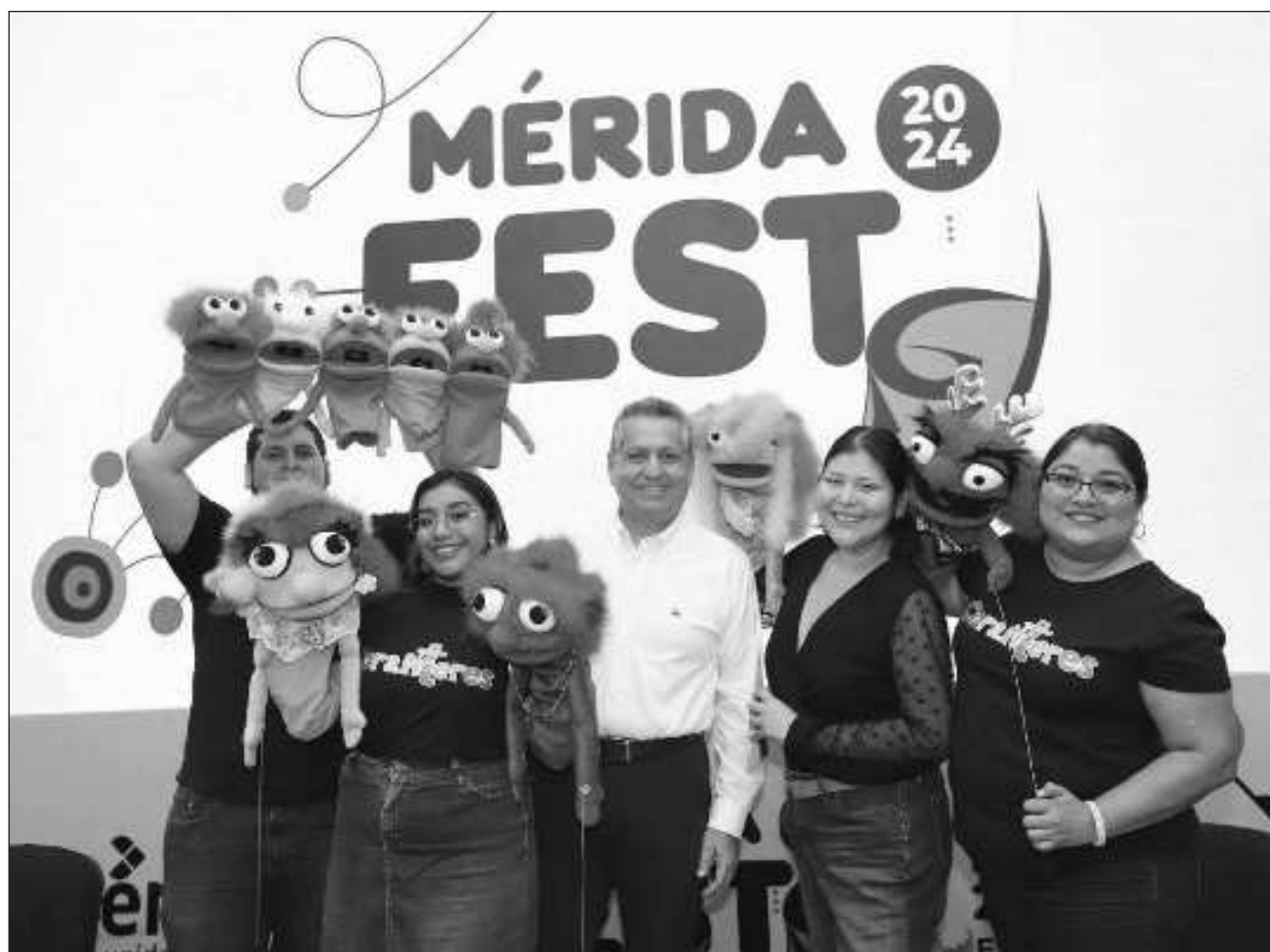
▲ Más de 760 artistas locales y extranjeros se presentarán en los eventos a realizarse del 5 al 24 de enero.

Asimismo, el presidente municipal destacó que eventos como el Mérida Fest posicionan cada vez mejor a Mérida ante los ojos del mundo, por armonizar la