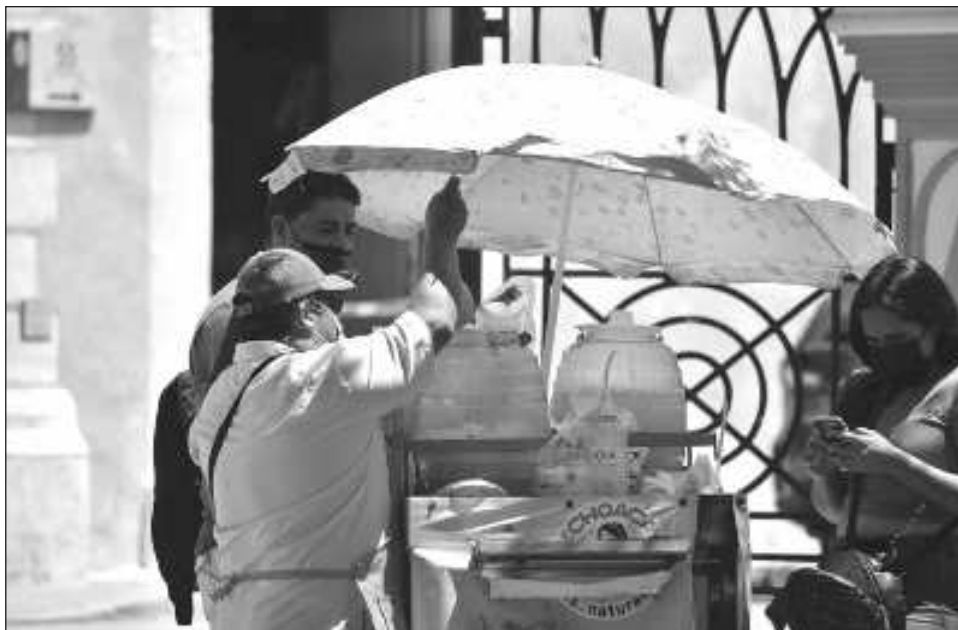
▲ De acuerdo con el IMCO, el trabajo doméstico implica labores de limpieza en el hogar, de artículos personales y también labores de cocina por las cuales normalmente no hay un pago dentro de los hogares, pero fuera de él tienen un costo.

Resalta que las mujeres realizan la principal contribución económica por el trabajo no remunerado ya que ellas aportan 2.6 veces más valor económico que los hombres.