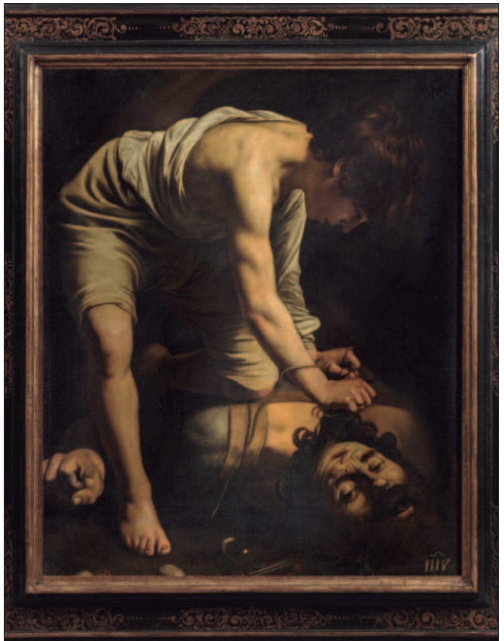
▲ La obra restaurada de Caravaggio se encuentra en una de las salas dedicadas a las obras del naturalismo europeo, del que el pintor italiano fue su principal precursor.

Sánchez explicó que la tonalidad amarillenta del viejo barniz transformaba el cromatismo original de Caravaggio aportando a los tonos claros y luminosos de las carnaciones y las vestiduras una gama cálida que alteraba totalmente la idea del artista. A su vez, la pérdida de transparen-