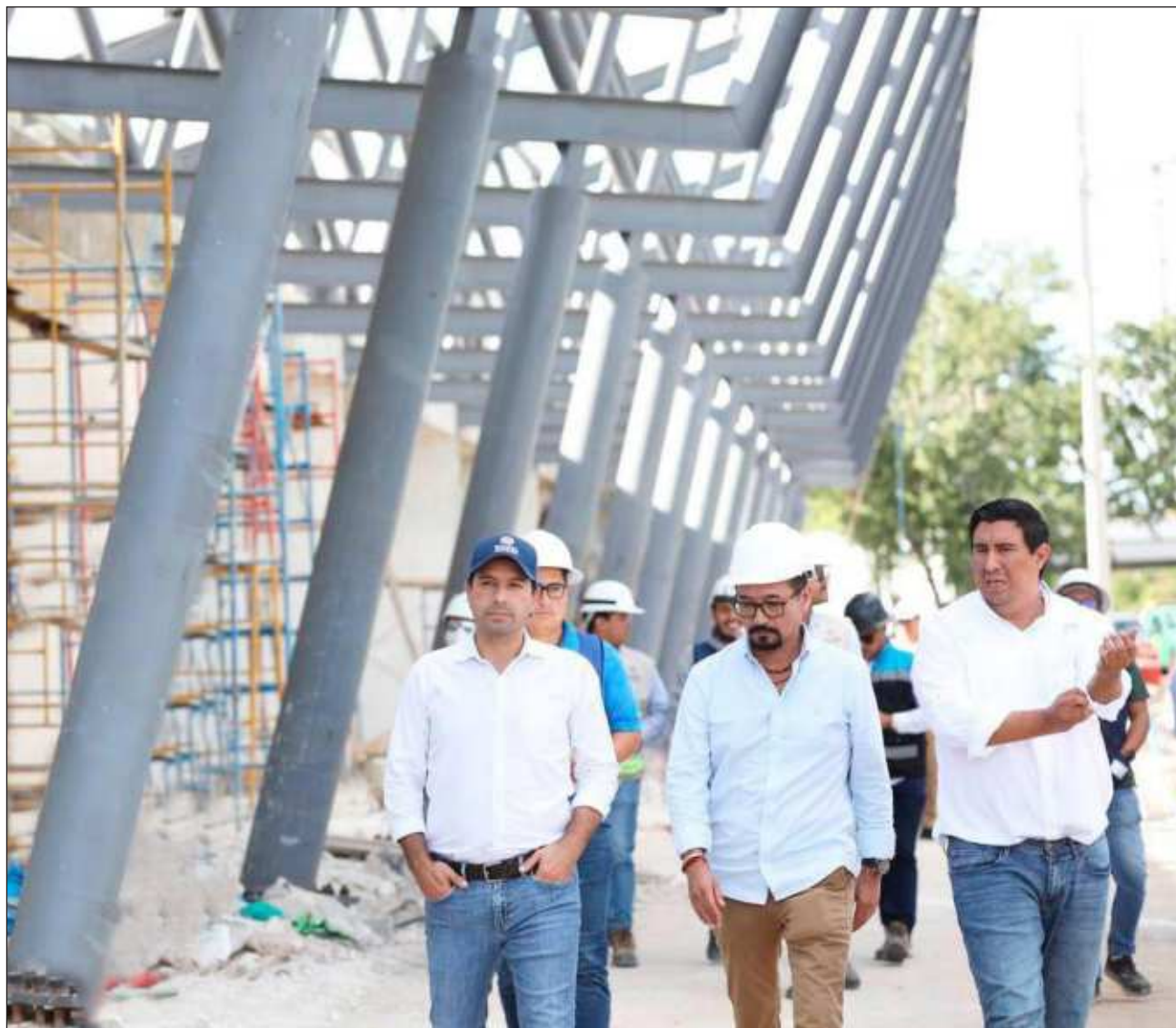
▲ El Centro de Transferencia Multimodal Caucel contará con un diseño integral e inclusivo con sala de espera, oficinas administrativas y áreas de descanso para operadores y permitirá a los usuarios el acceso a la parada del Va y Ven.

La infraestructura del Cetram contempla una sala, área de descanso para operadores, baños públicos para mujeres y hombres, una