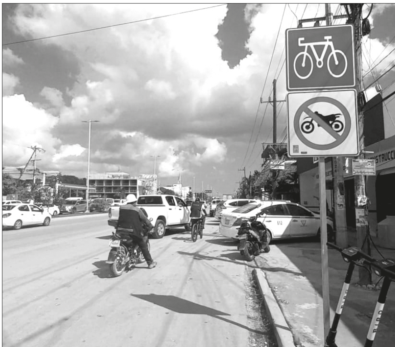
▲ El Plan de Movilidad Activa de Tulum (Pactum), promovido por la Secretaría de Desarrollo Agrario, Territorial y Urbano, consiste en un conjunto de obras con el objetivo de dar espacios más seguros para la circulación.

Mencionó que este plan de movilidad también se podría componer con reglamentos viales a favor de los ciclistas y también con responsabilidades a la hora de circular.