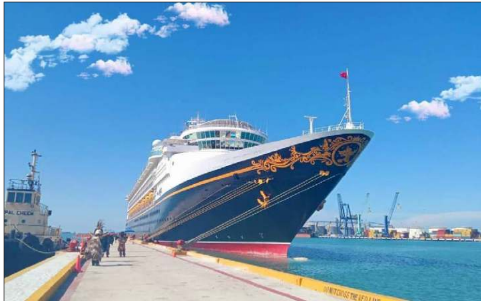
▲ El crucero Disney Magic , perteneciente a la naviera Disney Cruise Line, arribó a las 6 horas a la Terminal Internacional de Cruceros en el Puerto de Altura de Progreso.

También en este año se registraron los primeros arribos de los cruceros: World Voyager de la naviera