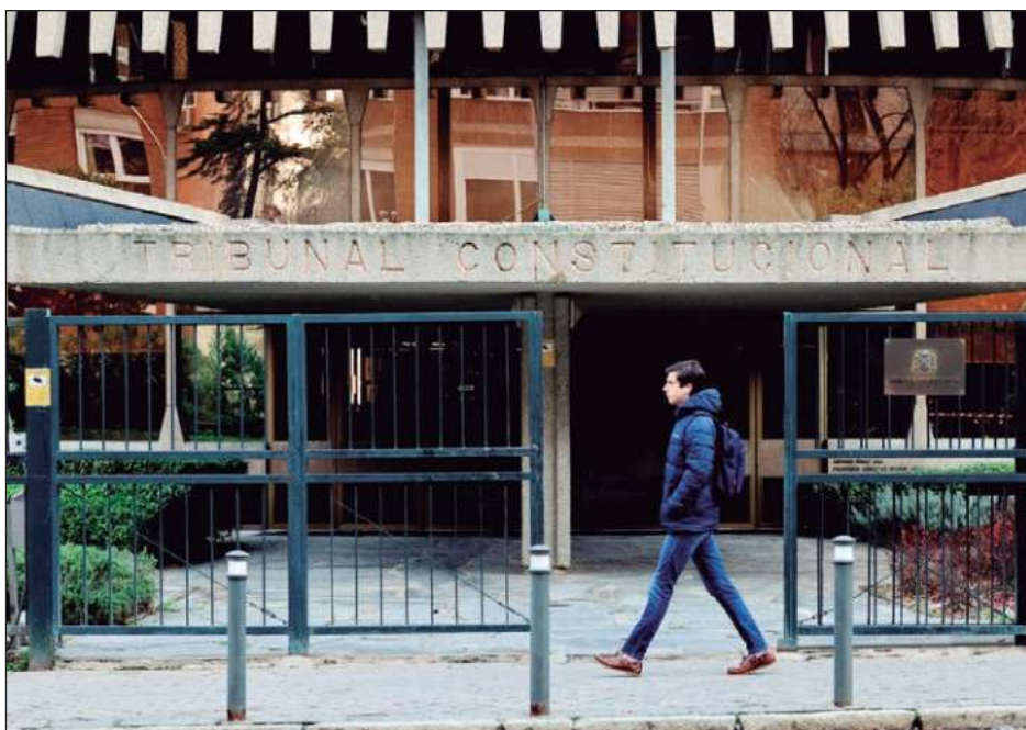
▲ Desde junio expiró el mandato de cuatro de los 12 magistrados del Tribunal Constitucional; el amparo concedido a la oposición impide los reemplazos.

Aunque aseguró que el gobierno respetará la decisión del Tribunal Constitucional, Sánchez prometió el martes que su "gobierno adoptará cuantas medidas sean precisas para poner fin al injustificable bloqueo del Poder Judicial y del Tribunal Constitucional".