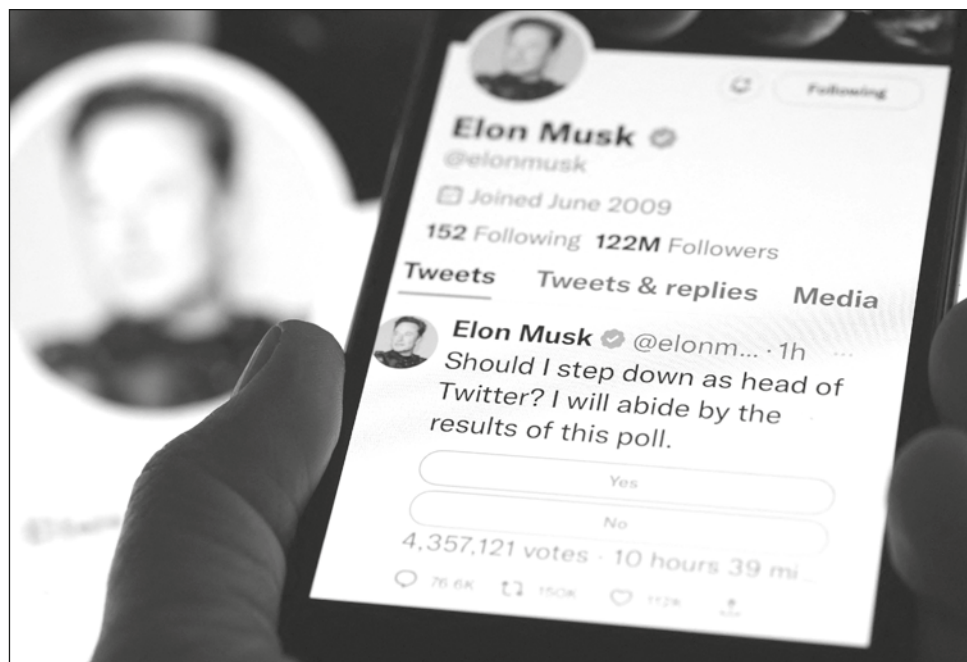
▲ Elon Musk prometió acatar el resultado de la encuesta que lanzó, preguntando si debería renunciar a la dirección de Twitter; votaron más de 17 millones de cuentas.

Los pedidos de Wall Street para que Musk renuncie han estado creciendo durante semanas y recientemente incluso los alcistas de Tesla Inc han cuestionado su enfoque en la plataforma de redes