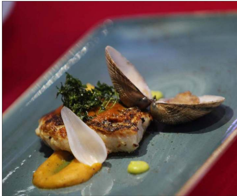
▲ El libro Valladolid: Capital gastronómica de Yucatán estará listo en 2023.

Los manjares culinarios serán presentados en la obra, a partir de las historias y re-