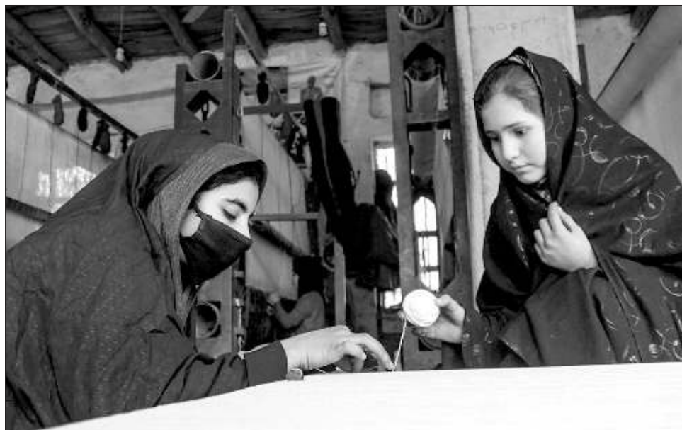
▲ En Afganistán, las niñas no pueden acudir a la escuela secundaria y la mayoría de los empleos están vedados para las mujeres, al igual que los gimnasios y los parques.

Las niñas no pueden asistir a la escuela secundaria y la mayoría de los empleos están vedados para las mujeres, que deben estar cubiertas de la cabeza a los pies cuando están en público.