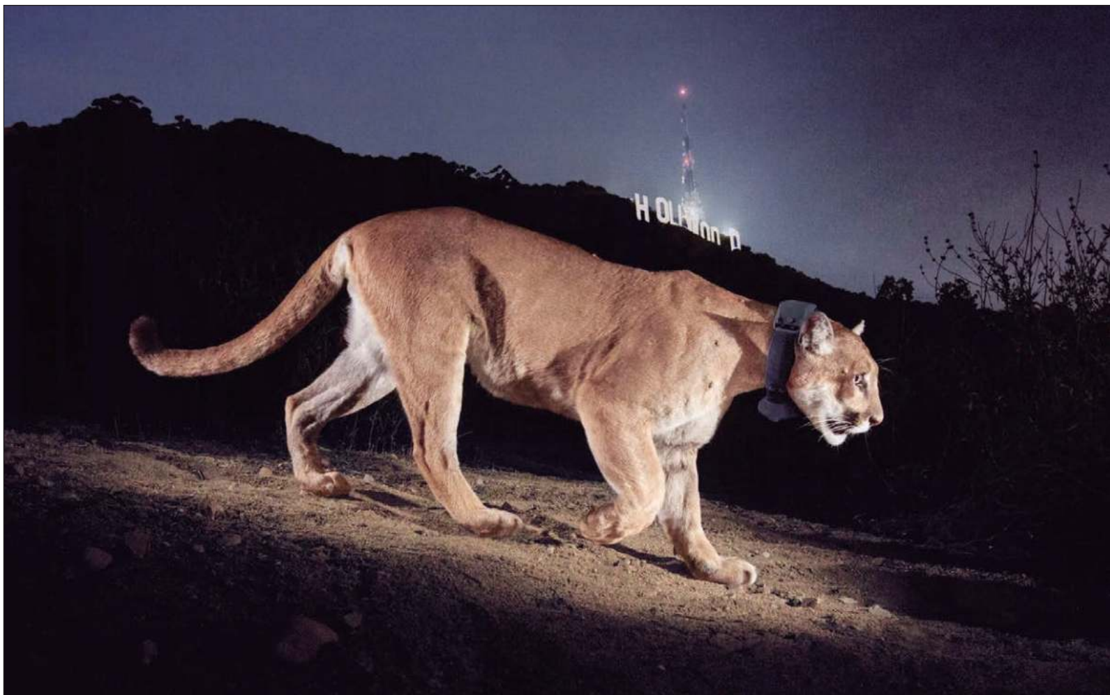
▲ Una cámara remota captura el paso del puma P-22 en Griffith Park, en busca de ciervos o mapaches.