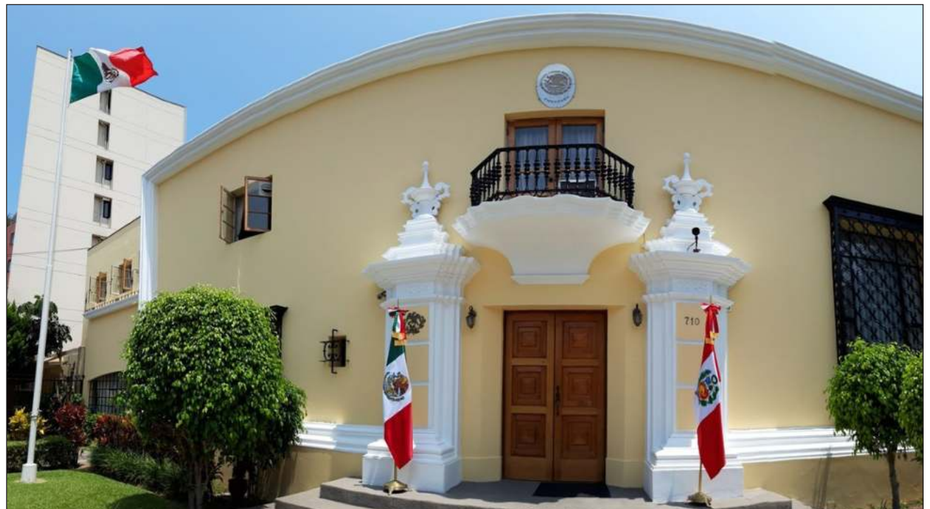
▲ La decisión del gobierno peruano responde a "las reiteradas expresiones" de México "sobre la situación política".

La decisión del gobierno peruano responde a "las reiteradas expresiones" del gobierno mexicano "sobre la situación política del Perú que constituyen injerencia en nuestros asuntos internos", dijo el martes la canciller peruana, Ana Cecilia Gervasi, en un pronunciamiento. La familia de Castillo ingresó este martes a la embajada.