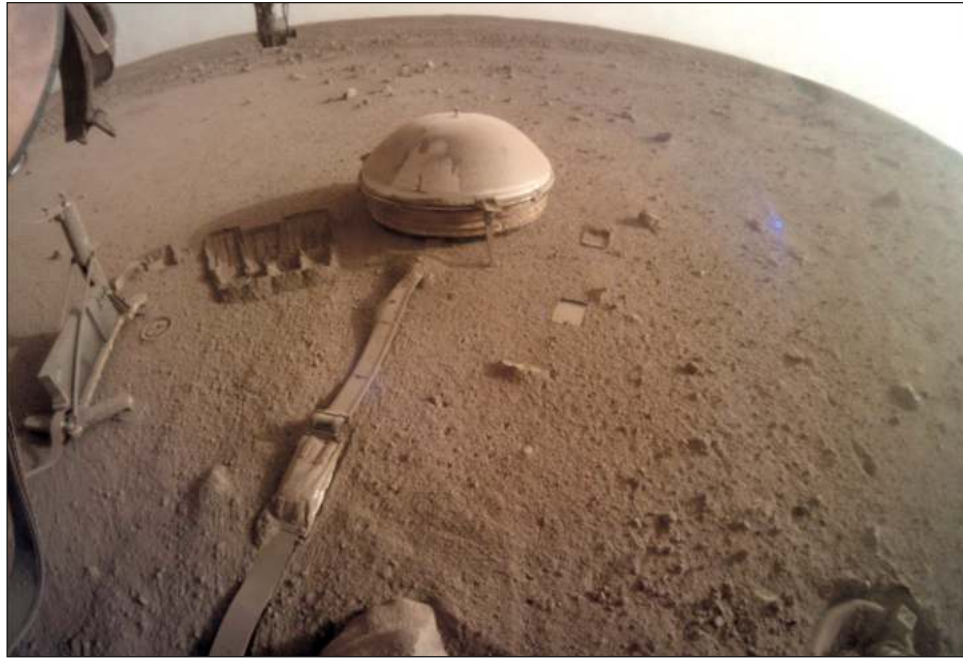
▲ El InSight captó un remolino de polvo marciano y también detectó más de 300 marsismos; es decir, un terremoto en el planeta rojo, incluso provocados por meteoroides.

InSight aterrizó en Marte en 2018 y fue la primera nave espacial en documentar un marsismo, es decir un sismo