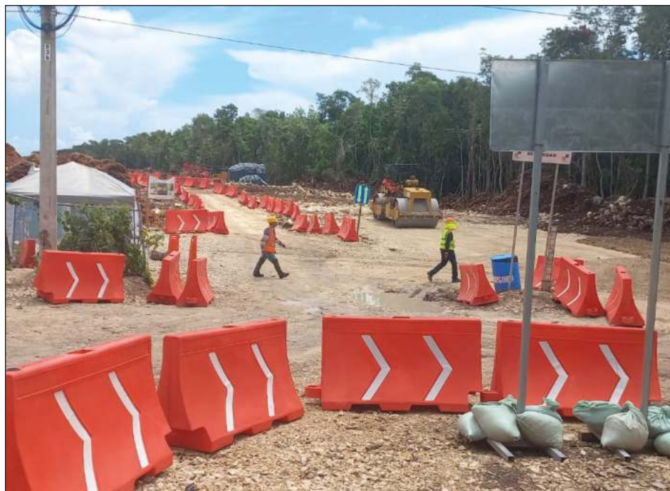
▲ Los trabajadores de la obra ferroviaria federal tienen miedo de laborar por las noches, lo que disminuye la velocidad con la que realizan la construcción.

Yo quiero reconocer que la autoridad está haciendo el mejor de sus esfuerzos para evitar todo ese tipo de situaciones negativas, sin embargo según va creciendo Tulum va creciendo también la delincuencia, va llegando cada día gente no con el interés de venir a trabajar