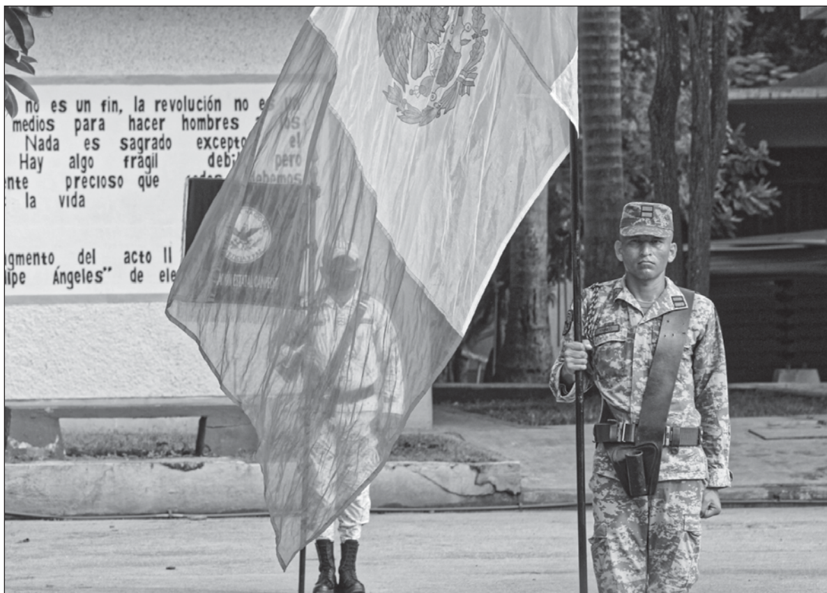
▲ "En todo rigor, el país está siendo militarizado, cubriendo el proceso con el manto de pureza del 'pueblo uniformado', la supuesta honestidad y horadez de las fuerzas armadas, y la -también supuesta -idea de que todos los demás o son corruptos o se pueden corromper fácilmente".

En el actual arreglo geopolítico, México no tendría por qué con-