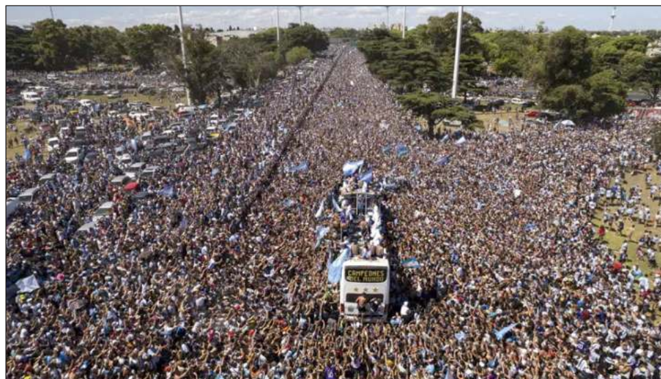
▲ Millones de personas celebraron a los campeones del mundo en las calles de Buenos Aires.

Trató infructuosamente de atribuirse un gol de cabeza frente a Uruguay y mostró una mala actitud luego de que se le sustituyó ante Corea del Sur, lo que derivó en que su técnico lo relegara a la banca contra Suiza y Marruecos en la fase de eliminación directa. Lloró después de que Portugal