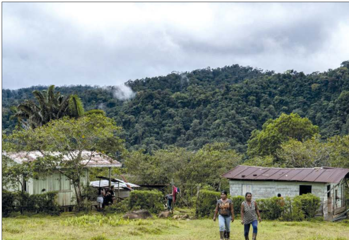
▲ U xak'alta'al yéetel u beeta'al meyaj'o'ob yóok'lal ba'ax ku yúuchul ti' máasewal kaajo'obe' ma' chéen ch'a'abili'; jach k'a'anan u kanik máak bix najmal u ts'iibta'al.

Ichil kamp'éeel kúuchilo'obe' -kúuchil u'uyaj yéetel cha'an, kúuchil t'aan, kúuchil u máan k'iino'ob yéetel kúuchil k'ajóolal xaak'ale', "EntreRíose" ku ye'esik u jaajil yéetel u taan máax ma' kiimo'ob tu k'ab le tus jolkano'obo', lelo'oba' tu saajkunsaj tuláakal máako'ob ti'al u tia'alintiko'ob