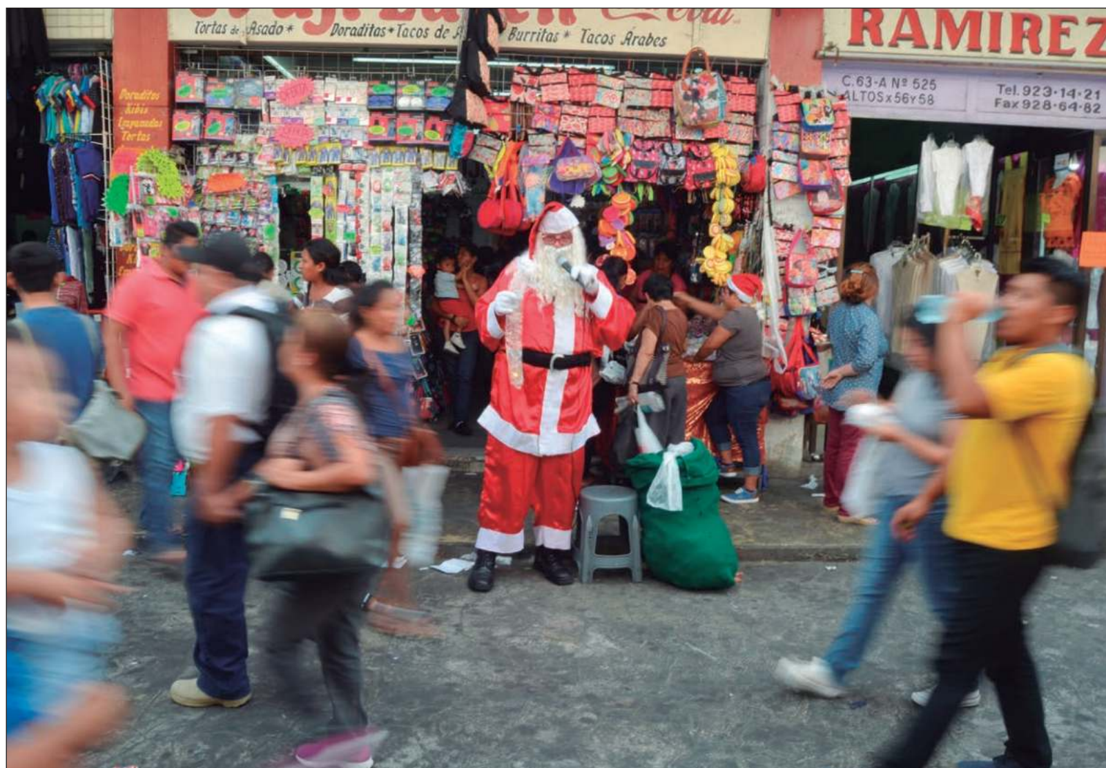
▲ “Demos espacio a la fraternidad y la hermandad para ganarle terreno a las discusiones que nos parten el alma”.