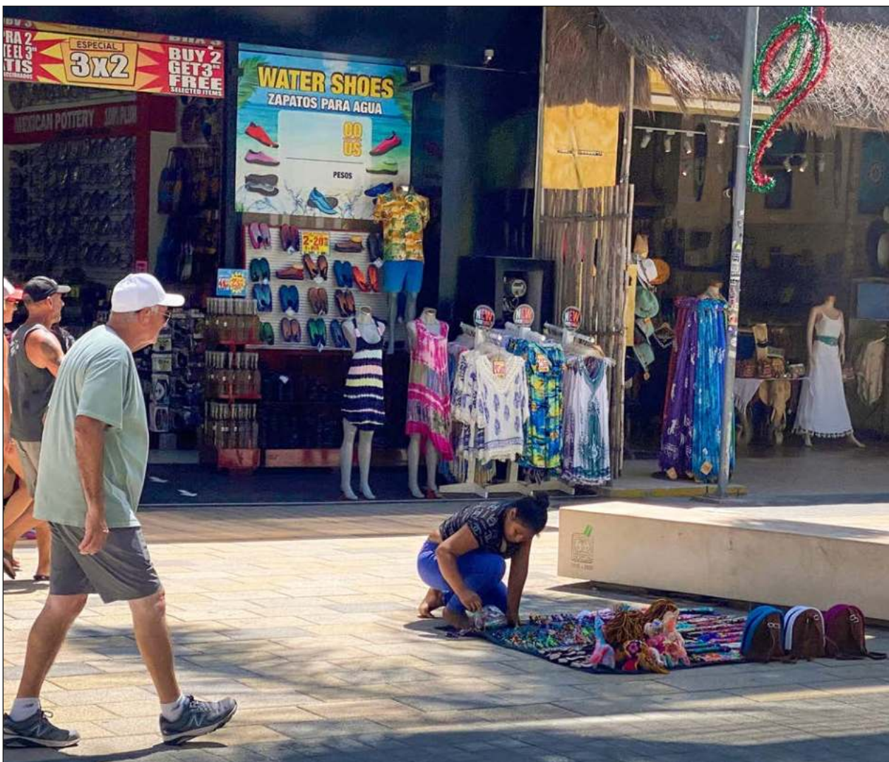
▲ Restauranteros, hoteleros, vendedores de artesanía y hasta microempresarios de Tulum verán un impacto positivo en los siguientes días cuando inicie la temporada de manera oficial, anticipó la Canaco-Servytur.

El funcionario declaró que estas medidas son con la intención de preservar la tranquilidad y calma de la zona costera de Tulum.