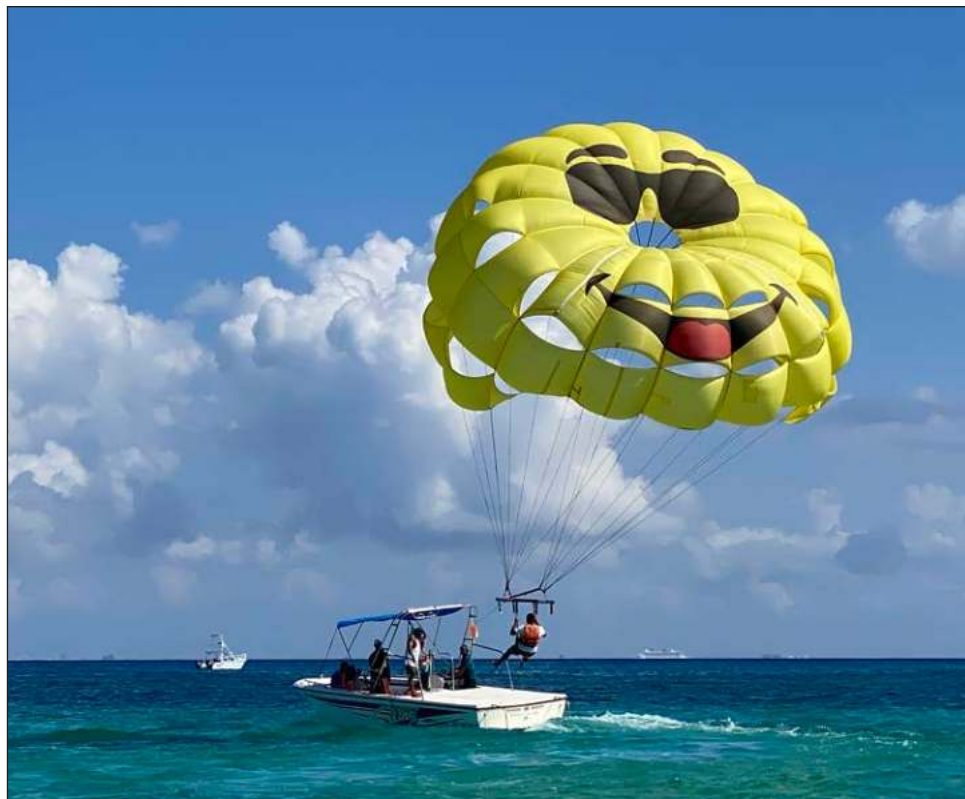
▲ El Consejo de Promoción Turística de Quintana Roo trabajará con el sector privado para determinar los mercados prioritarios y cuáles pueden potenciar objetivos.

Se trata de aprovechar la marca el Caribe Mexicano como una descripción de lo que es Quintana Roo, pero