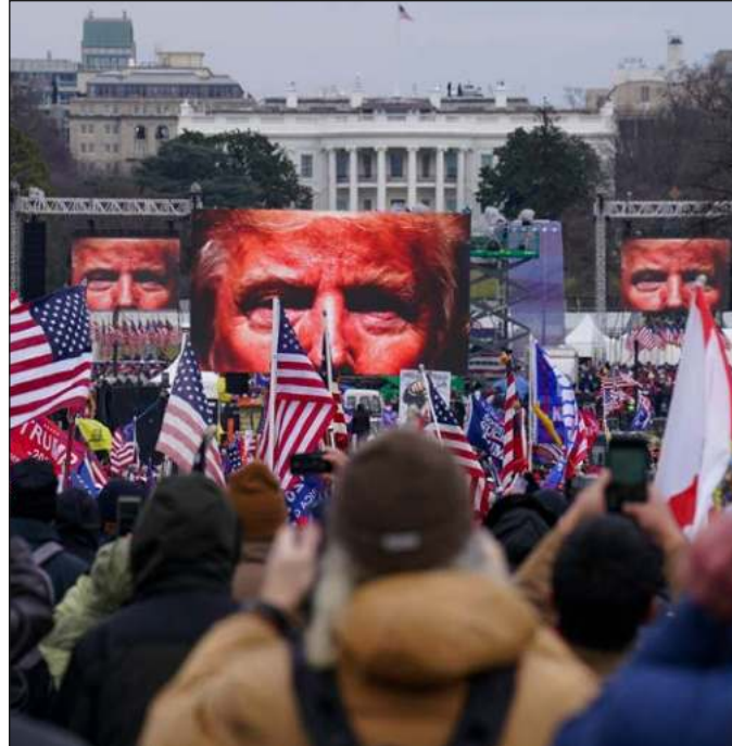
▲ Si Donald Trump fue capaz de dar un zarpazo como el del 6 de enero de 2021 con tal de permanecer en la Casa Blanca, cabe preguntarse qué haría para evitar un juicio o pisar la cárcel.

Cabe recordar que el esclarecimiento de lo ocurrido el 6 de enero se lleva a cabo en distintas instancias. En una de éstas, un jurado declaró culpables de sedición a integrantes de las turbas ultraderechistas que irrumpieron armados en el Capitolio; en forma paralela, se encuentran bajo la mira de la justicia las maniobras de Trump para trastocar su derrota electoral en victoria y para hacerla pasar como producto de un “fraude”; asimismo, hay una pesquisa en curso por la sustracción ilegal de documentos clasificados de la Casa Blanca por parte de quien fue su huésped principal entre 2017 y 2021, y por añadidura la empresa inmobiliaria de Trump fue declarada culpable de defraudar al fisco a lo largo de tres lustros.