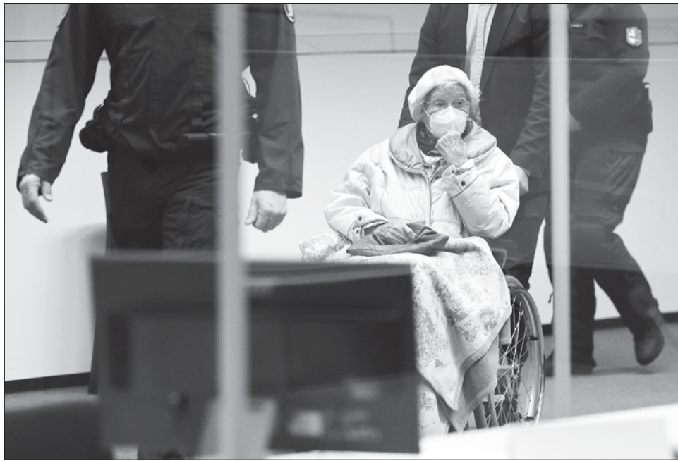
▲ El trabajo administrativo de Irmgard Furchner, hoy de 97 años, aseguró el funcionamiento del campo de concentración de Stutthof, en Polonia, según la fiscalía.

“Siento todo lo que sucedió”, declaró ante la instancia regional en la ciudad norteña de Itzehoe.