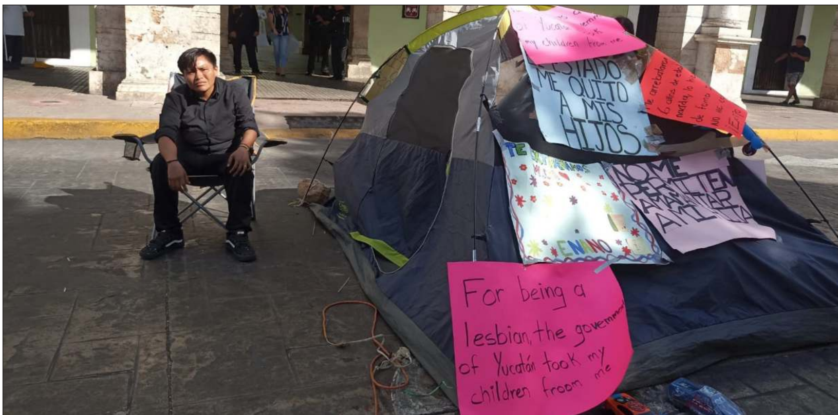
▲ La mujer mantiene una manifestación frente al Palacio de Gobierno luego de que la Procuraduría de Protección de Niñas, Niños y Adolescentes del Estado de Yucatán tomó la custodia de su bebé recién nacida y su hijo de seis años por ser lesbiana y "no apta" para ser madre.