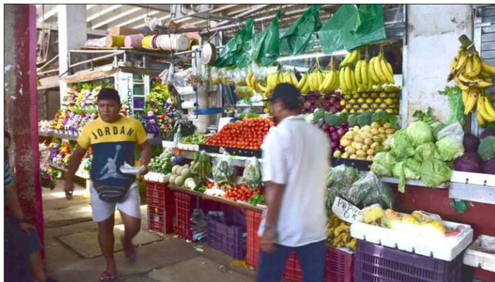
▲ En frutas y verduras se observa la mayor inflación, pues el incremento en sus respectivos precios va del 50 al 120 por ciento, según el monitoreo de Grupo Consultor de Mercados Agrícolas.

De acuerdo con el Instituto Nacional de Estadística y Geografía, la inflación general de noviembre se ubicó