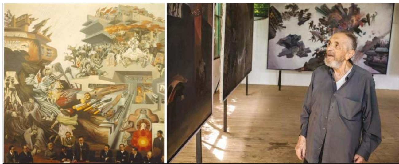
▲ La obra mide unos siete por siete metros, y representa la subyugación del trabajo humano ante las máquinas y la tecnología, lo cual despierta solidaridad entre la clase trabajadora.

La obra mide unos siete por siete metros, y representa la subyugación del trabajo humano ante las máquinas y la tecnología, lo cual despierta solidaridad en la clase trabajadora, pero también resistencia, resaltada por las banderas rojas de la huelga y las antorchas, reprimida con la fuerza inhumana de los soldados-