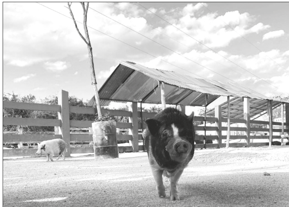
▲ El santuario ha trabajado desde hace más de 10 años en el rescate de perros y otros tipos de animales, como cerdos, caballos y tortugas.

La petición precisa que Tierra de Animales ha trabajado desde hace más de 10 años en el rescate, rehabilitación y dando en adopción a perros esterilizados, así como el rescate de todo tipo de animales y diversas campañas de concientiza-