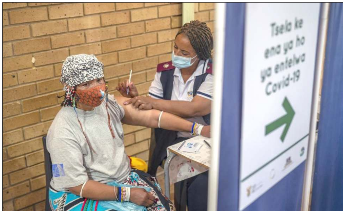
▲ La gran interrogante de con qué periodicidad se tendrá que recibir una vacuna contra el Covid constituye un desafío para los expertos en esta etapa de la pandemia.

El próximo 31 de diciembre se cumplirán dos años desde que la OMS recibió la primera notificación sobre casos de una neumonía de tipo desconocido detecta-