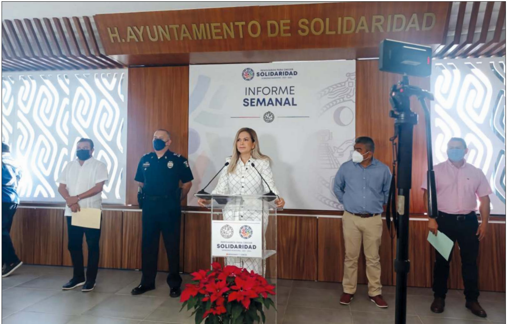
▲ La actual administración municipal detectó 62 áreas con irregularidades, y estimó un quebranto financiero por 75 millones de pesos.