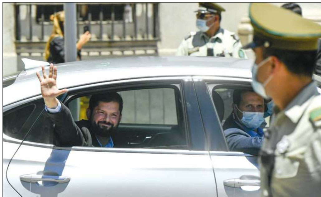
▲ Deben observarse con cautela las perspectivas transformadoras del gobierno que se iniciará en breve, pues el legislativo está fragmentado en 20 partidos y cuatro coaliciones.

Por último, el triunfo de Boric es, a no dudarlo, un signo sumamente positivo para América Latina, pues no cabe duda que el nuevo presidente chileno se sumará a los gobiernos progresistas surgidos en años recientes.