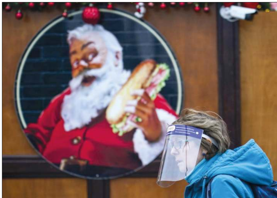
▲ Doce personas han muerto en Reino Unido tras contagiarse con la variante ómicron, dijo el lunes el viceprimer ministro Dominic Raab.

El primer ministro Mark Rutte anunció el sábado el confinamiento total de Países Bajos, ordenando el cierre de todas las tiendas, excepto las esenciales, así como de restaurantes, peluquerías, gimnasios, museos y otros lugares públicos desde el domingo hasta al menos el 14 de enero.