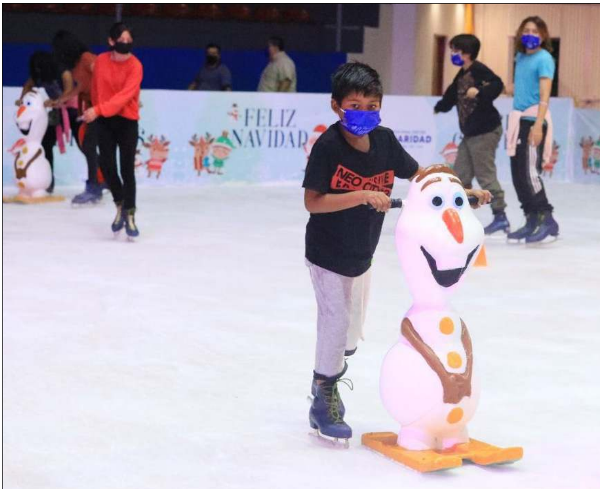
▲ Tu yáak'abil le domingo máanika', j k'a'aytab u káajal u meyaj u kúuchil u sáal xiímbal máak yóok'ol bat te'e le quintanarroil noj kaajo'. Le je'elo', jump'éeel kúuchil ti'al u náaysaj óol, ts'o'okole' x ma' bolil. Beyxan, ma'ili'