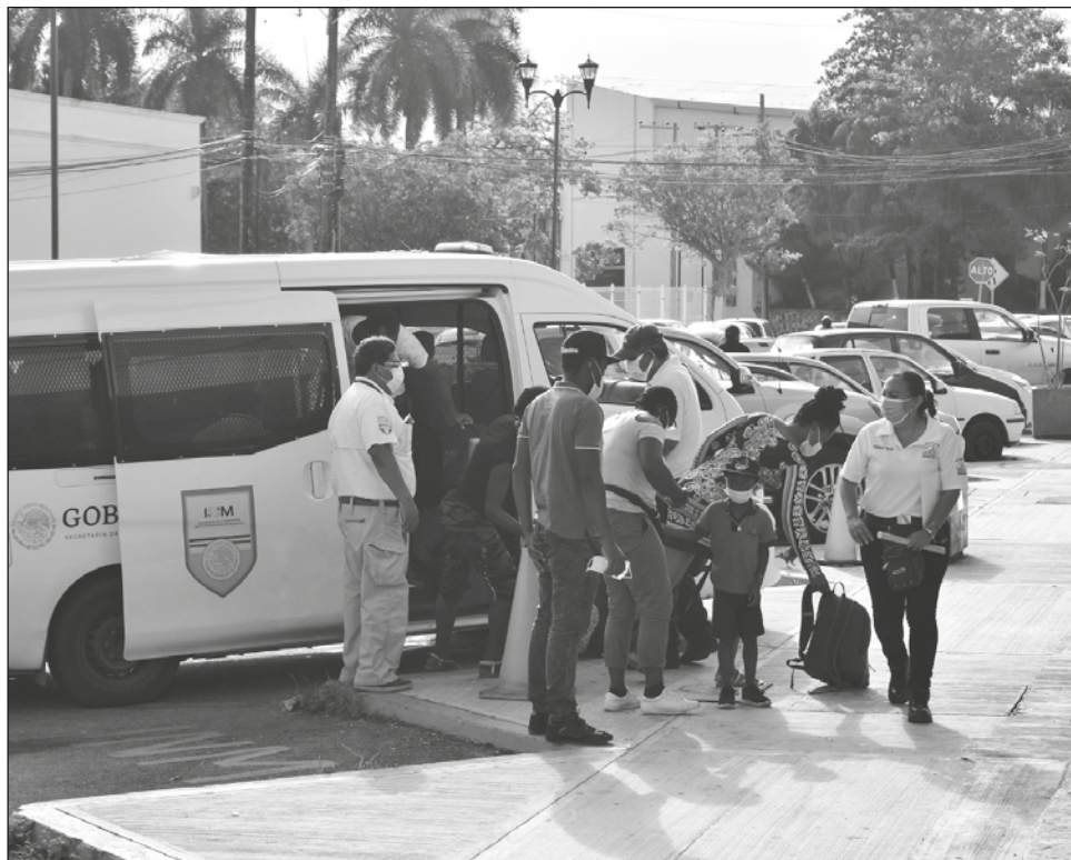
▲ Unos mil 500 migrantes habían sido relocalizados temporalmente.

Según el reporte de actualización fueron unos mil 500 los migrantes que fueron relocalizados a Campeche para la regularización de sus visas, misma que tendrá duración de un año a partir de sus entregas para que estos puedan movilizarse por el país sin que sean detenidos y posteriormente deportados a sus países de origen.