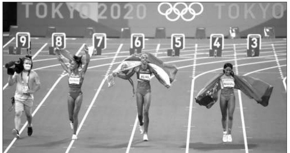
▲ La venezolana Yulimar Rojas (centro), tras ganar la medalla de oro del salto triple en los Juegos Olímpicos de Tokio, el pasado domingo 1 de agosto.

El trasfondo: el siete veces campeón Lewis Hamilton remontando en las últimas carreras de la temporada en un fallido intento para contener a su retador Max Verstappen. La emoción: el asombro cuando chocaron en el Gran Premio de Italia, donde el Red Bull de Verstappen se encaramó encima del Mercedes de Hamilton.