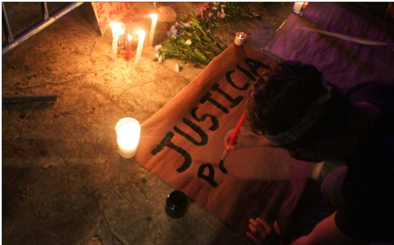
▲ La falta del ejercicio expedito de justicia está hecho para que la impunidad sea la norma.