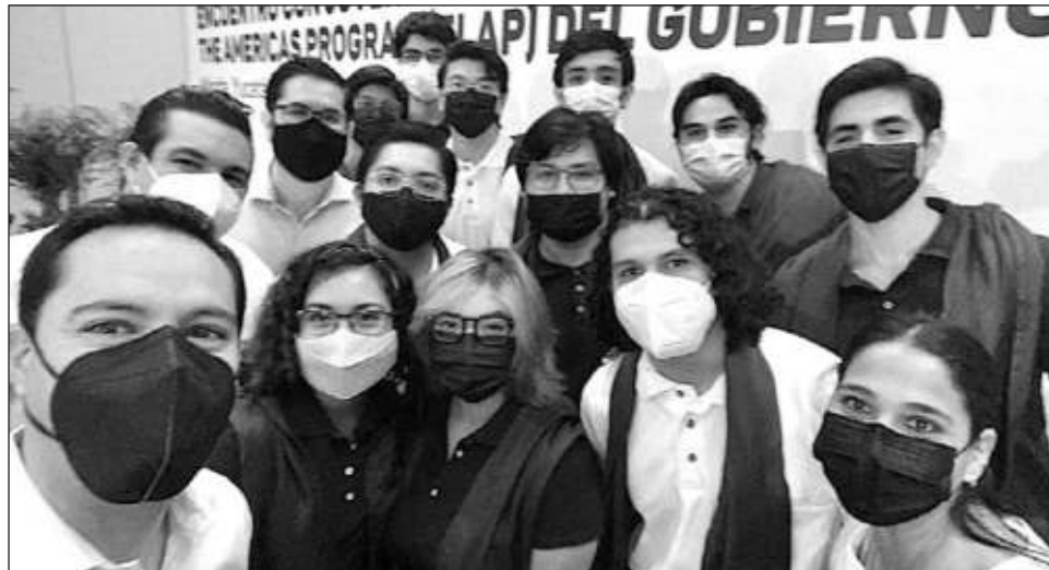
▲ Siete estudiantes de la Universidad Politécnica de Yucatán y cuatro de la Universidad Tecnológica Metropolitana forman parte del Emerging Leaders in the Americas Program.