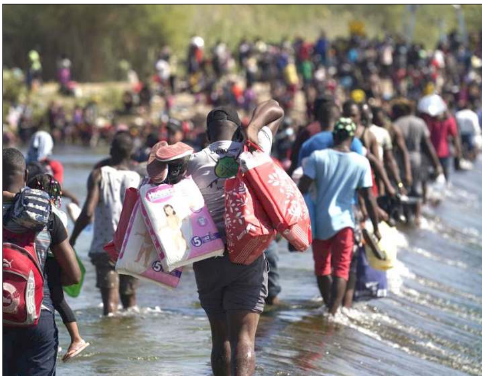
▲ Los visados adicionales suponen un ligero descenso respecto de los 22 mil puestos a disposición para la segunda mitad del año fiscal 2021.