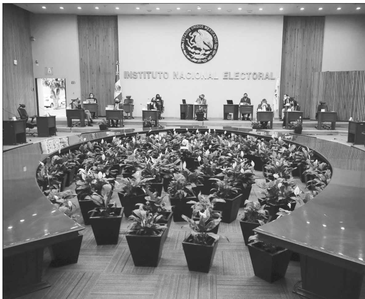
▲ En el fondo, el esquema IFE-INE sigue privilegiando el reparto de consejerías entre los partidos y la toma de decisiones conforme a los intereses de las cúpulas.

ESE MODELO NACIDO en el salinismo y maquillado en fechas posteriores no obedece al mandato popular depositado en las urnas en 2018 ni a la esperanza de cambio que, según las recientes encuestas de opinión, le dan a López