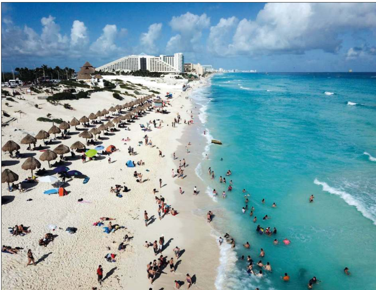
▲ Durante la semana 49 de este 2021, Cancún obtuvo el mayor nivel de ocupación hotelera con 76.3%, superando a todos los destinos turísticos de México.

“Por lo tanto, bautizar con este nombre de marca turística mundial al nuevo aeropuerto del Caribe Mexicano es la mejor opción”, destaca el documento presentado.