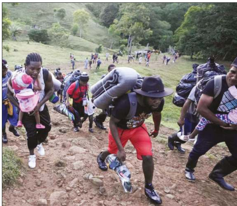
▲ As local economies offer good jobs and training for their citizens, the incentive to turn to crime will be reduced and people will want to stay at home.

CANADIAN MINISTER FOR International Development Harjit S. Sajjan said that working together is the only way we can end the forced displacement of people from Central America and Mexico. It is a major humanitarian and refugee crisis that disproportionately affects women and girls. By working with partners like the International Organization for Migration and the United Nations Refugee Agency, Canada will support initiatives that will reinforce the safety and well-being of women and girls by improving living conditions and protection mechanisms.