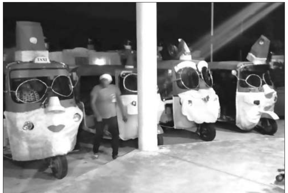
▲ Como un detalle de la caravana que organizaron las mujeres taxistas, estuvo la personificación de los vehículos como Santa Claus.

Esta es la primera asociación formada por mujeres mototaxistas en todo Yucatán, por lo cual, los trámites legales para consolidarla les tomaron casi dos años, hasta lograrlo en julio de este año, con 37 mujeres al frente para realizar labores en favor de su comunidad, “nosotras nos dedicamos no nada más a hacer el evento como el que hizo, sino también hemos hecho entregas de medicamentos, sillas de ruedas y mucha labor altruista como limpieza de calles”.