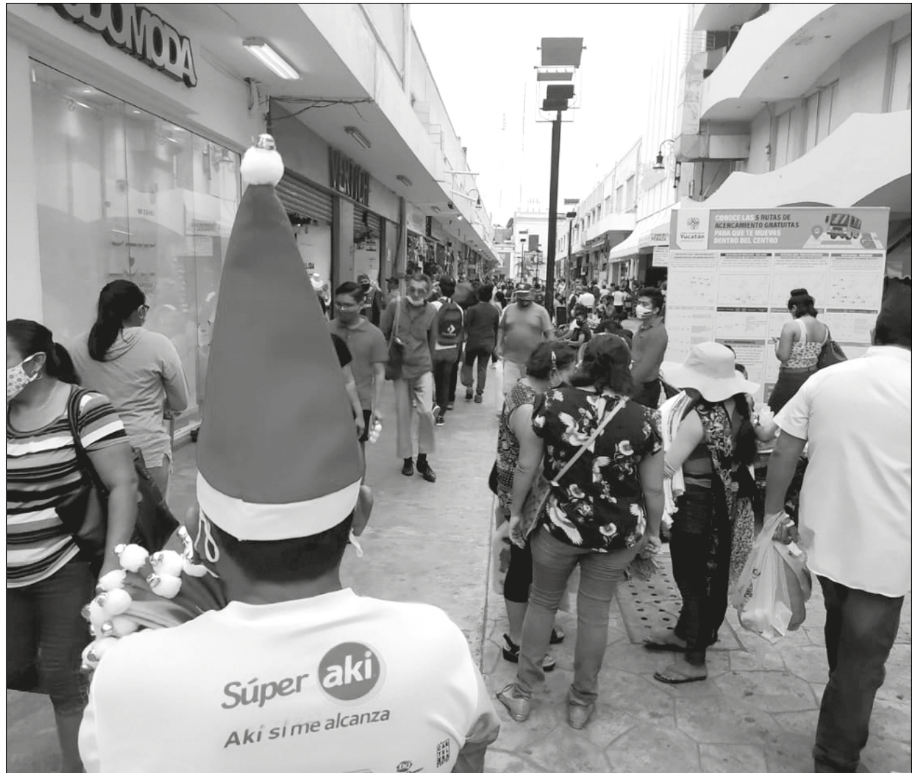
▲ A partir de la primera quincena de diciembre se observó un incremento de la afluencia de personas en el centro histórico de Mérida, supermercados, tiendas departamentales y plazas comerciales.

A partir de la primera quincena de este mes, subrayó, se observó un incremento de la afluencia de personas en el centro histórico de Mérida, supermercados, tiendas departamentales y plazas comerciales, debido a que los trabajadores empezaron a recibir sus aguinaldos.