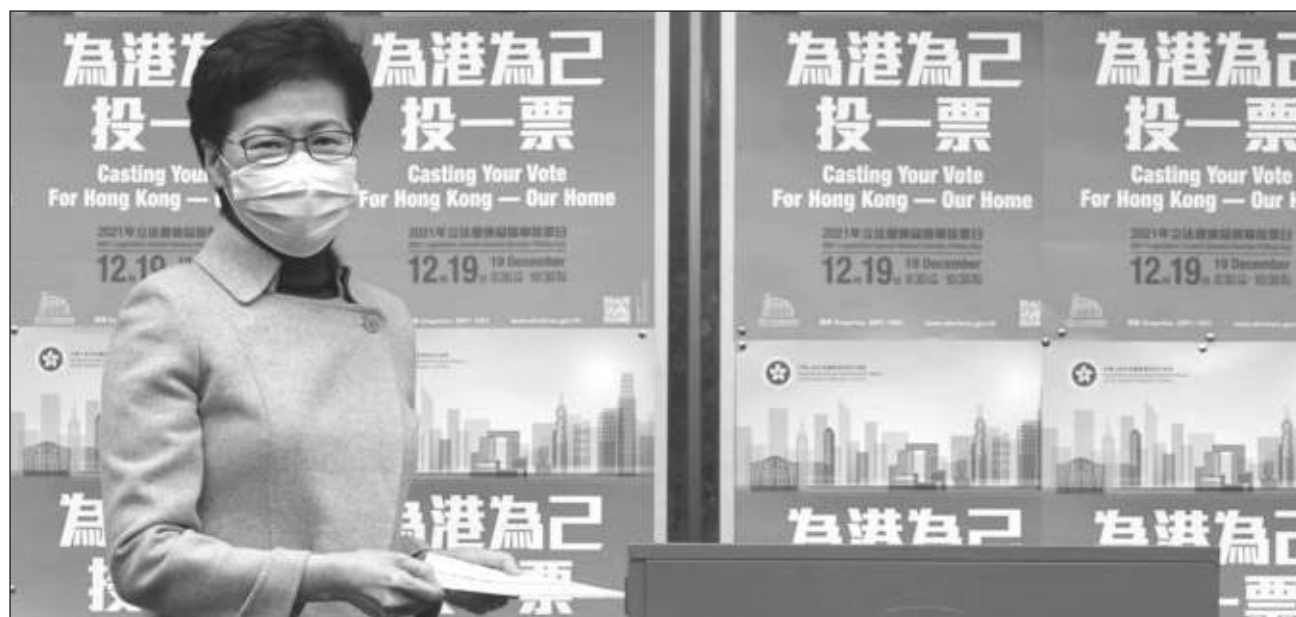
▲ La controvertida reforma electoral hongkonesa permitió a algunos candidatos reelegirse, pero también llevó al órgano legislativo a nuevas figuras políticas ajenas a la cúpula del poder en la región autónoma china

“Las cosas han cambiado mucho durante la última década. En mi mandato he