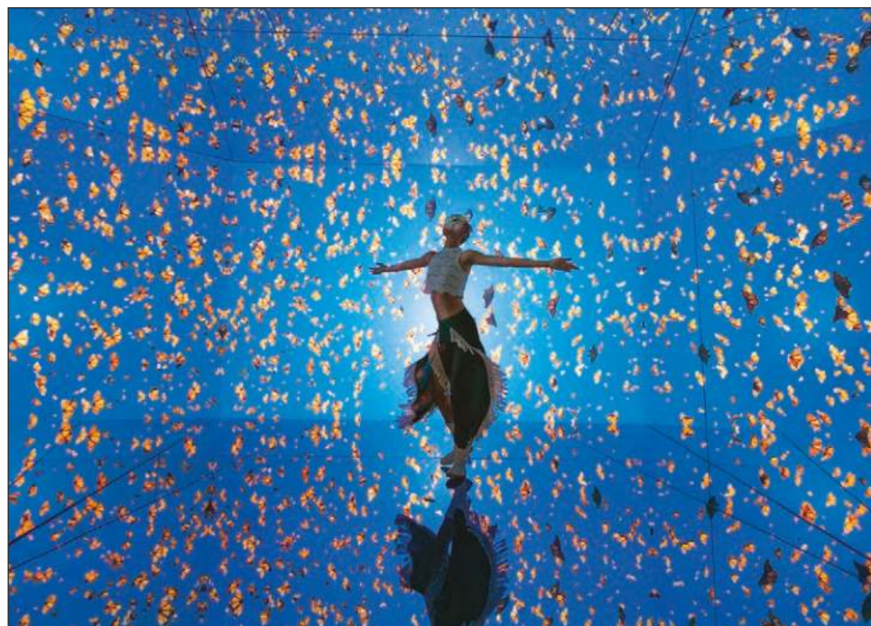
▲ En Santuario, Pepe Soho realiza un homenaje a la naturaleza del país, mediante cuatro espejos infinitos y proyecciones de mariposas monarca, luciérnagas y ballenas.

En la exhibición que se presenta en Dubái, el público se encontrará con tres instalaciones que forman el proyecto Mystika . Santuario es la primera instalación de cuatro espejos infinitos con una proyección del santua-