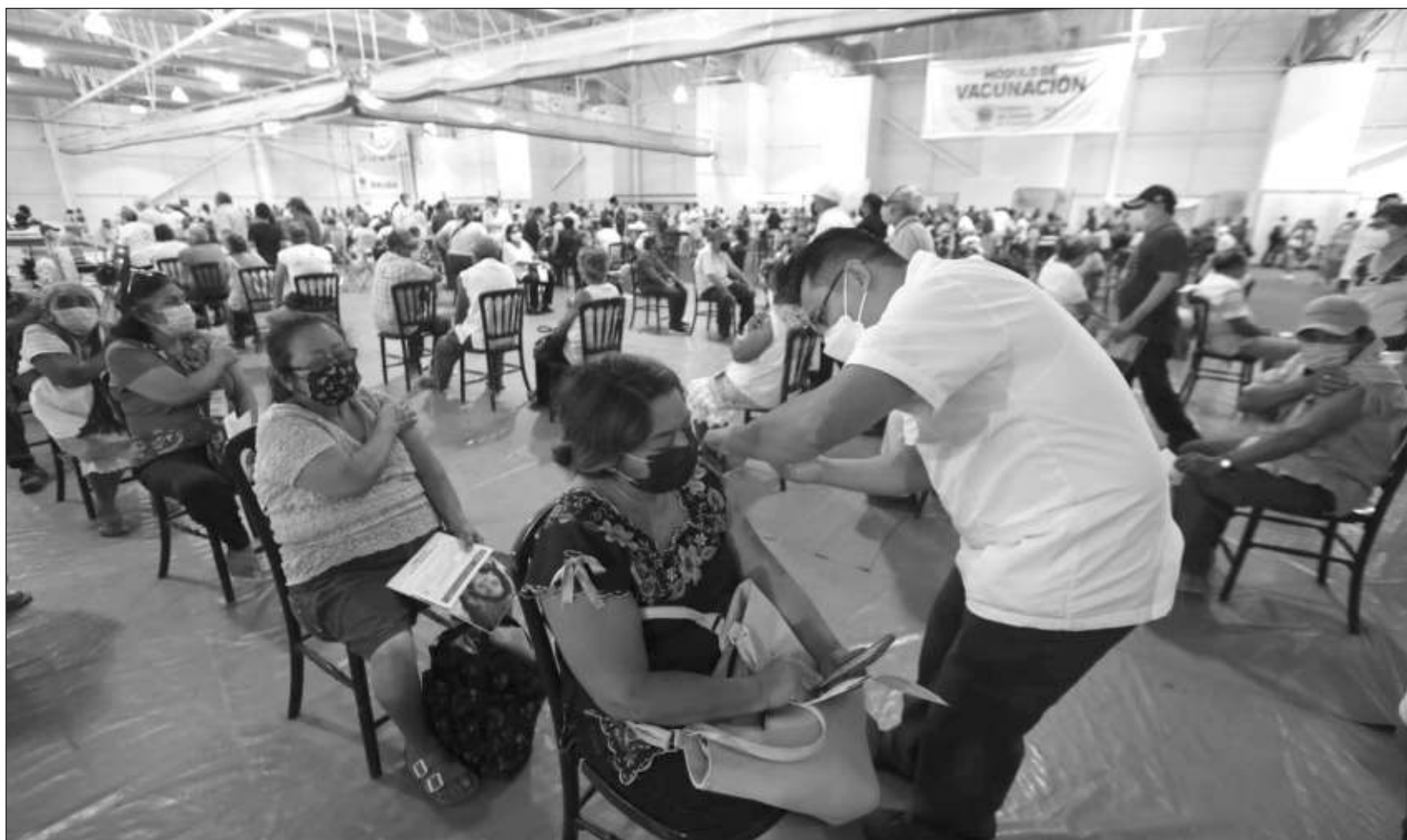
▲ La aplicación de la vacuna de refuerzo, de la farmacéutica AstraZeneca, continuará hoy en Mérida, en el Multigimnasio Socorro Cerón de la Unidad Deportiva Kukulcán y el Centro de Convenciones Yucatán Siglo XXI.