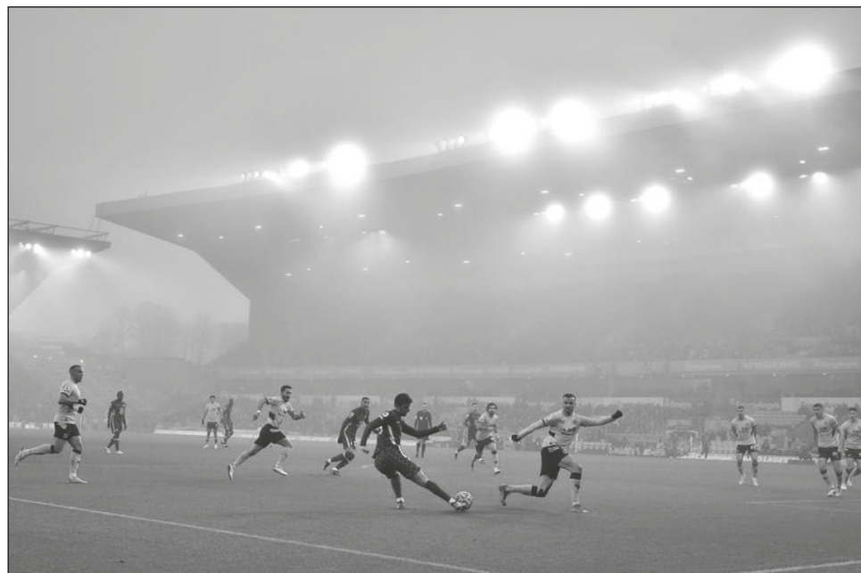
▲ La Liga Premier no pausará su temporada, a pesar del incremento de casos de Covid-19. En la imagen, un aspecto del duelo Chelsea-Wolverhampton del pasado domingo.

“Aunque reconocemos la cantidad de equipos que tienen brotes de Covid-19 y los retos”, señaló el circuito tras la llamada, “es la intención colectiva de la liga continuar