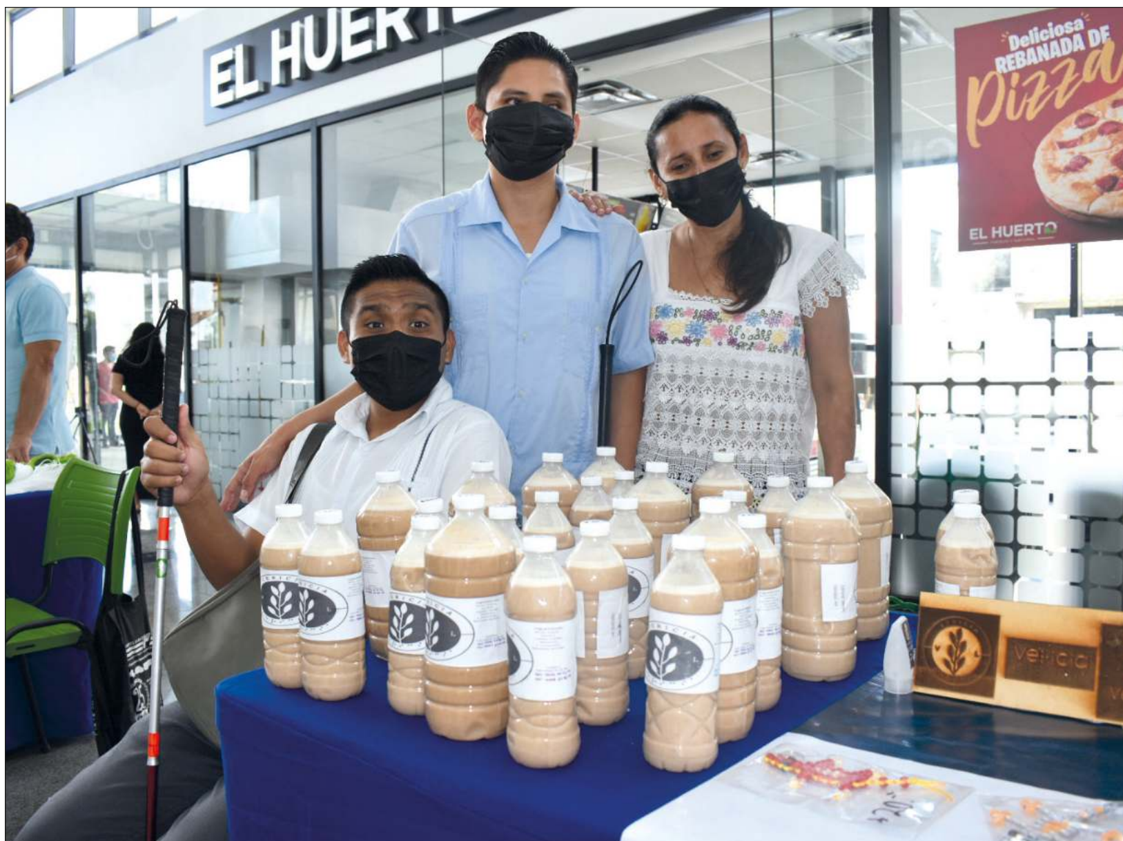
▲ En Yucatán, quienes emprenden lo hacen en el sector de alimentos y bebidas y en la industria textil, empleando insumos endémicos y materias primas y polímeros amigables con el medio ambiente.