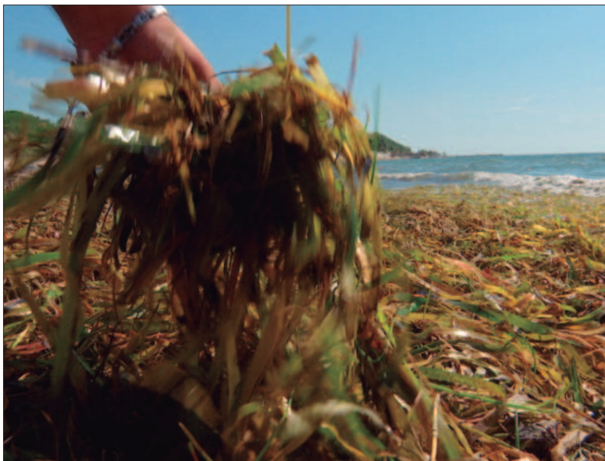
▲ "En Puerto Morelos, el problema fue el arribo excesivo de sargazo a la orilla del mar y en Sisal, la falta de conocimiento sobre las macroalgas que ahí llegan. Nuestro objetivo fue promover la participación ciudadana para monitorear colaborativamente la abundancia y diversidad de esas macroalgas".

EN PUERTO MORELOS , el problema fue el arribo excesivo de sargazo (macroalga marina) a la orilla del mar y en Sisal, la falta de conocimiento sobre las macroalgas que ahí llegan. Nuestro objetivo fue promover la participación ciudadana para monitorear