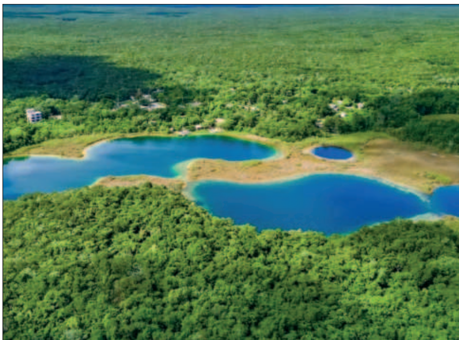
▲ Algunos puntos considerados para designar estas áreas como zonas protegidas, son elementos de biodiversidad que existen y el ecosistema.