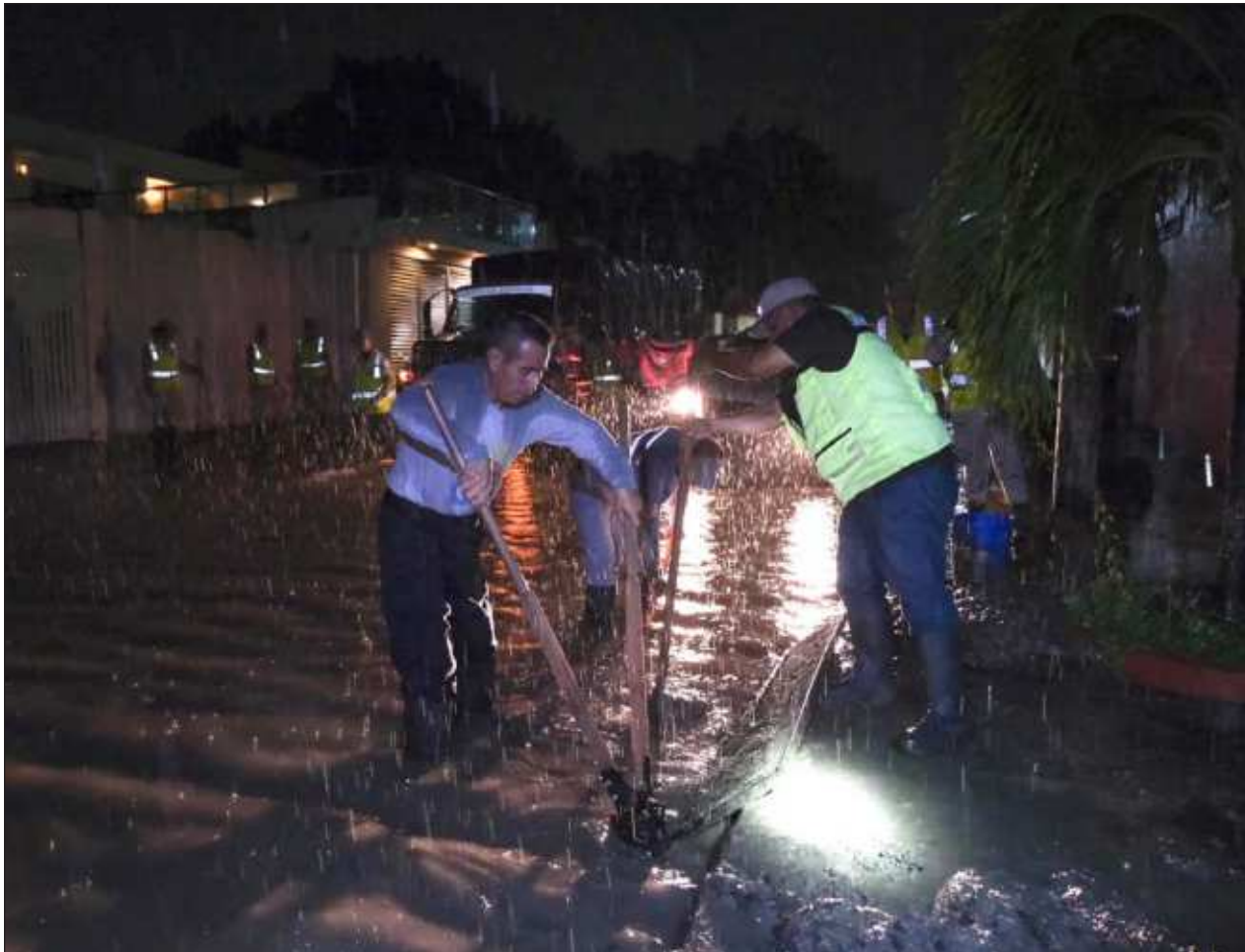
▲ Cuadrillas de trabajadores laboran para mantener las calles secas y transitables.

La alcaldesa anunció la puesta en marcha de proyectos como Quinta Sostenible, que contempla el mejoramiento de esta importante vialidad turística, los comités de vigilancia, a instalarse en la misma Quinta Avenida; y Mercado de la 10, para revitalizar este inmueble; la plataforma Capaces, para la capacitación integral, y la app Let's Playa, para la difusión de experiencias y promoción turística.