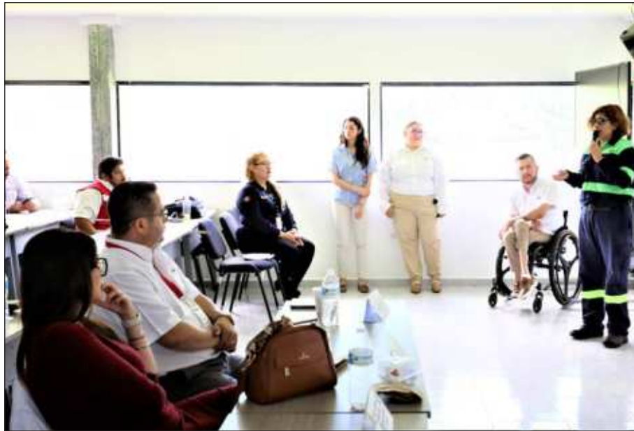
▲ Kekén recibió el reconocimiento por parte del IMSS debido a sus múltiples esquemas alineados a normativas que garantizan instalaciones funcionales para laborar en óptimas condiciones y prácticas favorables para la salud.

Este reconocimiento de validez nacional es entregado por el organismo paraestatal a todas aquellas compañías que cumplan con cinco líneas de acción principales como la prevención de accidentes de trabajo en mano y tobillo; trastornos musculoesqueléticos; enfermedades laborales relacionadas con factores de