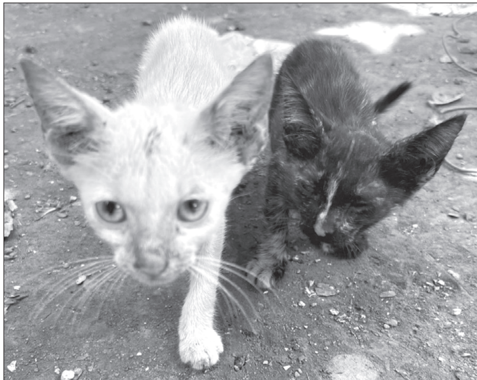
▲ La campaña de esterilización está destinada para animales domésticos en situación de calle, así como a familias con recursos limitados.

La iniciativa ofrece 100 lugares gratuitos para que la población pueda llevarlos sin inconveniente