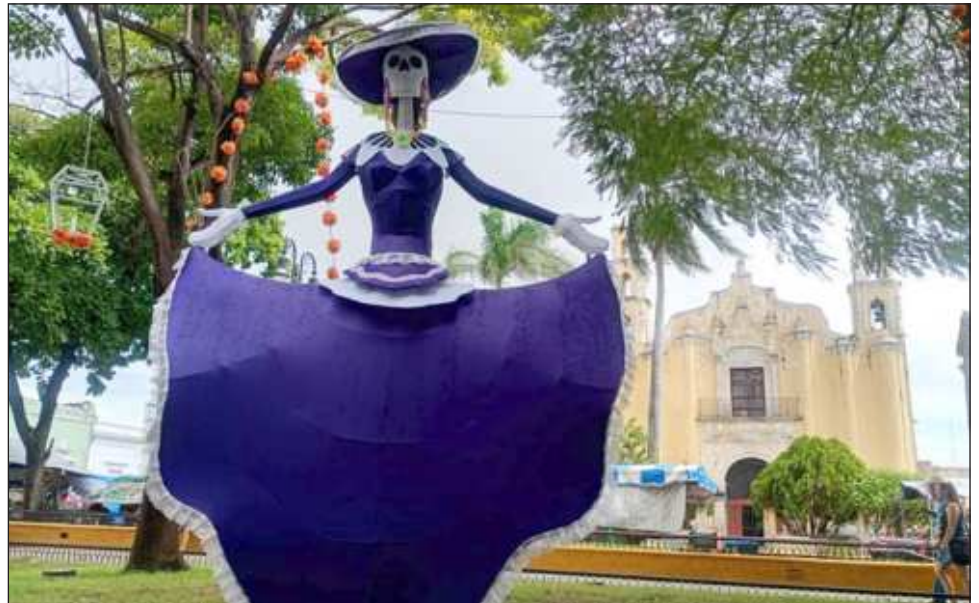
▲ Estas figuras forman parte de los adornos del Día de Muertos, instalados por el ayuntamiento de Mérida y que estarán disponibles hasta el 8 de noviembre.

La cartelera completa está disponible en merida.gob.mx/animas/ .