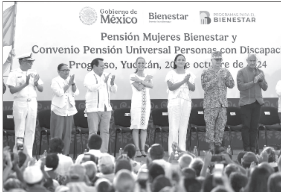
▲ Desde puerto Progreso, la Presidenta firmó el convenio de universalidad de la pensión para las personas con discapacidad, con lo que Yucatán se convirtió en la entidad número 23 en comprometerse a brindar apoyos económicos a este sector.

"Por fin vamos a hacer realidad el Puerto de Altura de puerto Progreso, iniciamos este año el trabajo porque el suelo de esta zona es muy duro y se requieren máquinas especiales para poderlo hacer, pero ya vamos a iniciar. Es un proyecto conjunto entre el gobierno del estado y el gobierno de México; además, el Tren Maya lo vamos a hacer tren de carga, no solamente de pasajeros y va a tener una línea que llegue aquí hasta