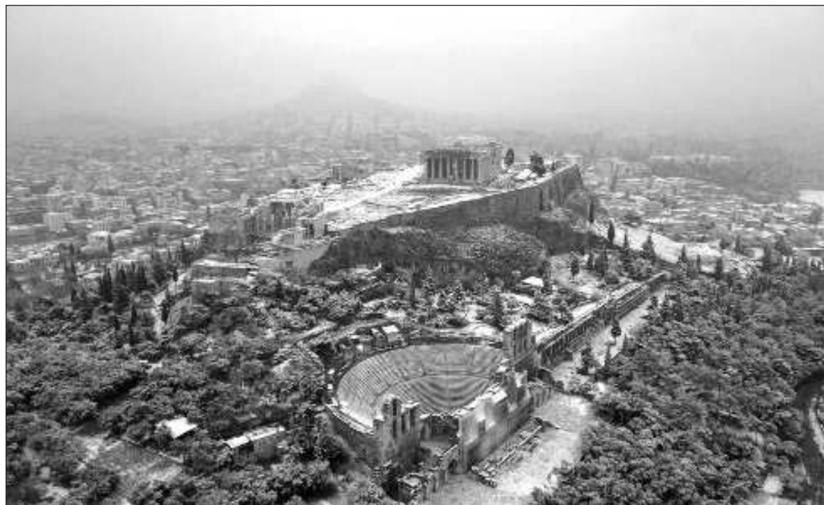
▲ “La paradoja de la democracia moderna estriba en que una elección que se gana por mayoría abrumadora reduce la calidad de la propia democracia en la medida en que la oposición minoritaria entra en un estado crítico que le impide diagnosticarse”.

Y es que la democracia moderna tuvo un origen sectario pues el derecho al voto estaba lleno de restricciones. Los primeros ejercicios democráticos en los Estados Unidos estaban acotados solamente para quienes pagaban impuestos; en Francia se instrumentó el sufragio censitario al que sólo tenían derecho algunos sectores de la sociedad como, por ejemplo, los varones propietarios de bienes inmuebles y/o aquellos que tenían altos niveles de rentas, así como los franceses blancos alfabetizados. Además, algunos sufragios tenían más valor que otros y ello implicaba en muchas ocasiones que unos pocos decidieran por