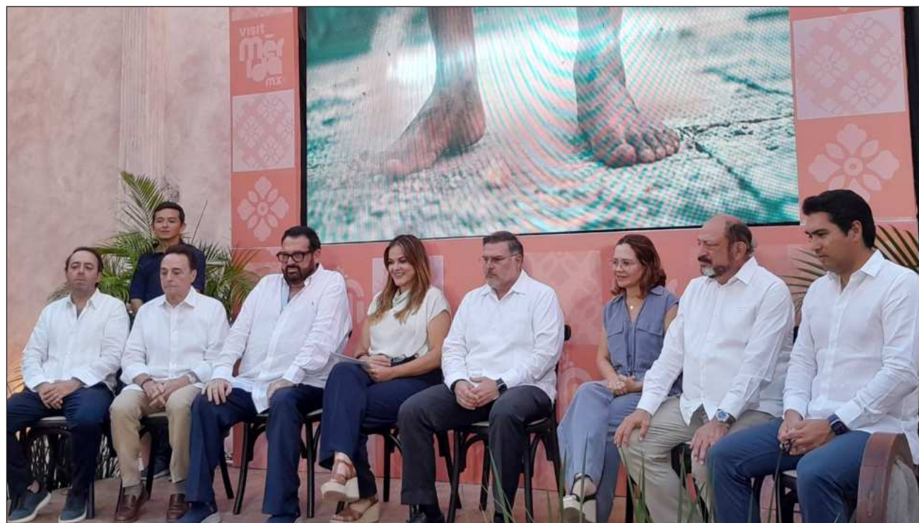
▲ Aprovechando la conexión con las tres ciudades mundialistas -CDMX, Guadalajara y Monterrey-, las autoridades del ayuntamiento de Mérida ha emprendido campañas de promoción digitales a través de plataformas digitales.

“Entre gol y gol, entre partido y partido, que vengan a la ciudad capital más segura del país a disfrutar de nuestra cultura, nuestra gastronomía y nuestra identidad cultural”, declaró la alcaldesa.