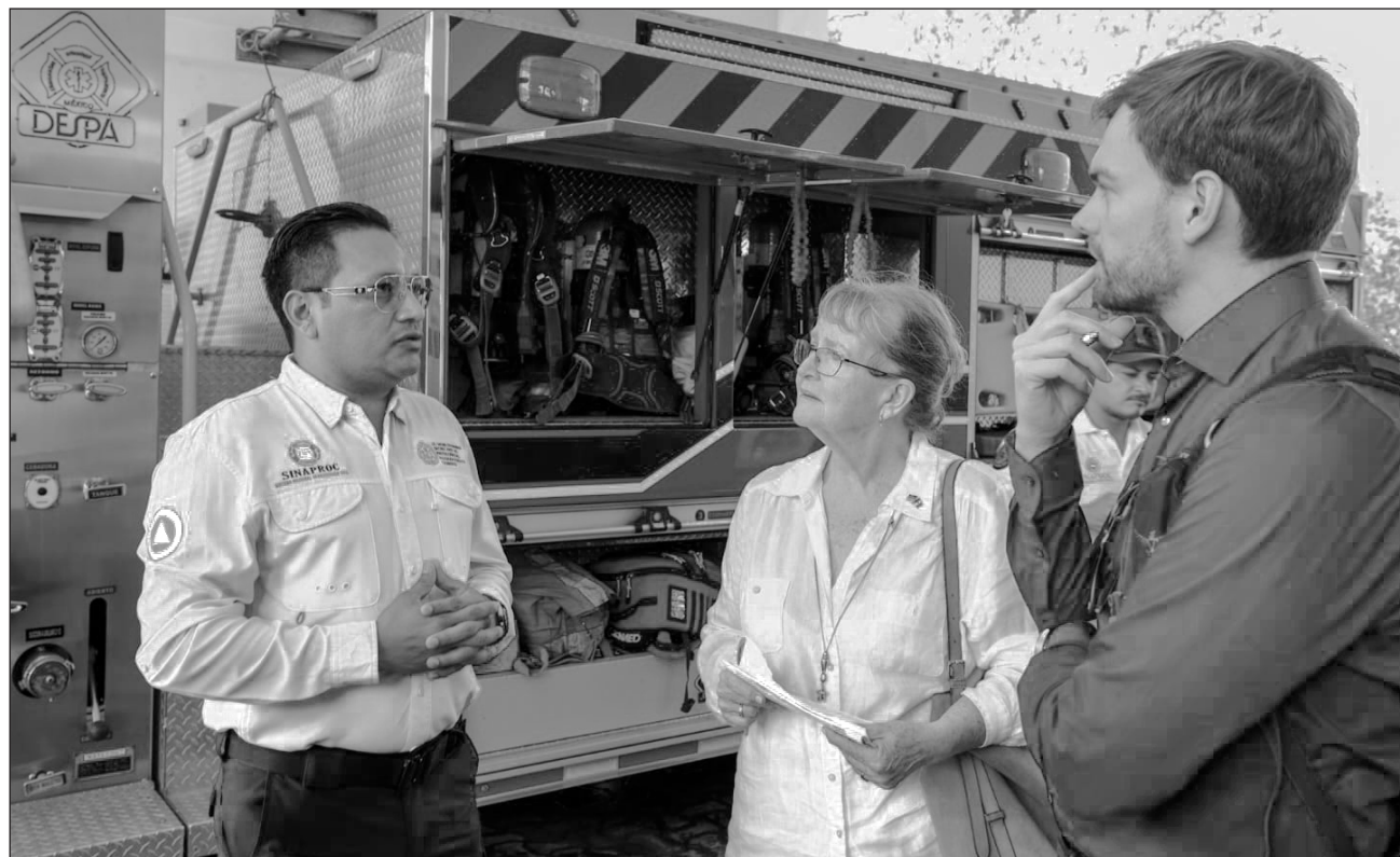
▲ En Playa 88, se realizó una demostración de primeros auxilios respiratorios.

Posteriormente, se trasladaron al Centro de Atención y Protección al Turista (CAPTA), donde la secretaria