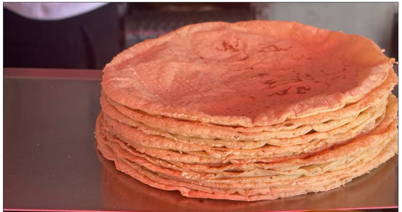
▲ Actualmente el precio de la tortilla oscila entre los 27 y 30 pesos, por lo que de mantenerse esta tendencia a la alza en el precio de los insumos, se estaría pensando en aumentar hasta un peso por kilogramo, en algunos casos, superaría los 30 pesos.

Detalló que esta alza se deriva en el incremento que ha tenido la harina de maíz, de 500 pesos más por tonelada, lo cual impacta en las utilidades de los empresarios del ramo, haciendo insostenible la actividad, sin lograr un ajuste de precios.