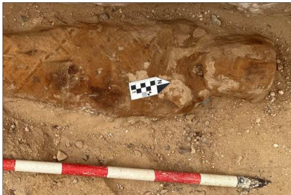
▲ El equipo de arqueólogos descubrió la estructura funeraria conocida como Tumba 65, en Al Bahnasa, Egipto.