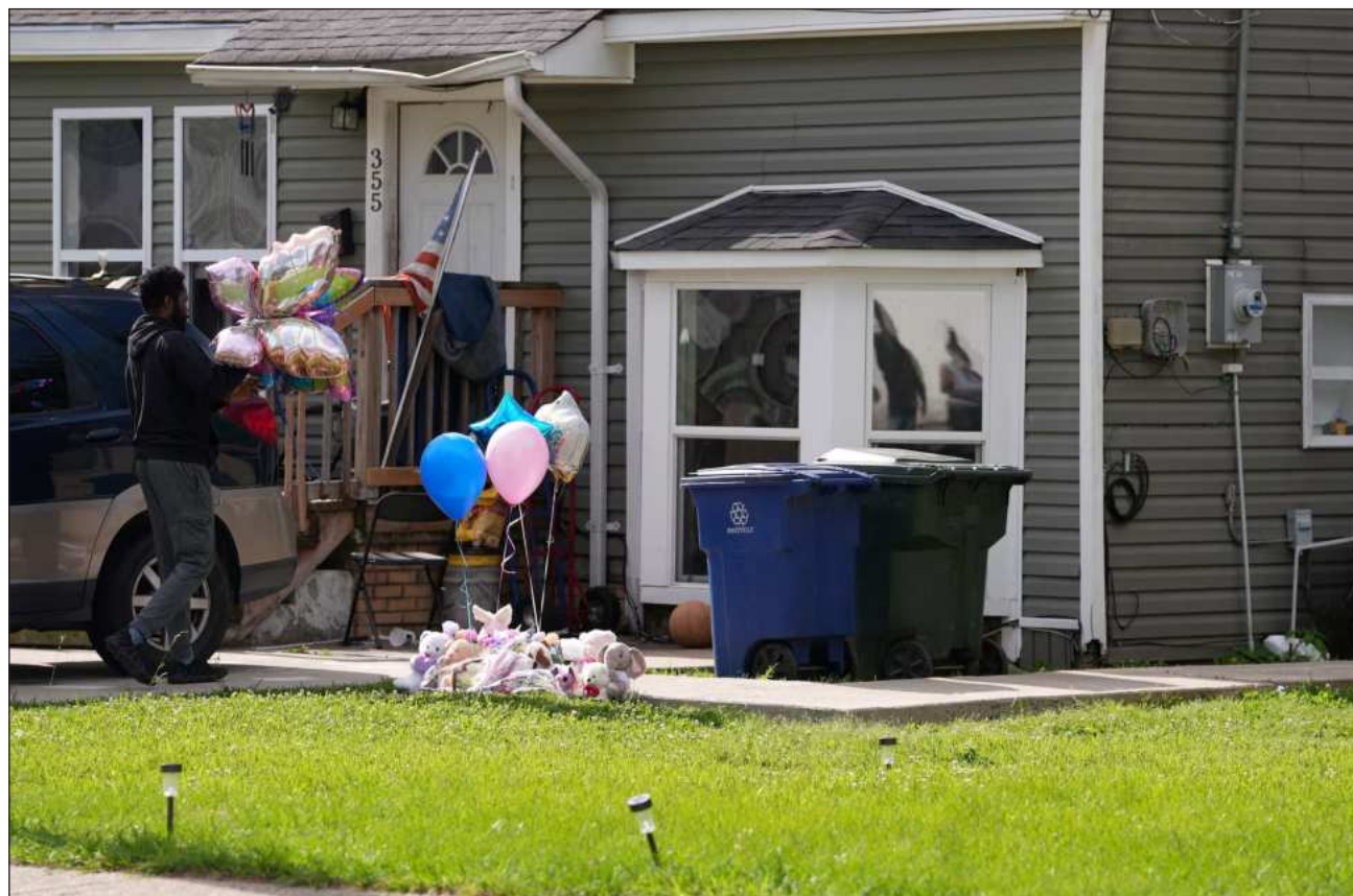
▲ “Ayer por la tarde (domingo), a esta misma hora, todos esos niños jugaban en el jardín frente a la casa”, relató un vecino.

La policía identificó al atacante como Shamar Elkins, de 31 años, quien huyó del sitio de los tiroteos en un vehículo robado y fue per-