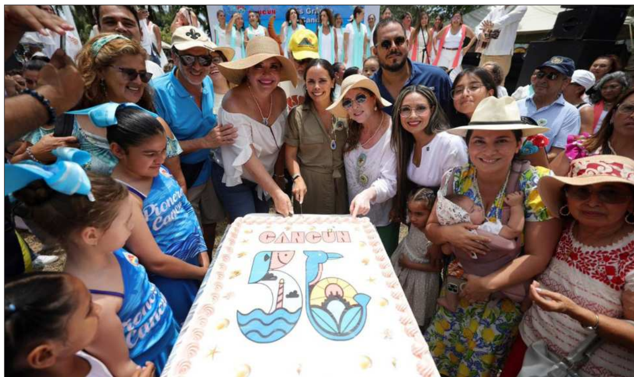
▲ El Parque Fonatur fue sede el domingo del Picnic más grande Cancún.

Para iniciar los festejos, la mañana del domingo se realizó el Desfile Cancunense, que reunió a más de siete mil personas de diferentes sectores y gremios en las calles del primer cuadro de la ciudad y los alrededores del palacio municipal.