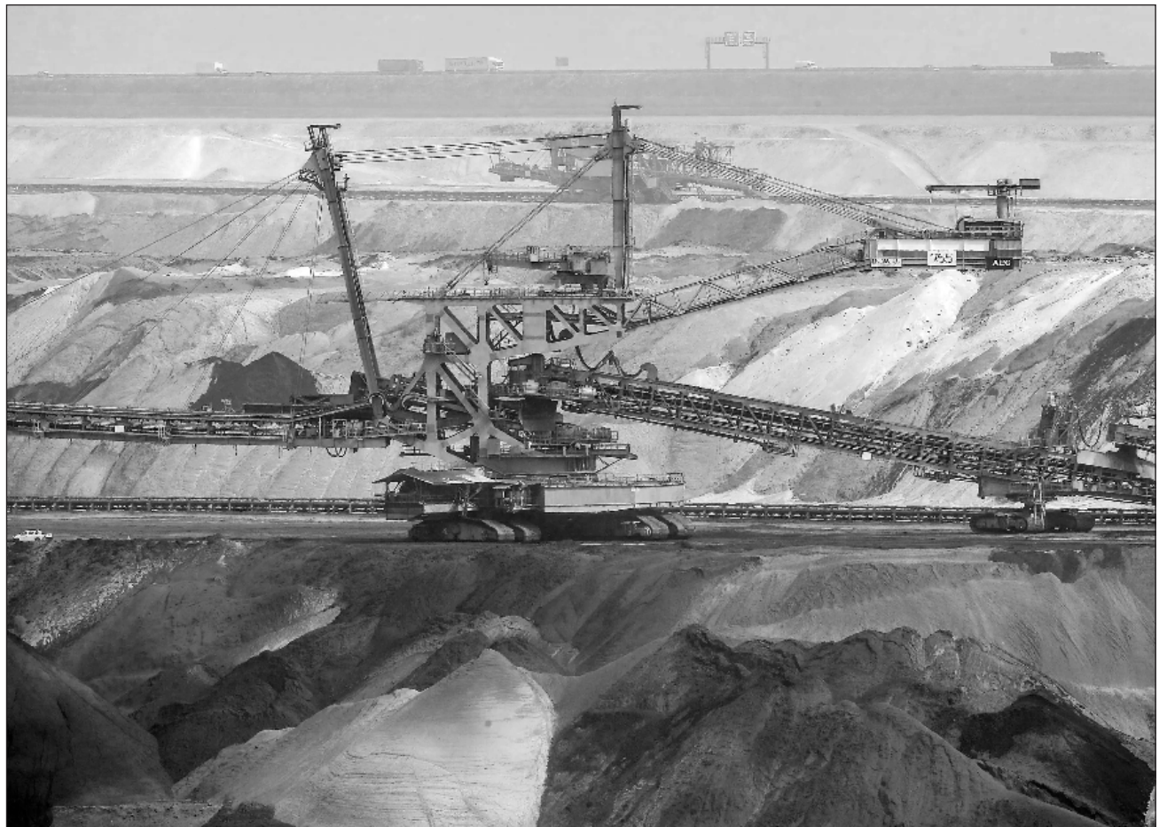
▲ Colombia busca lanzar una coalición de naciones comprometidas en impulsar la eliminación progresiva de estos combustibles.

Las conclusiones de la cita se incorporarán en una "hoja de ruta" para dejar atrás los combustibles fósiles, liderada por Brasil como país anfitrión el año pasado de la COP30.