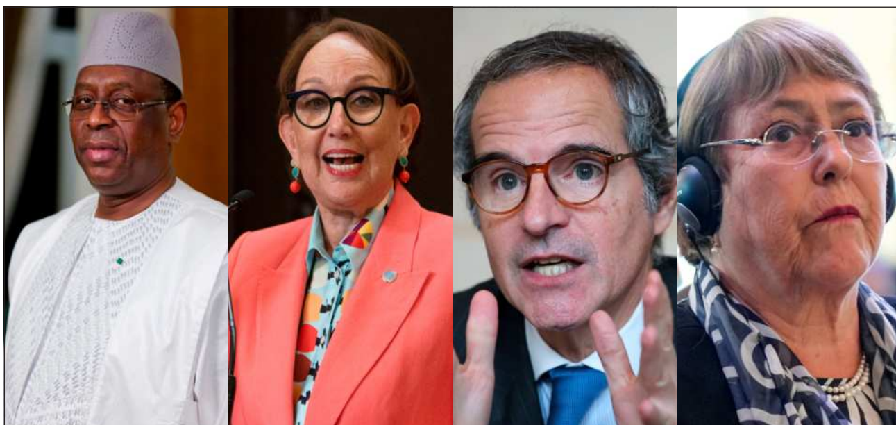
▲ Los cuatro candidatos a suceder a Antonio Guterres, se presentarán en audiencias públicas, etapa preliminar del proceso.

Sall, Grynspan, Grossi y Bacheletl serán sometidos a preguntas de 193 Estados miembros