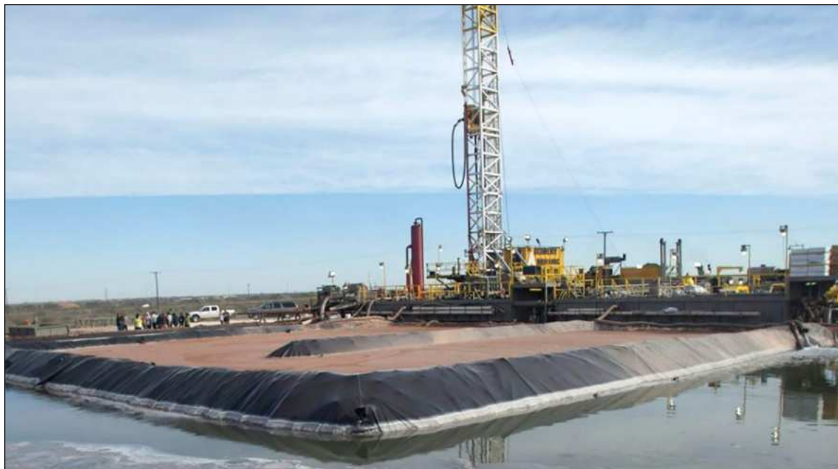
▲ “La búsqueda de soberanía energética no debe ser a costa de la verdadera soberanía nacional”.

*Institute for Policy Studies ( www.ips-dc.org )