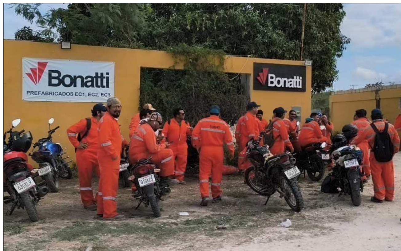
▲ Los volqueteros acusan que la empresa se justifica alegando que de vez en cuando están en oficina y, por ende, en un espacio climatizado, razón por la cual no cumplen enteramente con el equipo de seguridad.

Afirmaron que les notificaron de una reunión al mediodía con representantes de la empresa para darles información del porqué o no se puede mejorar el salario actual de estos trabajadores, además de buscar una serie de estrategias para incluso también tener un ambiente laboral sano tanto para los