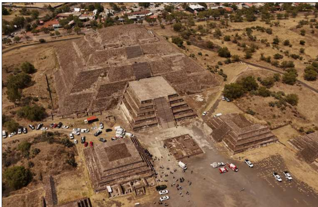
▲ El tiroteo en Teotihuacán revela un relajamiento injustificado de la seguridad interna.

El Gabinete de Seguridad tiene en manos una oportunidad para hacer ajustes en lo que haya fallado, pero especialmente para brindar garantías a quienes con motivo del Mundial de fútbol llegarán al país y aprovecharán conocer algunos de sus mayores atractivos, entre los que las zonas arqueológicas destacan por mérito propio.