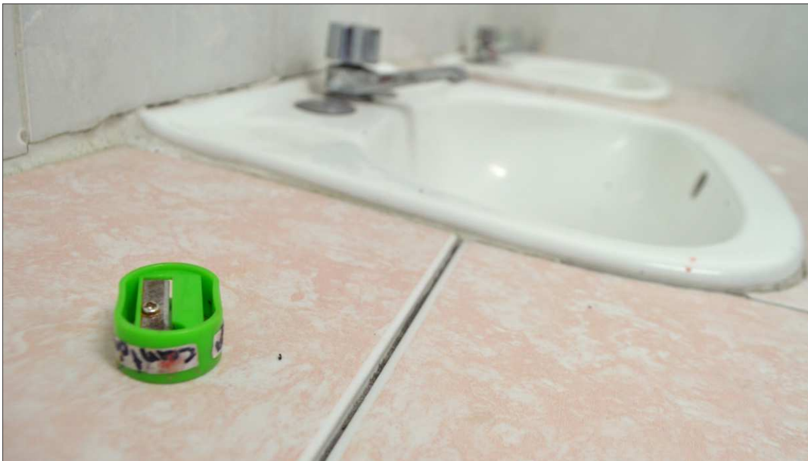
▲ “Los baños públicos, en escuelas u otros lugares, son espacios donde algunas personas expresan frustraciones, coraje, complejos, etcétera. Lo hacen con dibujos o texto. El tema es importante porque refleja una cultura que puede estar camino a mayor deterioro, cuando se trata de expresiones incorrectas”.