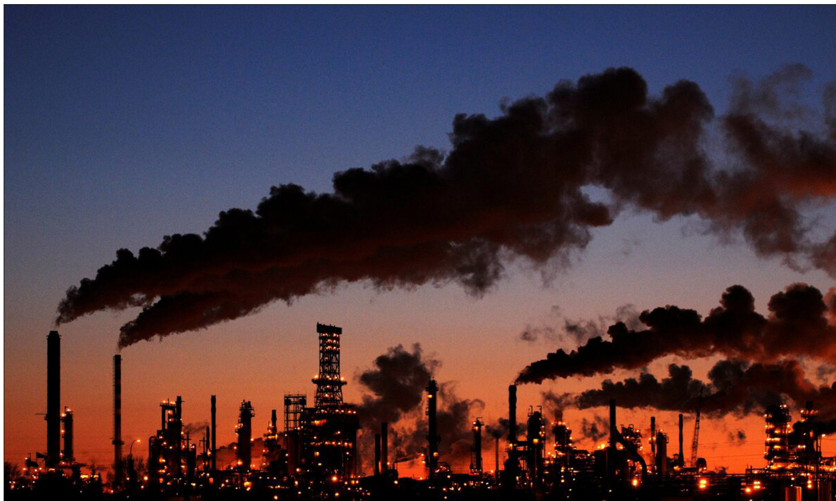
▲ Pese a los llamados para impulsar medidas ante el cambio climático, la corriente mundial apunta a que la promesa de la COP28 de Dubái está lejos de cumplirse.