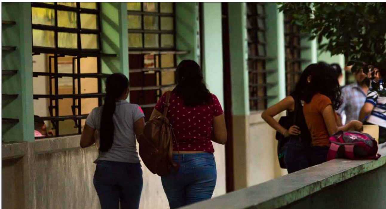
▲ La meta, señaló la Presidenta, es que las y los jóvenes se sientan incluidos en el sistema educativo.

Se proyecta crear 200 mil nuevos lugares en educación media superior para 2026