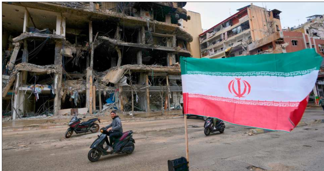
▲ Trump indicó que aún espera enviar a su equipo negociador a Islamabad para una segunda ronda de conversaciones.

Trump indicó que aún espera enviar a su equipo negociador, encabezado por el vicepresidente JD Vance, a Islamabad para una segunda ronda de conversaciones, incluso mientras Irán insistía en que no participaría hasta que Trump reduzca sus exigencias.