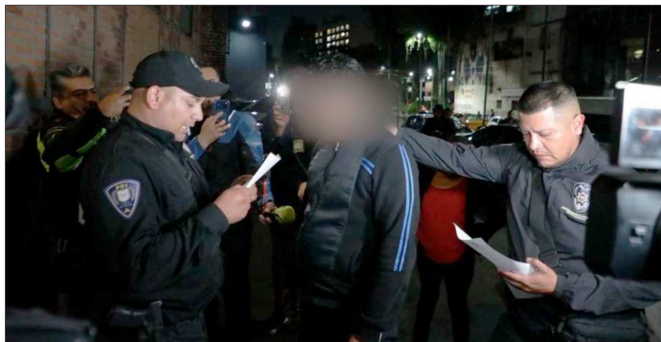
▲ La FGJ de la CDMX dijo en un comunicado que como resultado de la investigación obtuvo y ejecutó una orden de aprehensión contra Juan Jesús N, quien se desempeñaba como vigilante de un inmueble ubicado en avenida Revolución.

Y que, con base en estos elementos, “afirma categóricamente con sustento en datos de prueba que apuntan a su participación”, los cuales serán fortalecidos con las diligencias en curso y confrontas genéticas una vez que se cuente con la