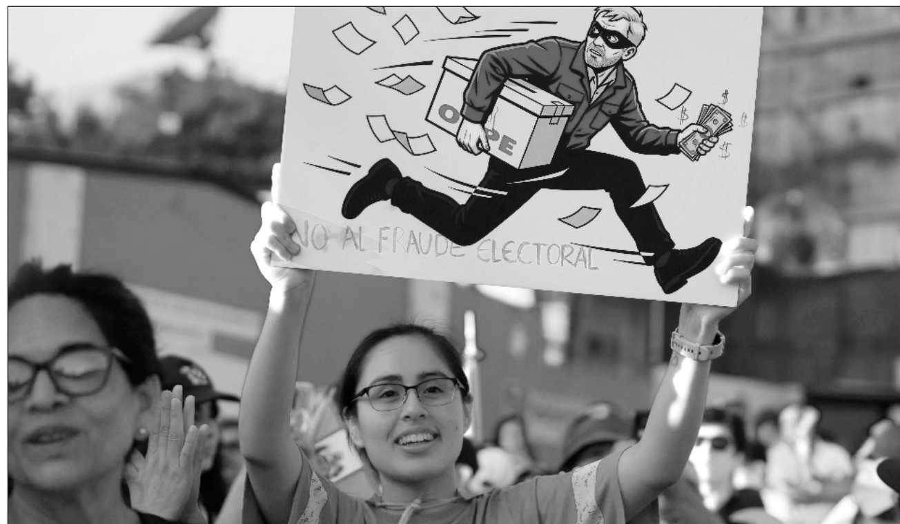
▲ López Aliaga, quien lucha el segundo lugar, ha señalado que en Perú se ha producido un "fraude electoral único".

El funcionario indicó que más de una semana después de los comicios de primera vuelta, se recibieron 27.227