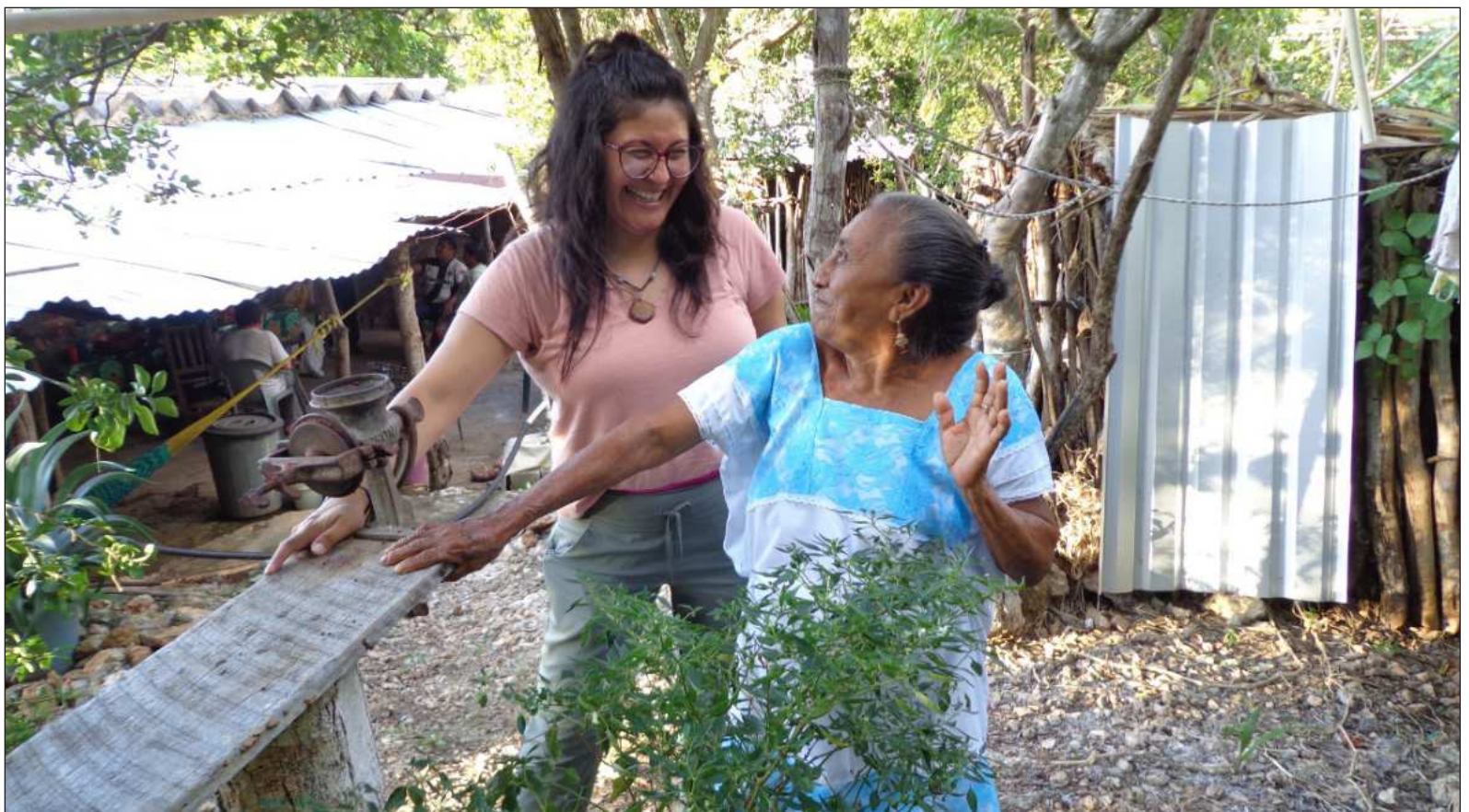
▲ “Conviviendo con la gente de las comunidades, recobramos fuerza y comprendimos que la dinámica seguía su curso y nos movía a todos”.