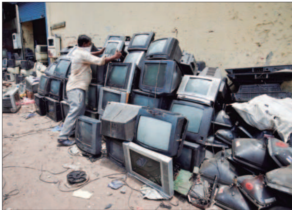
▲ Si los países consiguieran elevar las tasas de recolección y reciclaje de residuos electrónicos a 60% para 20230, los beneficios para la salud humana serían inminentes.

Mientras, menos de una cuarta parte de la masa anual de desechos electrónicos producida -exactamente 22.3 por ciento- se recolectó y se recicló según los protocolos internacionales, con lo que se perdieron recursos naturales recuperables por valor de 62 mil millones de dólares y se generaron crecientes riesgos