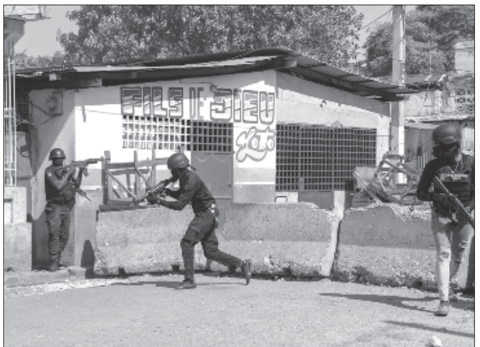
▲ Embajadas y organizaciones internacionales están procediendo a reducir y evacuar personal en Haití, a causa de la escalada de violencia a manos de bandas armadas.

El lunes pasado, el primer ministro haitiano, Ariel Henry, anunció en un mensaje a la nación que dimitirá en cuanto esté implementado un consejo presidencial de transición, que deberá ponerse de acuerdo para designar un nuevo jefe de Gobierno y abrir el camino a que se celebren elecciones presidenciales.