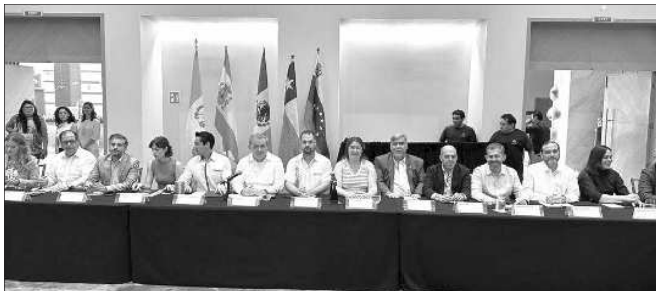
▲ Durante la primera jornada del evento, los expertos coincidieron en que México es “uno de los países líderes en el desarrollo del turismo” porque logró darle visibilidad a las comunidades y territorios rurales.

“Como destino líder en materia turística de México y América Latina, el