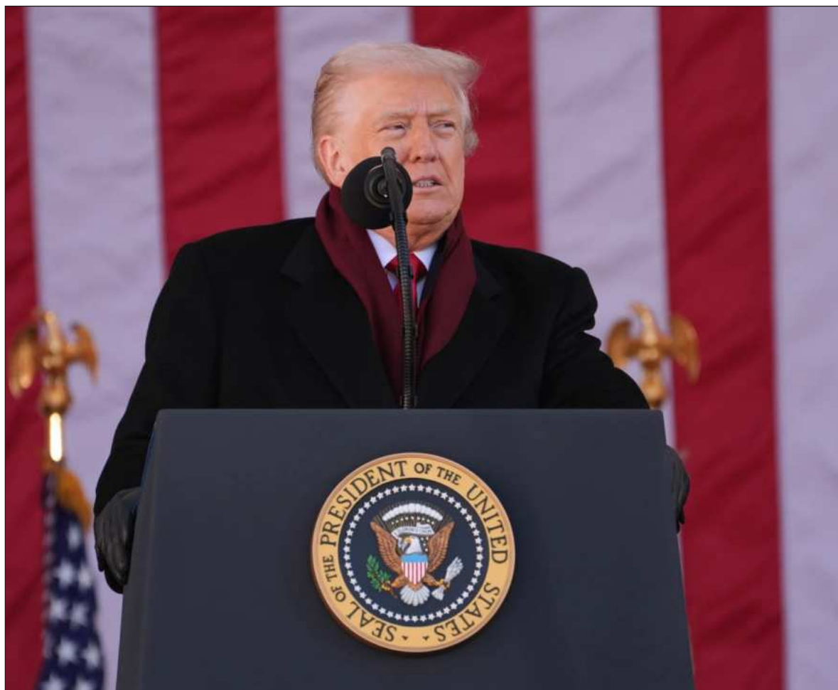
▲ “En tal estado de disociación de la realidad, Trump pretende que este jueves, en Davos, diversos jefes de Estado y de gobierno firmen la constitución de una “Junta de Paz” que, con previo pago de admisión de mil millones de dólares, permitirá a los inversores participar en una especie de gobierno mundial, supranacional, un club para decidir sobre zonas en conflicto”.

¡CLARO, CON DONALD como máximo jefe, CEO autodesignado, administrador de los miles de millones de dólares de las membrías y, junto con su familia (el yerno Jared Kushner como ejemplo de conflicto de intereses), beneficiario principal de los dividendos por venir!