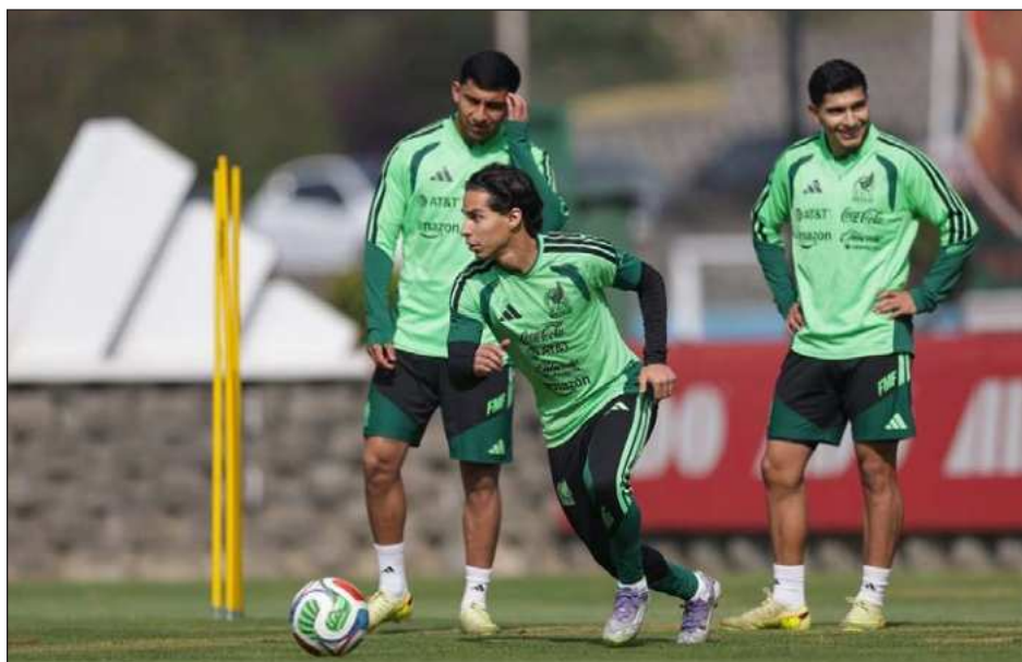
▲ El Tricolor llegó el martes por la noche a Panamá, donde el jueves entrará en acción.

Por no ser Fecha FIFA, el equipo mexicano está conformado por jugadores de la Liga Mx, ocho de ellos de las Chivas, el líder del torneo Clausura.