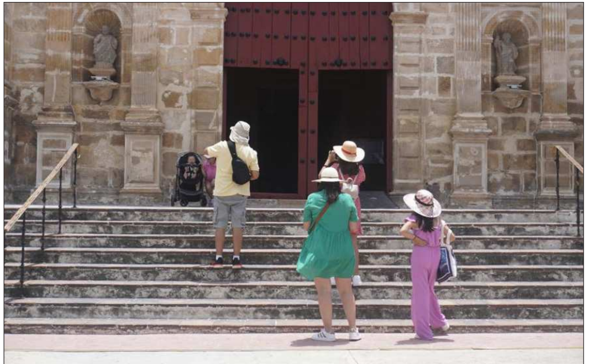
▲ “El turismo es una industria de confianza, y la seguridad es la base de esa confianza”.

LA META ES clara: consolidar a México como el quinto país más visitado del planeta. Para ello, se ha desplegado una delegación histórica de 32 estados con 900 representantes, entre los que se