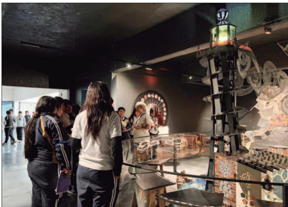
▲ En la muestra convergen criaturas de historieta con objetos geométricos.

MatemAlquimia fue creada durante la pandemia por un grupo de 24 artistas y matemáticos, quienes transformaron conceptos como fractales, topología, sólidos arquimedianos o números primos en experiencias artísticas. La propuesta nació del intercambio de ideas entre Daubechies y la artista textil Dominique