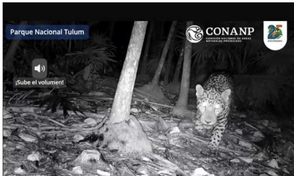
▲ Según la Conanp, el suceso demuestra el impacto positivo de las acciones para proteger a la especie e hizo un llamado al gobierno estatal para reforzar la conservación del jaguar.