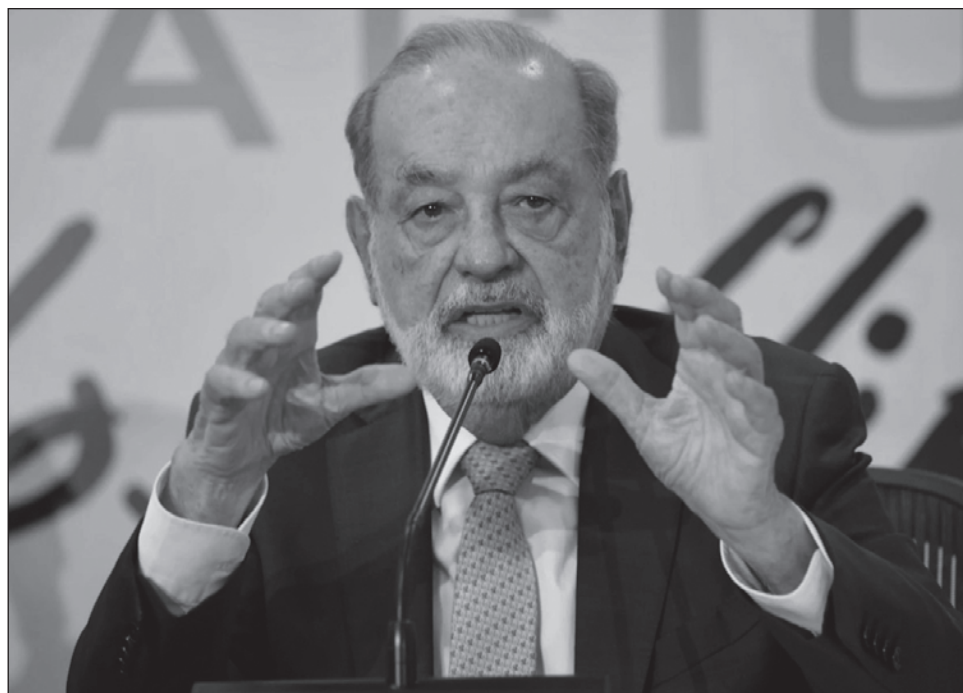
▲ A diferencia de otros países donde las listas se van modificando, en México las fortunas no se mueven, y si lo hacen es para cambiar de nombre, pero no de apellido.

De acuerdo con un informe de la organización internacional para América Latina y el Caribe, de los 109 millones de millonarios que hay en la región, 22 son de México y acumulan una riqueza conjunta de 219 mil millones de dólares, más de un tercio de la que poseen en conjunto todos los potentados de la región.