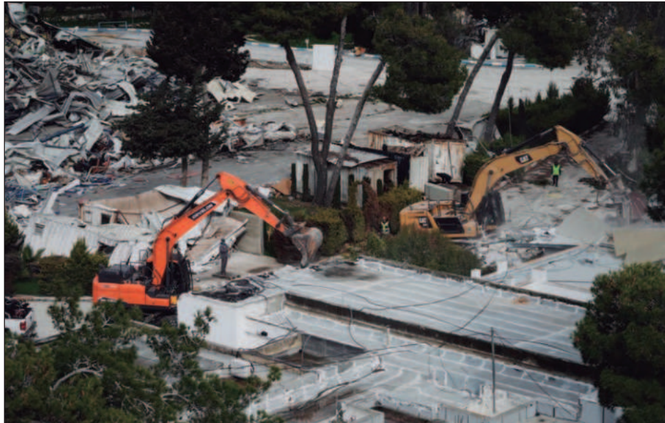
▲ Cuadrillas militares comenzaron a demoler las oficinas de la Agencia de Naciones Unidas para los Refugiados de Palestina en Sheikh Jarrah, y lanzaron gas lacrimógeno en una escuela de oficios para jóvenes en Qalandia, a las afueras de Jerusalén.

Roland Friedrich, director del grupo en Cisjordania reocupada, dijo que la Unrwa recibió información de que las cuadrillas de demolición y la policía llegaron a su sede en Jerusalén Oriental este martes temprano. El personal no ha trabajado en la instalación debido al peligro y la incitación durante casi un año, pero las fuerzas israelíes confiscaron dispositivos y expulsaron