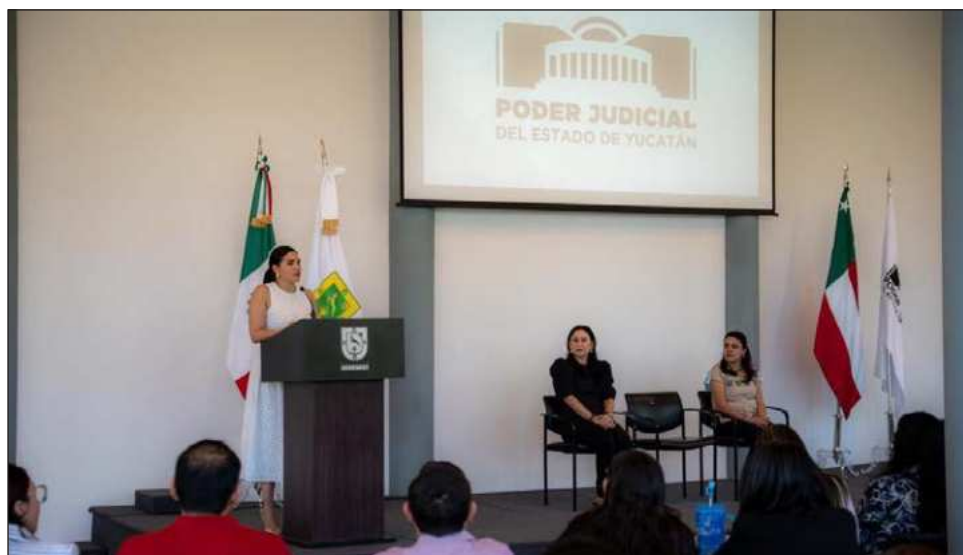
▲ Entre los participantes se encuentran jueces de Oralidad Familiar, jueces mixtos, secretarios de acuerdos, secretarios de estudio y cuenta de primera y segunda instancia.