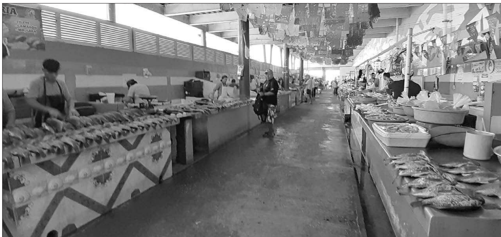
▲ El principal centro de abasto de la ciudad cierra sus puertas a las 18 horas en la actualidad pero, a partir de esta medida, concluirá actividades a las 20 horas.

"Sin lugar a dudas esta ampliación en el horario es favorable para los comerciantes, aunque también debe de ir acompañada de una mayor vigilancia y seguridad".