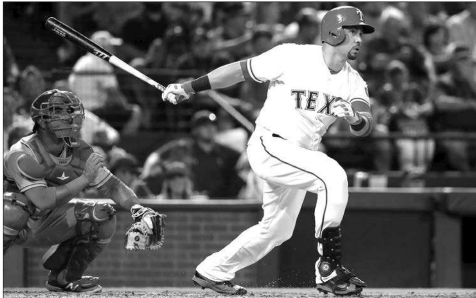
▲ Carlos Beltrán batea un jonrón para Texas contra los Serafines el 21 de septiembre de 2016.

Beltrán se convirtió en el sexto pelotero de Puerto Rico que acaba en Cooperstown, la ciudad en el norte del estado de Nueva York donde se encuentra el mu-