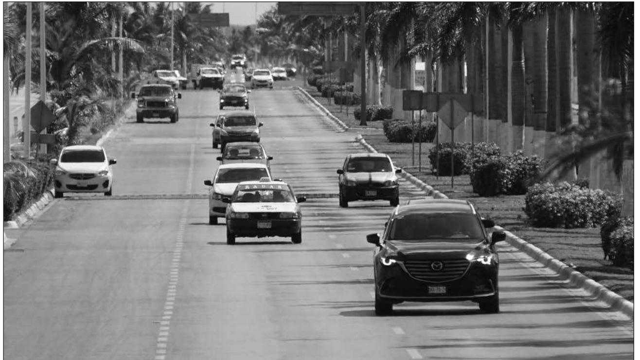
▲ El informe del Secretariado Ejecutivo del Sistema Nacional de Seguridad Pública contempla la década de 2015 al 2025 en cada entidad federativa del país. El año pasado se reportaron 43 unidades robadas, 14 automóviles y 29 motocicletas.

Los números también mostraron una tendencia a