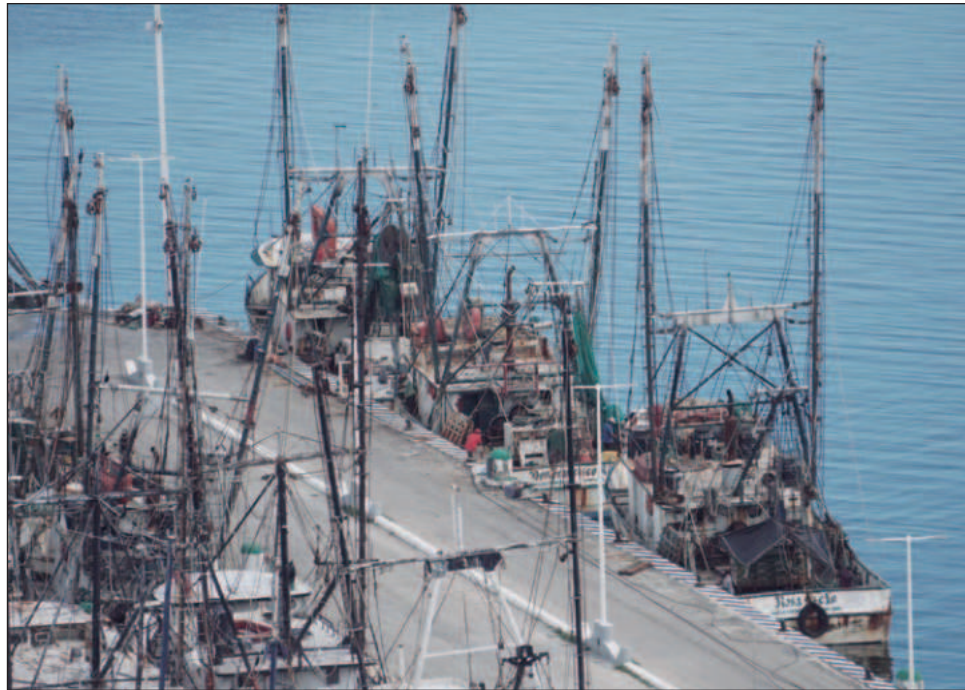
▲ Los barcos apenas obtienen alrededor de 200 kilos por noche y con camarón de tallas pequeñas, cuando en la temporada pasada los volúmenes eran 30% mayores.

Indicó que el sector no ha logrado recuperarse, ya que los barcos apenas obtienen alrededor de 200 kilos por noche y con camarón de tallas pequeñas, una condición que contrasta con la temporada pasada, cuando a estas mismas fechas se registraban volúmenes entre 20 y 30 por ciento mayores. Romellón