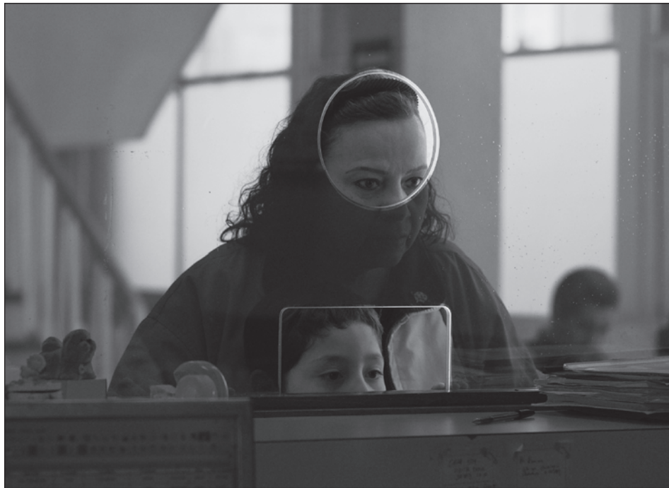
▲ La película elegida para la gesta se centra en el vínculo emocional entre un niño de ocho años y una mujer que se ve obligada a atenderlo ante la ausencia de los padres. Fotograma

Michel Franco figura entre los productores y el guion fue escrito por el mismo Eimbecke junto con Vanesa Garnika.