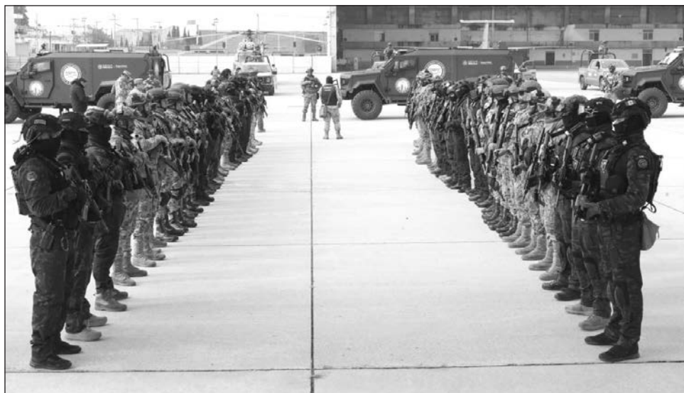
▲ El traslado desde territorio nacional ocurrió la mañana de este martes a bordo de siete aeronaves de las Fuerzas Armadas y fue confirmado por Omar García Harfuch.

Dichas personas fueron llevadas a las ciudades