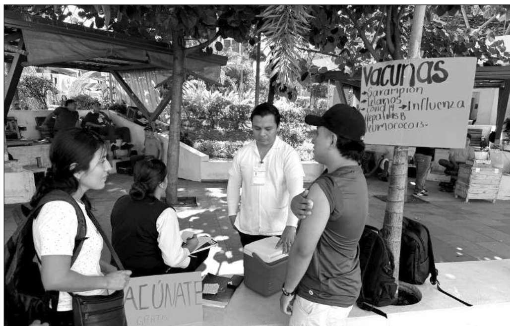
▲ El brote actual ya es de varios miles de casos, concentrados en Chihuahua, Jalisco y Chiapas, y amenaza con extenderse a los 32 estados, donde inciden la desigualdad y la falta de inmunidad.

La posibilidad de que el sarampión reaparezca en los 32 estados es reveladora, incluso para un régimen que declara que la justicia social es prioritaria: la desigualdad y la falta de inmunidad inciden negativamente en la salud pública. Si a esto agregamos la movilidad interna y que también el país se ha vuelto destino para miles de migrantes que pueden no contar con una vacuna, lo que se tiene es una gran población desprotegida. El riesgo incrementará cuando, a partir de mayo, comiencen a llegar los aficionados al balompié y posteriormente regresen a sus países de origen, posiblemente infectados.