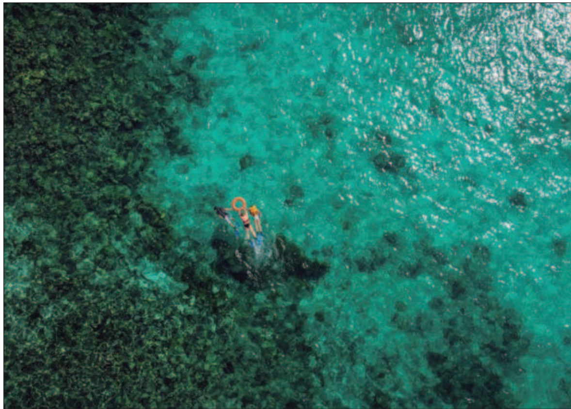
▲ Fundada en el año 2001, la asociación civil sin fines de lucro CeIBA se dedica "al análisis de los problemas relacionados con el medio ambiente y los recursos naturales renovables".

Si tenemos el buen tino de elegir para conducir la administración de la cosa pública nacional a una persona que no considere que el poder que ostentará traerá incluida una dosis omnímoda de saber; es decir, si logramos que quede al frente del ejecutivo alguien que se encuentre convencida de que no tiene por qué saberlo todo, y esté consciente de que en México hay un acervo de conocimientos muy sólido, seguramente recurrirá a los actores sociales - pensadores e investigadores, miembros de los centros e institutos de generación e conocimiento, y miembros de las diversas organizaciones de la sociedad civil que dedican su tiempo y sus capacidades a indagar acerca de los diferentes aspectos de la realidad nacional - les consultará acerca de los temas que resulten de interés para la construcción de las políticas públicas que pretenda llevar a cabo, y se tomará parte de su tiempo para leer con