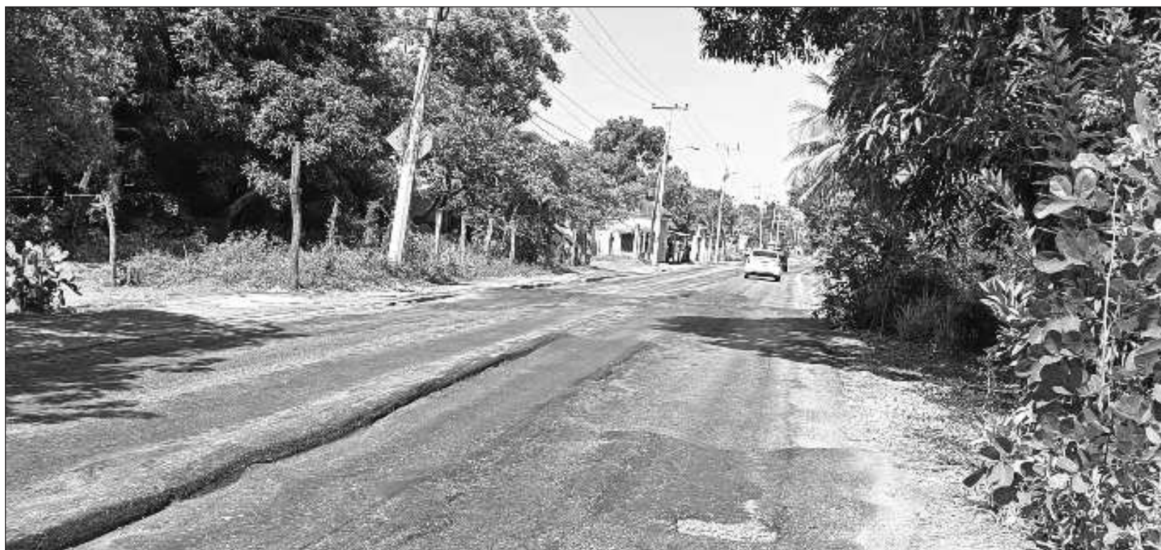
▲ Los carmelitas han visto pasar frente a sus ojos la riqueza que ha generado grandes beneficios para el país, pero muy poco para la entidad y para la Isla.

“La importancia económica de Carmen radicaba en que solo en tres regiones en el mundo se producía el palo de tinte: en Brasil, en Belice y en Carmen, por lo que este puerto mantenía una relación comercial con los principales puertos a nivel mundial de ese entonces como Liverpool, Habsburgo, Cádiz, y Lisboa, entre otros”.