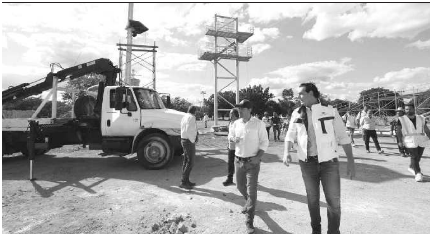
▲ A través de una inversión sin precedentes de más de 146 mdp, la remodelación y modernización de la Unidad Deportiva del Sur Henry Martín contempla obras como canchas de basquetbol, futbol, jaulas de bateo y un centro de usos múltiples con tableros, techo y gradas.