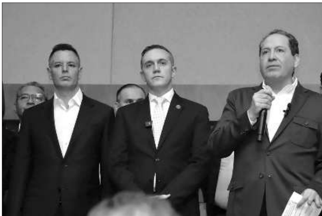
▲ Difícilmente puede decirse que los impulsores de la Alianza son de izquierda, pero sí han sido opuestos a confundirse con el PAN, muchos de ellos se formaron considerándolos enemigo.

Queda pendiente cuánto podrá sumar la Alianza a la causa de Claudia Sheinbaum, pero si a paralelismos históricos nos atenemos, la Revolución Mexicana se hizo con porfiristas; a nadie extraña entonces que sea necesario abrir espacios a priistas de viejo cuño.