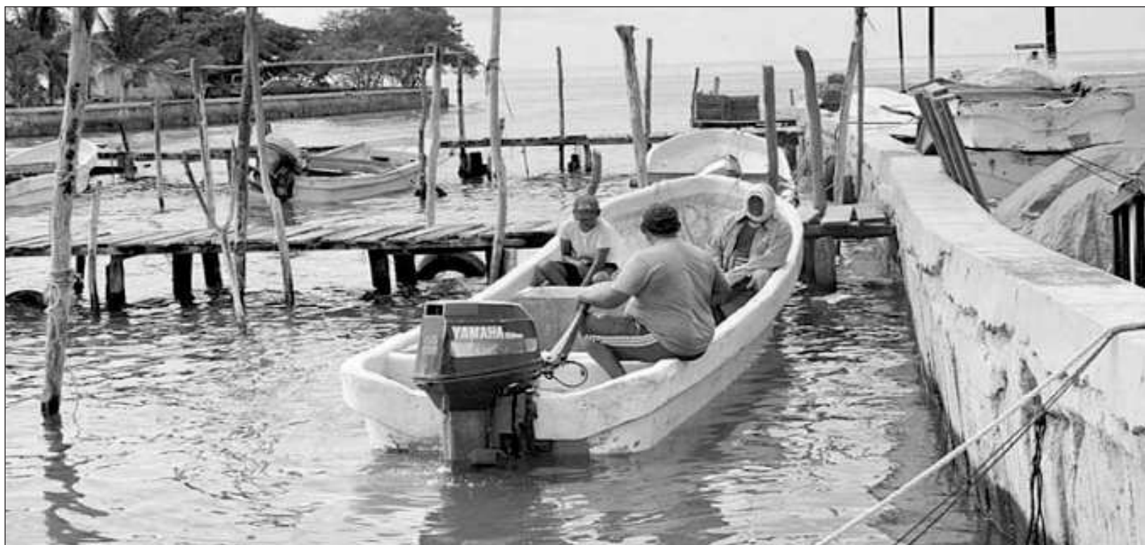
▲ Carmen ha sido considerada como la capital económica del estado y la petrolera de México, lo que le ha valido reconocimiento a nivel internacional.