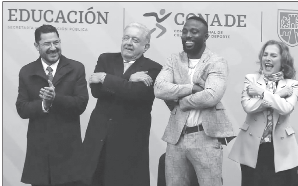
▲ El presidente Andrés Manuel López Obrador entregó el Premio Nacional del Deporte 2023 a la novena mexicana que participó en el Clásico Mundial de Beisbol, y celebró junto a Randy Arozarena realizando su pose para festejar.

El presidente elogió el trabajo de las familias y los en-