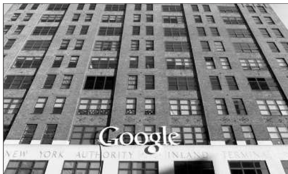
▲ El gigante tecnológico realizaba prácticas monopólicas en su plataforma de aplicaciones.

Google entregará 630 millones de dólares a un fondo de conciliación para los consumidores y otros 70 millones de dólares a las decenas de estados que presentaron las acciones legales contra la empresa tecnológica.