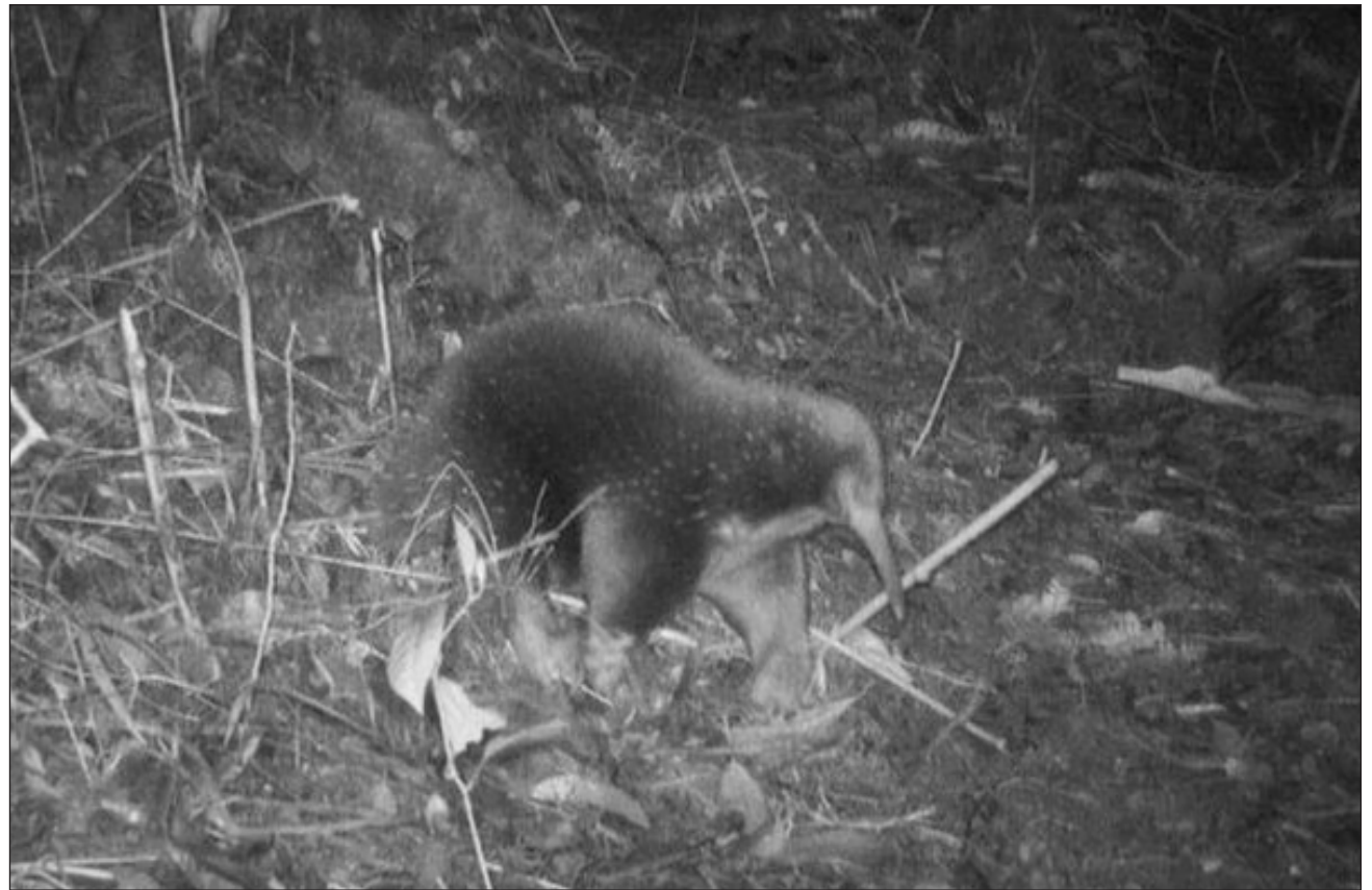
▲ Ba'alche' mix juntéen ila'ak táanxel tu'ux ti' Montañas Cíclopes, ts'ooke' walkila' táakbesa'an ichil u tsoolil Lista Roja de Especies Amenazadas beeta'an tumen Unión Internacional para la Conservación de la Naturaleza.. Oochel Ap

Tuláakal ba'ax ila'abe', ti' yano'ob ti' k'áax tu'ux ma' jach no'oja'an u yantal