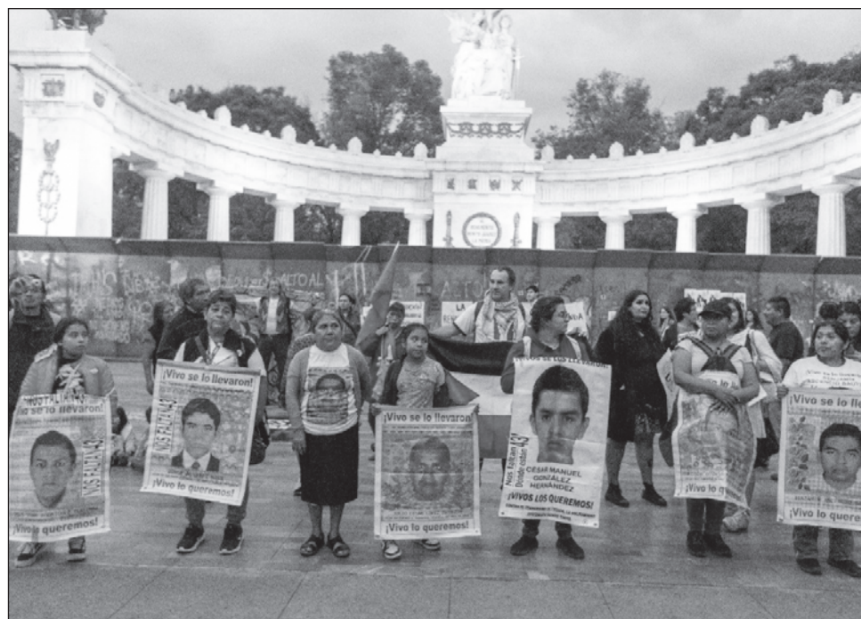
▲ El mandatario acusó al Centro Prodh de tener “doble moral” al defender tanto a los familiares de los 43 normalistas como a los implicados en esos crímenes.

Los familiares puntualizaron que “fueron las investigaciones turbias e ilegales” que derivaron en la mal llamada verdad histórica lo que condujo a la liberación de