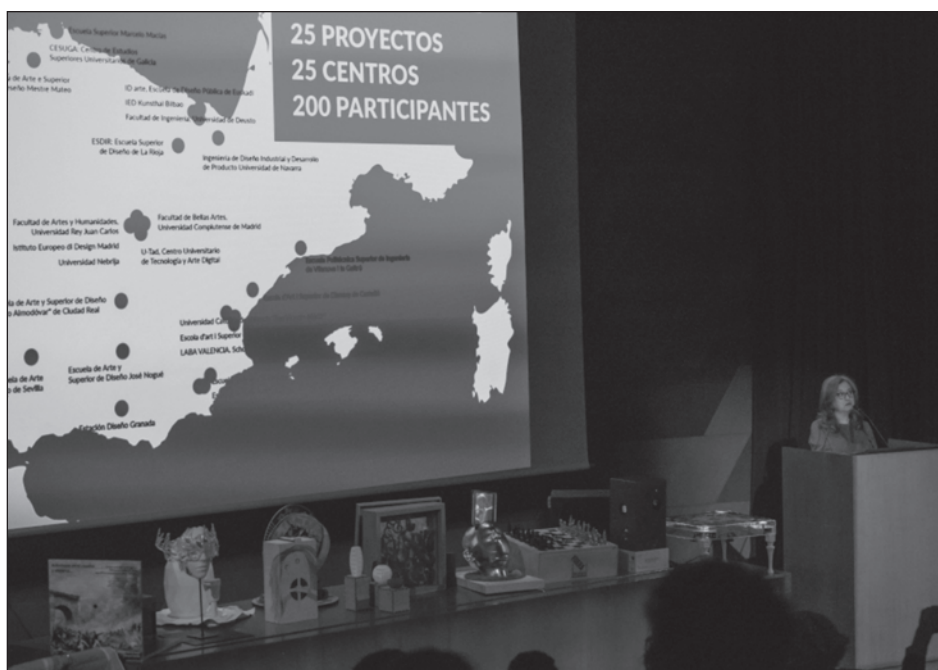
▲ Al programa, titulado El Prado en Vol. se sumaron más de 200 participantes de 25 centros de nueve comunidades autónomas.

También ha estado experimentando con la inteligencia artificial. Recientemente le pidió a esta herramienta que compusiera una canción para él al estilo de Dylan , y lo hizo. La IA se sabe de memoria todas las canciones de Bob Dylan , se maravilla. "Hay cientos y cientos de ellos. Puedes decir: 'Dame una canción de Dylan de los 80, dame una de los 90...' y escribirá uno para ti. Lo que produjo no fue una canción particularmente buena, pero Bob también escribió muchas canciones malas!"