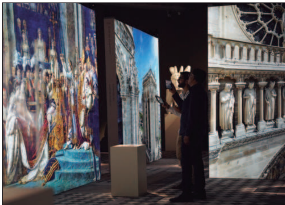
▲ Al entrar a la sala de exhibición se entrega al visitante el HistoPad con el que podrá navegar las 21 Puertas del Tiempo para embarcarse en un viaje interactivo.

Al entrar a la sala de exhibición se entrega al visitante el HistoPad con el que podrá navegar y escanear las 21 Puertas del Tiempo para embarcarse en un viaje interactivo. Desde los cimientos