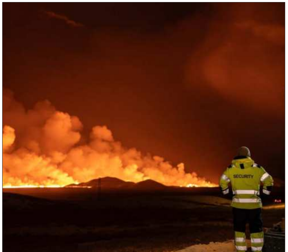
▲ El volcán situado en el sur de Reikiavik entró en erupción la noche del lunes en una zona donde la actividad sísmica era muy intensa desde inicios de noviembre.

Los cerca de 4 mil habitantes de Grindavik, un puerto pesquero a 40 km de la capital, fueron evacuados el 11 de noviembre.