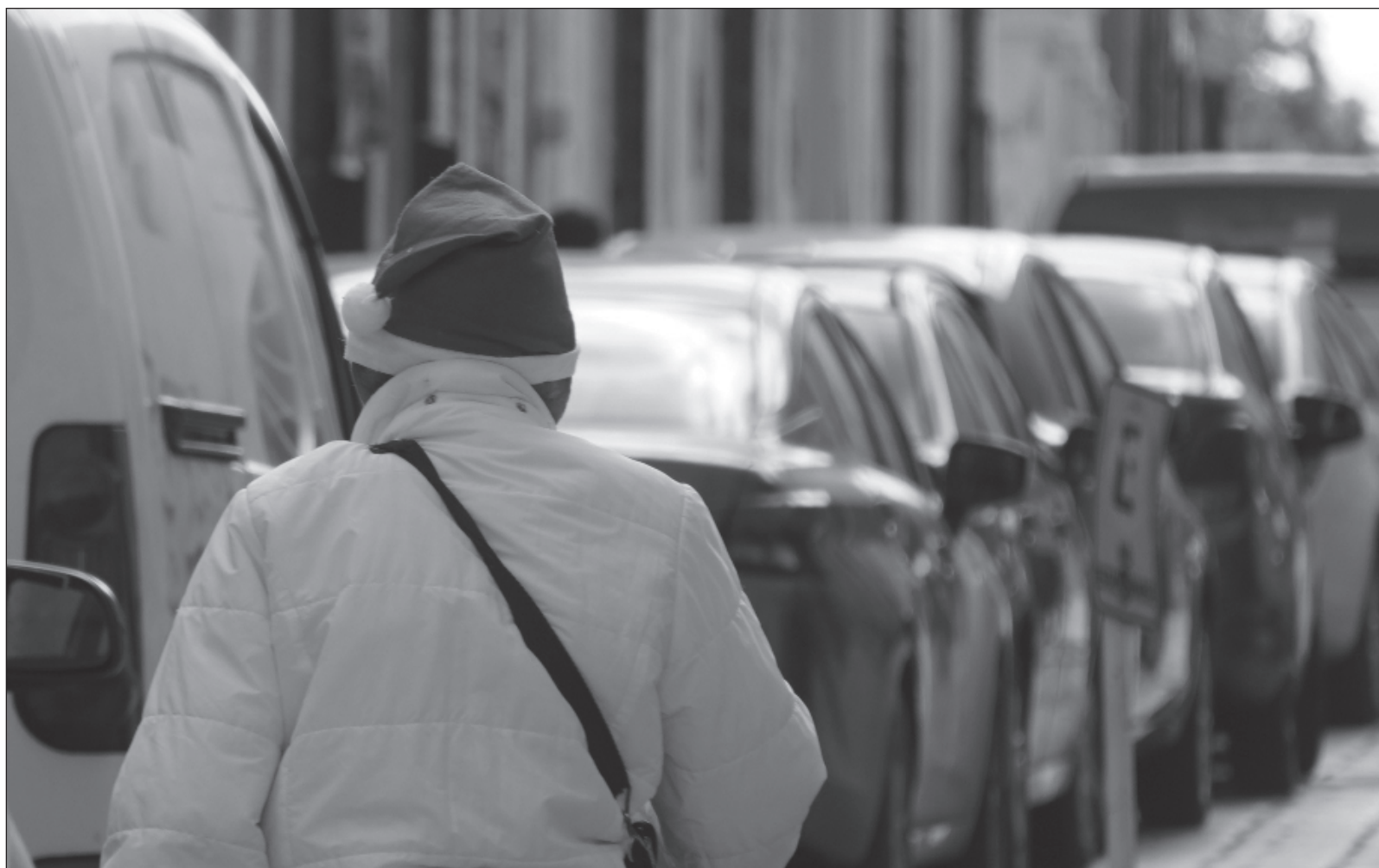
▲ "El uso de máscaras, disfraces y atuendos especiales para caracterizar personajes de temporada festiva sólo añade una nueva capa sobre la superficie que oculta o distorsiona gestos espontáneos y emociones verdaderas".