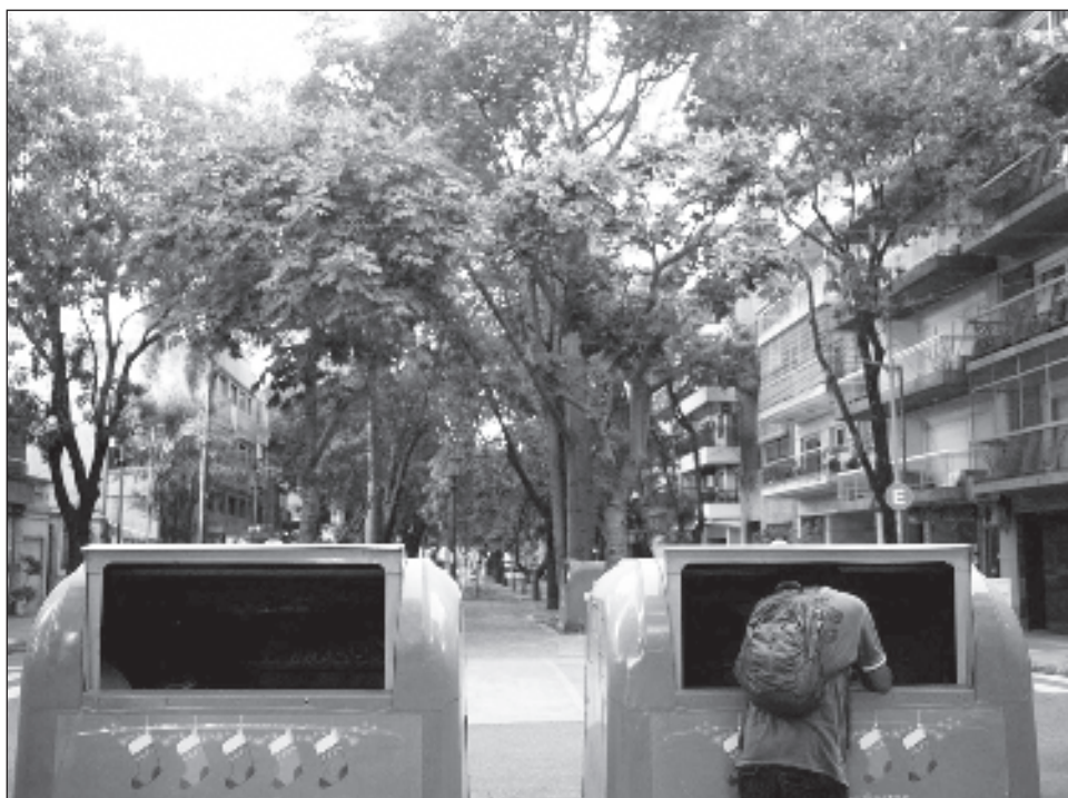
▲ La ministra de Capital Humano advirtió que quitará las ayudas económicas a beneficiarios de planes sociales que participen de protestas donde se corten calles y avenidas.

El debate sobre las medidas se intensifica mientras este miércoles una gran movilización de grupos de izquierda fue convocada.