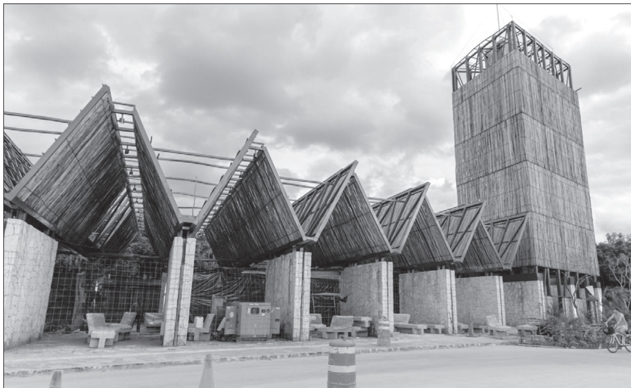
▲ Los comerciantes consideran que las modificaciones derivadas del Parque del Jaguar también se traducirán en una mejoría en la llegada de turistas, quienes tendrán mejores condiciones, servicios y alternativas.