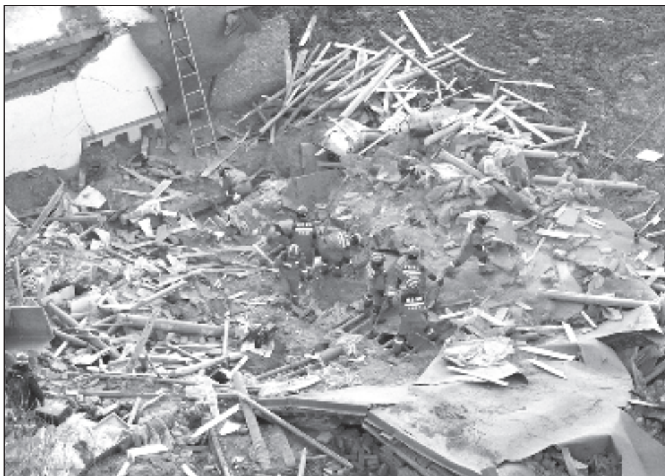
▲ El sismo dañó más de 155 mil edificios, según el canal público de televisión CCTV, y obligó a los pobladores a salir a la calle, bajo unas temperaturas gélidas.

El epicentro del temblor se situó a 100 kilómetros al suroeste de la capital provincial, Lanzhou, y fue seguido por varias réplicas.