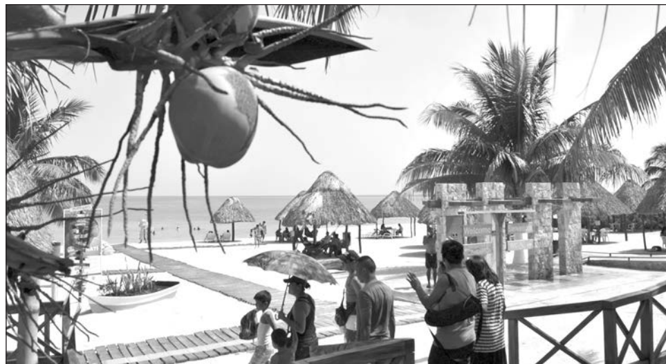
▲ El balneario deberá adaptarse a la "nueva normalidad", con instalación de puntos de sanidad y señalética recordando las medidas sanitarias.

Este balneario ha permanecido cerrado desde el inicio de la pandemia en marzo de 2020, y pese a los cambios en el Semáforo Epidemiológico Nacional que ha logrado la entidad por el control de la pandemia, el inmueble no ha