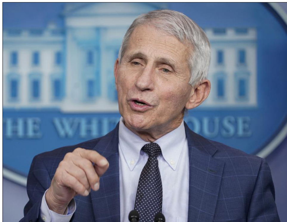
▲ El director del Instituto Nacional de Alergia y Enfermedades Infecciosas trató de defender la promesa previa del presidente Biden de volver pronto a la normalidad.

El prospecto de un invierno ensombrecido por una ola de infecciones es una grave inversión del optimismo proyectado por Biden hace 10 meses, cuando él le dijo a la CNN que el país pudiera estar de regreso a la normalidad para Navidad. Biden se ha cuidado de no prometer excesivamente, pero la confianza en el país ha sido