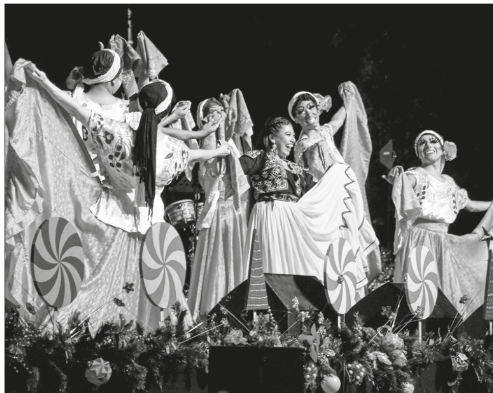
▲ En el Magno Concierto de Navidad participaron el Ensamble Ópera Mixe y la Compañía de Danza México de Colores.

Gorriocillo pecho amarillo, Mi último fracaso, Cu-