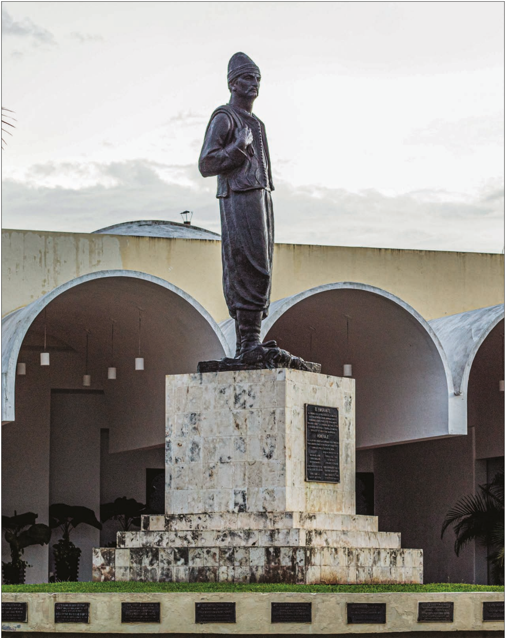
La migración de la comunidad libanesa a Yucatán ha sido ampliamente estudiada precisamente porque es una de las culturas que más presencia tiene en el estado. ▲