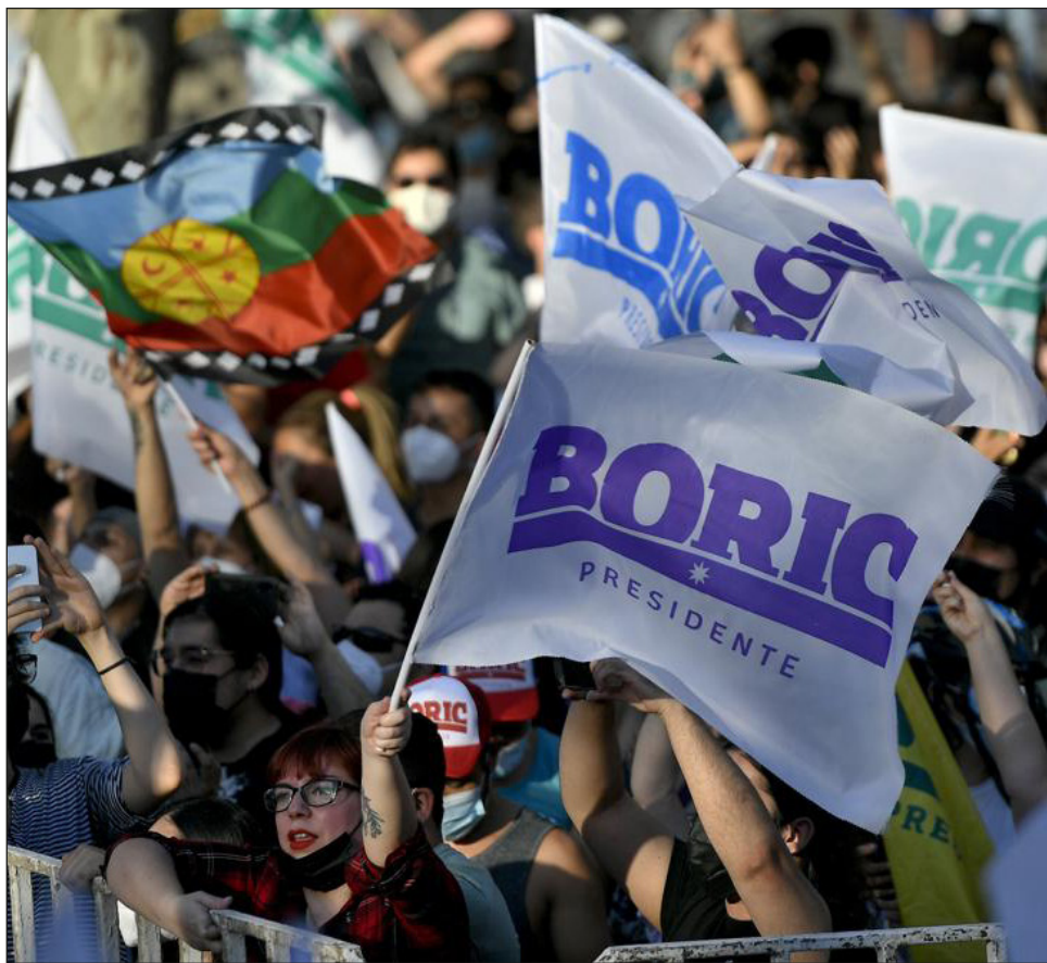
▲ Apenas contabilizadas poco más de la mitad de las actas, el abogado ultraderechista José Antonio Kast reconoció el triunfo de Boric y se comprometió a colaborar con él.

El próximo gobierno enfrentará un complejo panorama económico. Luego de un crecimiento entre 11,5% a 12% este año, caería a un 2% en 2022, con una inflación cercana al 7%, más del doble de la meta del 3% que por años ha tenido Chile.