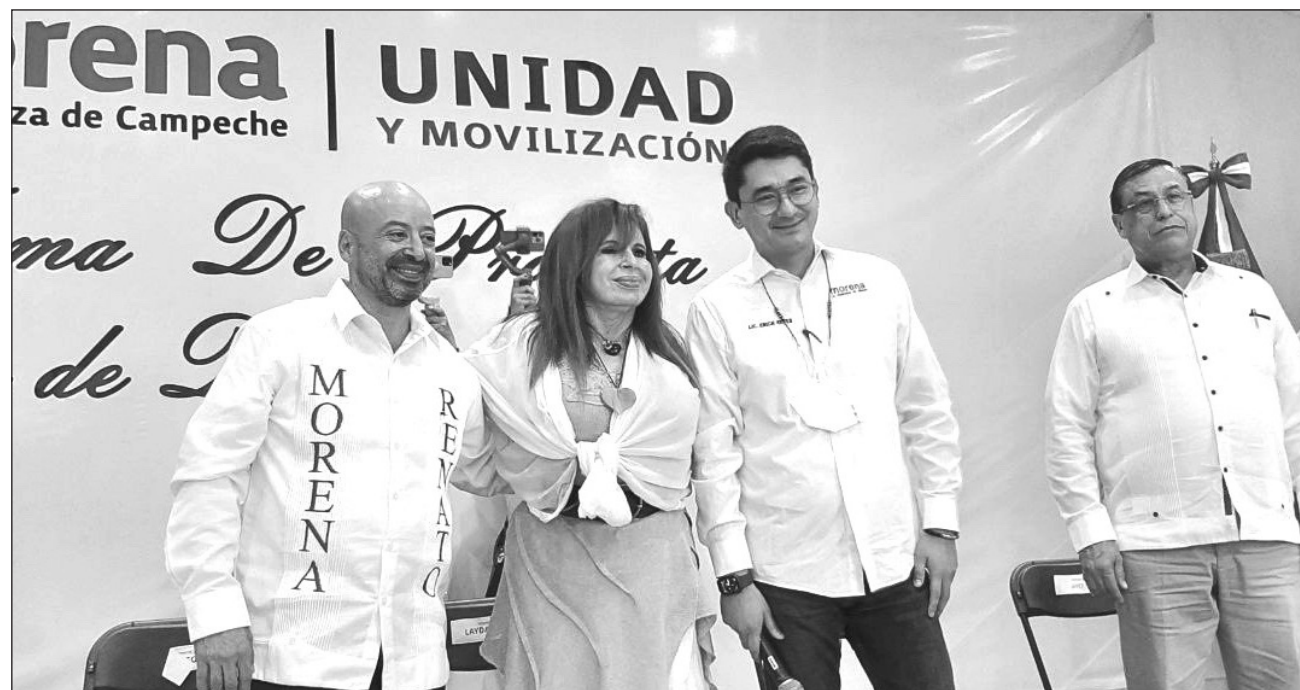
▲ Este domingo tomó protesta el fiscal general de Campeche como defensor de la Cuarta Transformación en Campeche junto a su agrupación Renacer.

Renato, en el uso de la palabra, empuñó su imagen,