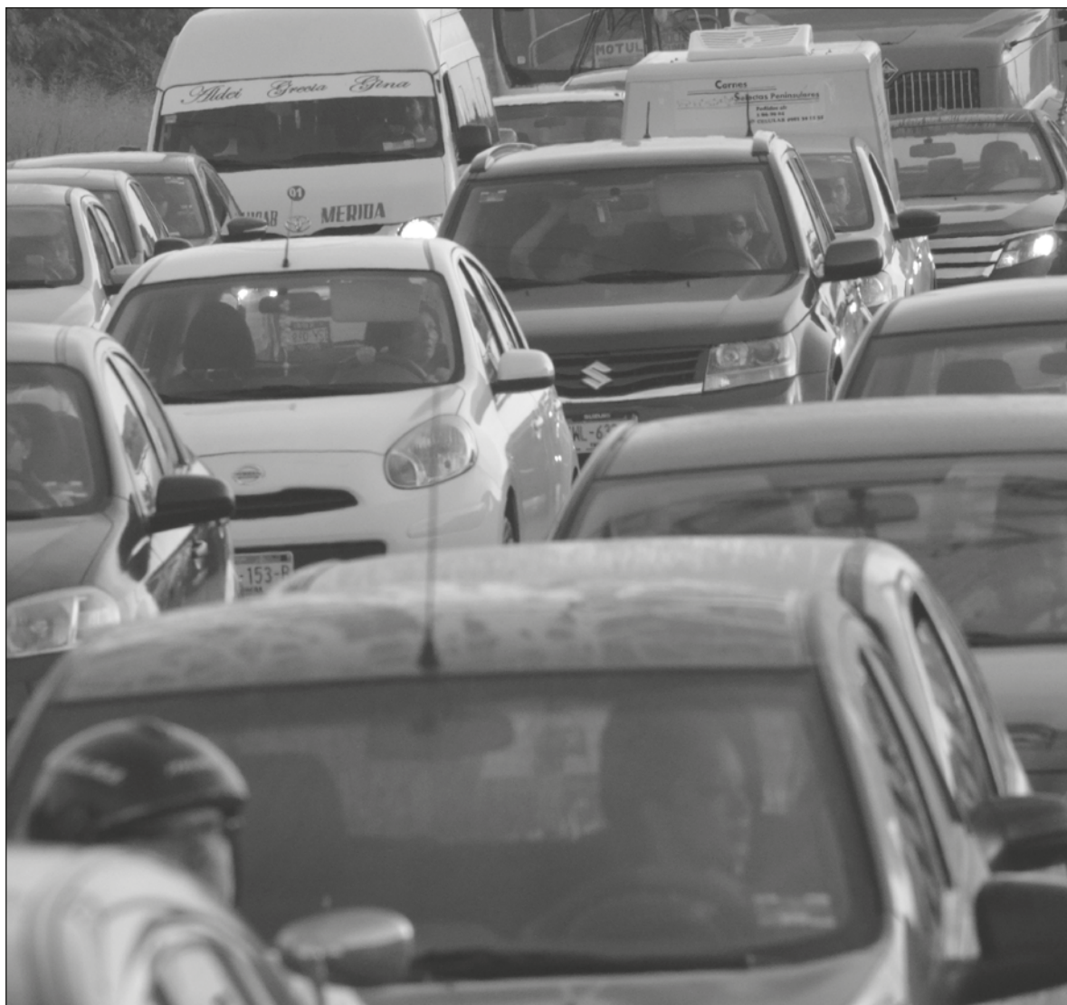
▲ Espero que este caos vial que estamos padeciendo deje muy claro las consecuencias catastróficas que tendríamos con el estadio sustentable.

Desconozco la cantidad de personas que han llegado con el objetivo de fincar su nido en este árbol yucateco, pero la variedad de placas de todo el país me da una idea de la