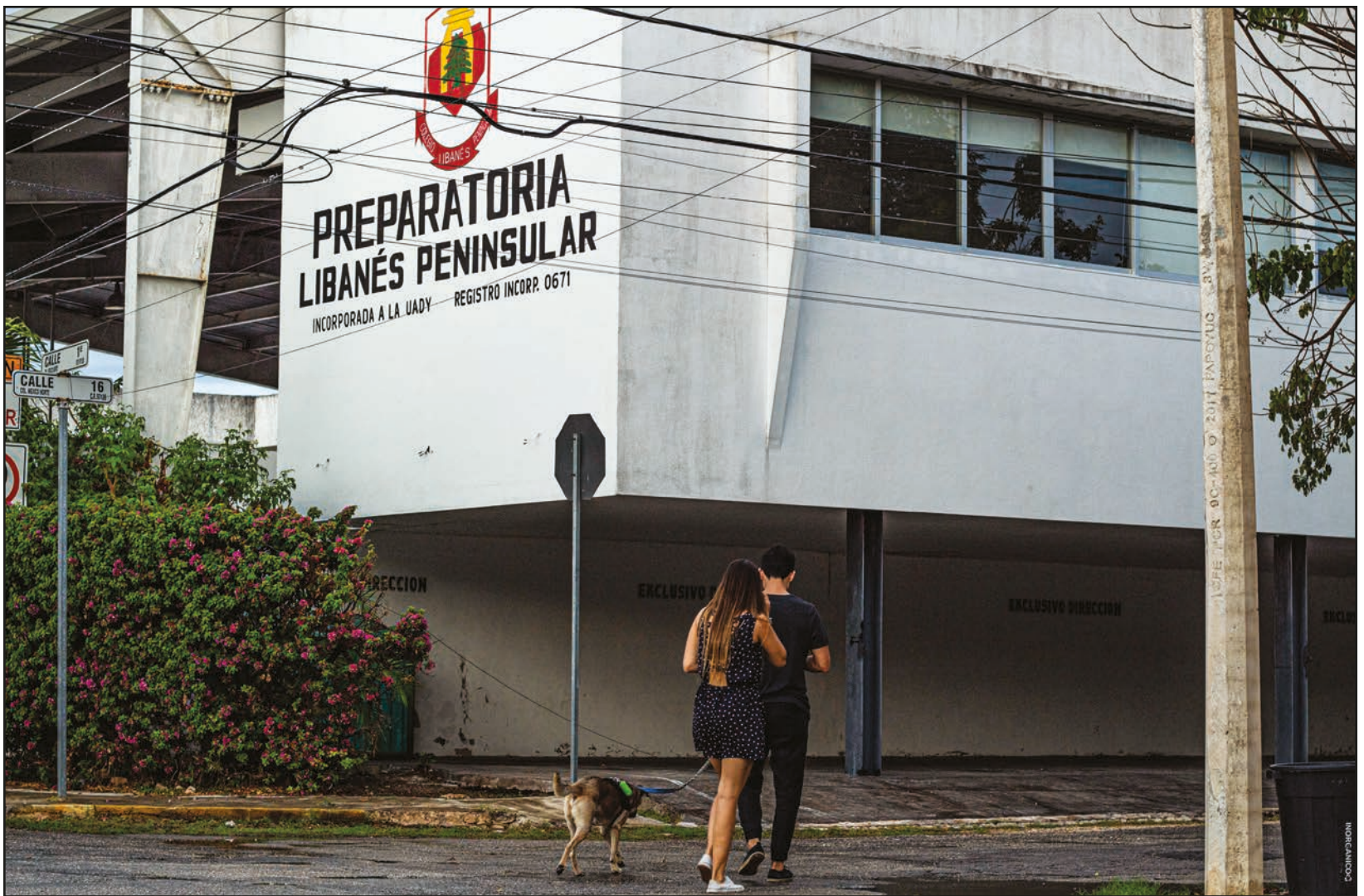
Con los años, no sólo el Club Libanés ha crecido, sino que el eco de la comunidad ha impactado en el paisaje urbano. Fotos: Katia Rejón ▲

“Parecía infinito. Nos quedábamos todo el sábado con nuestras mamás. Era una vida diferente, ahora hay actividades extraescolares pero seguimos siendo un punto de reunión para la comunidad”, dice en entrevista.