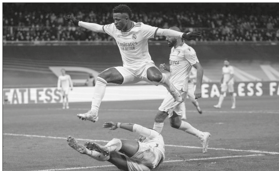
▲ El merengue Vinicius Junior, durante el partido de ayer contra el Cádiz.

El técnico Carlo Ancelotti echó de menos a Luka Modric, Rodrygo, Marco Asensio, Gareth Bale, Marcelo, además del arquero suplente Andriy Lunin, tras dar positivo a Covid-19. Del grupo de afectados, Modric es el único fijo en el once titular, en tanto que Rodrygo y Asensio juegan con frecuencia. Bale