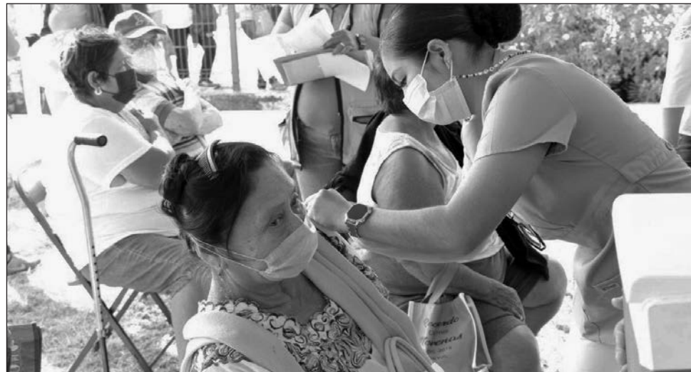
▲ Piden a la población acudir con la documentación necesaria al módulo.

El martes 21 de diciembre se llevará este proceso en las localidades de Espita, Izamal, Temozón, Tinum, Seyé, Temax, Tekit y Sotuta.