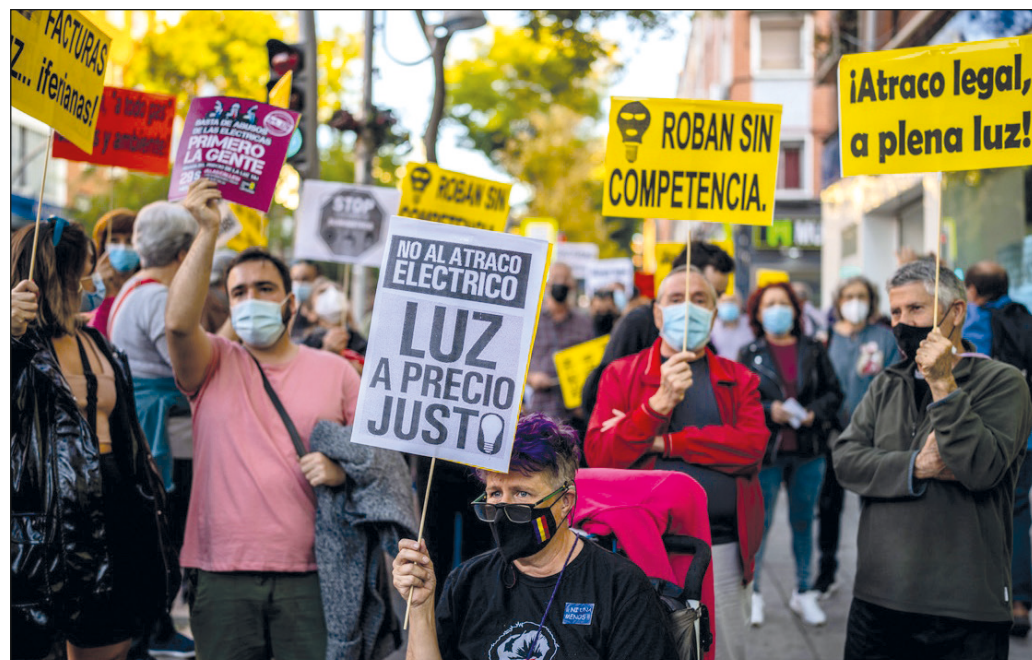
▲ Con la llegada del invierno y los aumentos al precio de la electricidad, los españoles se ven obligados a elegir entre encender la calefacción, cocinar o cubrir otros gastos básicos.

La indefensión de la sociedad española frente a la arbitrariedad de las empresas a las que se les entregó el sector eléctrico en las décadas de los 80 y 90 constituye un espejo ineludible en momentos en que México debate el futuro de su industria y encara dos alternativas de enormes consecuencias: por un lado, repetir la experiencia hispana de liberalización y rendición nacional a los caprichos del mercado y, del otro, la recuperación de su rectoría y capacidad de planificación sobre esta infraestructura esencial para el desarrollo nacional y el correcto funcionamiento de la vida cotidiana.