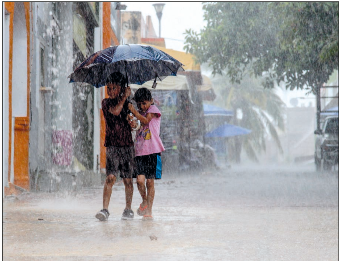
▲ "En Quintana Roo, y esto lo he aprendido con los años, siempre he encontrado una mano solidaria que me ayuda a retomar el rumbo".

Estudié medicina y me especialicé en otorrinolaringología. Durante mi época como recién egresado aprendí dos cosas. La primera, que el movimiento que necesitas está sobre tus hombros . Es decir, si queremos cambiar el mundo, debemos empezar por nuestra calle, supermanzana, municipio y estado. Y segundo, que sólo el tiempo dirá si tengo razón o me equivoco , aunque eso sí, siempre lo podemos resolver,