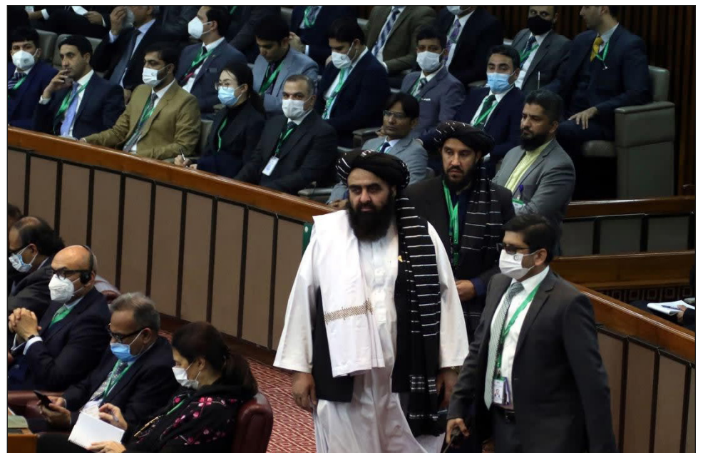
▲ El ministro de relaciones exteriores, Amir Khan Muttaqi, acudió a la cumbre de la OIC como representante del gobierno talibán.

Muttaqi mostró así su interés en "escuchar y aceptar todas las solicitudes, preocupaciones y consejos de los países islámicos en relación con Afganistán que puedan