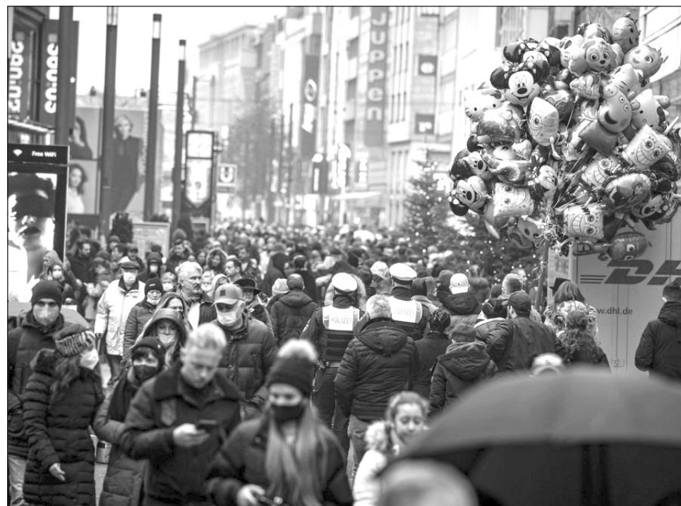
▲ La OMS señaló que la variante ómicron se está propagando rápidamente incluso en países con tasas altas de vacunación.

No está claro todavía si el crecimiento rápido de los ca-