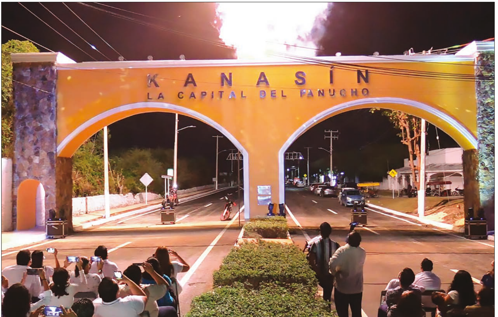
▲ Se inauguró de manera oficial el arco que da la bienvenida en Kanásín, ahora conocida como “la capital del panucho”.