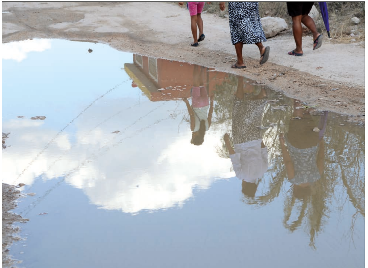
▲ Entre 2010 y 2020, la pobreza en Tinum aumentó 24.52 por ciento, de acuerdo con la investigación Una mirada a la pobreza municipal , del IMCO.

Las ciudades más competitivas tienen un menor porcentaje de su población en pobreza y pobreza extrema. De acuerdo con el Índice de Competitividad Urbana (ICU) 2021 elaborado por el IMCO, sólo 4 por ciento de la población de las ciudades con mejores resultados en el ICU 2021 están en situación de pobreza extrema. En contraste, las ciudades con peor desempeño tienen el doble de la población en condiciones de pobreza extrema y 48 por ciento en situación de pobreza.