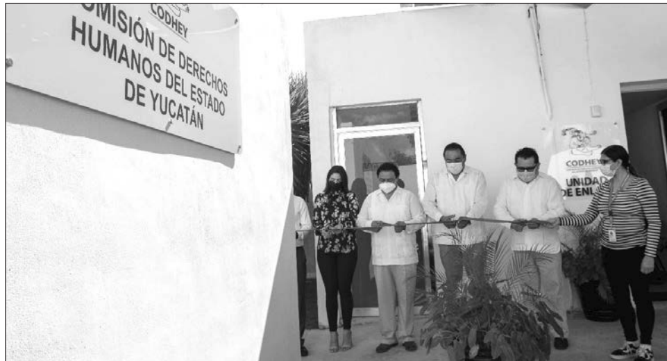
▲ Los presentes destacaron que la FGE sea la primera institución del país en contar con un módulo de derechos humanos.

“Con esta acción se busca que la ciudadanía cuente con la oportunidad de denunciar directamente cualquier tipo de irregularidad de quienes deben procurar justicia. Esa