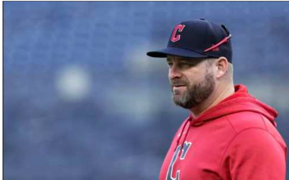
▲ El manager de los Guardianes de Cleveland, Stephen Vogt, durante un entrenamiento previo al primer juego de la Serie de Campeonato de la Liga Americana.

Murphy siguió una trayectoria profesional inusitada hacia el éxito en las Grandes Ligas: fue piloto universitario durante mucho tiempo en Notre Dame y Arizona State antes de pasar a las ligas profesionales en 2010. Trabajó en el sistema de sucursales de los Padres hasta 2015, cuando fue contratado como coach de banca de Milwaukee bajo las órdenes de Craig Counsell, quien jugó para Murphy en Notre Dame.