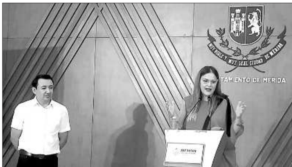
▲ Para finales de 2024, este programa pretende beneficiar a 65 familias de adultos mayores. Se tiene programado que para 2025 este apoyo municipal cubra a 250 familias.

Es requisito indispensable que los solicitantes tengan 60 años o más. Entre las acciones de mejora, se tiene contemplado los trabajos en albañilería, plomería, impermeabilización, poda y jardinería, electricidad y rampas de acceso a viviendas.