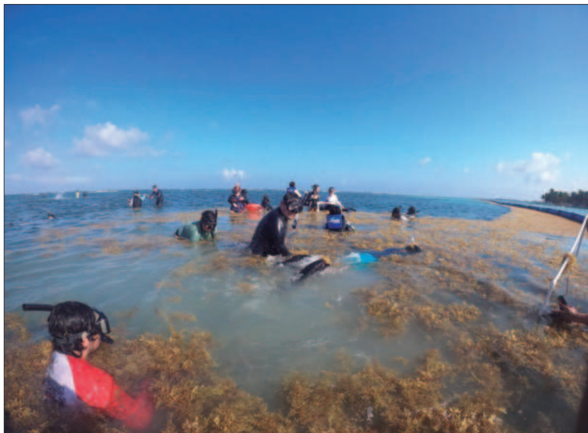
▲ Práctica de campo sobre impacto ambiental en Chuburná Puerto. Durante la actividad, se describieron sistemas ambientales e identificaron posibles golpes como parte de un proyecto hipotético de recuperación de playas.

*Responsable Técnico del Laboratorio de Calidad Ambiental; profesora de asignatura de la Licenciatura en Ciencias Ambientales y presidente del Comité de Ética en Investigación y Docencia de la ENES Mérida.