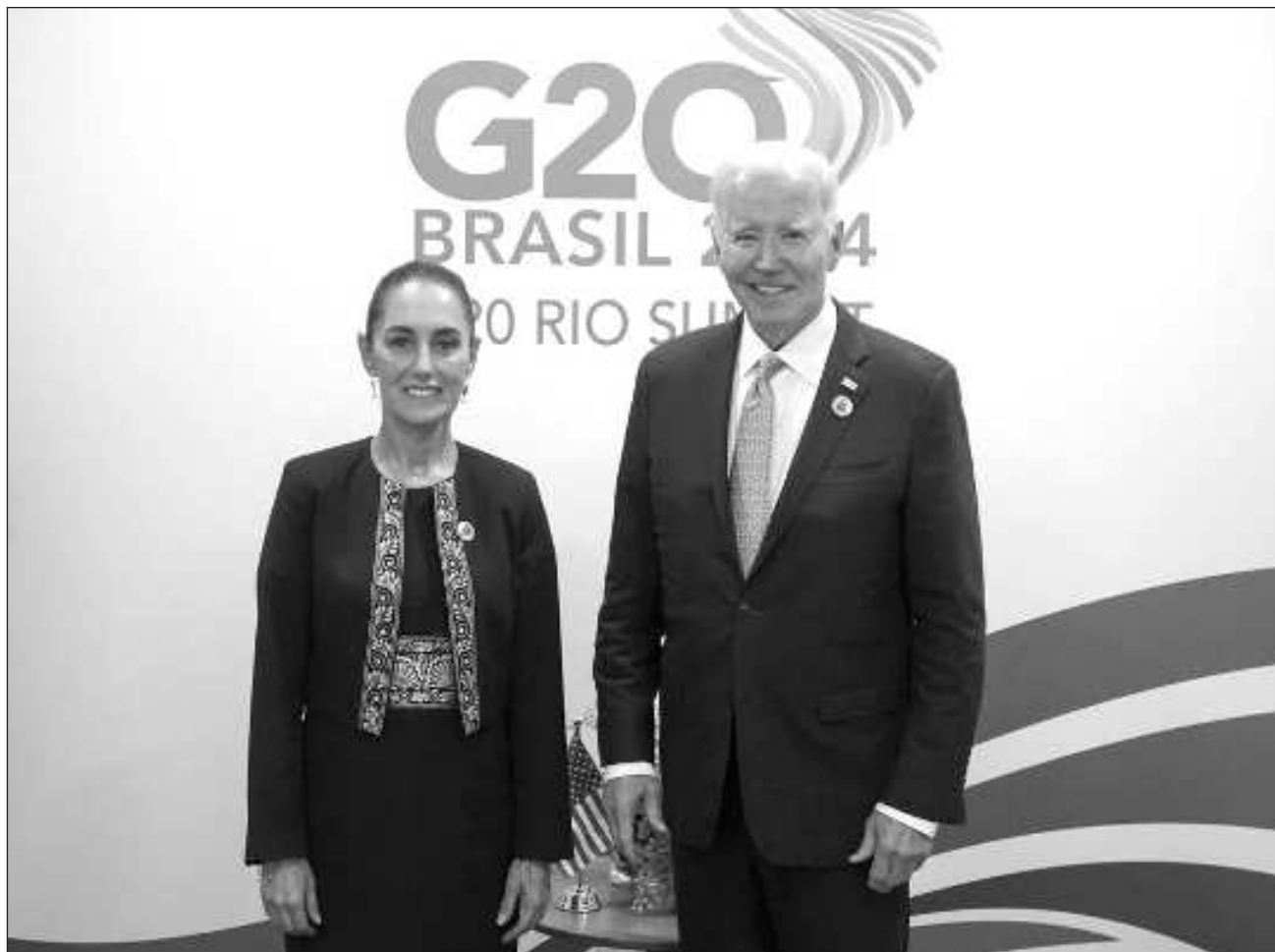
▲ La mandataria comentó que con Biden hablaron del T-MEC y del trabajo de los mexicanos en EU.

La mandataria también comentó que con Joe Biden hablaron del T-MEC y del trabajo de los mexicanos en Estados Unidos.