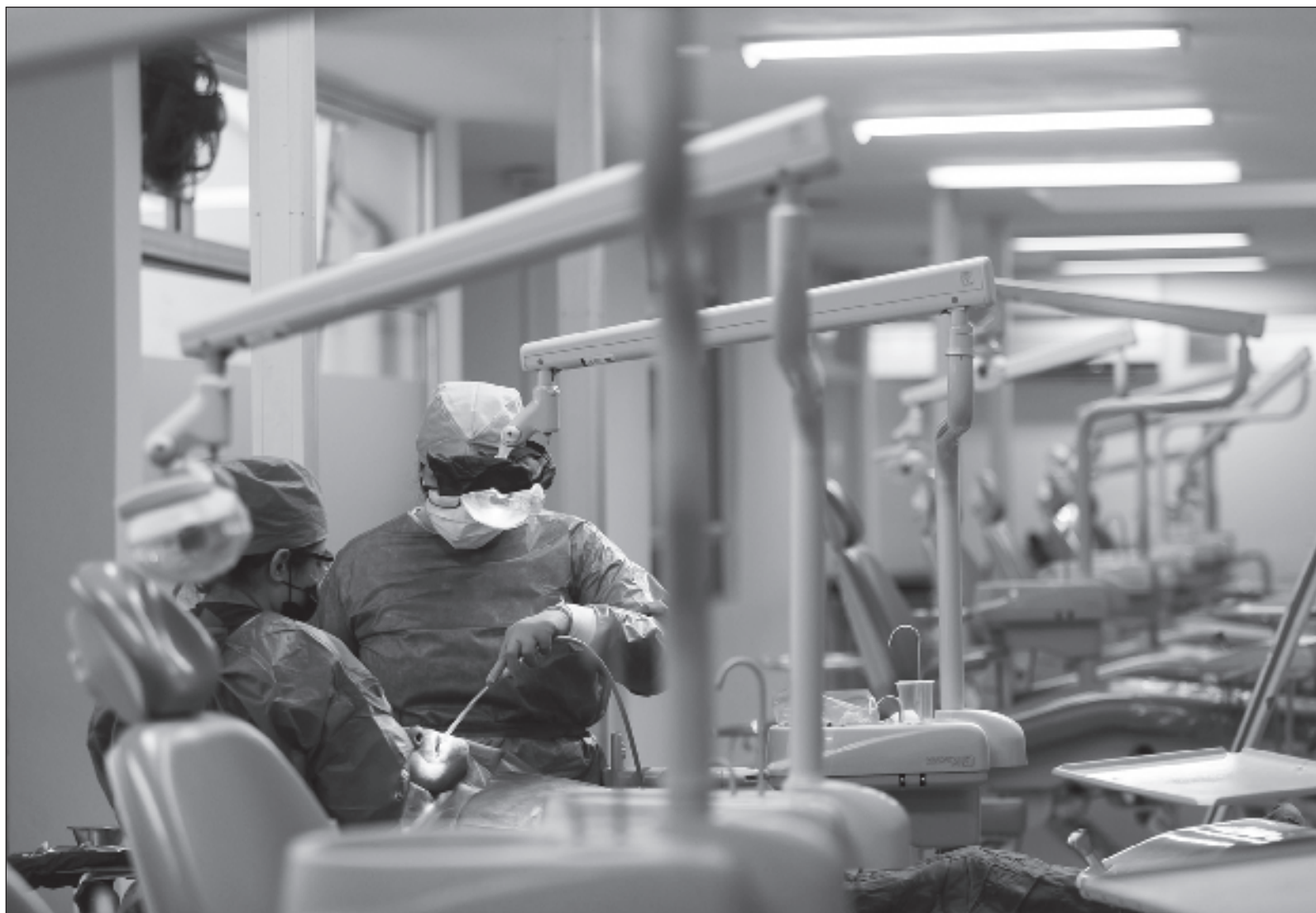
▲ “Tengo miedo que con mis nuevos dientes se borren los recuerdos de la pandemia, cuando realmente conocí a las personas que amo”.