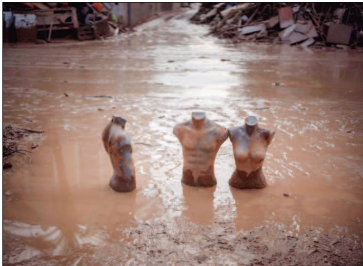
▲ "Para atacar la crisis climática, se requieren cambios que modifiquen el funcionamiento de nuestras sociedades, a partir de una profunda transformación de los sistemas económicos y políticos imperantes".

Esta transformación implica fijar límites sólidos al consumo desme-