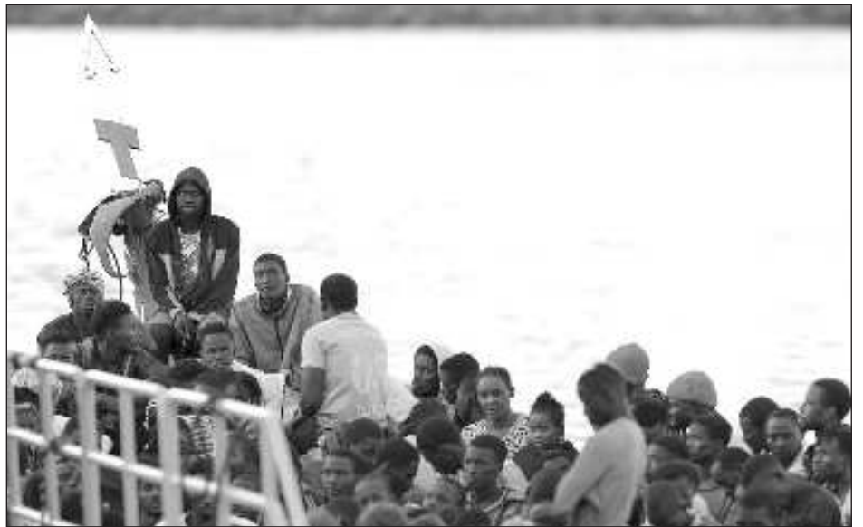
▲ "Queremos facilitar que las personas extranjeras consigan un trabajo adecuado a su perfil profesional, explicó la ministra socialista, y agregó que la modificación del reglamento transformará "a mejor nuestro país. España es hoy por suerte un país de oportunidades".

De acuerdo con la plataforma, este martes la concentración actual de PM2.5 es 66 veces el valor recomendado anual por la OMS.