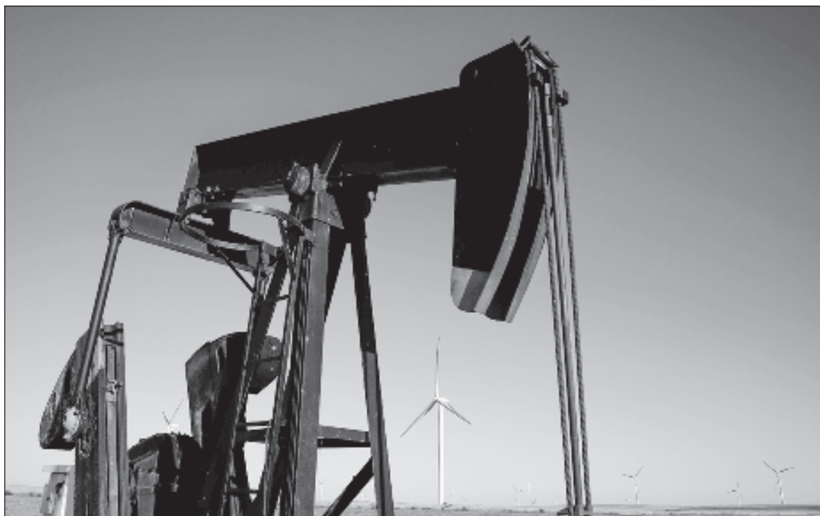
▲ “La energía fósil es el motor del planeta, el sol no alcanza para mitigar el problema. Las potencias lo saben”.

“... CONSTATO CON TRISTEZA que el mundo está peor, tenemos el mayor número de conflictos armados desde la segunda Guerra mundial, la mayor cantidad de fenómenos climáticos extremos con efectos devastadores en todos los puntos del planeta (...) el hambre no es el resultado de la escasez por fenómenos naturales, es una