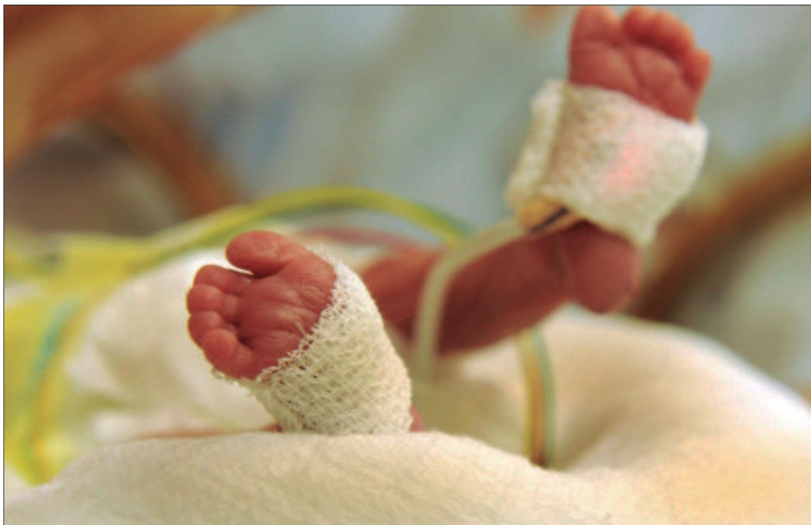
▲ “La calidad de vida de los bebés prematuros dependerá de la calidad de intervenciones que recibe después del nacimiento”.