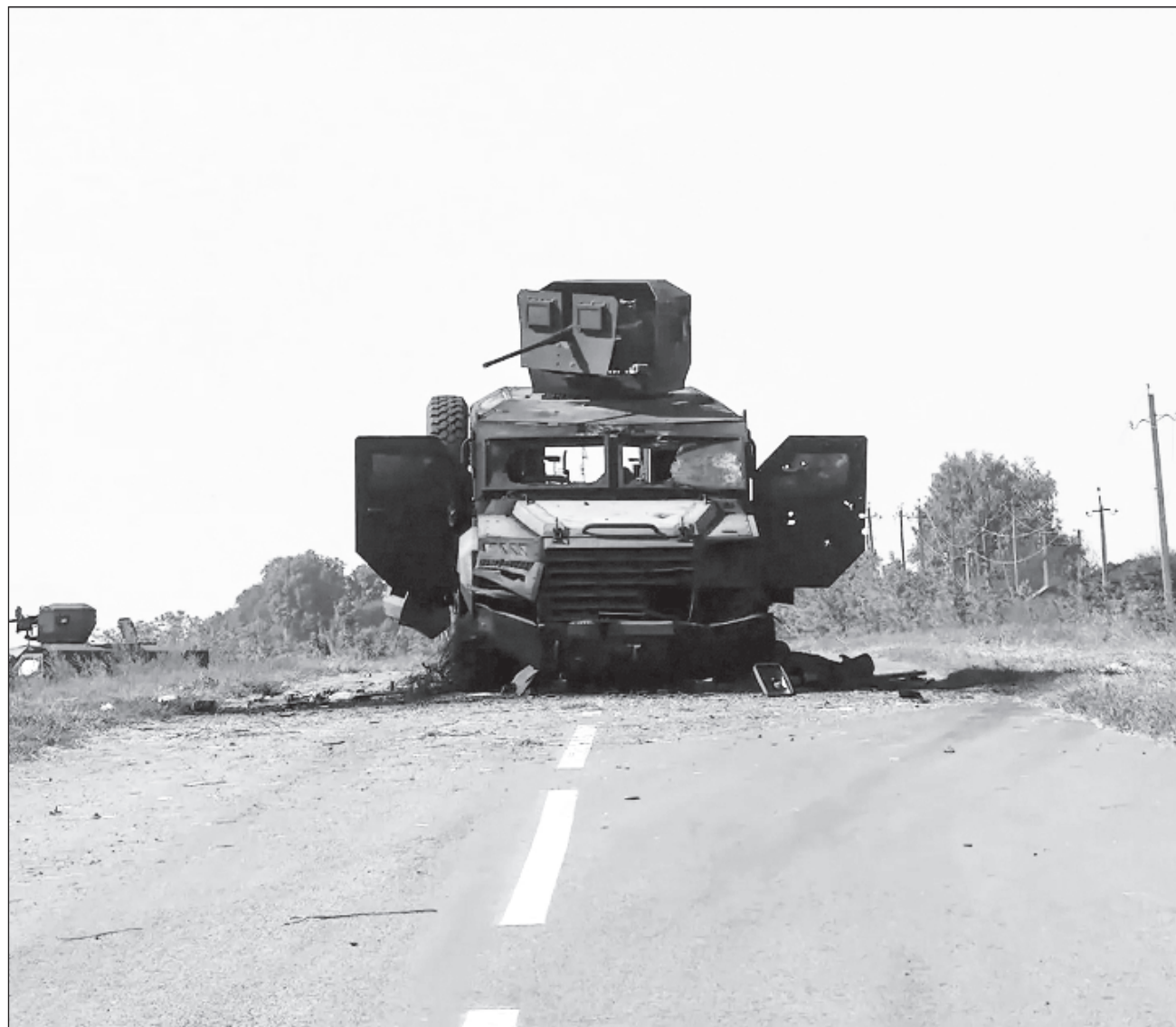
▲ El presidente ruso, Vladimir Putin, advirtió en septiembre que los países de la OTAN estarían “en guerra con Rusia” si permitían a Ucrania atacar territorio ruso con misiles occidentales de mayor alcance.

Esas posibilidades incluyen el recurso a armas nu-