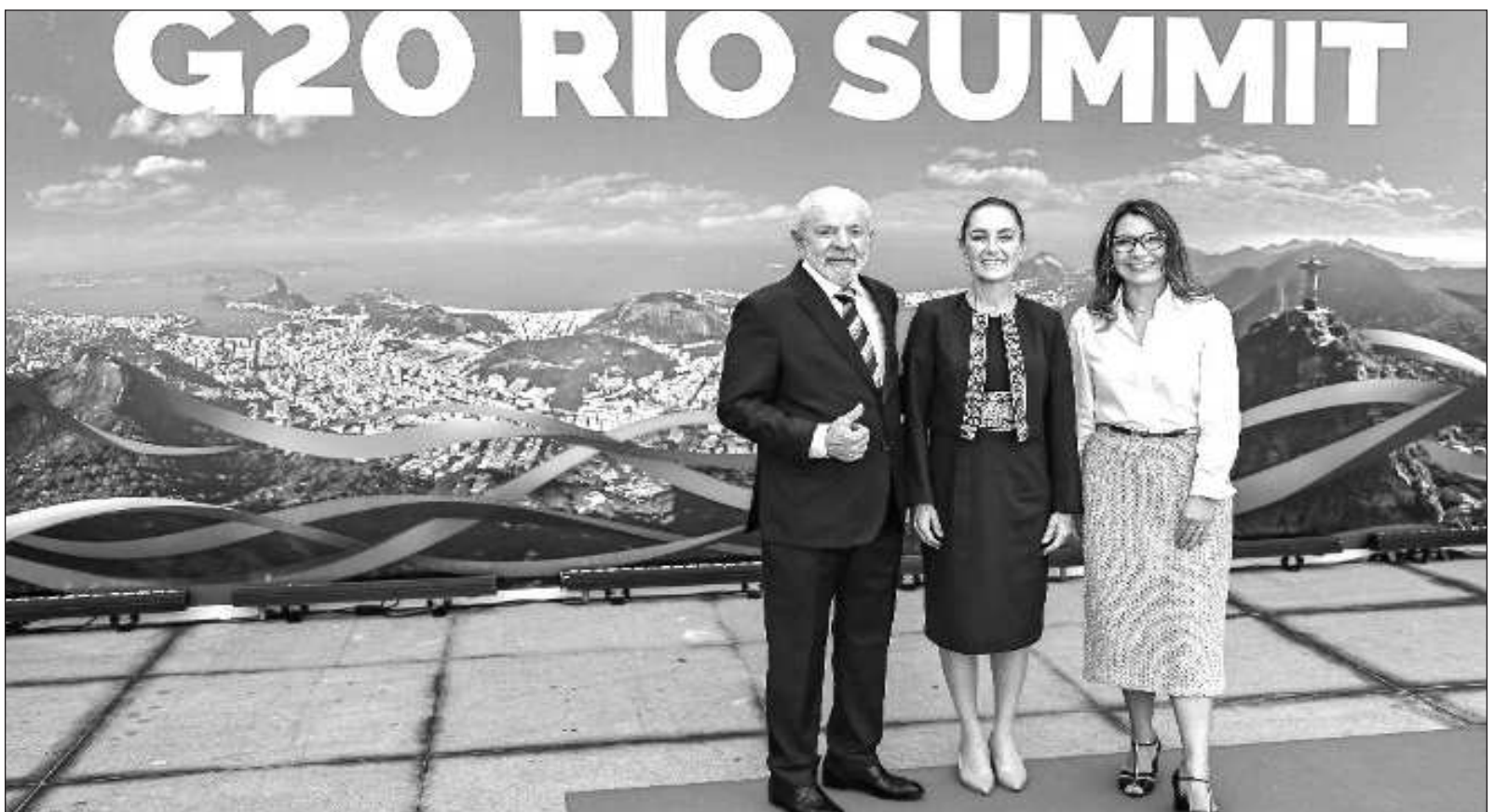
▲ “Una cercenadura presupuestal de esa magnitud implicaría reducir la posibilidad de cumplir diversos compromisos de índole internacional”.