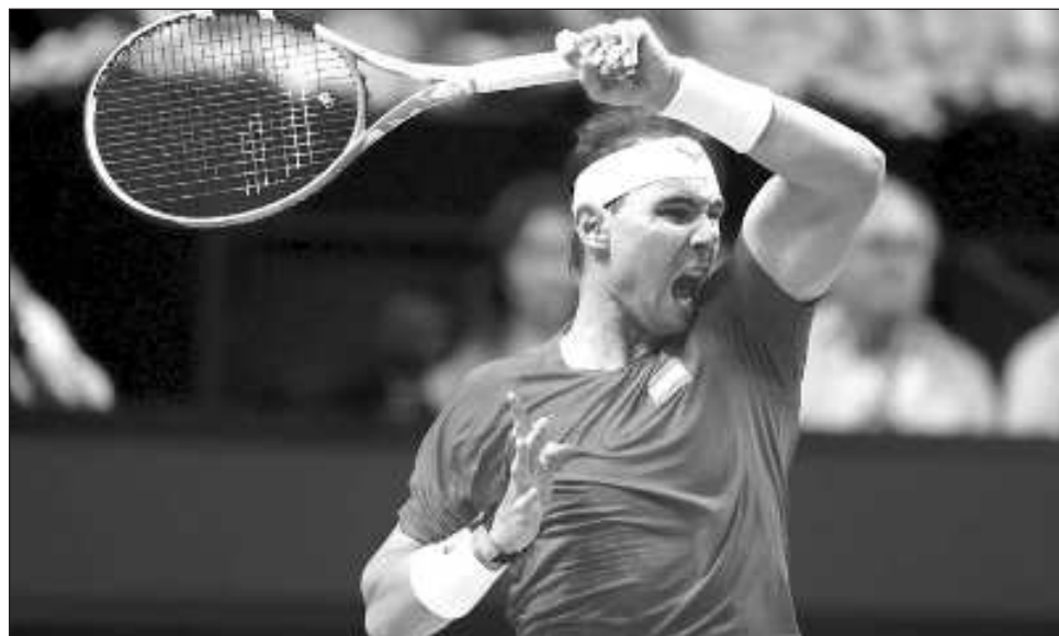
▲ Rafael Nadal, durante el último encuentro de su carrera, en los cuartos de final de la Copa Davis.

Su discurso precedió a un video de felicitaciones con grandes figuras del tenis y el deporte mundial: Serena Williams, Andrés Iniesta, Roger