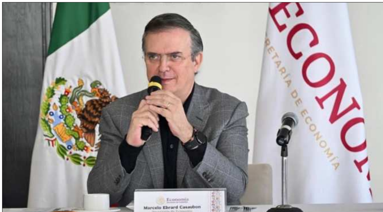
▲ Marcelo Ebrard señaló que la negociación no será tan dura como en 2018, cuando se encontró a un Donald Trump asegurando que el entonces Tratado de Libre Comercio de América del Norte, era el peor acuerdo comercial de la historia.

Para Ebrard, la revisión del T-MEC implica un reto, pero resaltó que "retos siempre habrá", por lo que ahora el equipo negociador de la