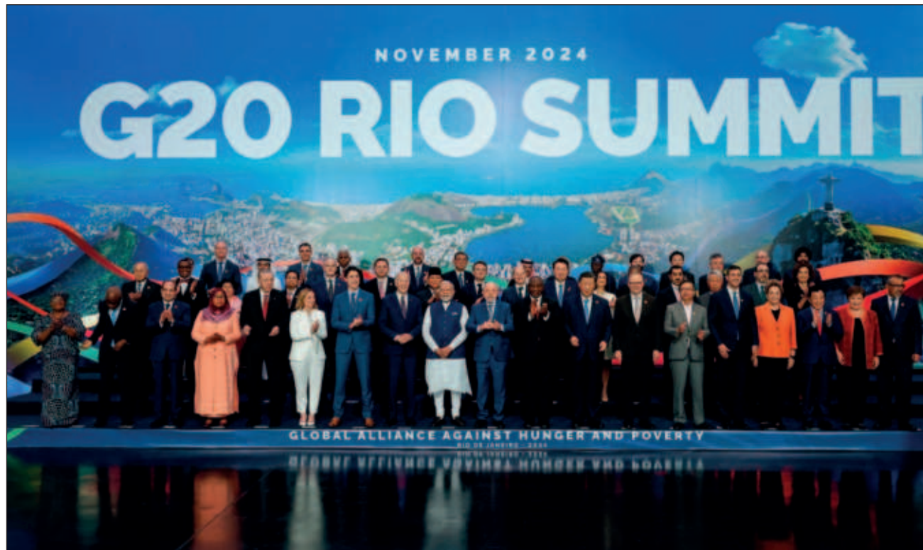
▲ El pedido del presidente brasileño tiene lugar un día después de que las 20 principales economías del mundo, que representan 85 por ciento del PIB mundial y 80 por ciento de emisiones, suscribieran la declaración final del encuentro, la cual fue presentada con pocos avances respecto a la agenda climática.

El secretario general de la ONU, António Guterres, secundó el llamado al reiterar que “fracasar” en la capital azerbaiyana “no es una opción”, debido a la magnitud de los desafíos que afronta el planeta.