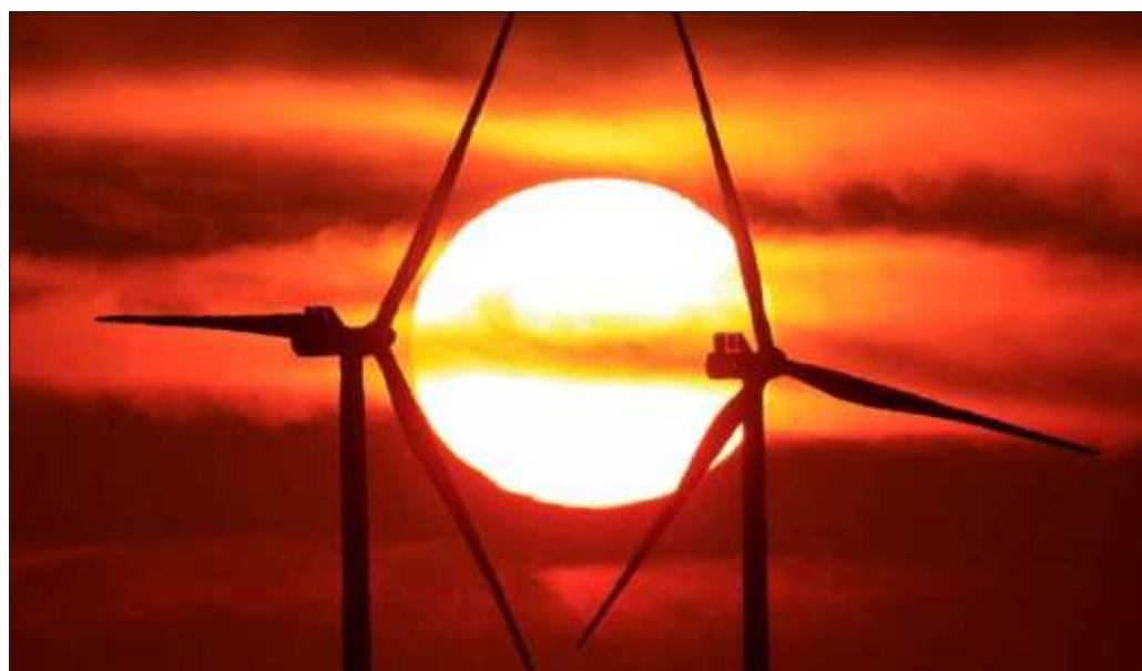
▲ El potencial está ahí, con cinco parques de energía limpia, nuevas centrales de ciclo combinado, un Puerto de Altura y el Tren Maya. Esto es tener una mezcla afortunada para la producción y la logística.

El potencial está ahí, con cinco parques de energía limpia, nuevas centrales de ciclo combinado, un Puerto de Altura y el Tren Maya. Esto es tener una mezcla afortunada para la producción y la logística. Haría falta comprometer a la CFE a que fortalezca su red de distribución para así evitar los molestos y dañinos apagones. Esto haría realidad la creación de un polo de bienestar.