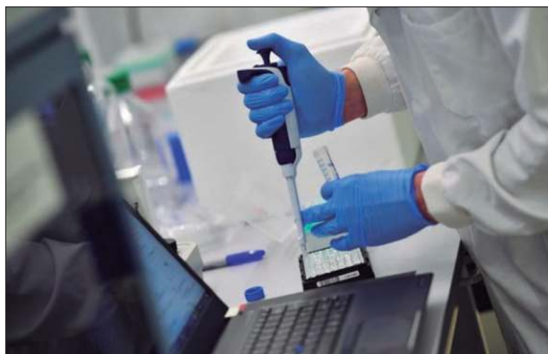
▲ "Cómo pasamos de la carrera por los puntos a la instrumentalización de las comunidades en los proyectos que buscan la incidencia social".

El problema es que tenemos una comunidad científica que aún no está preparada para hacer este profundo salto cualitativo y también