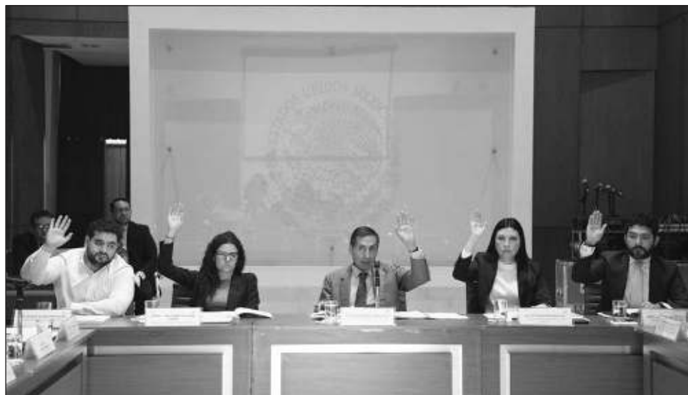
▲ En la reunión participaron la gobernadora del BdeM, así como los secretarios de Gobernación, Luisa María Alcalde, y del Trabajo, Marath Bolaños, y la titular del ISSSTE, Bertha Alcalde.