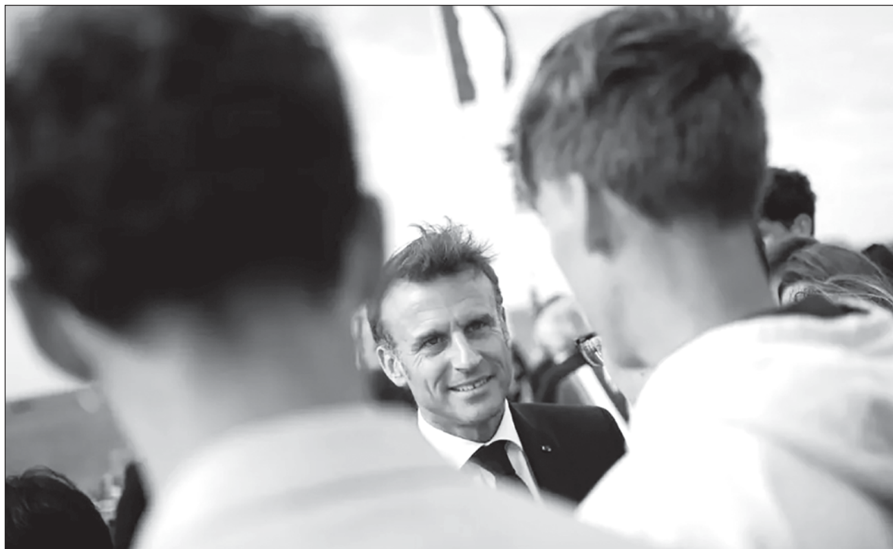
▲ Los comentarios del presidente francés, Emmanuel Macron, de considerar “grotesco” la posibilidad de “cambiar de sexo en el ayuntamiento” conmocionó a los grupos y colectivos LGTBTIIQ+, así como a la oposición de izquierda.

Francia autoriza desde 1992 a las personas transgénero a modificar su estado civil, pero esta modificación estaba condicionada a una “prueba médica irreversible de una transformación física”.