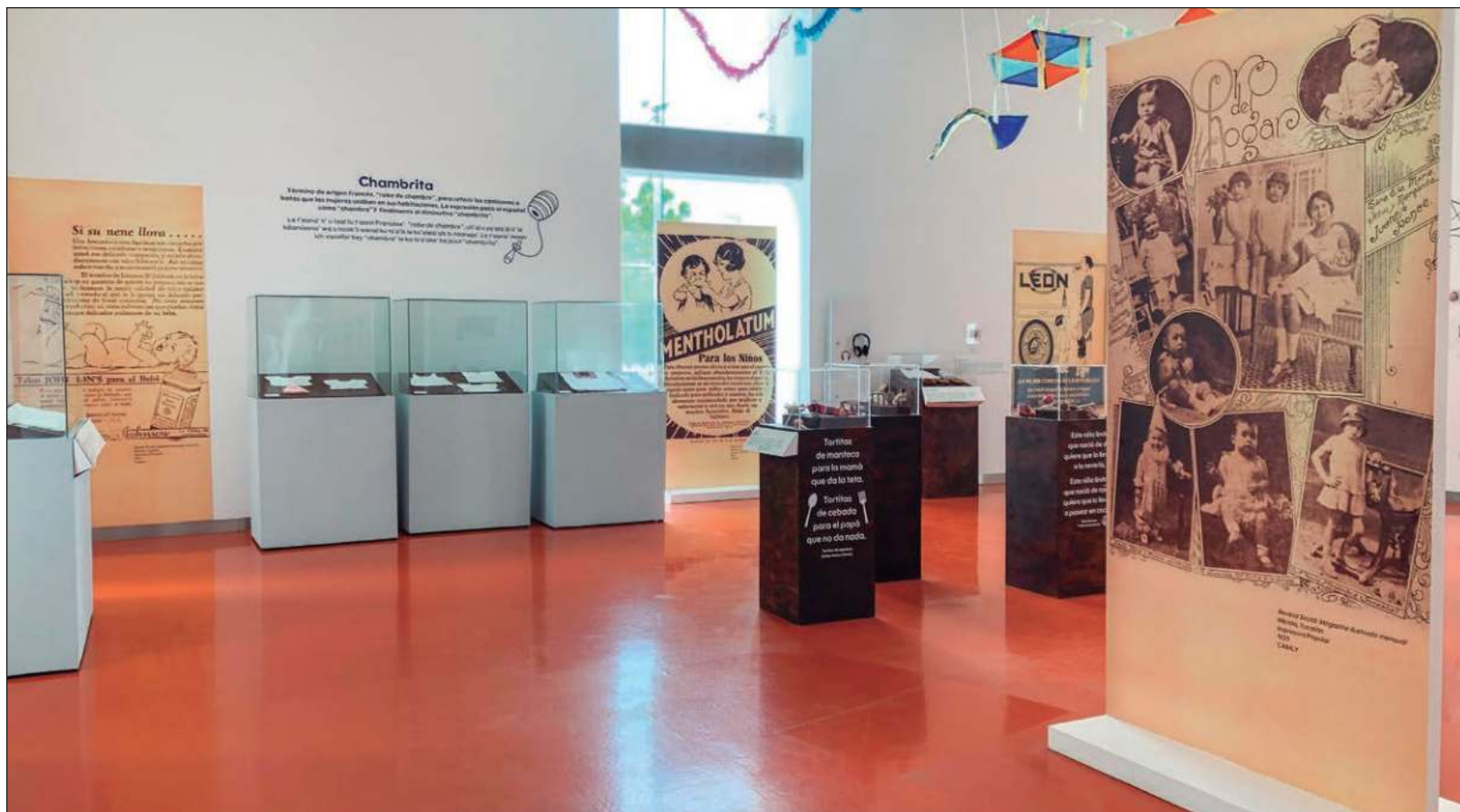
▲ La exposición es nostalgia; es capaz de transportar al visitante a los juegos de la infancia, las poses en las fotografías que todavía no se digitalizaban o el recuerdo de la primera comunión. También es recordar esas costumbres para recibir al bebé y la ceremonia del jéets méek' .

Chan paal. Nenés, niños y niñas en Yucatán es una exposición temporal que estará hasta el próximo 30 de septiembre de miércoles a lunes de 9 a 17 horas con entrada gratuita. La muestra está abierta y dirigida a todo tipo de público.