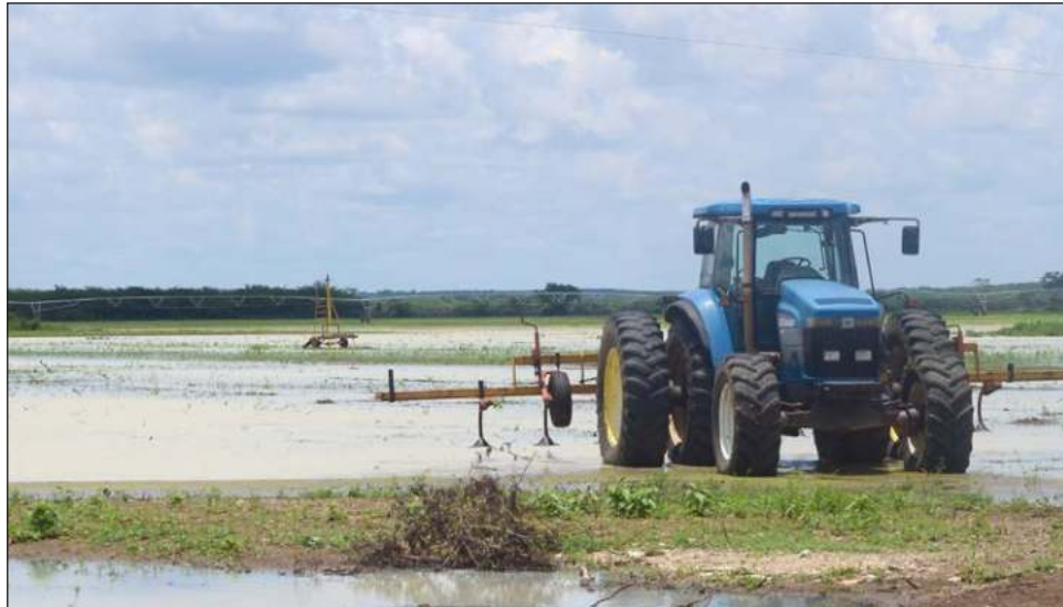
▲ Los horticultores dijeron que "hay sospecha de que la obra no finalizada de las vías del Tren Maya obstruye el caudal natural del cauce por donde se drenan las aguas de esta zona".

Las caras de los productores lo decían todo, meses de trabajo desaparecieron debido a la inundación de áreas que no se encharcaban severamente. Las lechugas, el rábano y otras hortalizas no podrán rescatarse, al menos no está cosecha, aún