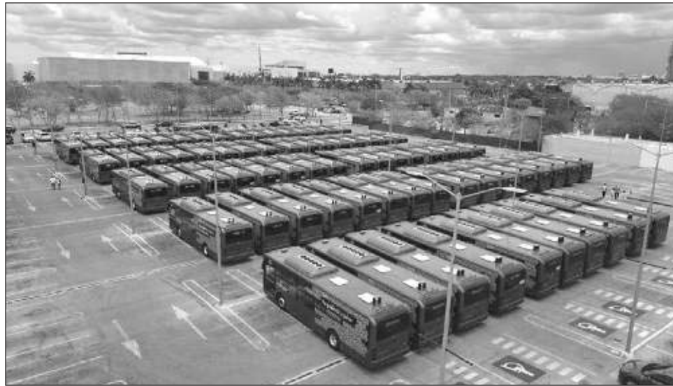
▲ Las nuevas unidades híbridas -amigables con el medio ambiente- son Yutong, contaminan 60 veces menos que un autobús convencional y no generan ruido. Además, combinan un sistema de propulsión diésel-eléctrico, con capacidad para 70 personas.

El horario de funcionamiento será de lunes a do-