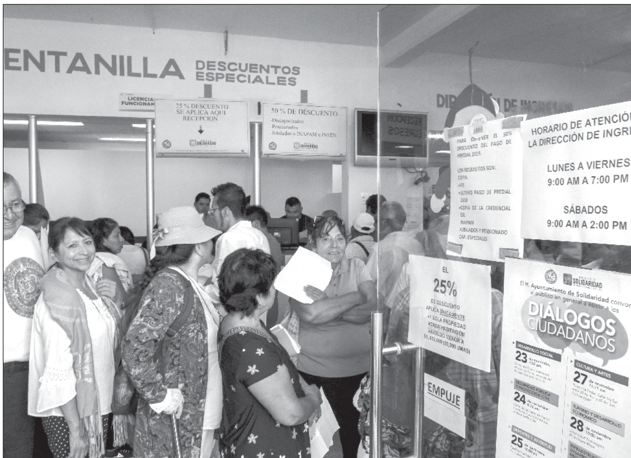
▲ El estudio ¿Cómo gastan los estados? Informe Estatal del Ejercicio del Gasto , del Instituto Mexicano para la Competitividad, examina si los gobiernos estatales han recaudado conforme a lo estimado en sus leyes de ingresos.

A través del Sindicato de la Industria de la Radio y la Televisión ha impartido cursos de periodismo radiofónico y locución. En febrero del 2023 recibió en la Cámara de Diputados el reconocimiento a su trayectoria en medios de comunicación, otorgado por Comunicadores por la Unidad A.C. En septiembre de ese mismo año, la Asociación Nacional de locutores delegación Yucatán, le entrega la medalla Luis M. Fariás por 25 años de trayectoria en los micrófonos.