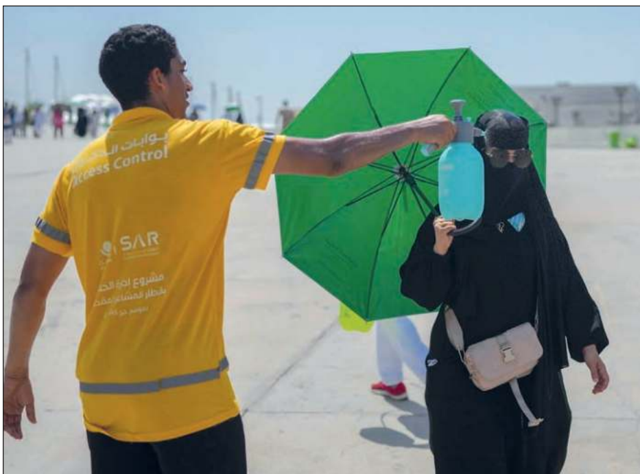
▲ De acuerdo con un estudio saudita publicado en mayo, las temperaturas en los lugares donde se llevan a cabo los rituales aumentan en 0.4 grados centígrados cada 10 años.

Enseguida, Putin apuntó: "Hoy luchamos juntos contra el hegemonismo y las prácticas neocoloniales de Estados Unidos y sus satélites, oponiéndonos a los intentos de imponer modelos de desarrollo y valores que son ajenos para nosotros".