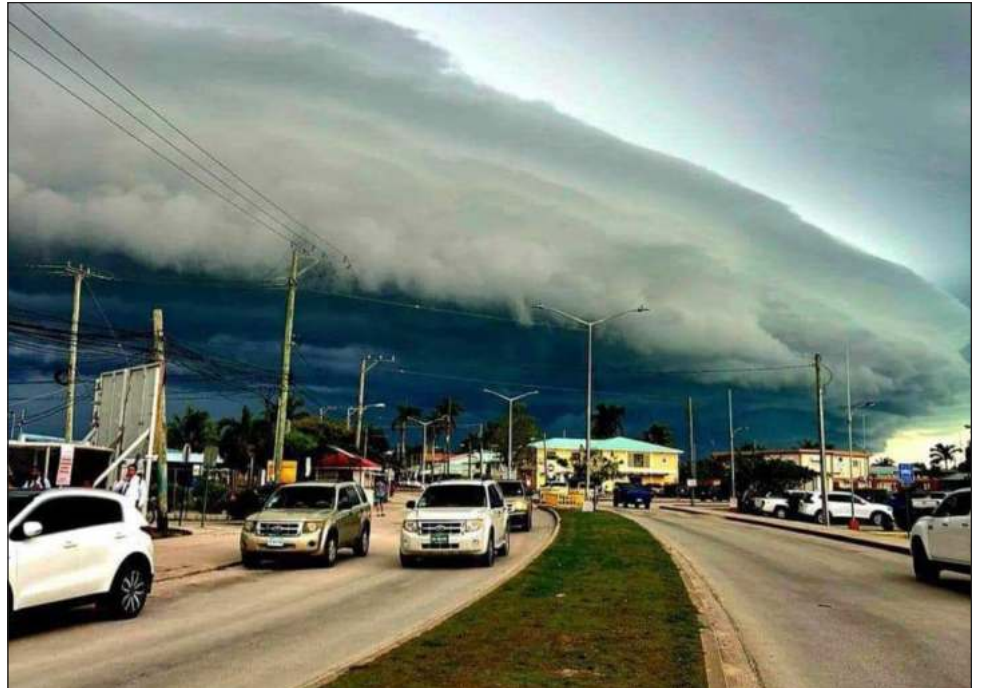
▲ El término potencial ciclón tropical nació ante la falta de una nomenclatura para los fenómenos que están apenas desarrollándose, pero que presentan vientos fuertes.

Para que ya sea considerado huracán tiene que alcanzar velocidades superiores a 110 km/h para la categoría 1; de ahí por velocidad de viento si rebasa 154 km/h entra a categoría 2; después de 178 km/h es categoría 3; desde 209 km/h categoría 4 y hasta que supere 252 km/h es categoría 5.