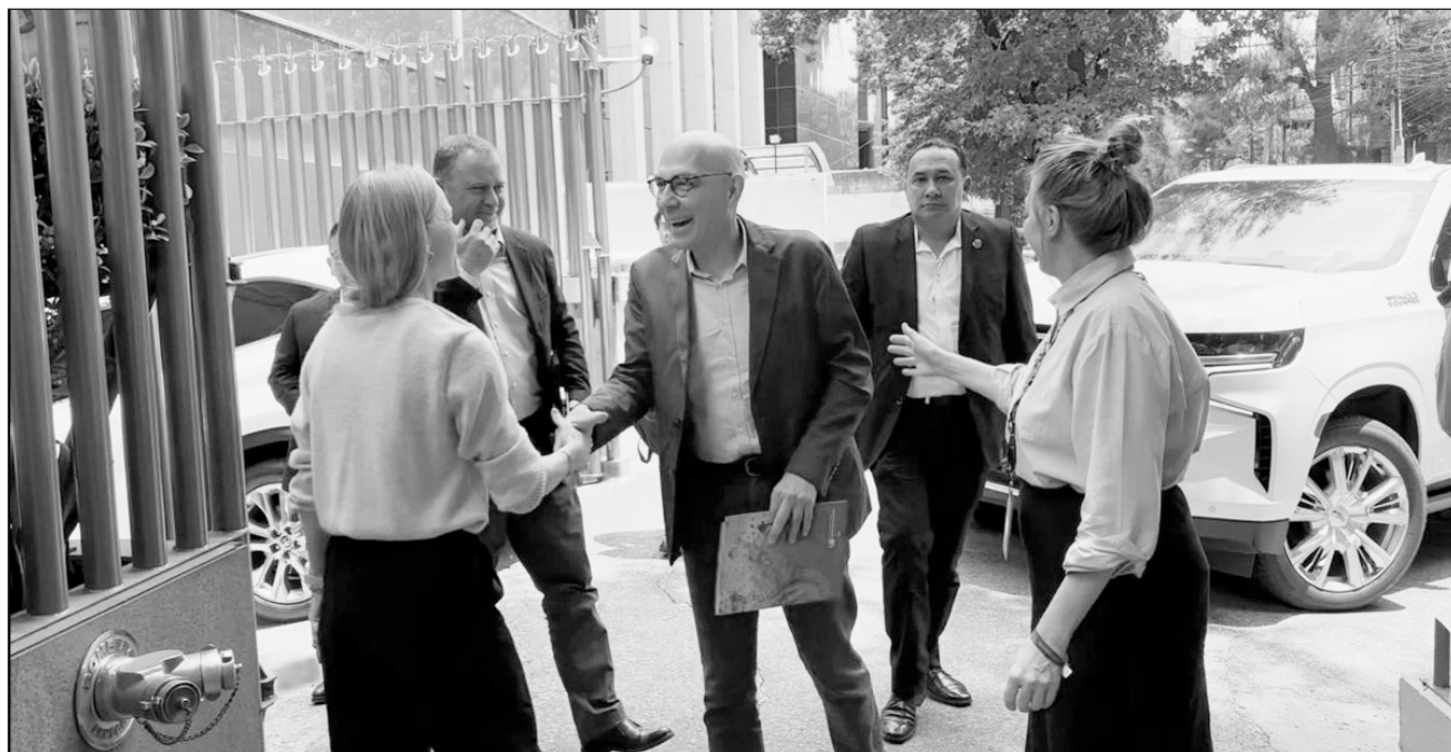
▲ Türk arribó a CDMX para una primera reunión con integrantes y representantes de diversas agrupaciones.

Türk arribó a oficinas de la Organización de las Naciones Unidas (ONU) en la Ciudad de México alrededor de las 13 horas para una primera reunión con integrantes y representantes de diversas agrupaciones, entre ellas, Documenta; el Centro fray Juan de Larios; Centro de Derechos Humanos Miguel Agustín Pro Juárez; Amnistía Internacional; Centro de Derechos Humanos de la Montaña Tla-