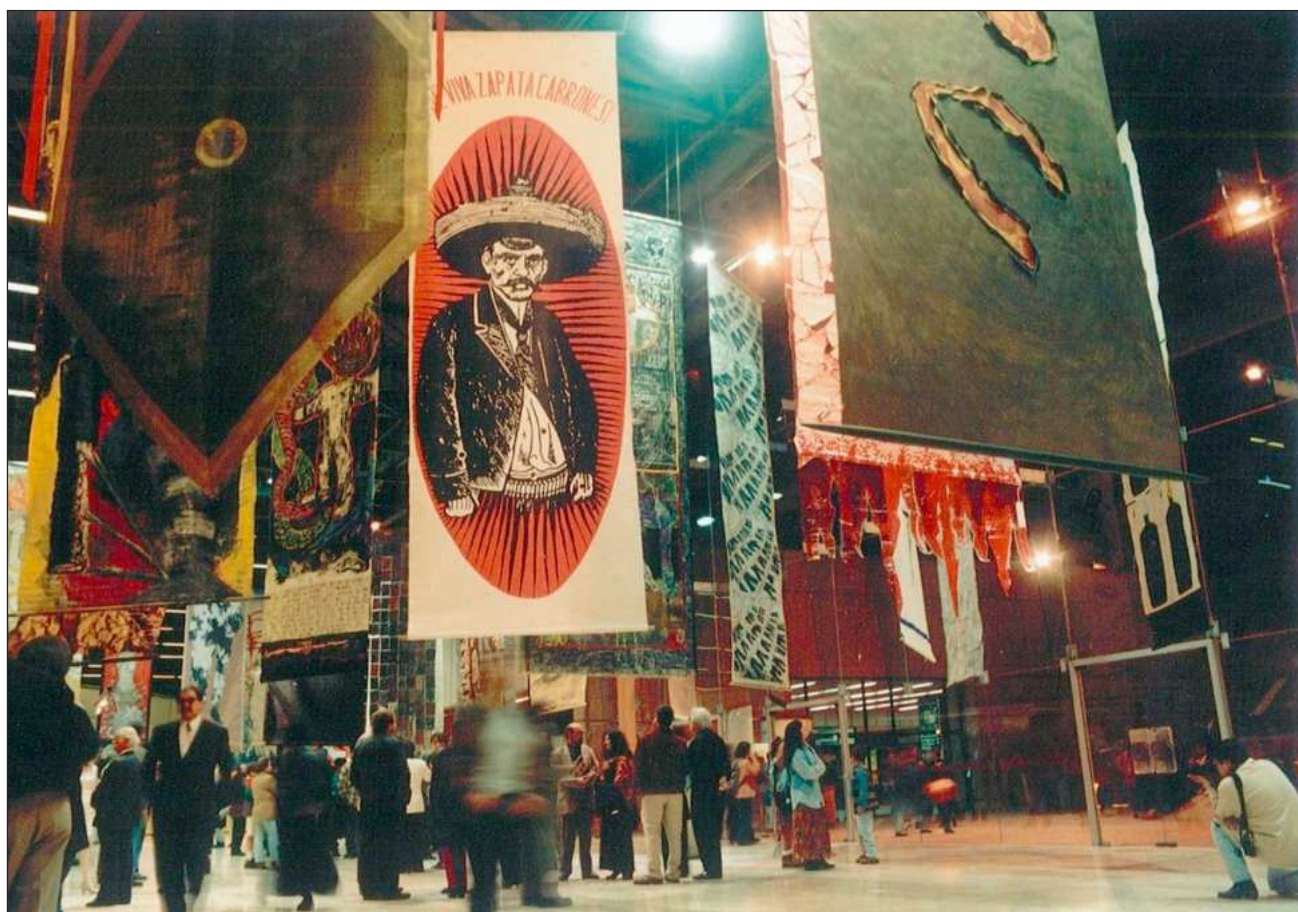
▲ El evento cultural nació en 1996 como un salón anual orientado a propiciar el encuentro entre artistas; trató de combinar los emergentes, con otros de trayectoria internacional y figuras claves del arte contemporáneo.

das las piezas irían enrolladas en un solo tubo. El estandarte más pesado es de 12 kilos”. Hasta el mo-