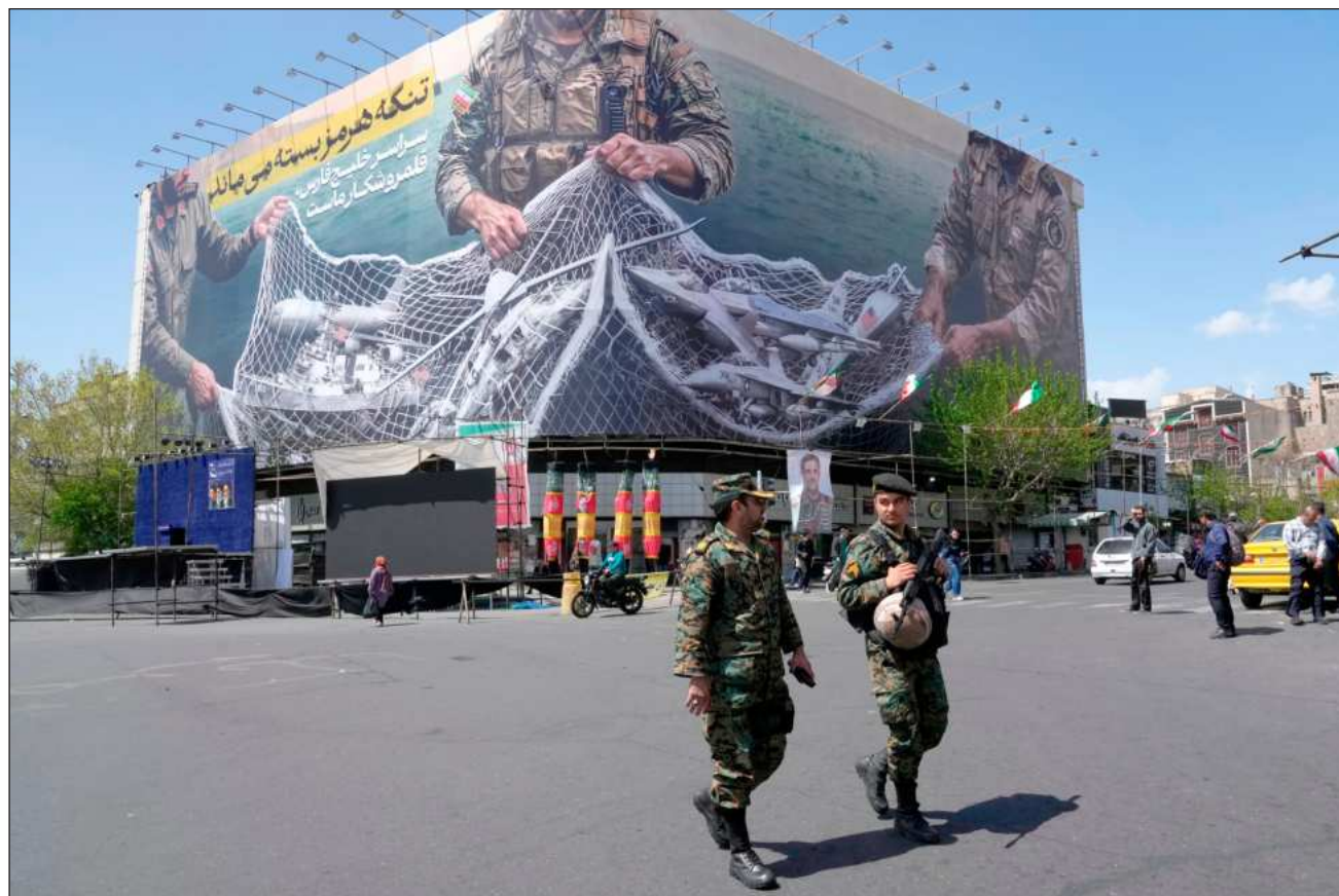
▲ Según Trump, la Marina de EU en el golfo de Omán advirtió a la embarcación que se detuviera, pero no lo hizo.

La incertidumbre generó una nueva alza de los precios