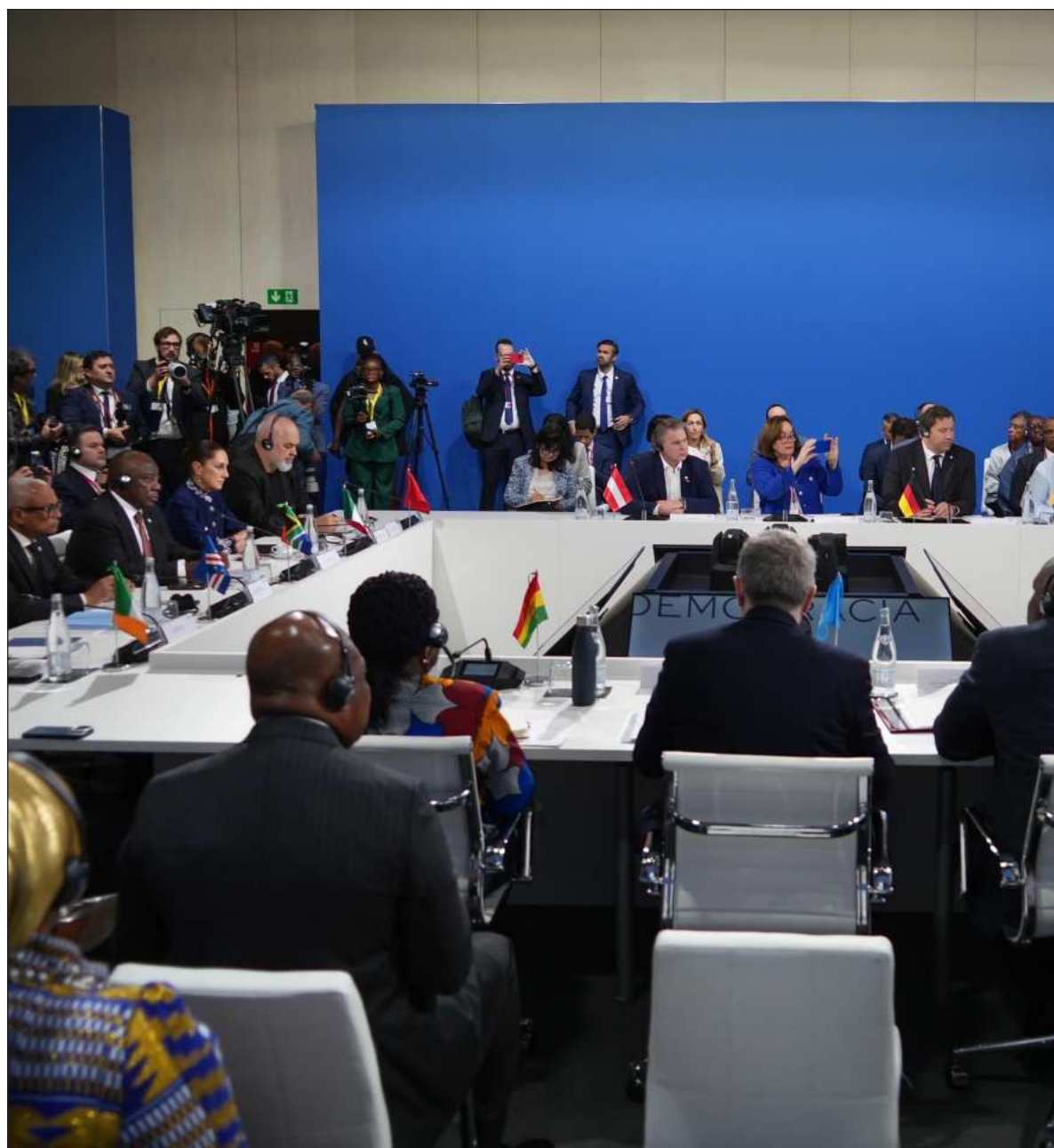
▲ “La postura del gobierno de la presidenta sheinbaum en la cuarta cumbre en defensa de la democracia reafirma la avanzada de la 4T por seguir el rumbo hacia la revolución de las conciencias”.