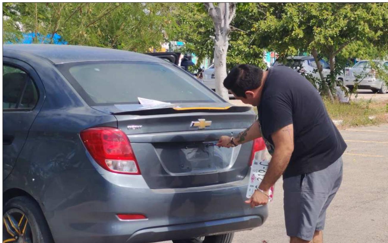
▲ El secretario de Administración y Finanzas subrayó que “la gobernadora amplió ese plazo 15 días más. Actualmente, quienes realizan el procedimiento no pagan multa, pero sí un recargo conforme a las leyes de ingresos de cada municipio”.

El funcionario precisó que el periodo de gracia concluyó el 31 de marzo a través del Seafi, instancia encargada del