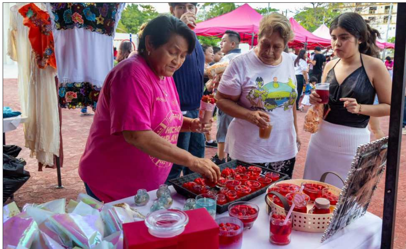
▲ El Mercado Hecho en Playa se proyecta como un nuevo punto de encuentro social y económico.