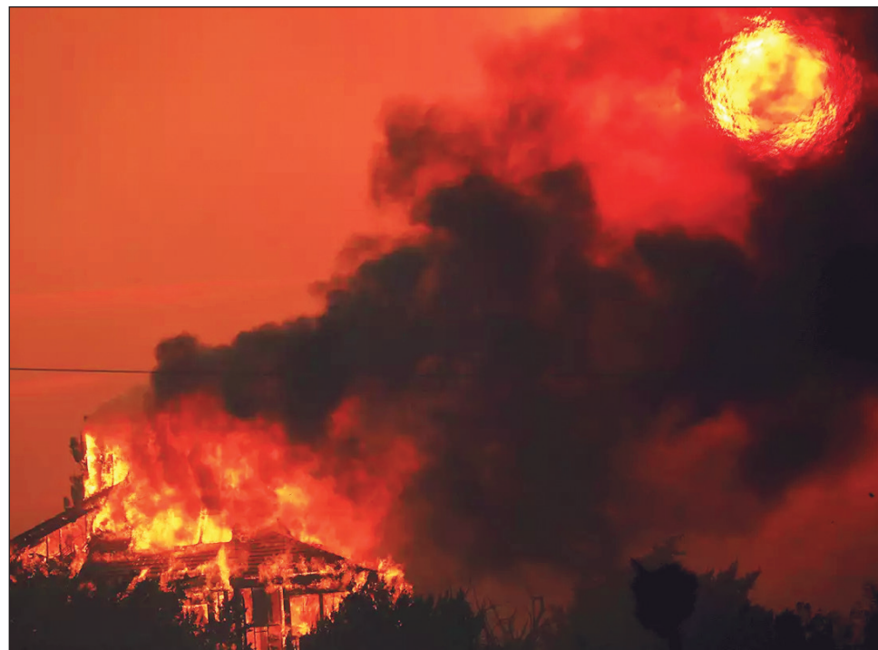
▲ Las restricciones por la pandemia retrasaron la ayuda en algunas regiones.

Entre los indicadores que se destacaron se encuentran las extensiones de hielo marino en el Ártico, que fueron mínimas en dos meses de