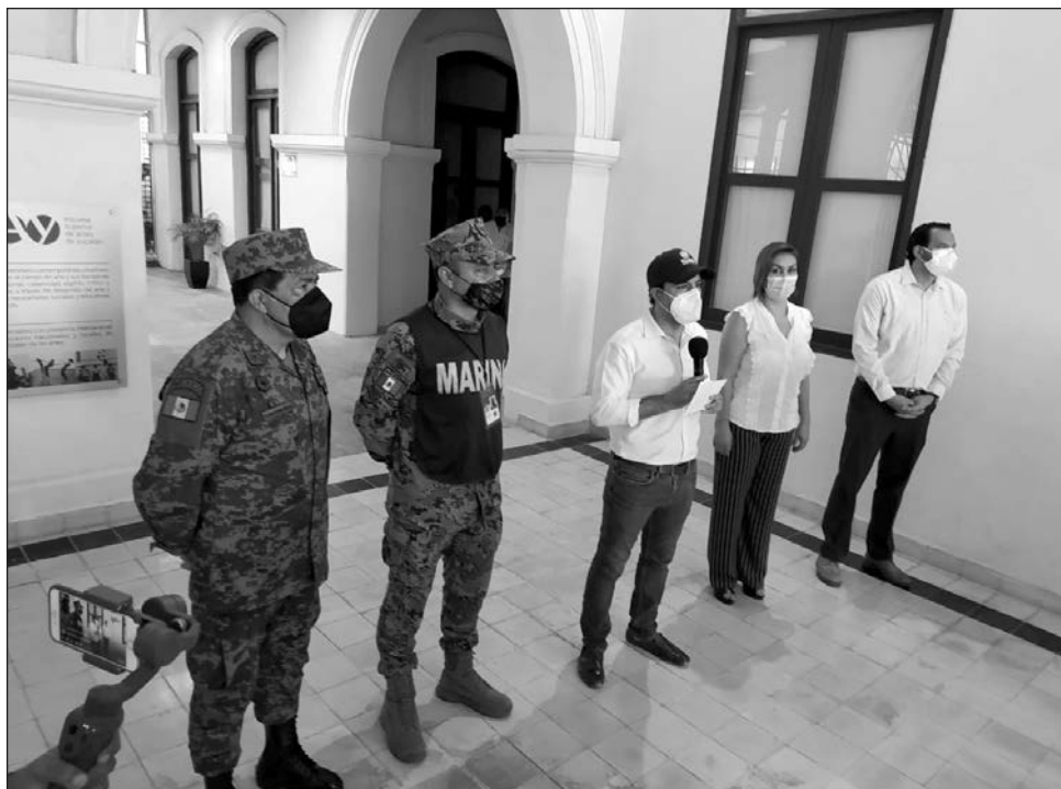
▲ Ya existe una propuesta para la transición al semáforo amarillo.

"El domingo, a razón de la lluvia, dos de los módulos de vacunación se vieron en la necesidad de cerrar tem-