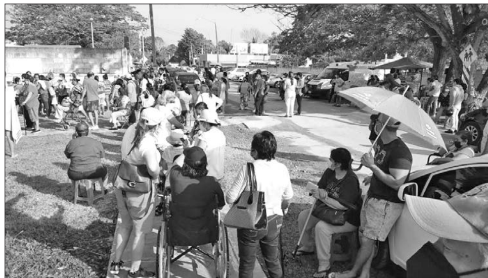
▲ En las últimas 24 horas se aplicaron 894 dosis en el estado.

Aunque la temperatura en la mañana superaba los