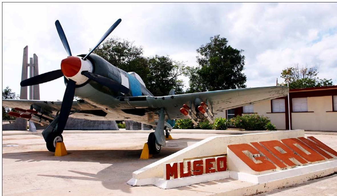
▲ El Museo de Playa Girón recuerda con sus objetos, los intentos por derrocar un gobierno y exalta el esfuerzo y la buena ventura del bando ganador.

tución del régimen de Castro con uno más dedicado a los verdaderos intereses del pueblo cubano, y más aceptable a EU, llevado a cabo de tal manera que evitara cualquier apariencia de una intervención estadounidense. Según lo planificado, los mercenarios de la brigada debían lograr rápidamente una cabeza de playa y declararla territorio liberado. Ahí sería trasladado, desde EU, el gobierno provisional, el cual estaría compuesto de exiliados seleccionados por la CIA. En ese momento Kennedy le daría reconocimiento, el nuevo gobierno pediría ayuda internacional y los marines desembarcarían.