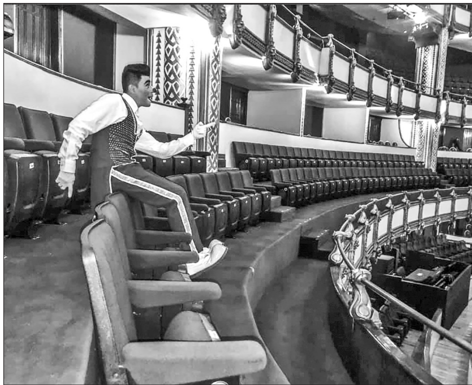
▲ Esta institución del espectáculo ha sorteado diversas etapas en sus más de cien años de historia, desde la Revolución Mexicana hasta la actual pandemia.