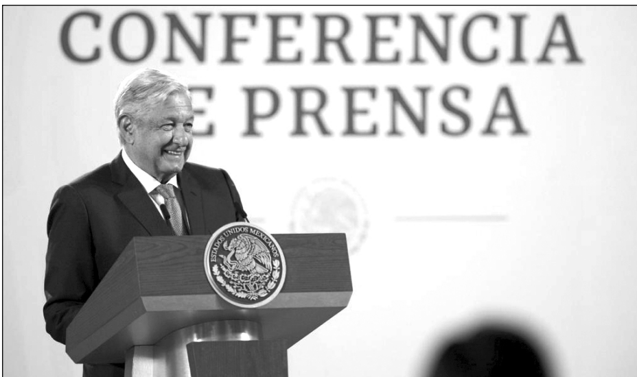
▲ AMLO no debe promover obras de gobierno en sus conferencias: INE.

"Si ese programa se amplía a Centroamérica podría ayudar muchísimo, porque podría crecer tres veces más. Estamos hablando del mismo clima, la misma naturaleza, la misma cultura,