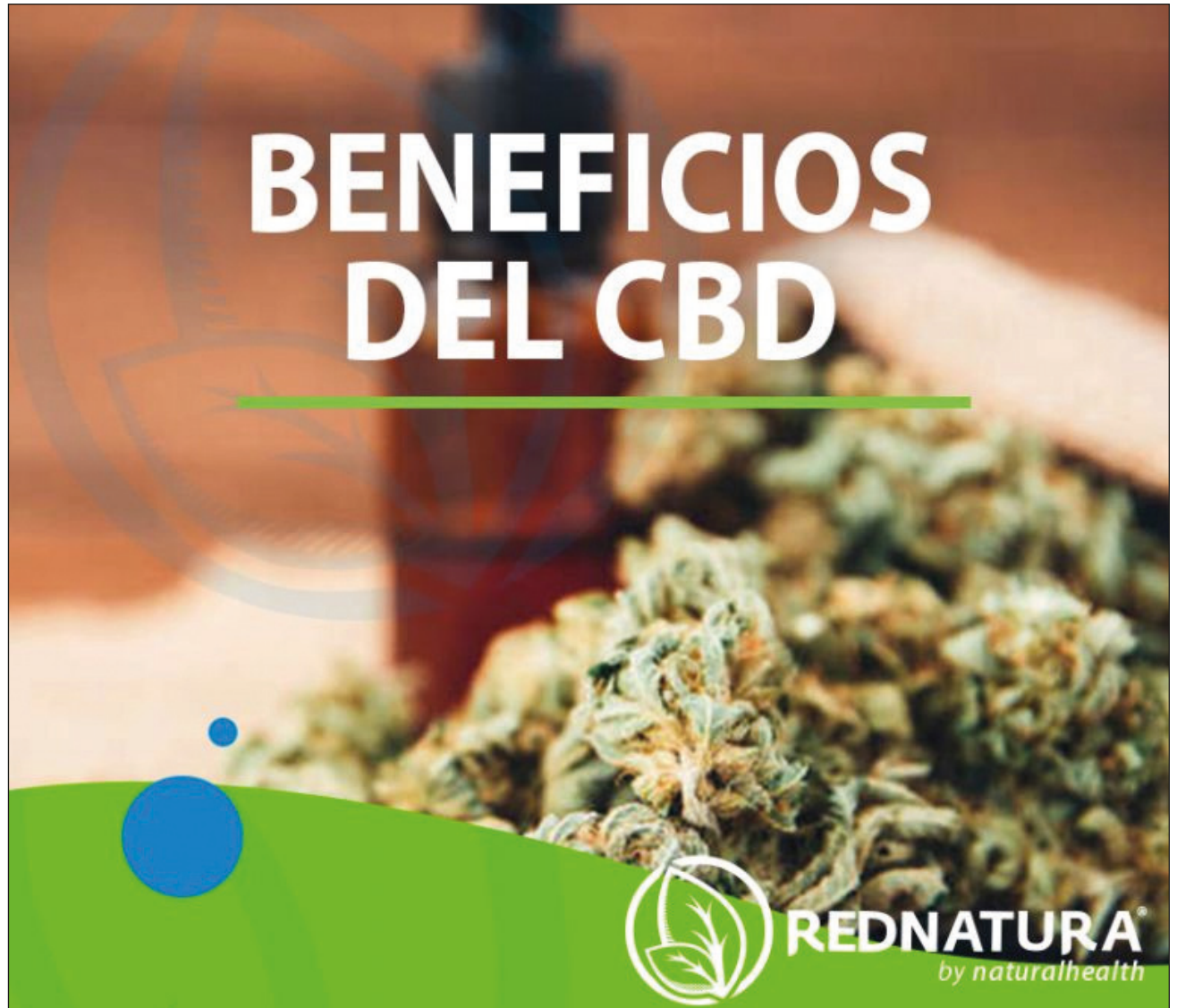
▲ Resulta contradictorio querer preservar usos y costumbres y a la vez prohibir la medicina alternativa.

“Estados Unidos trabajó por años en el tema y en vez de satanizarlo, busco un camino alternativo para que la regularización de la marihuana sea eficaz, siendo que, entendió que el cáñamo es diferente a la marihuana, y por supuesto que puede ser consumido sin que haya repercusiones a la moral, pues hay que decirlo: el CBD es de uso medicinal respecto a sus dosis y ayuda en la vida cotidiana”.