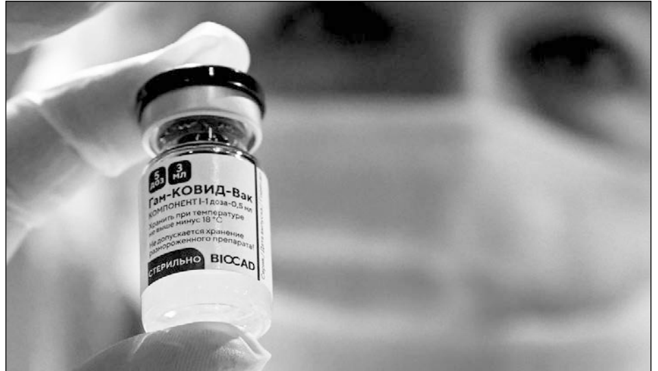
▲ Hasta ahora, la Sputnik V, desarrollada por el Centro Gamaleya, ha sido registrada en 60 países con una población total de 3 mil millones de personas.

De acuerdo al fondo, la tasa de contagio de 3.8 mi-