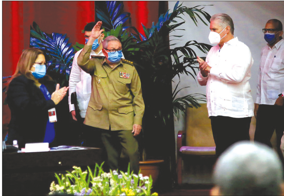
▲ Raúl Castro (al centro) informó el viernes pasado que ya no aceptaría una nueva elección como líder del PCC, el cual ahora estará encabezado por Miguel Díaz-Canel (der).

Castro tampoco apareció en el listado del Buró Político proporcionado por el portal Cubadebate, como tampoco figura allí el hasta