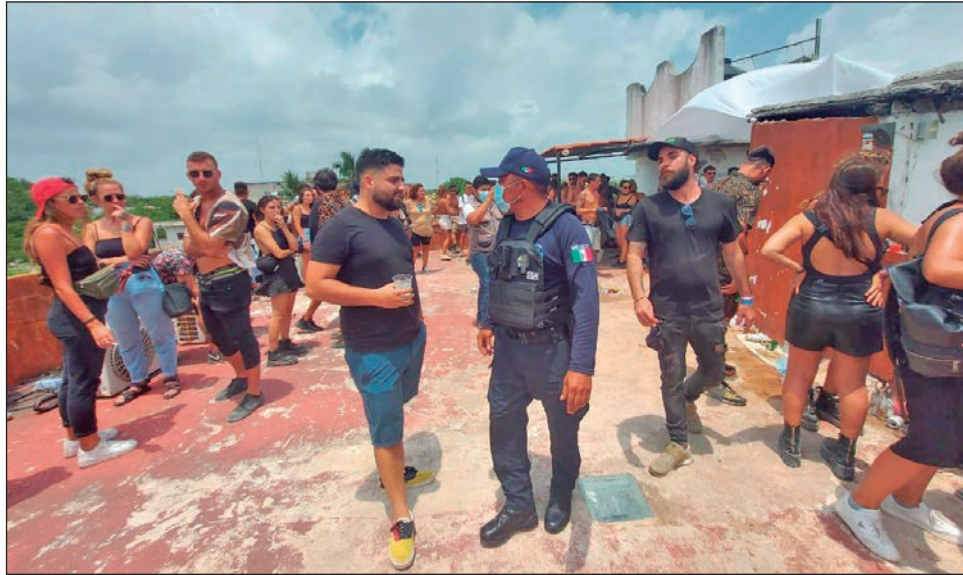
▲ En cada uno de los eventos había más de un centenar de personas.

Una de las fiestas se detectó en la azotea de un hostel ubicado en la colonia Lakín, donde habían más de 100 personas sin respetar la sana distancia y consumiendo bebidas