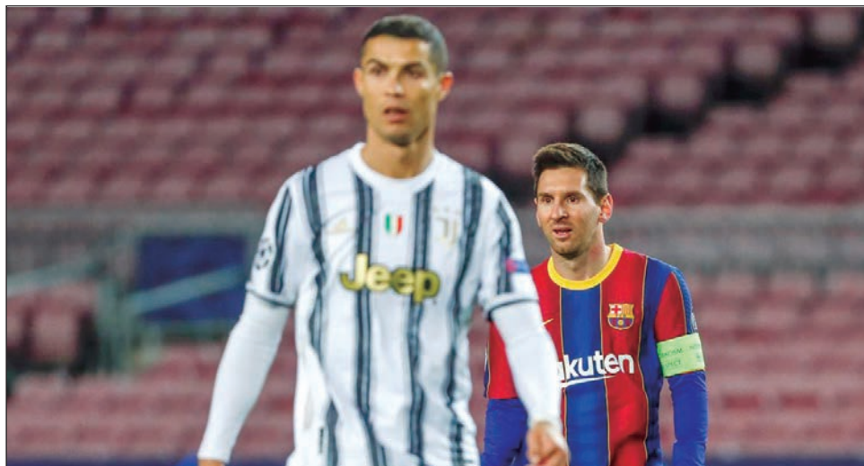
▲ Cristiano y Messi están entre las figuras que podrían quedar fuera de los torneos de selecciones de fútbol.

Las 55 federaciones miembro de la UEFA sostendrán su reunión anual