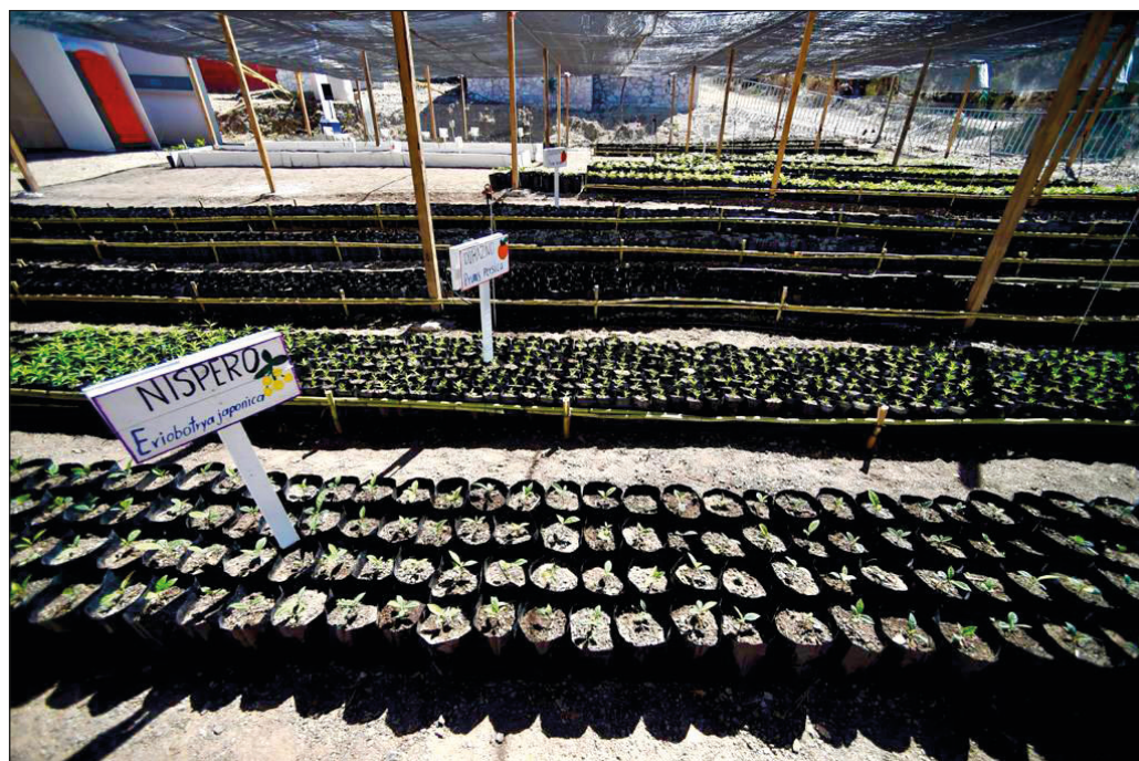
▲ México llegará con una iniciativa sustancial a la reunión entre presidentes

La reunión virtual entre ambos mandatarios, agendada para el jueves de esta semana, estará dedicada a las acciones sobre cambio climático. Es claro que la parte mexicana llegará al encuentro con una iniciativa sustancial, integral y con sentido común que contribuirá a despejar los malos augurios sobre un supuesto desencuentro entre AMLO y Biden por políticas ambientales y que ofrece, además, la posibilidad de alcanzar mecanismos de regulación migratoria que Washington necesita con urgencia. Cabe esperar, pues, que el mandatario del país vecino sea receptivo a la propuesta.