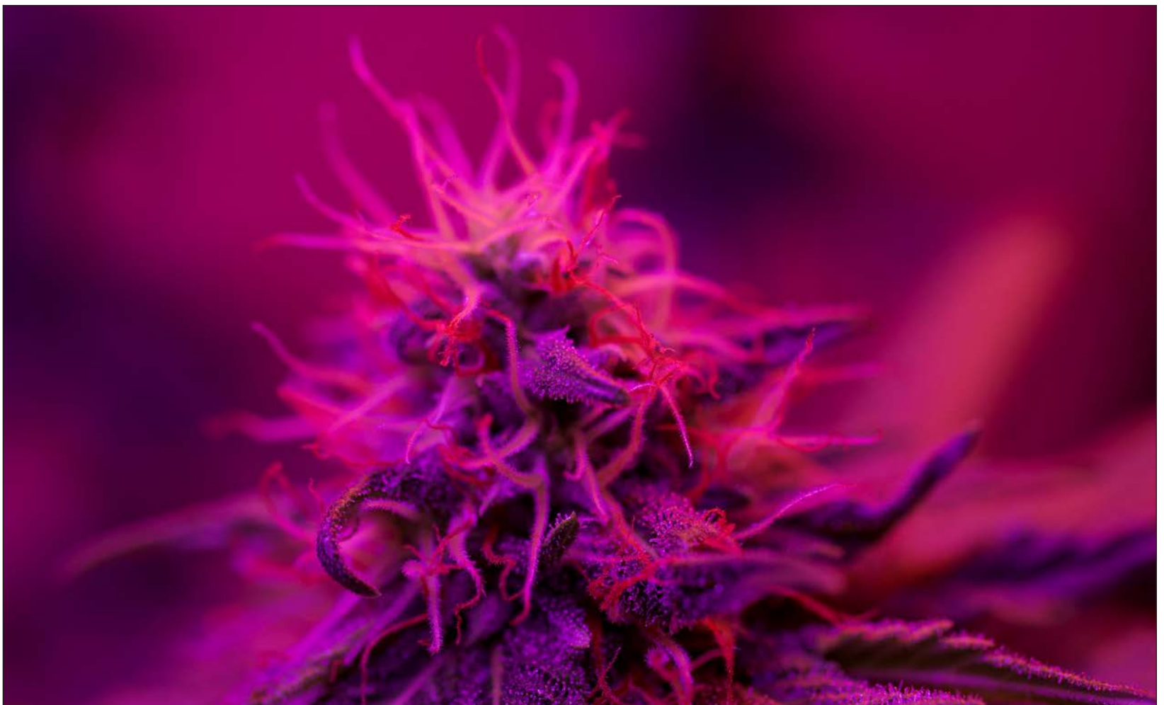
▲ Todo se obtiene en Internet, desde marihuana cultivada en interiores hasta insumos para un invernadero y empezar a producir.