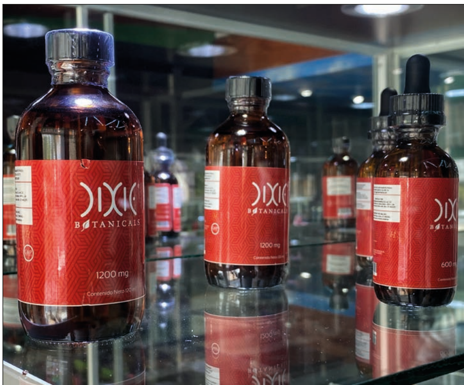
▲ El cannabis puede emplearse para varios padecimientos.