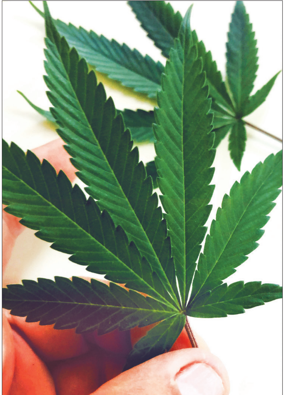
▲ Walkila' úuchik u éejenta'al aalmajt'aan tí'al u je'ets'el bix kéen k'a'abéetkunsa'ak cannabise' yaan u páajtal u pa'ak'al tu yotoch máak; yaan xan u páajtal u meyajta'al tumen ma' talam ba'ali', tuláakal tí' Internet yaan mñ.

U tuukulil Víctore' leti' u páajtal u pak'ik tí'al u páajtal u k'a'abéetkunsik xan, yéetel ka béeyak xan u ts'áak tí' máaxo'ob naats' yanik tí', ba'ale' lelo' yaan u yúuchul tumen ts'o'ok u je'ets'el a'almajt'aan tsolik bix u nu'ukil u