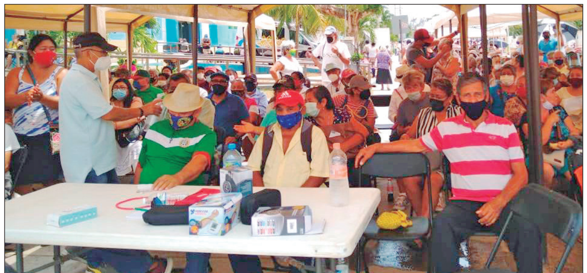
▲ Durante la primera fase, el pasado mes de febrero, se aplicaron 2 mil 190 dosis.

Y el miércoles 21 de abril toca el turno a las letras P y Q de 8 a 10 de la