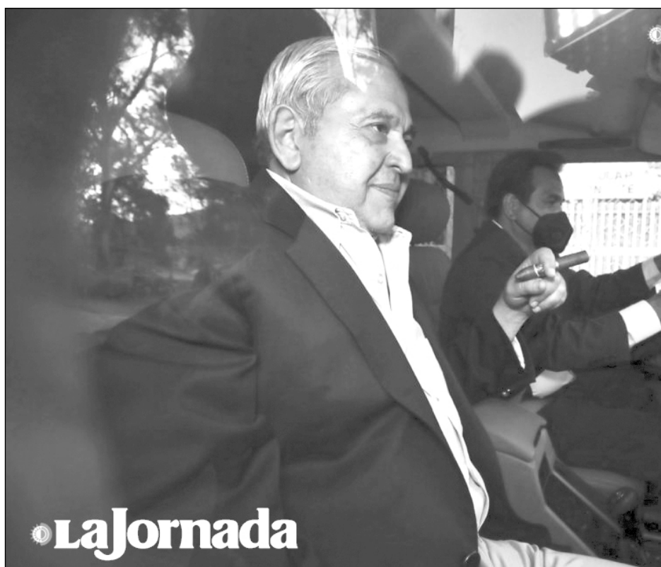
▲ El socio mayoritario de Altos Hornos de México sorteó la acción de la justicia, mediante un acuerdo en México, después de haber sido extraditado de España.

La esposa de El Chapo , que es ciudadana estadounidense y mexicana, está acusada de participar en una asociación ilícita para traficar cocaína, metanfetaminas, heroína y marihuana.