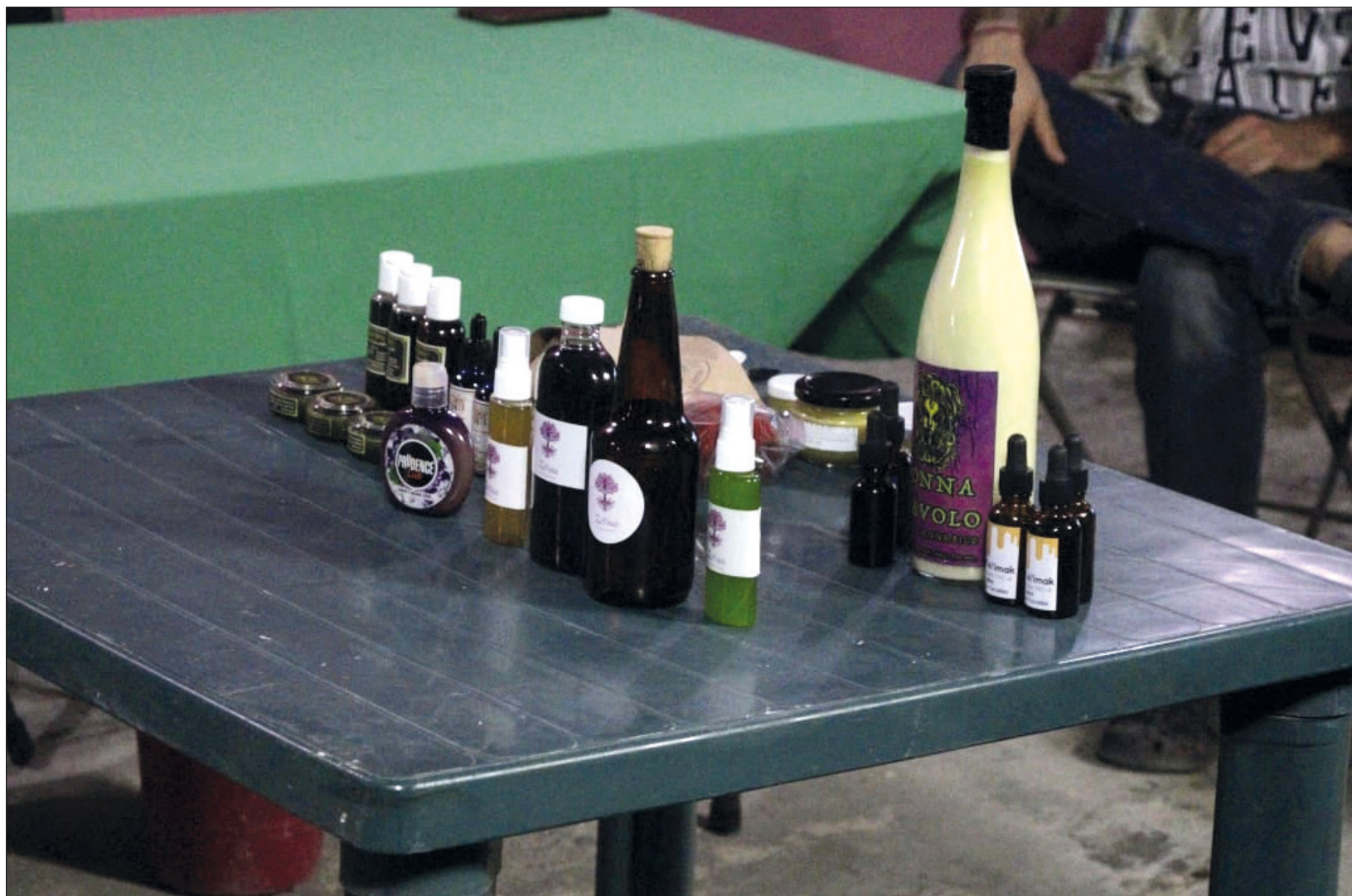
▲ En el Primer Encuentro Cannábico se presentaron diversos emprendimientos relacionados a esa planta.

Esperan poder replicar estos foros con mayor gente y con la ciudadanía en general para perderle el miedo a esta planta natural y sus beneficios, crear una cadena productiva y que la industria no fracase en la entidad.