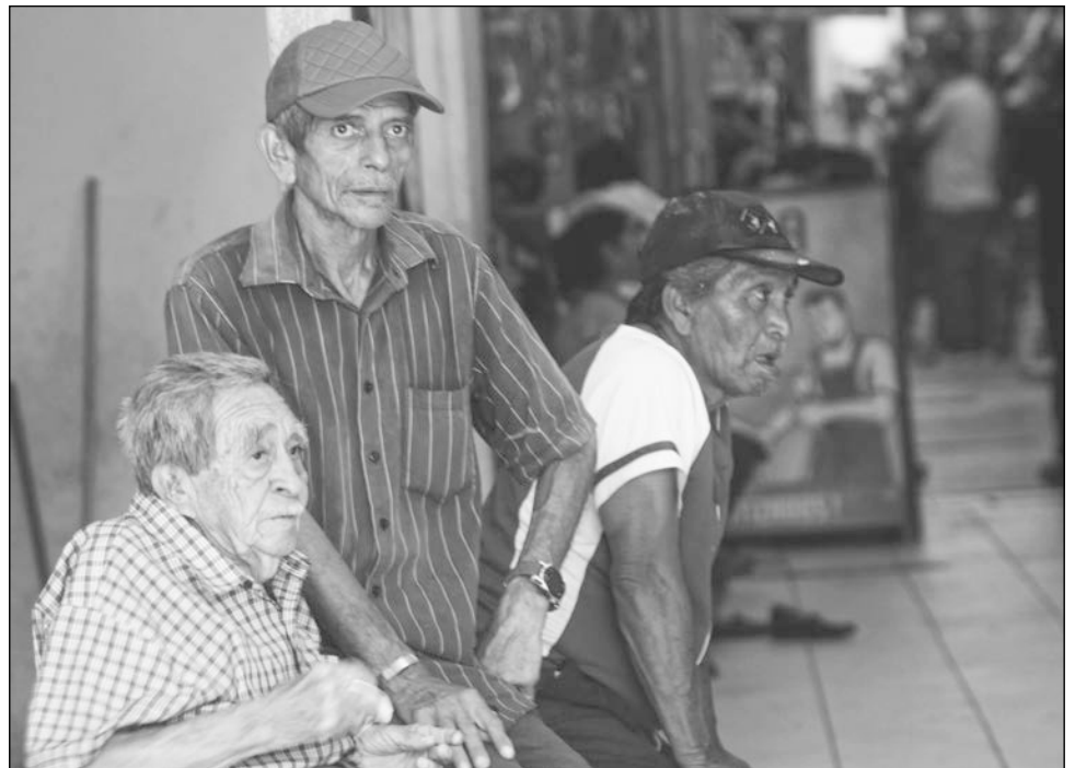
▲ A pesar de la baja en la asistencia, la campaña se considera exitosa.

Reconoció que con el respaldo del ayuntamiento de Carmen se continuó apoyando a la población