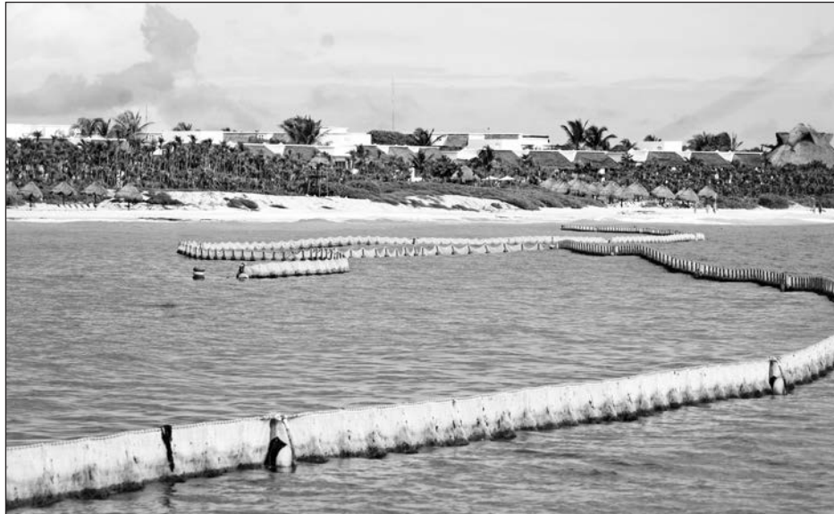
▲ Las barreras no están cumpliendo su propósito, afirmaron turistas.