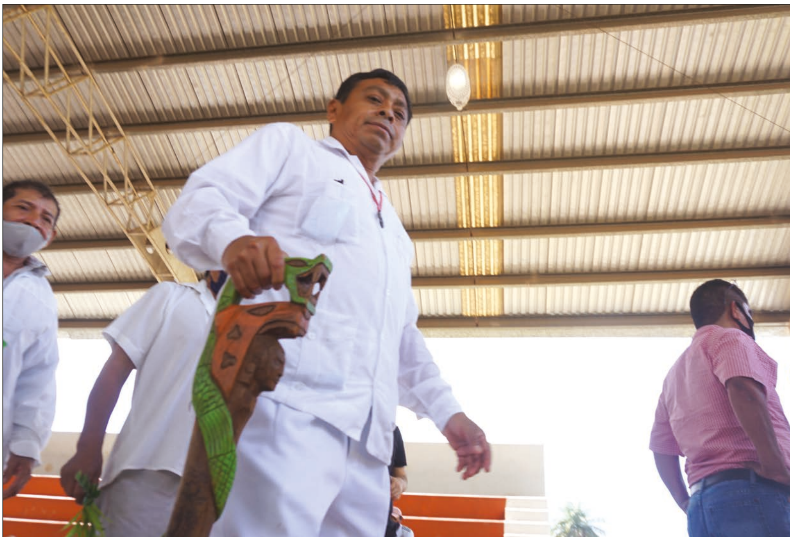
▲ Es necesario contar con educación que permita construir una sociedad nueva, diferente, incluyente, en paz y en progreso económico y humano.