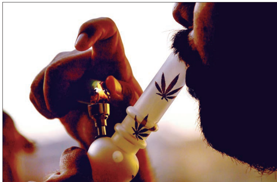
▲ La legislación mexicana impide consumir mariguana en cualquier espacio.

Está prohibido el consumo en establecimientos comerciales con acceso