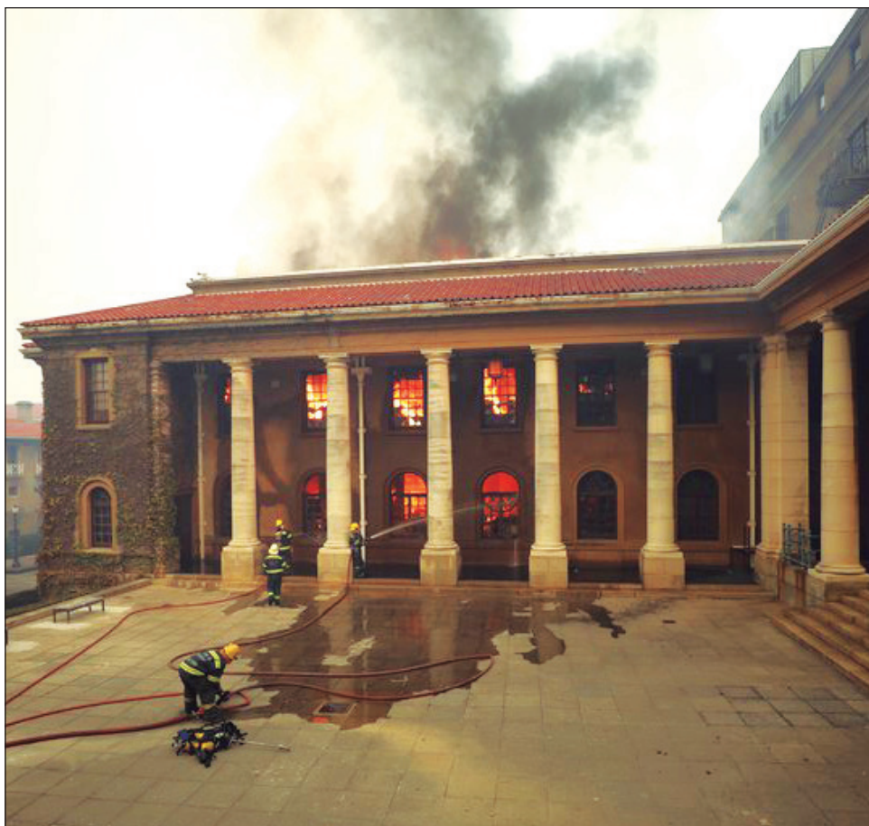
▲ Los estudiantes lograron ser desalojados del área del siniestro.

Más de 100 bomberos y personal de emergencia fueron enviados al campus universitario y al Parque Nacional Table Mountain, mientras se utilizan cuatro helicópteros para arrojar agua en las áreas circundantes, informó el portavoz del centro de gestión de riesgo de desastres de la ciudad, en un comunicado.