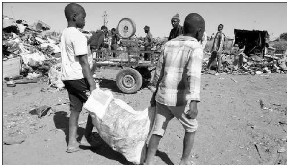
▲ La OIT define el trabajo forzoso como un trabajo impuesto contra la voluntad del empleado y exigido bajo castigo o amenaza; puede ocurrir durante la contratación, en las condiciones de vida asociadas al empleo o al obligar a alguien a quedarse cuando quiere marcharse.

Los datos de 2021, el año más reciente cubierto en el detallado estudio internacional, suponían un incremento de 37 por ciento, o 64 mil millones de dólares, en comparación con la estimación previa de una década antes, según la Organización Internacional del Trabajo. Eso se debe tanto a que hay más personas explotadas como a que cada víctima genera más dinero, según la OIT.