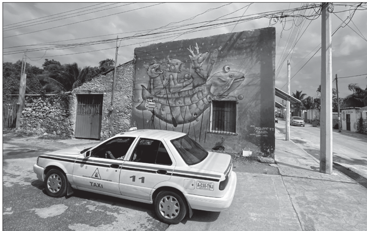
▲ Lo que ha sido siempre un ecosistema vulnerable, ha visto cada vez más comprometida su resiliencia y se ha sometido a impactos cada vez más intensos, por la confluencia de diversas actividades humanas.

Frecuentemente, a pesar de una oposición feroz, obcecada e impermeable a la razón, hay personas y organizaciones que insisten tozudamente en emprender acciones que permitan construir