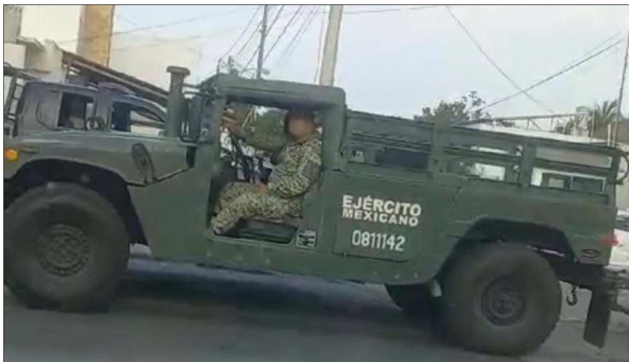
▲ La mañana de este martes fue encontrada una granada al interior de una caseta de vigilancia de un fraccionamiento de la colonia Chuburná, en Mérida, sin embargo, no representó ningún riesgo para la ciudad-