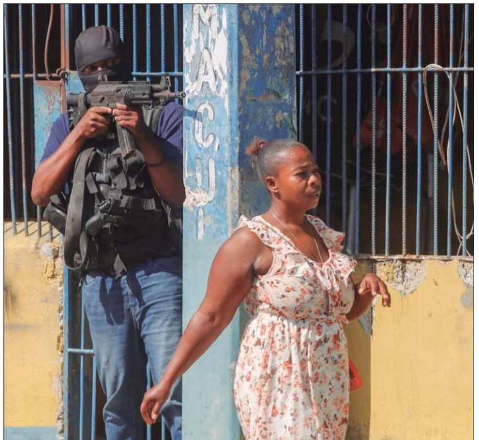
▲ Grupos armados iniciaron los ataques a la capital Puerto Príncipe mientras el primer ministro se encontraba en un viaje oficial en Kenia para pedir apoyo.

Henry, quien no ha podido regresar a Haití desde un viaje oficial al extranjero debido a que la constante violencia de pandillas mantiene cerrado el principal aeropuerto internacional del país, ha prometido renunciar una vez que se cree el consejo de transición. Él se encontraba en un viaje oficial en Kenia para presionar por el despliegue de una fuerza policiaca y respaldada por la ONU iniciaron los ataques.