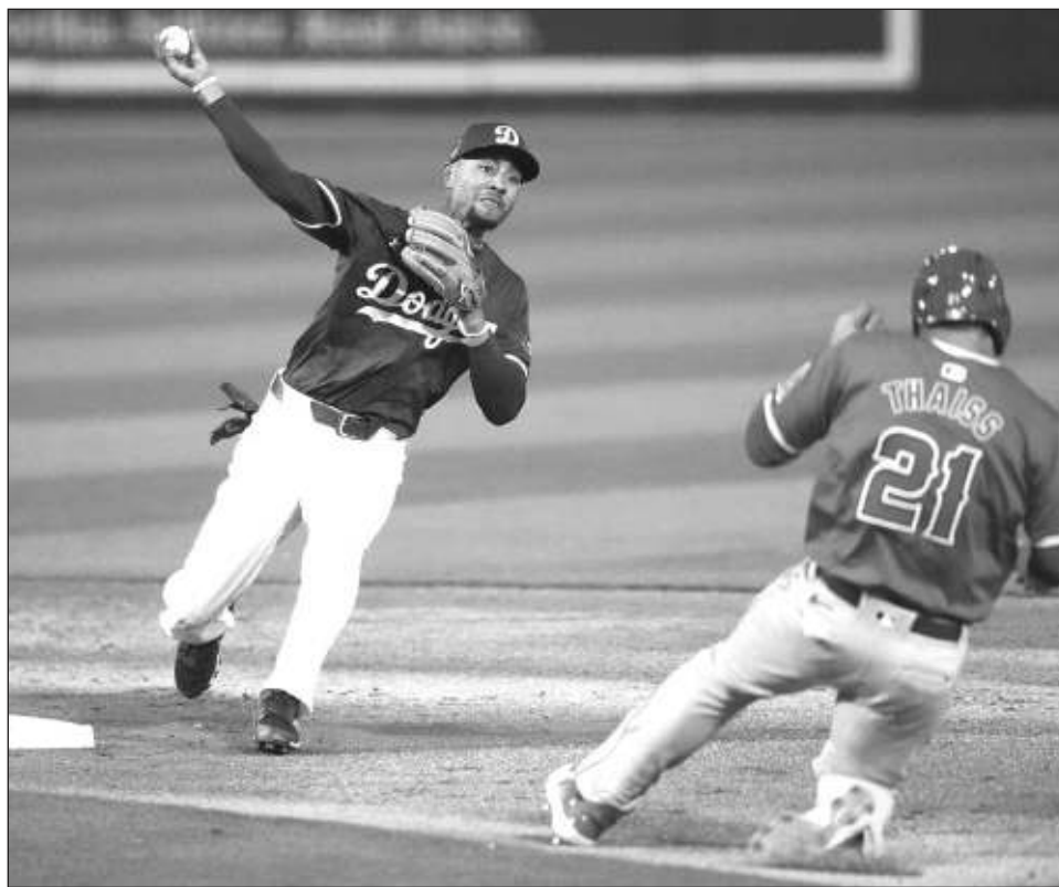
▲ El dodger Mookie Betts es uno de los principales candidatos a ser el "MVP" de la Liga Nacional.

2. Arizona. Los Cascabels avanzaron raspando a los playoffs la pasada temporada, pero se prendieron en la postemporada, metiéndose a la segunda Serie Mundial de su historia antes