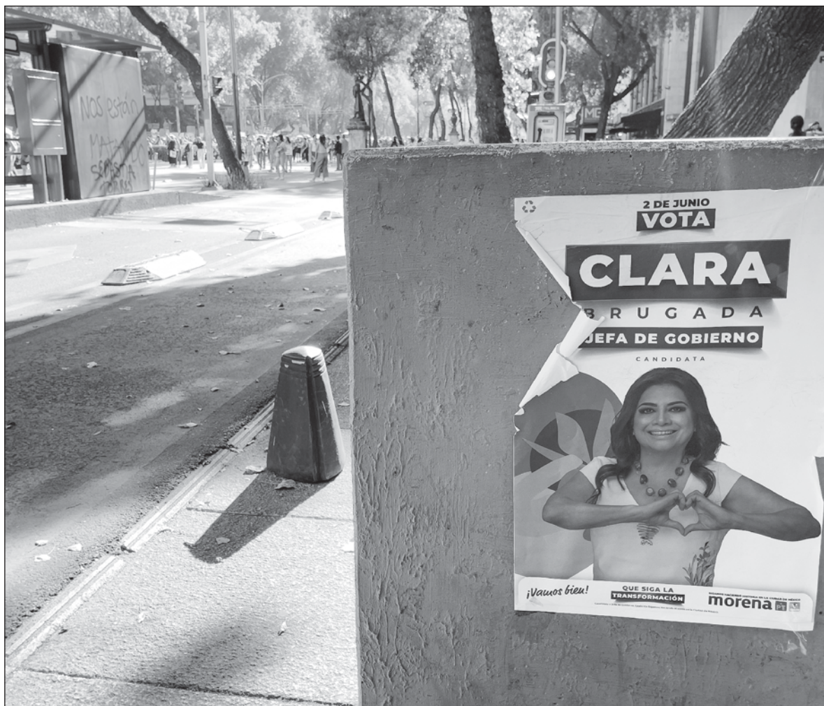
▲ "No hay unidad sólida, sino apariencias no siempre bien montadas y una serie de pleitos, intrigas y jaloneos entre grupos y entre integrantes de los círculos cercanos a Brugada que pueden propiciar derrotas al guinda y sus acompañantes como en 2021".

EXPLICÓ QUE SE propuso al empresario un acuerdo para que "legalmente, sin violar ningún procedimiento, sin violar ninguna ley y además bajo la consideración del Poder Judicial, o sea... Si Azteca o