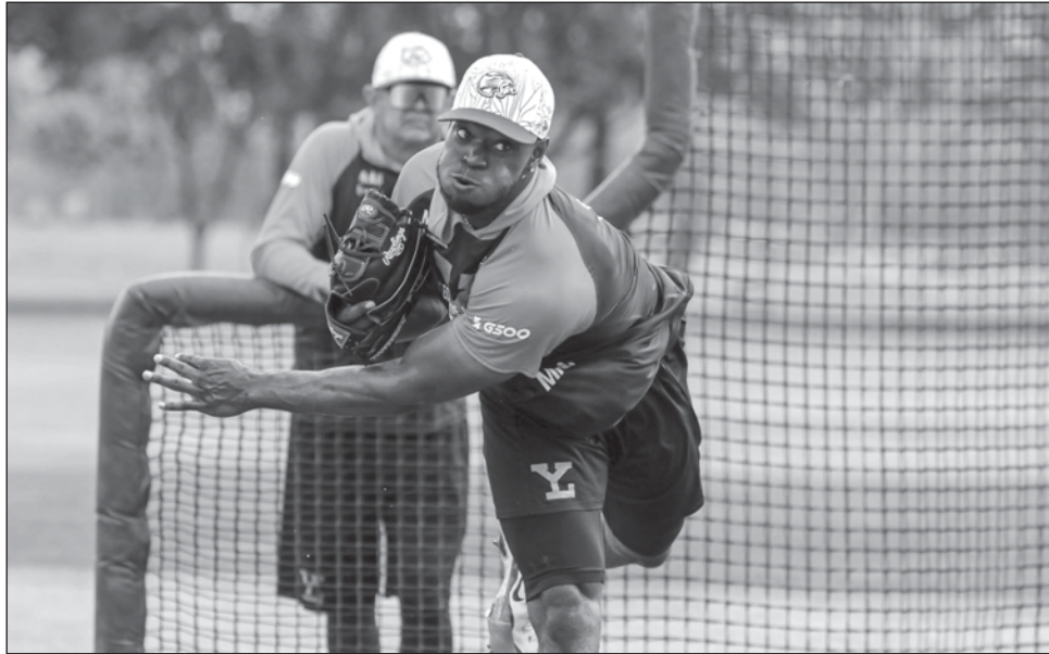
▲ CD Pelham impresionó durante un "live bp" el martes en la Universidad Modelo.

El ex "big leaguer" Héctor Velázquez, quien desde el arranque del minicampamento estaba prácticamente listo luego de lidiar con problemas físicos el año pasado, abrirá por los rugidores. La Modelo enviará a la loma a un refuerzo, el zurdo