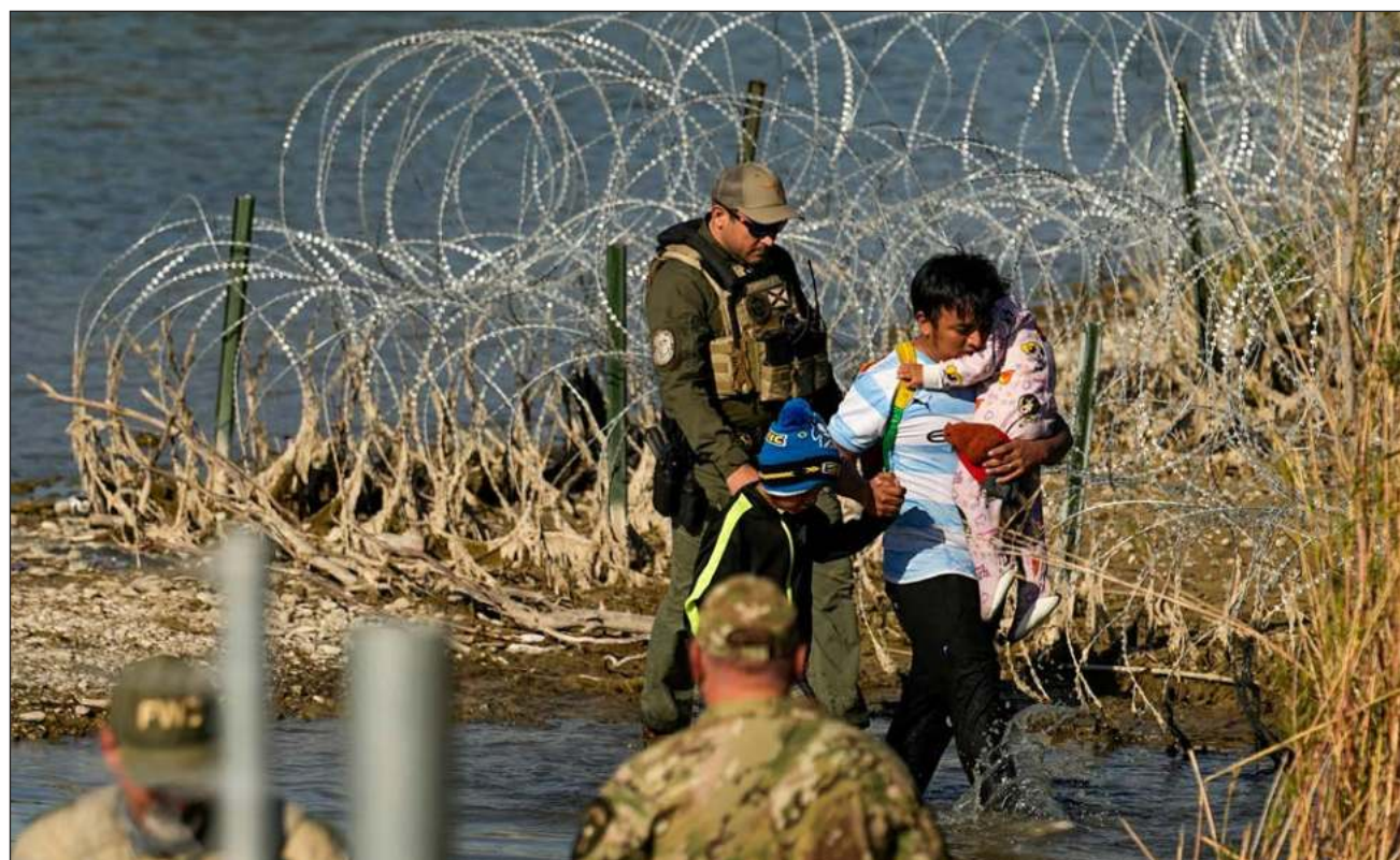
▲ El ex canciller mexicano, Marcelo Ebrard Casaubón, puntualizó que la decisión tomada por la Suprema Corte estadounidense "es el mayor retroceso en materia de derechos humanos en los Estados Unidos en lo que va del siglo".

El ex canciller de México, Marcelo Ebrard, criticó esta tarde la decisión de la Suprema Corte