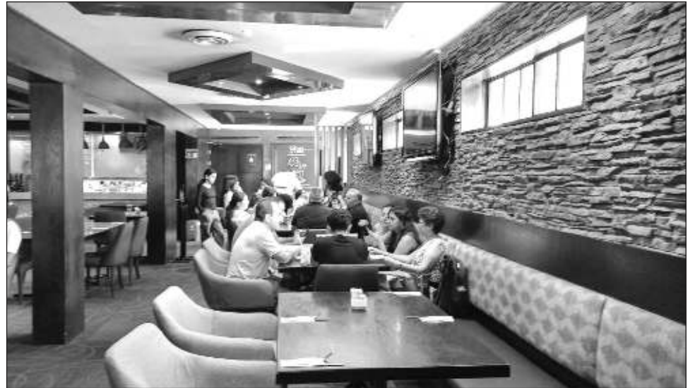
▲ Quintana Roo creció 8.34 por ciento aproximadamente, uno de los pocos estados en todo México que mantiene crecimientos importantes, independientemente de la fuerte obra pública.

“Esperemos que sean muy productivas para todo el sector, no solamente restaurantero, sino para todo el sector turístico de Quintana Roo y que tengamos grandes derramas económicas, muchos visitantes, que