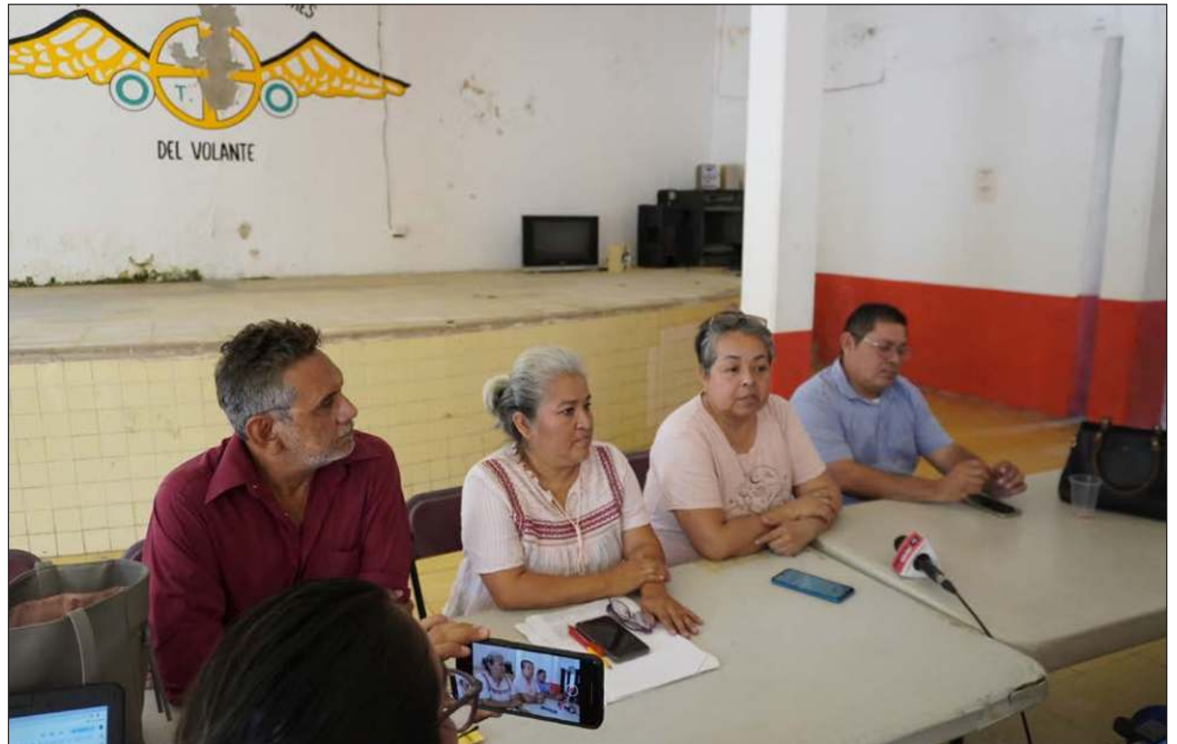
▲ Los miembros del frente destacaron que desde el cambio de administración, en el IET les exigieron cambiar la tonalidad del rojo en los taxis, pasando algunas de rojo vivo a tono vino, como los colores institucionales de Morena.

Aseguraron que en algunos trámites que ellos hacen les piden respaldar al partido en el poder, y que desde ahora han comenzado a presionar con el tema de la publicidad de los candidatos, pidiéndoles rechazar a los aspirantes de partidos contrarios a Mo-