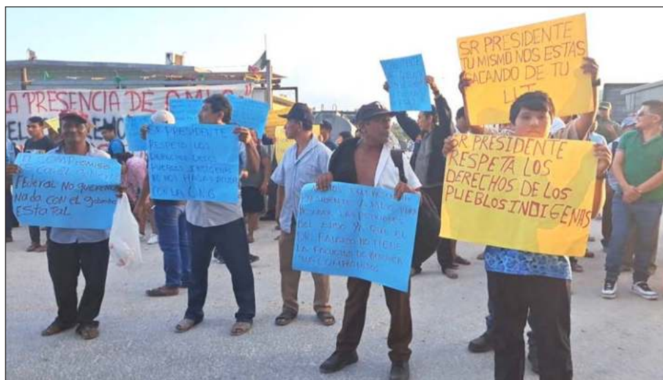
▲ Más de 600 ejidatarios inconformes inhabilitaron este martes el acceso al banco de materiales y las obras del proyecto ferroviario que se ubica camino a la comunidad de Chumpón, en el municipio Felipe Carrillo Puerto. Foto captura de pantalla

Tras ello, se acordó paralizar protestas hasta el 2 de marzo, siendo este el plazo dado por la autoridad para