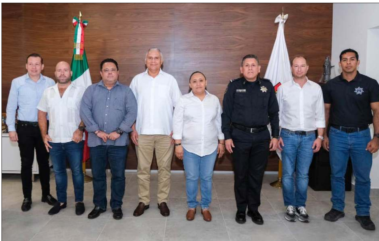
▲ Organizaciones como la Coparmex exigieron medidas para recuperar la seguridad local.

Morena, el Verde Ecológico, Partido del Trabajo, el de la Revolución Democrática, Más Apoyo Social y el Revolucionario Institucional no dieron a conocer a sus aspirantes a una diputación plurinomial al cierre de edición.