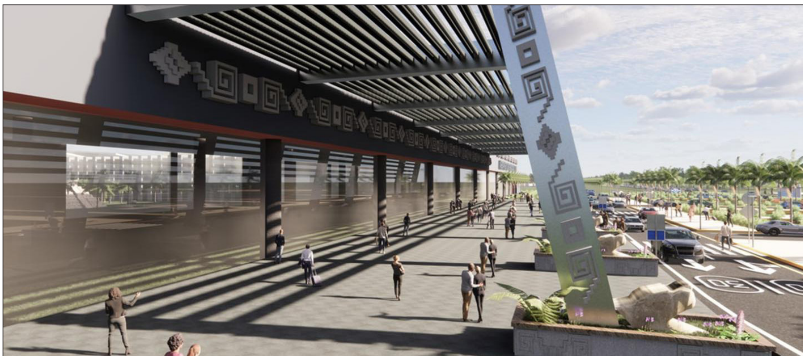
▲ La construcción, a cargo de la Sedena, iniciará una vez que termine la edificación de la terminal aérea de Santa Lucía, en la capital del país.