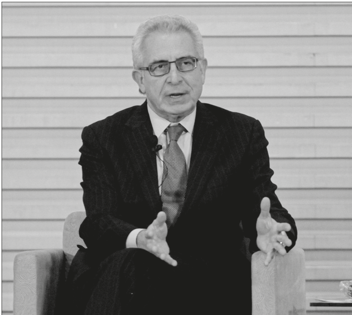
▲ Ernesto Zedillo ha ganado, en 10 años, el equivalente a seis veces lo que devengó como presidente.