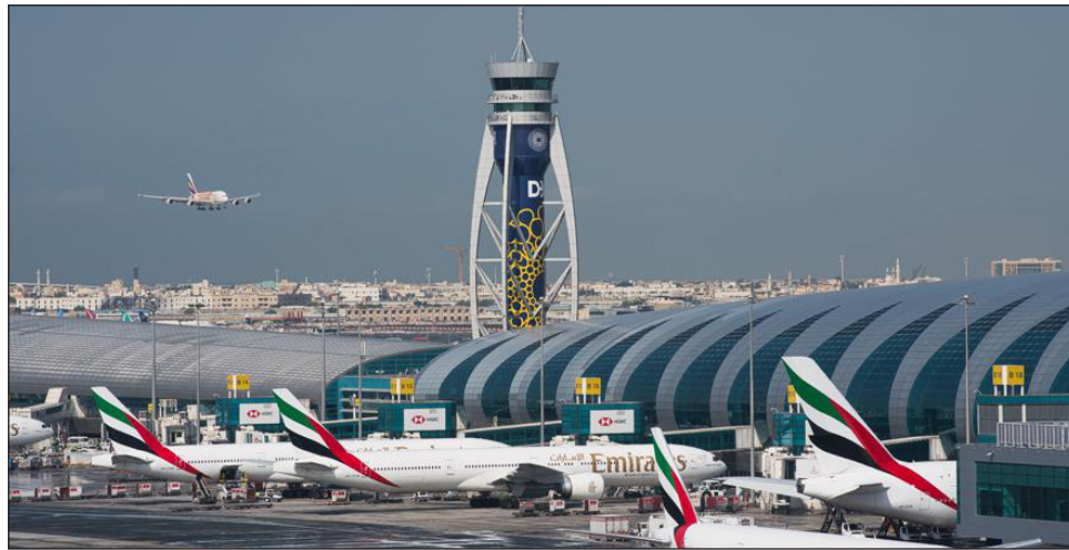
▲ A las aerolíneas y los fabricantes de aviones les preocupa que las nuevas señales 5G puedan interferir en los radioaltímetros de los aviones. Foto crédito

Emirates, Air India, Lufthansa, British Airways o Japan Airlines, entre otras, anunciaron cancelaciones o cambios de vuelos con destino a Estados Unidos por este motivo.