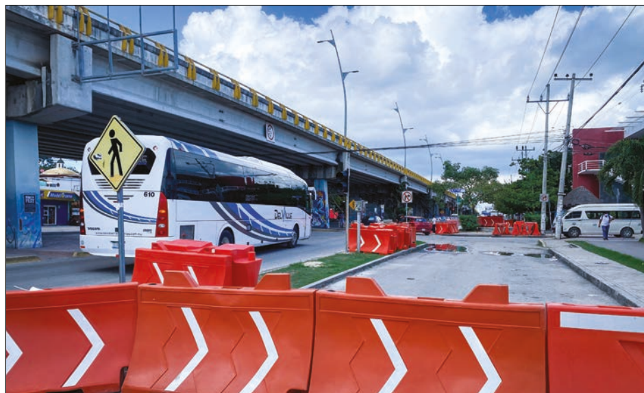
▲ El nuevo trazo será en el lado oeste de los hoteles ubicados en el tramo 5 del mega proyecto, no del lado de la playa.

Por su parte, el titular de Sedatu agregó que las obras que hasta el momento se habían hecho en este tramo