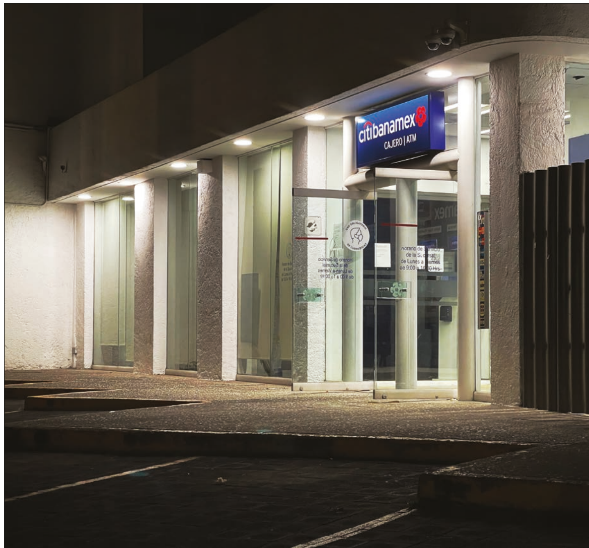
▲ En 2001, durante el gobierno del panista Vicente Fox, vendieron al Citigroup por 12 mil 500 millones de dólares, incluido el patrimonio cultural consistente en edificios históricos.

SALINAS DE GORTARI y Zedillo Ponce de León, ambos ex presidentes surgidos del PRI, con la complicidad del PAN, consumaron la conversión de deudas privadas de magnates en deuda pública puesta sobre las espaldas del empobrecido pueblo de México. Salinas privatizó todo lo que pudo vendiendo a sus amigos y socios empresas y bienes nacionales a precios de ganga, sin que el monto obtenido de las privatizaciones beneficiara a los mexicanos, e incluso, cuando