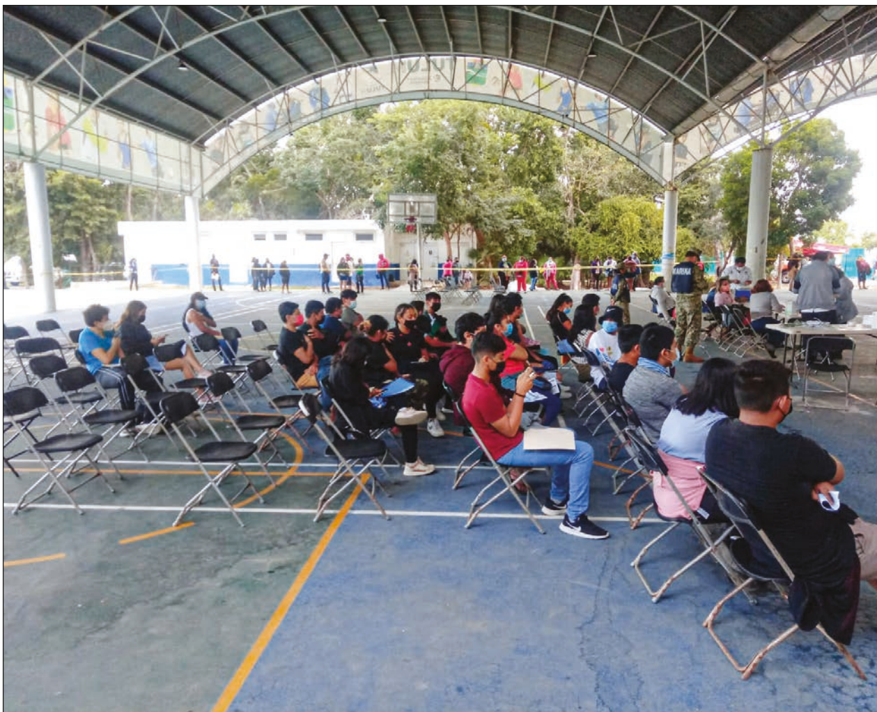
▲ No se aplicaron las más de 2 mil 100 dosis asignadas para los tres días de inoculación.

El Sistema de Información Georreferenciada (SIG) rural se conforma de datos estadísticos del estado, municipios y localidades, manzanas e incluso vialidad; así como de cartas topográficas de caminos, carreteras y cuerpos de agua.