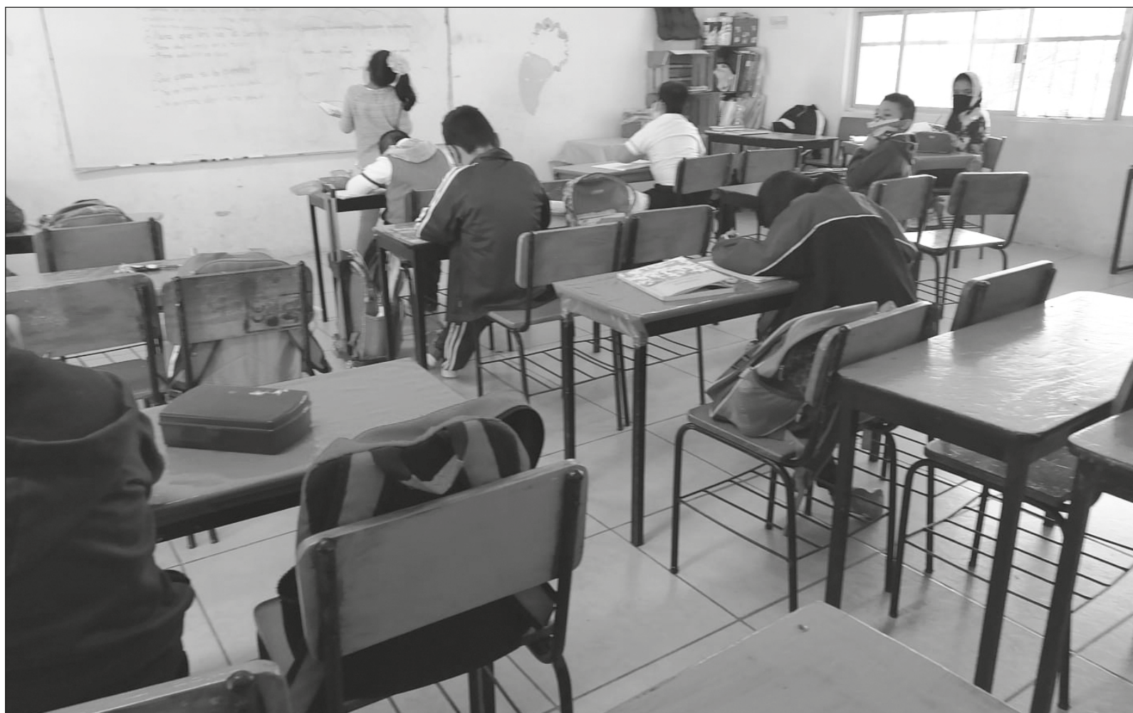
▲ Si no hay programas que incluyan contenidos educativos tendientes a la transformación, mucho menos existe un magisterio preparado para orientar a las nuevas generaciones hacia donde pretende llegar este gobierno.