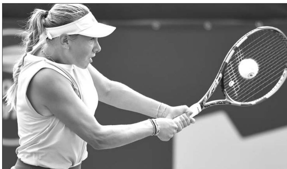
▲ Amanda Anisimova, quien conquistó el Mundial Juvenil Yucatán hace seis años, se instaló en la tercera ronda del Abierto de Australia, luego de vencer a Belinda Bencic, la jugadora 22 en la siembra.

Osaka ganó el Abierto de Australia el año pasado, su cuarto cetro del "Grand Slam", pero después se retiró de Roland Garros y no asistió a Wimbledon para tomarse un descanso por salud mental. Después fue eliminada al principio del Abierto de Estados Unidos.