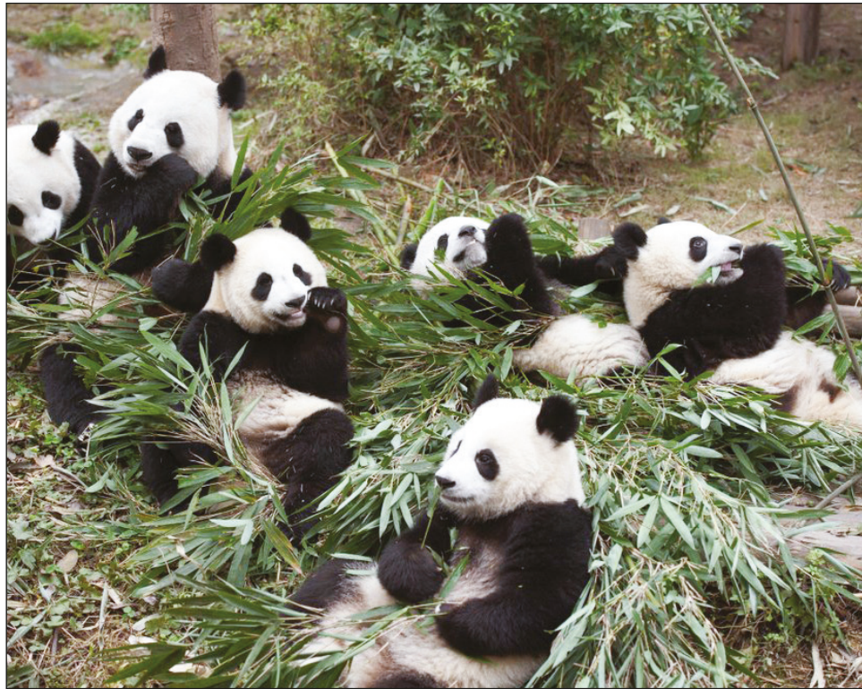
▲ Los cambios en la microbiota intestinal del panda en la temporada en la que los brotes de bambú están disponibles ayudan a este plantígrado herbívoro a ganar más peso y almacenar más grasa para cuando sólo hay hojas de esa planta para masticar.

“Es la primera vez que establecemos una relación causal entre la microbiota intestinal de un panda y su fenotipo. Hace tiempo que sabemos que estos pandas