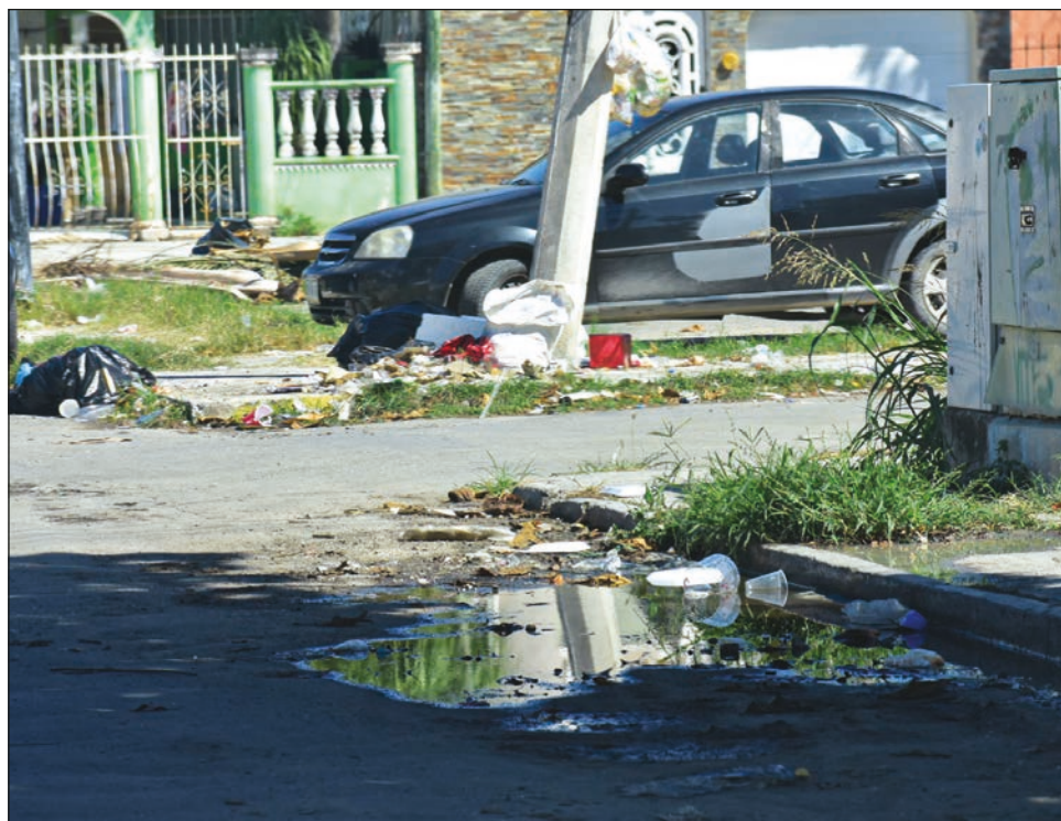
▲ El vertimiento de aguas jabonosas, residuales o negras tiene consecuencias para el medio ambiente, no sólo impacta genera bache, también contaminan mantos acuíferos.