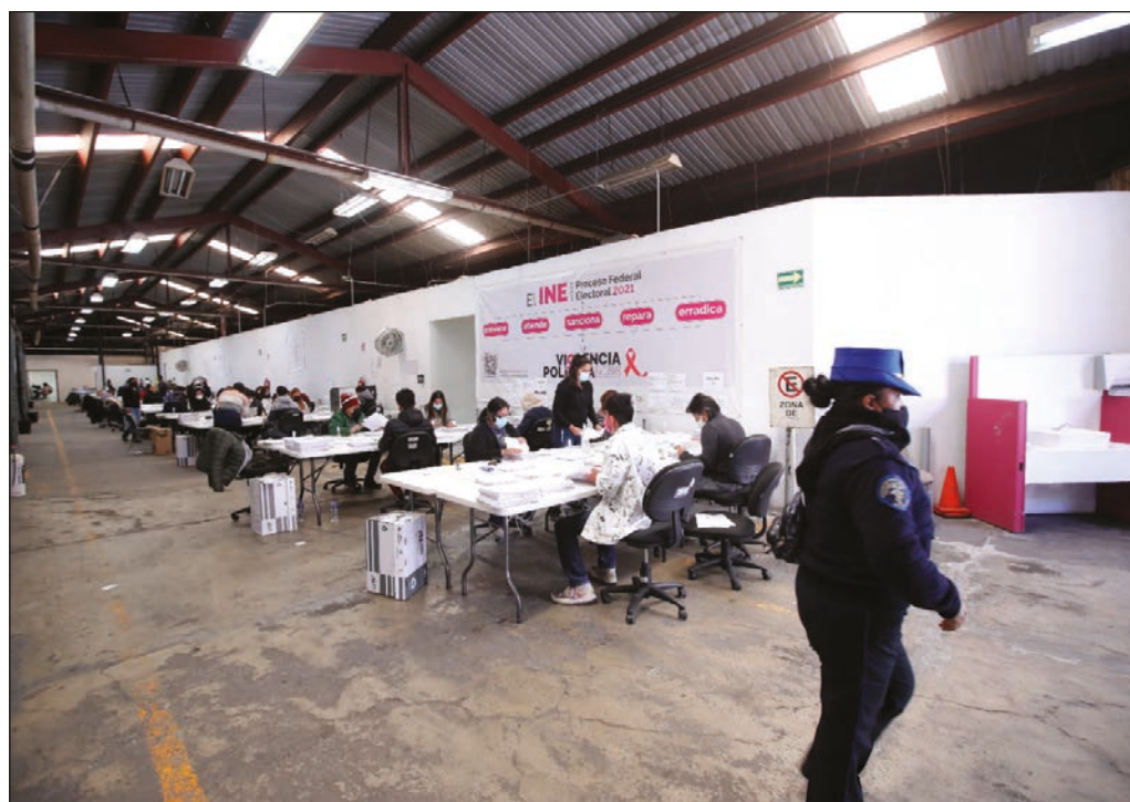
▲ El INE recibió 11 millones 97 mil firmas de apoyo a la realización de la consulta de revocación de mandato y aún tiene por revisar y validar la mayor parte de ellas.

Por el bien de la democracia, es deseable que este experimento plebiscitario se desenvuelva con éxito, y que se extienda a todos los ámbitos de la administración pública, desde los gobiernos estatales y municipales, hasta el Poder Legislativo y los cargos directivos de los órganos autónomos como el propio INE.