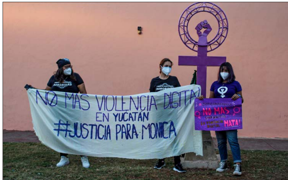
▲ Mujeres acudieron a la Antimonumenta Feminista en el Remate para exigir que los agresores de Mónica sean castigados.

El juicio tendrá lugar el lunes 24 de enero a las 8:00 horas y las mujeres exigen