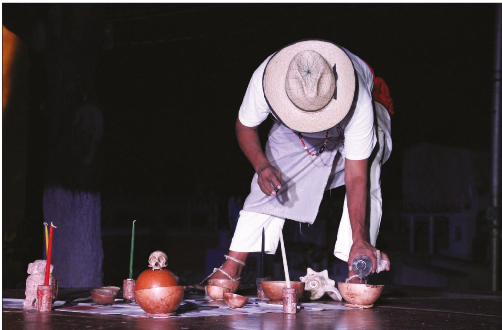
▲ El cuch-kebán consiste en lavarle la cara al muerto y depositar el agua usada en jícaras para dársela a beber a los concurrentes.