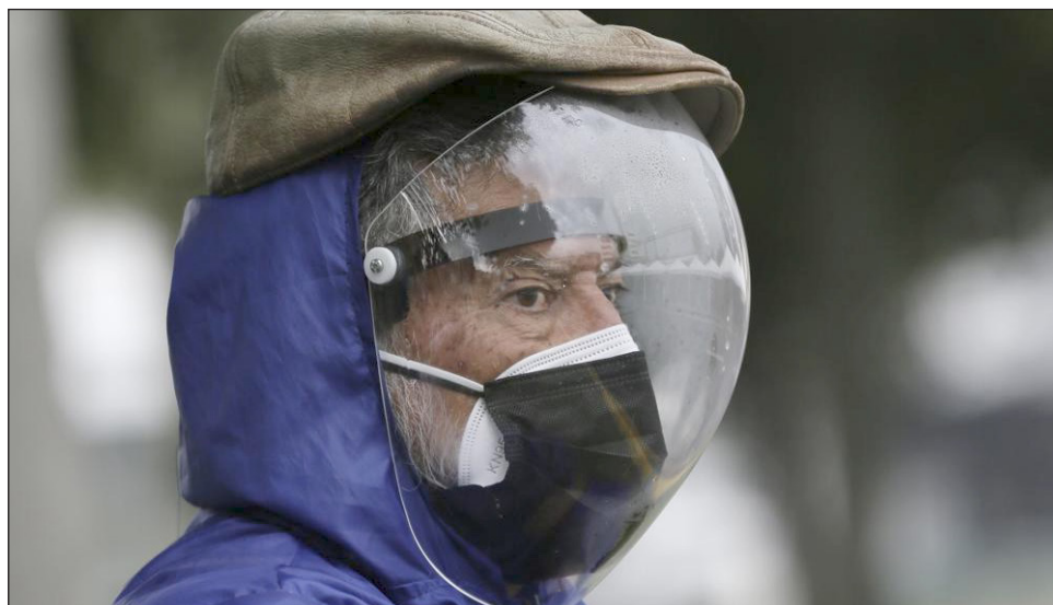
▲ Algunas regiones parecen haber pasado lo peor de la última ola de ómicron, admitió el responsable de la OMS, aunque “no todos los países están fuera de peligro todavía”.

El número de casos nuevos de coronavirus subió 20 por ciento la semana pasada, a