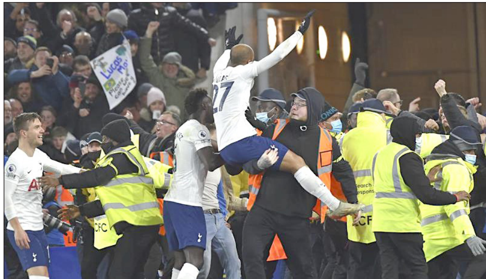
▲ El festejo enloquecido de jugadores del Tottenham con sus aficionados.

Como una recompensa adicional para el Tottenham, la victoria lo colocó por encima de su acérrimo rival Arsenal, en el quinto peldaño de la Premier, y sólo a un punto de los sitios que otorgan pasajes para la Liga de Campeones.