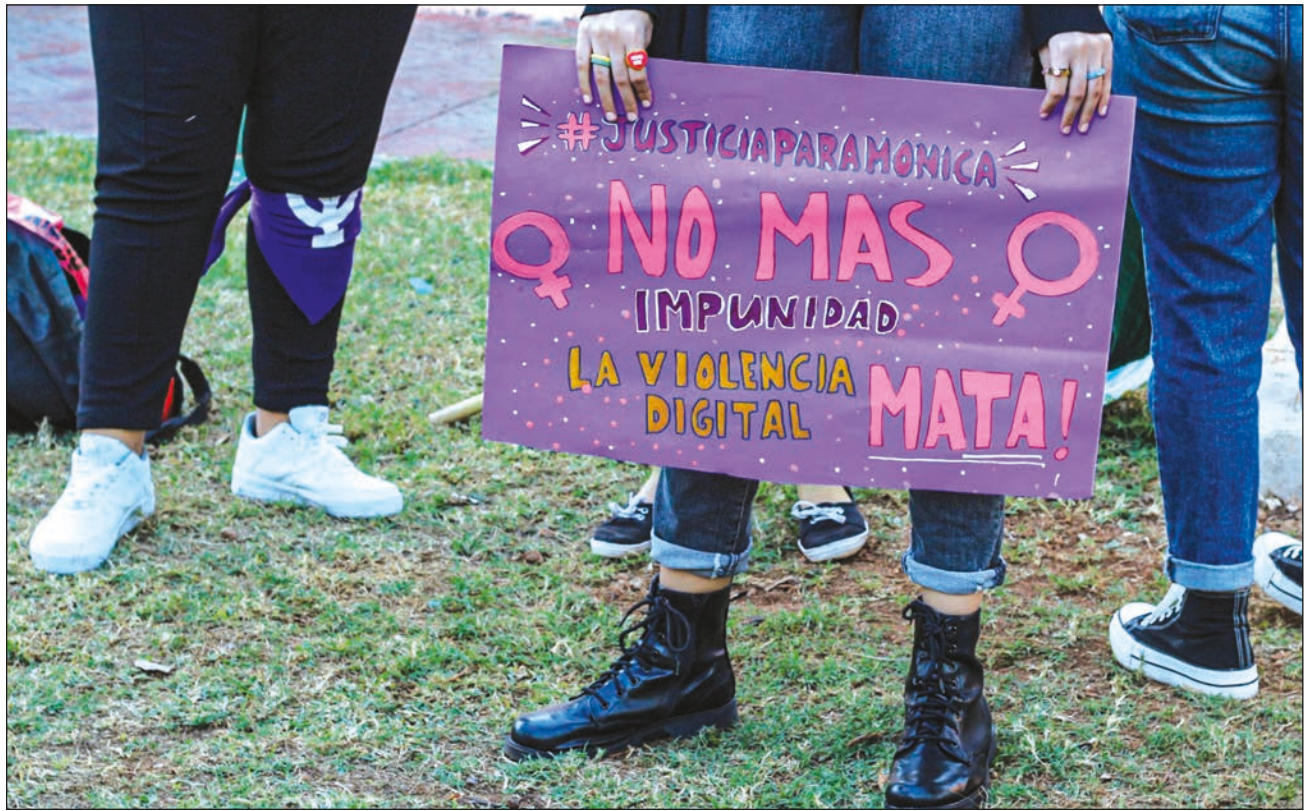
▲ Tu k'iinil jo'oljeake', ya'abach ko'olelo'ob tu much'ajubáajo'ob ti' chíikulal ts'a'aban tu noj kaajil Jo', ti'al u k'áatiko'ob ka ch'éenek u loobilta'al ko'olel ti' kúuchilo'ob je'el bix Internet.

Ba'ale' loobilaj ku beeta'al ti'e', k'ucha'an tak ti' u láak'tsiló'obi, "ma' tán u ts'o'okol ba'ax ku beeta'al ti,