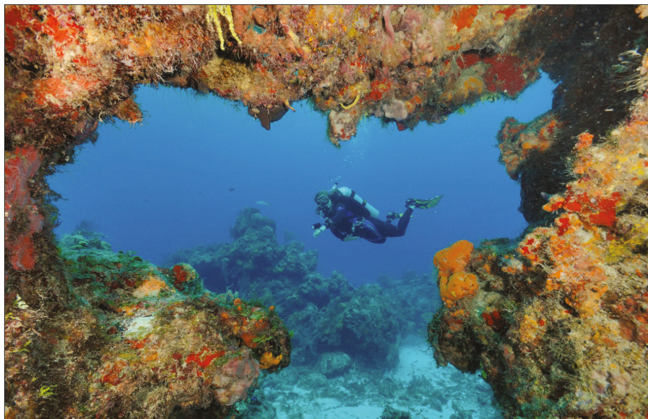
▲ Entre los principales destinos de la isla se encuentra el Parque Nacional Arrecifes.

Asimismo, la conectividad aérea de la isla con vuelos directos desde varios destinos de Estados Unidos y Canadá permiten el arribo de miles de turistas cada año, y es uno de los puer-