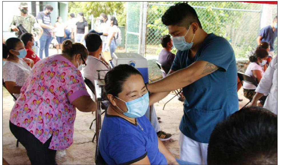
▲ Las personas mayores de 60 años que no hayan recibido vacuna alguna o requieran la segunda dosis, pueden acudir a los módulos permanentes en Mérida y el interior del estado.

Para el caso de Mérida, las unidades se ubican en el Centro de Salud Urbano de la colonia Santa Rosa de