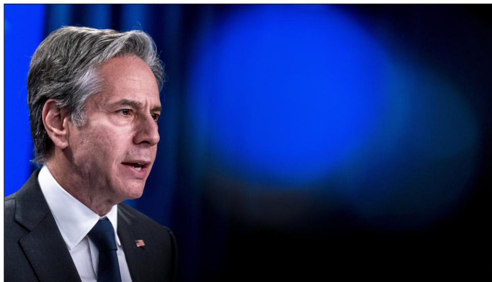
▲ El secretario de Estado advirtió que si el presidente Vladimir Putin no sigue la vía de la diplomacia, estaría adoptando un camino “de confrontación con consecuencias para Rusia”.

El secretario de Estado advirtió que si Putin no si-