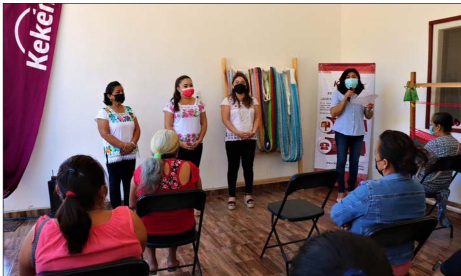
▲ Además del taller de urdido, Kekén promueve en diversas comunidades capacitaciones gratuitas relacionadas con la producción de miel de abeja melipona.

Con la puesta en marcha de este esquema, la empresa con más de 7 mil colaboradores en la entidad alcanzó la activación de 30 grupos beneficiados en temas de desarrollo productivo local