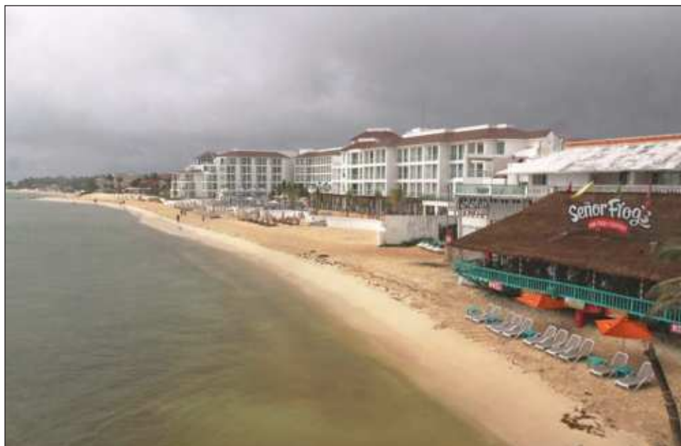
▲ La masa de aire frío mantendrá el cielo parcialmente nublado y viento del noroeste y norte de 30 a 40 km/h, principalmente en la zona norte y zonas costeras.