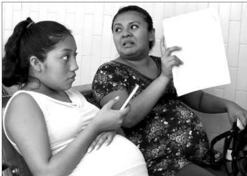
▲ Las autoridades campechanas han ejecutado 99 metas de trabajo para la erradicación del embarazo infantil y la disminución del embarazo en adolescentes.

En la sesión ordinaria y ante 33 enlaces institucionales del ámbito estatal y federal, el Instituto de la Mujer del Estado de Campeche quien funge como secretaria técnica del GEPEA, presentó las Acciones del Fondo para el Bienestar y el Avance de las Mujeres (FOBAM) 2023, en el que se destaca la ejecu-