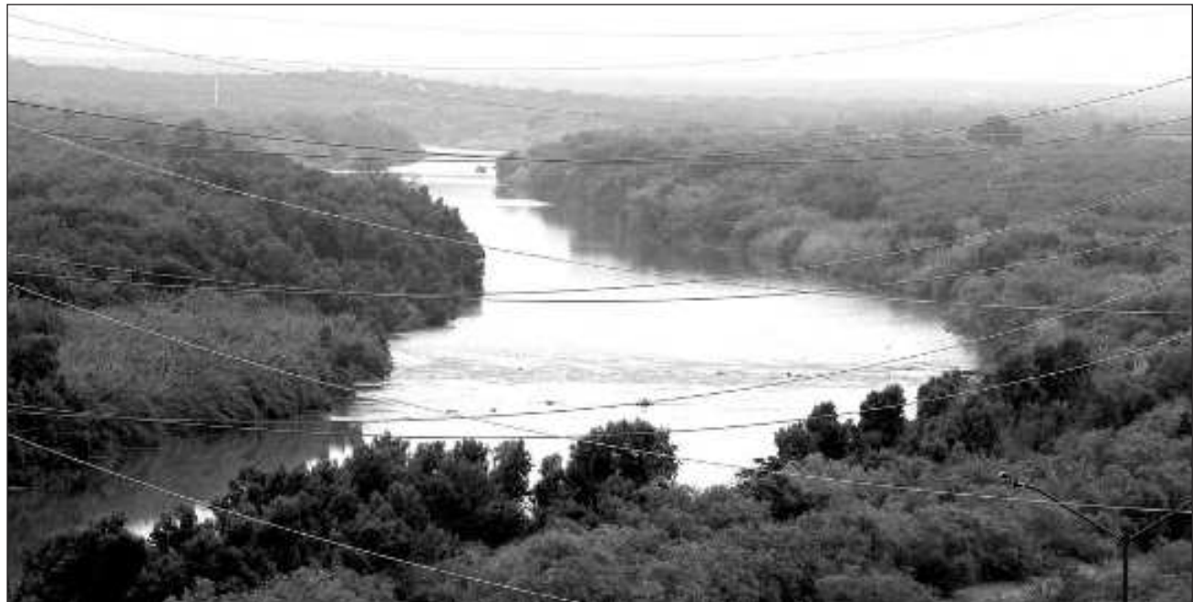
▲ Legisladores tamaulipecos y del Senado señalan que esta medida viola el Tratado Internacional de Aguas de 1944 suscrito por ambos países, que establece la entrega de una tercera parte del líquido del río Bravo, y lo que ahora se plantea es el envío de dos terceras partes.

Con el tratado, México asigna al país vecino, del lado del río Bravo, 431.6 millones de metros cúbicos anuales, una tercera parte del líquido. Las entregas de este cauce se hacen en ciclos de cinco años, por lo que de los mil 294.8 millones de metros cúbicos que se ten-