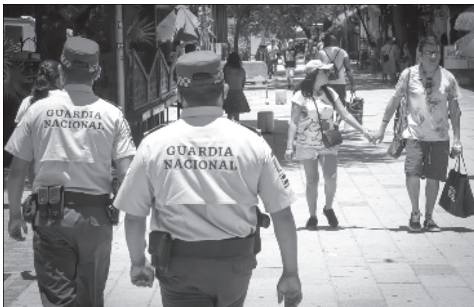
▲ López Obrador planteó que gobernadores de oposición están a favor de que la GN dependa de la Sedena, pero quienes se oponen son los legisladores.

El jefe del Ejecutivo planteó que incluso los gobernadores de oposición: PRI y PAN están a favor de que la Guardia Nacional dependa de la Secretaría de la Defensa, pero quienes se opo-