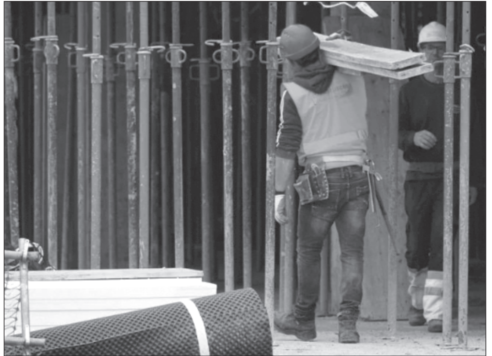
▲ Durante el periodo enero-noviembre de 2023, el estado de Yucatán registró 649 nuevos patrones ante el IMSS, cifra superior a la media nacional de 385.

También, con el fin de continuar haciendo crecer los emprendimientos, micro y pequeñas empresas para que sigan generando economía y empleos el gobernador distribuyó recientemente un total de mil 146 apoyos de programa MicroYuc productivo y 221 de MicroYuc Social, respaldo que representa una inversión total de 7.8 millones de pesos.