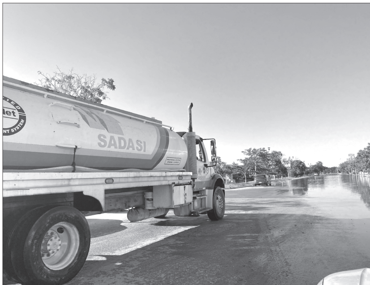
▲ Una solución a las inundaciones en Las Américas y otras partes de Yucatán sería construir un canal que drene el agua hacia la costa, para lo que el factor económico será determinante.

Afirmó que esas obras sólo se hacen en donde hay