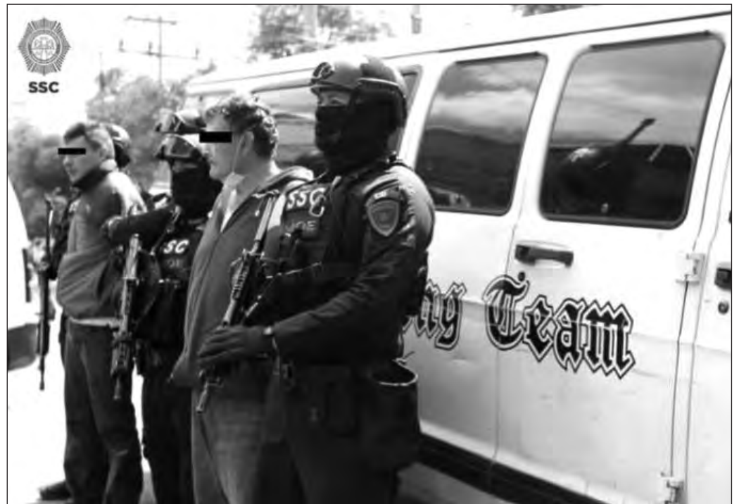
▲ La mañana de este sábado fueron detenidos dos sujetos que, de acuerdo con cámaras de vigilancia, participaron en la descarga de las bolsas con los medicamentos robados.

El día 7 de este mes, la empresa Novag Infancia notificó a la Comisión Federal para la Protección contra Riesgos Sanitarios (Cofepris) que le fueron robados 37 mil 967 medicamentos utilizados para el tratamiento del cáncer en niños. La madrugada del viernes 16, un ciudadano denunció que varios sujetos a bordo de una camioneta color blanco dejaron bolsas de basura sobre la banqueta en calles de la colonia Trabajadores, en la alcaldía Azcapotzalco. Al inspeccionar las 27 bolsas abandonadas, elementos de la Secretaría de Seguridad Ciudadana (SSC) de la Ciudad de México y paramédicos del Escuadrón de Rescate y Urgencias Médicas (ERUM) descubrieron que contenían cajas de Fluorouracilo y Ciclofosfamida, dos de los fármacos sustraídos a Novag. Por la tarde, se confirmó que en las bolsas había 8 mil 144 cajas con cinco tipos de fármacos, y que sus números de lote coincidían con los reportados por robo nueve días antes.