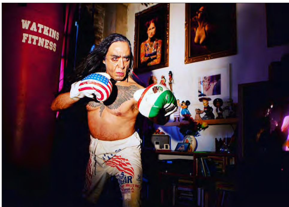
▲ Ser performancero ya es censurado, pero a veces lo hacen por el contenido sexual explícito de la obra, por contenidos políticos o por las imágenes religiosas muy irreverentes de La Pocha, explica Guillermo Gómez-Peña.

Con el proyecto Posnacional 3, La Pocha Nostra contribuye al desarrollo del género por medio de laboratorios de creación viviente con el propósito de comparar las distintas propuestas estéticas e intereses políticos. "Ha sido como una bitácora de las relaciones entre México y Estados Unidos mediante el performance, el video y la fotografía", explica Gómez-Peña.