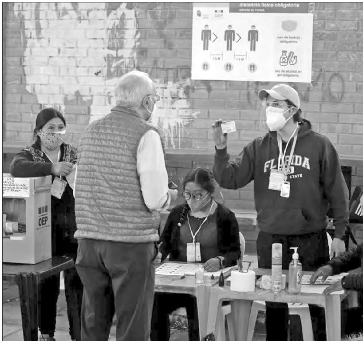
▲ Florezca el camino de retorno a la libertad y soberanía andina y el reinicio más profundo y radical de un nuevo capítulo en la verdadera construcción del socialismo para el bien de Bolivia.

Lo anterior no significa la celebración adelantada ni un pretende ser un triunfalismo ingenuo, nunca el gobierno golpista pretendió la celebración de elecciones realmente democráticas y limpias, su intención fue postergar las votaciones (como hizo dos veces) y perpetuar el régimen dictatorial implantando, por ello la implementación del fraude no se descarta. Se sabe de la represión abierta y selectiva, el bloqueo político al MAS, la guerra mediática, la injerencia imperialista y el silencio cómplice de la Organización de los Estados Americanos (OEA) que una vez más