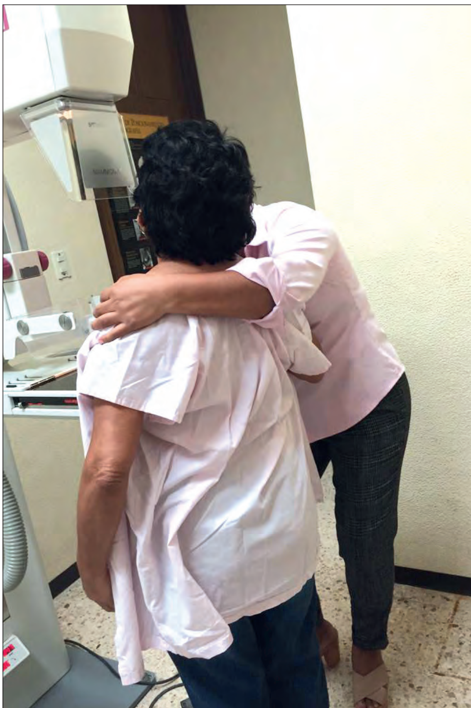
En el mes de octubre, el Instituto Municipal de la Mujer ya brindó 30 estudios para detección oportuna de cáncer de mama.

“Buscamos que se haga costumbre, entre las mujeres mayores de 20 años, el llevar a cabo por lo menos una vez al mes la autoexploración, principalmente en el día siete después de su ciclo menstrual, para que en caso de detectar alguna anomalía, acudir de inmediato con su médico