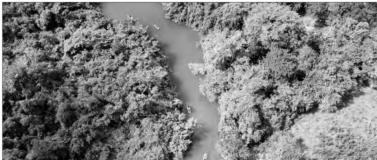
▲ La dirección municipal de turismo busca “darle un empujón” a la ruta de balnearios de la Ribera del Río Hondo.

Dijo que la nueva normalidad obliga a las autoridades a trabajar en promoción digital, por lo que han hecho videos de Mahahual, Xul-Ha, Huay Pix y Chetumal en coordinación