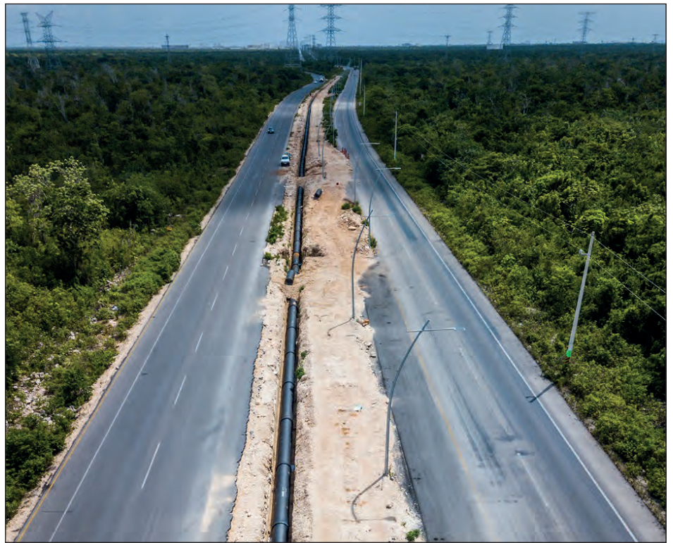
▲ Cada vez son más los países que recurren a esquemas de asociación público-privada para garantizar servicios como el agua potable.

En el caso de Aguakan la transparencia es doble, pues existe un contrato de concesión que se audita y vigila, con montos definidos para reinversión que se cumplen y, en el caso de Solidaridad, incluso se superan. Además, por ser empresa que cotiza en la Bolsa Mexicana de Valores, de manera periódica se dan a conocer los ingresos, que