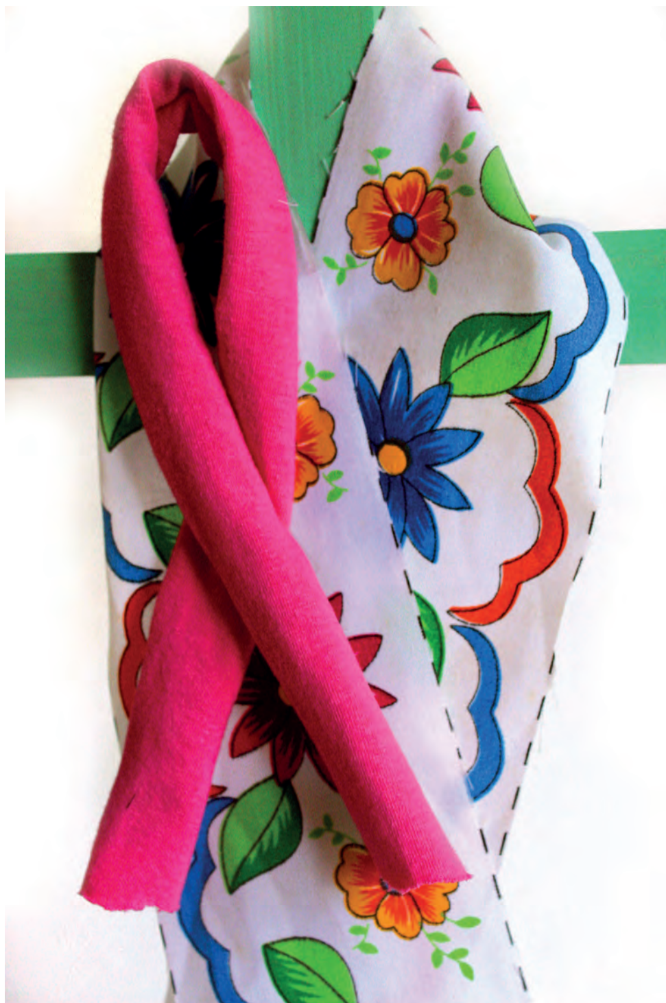
Datos de la Ssy revelan que hay un aproximado de 16 fallecimientos de mujeres en el estado por cáncer de mama al día.