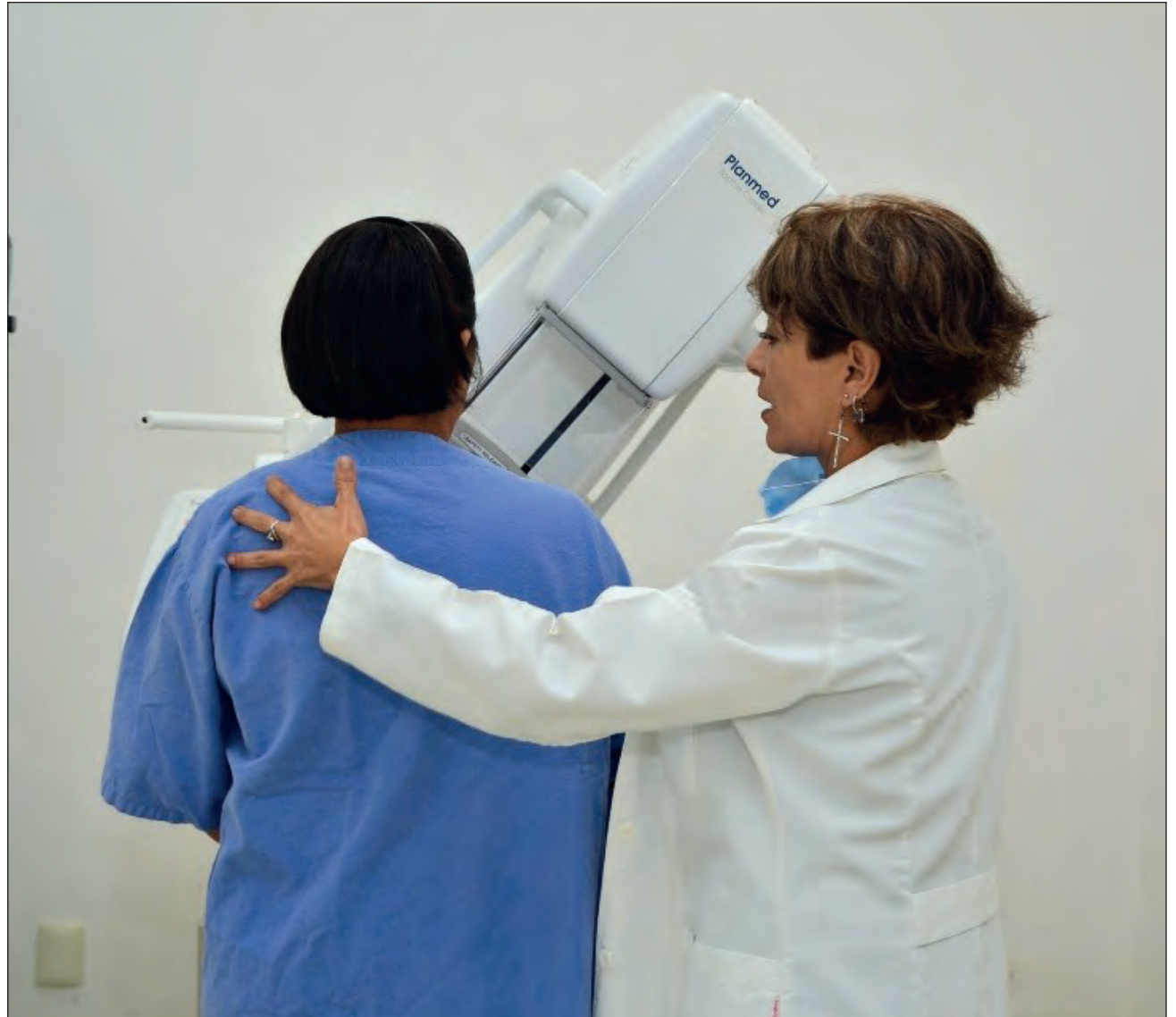
A menudo, la pareja deja sola a la paciente y ocurre un efecto machista. Muchos varones no están dispuestos a cooperar en la parte emocional o en la atención psicológica.

Al centrarse en la atención de la paciente, el psicólogo