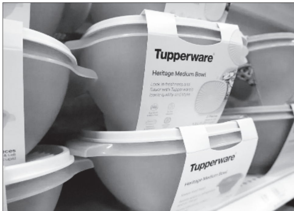
▲ La firma se acogió a la protección del capítulo 11 de la ley de Quiebras de Estados Unidos, que permite a las empresas continuar funcionando mientras trata de recuperarse.

La cotización de las acciones del célebre fabricante