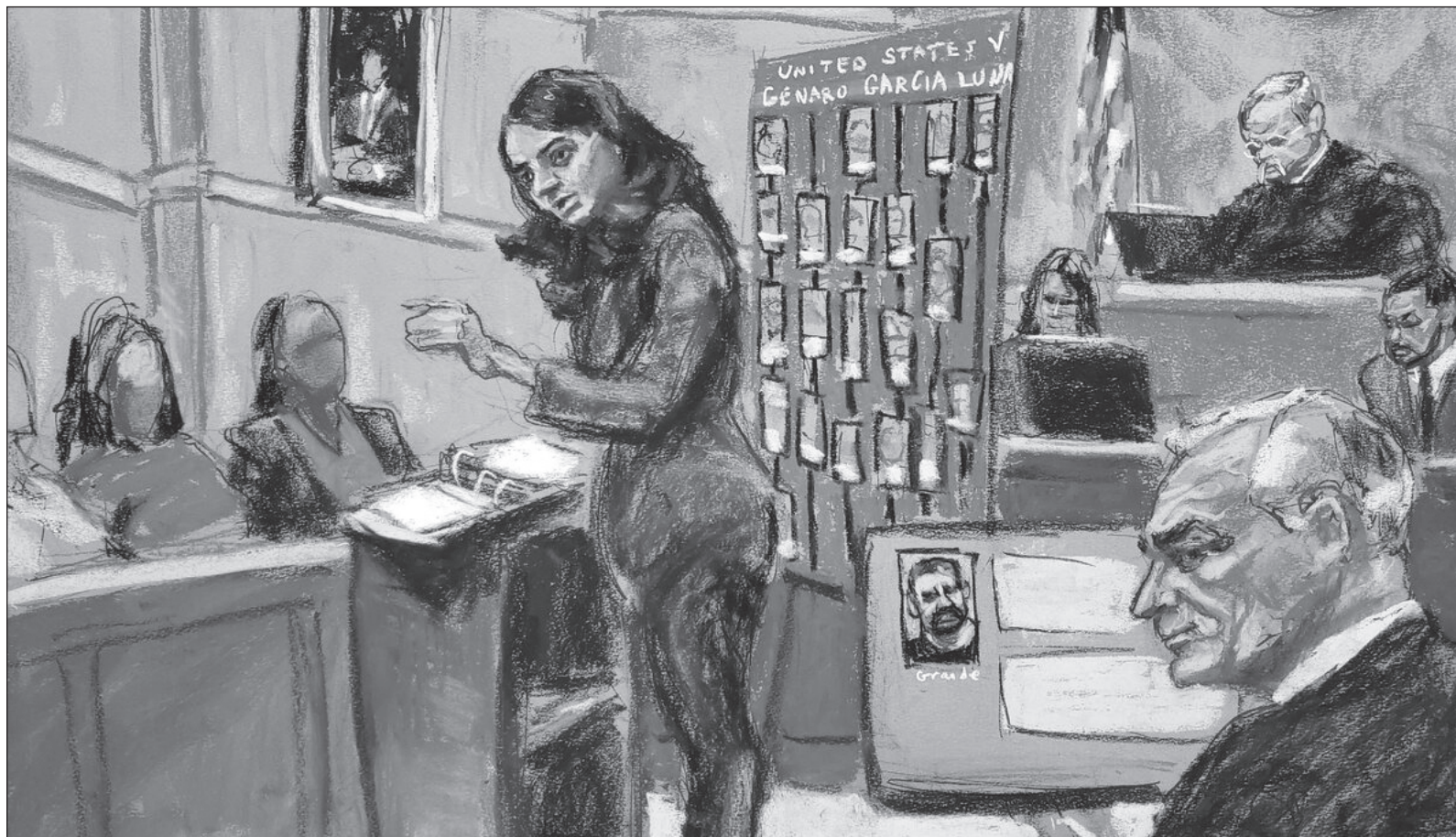
▲ "No sólo descalifica una Reforma Judicial ya en vigor, sino que se describe como un héroe, un mártir que por no dañar 'instituciones' de México no aceptó ser testigo protegido, dinero y unos meses de cárcel. ¿Alguien podría creerle? Además acusa sin pruebas a un presidente que tiene altísima aprobación".