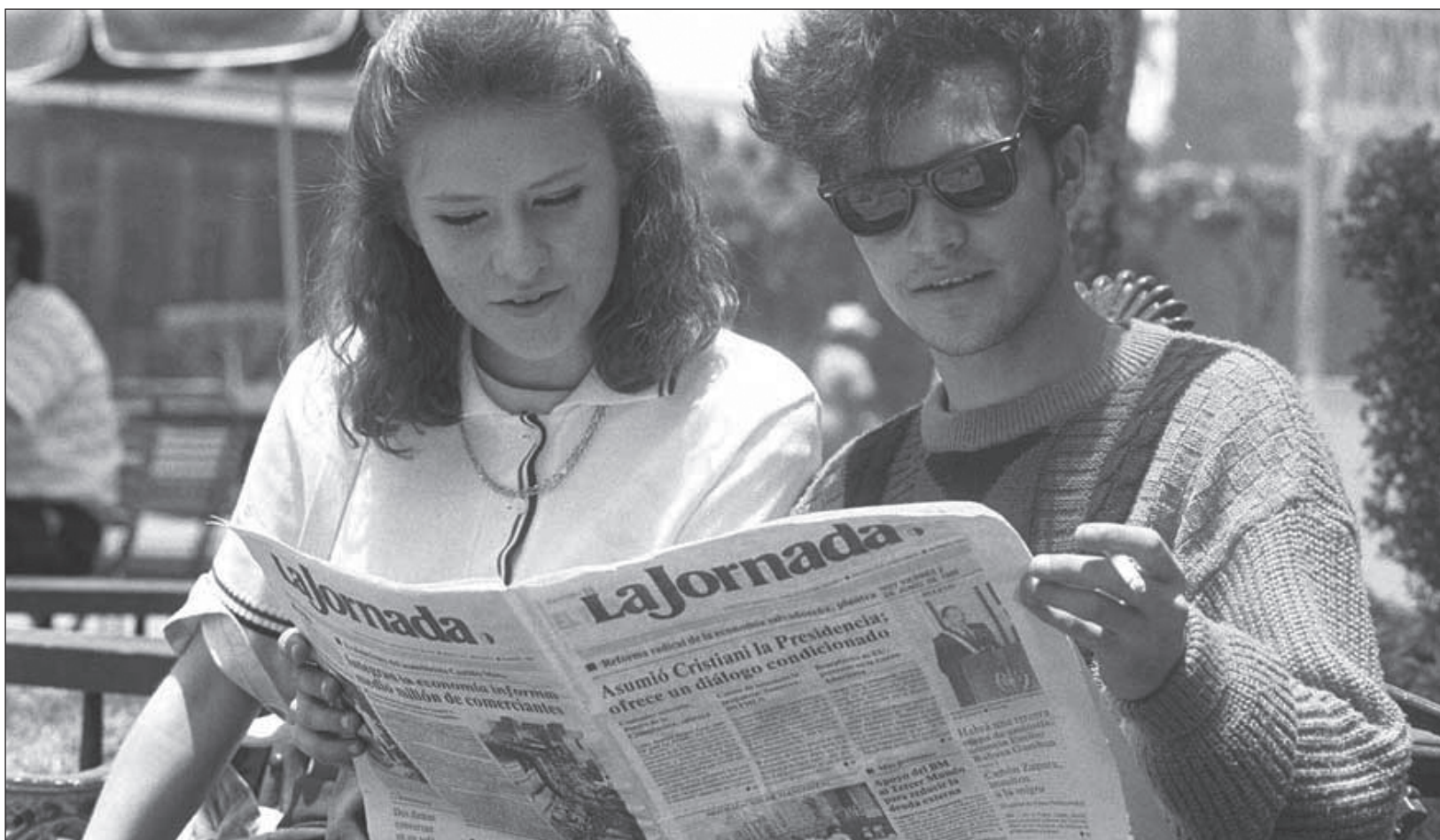
▲ "Al momento de la convocatoria y el nacimiento de este medio despuntaba ya una primavera con ideas de derechos humanos, carta de ciudadanía para la diversidad sexual, justicia y derechos laborales para todos, pero en particular para los trabajadores, campesinos e indígenas".