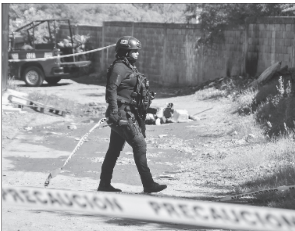
▲ El hallazgo se dio en la calzada Heroico Colegio Militar y Costerita, en ese punto se localizaron tres cuerpos sin vida de jóvenes, justo debajo del puente.

Ninguno ha sido identificado oficialmente por las autoridades hasta el momento