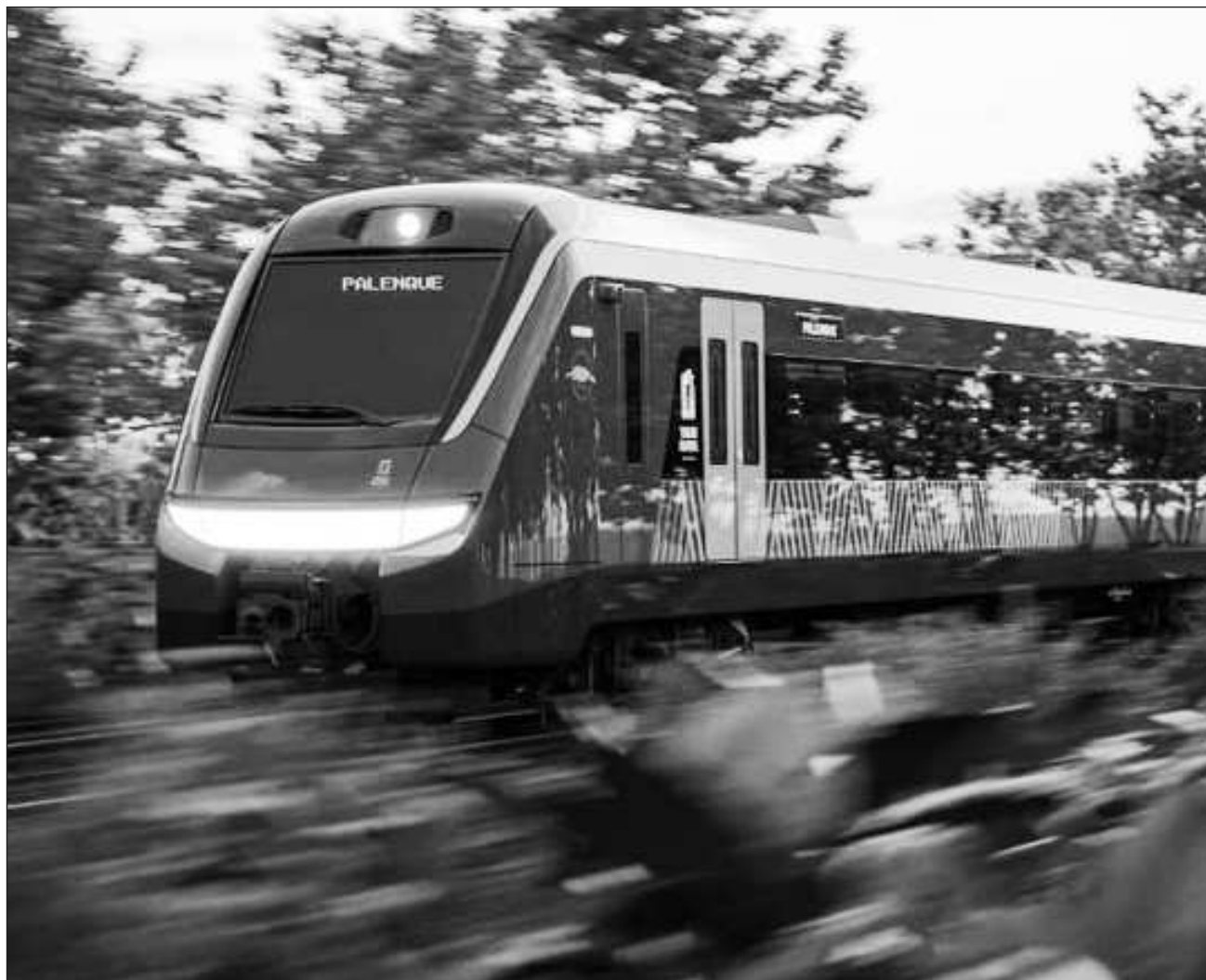
▲ Durante la gira por la península de Yucatán, el presidente Andrés Manuel López Obrador también inaugurará en Chichén Itzá el hotel del Tren Maya, uno de los seis ubicados en la ruta del proyecto ferroviario.

"En Mérida se descansa y terminamos (en la península de Yucatán), porque seguimos con la presidenta a supervisar el camino de Oaxaca al istmo y ese mismo día vamos a entregar constancias de construcción de más de 200 caminos artesanales", detalló.