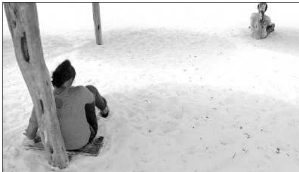
▲ El rango de edad en la que se presentan mayores indicadores de suicidios se encuentra entre los 20 y los 29 años de edad, atribuibles principalmente a problemas familiares o depresión.

Detalló que en la entidad se han presentado 53 casos, de los cuales, la capital del