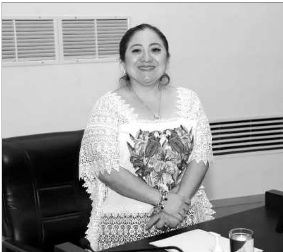
▲ El gobernador electo de Yucatán, Huacho Díaz Mena, le pidió a la próxima titular del Indemaya enfocarse en alcanzar la dignificación del pueblo maya.

“Tenemos un gran compromiso con la dignificación del pueblo maya, por ello le pido a Fabiola que se enfoque en alcanzar este objetivo”, declaró el gobernador electo, Joaquín Díaz Mena, al presentarla como parte de su equipo.