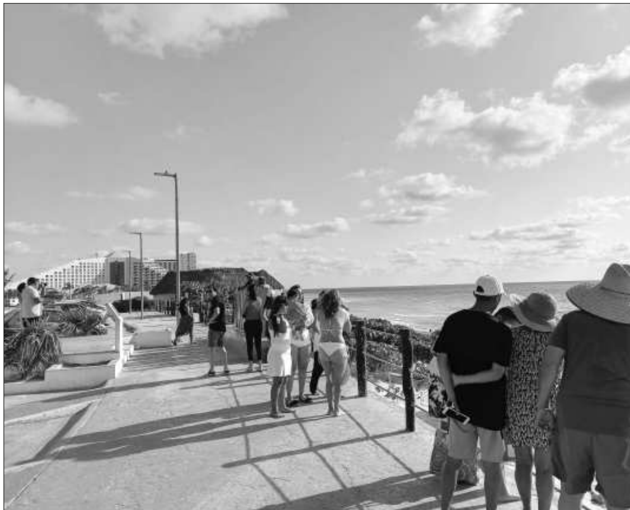
▲ "Llegamos a 60 por ciento (de ocupación hotelera) en algunos destinos. No fue lo que esperábamos ni lo que podría o debería de ser", sostuvo el presidente de la Asociación de Hoteles de Cancún, Puerto Morelos e Isla Mujeres.