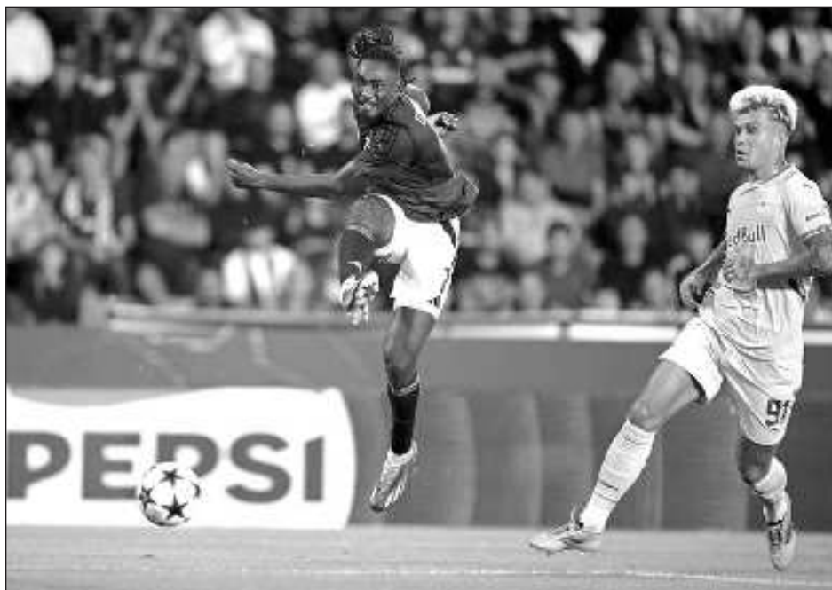
▲ Víctor Olatunji anota el segundo gol del Sparta Praga contra el Salzburgo.

El París Saint-Germain y el debutante Girona también parecían encaminados a un 0-0 hasta que el zaguero portugués Nuno Mendes anotó en el primer minuto del tiempo añadido, con la complicidad del arquero argentino Paulo Gazzaniga, para una victoria de 1-0 del club francés. “La