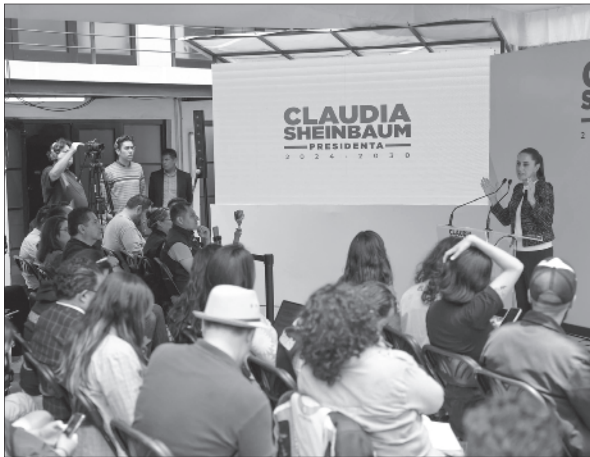
▲ “Sheinbaum, ayer (martes), en conferencia de prensa: ‘Hay esta idea de que, a mí me da risa, la verdad: primero, de que va a continuar él; todos sabemos que él se retira de la vida pública y va a tener las tareas que él ha decidido, que es escribir este libro, que también si lo ven, pues es una tarea política hasta cierto punto’”.

PODEROSO JEFE POLICIACO que fue durante todo el sexenio de Calderón (quien dice nunca haberse enterado de lo que realizaba su virtual vicepresidente de recaudaciones y ejecuciones), García Luna ha hecho que uno de sus abogados enviara a diversos periodistas un texto escrito de puño y letra, con pretensiones de exculpación propia pero, sobre todo, con el mensaje de clara intención mediática de