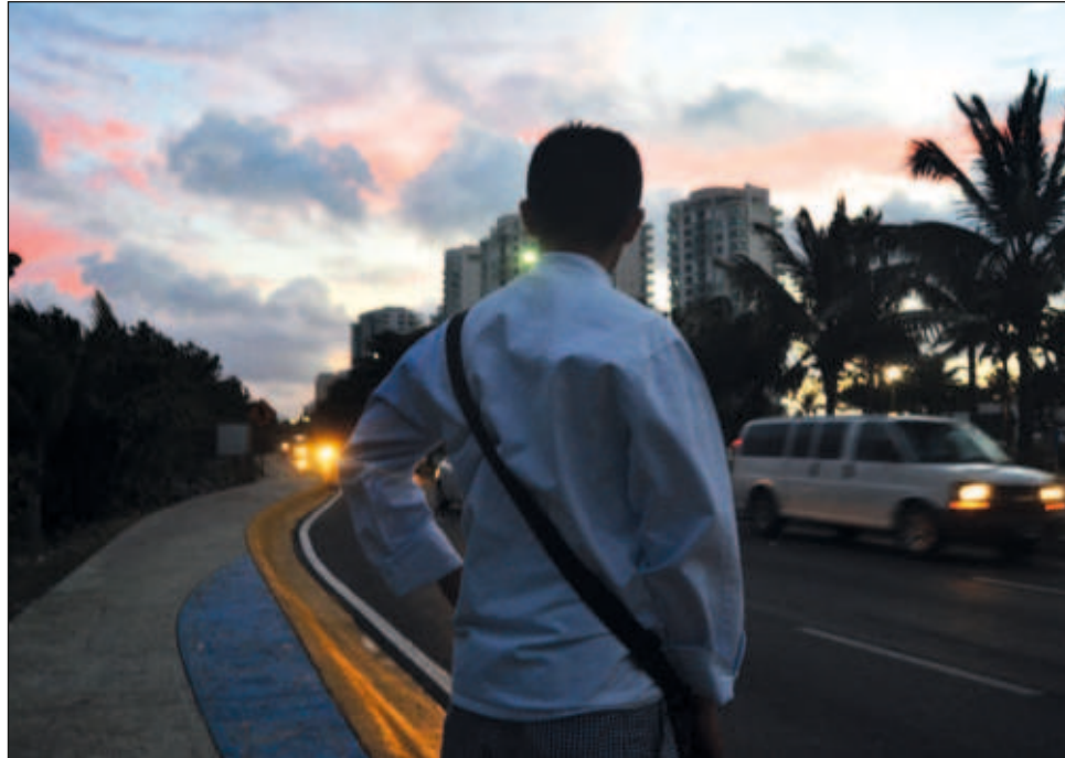
▲ De acuerdo con el Centro de Integración Juvenil de Cancún, hasta 70% de los trabajadores no atiende su salud mental, principalmente por falta de tiempo.

“A través de las pláticas (como las que ofrece el CIJ en