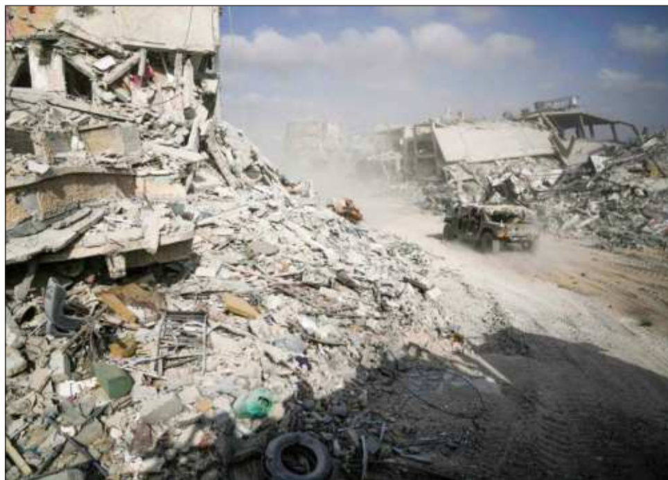
▲ La resolución fue adoptada mientras los ataques de Israel contra Hamas en Gaza se acercan a su primer aniversario y la violencia en Cisjordania alcanza nuevos máximos.

La resolución también exige la retirada de todas las fuerzas israelíes y la evacuación de los colonos de los territorios palestinos ocupados “sin demora”. E insta a los países a imponer sanciones a los responsables de mantener la presencia de Israel en los territorios y a detener las exportaciones de armas a Israel si se sospecha que se utilizan allí.