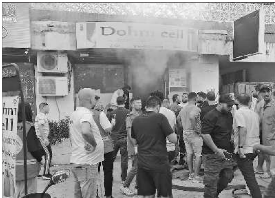
▲ En la provincia de Nabatieh ardieron 60 viviendas y establecimientos, así como 15 coches y decenas de motocicletas a causa de las explosiones de aparatos inalámbricos.

También se registraron fuegos en menor medida en las demarcaciones administrativas de la Bekaa, Baalbek-Hermel y Sur del Líbano, así como en los suburbios me-