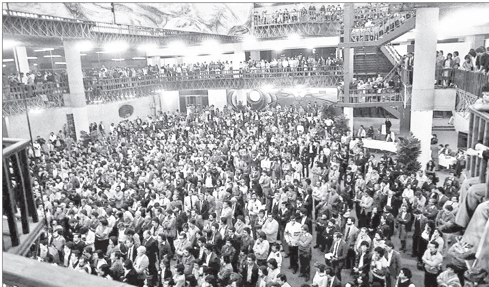
▲ “En La Jornada de los ochenta todo se hizo diferente. Sin el respaldo de medios empresariales o del gobierno, se apostó por los lectores, y los primeros en responder fueron los actores más relevantes del medio cultural”. En la imagen, convocatoria para la fundación del periódico en el Hotel México, el 29 febrero 1984.