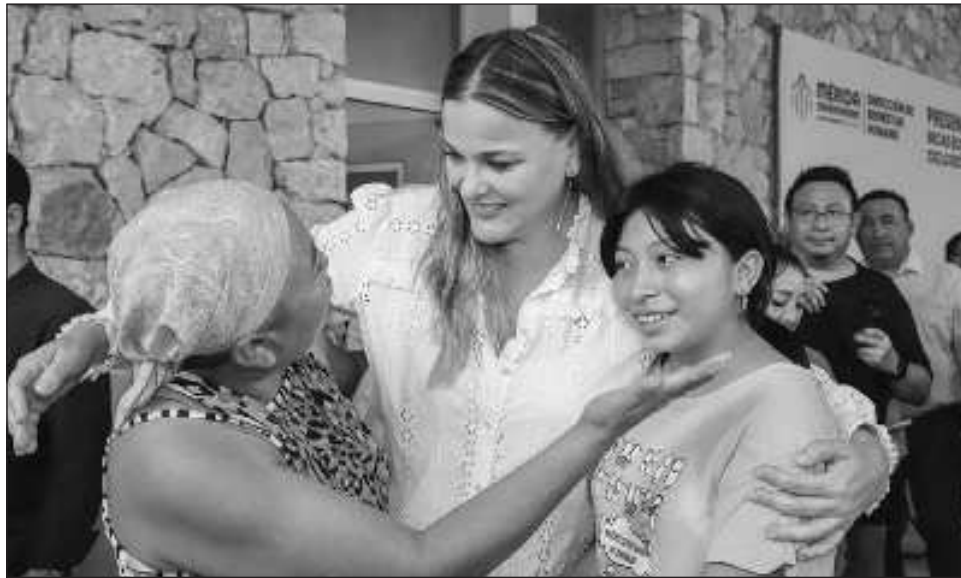
▲ Como requisito para acceder a estos apoyos, las y los interesados deberán tener un promedio mínimo de 8.0 para primaria y 7.5 para secundaria y no adeudar materias.

Mediante la Dirección de Bienestar Humano, se entregarán 4 mil 200 apoyos, es decir, 2 mil 350 becas más de las 1 mil 850 del ciclo anterior para igual número de alumnos de educación básica de escasos recursos.