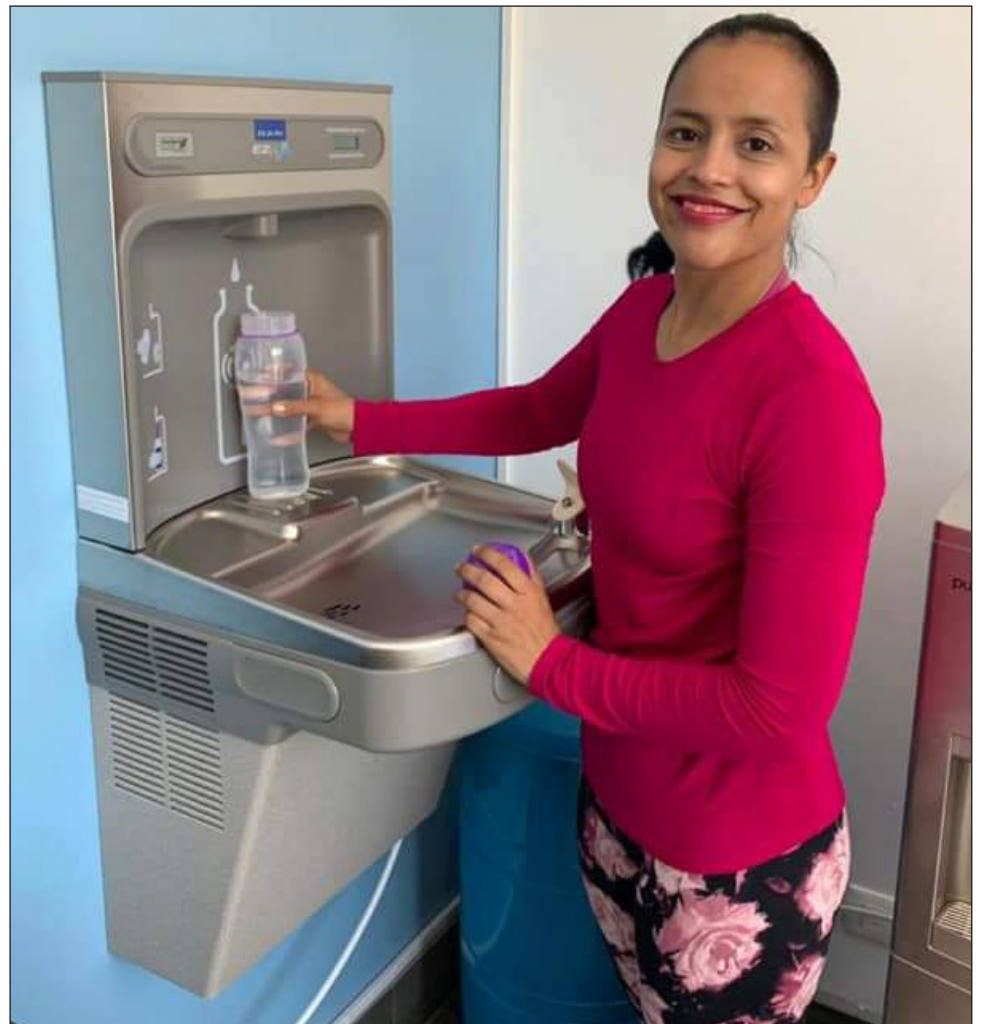
▲ Con más de 15 años en el mercado, además de 30 franquicias, Cancún se convierte en la número 35. Es una empresa nacional que se dedica a la purificación del agua y que, básicamente, se encarga de generar el agua purificada en el lugar donde se consume.

“Iremos poco a poco tratando de convencer a los hoteles, a los usuarios, a las residencias, en donde hay un ahorro económico, partamos de ahí y segundo, pues creo que es bien importante