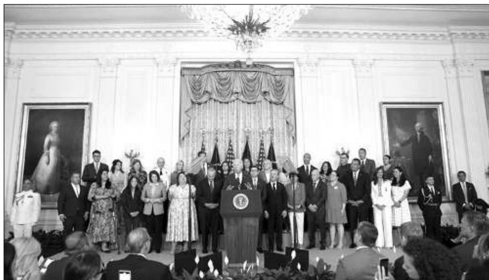
▲ EU señaló que unos 50 mil hijos menores de 21 años con un progenitor de ciudadanía estadounidense también podrán acogerse a la medida. Alrededor de 320 mil migrantes mexicanos son elegibles.

“Estas medidas promoverán la unidad familiar y fortalecerán nuestra economía”, anunció la Casa Blanca en un comunicado.