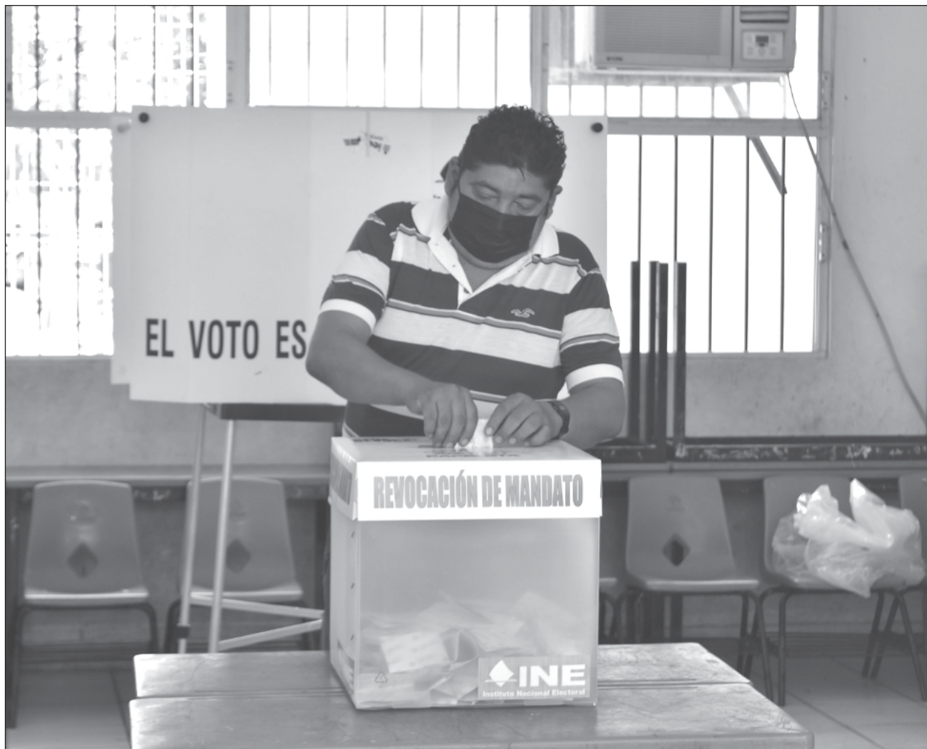
▲ La iniciativa, aprobada a nivel federal, debe adecuarse a la Constitución local, pero aplicaría hasta 2030.

“Está omisión es dolosa, intencional la de prorrogar el reconocer este derecho