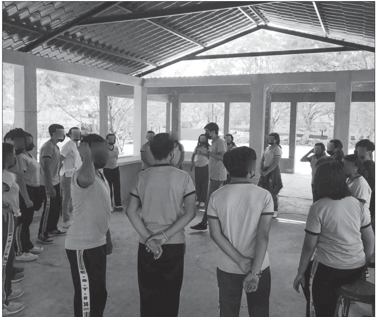
▲ Esta estrategia se realiza en colaboración con el Sistema Nacional de Protección de Niñas, Niños y Adolescentes, visitando diferentes planteles educativos de la entidad con el objetivo de fortalecer la prevención del suicidio.

Estas acciones se continuarán realizando a través de visitas en otras escuelas para promover la salud mental de los jóvenes.