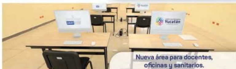
Nueva área para docentes, oficinas y sanitarios.