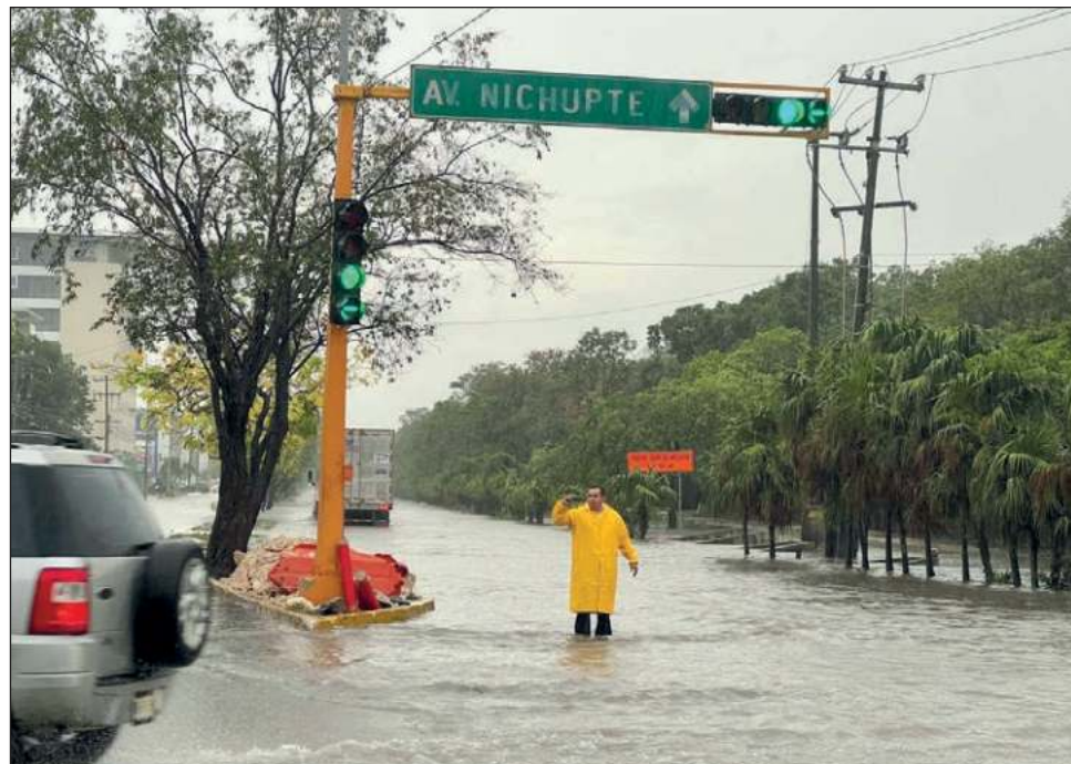
▲ El clima también ha ocasionado fallas en algunos semáforos, por lo que elementos de tránsito se encuentran en varios puntos para controlar la movilidad y evitar accidentes. Sin embargo, también han registrado algunos vehículos varados que no alcanzaron a superar grades encharcamientos.

El clima también ha provocado fallas en algunos semáforos, por lo que ele-