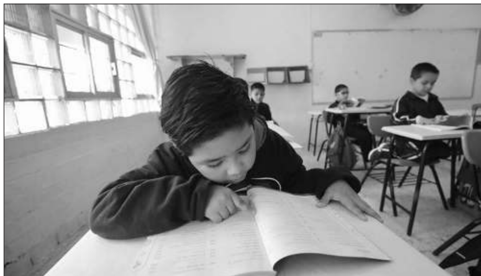
▲ En el caso de los estudiantes mexicanos, obtuvieron más de 4.5 puntos más de lo esperado en el pensamiento creativo, una gran ventaja de rendimiento relativo.

Si bien los resultados revelan que los sistemas educativos que obtuvieron puntuaciones altas en pensamiento creativo "casi siem-