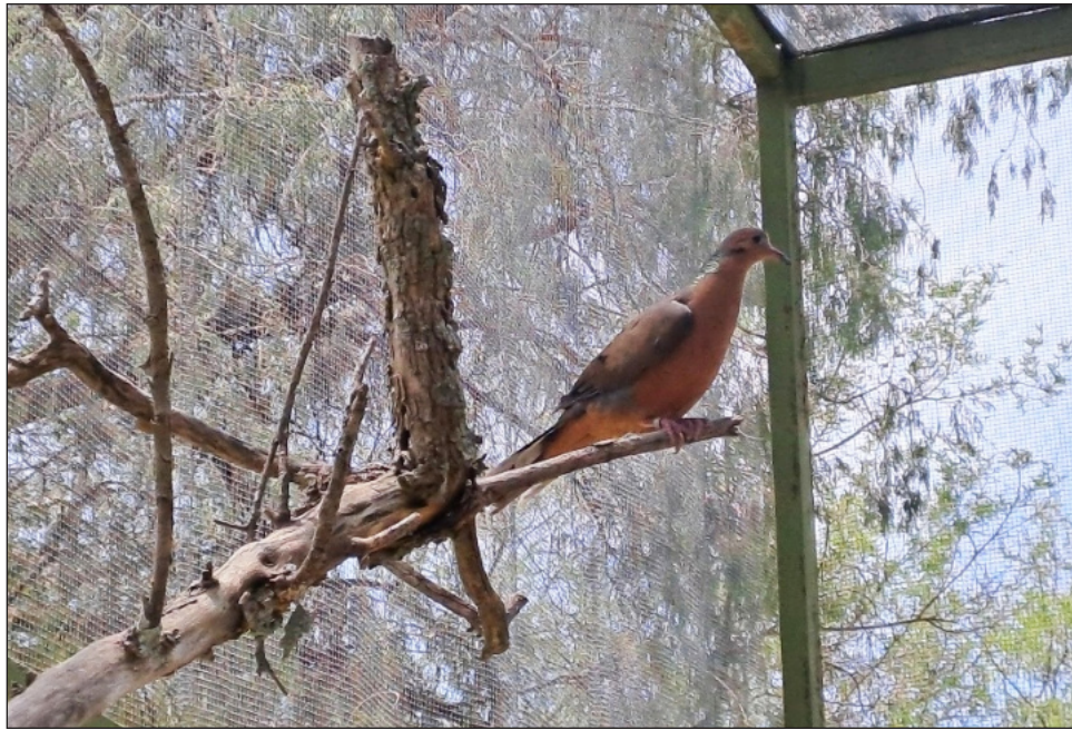
▲ "Cuando se perdió la paloma de Socorro, la gente no estaba consciente de lo que pasaba hasta que otros investigadores detectaron que, junto con ésta, había otra especie que ya no estaba presente en la isla, el tecolotito enano de Socorro, ya extinto", subrayó Martínez.

"Nuestra percepción del ambiente ha cambiado a lo largo del tiempo. En nuestro país recientemente se ha tenido claridad de que si no se cuida el ambiente y se van per-