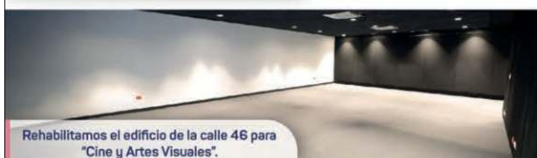
Rehabilitamos el edificio de la calle 46 para "Cine y Artes Visuales".