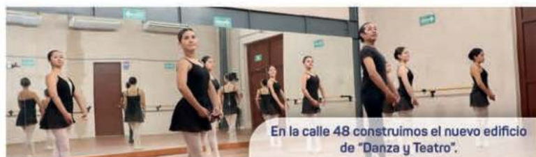
En la calle 48 construimos el nuevo edificio de "Danza y Teatro".