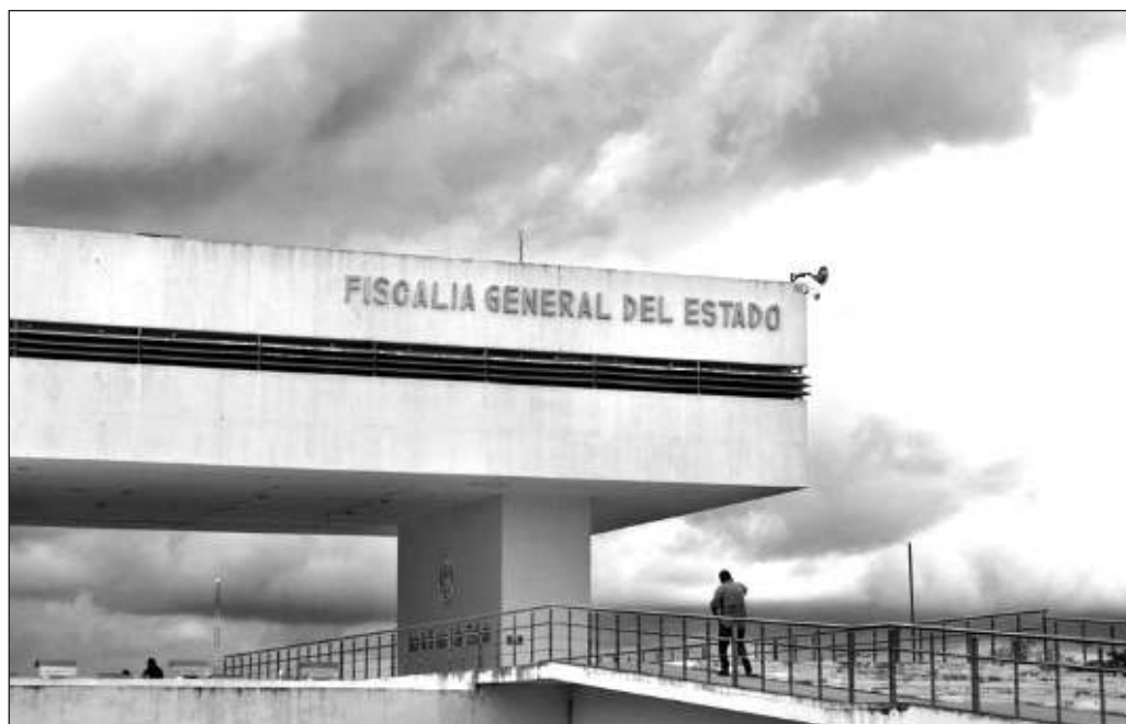
▲ La reforma debe implicar también el fortalecimiento de las fiscalías, ya que desde ahí suelen cometerse anomalías por las cuales se termina por poner en libertad a afamados delincuentes.

Lo cierto es que la transformación se quedará corta si se limita al Poder Judicial. La reforma debe implicar también el fortalecimiento de las fiscalías, ya que desde ahí suelen cometerse anomalías por las cuales se termina por poner en libertad a afamados delincuentes, no es una mera decisión de jueces y magistrados, aunque sí se les hace más fácil terminar cometiendo una injusticia.