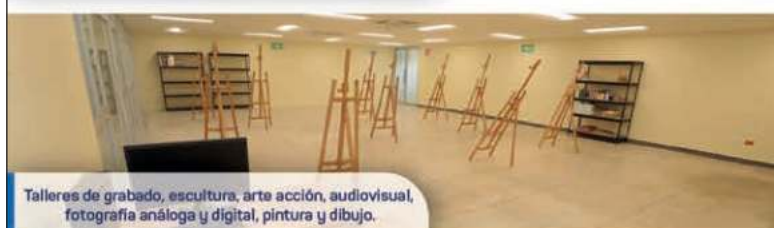
Talleres de grabado, escultura, arte acción, audiovisual, fotografía analógica y digital, pintura y dibujo.