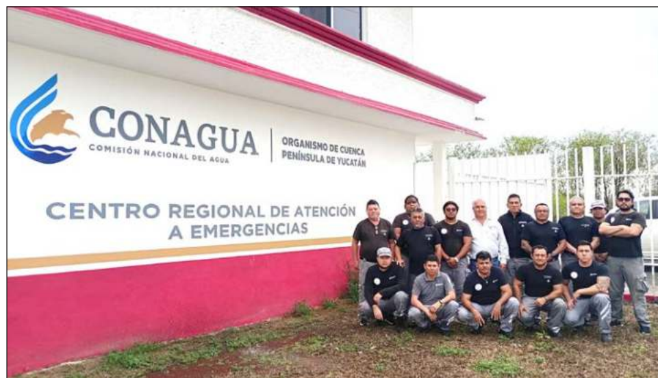
▲ El equipo del Centro Regional de Atención de Emergencias se turna para tener una cobertura 24/7, principalmente durante la época de ciclones tropicales.

“La coordinación con los órganos de Protección Civil es