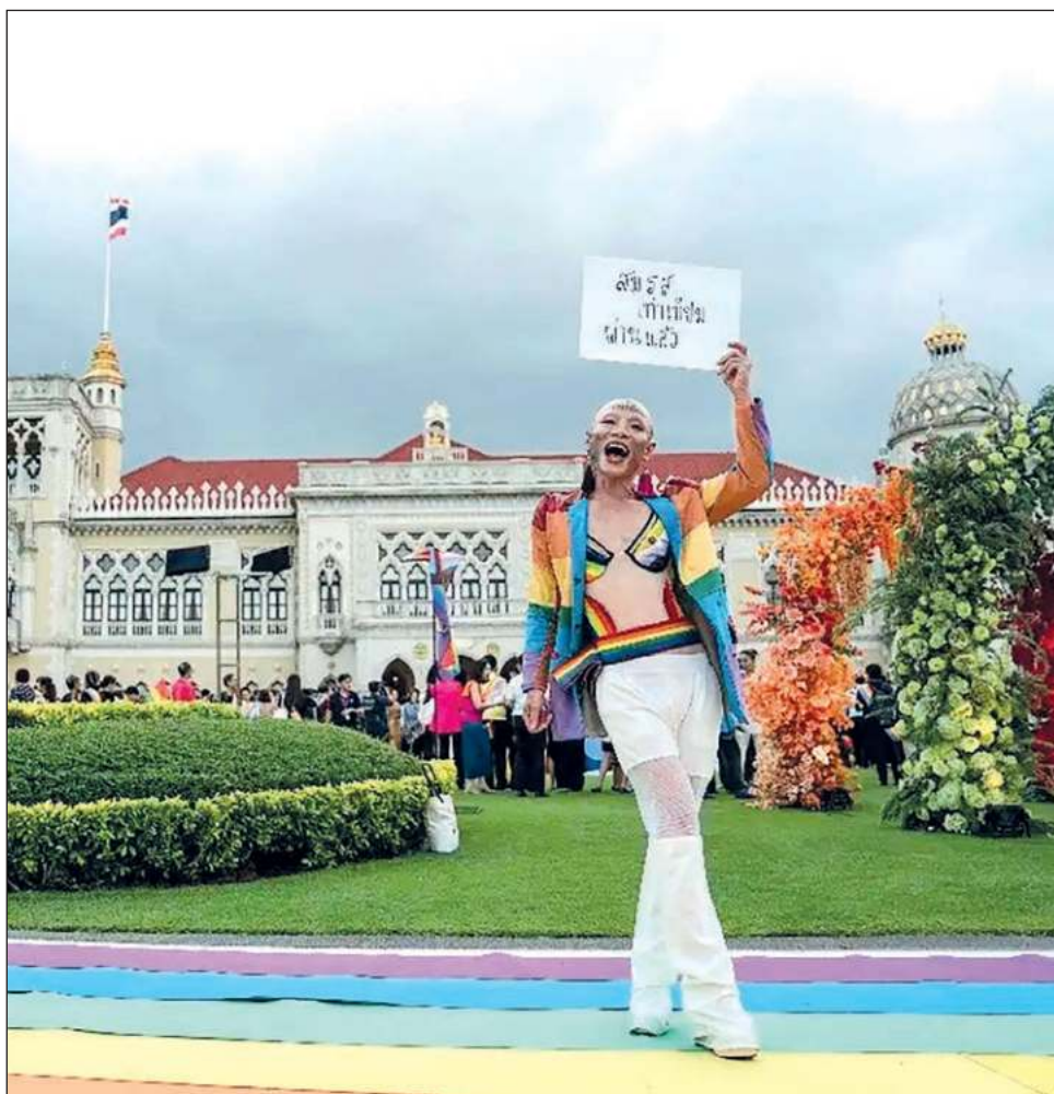
▲ Tras la aprobación de la ley, los activistas de la comunidad LGBTTTI+ esperan que sea posible celebrar los primeros matrimonios igualitarios en el reino en octubre.

Además, le otorga a las parejas homosexuales los mismos derechos que a las heterosexuales en materia de adopción y herencia.