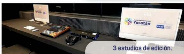
3 estudios de edición.