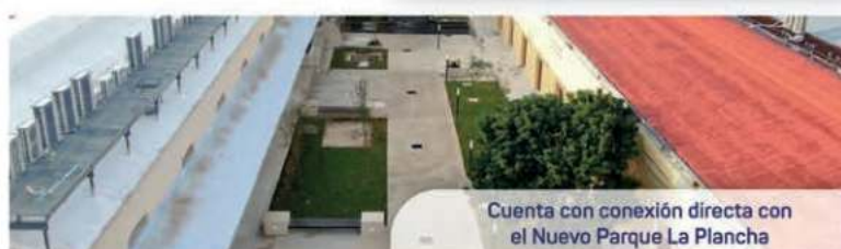
Cuenta con conexión directa con el Nuevo Parque La Plancha