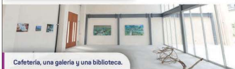
Cafetería, una galería y una biblioteca.