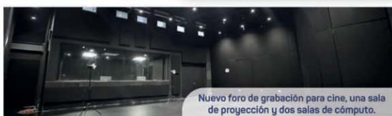
Nuevo foro de grabación para cine, una sala de proyección y dos salas de cómputo.