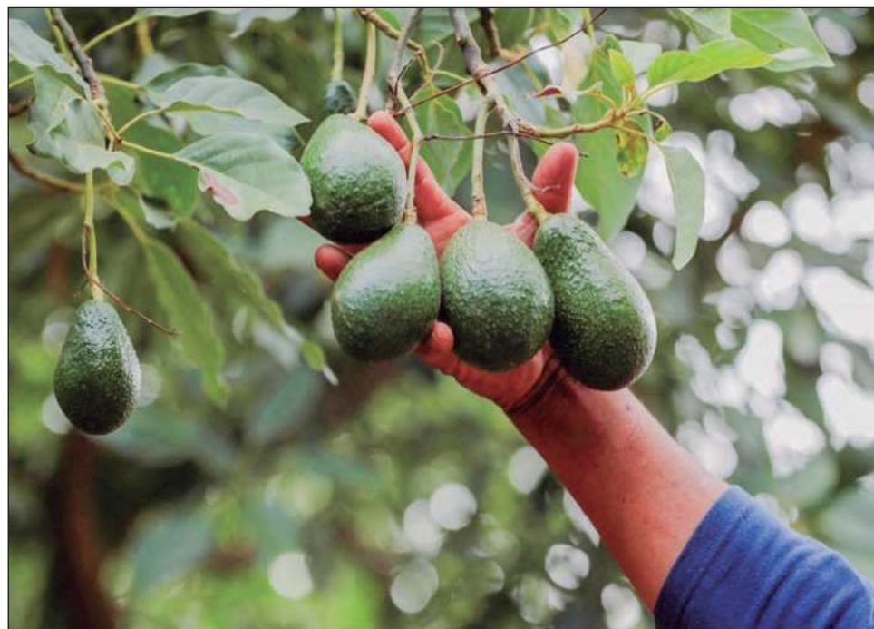
▲ El embajador de Estados Unidos, Ken Salazar, confirmó este martes de la suspensión que se mantendrá hasta que se hayan resuelto los problemas de seguridad.

Afirmó que esta pausa no afecta a otros estados mexicanos, donde continúan las inspecciones del APHIS, ya que esta acción no bloquea todas las exportaciones de aguacates o mangos a Estados Unidos, ni detiene los