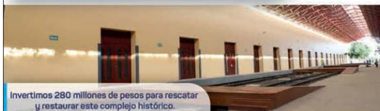
Invertimos 280 millones de pesos para rescatar y restaurar este complejo histórico.