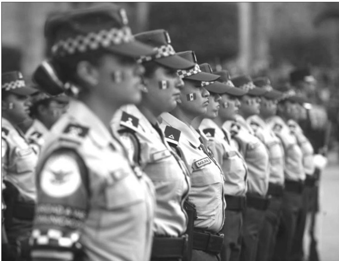
▲ Ante pregunta al respecto durante la conferencia de prensa diaria, el mandatario respondió: “Veo a Claudia (Sheinbaum) muy fuerte, pero además (las fuerzas armadas) son muy leales, disciplinados, tanto en la Marina como en la Defensa”.