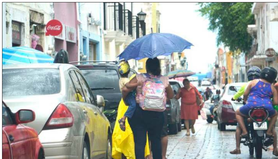
▲ Las dependencias que continuaron con sus labores fueron las dedicadas a la atención de Protección Civil, Seguridad Pública, Fiscalía General del Estado y Salud.

En el Poder Legislativo, lo único que el Congreso del Estado sesionó fue respecto con a la ley de Revocación de mandato en la entidad;