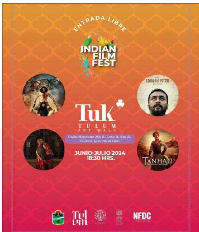
▲ Las cintas seleccionadas son RRR , Soorai Pottru , Bajirao Mastani y Tanhaji: The Unsung Warrior . Foto cartel promocional

El festival cinematográfico se llevará a cabo en la plaza Tuk, municipio de Tulum