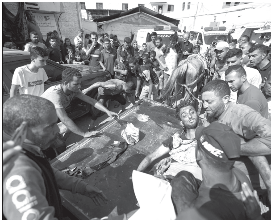
▲ El Alto Comisionado de la ONU para los Derechos Humanos, puntualizó que “la proporción de mujeres muertas en 2023 se duplicó y la de niños se triplicó” en relación al año anterior.

“En 2023, los datos recabados por mi oficina muestran que el número de de-