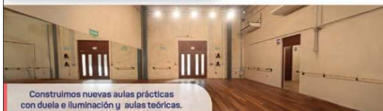
Construimos nuevas aulas prácticas con duela e iluminación y aulas teóricas.