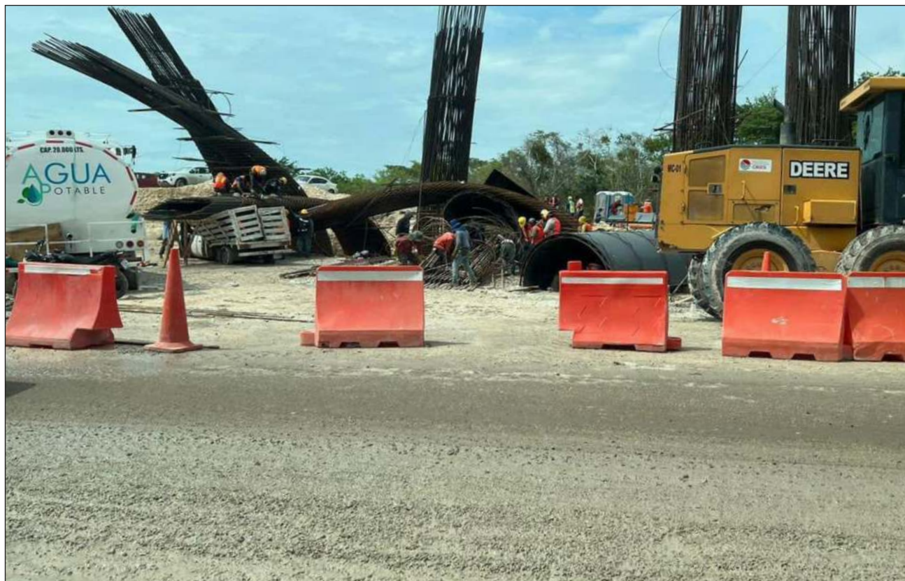
▲ Las varillas que conformaban los castillos fueron dobladas por el viento; uno de ellos cayó sobre una camioneta.

El hecho trascendió en redes sociales pues conductores que pasaban por el área tomaron fotografías del percance, del cual hasta ahora no se han reportado heridos. La administración del Tren Maya no se ha pronunciado al respecto.