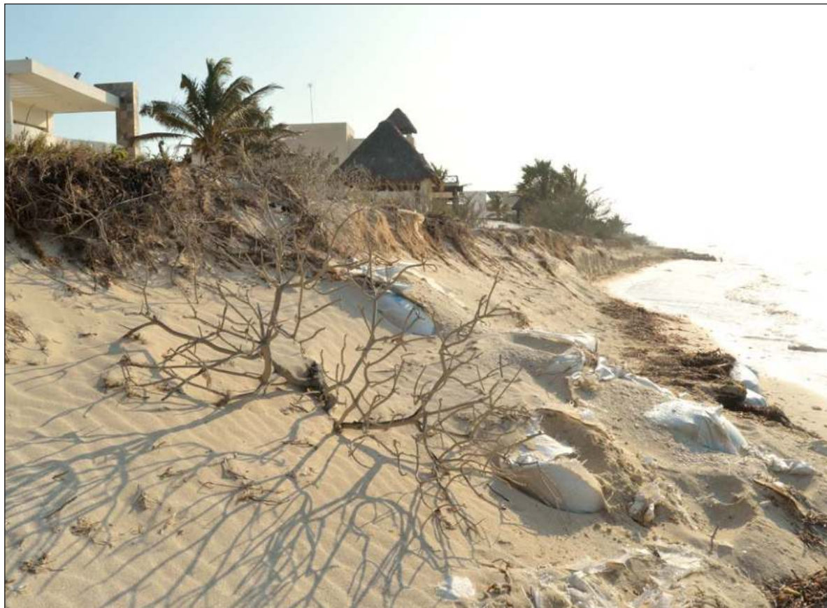
▲ “La capacidad del gobierno federal para enfrentar los retos que significan cuidar de los recursos naturales y servicios ambiental de un territorio megadiverso (...) se han ido erosionando de manera dramática”.

El impacto de esta erosión se ha notado sobre todo en los que fueran órganos desconcentrados de la Secretaría del medio Ambiente y Recursos Naturales, que son por cierto los principales responsables del conocimiento y uso sustentable de la biodiversidad que aloja el territorio del país, la conservación y manejo apropiado de los ecosistemas que constituyen la base natural del paisaje nacional y los servicios ambientales que proveen a nuestra sociedad, la garantía de acceso humano al agua, tanto para consumo directo como el riego y la generación de energía, el uso apropiado de los recursos forestales, los procesos de mitigación de las causas con que México contribuye a la actual emergencia climática y de adaptación a las condiciones que nos impone al acelerado cambio climático global.