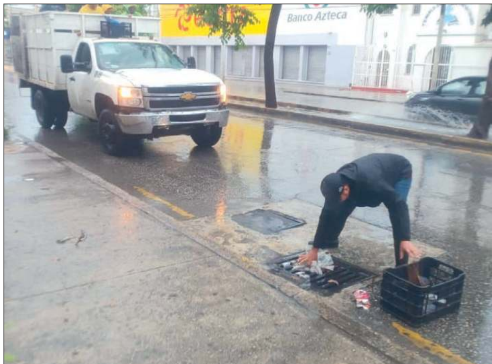
▲ Las afectaciones por el potencial ciclón tropical número uno, en el Golfo de México, alcanzaron los municipios de Benito Juárez, Solidaridad e Isla Mujeres.

Mientras que en Playa del Carmen se reportan caída de árboles, desprendimiento de láminas de zinc que servían como techos de viviendas y encharcamien-