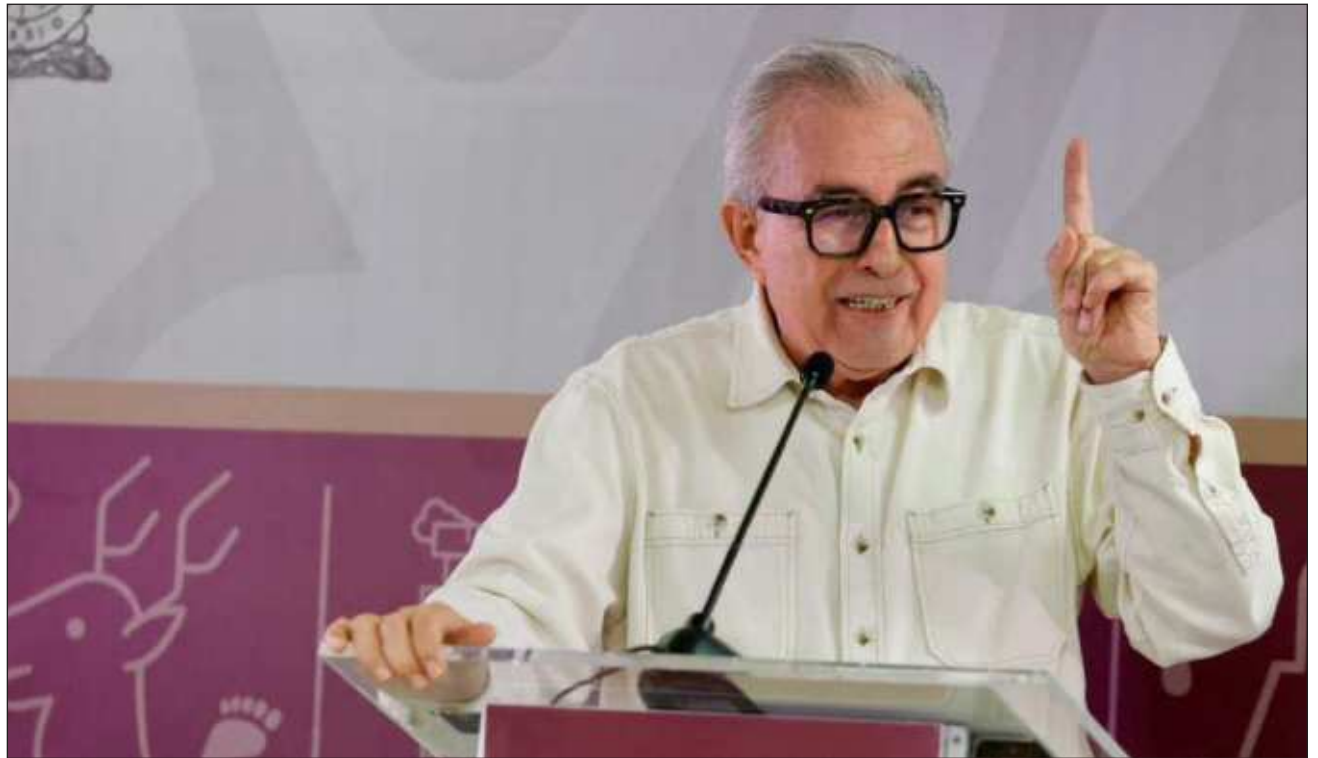
▲ La UIF confirmó a través de un comunicado las medidas aplicadas contra Rubén Rocha.

Al referirse ampliamente al caso de Sinaloa y a la relación con Estados Unidos, la mandataria advirtió que es importante