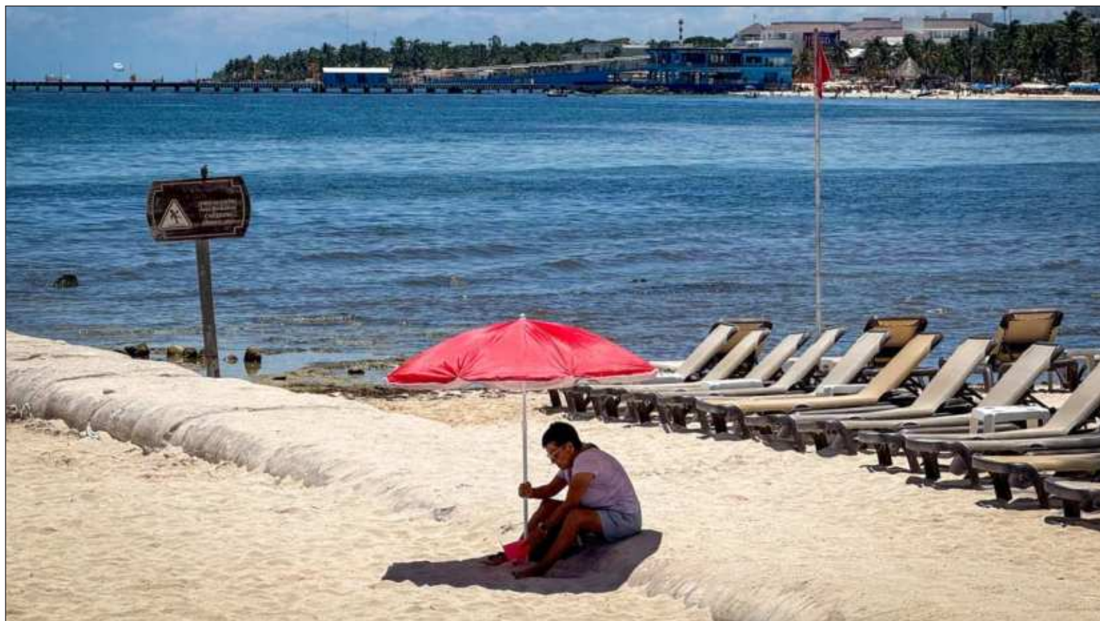
▲ “Normalmente en nuestro país experimentamos El Niño con veranos secos y cálidos, en el invierno hay lluvias en el norte”.