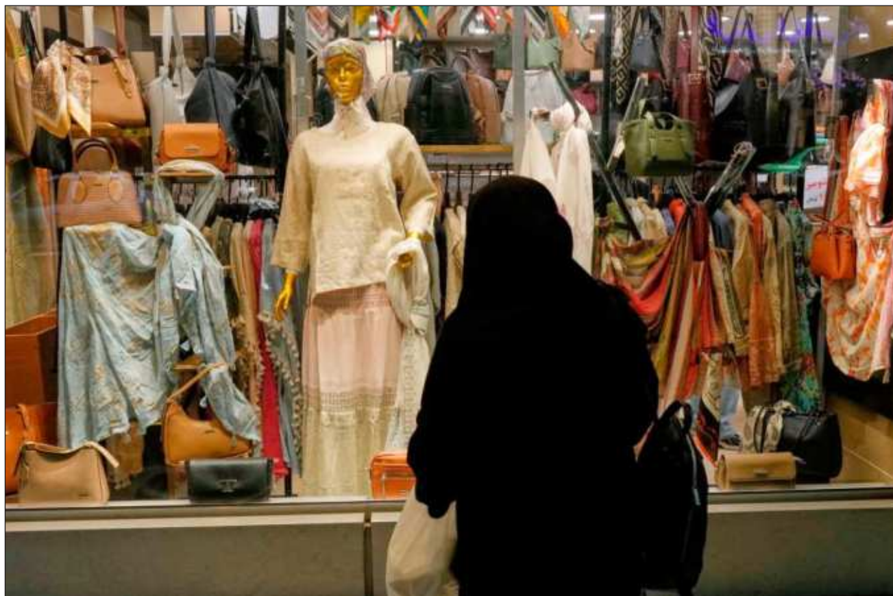
▲ Al menos 279 empresas han citado la guerra como motivo para adoptar medidas y mitigar el impacto financiero.

Al menos 279 empresas han citado la guerra como motivo para adoptar medidas defensivas destinadas a mitigar el impacto financiero, entre ellas subidas de precios y recortes de producción, según muestra el análisis. Otras han suspendido los dividendos o las recompras de acciones, han despedido temporalmente a personal, han añadido recargos por combustible o han solicitado ayuda gubernamental de emergencia.