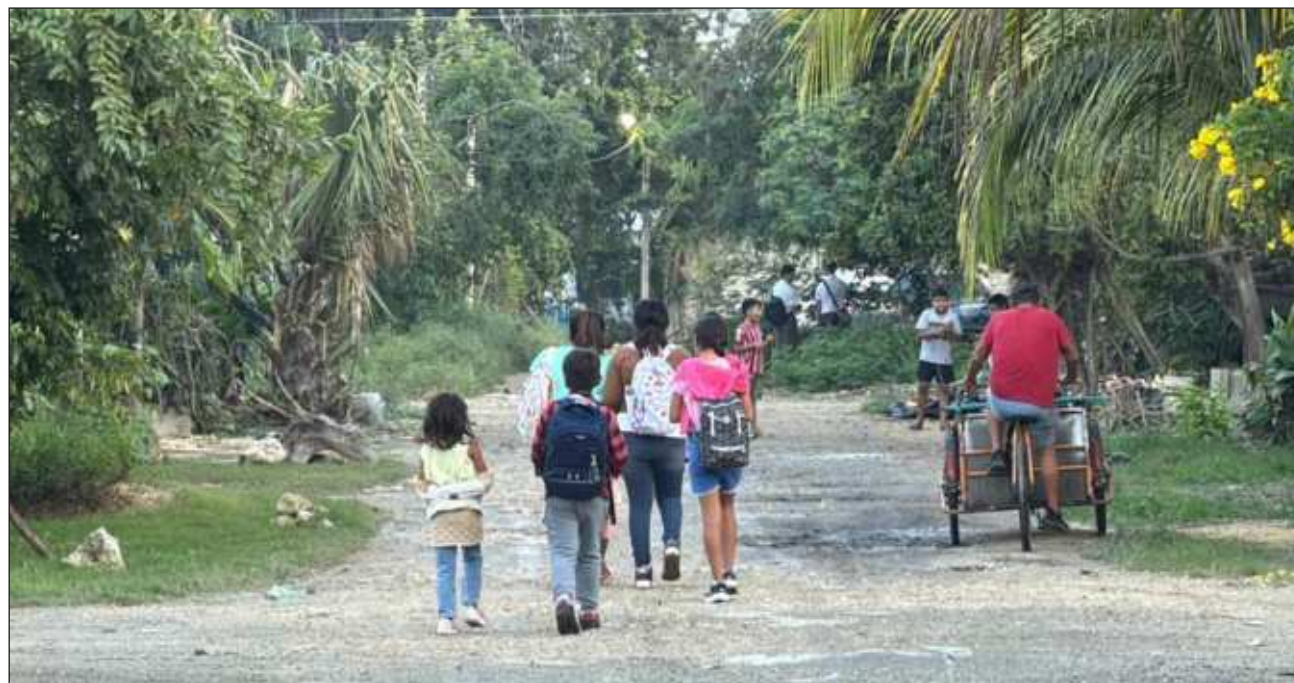
▲ El proyecto no sólo contempla la creación de nuevas rutas, sino también la coordinación con autoridades y organismos para mejorar las condiciones urbanas de estas zonas, especialmente vialidades y servicios.