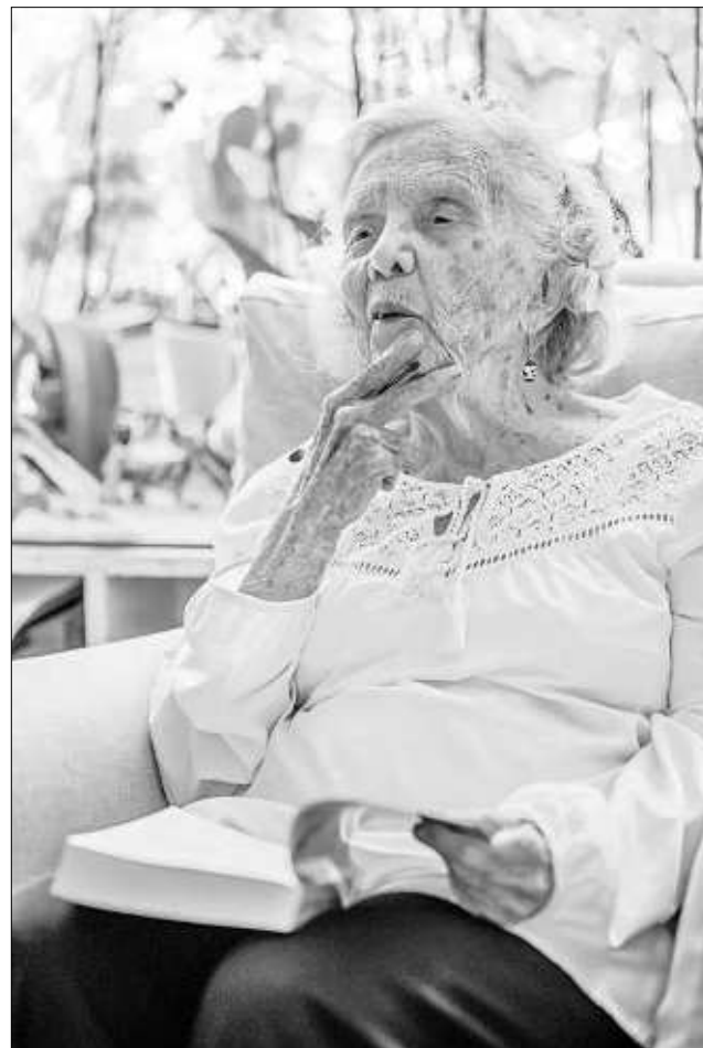
▲ “ La Jornada ha sido muy importante en mi trayectoria profesional, y agradezco mucho a los lectores que me hayan acompañado durante tantos años”, expresó la autora de La noche de Tlatelolco .

El silencio dura apenas unos segundos. Después llega una idea que parece resumir buena parte de su manera de mirar el mundo: “la originalidad es sagrada”.