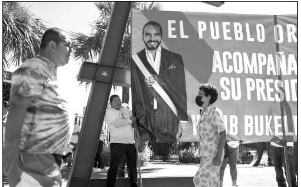
▲ El presidente salvadoreño, que goza de una alta popularidad, basó su campaña en el combate a las temibles pandillas e hizo que el Poder Judicial habilitara su reelección pese a estar prohibido.

En el año y medio que lleva el presidente de Colombia se ha reunido cuatro veces con su homólogo venezolano y delegaciones de alto nivel de ambos países van y vienen entre Caracas y Bogotá, donde se reabrieron hace más de un año las embajadas.