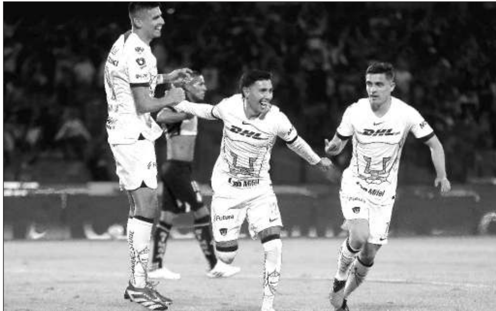
▲ La afición de los Pumas disfrutó la propuesta ofensiva de los suyos.

En el comienzo del tiempo de descuento el jugador de Tigres, Eduardo Tercero, fue expulsado tras encarar a un rival, lo que