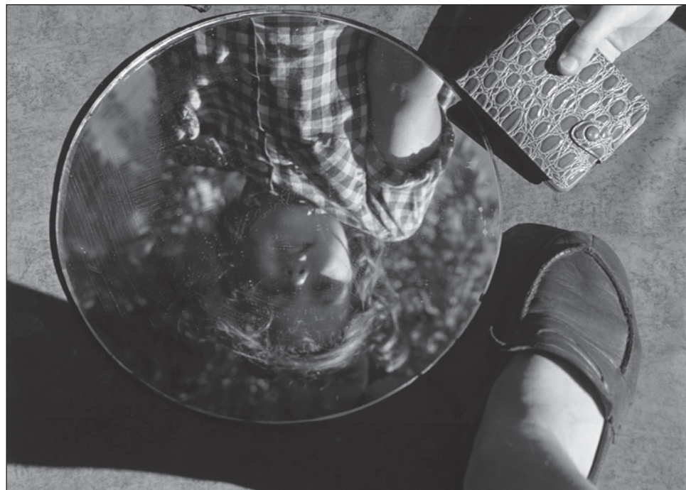
▲ La protagonista de la exposición tuvo una vida silenciada, era invisible, sin identidad, y, dada su profesión, carecía de hogar: su habitación era su propia fotografía.