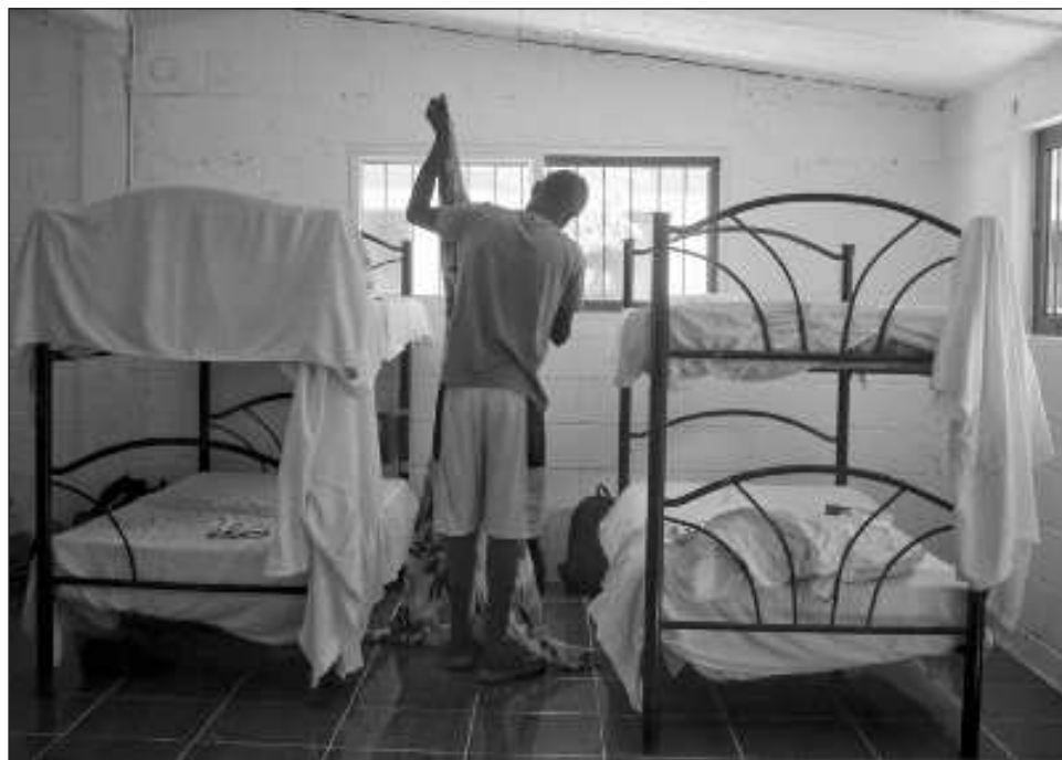
▲ En CISVAC han notado que muchas de las personas que llegan a Quintana Roo ya no lo hacen con la intención de irse al norte, sino de quedarse a vivir en el Caribe Mexicano.

“Este año se incrementó (la cifra de migrantes) casi 23 por ciento comparado con el año pasado, muchísimo, de hecho donde más hemos tenido son las solicitudes de asilo por refugio humani-