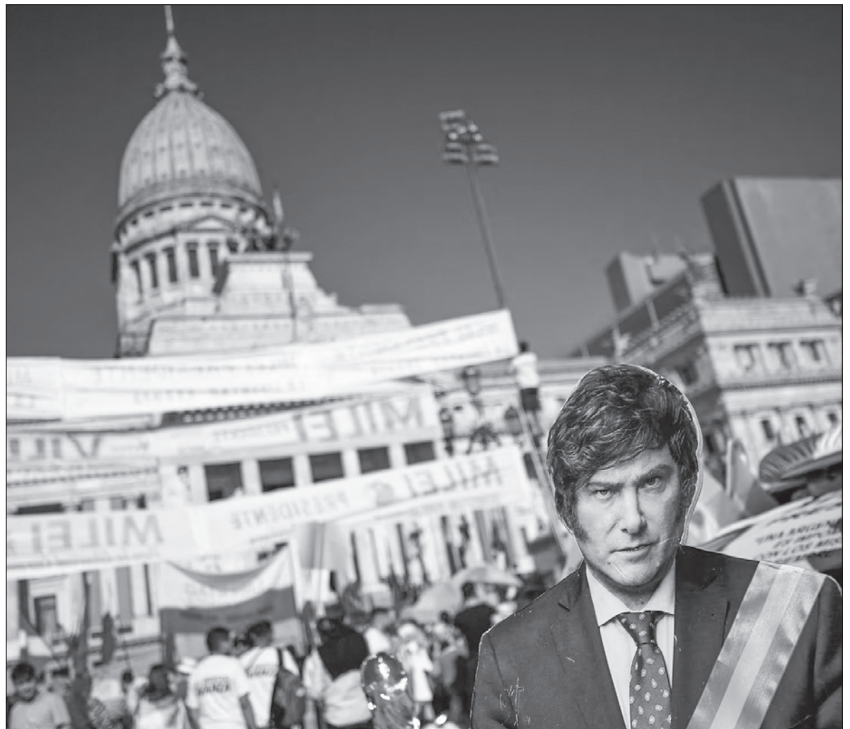
▲ “La historia contemporánea de Latinoamérica nos ha mostrado que la progresividad de los derechos humanos no es un criterio aplicable y del todo cierto en el vaivén político de nuestros países”.

POSICIONAMIENTOS COMO EL anterior, también se manifiestan en las calles, produciendo enfrentamientos entre grupos que reivindican los derechos y los que están cercanos a la forma de pensamiento de los grupos en el gobierno. Esto afecta al movimiento feminista argentino porque en los últimos años ha incidido en la transformación de leyes sobre los derechos sexuales y reproductivos, sobre la identidad, acceso a la justicia, bienestar social, cuidados