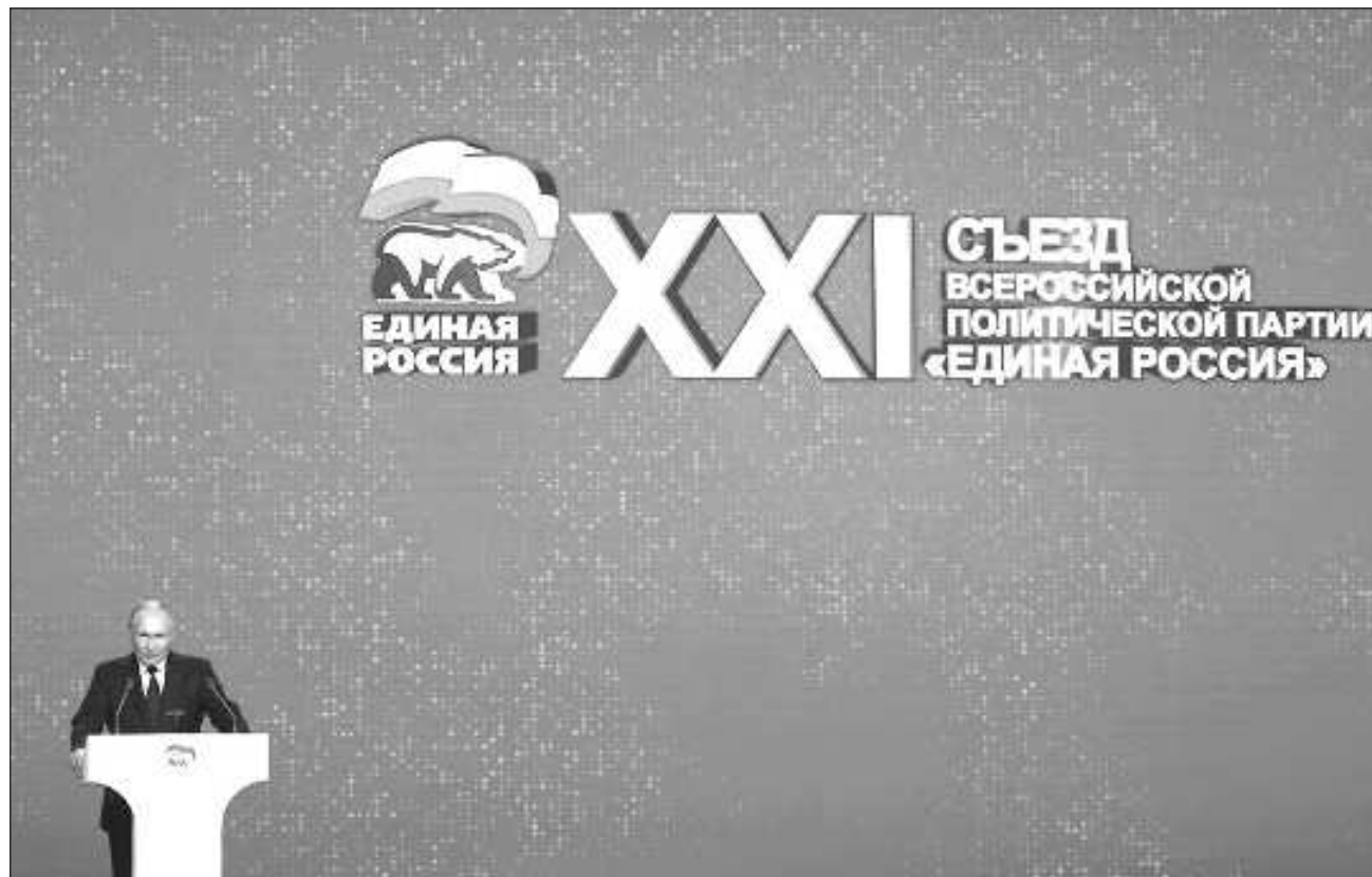
▲ Si Vladimir Putin es reelegido como presidente, una opción probable en un sistema en el que la oposición es casi inexistente, podría permanecer en el Kremlin hasta 2030: todos sus opositores están en la cárcel o en el exilio.

Putin, de 71 años, ha dicho que hará de la “soberanía” uno de los objetivos clave de su quinto mandato en el Kremlin.