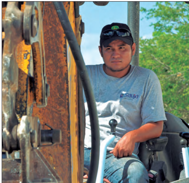
▲ De los 25 mil afiliados a la CROC, el 10% ha perdido el trabajo.

Los más afectados son del ramo de la industria de la construcción. "Si nos ha pegado duro la pandemia", reconoció el líder sindical, quien además dijo que por