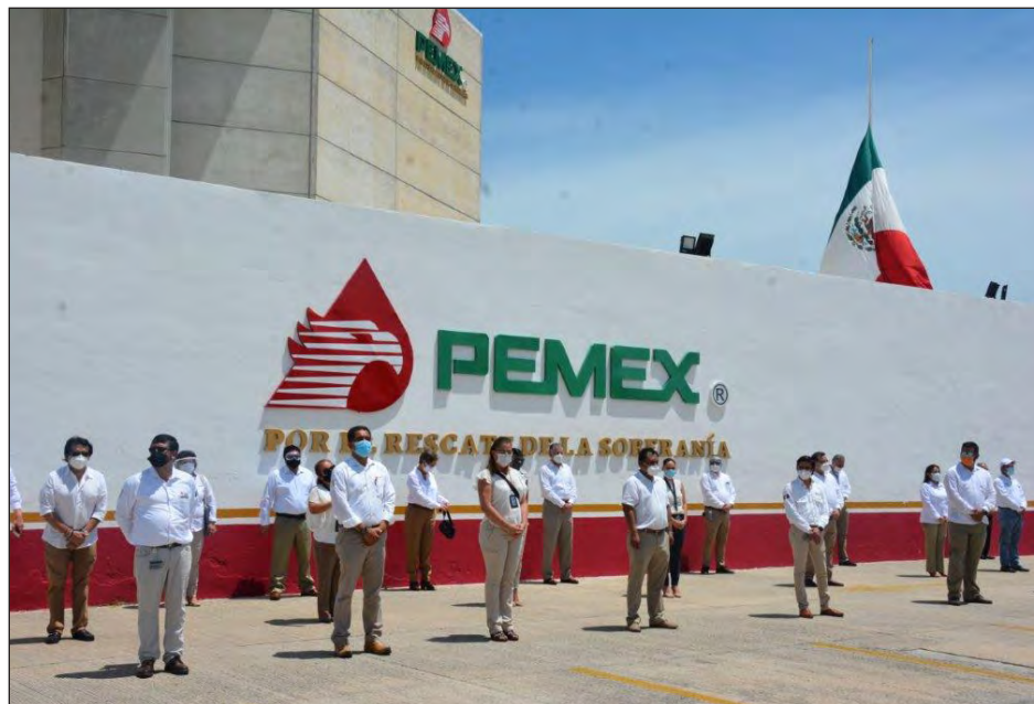
▲ La bandera nacional se mantendrá a media asta durante 30 días, hasta el próximo 11 de septiembre.