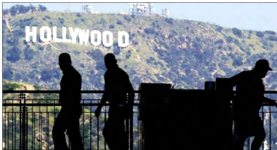
▲ A pesar del crecimiento de otros centros de filmación como el estado de Georgia, muchos cineastas parecen decididos a permanecer en Los Angeles.

Los temores sobre la salud del equipo, la incerti-