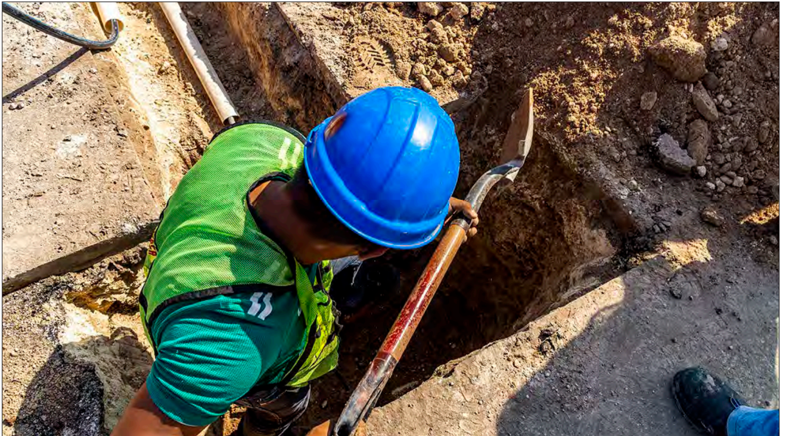
▲ Vecinos de la calle 13 con la avenida 90 señalaron haber detectado que su agua potable había tomado una coloración oscura.