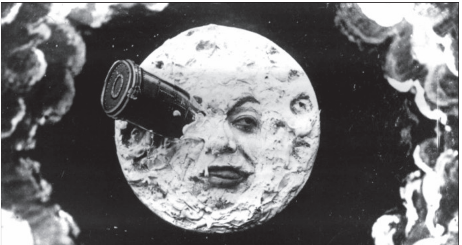
▲ Viaje a la luna es una vibrante muestra del talento creador de Georges Méliès. Fotograma de la película Le Voyage dans la Lune