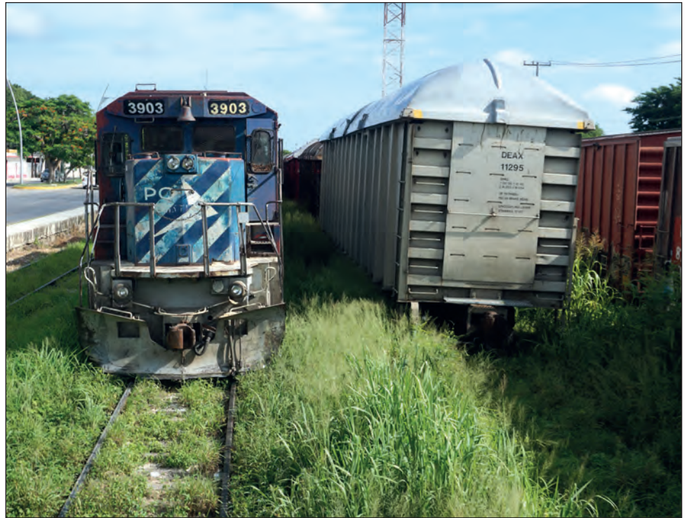
▲ Con el convenio se gestionaría obtener los más de mil plazas de trabajo que el Tren Maya ofrecería en el tramo 3, que va desde Calkiní a Izamal.

"Que el dinero se quede en la región donde se lleva a cabo la obra, no traer gente que se lleve el proyecto"; apuntó.