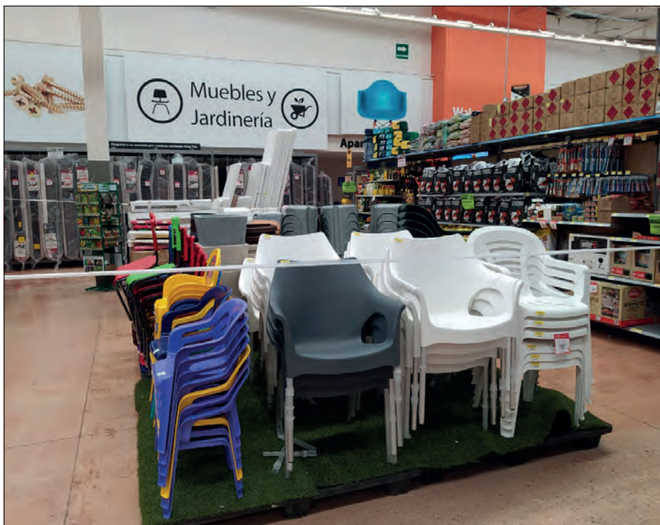
▲ Entre las medidas para evitar contagios está la restricción de venta de artículos “no esenciales” en los supermercados.

El rango de edad de los contagiados oscila entre un mes y 98 años.