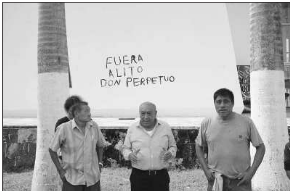
▲ Uno de los integrantes de Grupo Resurgimiento fue detenido por elementos de la Policía Estatal tras rayar una de las paredes del inmueble con el lema "Fuera Alito, don Perpetuo".

El veterano priista nuevamente arremetió contra el ex gobernador de Campeche y dijo "desde su llegada a la gubernatura del estado se vislumbraba el mal momento del tricolor , y cuando comenzó su plan para hacerse de la dirigencia nacional, sa-