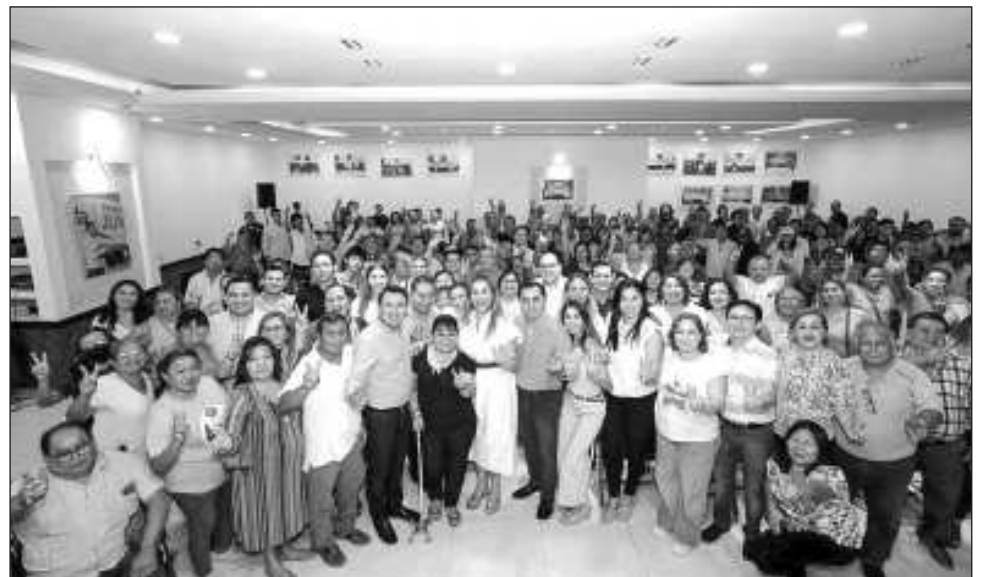
▲ En reunión con la estructura panista pidió reflejar el sentir ciudadano.

La alcaldesa electa agregó que a lo largo de la historia de Yucatán los panistas siempre han mantenido la unidad, y ahora no será diferente. Destacó que Mérida siempre ha contado