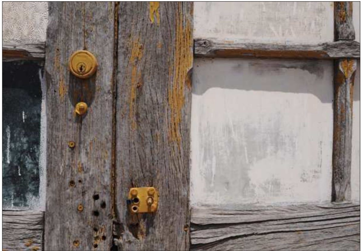
▲ La puerta, como objeto, tiene entonces funciones ambivalentes: comunica y aísla, lo que implica también comunión o confrontación o, bien la construcción de la intimidad, pero también la del encarcelamiento. Una puerta que se abre puede conducirnos a la libertad o a un precipicio; una puerta que se cierra puede simbolizar una promesa o una condena.

En su factura retórica, la pieza tiene como eje una alegoría, es decir, un recurso expresivo que, como todos los recursos que se distinguen en el lenguaje figurado, se constituye como una analogía o comparación cuya finalidad es hacer “visible” la subjetividad de un individuo (el lenguaje humano funciona medianamente bien para hablar del mundo objetivo, pero parece extremadamente limitado para hablar de la subjetividad, por lo que tiene —digámoslo así— que doblarse, estirarse y hacerse maleable para alcanzar a nombrar las complejidades que hay en el universo de un sujeto). Concretamente, una alegoría supone una comparación en la que se expresa una entidad de alto