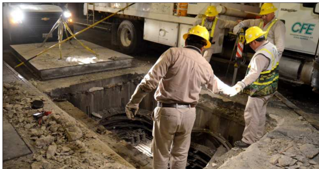
▲ Tendría que reconocerse que hay un problema enorme en la red de distribución, algo que es sabido desde hace tiempo, pero la CFE ha preferido concentrarse en la producción.

Los números siguen ahí. En Ciudad del Carmen se contaron 16 apagones en diferentes colonias este martes. De hacerse el ejercicio en Mérida, Campeche, Cancún y Chetumal, tendría que reconocerse que hay un problema enorme en la red de distribución, algo que es sabido desde hace tiempo, pero la CFE ha preferido concentrarse en la producción. Queda por ver si el excedente energético que se consiga no termina por colapsar la red peninsular, alimentando la idea de que México vive el surrealismo.