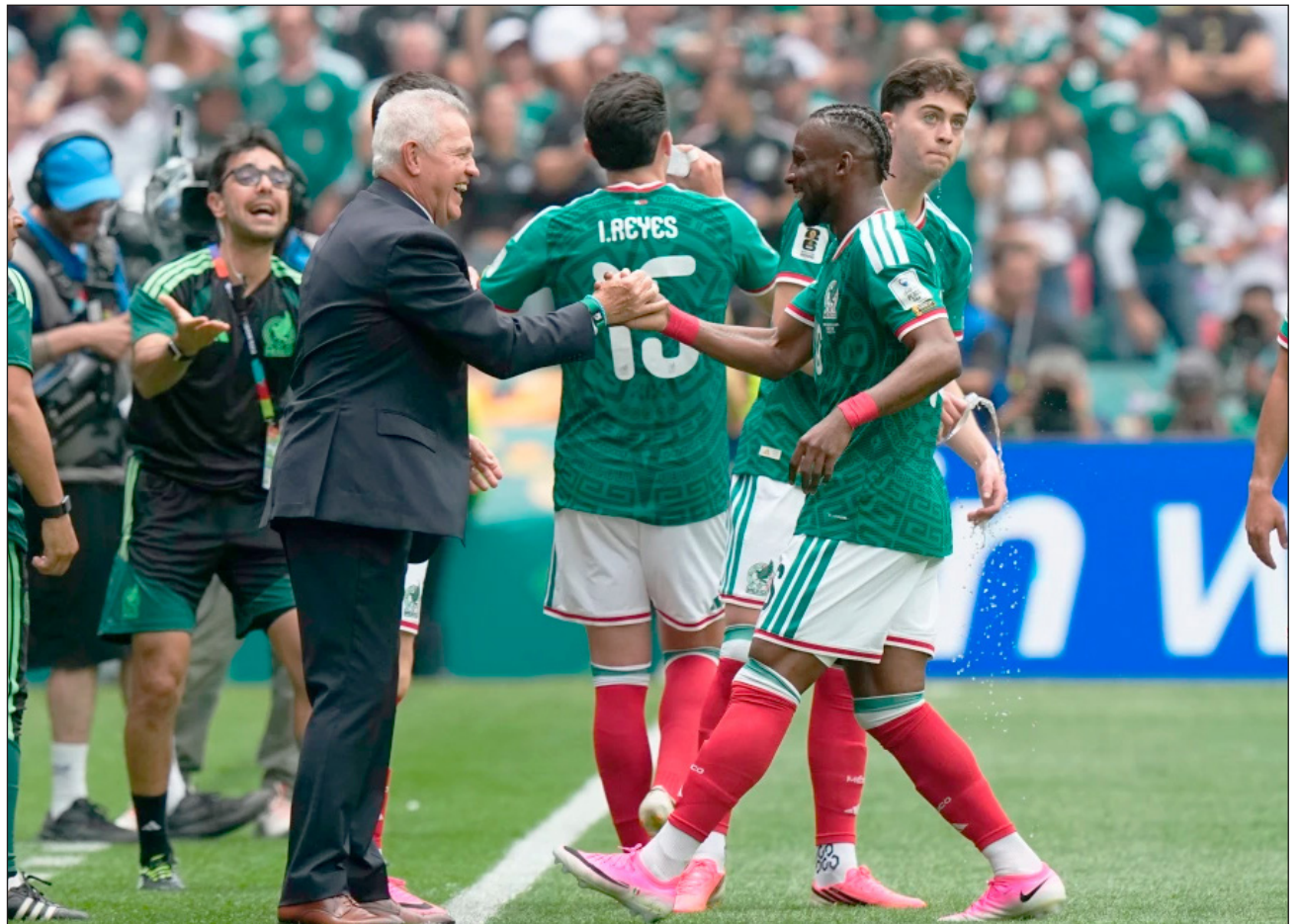
▲ Al jugar en casa, la meta es emular lo hecho en 1970 y 1986, cuando alcanzaron los cuartos de final.

Debido al nuevo formato de 48 países, México necesitaría llegar a un sexto encuentro para igualar esa marca.