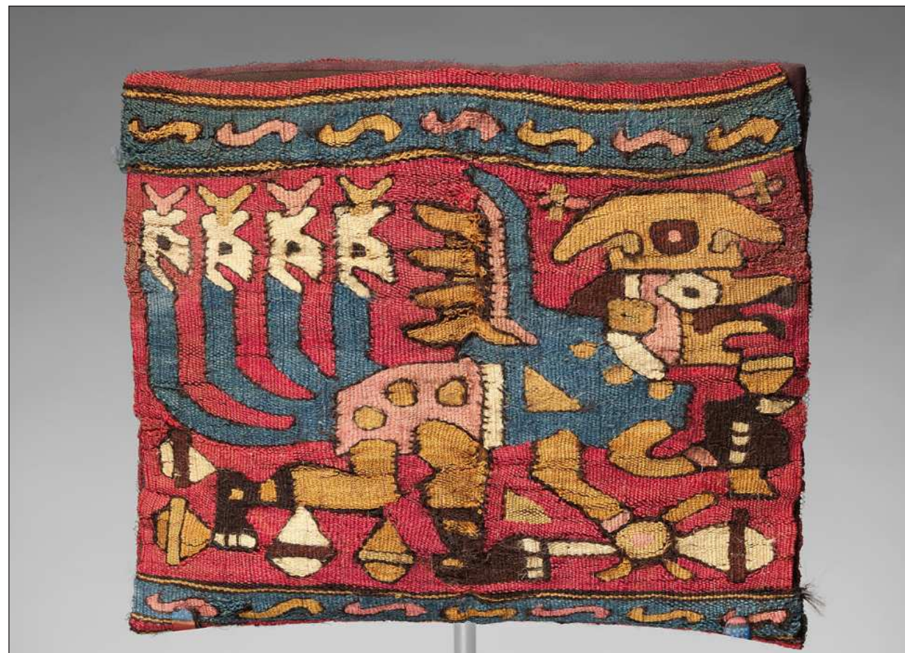
▲ La exposición que se presenta en Nueva York nace de un intercambio entre curadoras del museo expertas en las artes y cultura europea y latinoamericana, donde descubren y crean un diálogo entre estos mundos.