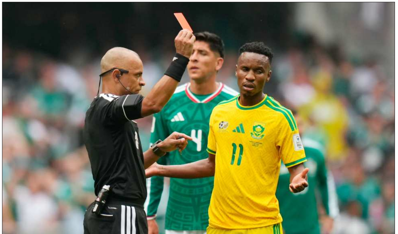
▲ Las expulsiones en las Copas del Mundo acarrearán al infractor una suspensión automática de un partido, pero en caso de juego anti deportivo, la comisión disciplinaria de la Federación Internacional puede ampliar las sanciones.