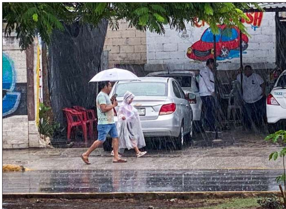
▲ Las condiciones meteorológicas imperantes en la península de Yucatán propiciarán que en Q. Roo, sobre todo en la zona sur, haya riesgos de inundaciones y deslaves.

Seguirá lloviendo en las próximas horas, ad-