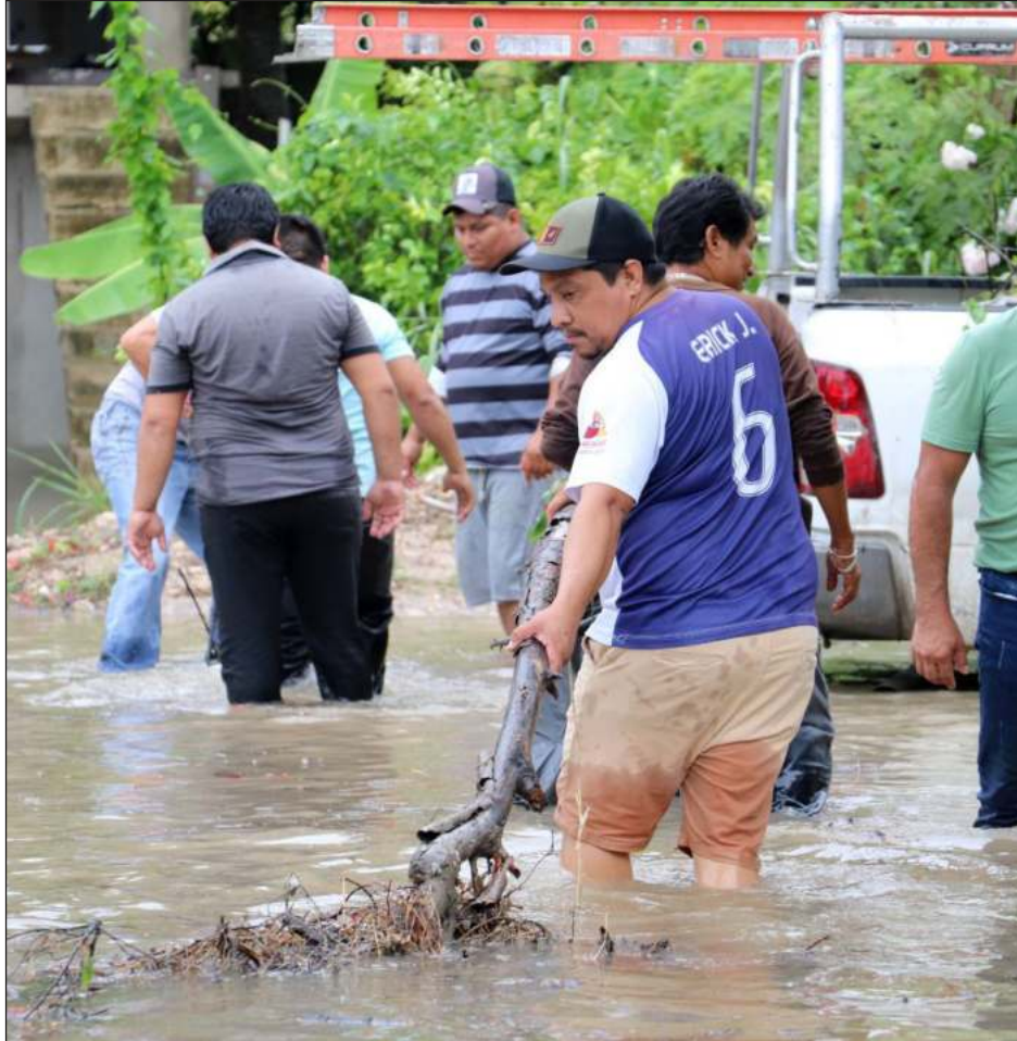
▲ Personal de Bomberos, Protección Civil, Servicios Públicos y otras áreas municipales, trabajan de manera coordinada en la limpieza de calles y alcantarillas.