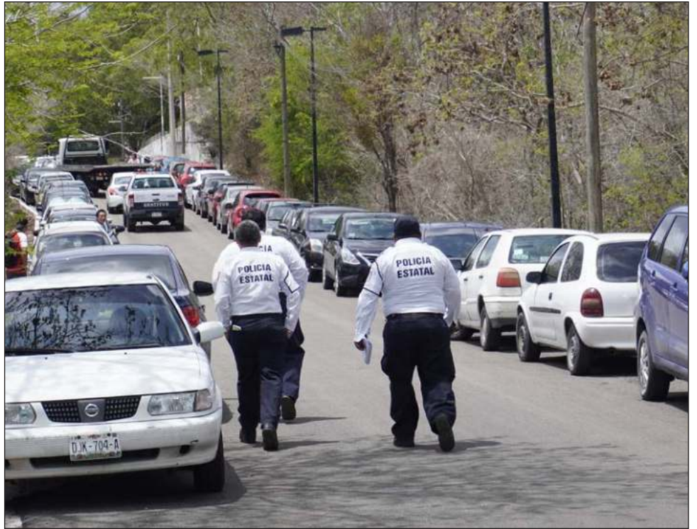
▲ Debido a las condiciones, algunos elementos han desistido de la protesta.