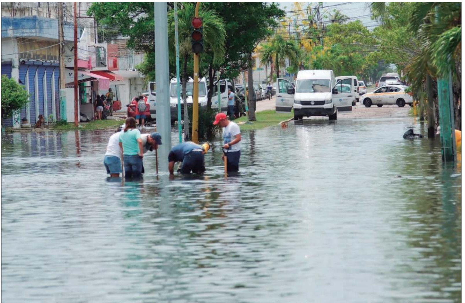
▲ "No basta con hacer que la ciudadanía no tire basura en la calle, menos con fotos de políticos caminando en calles inundadas, hace falta un plan integral de atención (...) Lo peor que podemos hacer es normalizar la situación con 'ni modo'; el reto es enorme y es de todos".