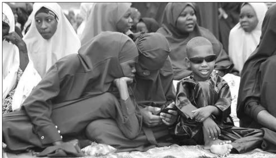
▲ Siguiendo la tendencia de los últimos años, el estudio muestra que dos tercios de los encuestados a nivel mundial ven al menos un video de unos minutos sobre un tema informativo cada semana.

El informe se basa en encuestas en línea realizadas por la empresa YouGov entre 95 mil personas en 47 países.