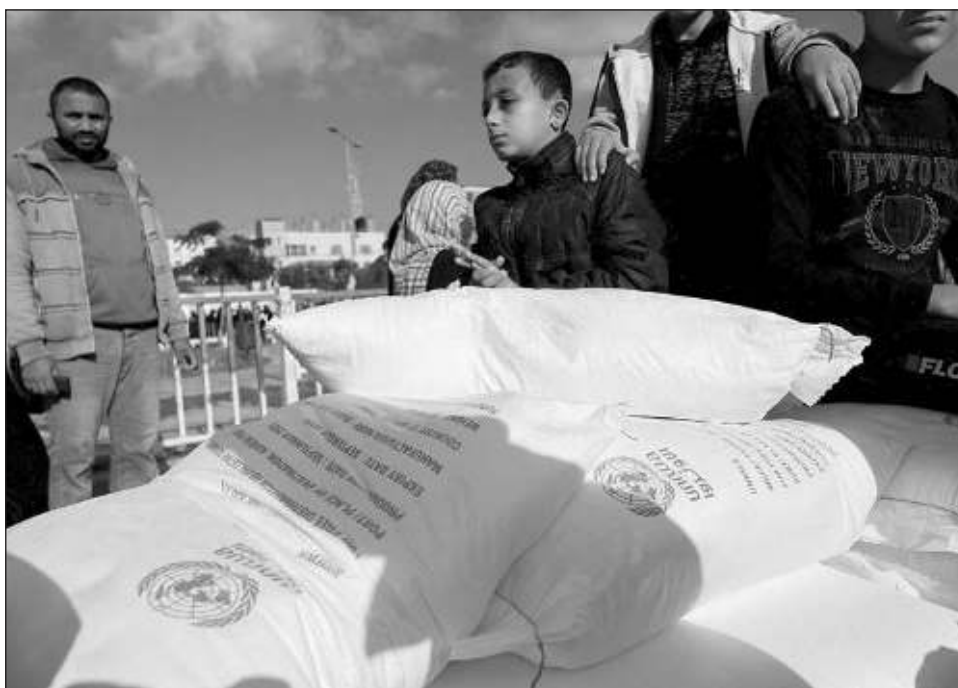
▲ La Agencia de la ONU para los Refugiados Palestinos tiene financiación hasta julio, “después de eso no sabemos qué ocurrirá”, informó el comisionado Philippe Lazzarini.

El Ejército israelí anunció una pausa táctica de