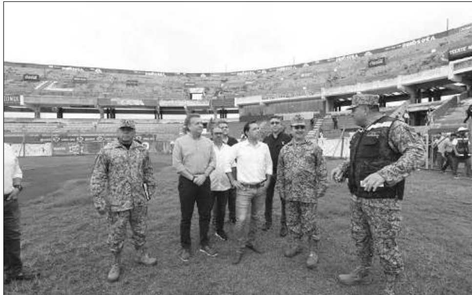
▲ El gobernador Mauricio Vila, durante un recorrido por el parque Kukulcán.