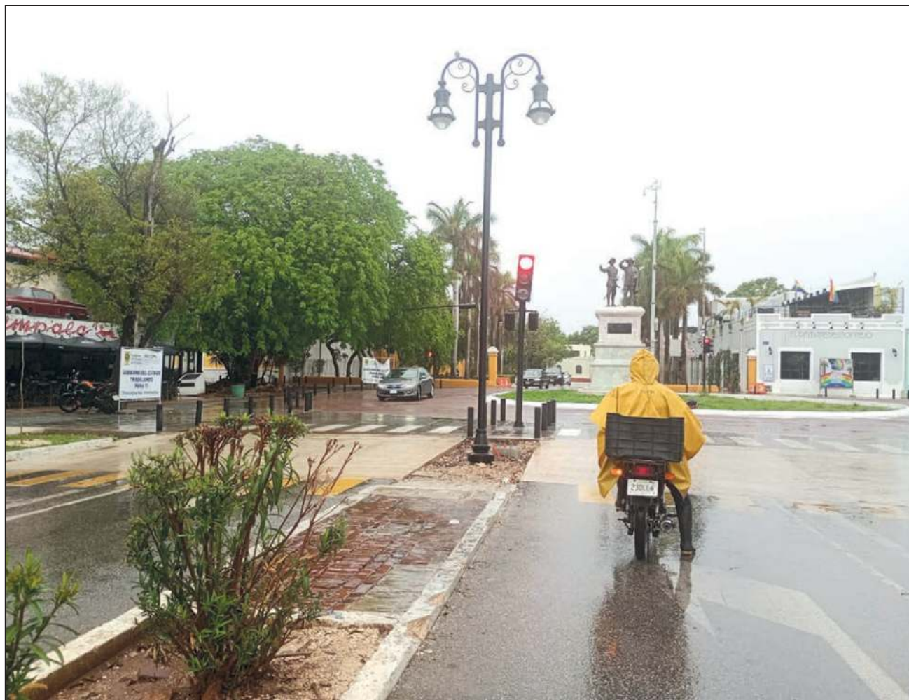
▲ Hasta el momento, la lluvia más intensa fue la que se presentó el sábado 15 de junio. Por la noche, en Paseo Montejo, se reportó la caída de un árbol. En Plaza UpTown, un pedazo del techo falso cedió por la humedad.

En las comisarías al norte de Mérida, estas afectaciones tras las lluvias también han sido frecuentes. “En Komchén normalmente siempre se inunda, pero por los niveles de las calles, porque está pegado al puerto. Siempre entra el agua en las casas. No tenemos problemas de electricidad, aunque sí muchas goteras. Cuando se acerca esta temporada, lo que hacemos es impermeabilizar antes, esta vez no nos dio chance porque de la