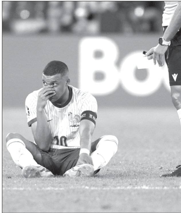
▲ Kylian Mbappé, con la nariz sangrando al ser amonestado en el partido contra Austria.