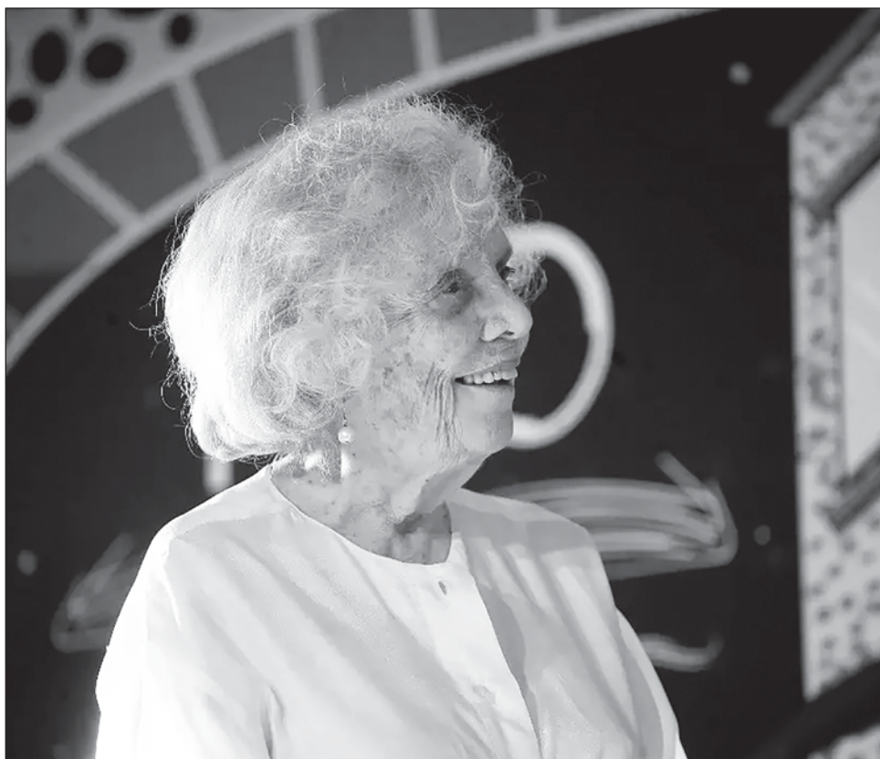
▲ En el periodismo hay mucha zozobra: “es un veneno y una pasión”, subrayó Poniatowska durante su mensaje en la Feria Internacional del Libro en Coyoacán.

Al concluir el homenaje, la autora de La piel del cielo bajó del escenario y partió plaza: un espectáculo de mimos y payasos que obstruía su salida del jardín Hidalgo fue suspendido y los artistas callejeros destacaron que quien salía “es la gran escritora Elena Poniatowska”, anunció el comediante como despedida la tarde del domingo.