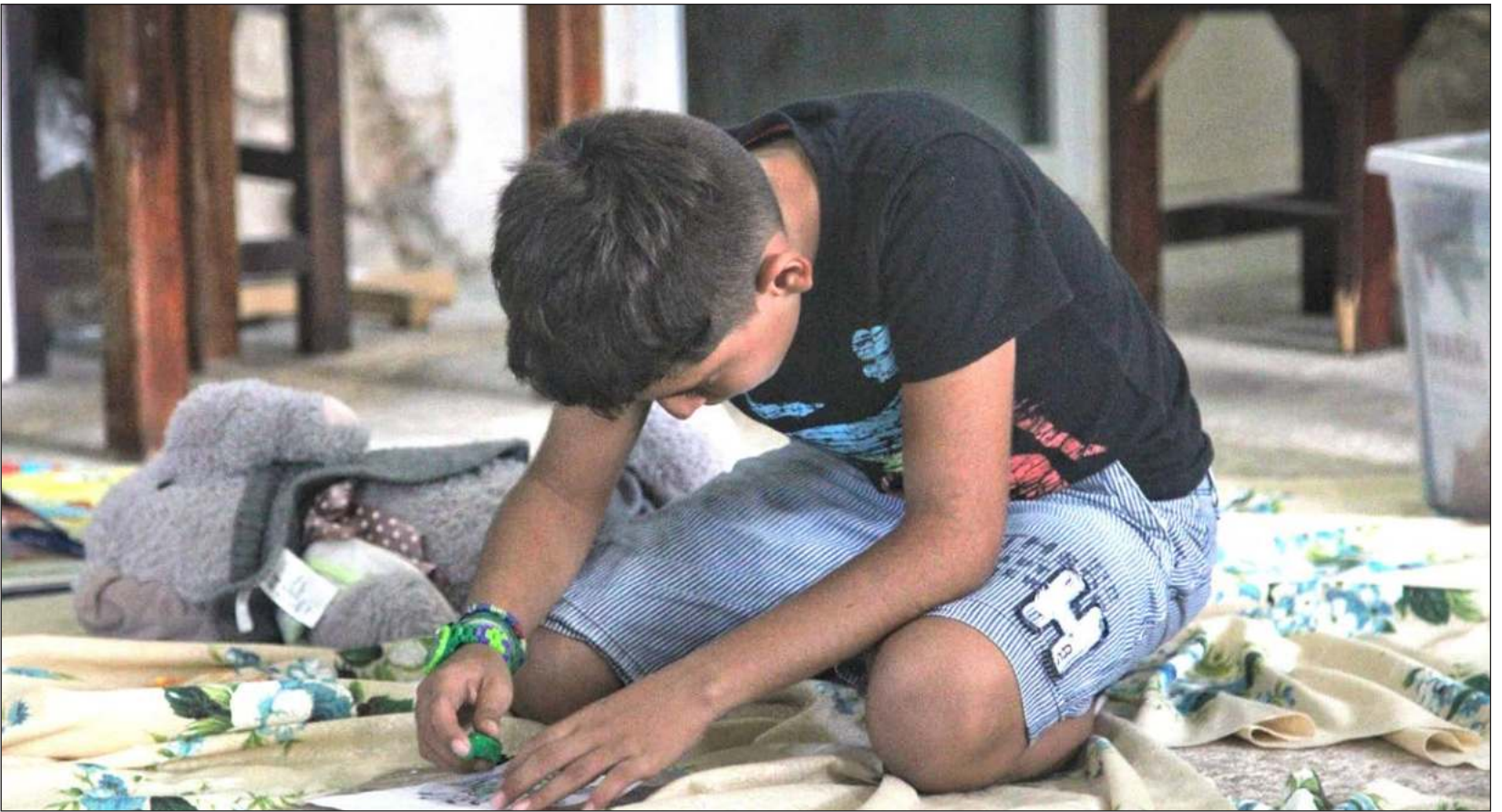
▲ El evento, organizado por Ciudad Mayakoba, el Museo Universum de la UNAM y el Centro Cultural de España en México, ofrecerá actividades como talleres de dibujo y creatividad literaria, sensorama sobre la selva maya, observación de estrellas y planetas, cuentacuentos, feria de libros y mucho más.