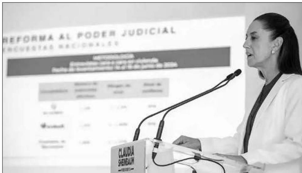
▲ Las empresas contratadas por el partido guinda fueron Enkoll y De las Heras, además de un ejercicio democrático más aplicado por la encuestadora de Morena.

En tanto, 14 por ciento respondió a De las Heras que “no”