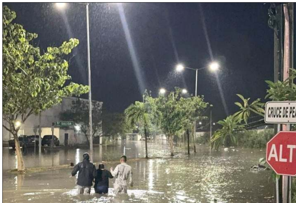
▲ Chetumal se ubica en la parte más baja de una cuenca que cada vez está más deforestada, con menos zonas que puedan retener escurrimientos de zonas arriba.

A través de sus redes sociales, la especialista comparte que Chetumal se ubica en la parte más baja de una cuenca que cada vez está más deforestada, es decir, que cada vez tiene menos zonas que puedan retener escurrimientos de zonas arriba, donde se están construyendo diques gigantes.