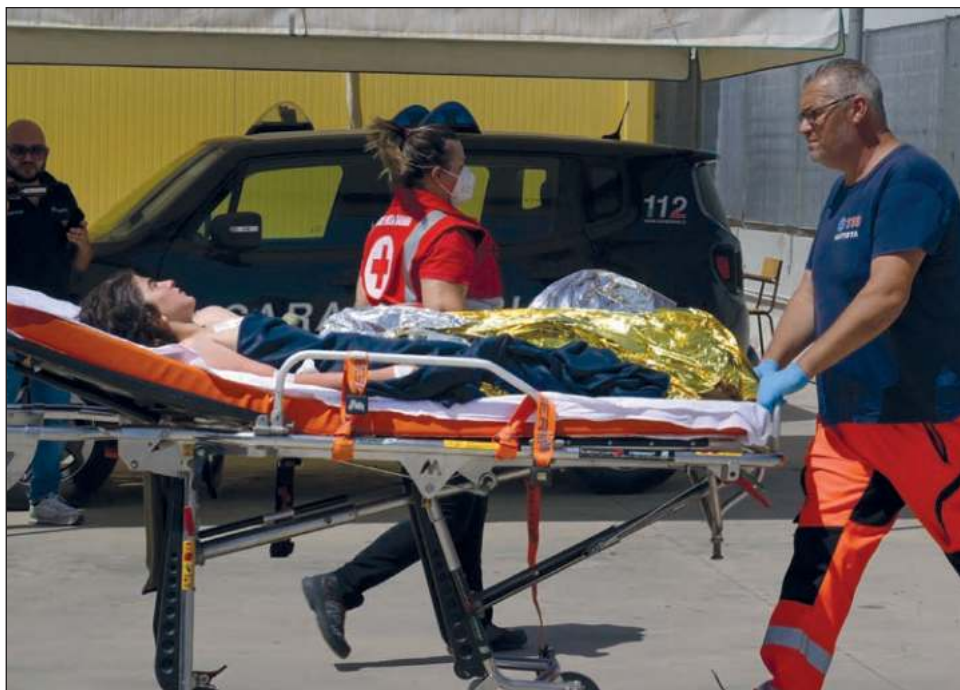
▲ Los migrantes que sobrevivieron fueron trasladados al puerto Roccella Jonica para recibir atención médica. En 2023 murieron o desaparecieron 3 mil 155 personas mientras cruzaban el Mediterráneo.

La búsqueda continúa con los dispositivos marítimos y aéreos de Italia y de la agencia europea Frontex, añadieron los guardacostas, sin precisar el número de personas reportadas como desaparecidas.