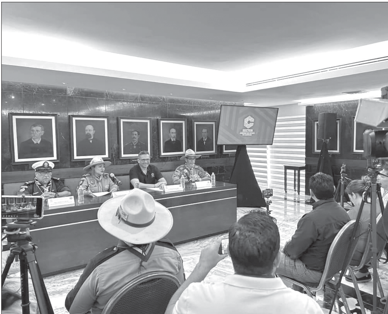
▲ El evento busca fortalecer la historia y cultura pirata a través de actividades acuáticas y naturales que favorezcan la creatividad, expresión y comunicación; así como dar a conocer los atractivos turísticos.

Sostuvo que las quejas de la población por el maltrato que les brindan los conductores de estas unidades piratas, no podían ser atendidas, pero ahora podrán ser sancionadas