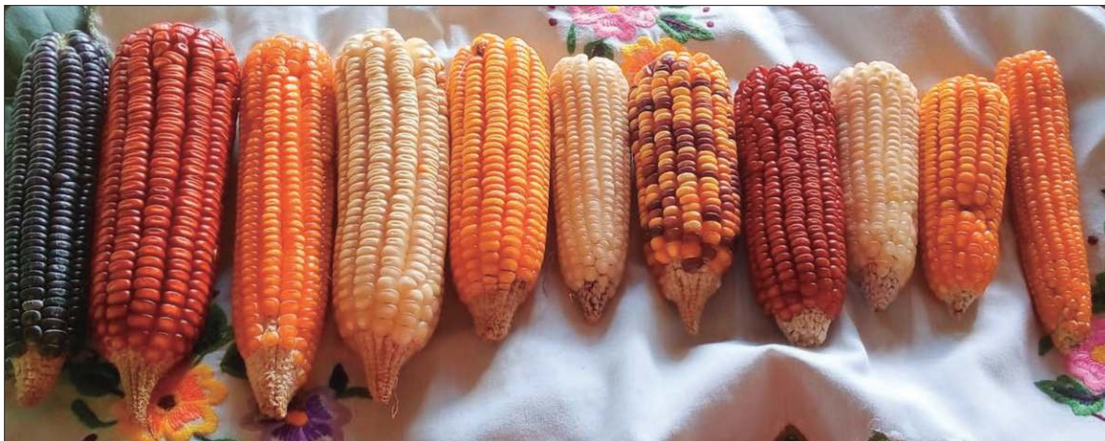
▲ "Todas, semillas con distintas características que se siembran en diferentes suelos (...) Las hay de cuatro colores: blanca, amarilla, roja, morada".