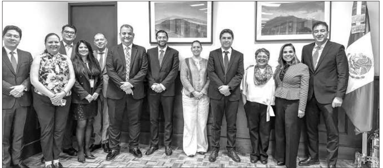
▲ Este decreto permitirá potenciar la economía de Chetumal y del sur del estado, con el tianguis del bienestar Yum Kaax, que va a ser de importaciones, los parques industriales y también la atracción de nuevas inversiones.

La Zona Libre de Chetumal establecerá los re-