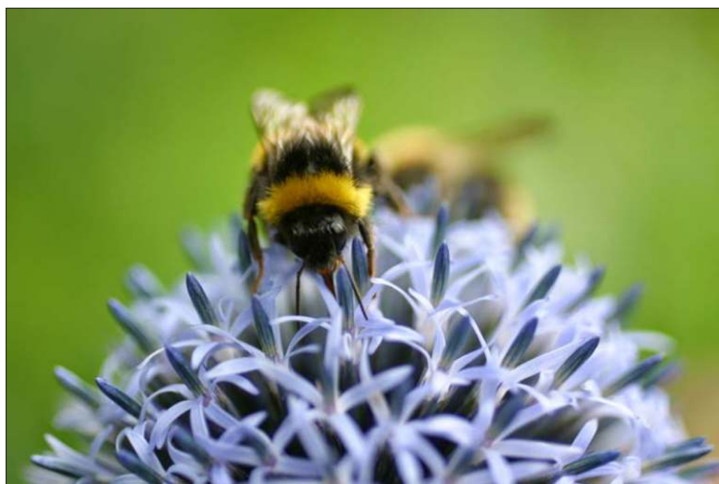
▲ Las abejas buscan flores que no son objeto de cultivo comercial y por lo mismo, un incendio o el levantamiento de un perímetro urbanizado terminan por provocar la pérdida de ingresos por exportaciones.

La apicultura, finalmente, merece ser considerada entre las actividades económicas esenciales de la península y esto también implica que se tengan precios justos para los productores y que seamos los propios habitantes de la región los primeros en promover el alto valor de la miel.