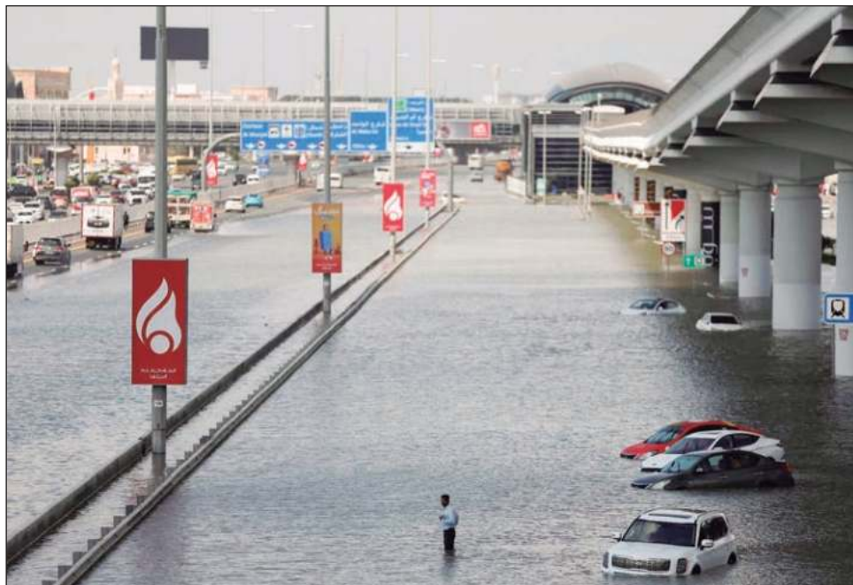
▲ Los 254 milímetros de lluvias, equivalentes a las precipitaciones que reciben Emiratos Árabes Unidos en dos años, generaron un atasco monumental en las autopistas.

La climatóloga Friederike Otto, especialista en evaluar el papel del cambio climático en fenómenos meteorológicos extremos, indicó a la AFP que es "muy probable" que el calentamiento global empeorara las condiciones de la tormenta.