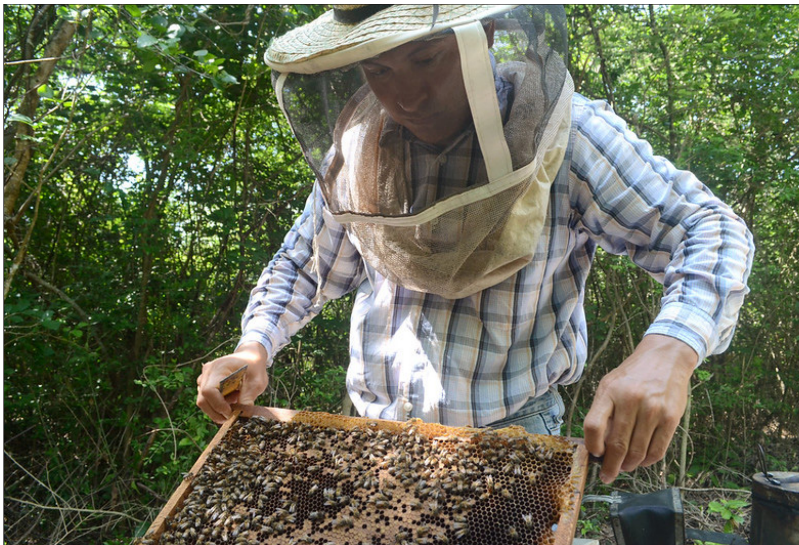
▲ Yucatán tiene el registro de 103 de sus 106 municipios como productores de miel, siendo los principales Tizimín, Tekax y Valladolid; en Campeche, Champotón, Hopolchén y la capital; mientras que en Quintana Roo son Felipe Carrillo Puerto, José María Morelos y Bacalar.

En otros derivados como la producción de cera derivada de la actividad apícola y de jalea real, polen y propóleo Yucatán está entre los cuatro mayores.