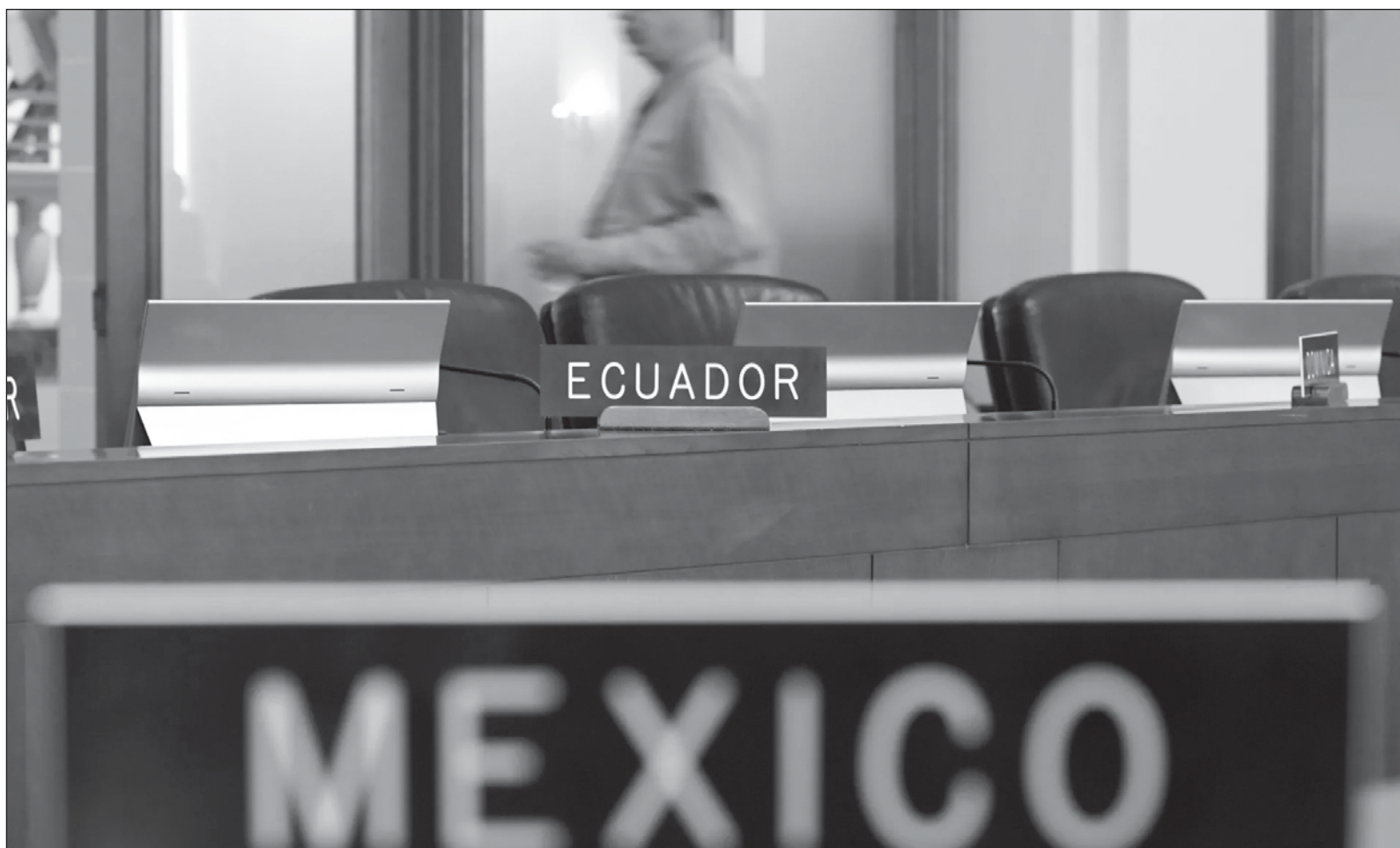
▲ "La gravedad del asalto a la embajada mexicana en Ecuador el 5 de abril, ordenada directamente por el presidente Daniel Noboa no deja lugar a la disculpa, viola leyes internacionales fundamentales y pisotea la historia (...) justificar el acto de barbarie de Noboa, muestra sus limitaciones y el nivel antinacionalista de la derecha conservadora".