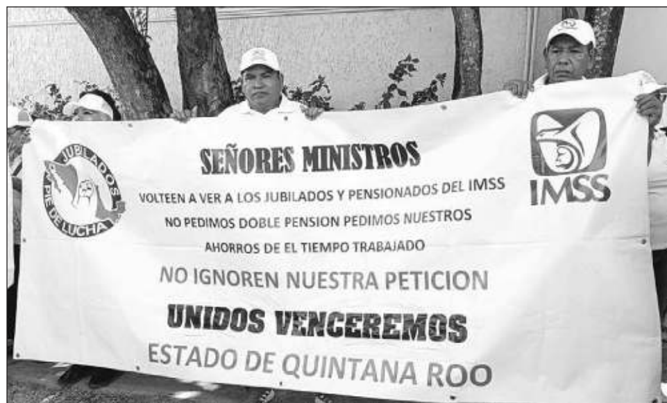
▲ Los manifestantes opinaron que la ley que pretende utilizar Afores de los trabajadores generará problemas, porque al final a la gente le dan largas y no le entregan su dinero.

Fue desde 2008 cuando salió una jurisprudencia de la Suprema Corte de Justicia de la Nación (SCJN) en la segunda sala, donde les informaron que les quitarían ese rubro y el dinero