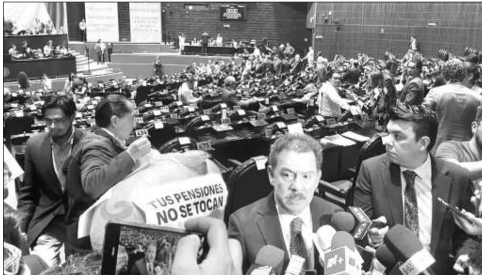
▲ El retraso en la discusión de la reforma para constituir un fondo de pensiones también presionará los tiempos de la Cámara, porque tiene que enviar el proyecto al Senado el mismo lunes.