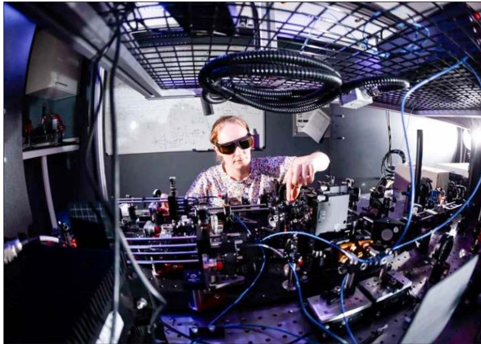
▲ Los repetidores clásicos no se pueden utilizar con información cuántica, ya que cualquier intento de leer y copiarla la destruiría.

Con el fin de hacer lo anterior, se requiere un medio para almacenar la información cuántica y recuperarla nuevamente: es decir, un dispositivo de memoria cuántica. En primer lugar, éste debe ha-