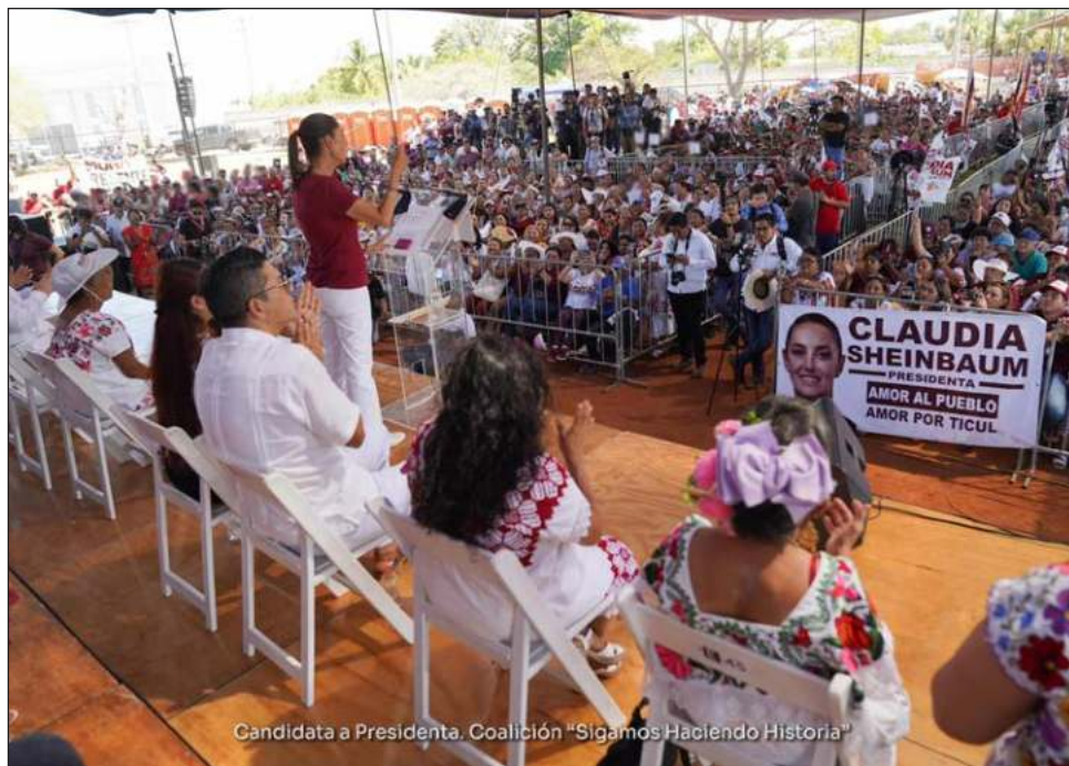
▲ Sheinbaum participó en el Encuentro con Mujeres Rurales realizado en el municipio de Ticul, desde donde anunció un programa especial de vivienda.

Shienbaum llamó a la ciudadanía a confiar en el proyecto de Díaz Mena y pidió que Yucatán deje entrar a la Cuarta Transformación.