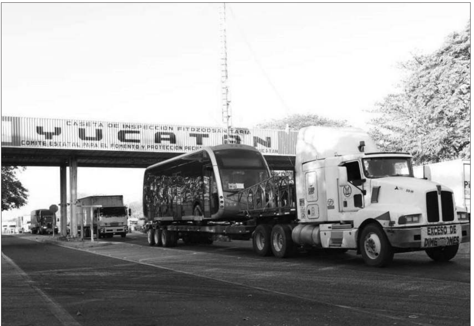
▲ Provenientes de España, las unidades fueron trasladadas vía barco hasta llegar a territorio mexicano y arribaron por tierra a la entidad.

Las cinco rutas que conforman el Ie-tram son: Paseo 60-La Plancha-Teya y Mejorada-La Plancha-Kanasín, que ya funcionan; La Plancha-Facultad de Ingeniería y La Plancha-Umán y La Plancha-Poxilá, que entrarán en funcionamiento próximamente.