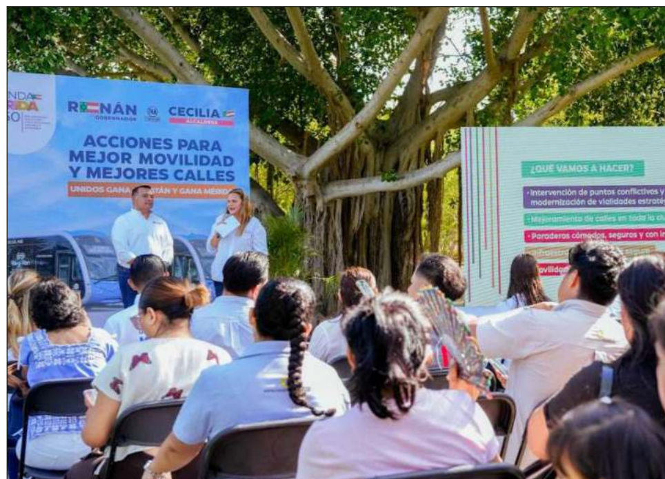
▲ El Plan de Acciones en Movilidad e Infraestructura Vial, contemplado en la Agenda Mérida 2050, consiste en la intervención e inversión en infraestructura de movilidad y hacer una reingeniería vial en ciertas zonas de la ciudad.

Incluye la modernización de paraderos más cómodos y funcionales con internet, intervención y creación de más ciclovías y potenciar el programa "En Bici", de igual forma se invertirá en la construcción de aceras adecuadas e inclusivas que