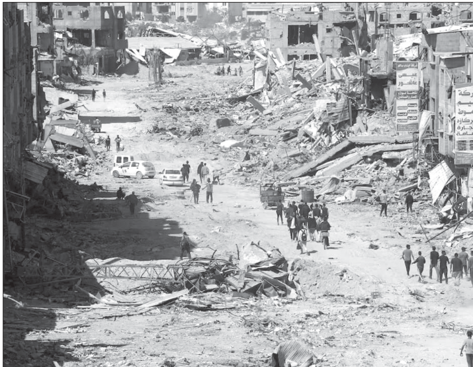
▲ Múltiples organismos de derechos humanos acusan a Israel de usar el hambre como "arma de guerra", con la mayoría de accesos terrestres cerrados.

Múltiples organismos de derechos humanos, entre ellos Human Rights Watch (HRW) acusan a Israel de usar el hambre como "arma de guerra", con la mayoría de accesos terrestres cerrados, inspecciones arbitrarias que demoran la entrada de camiones y más de un millón de gazatíes que sufre una ausencia "catastrófica" de alimentos, entre ellos 210 mil en el norte que ya padecen hambre.