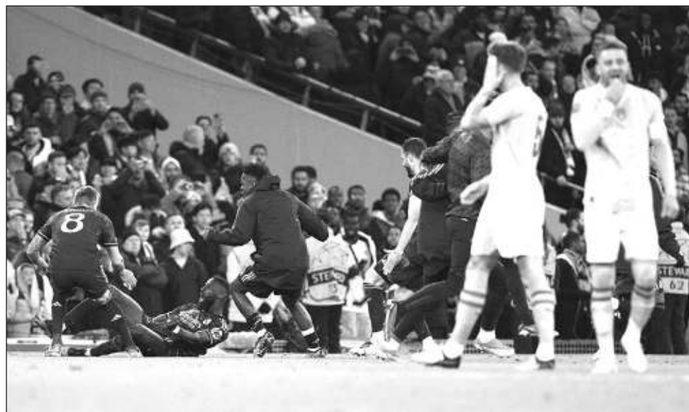
▲ El Real Madrid sufrió, pero dejó fuera al campeón Manchester City tras una serie de penales.