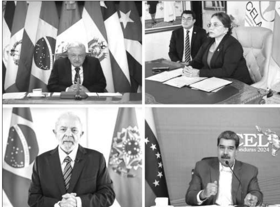
▲ Los presidentes de Brasil, Cuba, Colombia, Venezuela, Bolivia, Guatemala, y Guyana en representación de los países que integran la Comunidad del Caribe (Caricom), manifestaron su apoyo a México.

En su conferencia de prensa diaria en Palacio Nacional, destacó que los miembros de la Celac han expresado sus apoyos a los derechos de México y en contra de la violación del derecho internacional cometida por Ecuador con el asalto a la embajada mexicana en Quito y la detención a su interior del ex presidente ecuatoriano Jorge Glas.