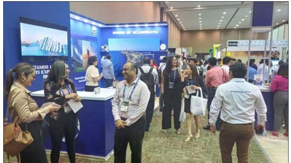
▲ Se contemplan acciones para mejorar la infraestructura, lo cual permitirá el acceso de embarcaciones de mayor calado, que sería de beneficio para la generación de empleos en la localidad.

Expuso que se complementan acciones, para mejorar la infraestructura portuaria de Isla de Carmen, con las cuales, permitirá el acceso de embarcaciones de mayor calado, lo que será de gran beneficio para el desarrollo