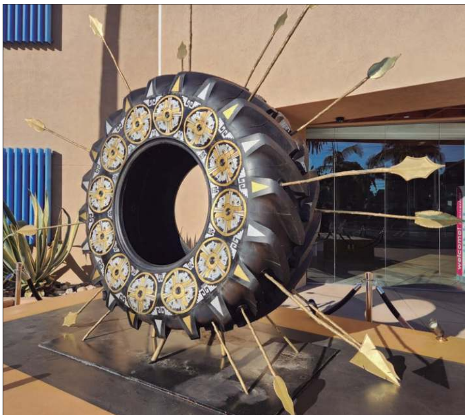
▲ Es una muestra de fuerte impacto visual que expone seis instalaciones de sitio específico, realizadas por la artista este año. Foto Facebook Museum of Latin American Art (MOLAA)

La artista pretende visibilizar la migración con una trayectoria nacional e internacional. Espera que su obra conduzca a una reflexión más lenta y profunda sobre la marca que nos dejan las fronteras, cuestionándonos hasta dónde estamos heridos por las separaciones.