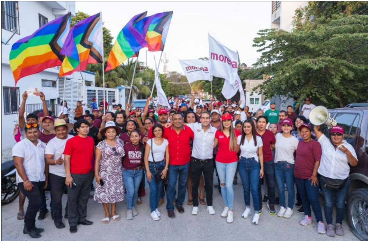
▲ En su segundo día de campaña, el candidato a alcalde de Tulum visitó a las familias de la colonia Tumben Kah y se reunió con ingenieros y arquitectos, a quienes presentó sus compromisos de favorecerle el voto el 2 de junio.