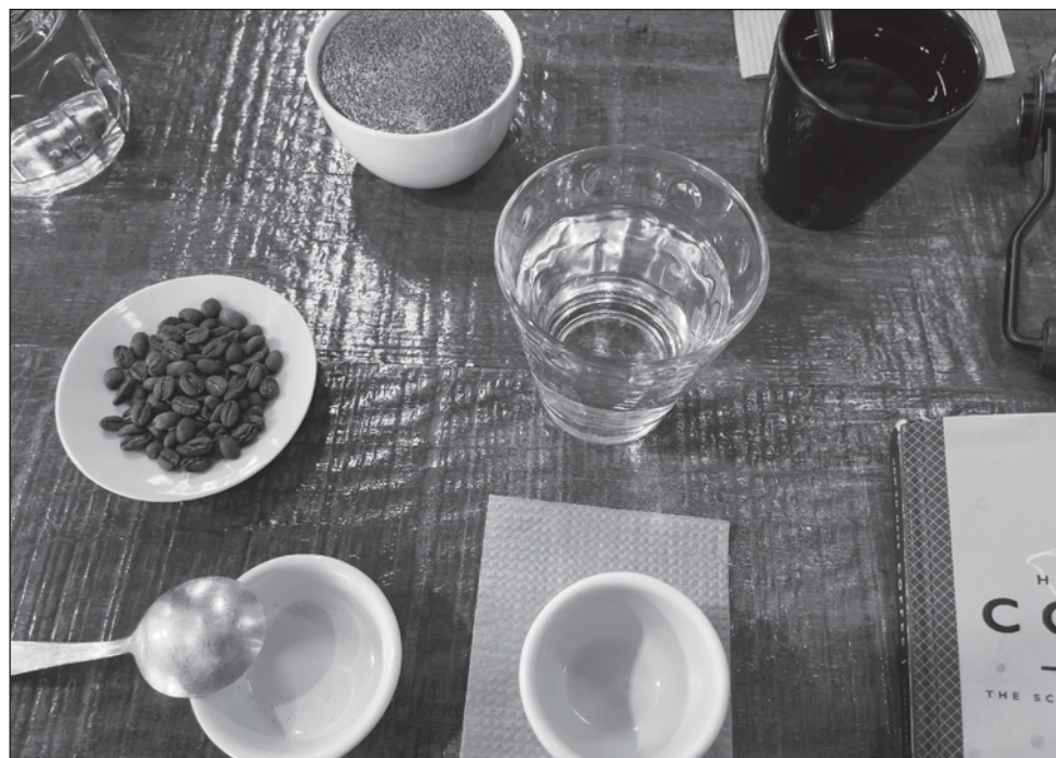
▲ El arábica es la fuente de casi 60% de los productos de café del mundo.

Los gigantes del café como Starbucks y Tim Hortons utilizan exclusivamente granos de plantas de arábica para preparar los millones de tazas de café que sirven todos los días; sin embargo, en parte debido a una baja diversidad genética derivada de una historia de endogamia y un tamaño de población pequeño, el arábica es susceptible a muchas plagas y enfermedades y sólo puede cultivarse en unos pocos lugares del mundo donde las amenazas de patógenos son menores y las condiciones climáticas son más favorables.