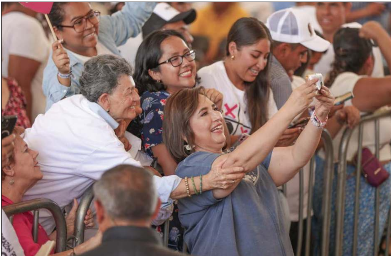
▲ Xóchitl Gálvez resaltó su “respaldo a la ministra, no hay un tema político; yo ando en campaña, ella está en lo suyo. Yo no la he visitado, no la he visto y si Zaldívar tiene pruebas que presente lo que quiera presentar”.

La magistrada respondió que al día de hoy se actualizan dos causales, relacionado con igual número de expedientes penales: en 2021 se ordenó orden de aprehensión por delitos de delincuencia organizada como operaciones con recursos de procedencia ilícita.